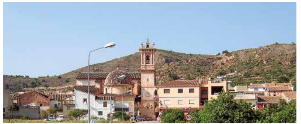
Vista del municipio de Petrés.

Finalmente, el castillo de los Barones de Petrés , palacio foraleza de los siglos XV-XVI, de carácter residencial y construido por la familia Aguiló. Si quieres conocer más detalladamente su historia, puedes leer el Reportaje de los castillos de esta edición de El Periódico DE AQUÍ.