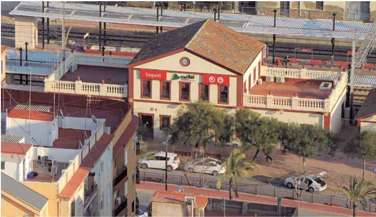
Vista aérea de las vías en la entrada a la estación de tren de Sagunt.