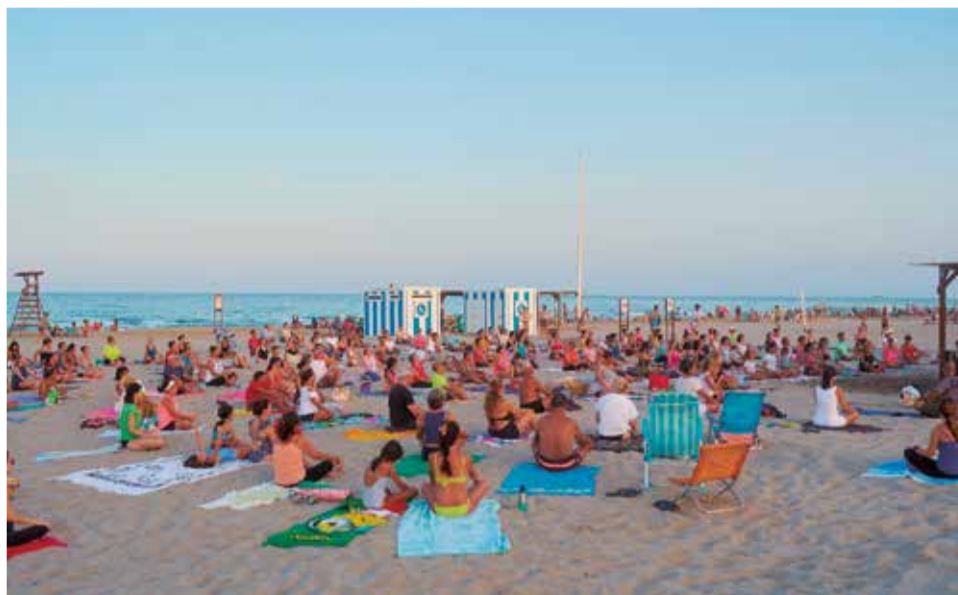
Yoga en la playa de Canet d'en Berenguer.

Entre las actividades que se pueden practicar destaca gimnasia de mantenimiento, crosstraining, aquagym, GAP, yoga, cubba, pilates, bailes latinos, marcha nórdica, tenis y voley playa, entre otros. Este año, como novedad, se ha ampliado la oferta deportiva infantil. Los más pequeños de la casa tendrán la oportunidad de disfrutar del tenis