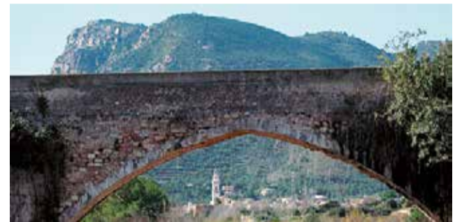
Acueducto de Alfara de la Baronia.

El pueblo está colosado por la Ermита , del siglo XVII, en cuyo interior preside la imagen de Nuestra Señora de los Afligidos, una talla del siglo XVII y patrona de Alfara de la Baronia.