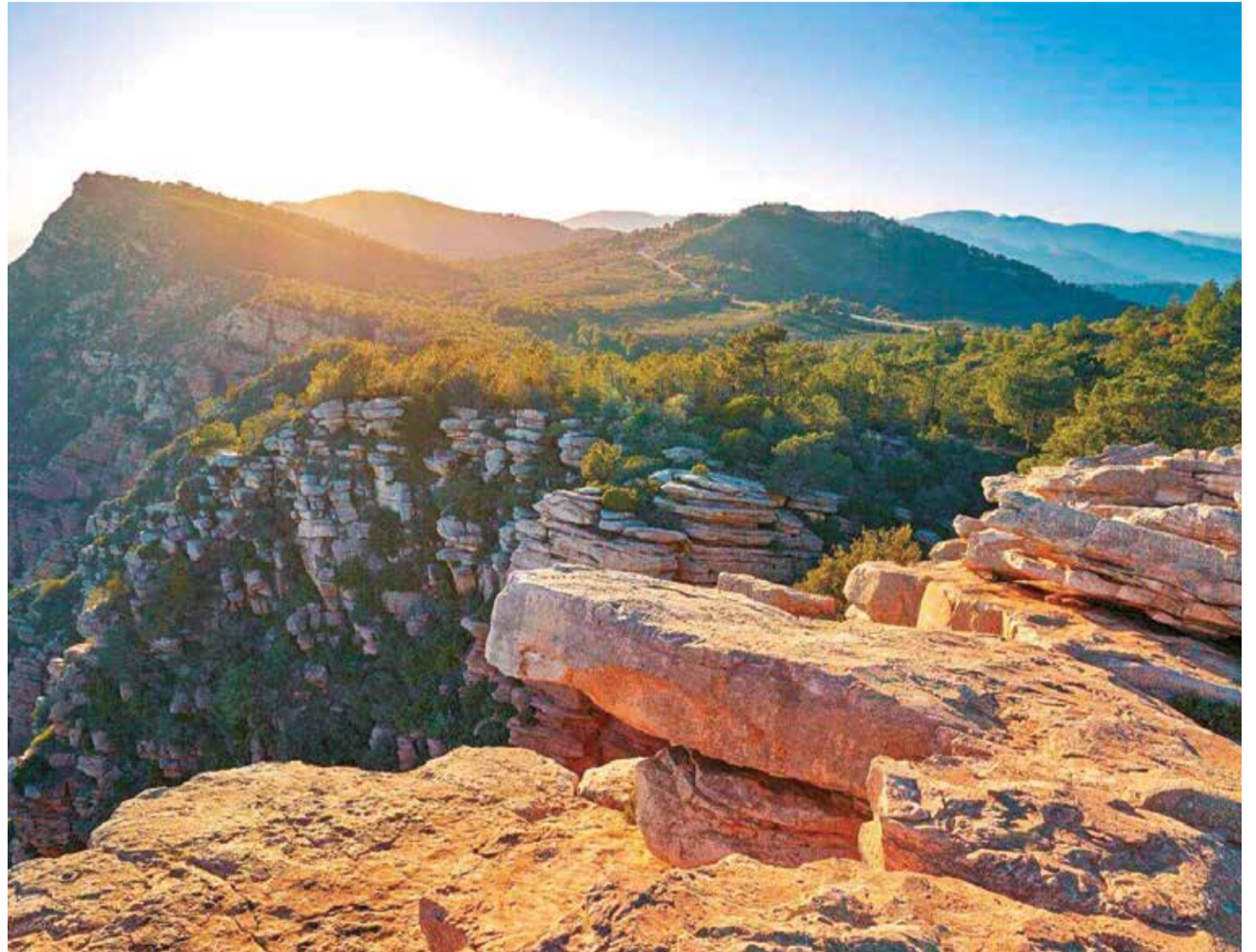
Vista del Garbí, el techo del Camp de Morvedre.

Este pequeño paseo va desde el núcleo urbano de Algar de Palancia hasta la presa. Una vez llegados a ésta se ofrecen varios caminos o sendas para proseguir con la caminata, pudiendo incluso conectar con otros pueblos como Soneja, etc. En definitiva, una ruta fresca que es la oportunidad perfecta para hacer en estos meses de verano y huir del calor.