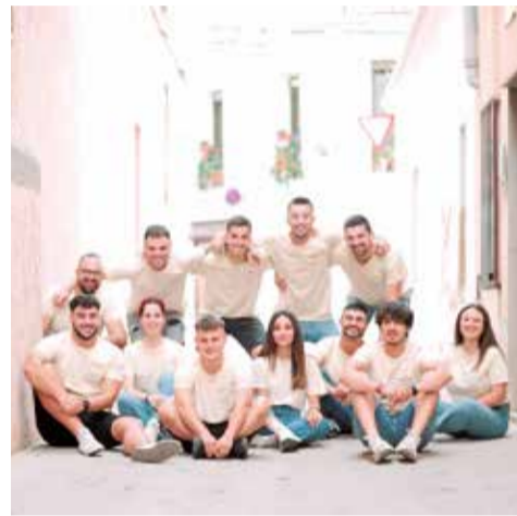
Festers de Quartell 2023.

Una vegada més, l'Ajuntament vol donar les gràcies als joves encarregats d'organitzar les festes, i tot el gran esforç que han realitzat durant tot l'any. També a tots els veïns i veïnes del poble que sempre celebren amb nosaltres, per la seua participació activa des de la responsabilitat, fet que fa de les nostres festes una ocasió on tots i totes tenim l'oportunitat de gaudir junts.