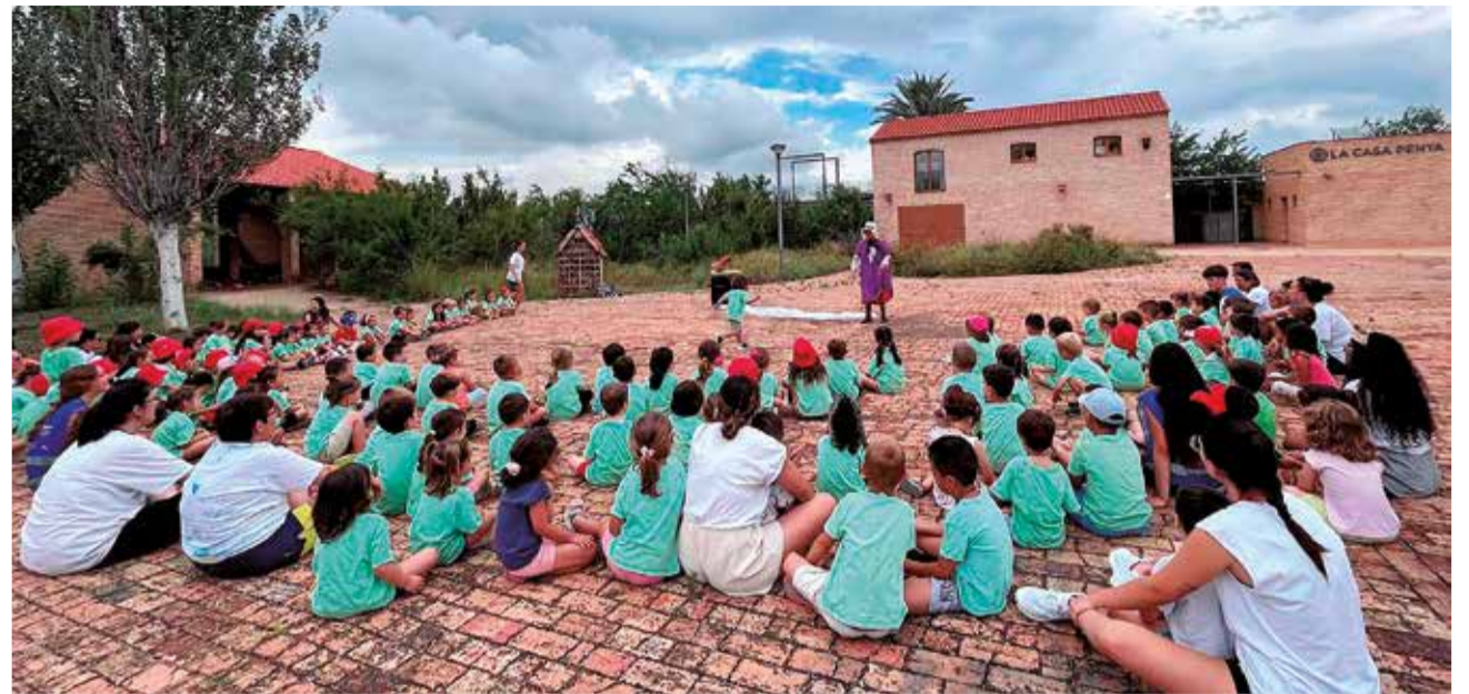
Alumnat de l'Escola d'Estiu a la Casa Penya.