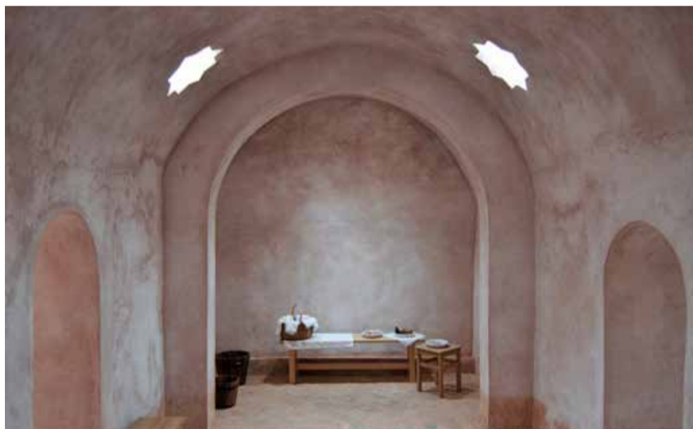
Interior de los Baños Árabes de Torres Torres.