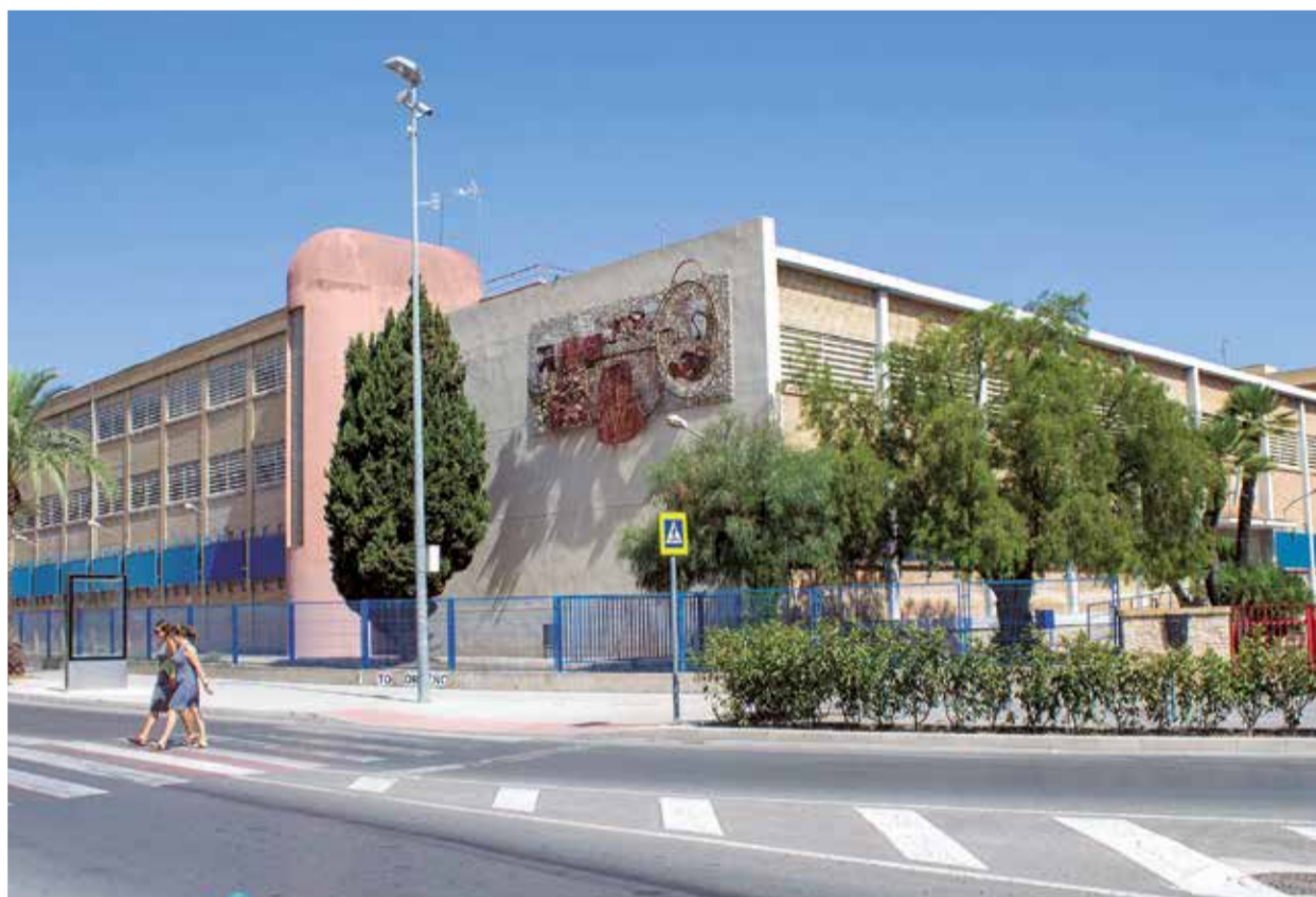
La sede del centro Eduardo Merello que se someterá a las obras de rehabilitación y ampliación.

Siguiendo las premisas del Plan Edificant, el Ayuntamiento de Sagunt se encargará de todos los procedimientos de contratación administrativa, e incluirá tanto los contratos de obras como los de servicios necesarios para la realización de la rehabilitación del edificio, de acuerdo con lo dispuesto en la normativa vigente de contratación pública. Además, el Consistorio ejecutará las obras de acuerdo con el proyecto técnico basado en el Pro-