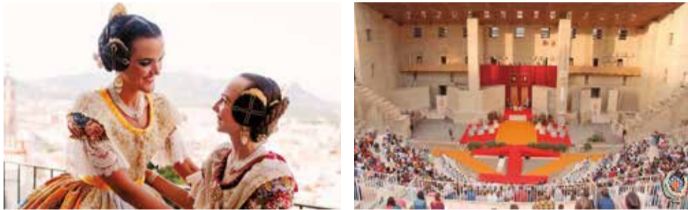
Falleras mayores y el teatro romano el día de la exaltación. / FJFS