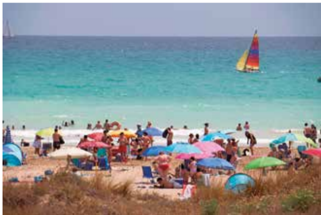
La playa de Canet d'en Berenguer es el principal atractivo turístico de la localidad.

lio (4, 11, 18 y 25) y cuatro en agosto (1, 8, 15 y 22). Habrá películas familiares como Tadeo Jones, 100% Wolf, Superpets o Sonic 2 para julio.