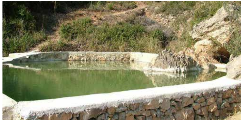
Font del Comte de Algímia d'Alfara.

Pero lo más significativo de la zona es la Vía Verde Ojos Negros . A finales del siglo XIX se concedió la explotación de diversos yacimientos de hierro en la localidad de Ojos Negros a un par de empresarios vascos, quienes fundaron la Compañía Minera de la Sierra Menera en 1900. Debido a la cantidad y calidad del mineral extraído decidieron solicitar la licencia para la construcción de un ferrocarril económico (vía estrecha) para transportar el mineral hasta el puerto de Sagunto. En el año 2001, el gobierno valenciano acondicionó el antiguo trazado ferroviario para su uso como vía verde. Posteriormente, el gobierno aragonés hizo lo mismo en su parte del recorrido. De esta manera, la Vía Verde une Teruel con la costa valenciana, siendo la más larga de España, con una longitud de 160 kilómetros.