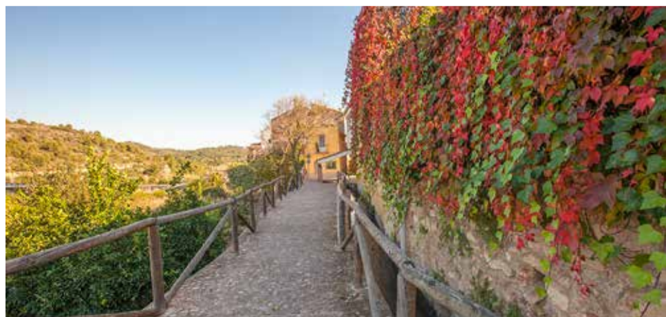
Paseo del amor de Algar de Palancia.

Por último, no podemos olvidar la Cisterna . Aunque para algunos es de origen musulmán, lo cierto es que, tras la expulsión de los moriscos del reino de Valencia se hicieron nuevas construcciones para poder atender las necesidades de sus habitantes.