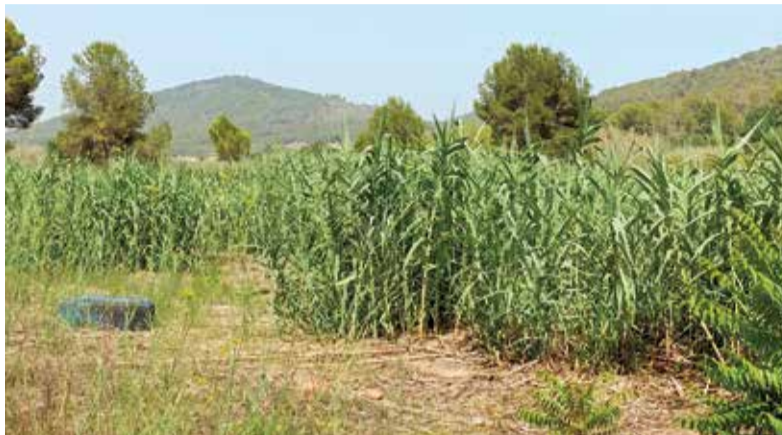
Canyars en el Palància.

Molt sovint s'ha dit que els arbres no ens deixen vore el bosc. Amb eixa expressió, es pretén dir que hi ha elements secundaris que no permeten mirar la realitat. Així hem estat molts anys, quan no teníem democràcia. Però també podem aplicar la frase per a referir-nos a tot el que espècies invasores que ocupen l'entorn fan per a amagar-nos la realitat ambiental i el patrimoni. És el cas dels canyars que omplien els barrancs i rius dels nostres pobles durant prou anys. Fins ara, ens havíem resignat a pensar que era impossible lluitar contra ells. Fins i tot hem pensat que era una espècie autòctona. Tanmateix, des de fa un temps, la Generalitat s'ha posat en marxa amb bon criteri per a intentar acabar amb ells. La canya és una espècie exòtica asiàtica, catalogada com una de les 100 espècies més invasores del món. No sols ha canviat la imatge antiga dels