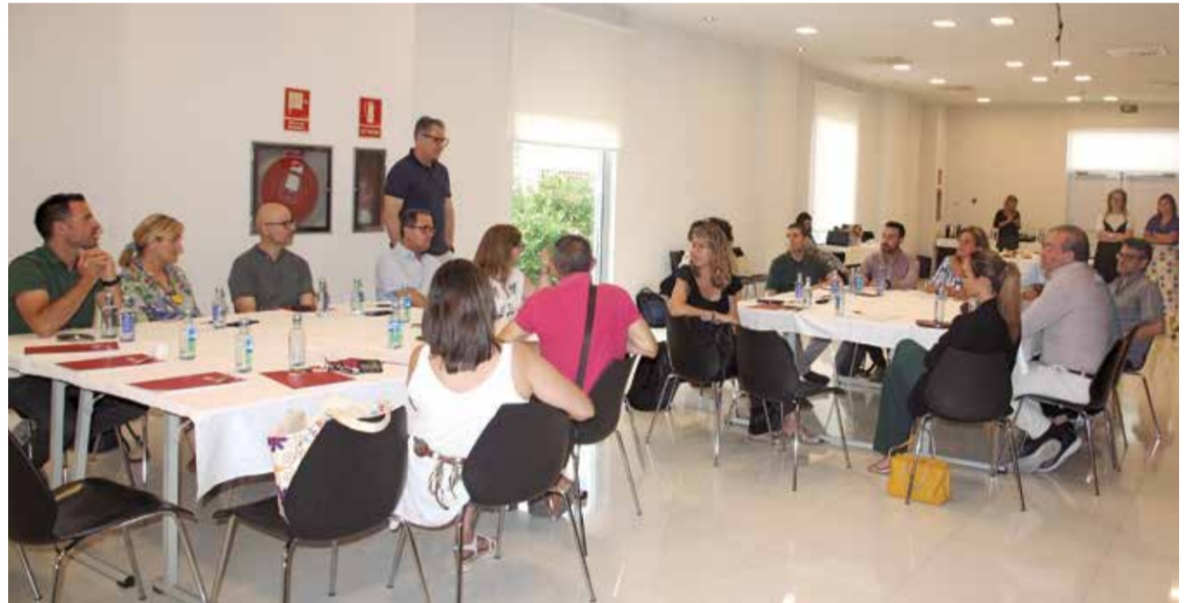
Un instante de la jornada organizada por la Asociación Empresarial del Camp de Morvedre.

ASECAM ORGANIZÓ UN ANÁLISIS DEL PRESENTE Y FUTURO DE LA ENSEÑANZA EN LA COMARCA