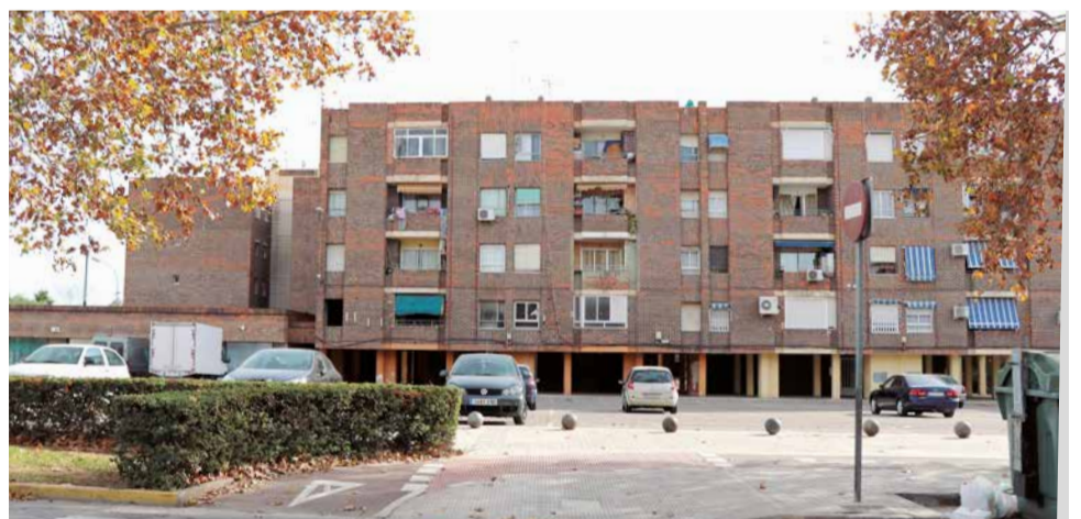
Una calle del barrio de Baladre.

Desde el Consejo de Baladre se activarán proyectos de participación ciudadana, así como campañas cívicas, medioambientales, de movilidad o limpieza y jardinería.