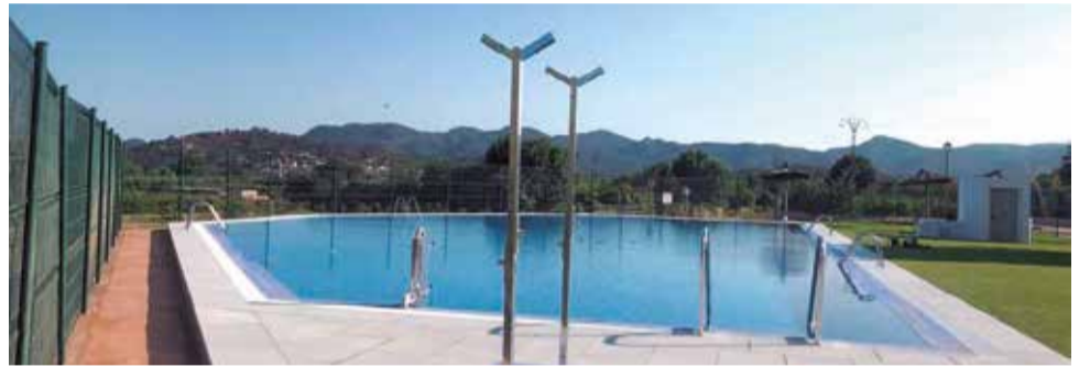
Piscina municipal de Alfara de la Baronia tras las obras.

EL MUNICIPIO PONE FIN A LOS PROBLEMAS EN LAS INSTALACIONES QUE DEJARON A LOS VECINOS SIN SERVICIO EL AÑO PASADO