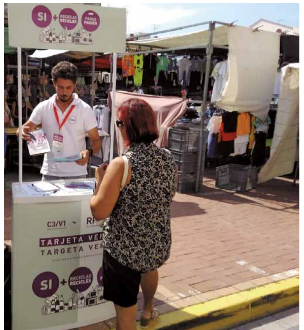
Sensibilización sobre el uso de ecoparques en los mercados.

El Consorcio Palancia Belcaire está formado por 56 municipios de las comarcas del Camp de Morvedre, Alto Palancia y Plana Baixa. Sus ayuntamientos, junto a las diputaciones de Castellón y Valencia y la Generalitat, gestionan de la manera más eficiente posible los residuos urbanos del Plan Zonal C3/V1.