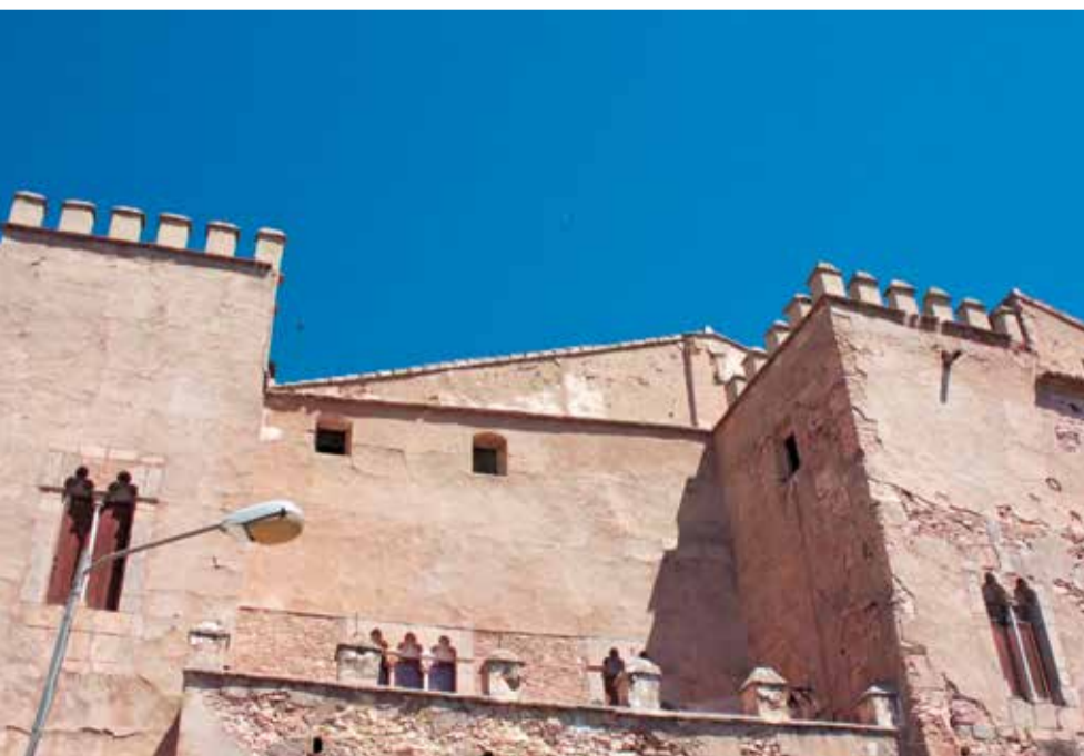
Palacio-castillo de Albalat dels Tarongers, emblema del municipio.