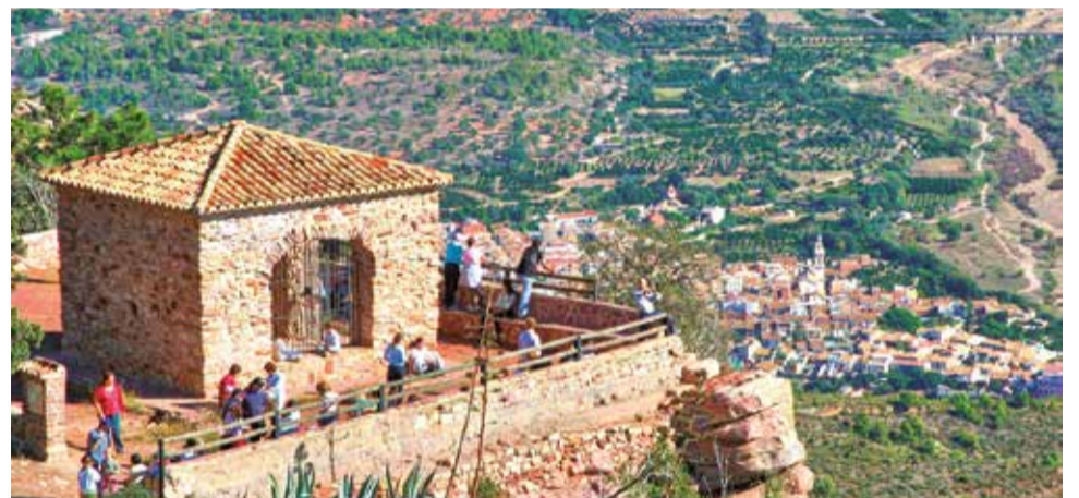
Mirador del Garbí con Estivella al fondo.

El Acueducto de los Arcos es una de las más destacables construcciones hidráulicas del Camp de Morvedre. Forma parte de la acequia mayor de Sagunt y se extiende por toda la subcomarca de la Baronia desde Algar hasta Sagunt. Su función es la de conducir el agua por encima del irregular lecho del Palancia, y así permitir que estén regadas las tierras de todos los lados del río, llegando hasta el término municipal de Albalat dels Tarongers.