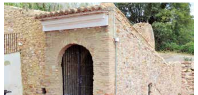
Cisterna de Alfara de la Baronia.