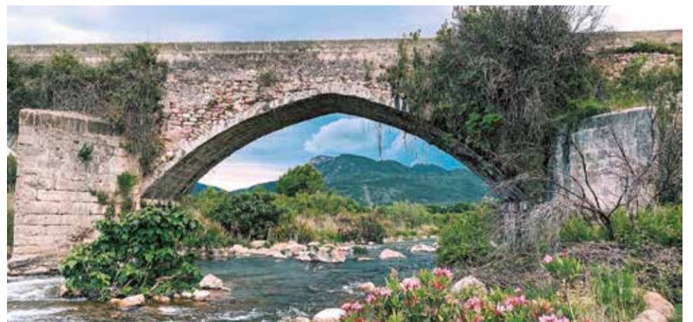
El Acueducto de Els Arcs, en el término municipal de Estivella.