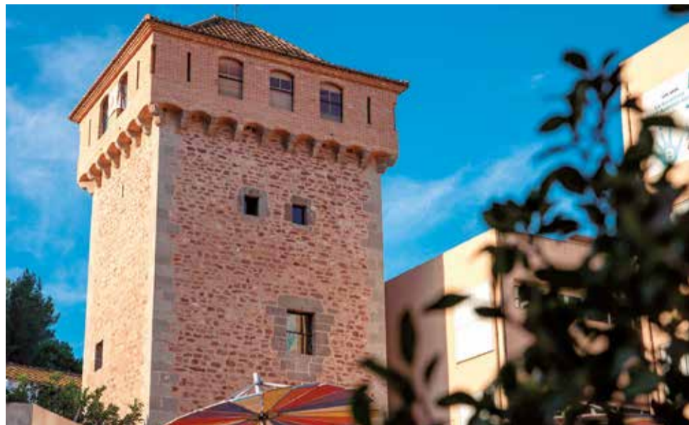
Torre de Gilet.

Por último, no podemos olvidar el Rodeno de la Creu , compuesto por grandes losas de rodeno superpuestas con vistas al Convento de Santo Espíritu y de la Sierra Calderona.