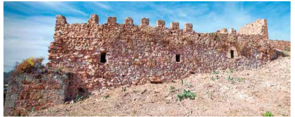
Castillo de Petrés.