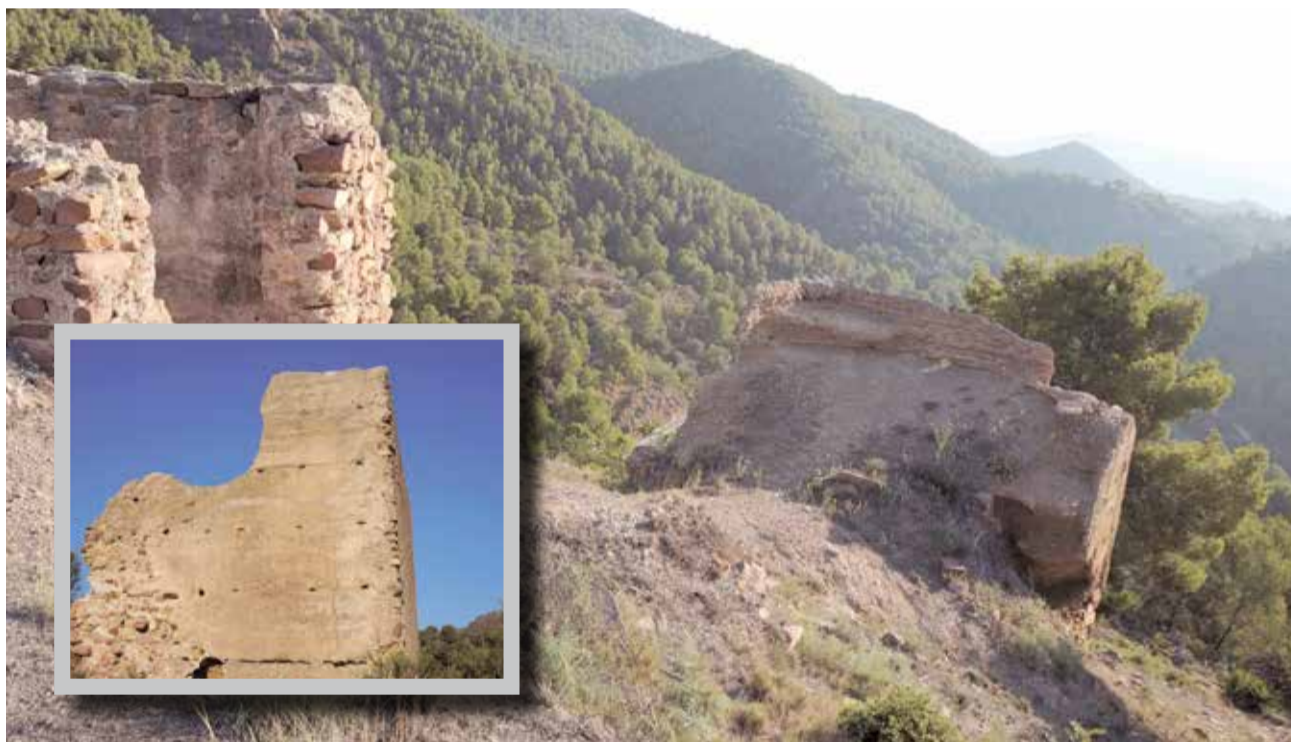
Castell de Segart.