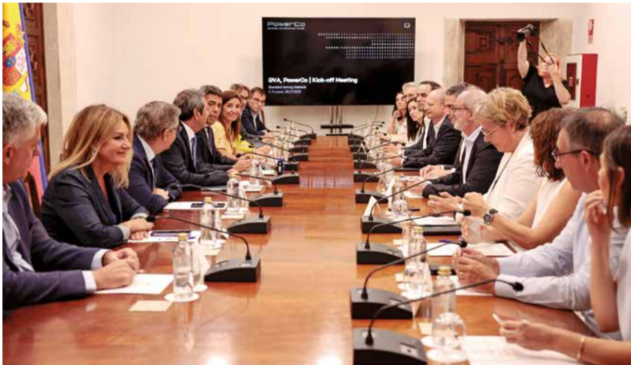
El president, Carlos Mazón, se reunió con miembros de Power Co y del antiguo Consell.

Del mismo modo, como marca el convenio, “ambas partes reconocen compartir el interés común y manifiestan su voluntad de colaborar en la sensibilización y el establecimiento de un lugar de trabajo amigable con la migraña en las instalaciones de ASECAM” dado que la entidad empresarial, además, se adhiere como colaboradora del proyecto Migraine Friendly Workplace puesto en marcha por la EMHA.