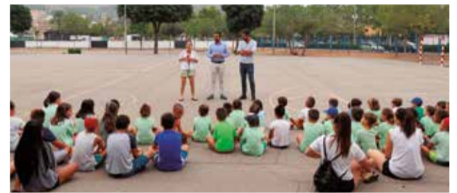
Diferents activitats portades a terme en els campus d'estiu organitzats per l'Ajuntament de Sagunt.

litat de vida del municipi per l'impacte que tenen sobre centenars de famílies.