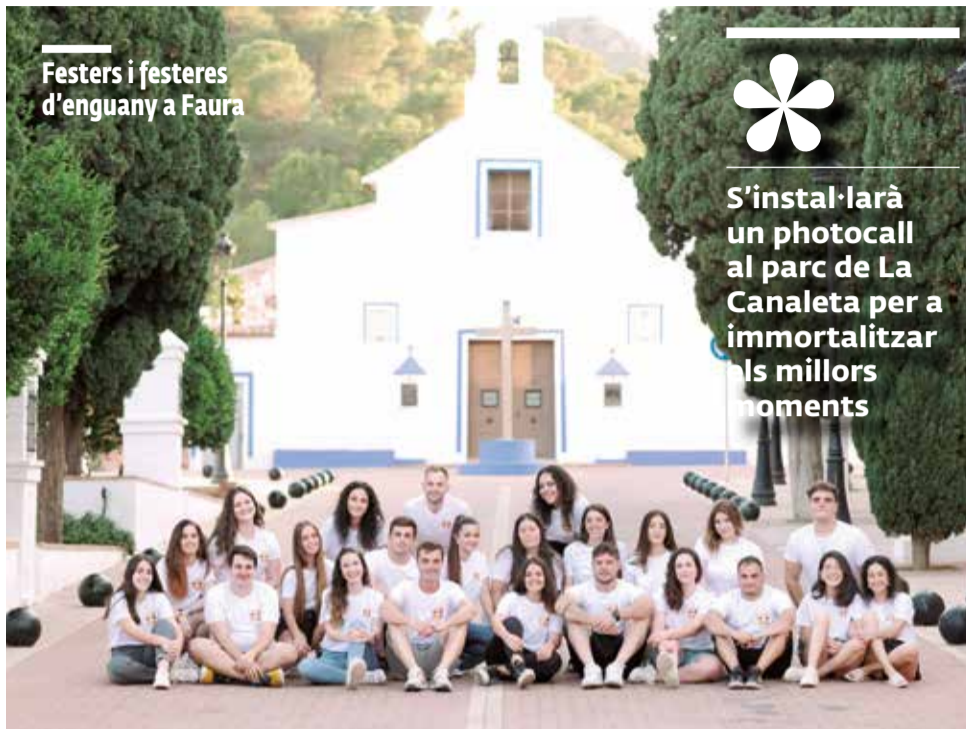
Festers i festeres d'enguany a Faura