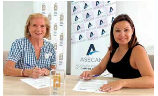
Ambas entidades firman el convenio.