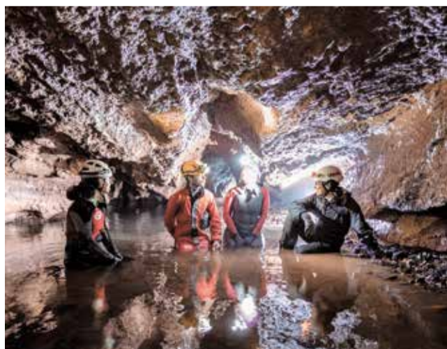
La cueva descubierta.