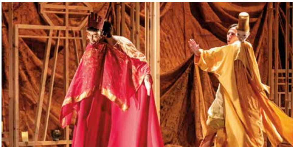
Bambalina teatre practicable: Èdip rei.

Les arts del moviment també ocupen un espai destacat en l'Off Romà, un element distintiu del festival que any rere any acosta la seua programació alternativa a un públic heterogeni en diferents punts de la ciutat de Sagunt i amb accés lliure.