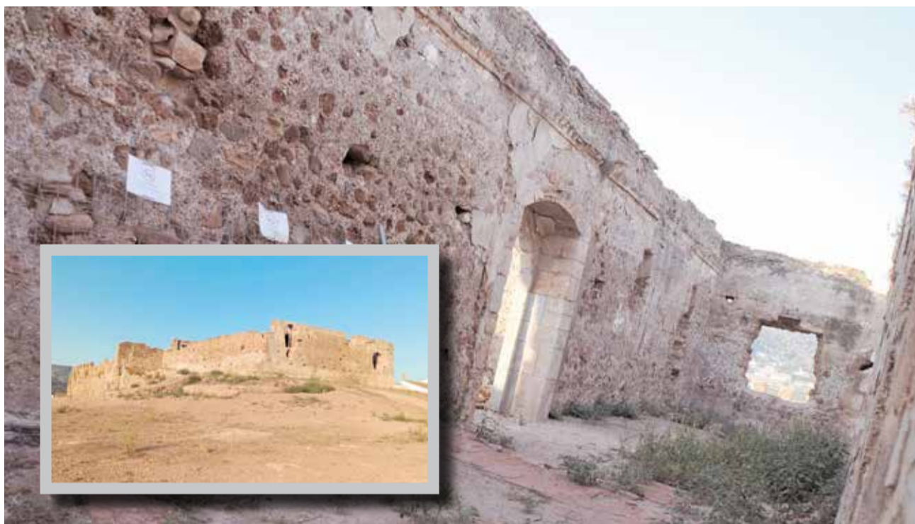
Castell de Petrés.

En definitiva, esta és una proposta per a una ruta de castells que necessiten protegir-se però que paga la pena visitar. No oblidem que som una comarca amb patrimoni ferit que necessita el nostre reconeixement i sobretot la protecció per part de les administracions.