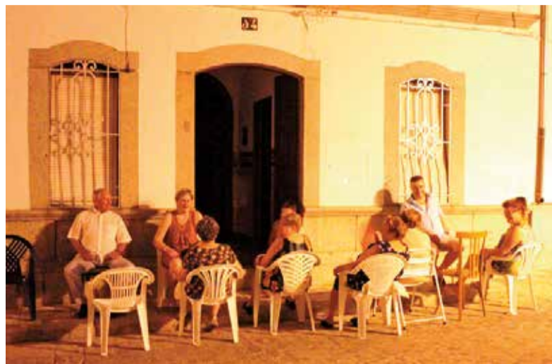
A la fresca.

Recorde aquells moments assentat en la cadira i fins i tot en la vo-