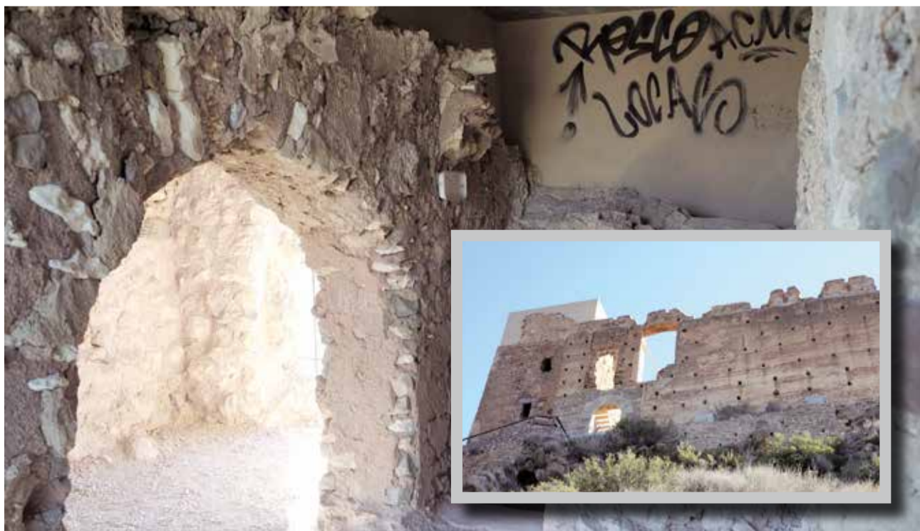
Castell de Beselga, al terme d'Estivella.