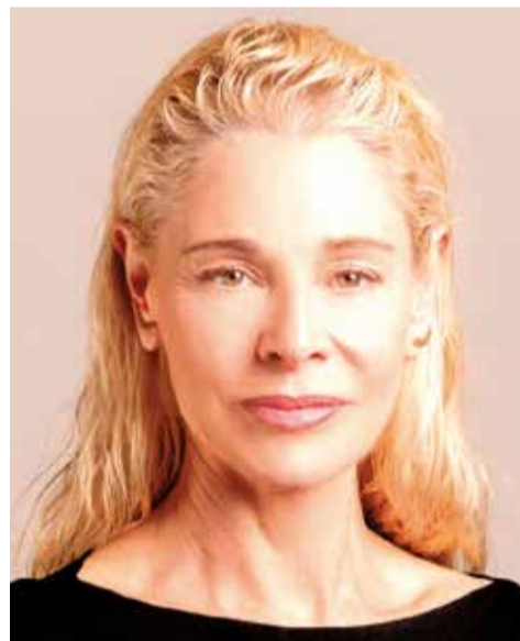
Pentación Espectáculos: Salomé.