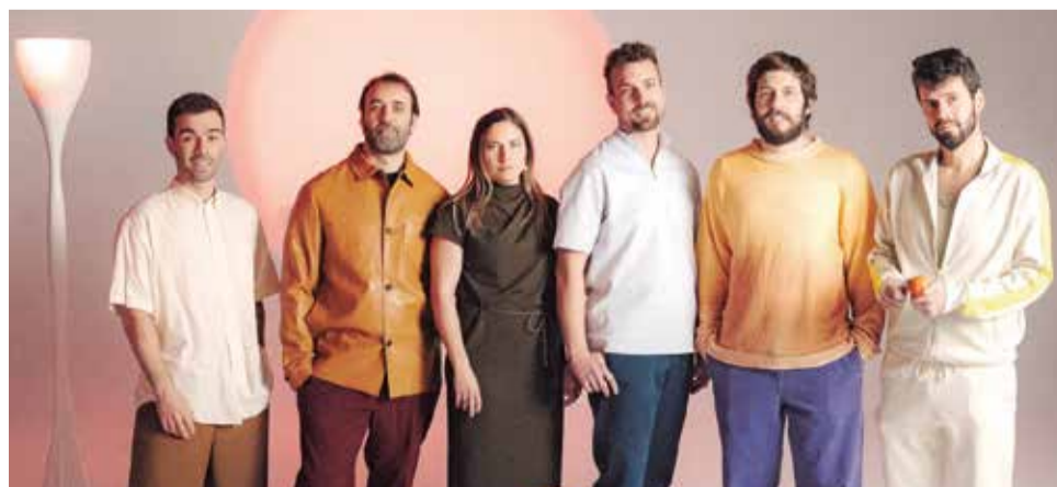
El Diluvi.