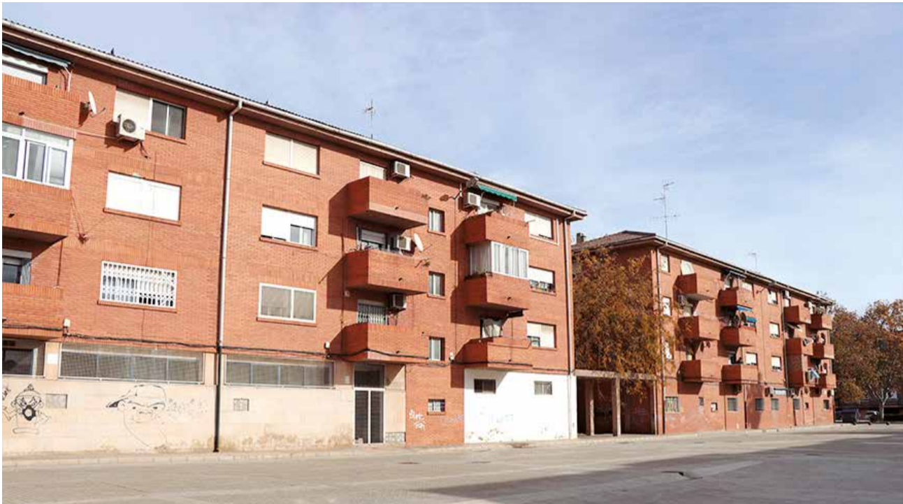
Dos edificios del barrio de Baladre, en el que se llevarán a cabo las actuaciones de mejora.