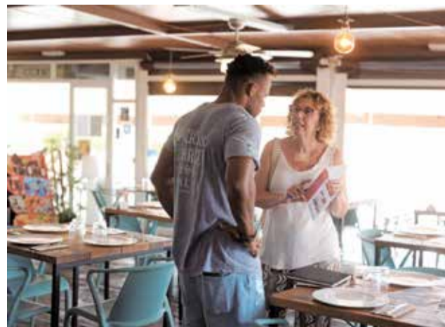
La concejala de Comercio visita establecimientos.

y Hosteleros de Canet d'en Berenguer, que hará de interlocutor entre los empresarios locales y las administraciones. También se han proyectado eventos comerciales y ferias con las que se involucrará a los ciudadanos en su organización contribuyendo de esta manera al desarrollo comercial local.