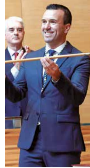
Vicent Mompó.

► ¿Cómo va a compatibilizar la alcaldía y su cargo como diputado nacional?