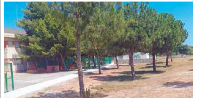
El nuevo espacio.