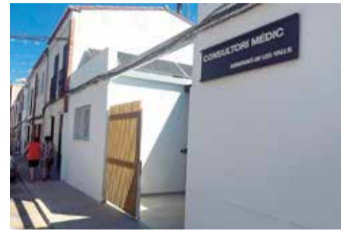
El nou consultori mèdic de Benifairó de les Valls.