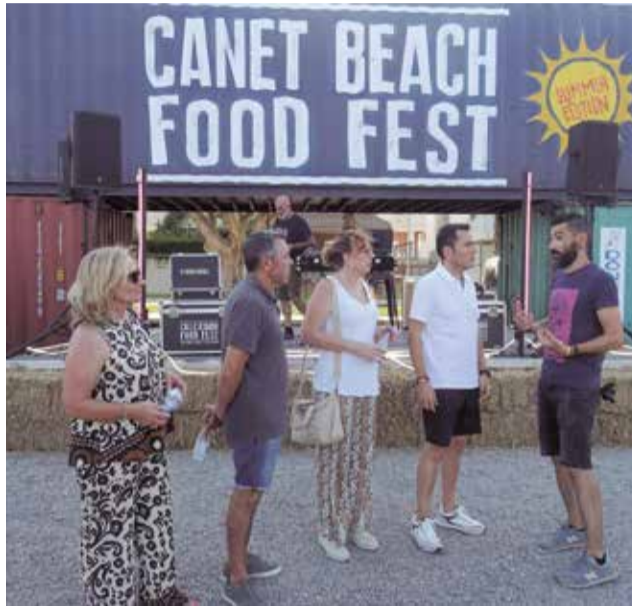
Inauguració del 'Canet Food Fest'.

"Amb aquest projecte, el que hem pretès és ampliar l'oferta d'oci familiar en Canet i també la gastronòmica, amb preus assequibles per a totes les butxaques. Però a més, aquest festival es convertirà en un atractiu turístic més i una eina per a desestacionalitzar el turisme, que és un altre dels nostres objectius. Per això, ja avancem que intentarem programar esdeveniments d'aquest estil en diferents èpoques de l'any per a atraure turistes i revitalitzar la nostra economia, així com