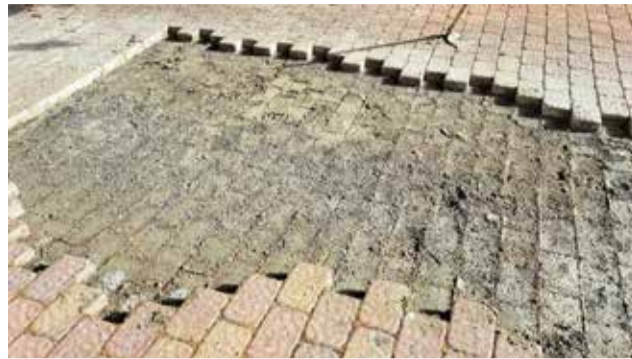
Corrigiendo el hundimiento.