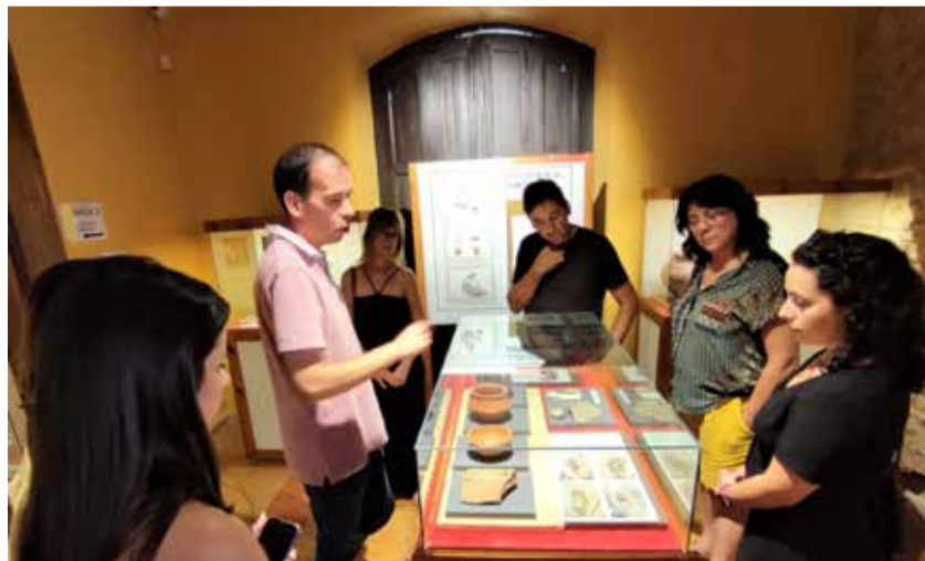
Visita al Museo de Arqueología y Etnología de Segorbe.

Ramos ha explicado que el Cuerpo Europeo de Solidaridad (CES) es una iniciativa de la UE que ofrece oportunidades para que jóvenes de entre 18 y 30 años lleven a cabo un servicio de voluntariado o participen en proyectos en el