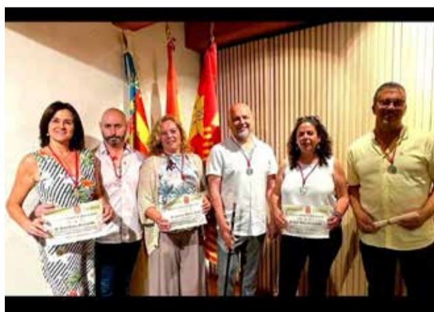
Ayuntamiento de GELDO