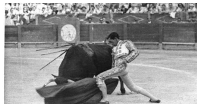
Manolete fotografiado por Finezas./ EPDA

Las imágenes proceden de los fondos del Centro de Asuntos Taurinos de la Diputación de Valencia, que