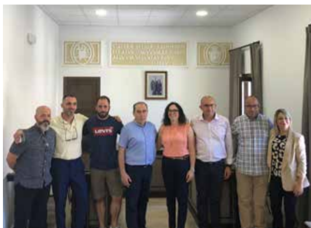
Ayuntamiento de JÉRICA