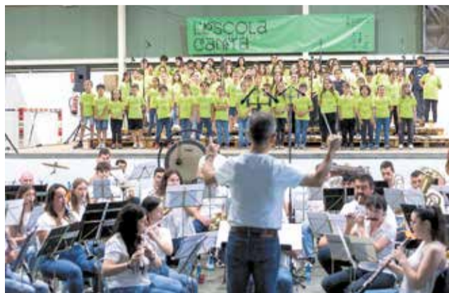
Concert del escolars amb la banda.

Per a preparar-se el concert, els centres duen a terme diferents activitats durant tot el curs. Primer, el professorat se sotmet a unes jornades de formació per tal d'analitzar la partitura i el text de l'obra. A partir de recursos didàctics i material divers, el professorat treballa dins d'horari lectiu la cantata amb els seus i les