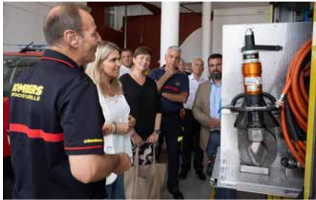
Instantánea de la visita.