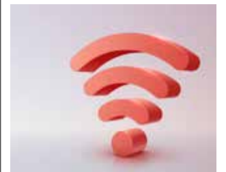
Símbolo Wifi.