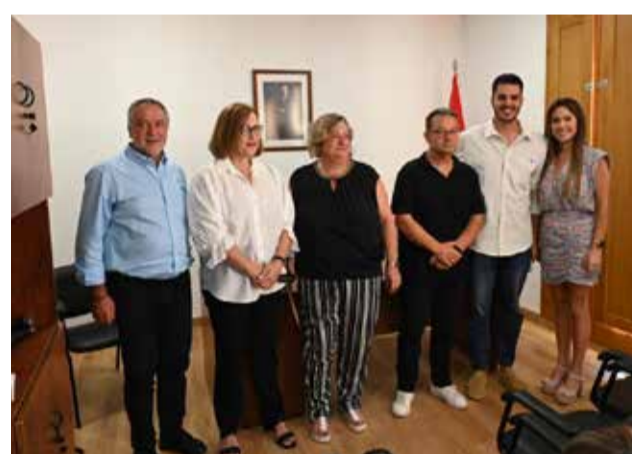
Ayuntamiento de GAIBIEL