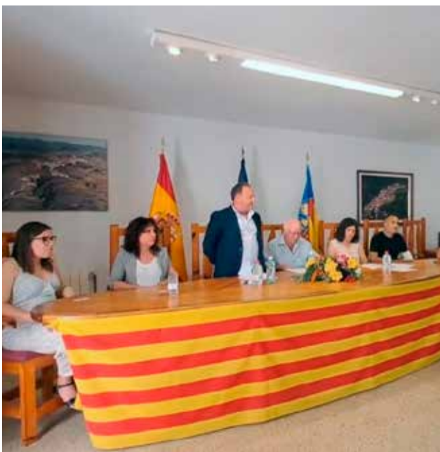
Toma de posesión en Cortes de Arenoso.

po de gobierno que han gestionado el control municipal en los anteriores cuatro años (2.019-2023), menos Benafer que estaba en manos de Amigos de Benafer y los resultados electorales han sido favorables al PSOE. Otra cosa son los cambios producidos entre los miembros de la corporación y muy especialmente entre los alcaldes. Han sido seis poblaciones del Palancia las que han cambiado de alcalde por la retirada de los anteriores en los cinco ayuntamientos que junto a Benafer suman seis nuevos alcaldes. En cuanto a la igualdad, han sido tres mujeres y tres hombres los que abandonan el cargo de alcalde/alcaldesa y llegan cuatro hombres y dos mujeres. Por lo que con