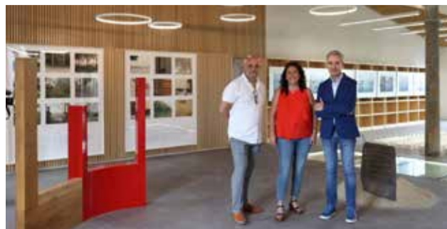
Inauguración de la muestra.