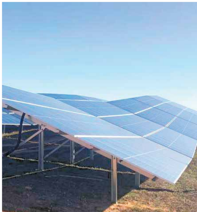
Plantas fotovoltaicas.

La presidenta explicó que para conocer el estado en el que se encuentran los diferentes proyectos en los municipios afectados y explorar posibles vías de ayuda, "se les ha pasado una ficha de análisis para conocer las necesidades específicas de cada