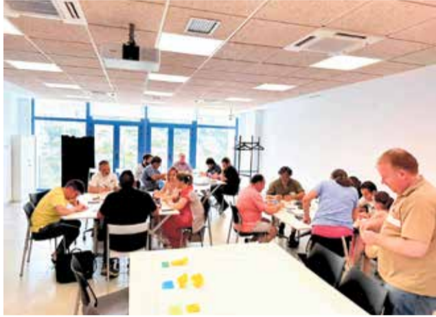
Reunión en Lluçena del Cid.

En estas reuniones han participado alcaldes, ADLs tanto de las corporaciones municipales como de la Federación Valenciana de Municipios y Provincias, empresarios y representantes de asociaciones culturales de carácter privado quienes han mostrado, de manera especial, “su preocu-