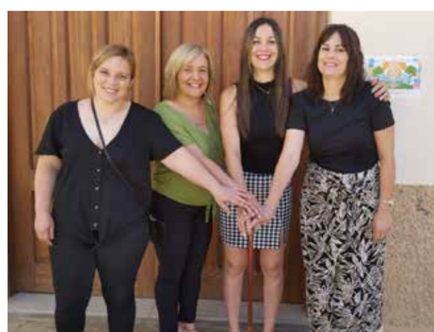
Equipo de gobierno de ZUCAINA