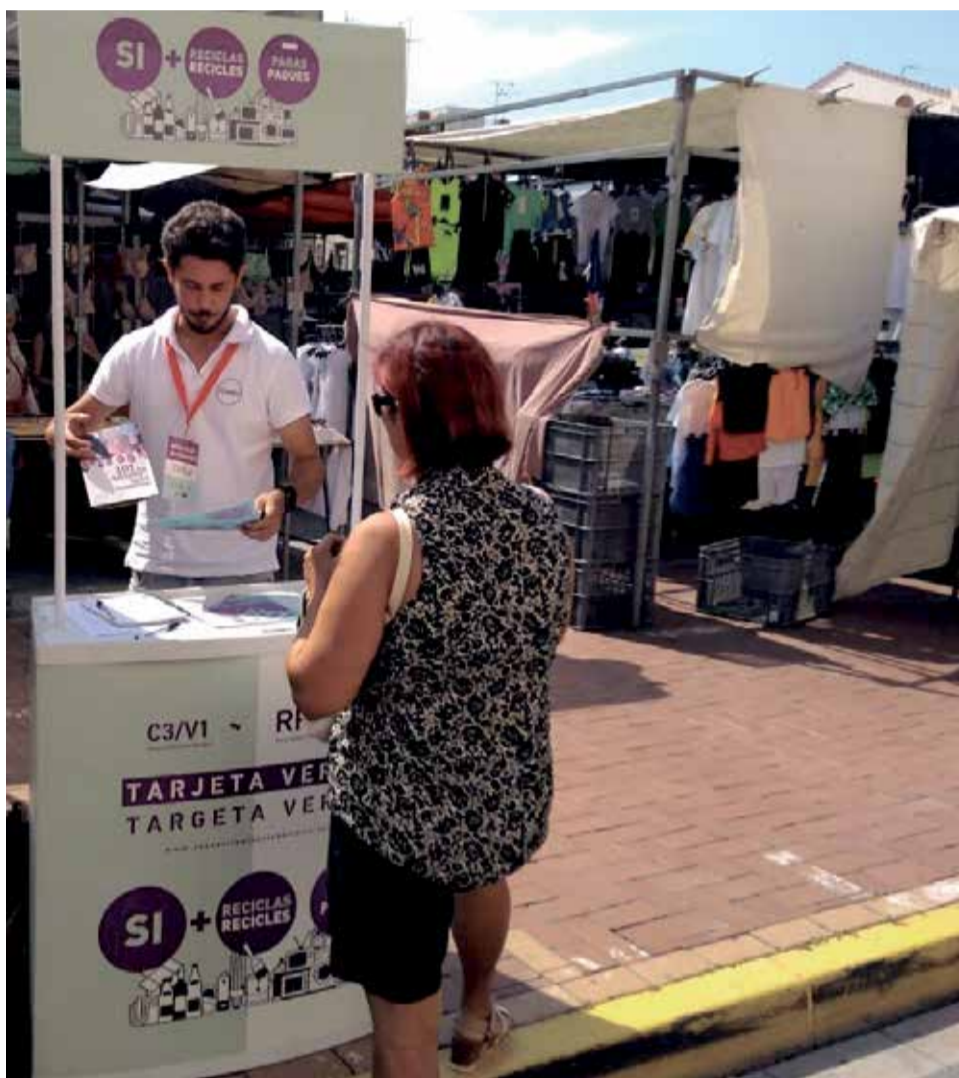
Sensibilización sobre el uso de ecoparques en los mercados.

El Consorcio Palancia Belcaire está formado por 56 municipios de las comarcas del Camp de Morvedre, Alto Palancia y Plana Baixa. Sus ayuntamientos, junto a las diputaciones de Castellón y Valencia y la Generalitat, gestionan de la manera más eficiente posible los residuos urbanos del Plan Zonal C3/V1.