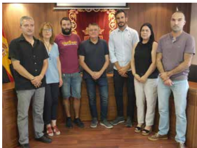
Ayuntamiento de MONTANEJOS