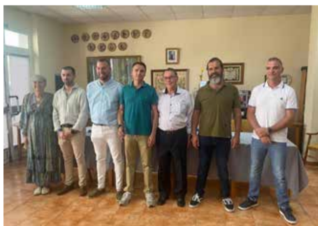
Ayuntamiento de NAVAJAS