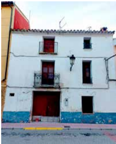
Edificio para viviendas. / EPDA

Se trata de una aportación de la Consellería de Vivienda dentro del programa 'Recuperem Llars' que tiene como finalidad la compra de un inmueble que antiguamente tenía el uso de posada, y que tras la reforma en él se construirán tres viviendas de alquiler social.