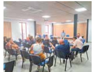
Reunó amb l'alcalde.