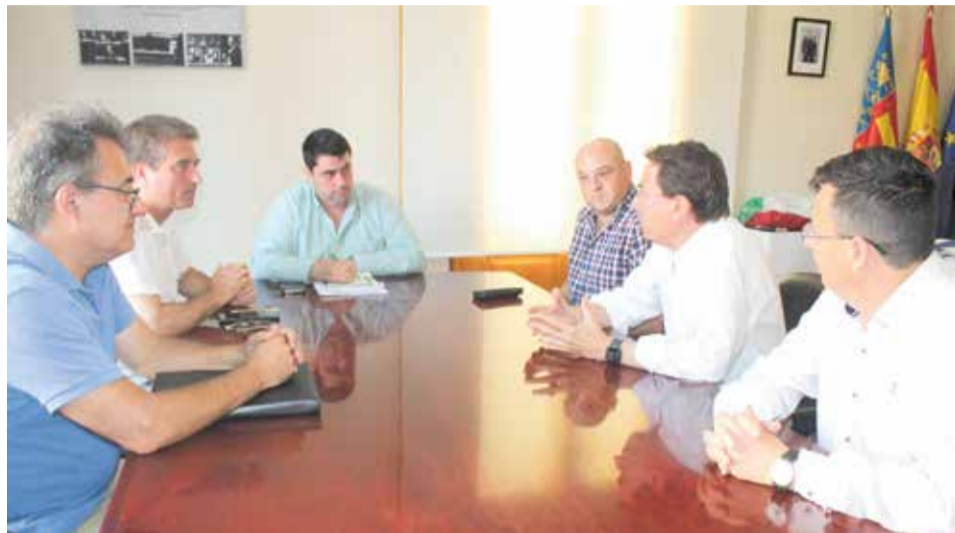
L'alcalde de Nules es reuneix amb l'empresa.

Amb un total de 84.000 metres quadrats, 57.000 corresponents a la planta de producció i 27.000 al centre logístic, i una capacitat productiva de 5.000.000 metres quadrats anuals, el