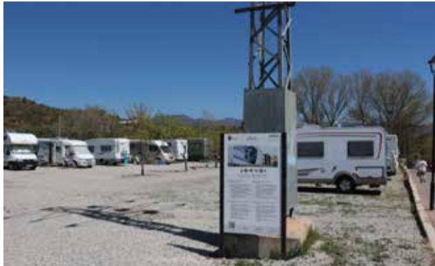
Área de servicio para autocaravanas en Geldo.

La red de Punts Nets AVANT consiste en áreas de servicio, que están geolocalizadas, en las que las personas usuarias de las autocaravanas pueden repostar agua potable y vaciar las aguas grises y las aguas negras, cumpliendo así con las exigencias medioambientales de tratamiento de residuos. Estas ayudas están dirigidas a financiar gastos relacionados con la ejecución de las obras de un nuevo punto limpio o