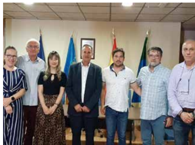
Ayuntamiento de MONTÁN