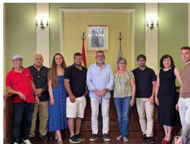
Ayuntamiento de VIVER