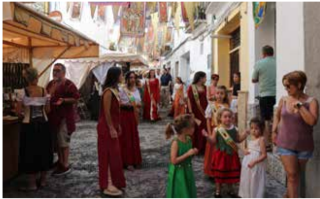
Aspecto de la calle Historiador Diago.

En la inauguración se reunió una auténtica pléyade de autoridades especialmente alcaldes y concejales de numerosos municipios de la zona. Con respecto al año pasado el escenario de la feria se ha ampliado a la Calle del Río