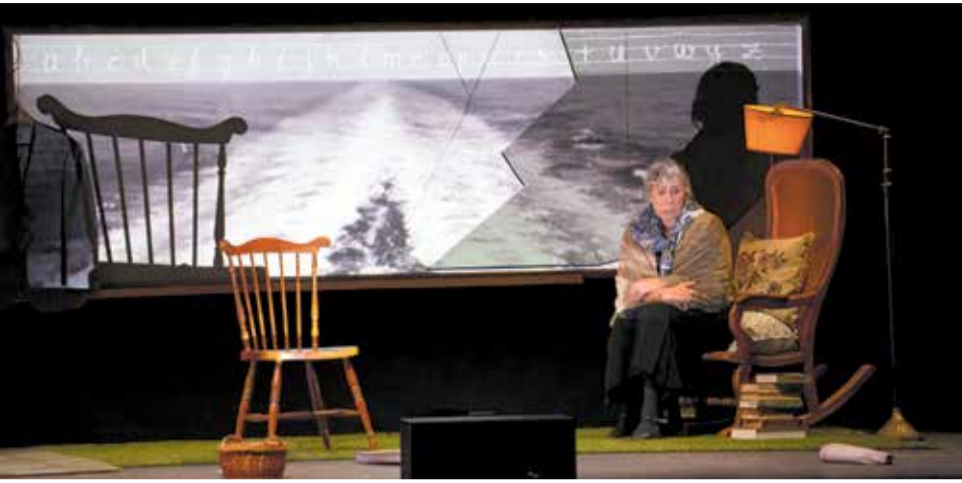
Festival de Teatre Clàssic de Peñíscola.