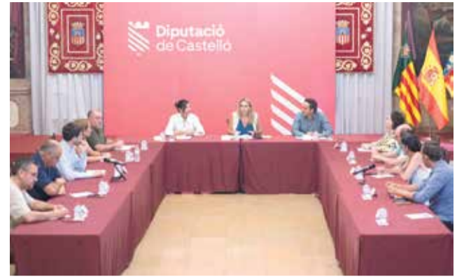
Reunión de los alcaldes en la Diputación.