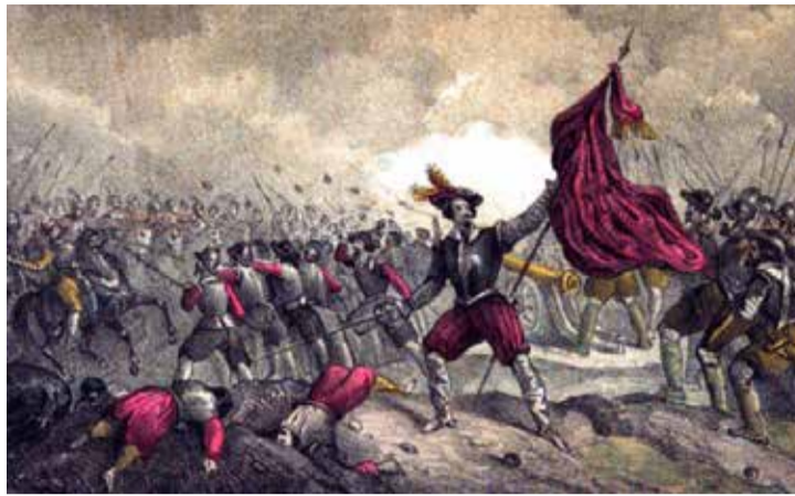
Pintura de la Guerra de las Germanías.