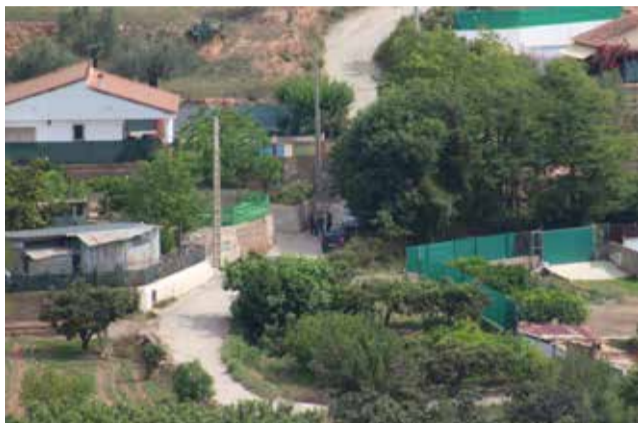
Zona donde ocurrieron los hechos.

La causa está abierta inicialmente, y sin perjuicio de ulterior calificación, por un delito de homicidio, según las mismas fuentes. La investiga-