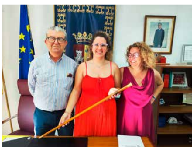
Ayuntamiento de VALLAT