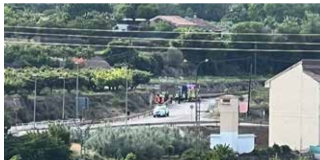
Accidente a la salida de Segorbe a Navajas.

Al parecer el vehículo invadió el carril contrario por el que circulaba la motocicleta, cuyo conductor resultó herido de gravedad. El herido, un hombre de 47 años presentaba politraumatismo, según el CICU, por lo