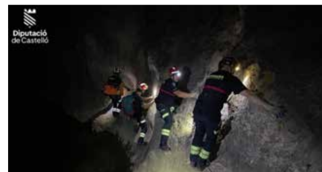
Dificultades para llegar hasta la lesionada.

Sobre las 2:30 de la madrugada los equipos de bomberos accedieron al lugar donde se encontraba la víc-