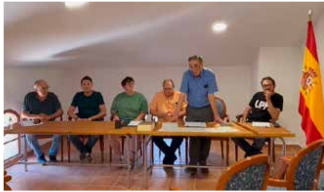
Constitución del Ayuntamiento de Puebla de Arenoso.