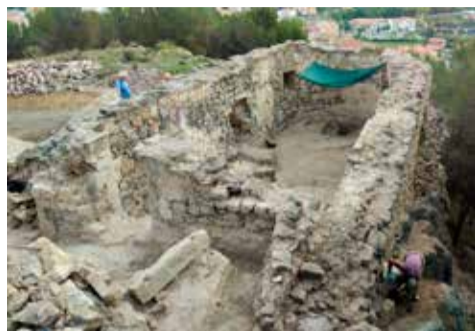
Trabajos sobre la iglesia.