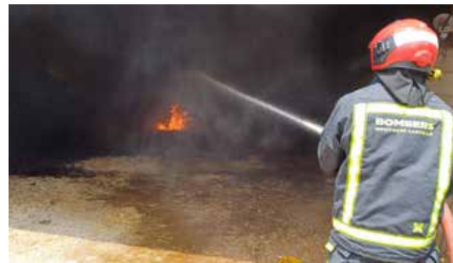
Los bomberos en una actuación.