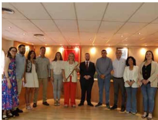
Ayuntamiento de ALTURA