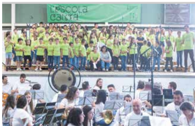
Concert del escolars amb la band--a.

seues alumnes. I finalment, la interpretació de l'obra es porta a terme al concert de cloenda del projecte, on tots els alumnes participants interpreten "La missió de Robi" acompanyats i acompanyades de la banda de música participant.