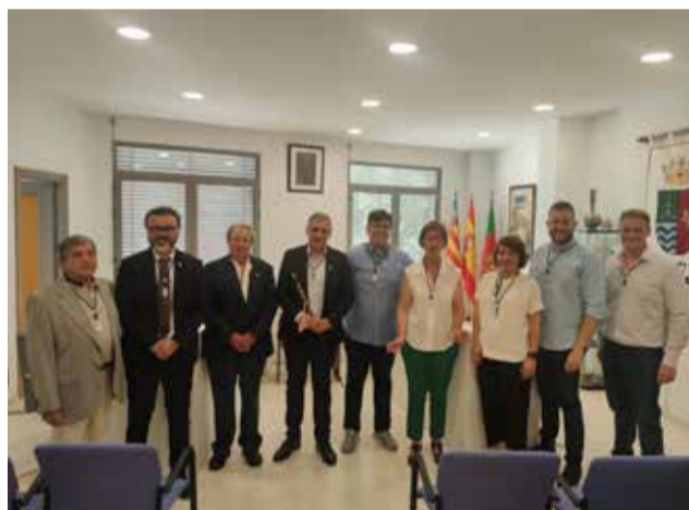
Ayuntamiento de SONEJA