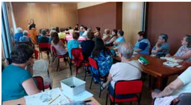
Talleres en Pina de Montalgrao.

Hay que destacar que el centro de mayores procederá a su reapertura diaria durante las tardes a partir del mes de agosto y se extenderá durante los próximos meses para que las personas interesadas puedan participar en