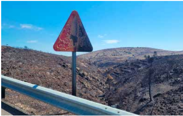
Montes arrasados por el fuego en el Palancia.

El proyecto aspira a realizar un plan de reducción de la huella de carbono de los municipios afectados. Los incendios registrados en el último año en la comarca han