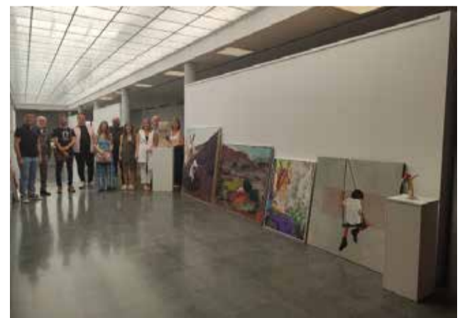
Componentes del jurado y obras ganadoras.