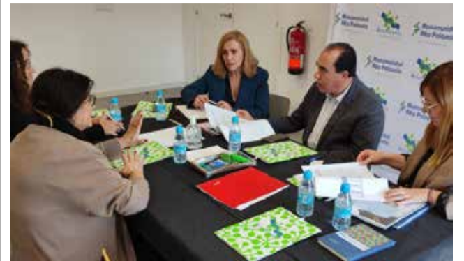
Firma del convenio