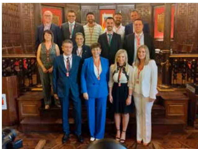
Ayuntamiento de SEGORBE

LA NORMALIDAD FUE LA TÓNICA GENERAL EN EL ACTO DE CONSTITUCIÓN DE LOS NUEVOS AYUNTAMIENTOS Y DE LA ELECCIÓN DE ALCALDES Y ALCALDESAS