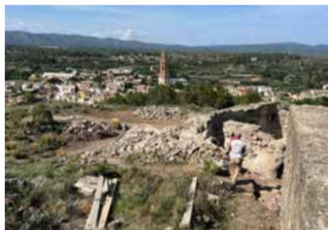
Actuación en los accesos.