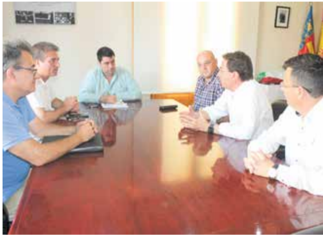
L'alcalde de Nules es reuneix amb l'empresa.

Amb un total de 84.000 metres quadrats, 57.000 corresponents a la planta de producció i 27.000 al cen-