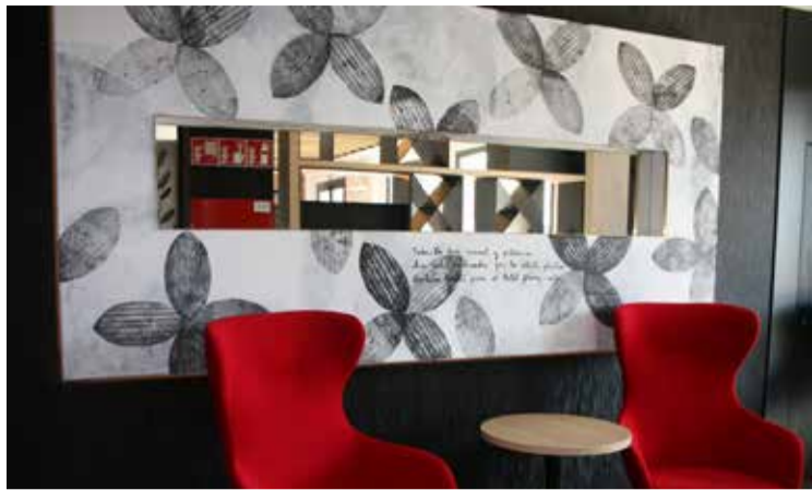
Premiados y patronos de la Fundación Max Aub.