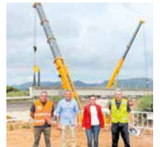
Obres del pont