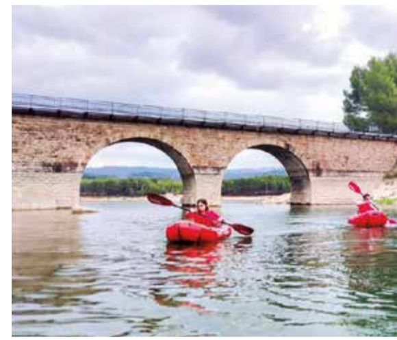
Deporte acuático que se puede practicar en las

La situación estratégica de Gandia en la Comunitat Valenciana, la privilegiada geografía y la climatología, convierten a este municipio en un lugar idóneo para la práctica deportiva durante los 365 días del año. Además, en su condición de ciudad deportiva, ofrece una