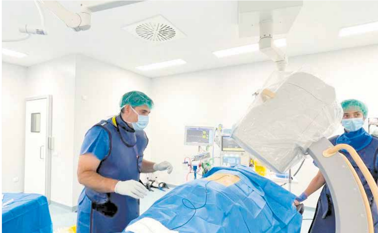
Instante de una operación en el Hospital Vithas de Castellón.

En paralelo, el especialista asegura que “el abordaje del dolor es multidisciplinar porque estamos implicados varias especialidades como traumatología, neurocirugía, cirugía urología y las patologías de columna como las lumbalgias y las cervicalgias son las más habituales en con-