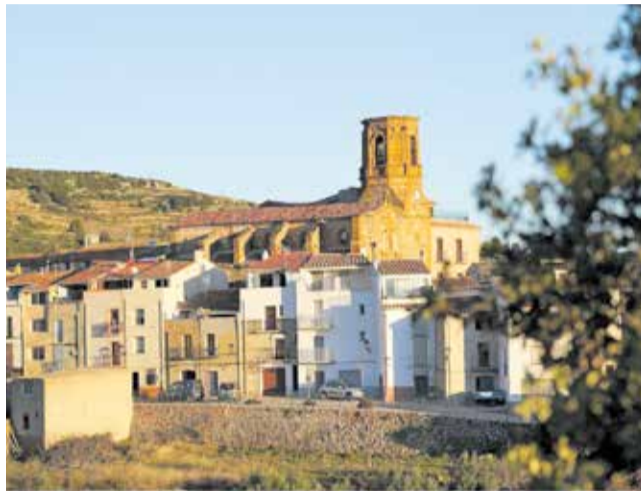
Vista de La Serratella.