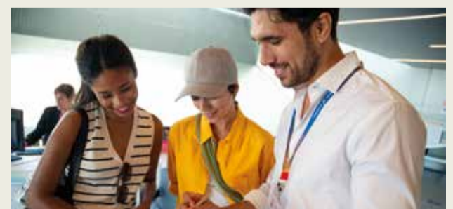
Professionals del sector turístic. / EPDA