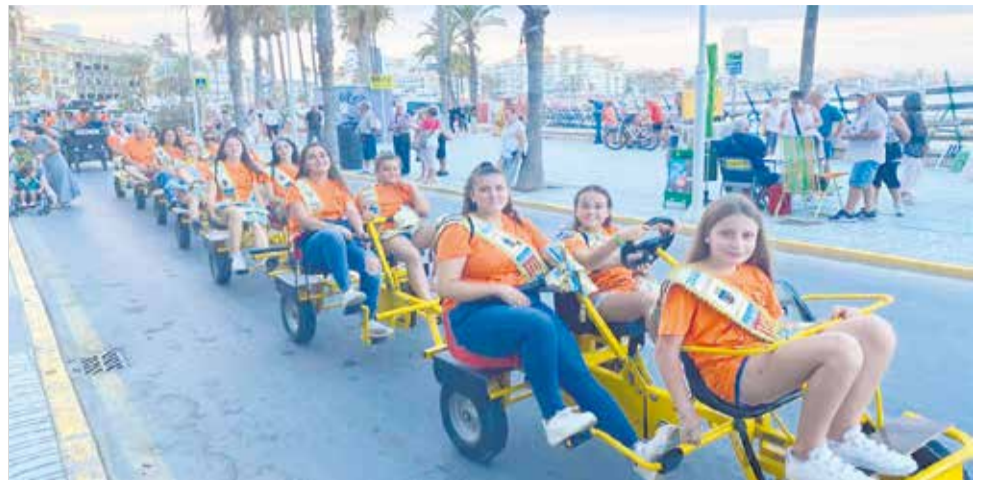
Un instant de la Volta amb bicicleta.