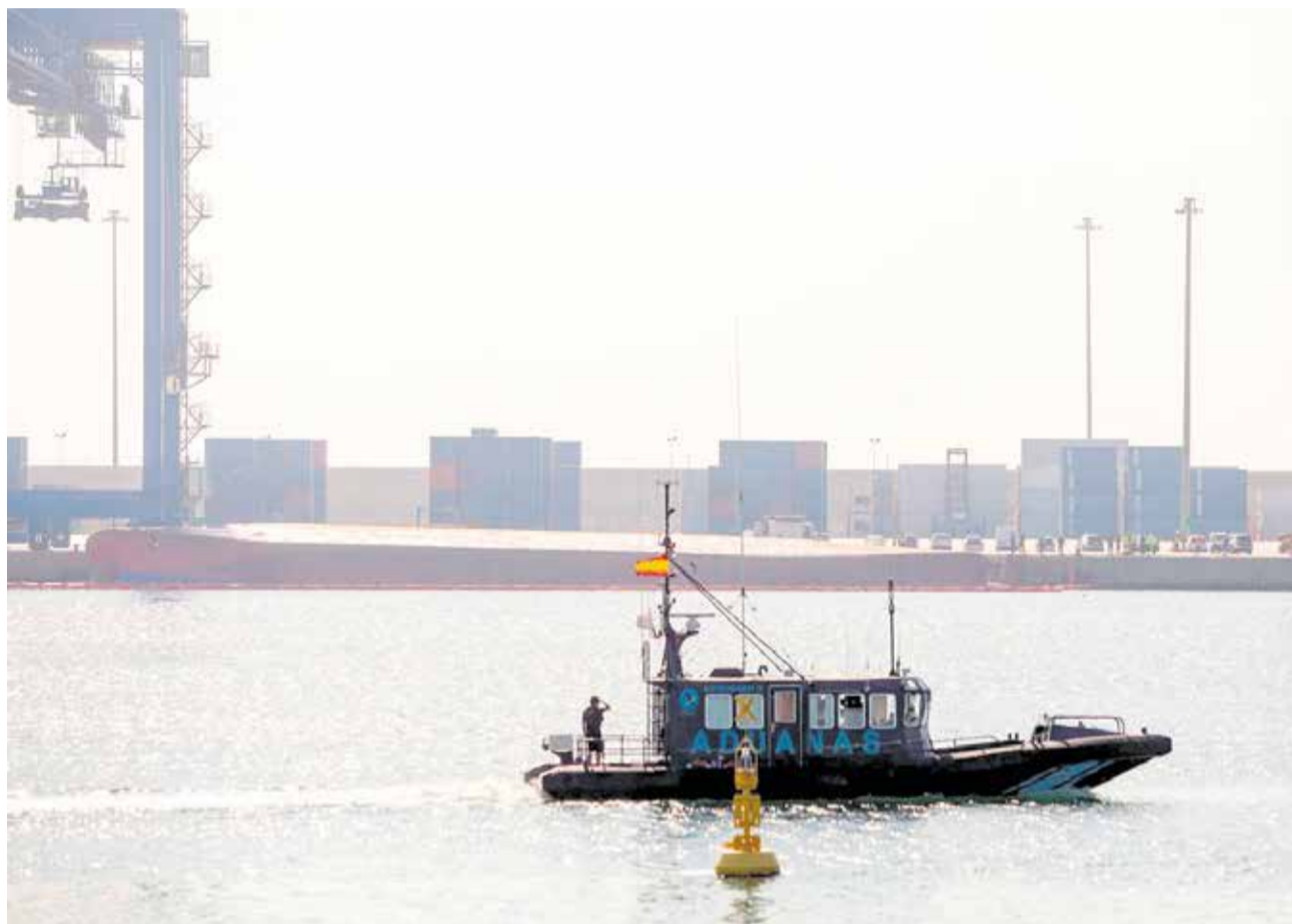
Un barco en el puerto de Castellón

Para mejorar la relación con el medioambiente Vidal afirmó que "querían crecer de manera eficiente, cuidando y protegiendo nuestro medio. Es la única manera