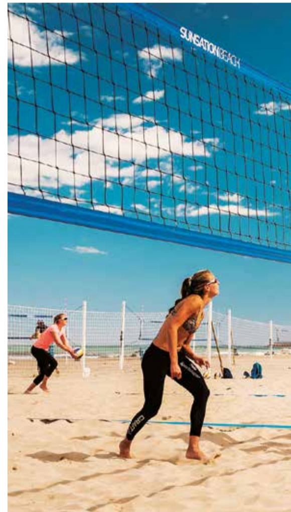
Varias personas practicando voleibol en una playa