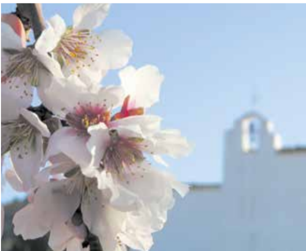
Primer premi del concurs. / EPDA