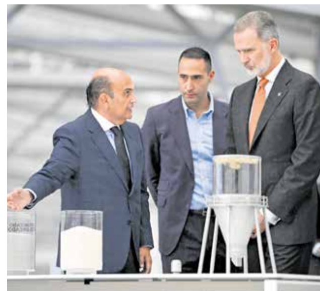
Un instante de la visita del rey Felipe VI.

“Mas allá de las personas que participan en este proceso, 2.750 sólo en Vila-real, todas son importantísimas y juntos generamos conocimiento, riqueza y prosperidad que revierte en nuestro entorno. Esperamos que quede enamorado de la cerámica valenciana, que llega a todo el mundo desde Vila-real, y hace marca España”, concluyó la consejera delegada tras atender a los medios de comunicación que estuvieron presentes en el acto.