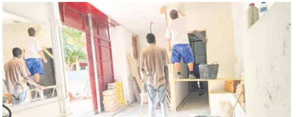
Les obres de l'auditori.