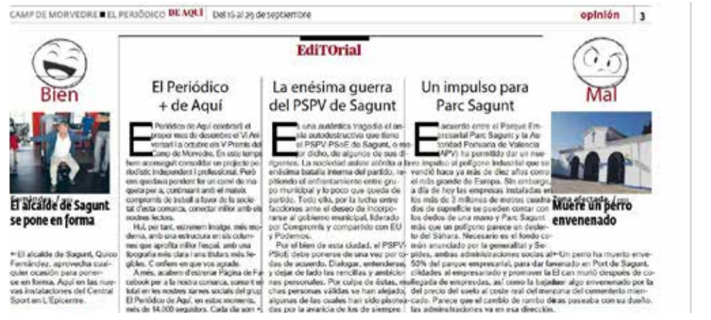
Editorial publicado el 16 de septiembre de 2016.

fer un canvi de maquera per a, continuant amb el mateix compromís de treball a favor de la societat d'esta comarca, conectar millor amb els nostres lectors. Hui, per tant, estrenem imatge, més moderna, amb una estructura en sis columnes que aprofita millor l'espai, amb una tipografia més clara i uns titulars més llegibles. Confiam en que vos agrade".