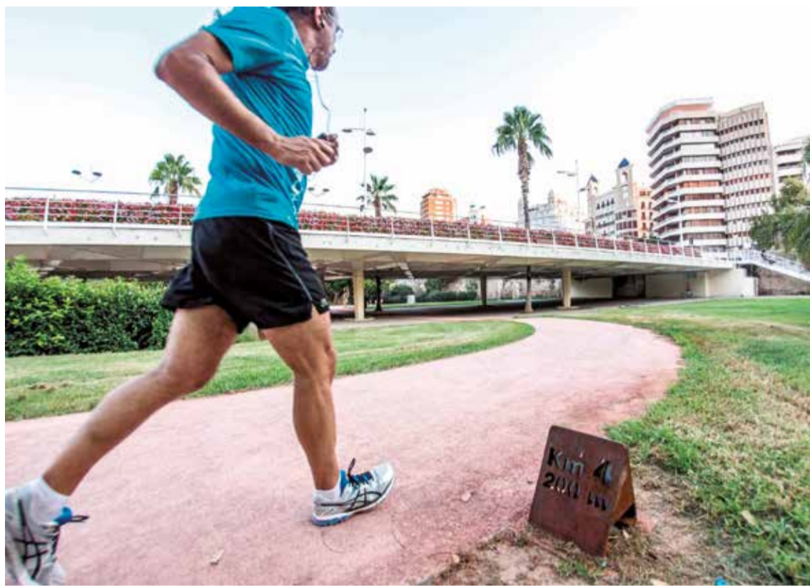
Los Jardines del Turia, un gran espacio verde que vertebra la ciudad de Valencia.

El anillo verde de Alzira es un proyecto que define el itinerario natural alrededor de la capital de la Ribera Alta para peatones y ciclistas incorporando el arbolado como elemento principal. Aunque a día de hoy continúa llevándose a cabo varias actuaciones para seguir adaptando el terreno a las diferentes actividades que ofrece el pulmón verde de Alzira, hay zonas y varios recorridos don-