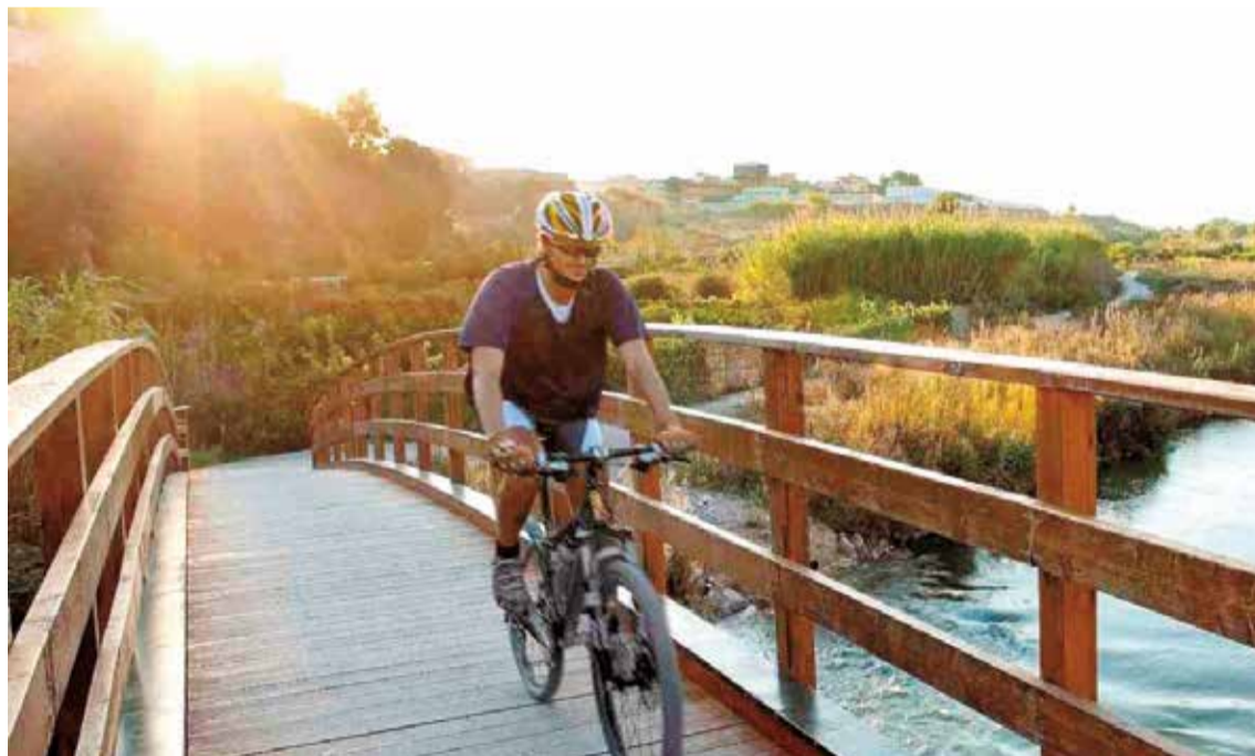
Parque Natural del río Turia, a su paso por la localidad de Riba-roja.

de puede practicarse deporte al aire libre como, por ejemplo, senderismo o ciclismo. Así pues, uno de los objetivos de este espacio es fomentar una movilidad más respetuosa con el medio ambiente, de manera que hacer deporte en este entorno no perjudique al paisaje y promueva unos hábitos saludables.