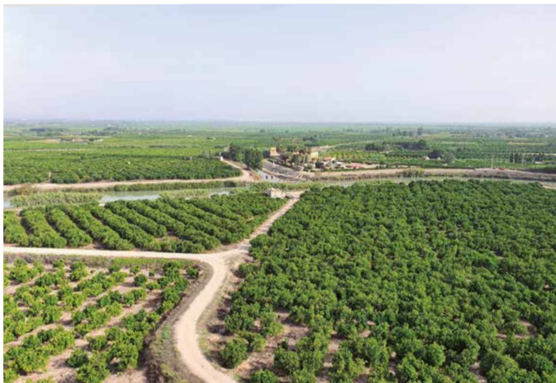
La huerta de Valencia, protagonista de las comarcas metropolitanas.