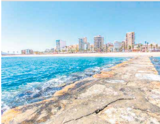
Vista de la platja de Vinaròs

Pel que fa a les dades més concretes, els apartaments han aconseguit una ocupació del 95%, els hotels un 93% i els càmpings han arribat al ple absolut amb el 100%. A nivell general, l'ocupació durant aquest 2023 durant els mesos de juliol i agost s'ha situat al 91%. En relació a l'origen dels visitants durant