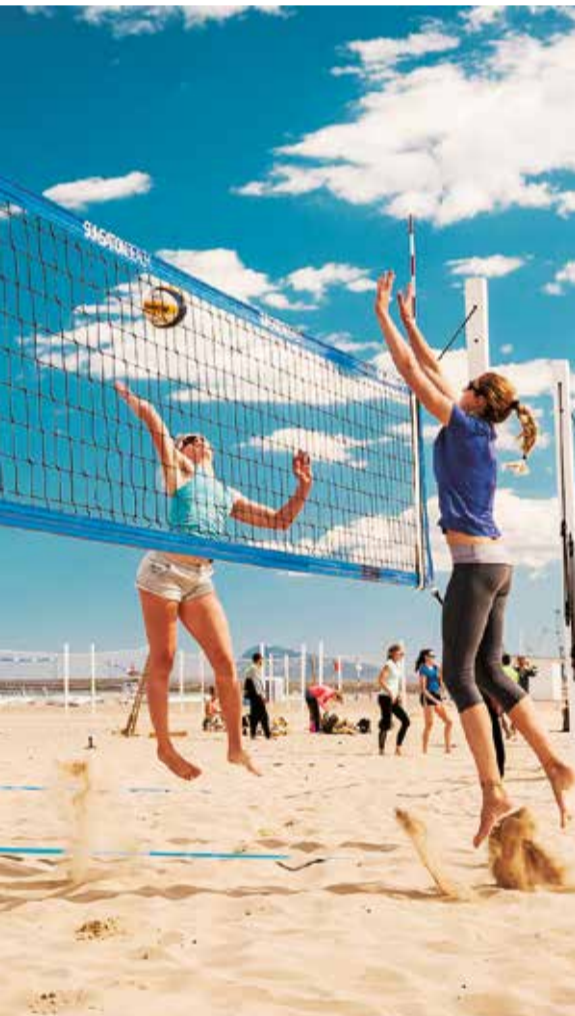
de Gandia, en la comarca de la Safor.