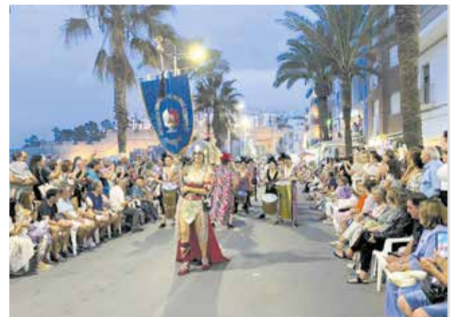
Varios momentos de la entrada de Moros y Cristianos de Peñíscola.