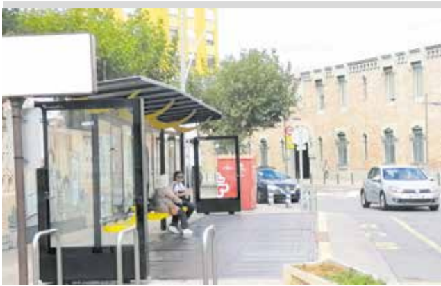
Fotografia d'una de les noves parades.