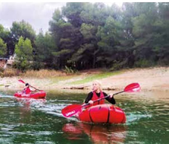
comarcas del Alto Palancia y Mijares.

► RUTA 99. Atraviesa pueblos de menos de 100 habitantes de Palancia-Mijares.