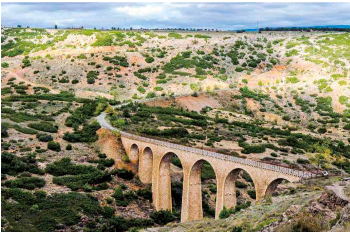
Un tramo del recorrido de la Vía Verde Ojos Negros, que une Teruel con Sagunt.

a pesar de que necesita una renovación. Es la comodidad de tener una ruta de este tipo cerca de casa y poder practicar deporte de una forma segura.