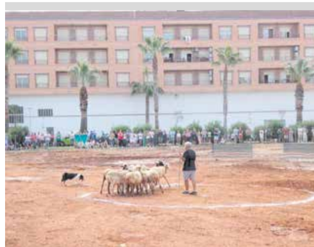
Un dels actes de la fira.

Precisament, l'espai més visitant ha sigut el Racó del Llaurador on s'ha instal·lat un museu itinerant dedicat a la Clemenules amb una exposició de fotografies antigues re-