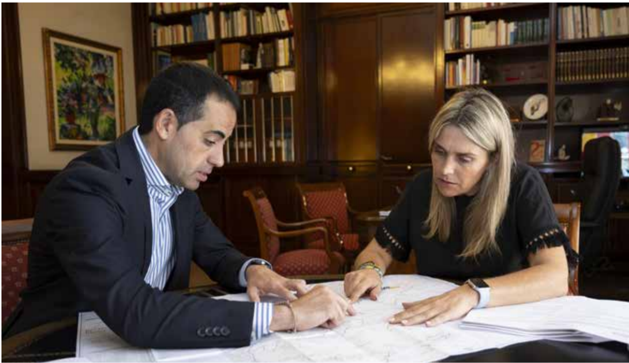
La presidenta de la Diputación de Castellón, Barrachina, junto con el vicepresidente Héctor Folgado.