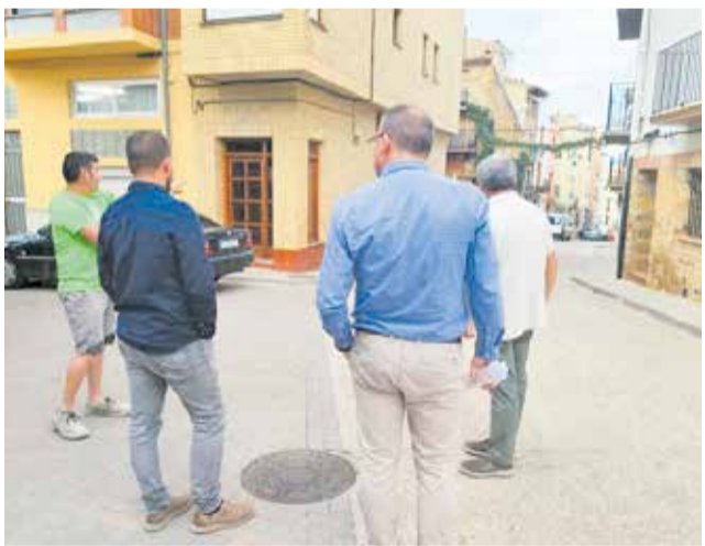
Reunió de supervisió de les obres.

Les obres que es duran a terme consistiran en la substitució de les xarxes de sanejament d'aigües que venen de les cases així com les d'aigua