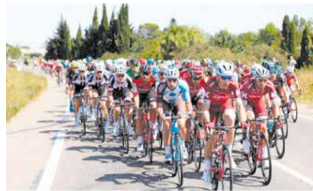
Imatge d'arxiu de la Volta Ciclista a Espanya