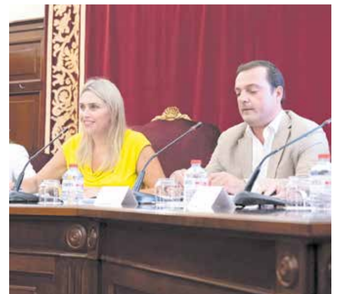
La presidenta, Marta Barrachina.

en cuenta indicadores de población y actividad turística, la distribución de la aportación de la Diputación va desde los 14.400 euros que corresponden a pueblos como Villahermosa del Río, Altura, Segorbe, Cinctorres, Forcall, Onda y Benassal, hasta los 193.810,38 euros de Peñíscola. Además desde la Diputación, también saldrán líneas de subvenciones para todos aquellos municipios que no cuentan con la Declaración de Municipio Turístico