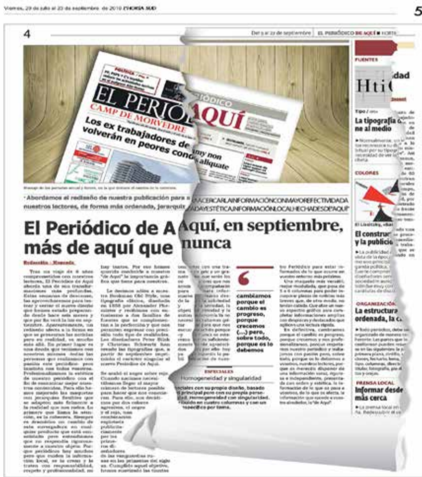
En julio de 2016 El Periódico de Aquí anunció el rediseño.