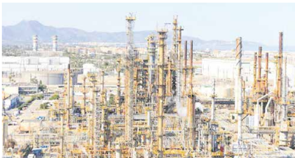
La refinería BP en Castellón.

La intención de esta nueva infraestructura es conectar el puerto con el corredor mediterráneo. Con una inversión total de más de 335 millones de euros, esta obra arranca-