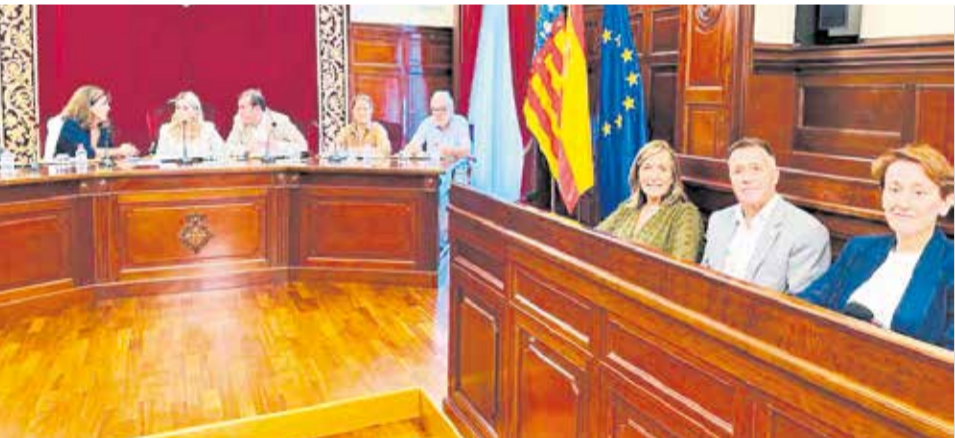
Ple de l'ajuntament d'Alcalà-Alcossebre.