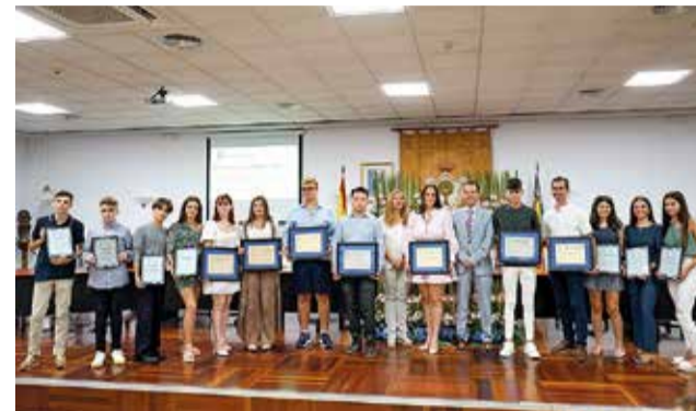
Els guanyadors i finalistes.

Amb el Premi a l'Excel·lència, segons les bases, "es reconeix els alumnes que han destacat per l'excel·lència i el rendiment dels seus resultats acadèmics en l'etapa d'Educació Secundària Obligatoria, Batxillerat