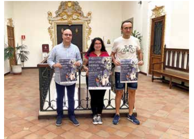
Presentació del cartell de la carrera de Halloween. / EPDA

El preu del dorsal és de 2 euros i es podrà adquirir en diferents comerços de la ciutat com ara Celia Fons (c/ Major de Santa Caterina), Tintoreria Camarena (c/ Auxili) o Sierra Street Style (c/