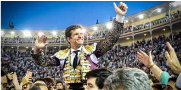
El Juli, en su última puerta grande en Madrid.