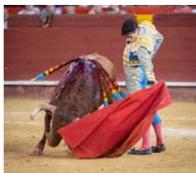
Talavante lidió cuatro toros.

www Nek Romero, la gran esperanza de la novillería valenciana, dejó sus mejores momentos ante el buen tercero, al que cortó una oreja que pudieron ser dos de no mediar un pinchazo previo. Con el sexto, un marmolillo, no tuvo la más mínima opción de lucimiento.