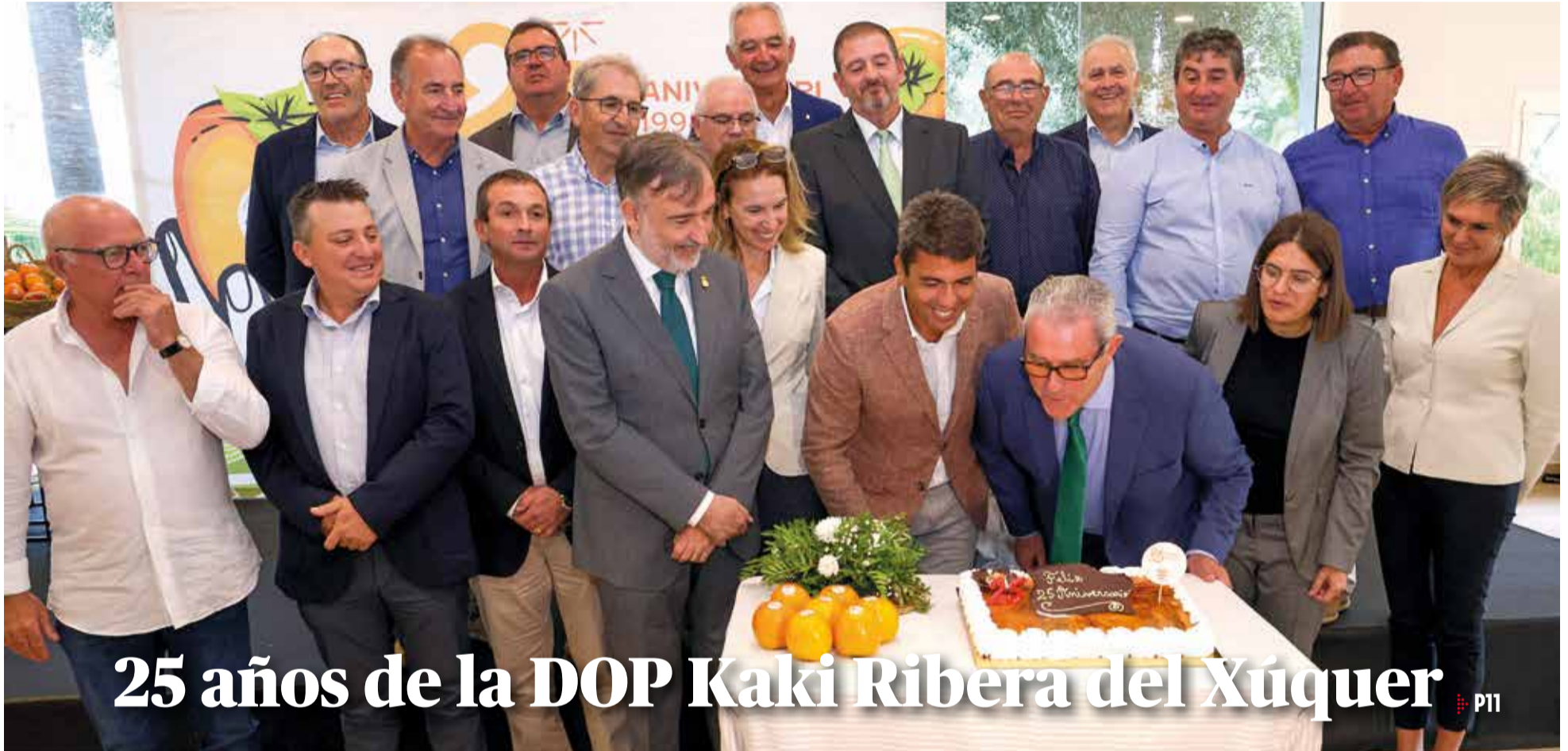
25 años de la DOP Kaki Ribera del Xúquer P11