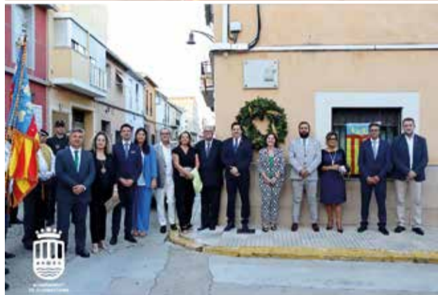
Celebració del 9 d'Octubre a Guadassuar.