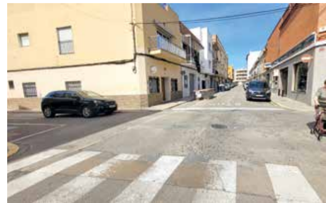
Zona nord de l'Alcúdia.