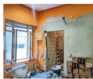
Part de les obres. / EPDA