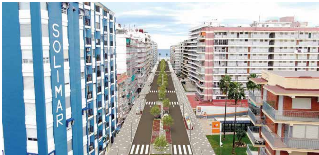
Les obres del carrer Caminàs de Cullera fins al passeig marítim.