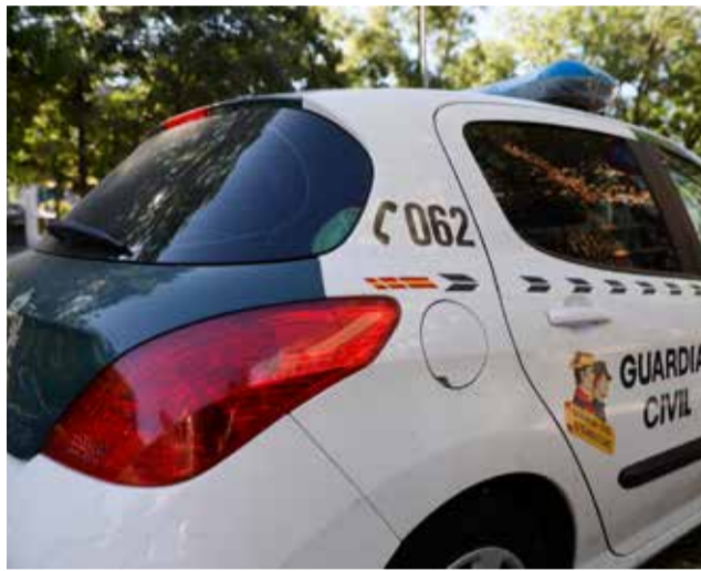
Coche de la Guardia Civil.

Los guardias civiles corroboraron que la menor residía en Valencia hasta finales del año pasado y que, tras haber sido con-