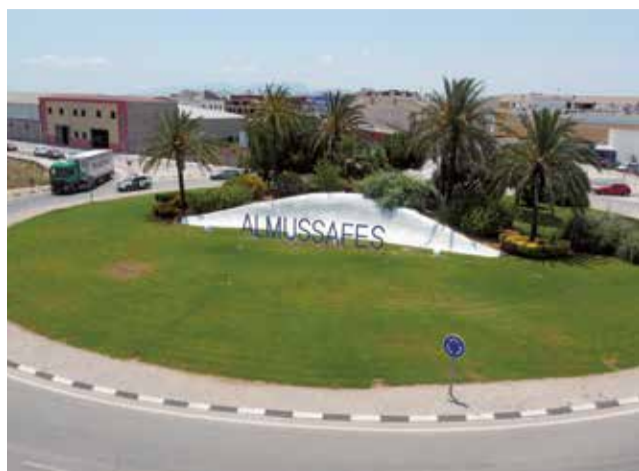
Entrada Almuñafes. / EPDA