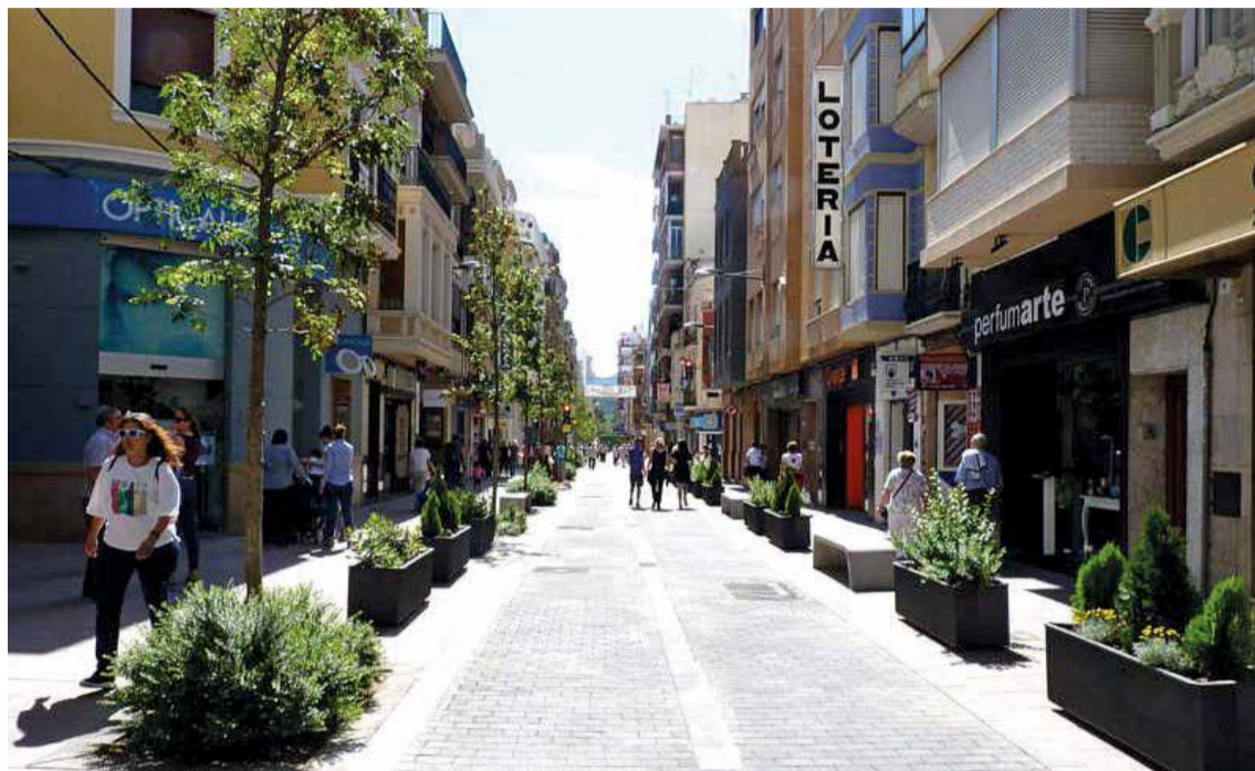
Calle Benito Pérez Galdós de Alzira.

La Comunitat Valenciana, es conocida por su rica cultura, su impresionante arquitectura y su deliciosa gastronomía. Pero también es un destino de compras excepcional, con calles comerciales que combinan la tradición con la modernidad, ofreciendo una experiencia única para los amantes de las compras. En este reportaje, exploraremos algunas de las calles comerciales más destacadas de la Comunitat Valenciana en concreto de sus comarcas y descubriremos lo que las hace tan especiales.