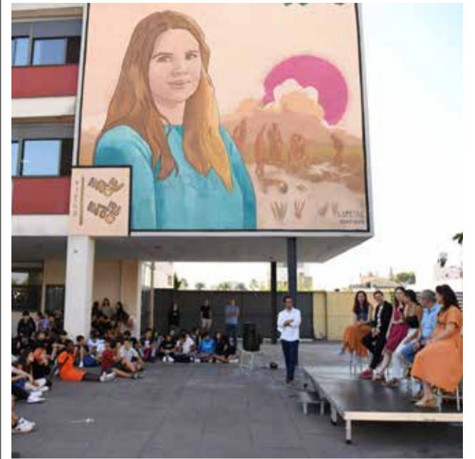
Mural a l'IES Sucro d'Albat. / EPDA