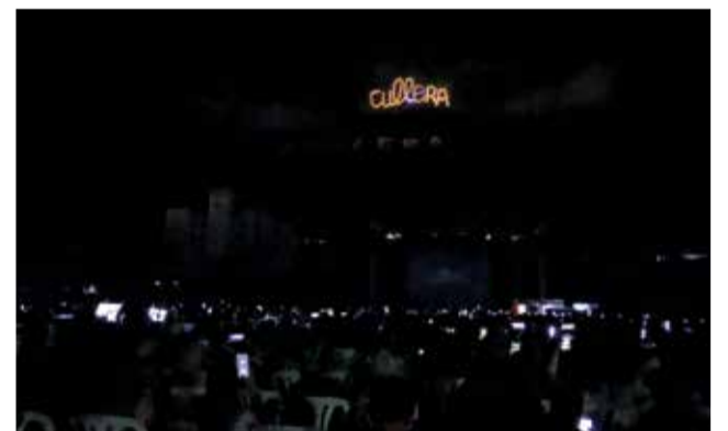
Diferents moments durant la commemoració dels 50 anys de les lletres de la muntanya de Cullera.

constantment, donant pas al dinamisme entre l'espectacle i el públic.