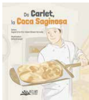
Portada llibre.