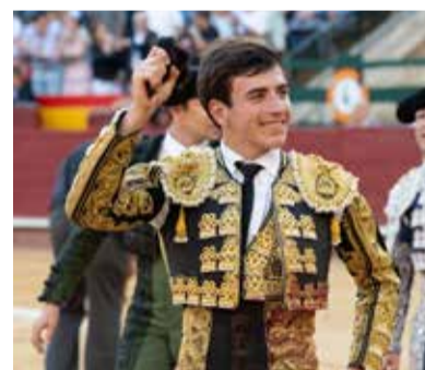
Nek, la gran esperanza valenciana.