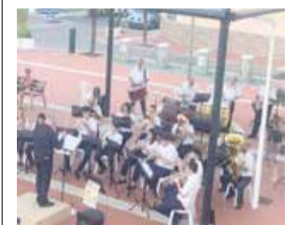
Actuación en Beniflà.