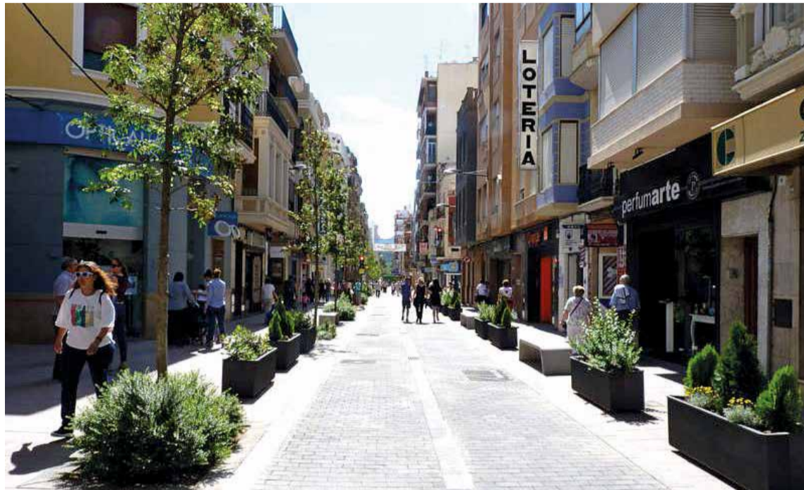
Calle Benito Pérez Galdós de Alzira.

La Comunitat Valenciana es conocida por su rica cultura, su impresionante arquitectura y su deliciosa gastronomía. Pero también es un destino de compras excepcional, con calles comerciales que combinan la tradición con la modernidad, ofreciendo una experiencia única para los amantes de las compras. En este reportaje, exploraremos algunas de las calles comerciales más destacadas de la Comunitat Valenciana en concreto de sus comarcas y descubriremos lo que las hace tan especiales.