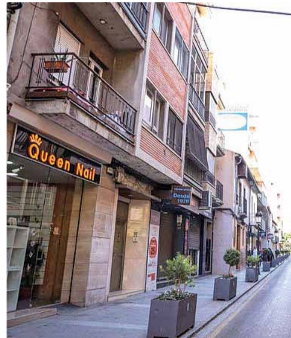
Calle Mayor de Paterna.