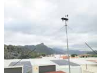
Estació meteorològica.