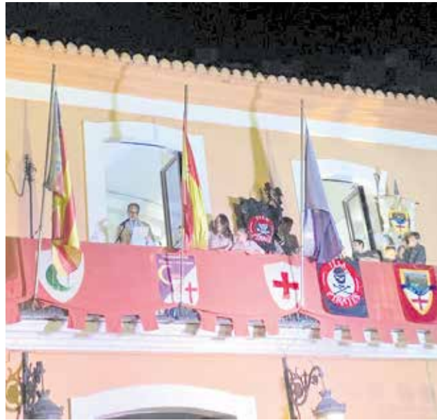
Pregó de Moros i Cristians 2022 de Villalonga.

El diumenge 8 es podarà fi a la programació de Moros i