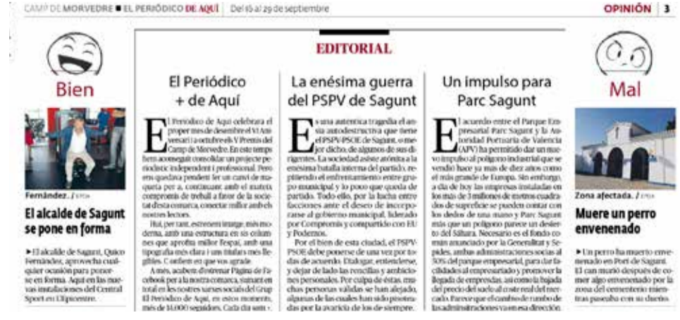
Editorial publicado el 16 de septiembre de 2016. / EPDA

fer un canvi de maquera per a, continuant amb el mateix compromís de treball a favor de la societat d'esta comarca, conectar millor amb els nostres lectors. Hui, per tant, estremem imatge, més moderna, amb una estructura en sis columnes que aprofita millor l'espai, amb una tipografia més clara i uns titulars més llegibles. Confiam en que vos agrade".