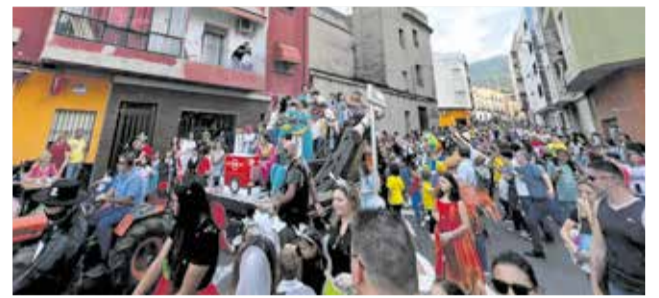
Actes de les festes d'octubre de Villalonga 2022.

de focs d'artifici, orquestra i macrodiscomòbil.