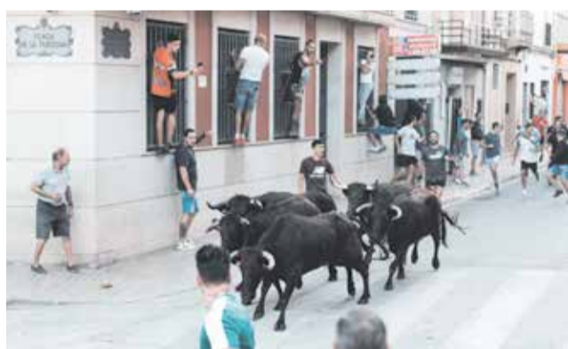
Encierro de vaquillas matinal del día 9.