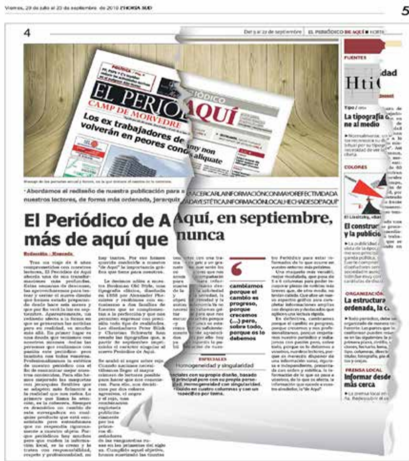
En julio de 2016 El Periódico de Aquí anunció el rediseño.