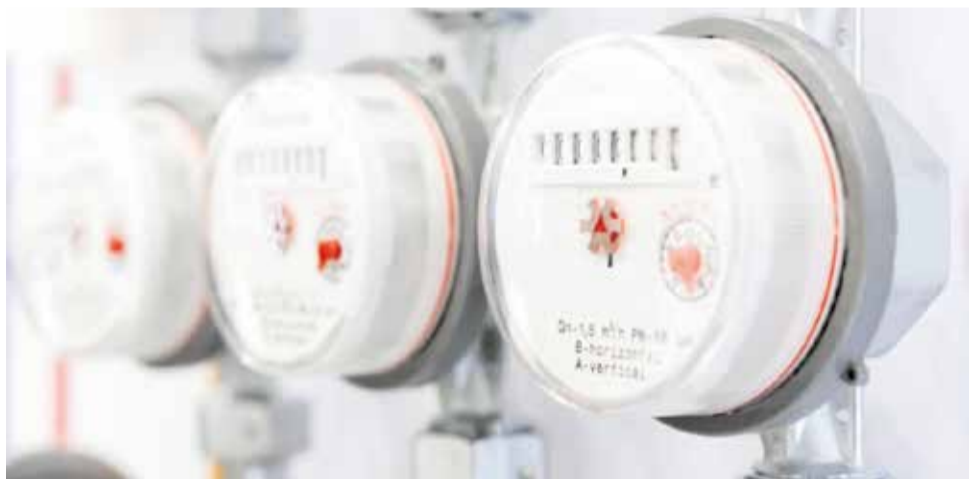
Comptadors de telelectura d'aigua potable. / EPDA