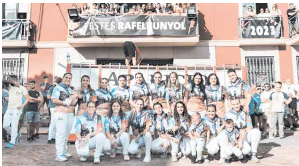
Las integrantes de Centre 2023.