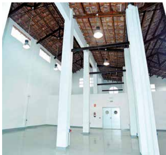
Antiguo matadero municipal de Sagunt.

Las actuaciones en las cuatro aulas, proyecto impulsado por el departamento de Promoción Económica e Industrial, comprenden las obras necesarias para su construcción (tabiquería, suelos, techos, aca-