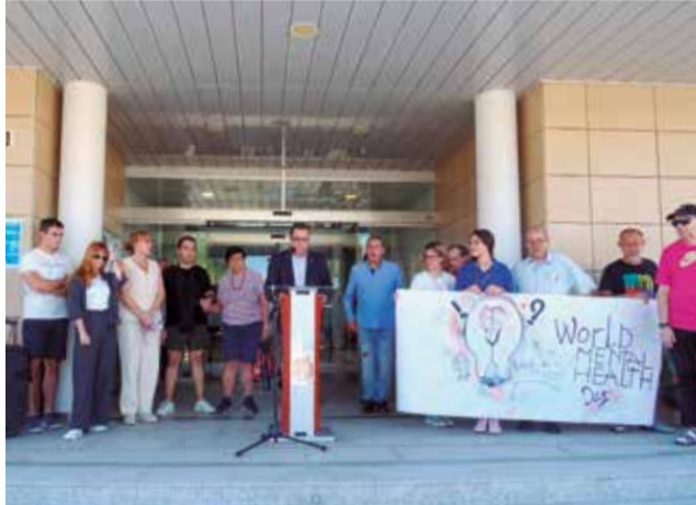
Un instant de la lectura del manifest.