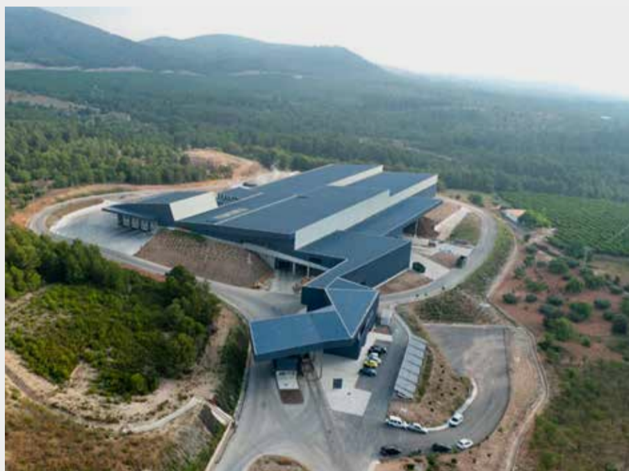
Vista de la planta de reciclaje de Algímia d'Alfara.