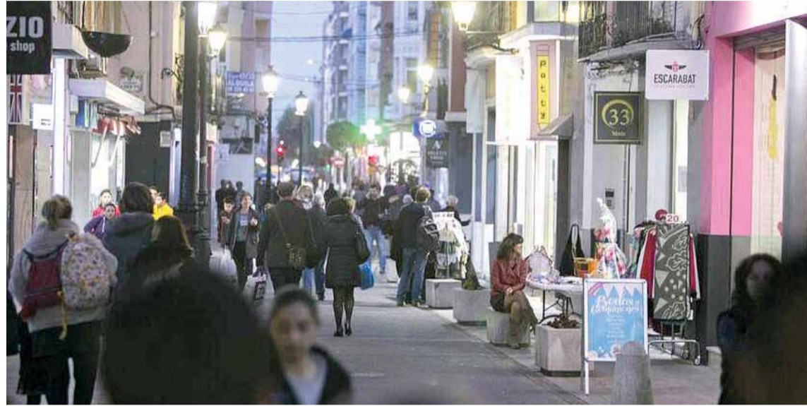
Calle Sant Pasqual de Gandia.