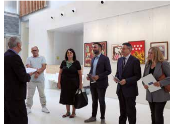
Inauguració de l'exposició.