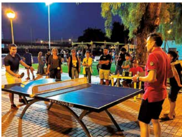
El dia de la inauguració.

Antoni va recordar que el projecte és fruit de "el nostre compromís amb les polítiques públiques de joventut, amb les quals volem donar resposta a les necessitats i reivindicacions dels nostres i les nostres joves". Un alcalde que va tendir la mà