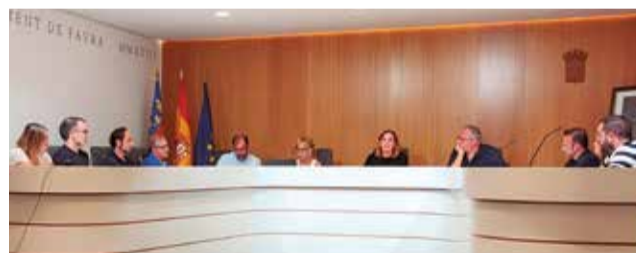
Ple de setembre de l'Ajuntament de Faura.

El Ple de l'Ajuntament de Faura ha aprovat per unanimitat el Compte General corresponent a l'exercici 2022, un informe que realitza la secretària sobre la comptabilitat de l'any anterior quan ja s'ha tancat l'exercici. El procediment s'inicia amb la reu-