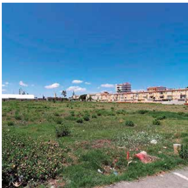
Inmediaciones del Malecón.

El Ayuntamiento también solicitará, como se ha acordado, al Ministerio para la Transición Ecológica y el Reto Demográfico iniciar el expediente de caducidad de la concesión dada por Real Orden el 11 de agosto de 1902 por incumplimiento de las cláusulas concesionales desde el año 1987 y una reunión de la alcaldía y grupos, con el citado Ministerio «para solucionar, con arreglo a la Ley de Costas y la Constitución Española, el interés general