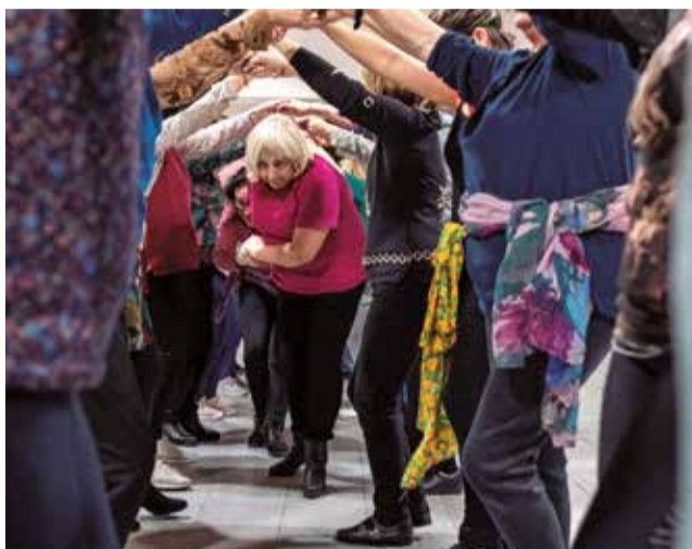
Una de les activitats organitzades per Hort Art.

LA DANSA COM A PERCEPCIÓ, CREACIÓ I VIVÈNCIA DE L'ENTORN VERTEBRA EL PROJECTE