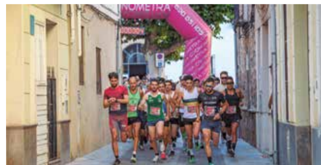
Moments de la carrera a Algar.