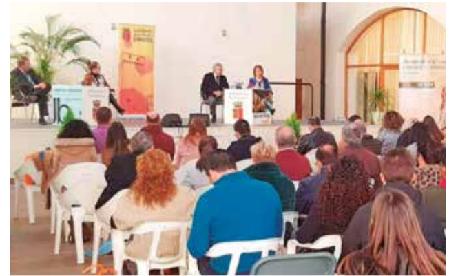
Un instante de las jornadas del año pasado.

Este año, el evento adquiere un interés adicional, ya que se llevaron a cabo recientemente elecciones municipales, lo que ha dado lugar a la constitución de numerosos gobiernos municipales nuevos. Las jornadas brindarán la oportunidad de compartir experiencias tan-