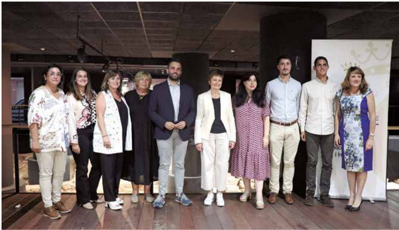
Autoridades municipales, rectora de la UV y exdirectora del Museo Arqueológico de Sagunt, entre otros.