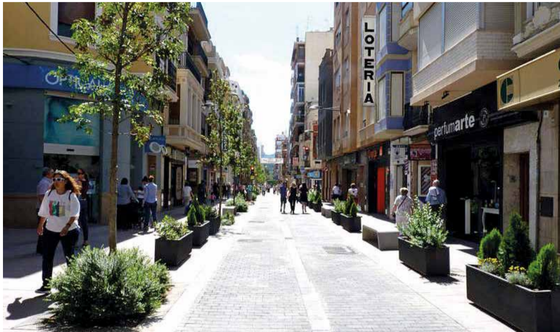
Calle Benito Pérez Galdós de Alzira.

La capital de l'Horta Sud, Torrent, es un gran centro comercial al aire libre. Sus calles están llenas de comercios que ofrecen una variada oferta de productos y servicios y cuenta con una asociación de comerciantes potente. No obstante, el eje de vertebración es la avenida al Vedat donde se puede disfrutar de un buen paseo mirando escaparates de todo tipo, por ello no es ex-