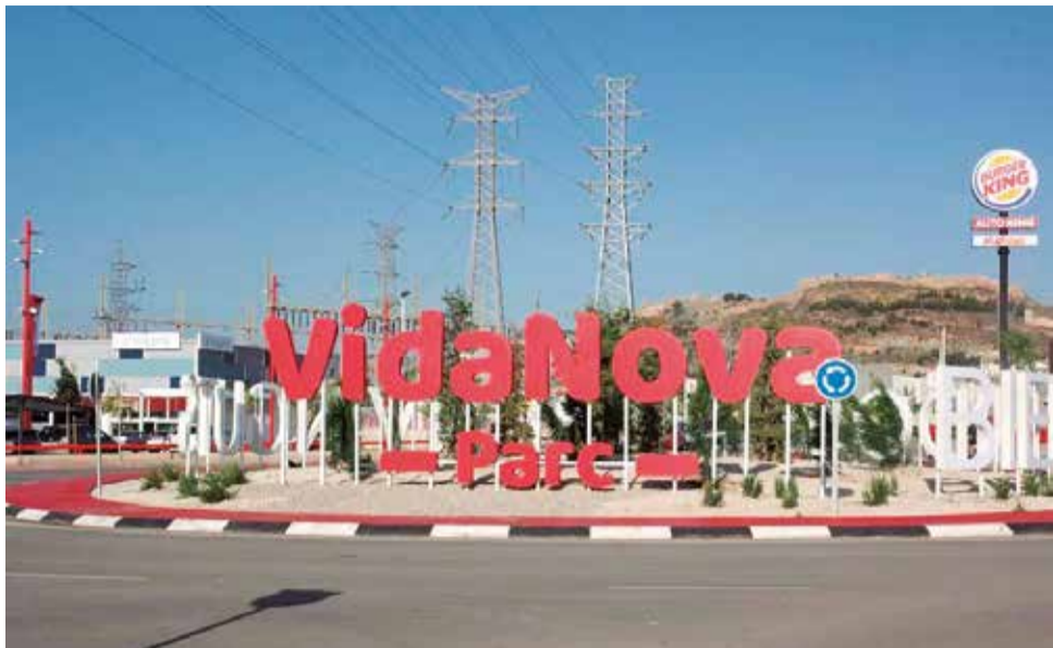
Entrada al centro comercial Vidanova Parc.