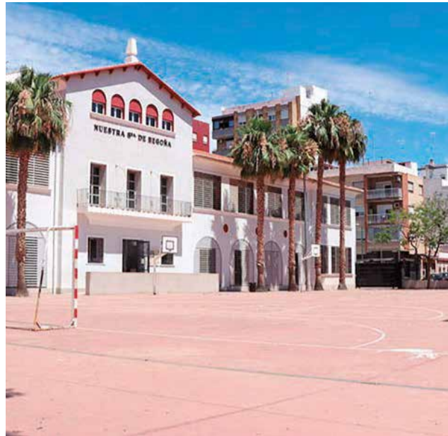
Un centro de Sagunt.

El objetivo de este proyecto es la creación de una red de control de calidad del aire en áreas cercanas a los centros educativos de la ciudad. Para lograrlo, se instalarán sensores diseñados específicamente para medir diversos contaminantes atmosféricos, incluyendo NO 2 , SO 2 , CO, O 3 , PM 10 , PM 2.5 y PM 1 , así como datos meteorológicos co-