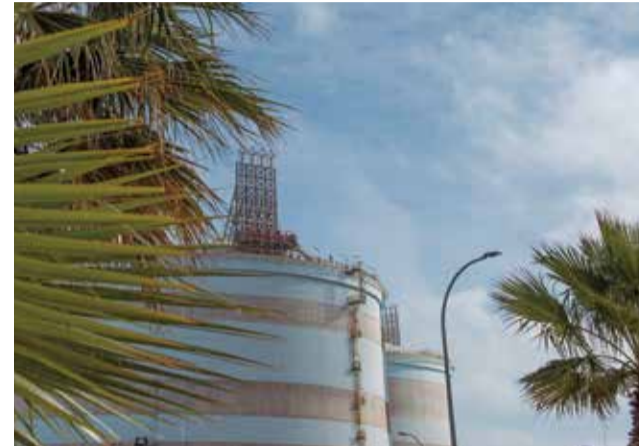
Instalaciones de Saggas, en el Port de Sagunt.

Con este proyecto, Saggas busca compensar la huella de carbono generada en 2021, alrededor de 500 tCO 2 e. Estas toneladas contemplan la totalidad de la huella de carbono de la planta en su alcance 1 y parte del alcance 3, que incluye los traslados de sus empleados desde sus casas hasta el trabajo, así como los desplazamientos del personal de Saggas por motivos laborales. Este proyecto, que ha sido registrado en la Oficina Española de Cambio Climático, ha permitido a la empresa obtener el sello Calculo, Reduzco y Compenso.