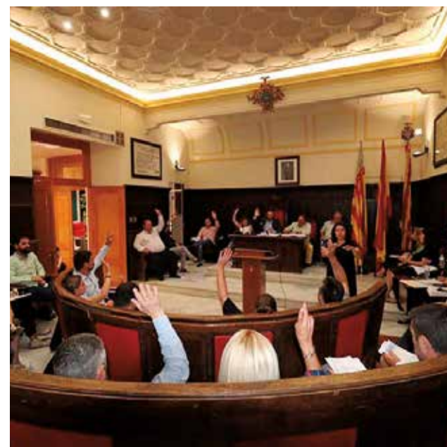
Votación en el pleno municipal del Ayuntamiento.

en la sentencia de la Audiencia Provincial de Valencia de 22 de diciembre del 2010 en la que declara la propiedad privada de esos terrenos en base a la concesión dada por R.O. de 11 de agosto de 1902, previa a la Ley de Costas de 1988 cuya Disposición Transitoria Segunda le es aplicable». Además, recoge que esta Disposición establece que esos terrenos mantendrán la situación jurídica otorgada por el título concesional, que es la ley de cada concesión, como estable-