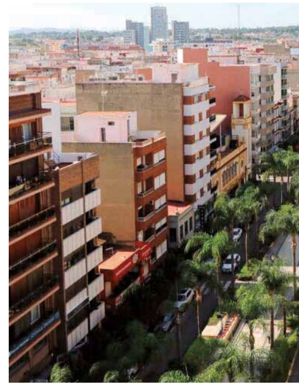
Avenida al Vedat de Torrent.