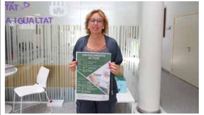
La regidora amb el cartell.