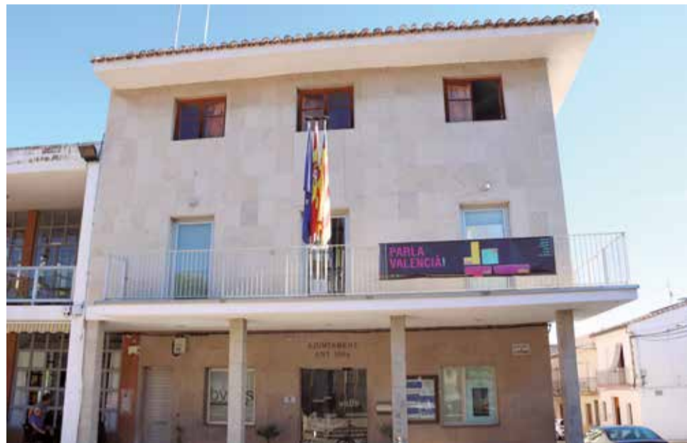
Façana de l'ajuntament de Benifairó de les Valls.

El procediment busca la participació ciutadana d'igual forma que l'anterior, en el qual es va realitzar una enquesta a la ciutadania per analitzar la normativa municipal, l'estructura organitzativa, els plans i els projectes existents.