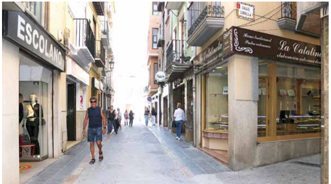
Calle Julio Cervera de Segorbe.

Esta es una de las mejores zonas conectadas con la población y las tiendas. Quien visite Alzira no puede olvidarse de pasar por la calle Benito Pérez Galdós, emblema del comercio en la capital.