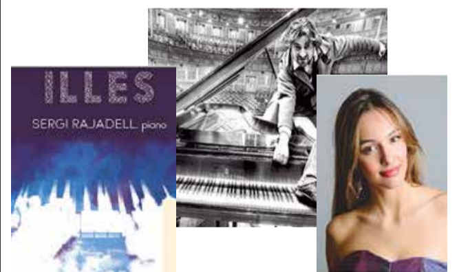
Carteles de los tres conciertos.