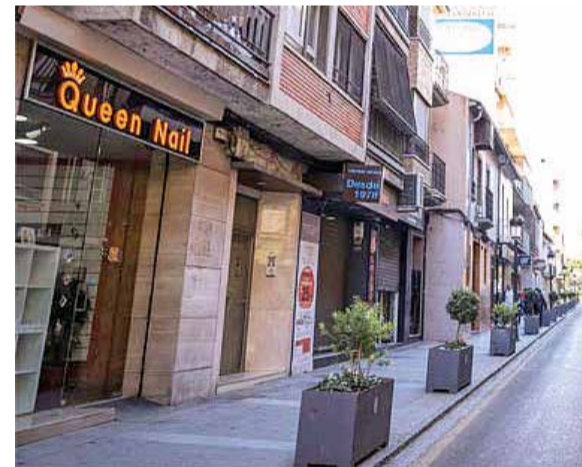
Calle Mayor de Paterna.

traño que sea una de las ubicaciones más demandadas para establecer un negocio. También, en esta amplia calle se sitúan las grandes marcas de moda y zapaterías de fabricantes nacionales. No está mal tampoco probar los dulces de las pastelerías y panaderías que se ubican en este gran centro comercial abierto. Además, si se opta por ir en dirección a El Vedat, el visitante se topa con el centro comercial Las Américas, como epicentro de la oferta de alimentación y otros servicios.