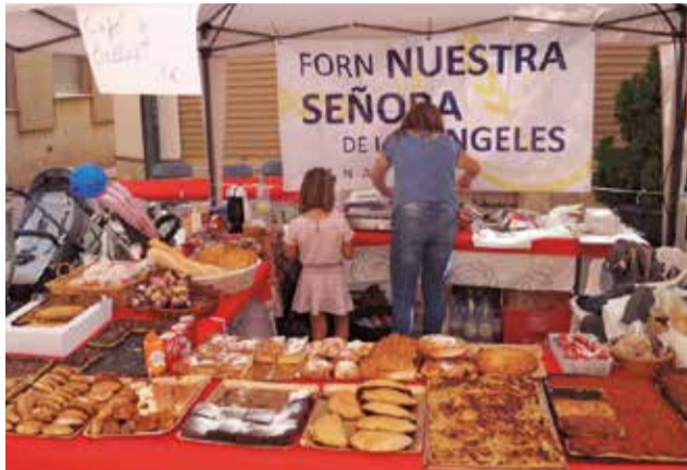
Un stand de la feria del año pasado.

Durante esta jornada, los participantes tendrán la oportunidad de presentar sus actividades y exhibir sus productos, ofreciendo a los visitantes una amplia variedad de opciones para descubrir y adquirir. La Feria es una apuesta firme del Ayuntamiento para impulsar la economía local. En esa línea, el Consistorio prepara una serie de actividades pa-