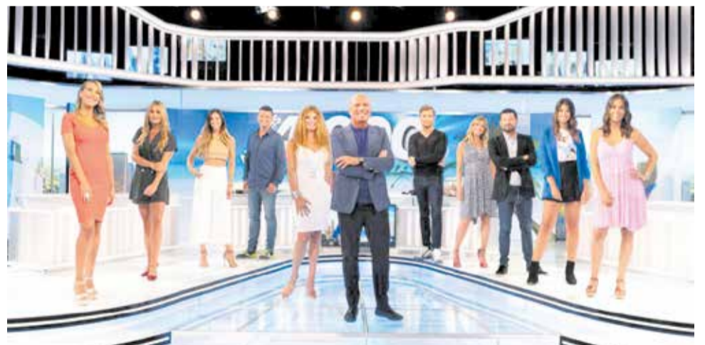
Alfonso Arús y su equipazo de Aruseros.

También, Fati Pizarro y Vicent Landete estarán en la retransmisión previa a la gala, en la alfombra roja entrevistando a galardonados e invitados del universo de la televisión.