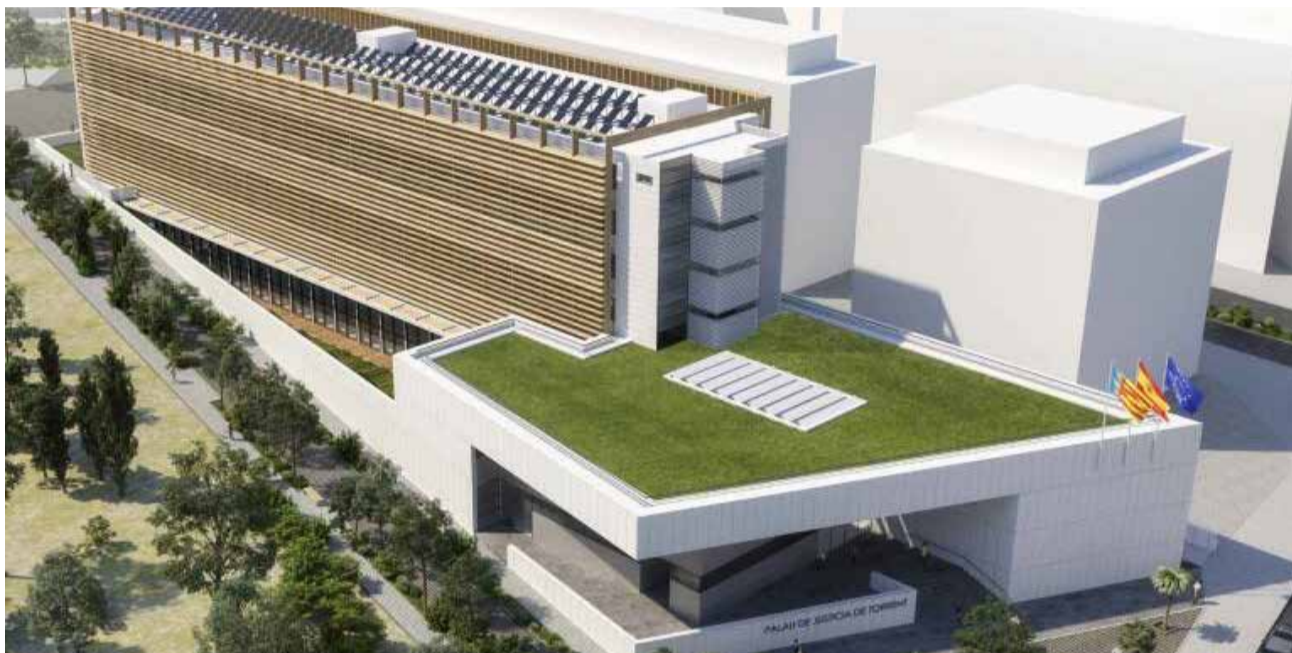
La recreación del futuro palacio de justicia de Torrent.

Los centros educativos que sufrirán las consecuencias son los colegios públicos Gregorio Mayans, Almassil y El Cid, el instituto IES Molí del Sol y la Escuela de Adultos, que se quedarán sin rehabilitar. Ante esta situación, el alcalde, ha anunciado que "acudiremos a los tribunales y donde haga falta, junto a los