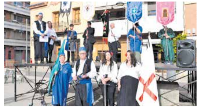
El traspàs de les capitànies.