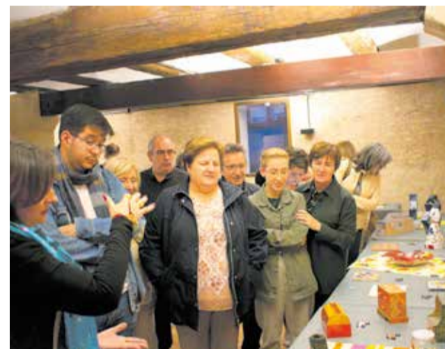
Los visitantes en la muestra 'Ecléctica'.

pletan y enriquecen la oferta cultural anual que sirve de herramienta para la promoción tanto de nuestro Centro Cultural, que ya de por sí es único, como de Alfafar".