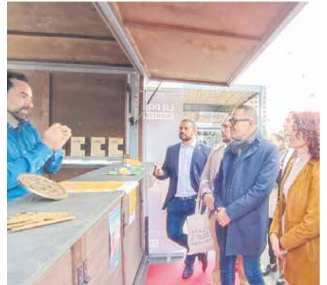
Uno de los stands del recinto.