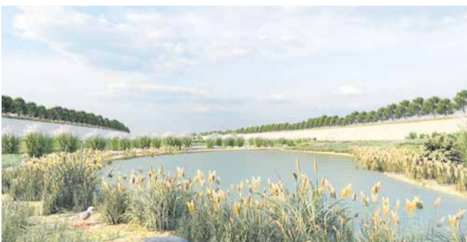
La vegetación actuará como un filtro verde.

en estas zonas para que actúen con filtros verdes naturales.