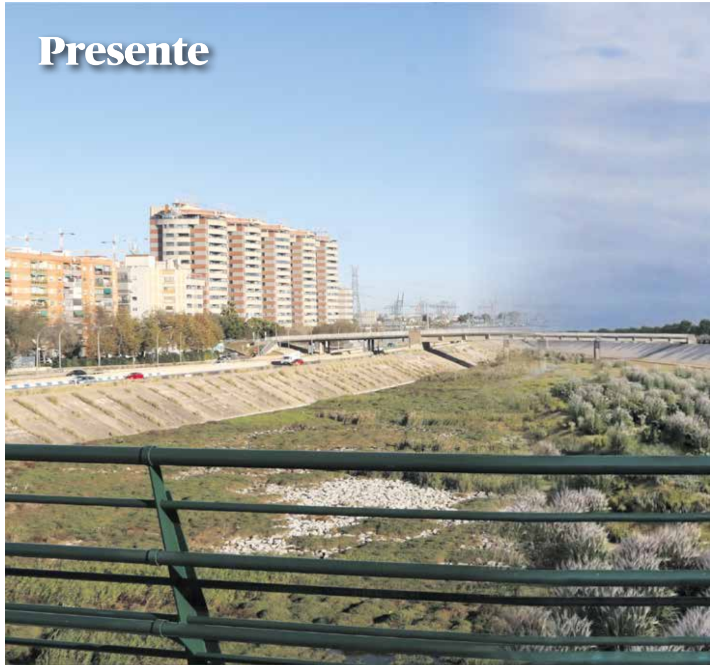
La parte izquierda de la foto es la imagen actual del cauce, y la parte derecha es una infografía tras la renaturalización.

Por su parte, la delegada del Gobierno en la Comunidad Valenciana, Pilar Bernabé, subrayó la "apuesta decidida" del Gobierno de España en el impulso de actuaciones dirigidas a recuperar los espacios naturales. "Debemos seguir ganando espacios verdes en nuestras