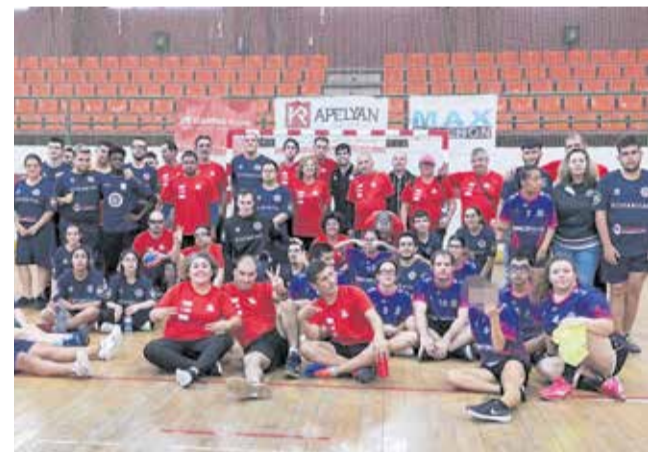
El equipo del Club Balonmano Mislata.

Son cinco los equipos de tres clubes distintos los que participan en la Liga de Balonmano Inclusivo de la Comunitat de Valencia, pionera en su clase en España. Durante la temporada 2023/2024 participarán BM Mislata CRE-AP, BM Mislata CO, EON HIS-