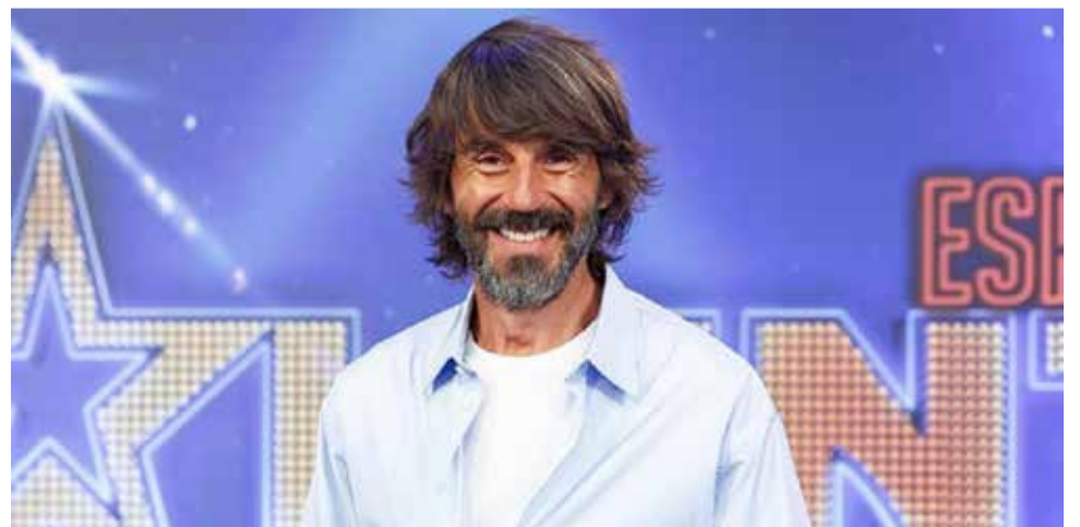
El presentador Santi Millán, que ha confirmado la asistencia.