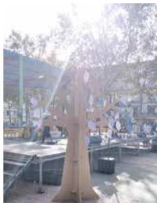
Un acto del año pasado.

Por otra parte, ya se han empezado a impartir diferentes talleres en los institutos de la comarca que versan sobre la violencia de género digital y la prevención de las violencias sexuales. El personal técnico