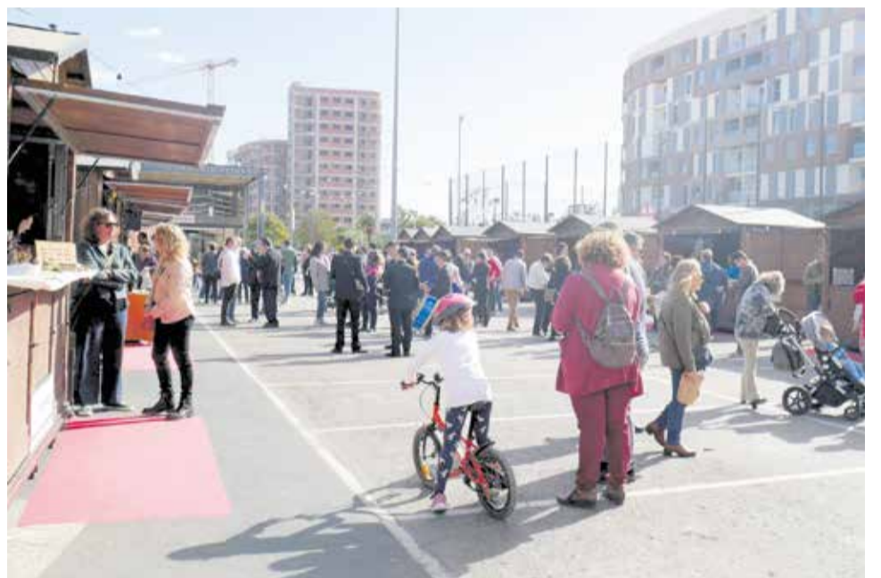
El ambiente que se respiró en el evento.

De hecho, tras la celebración de esta Fira de Turisme ya han sido diferentes poblaciones de la comarca las que se han ofrecido para albergar este evento en próximas ediciones, y los informadores y productores participantes están aportando ideas. Esta primera edición forma parte del Plan de Dinamización y Gobernanza Turística de l'Horta Sud financiado por Turisme Comunitat Valenciana, la Diputació y la Mancomunitat Intermunicipal de l'Horta Sud.