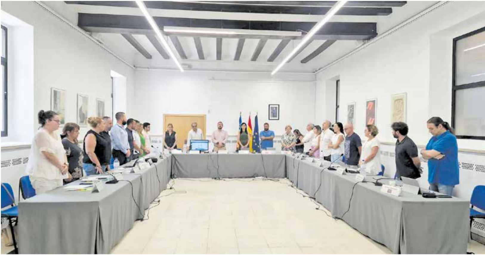
Los concejales durante un minuto de silencio en una sesión plenaria.

LA OPOSICIÓN VOTA EN CONTRA DE LAS MEDIDAS PROPUESTAS POR EL EQUIPO DE GOBIERNO (PSPV, COMPROMÍS Y PODEMOS)