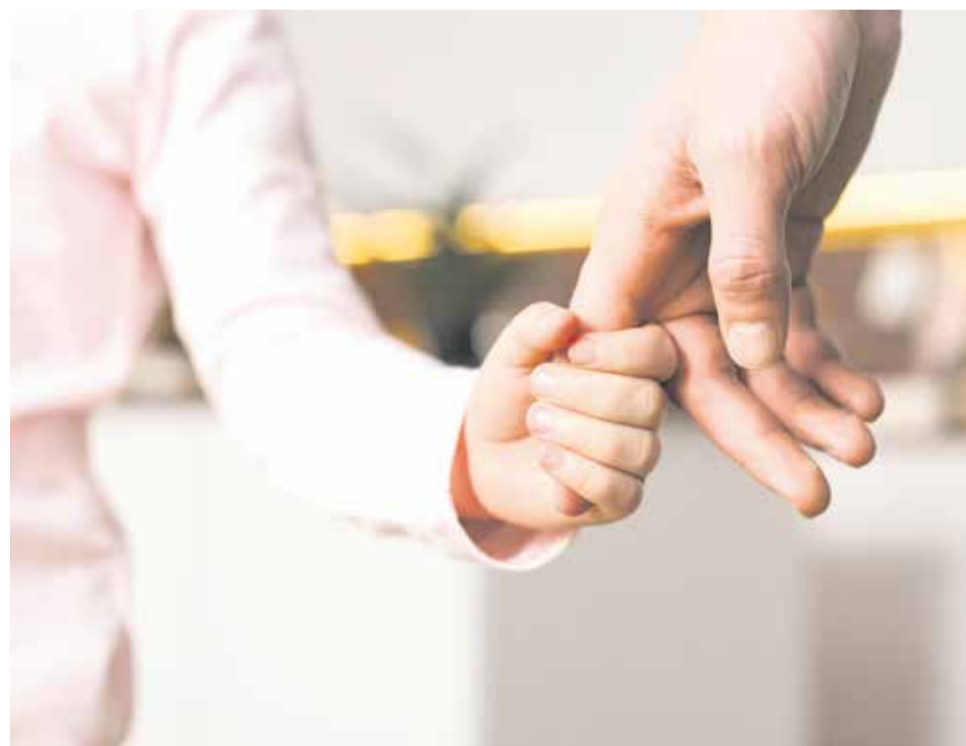
Una imagen representativa del curso.

Este curso, cuya duración es de ocho sesiones, trata una temática distinta en cada una de ellas. Comenzó el 30 de octubre y estará en marcha hasta el 18 de diciembre en el Centre Cultural l'Alqueria, en horario de 9:30 a 11 horas.