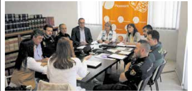
La reunió de la junta local de seguretat.