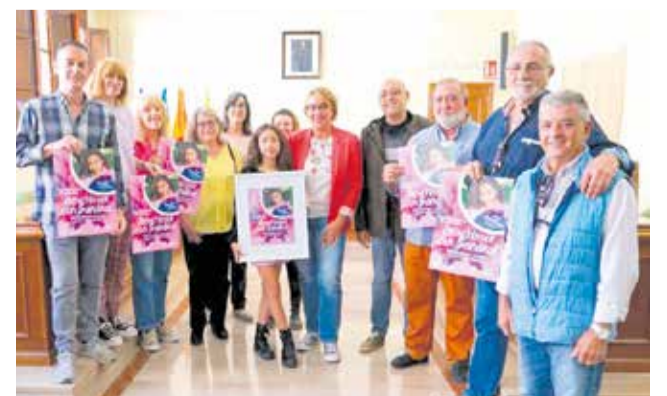
La corporación con la joven artista. / EPDA

hace un llamamiento a todos aquellos "eurofans" y ciudadanía en general a seguir conjuntamente el concurso todos juntos y mostrar el apoyo a la representante española en las redes sociales con las etiquetas #BenetússerConSandra y #BenetússerL'oviu.