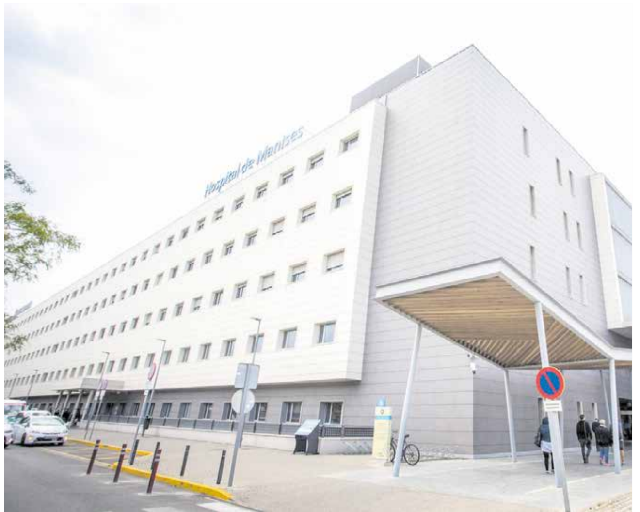
La fachada del Hospital de Manises.

Por ello, este nuevo circuito que ha implantado el Hospital de Manises busca aten-