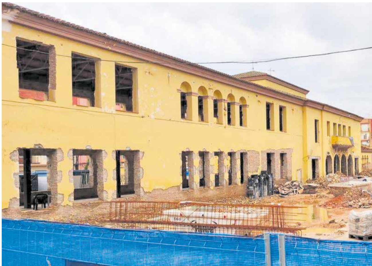
Las obras que se han retomado en la biblioteca municipal.

la obra que ahora se retoma de nuevo y que afronta su fase más importante", indican fuentes municipales. El proyecto supone crear una biblioteca de referencia desde un concepto más avanzado