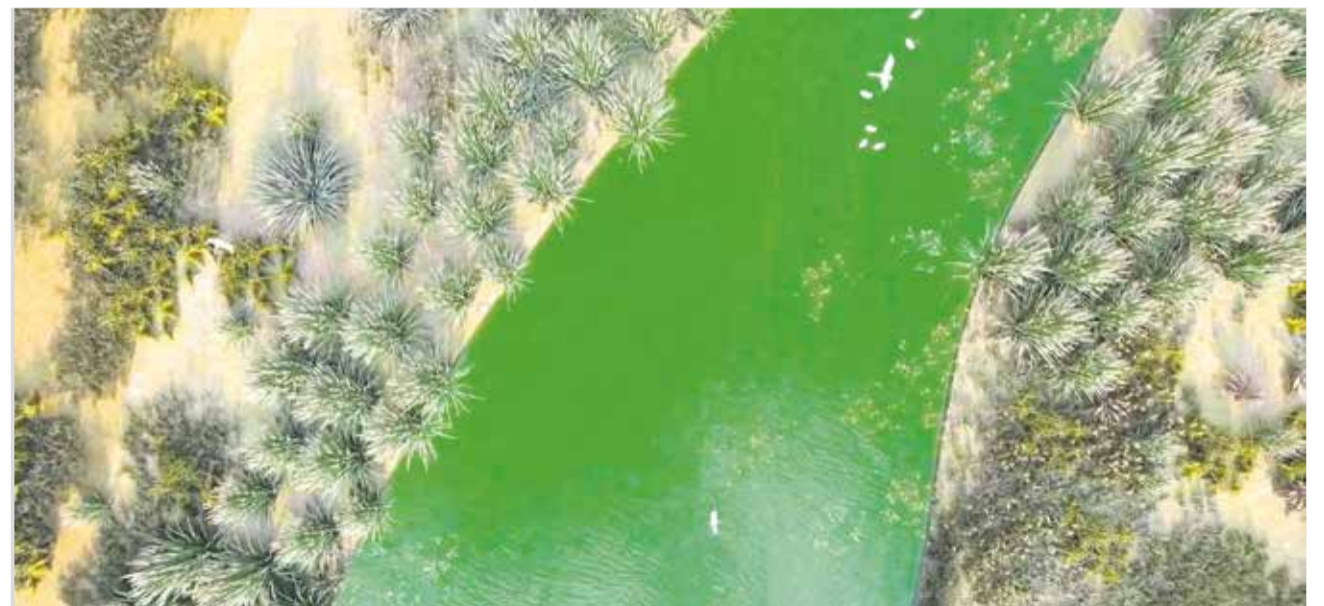
El cauce tendrá un caudal mínimo que permitirá recuperar la fauna autóctona.

ciudades. Conocemos las consecuencias del cambio climático y es muy importante que sigamos trabajando, desde todas las administraciones, en políticas que respeten la naturaleza", explicó.