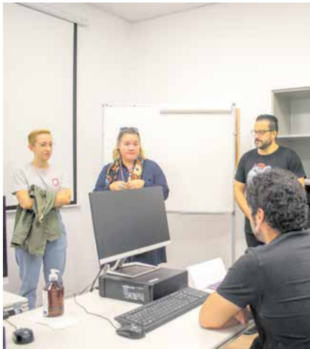
La concejala da la bienvenida a los nuevos trabajadores.

Además, "los docentes les ayudarán a desarrollar sus habilidades, a tomar conciencia de su potencial y es-