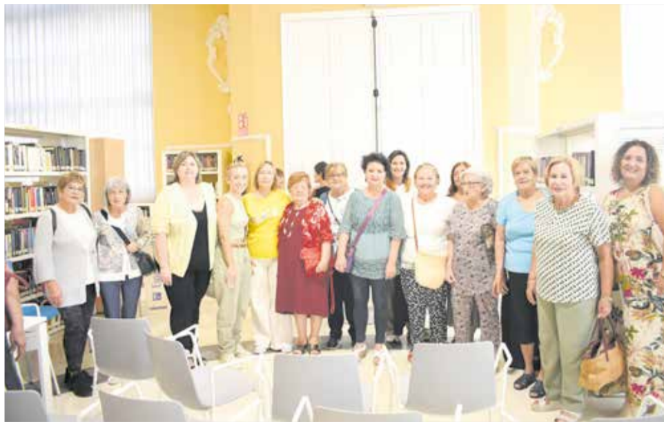
Las mujeres participantes en el Día de las Escritoras.