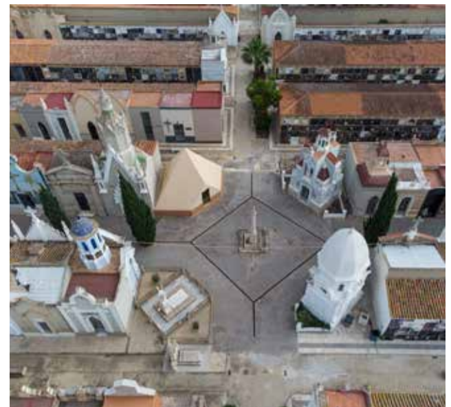
Vista aérea del cementerio de Catarroja.

perspectiva propia sobre el horror que supuso esta etapa funesta para la población civil. La ruta termina en el eje central del cementerio, donde está instalado el memorial. Un monumento hecho con una mezcla de arcilla y botánica, pero, especialmente, con el material más importante de todos: la convicción de reparar el recuerdo de aquellas personas asesinadas de forma inhumana e injusta.