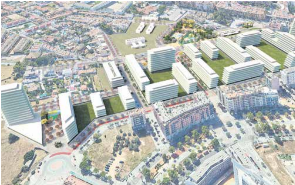
El futuro desarrollo de Parc Central III en Torrent.

verde al acceso norte de Mislata, pendiente desde hace más de dos décadas. La Generalitat licitó la redacción de un nuevo proyecto hace unos pocos meses para sustituir el anterior que databa de 2002, por el impacto sobre la huerta de Campanar.