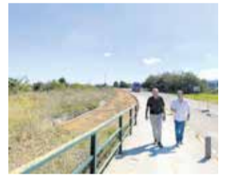
El recorrido de la ruta.