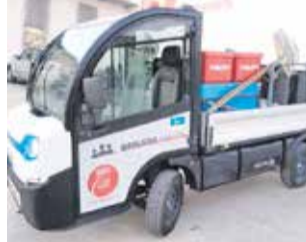
La nova unitat.