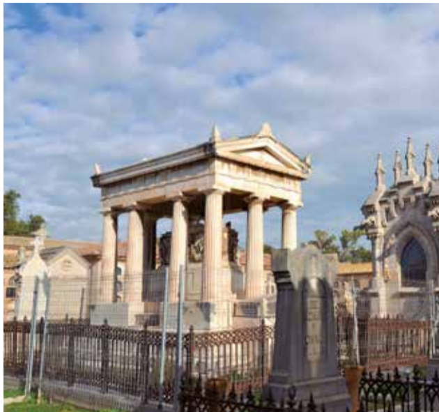
Cementerio General de Valencia.