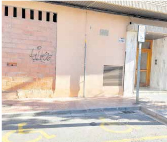
Una plaça d'aparcament amb sensors.

El sistema d'Smart City incideix en la millora i eficiència dels serveis bàsics que s'ofereixen al municipi mitjançant l'obtenció de dades per a millorar la presa de decisions, governança i, en general, la qualitat de vida de la ciutadania a través de diversos sistemes de gestió intel·ligent: del servei de recollida i transport de residus sòlids urbans, del reg en parcs i jardins, del monitoratge d'estacions meteorològiques, del control de les places d'aparcament per a persones amb mobilitat reduïda i de càrrega-descàrrega, de l'enllumenat públic i del sistema d'informació geogràfica GIS. Tot això confluirà en una sala de control, on a través de la instal·lació d'uns sistemes de monitoratge es