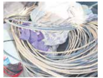
El material robado. / EPDA