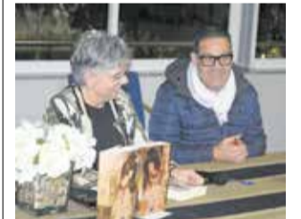
L'autora y l'alcalde. / EPDA