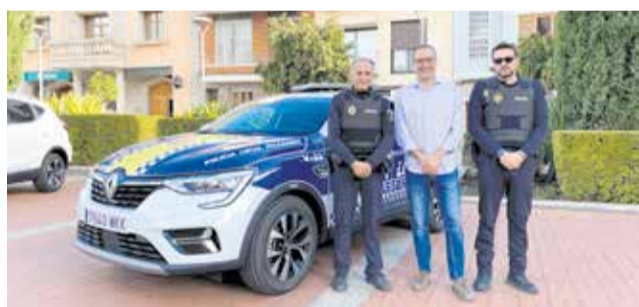
Els dos nous vehicles per a la Policia Local.