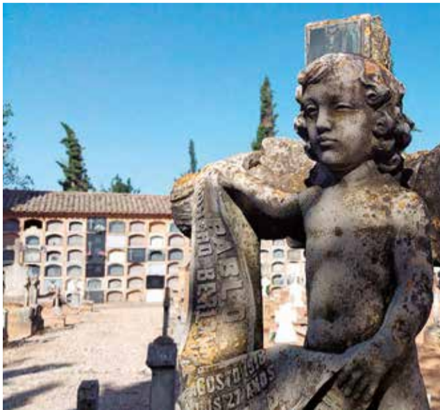
Cementerio de Requena.