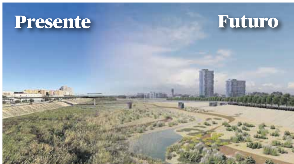
El paisaje que presentará el cauce, como está ahora y después.