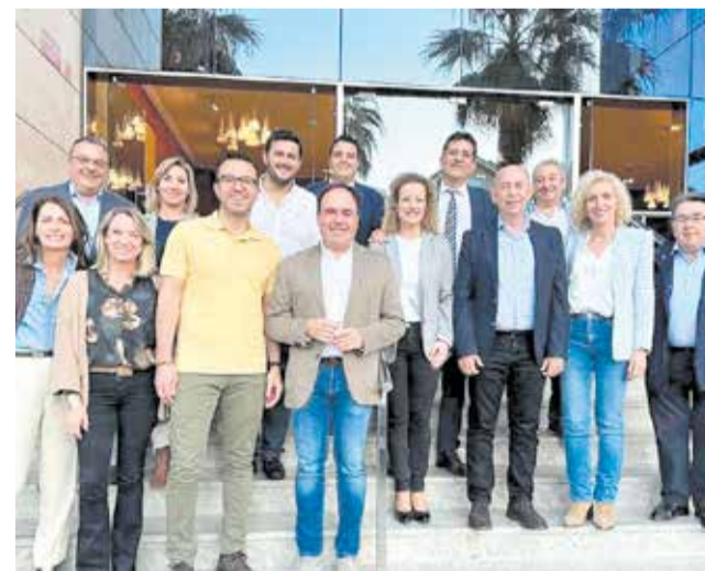
Los alcaldes populares de la provincia.

El cónclave también sirvió para tender la mano a posibles proyectos, eventos culturales y programas sociales comunes que puedan favorecer a atraer parte de esas inver-