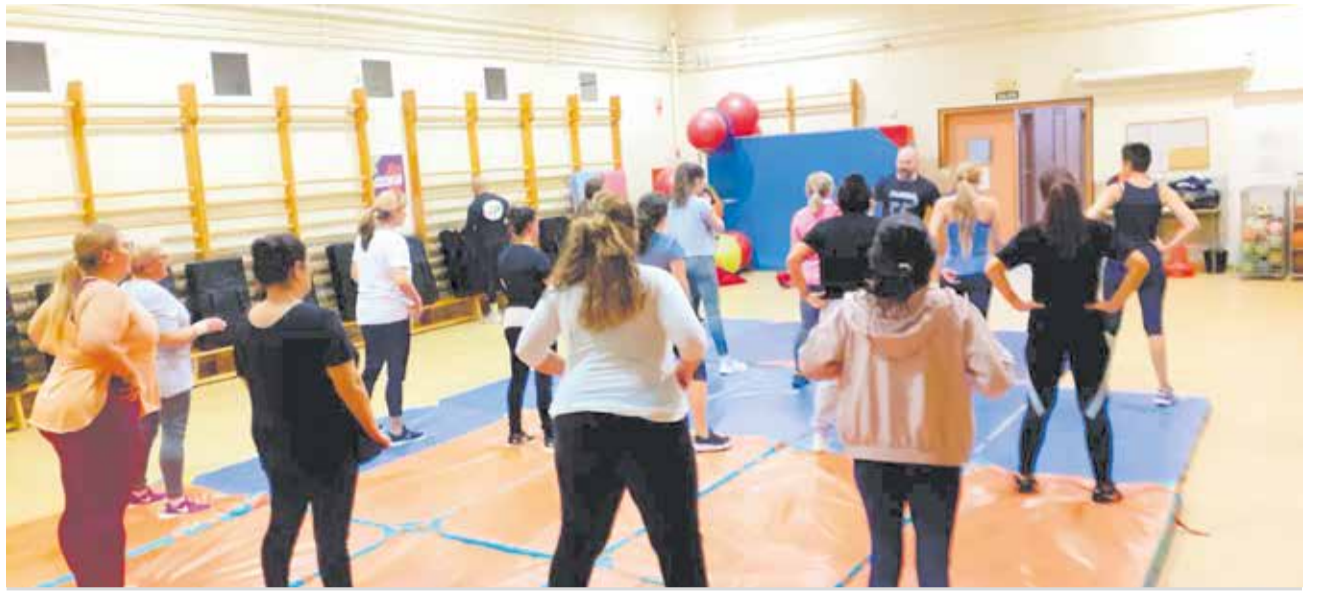
Un dels tallers per a dones organitzats per l'Ajuntament.

LA PROGRAMACIÓ ORGANITZADA PER L'AJUNTAMENT AMB MOTIU DEL 25N TÉ COM A LEMA 'EN IGUALTAT NI UN PAS ENRERE' I ES TANCARÀ EL PRÒXIM DIA 30 DE NOVEMBRE