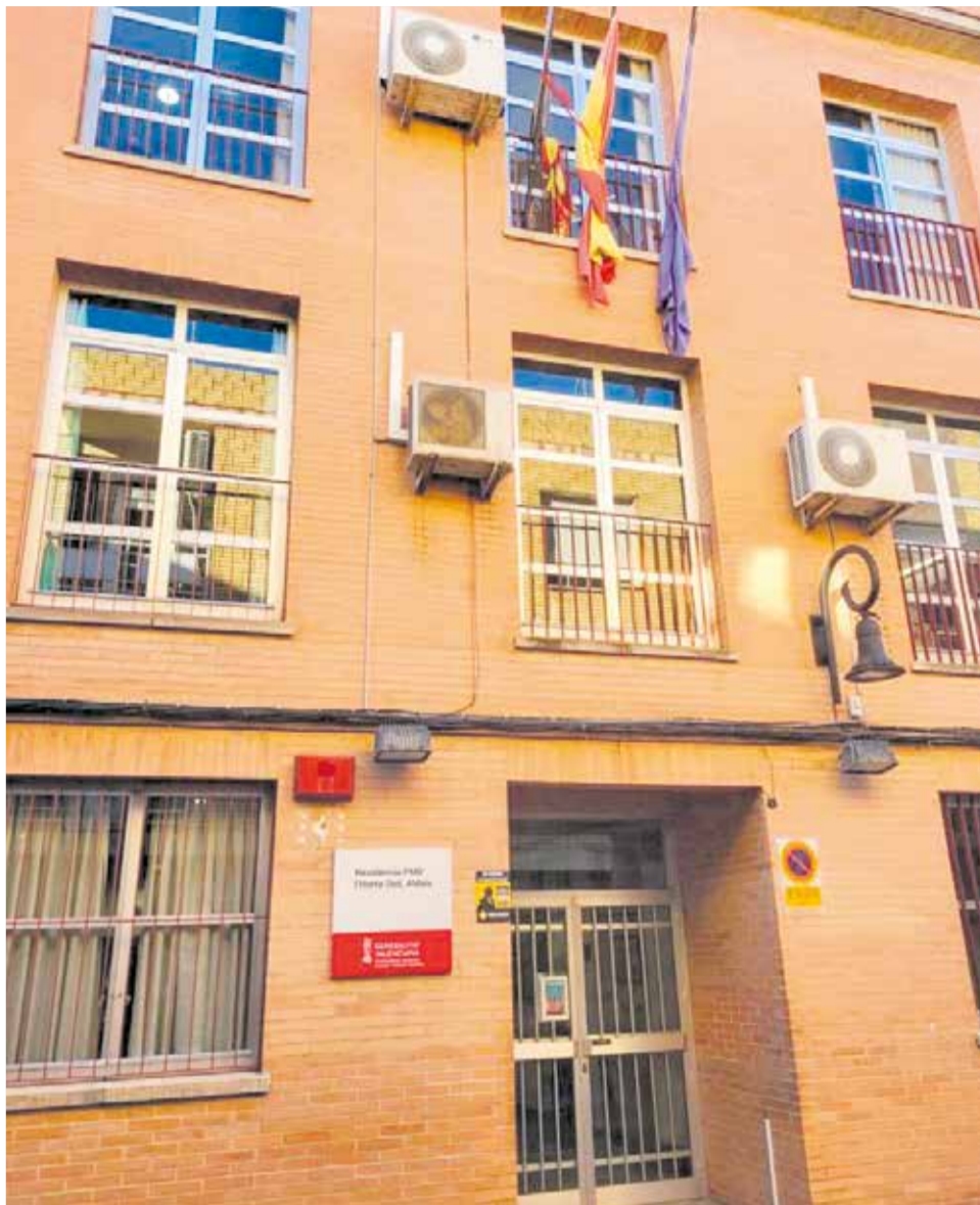
La residencia de personas mayores de Aldaia.

En la misma línea, explican que el Ayuntamiento lleva muchos años reservando el solar contiguo a la residencia para su ampliación, creación de un centro de día y mejora de las actuales instalaciones, y que la pasada legislatura fue visitada por la vicepresidenta de Igualdad y Políticas Inclusivas y personal técnico, quienes valoraron la necesidad de llevar a cabo dicha ampliación y mejora, y finalmente el año 2021 se obtuvo una respuesta positiva hacia la petición.