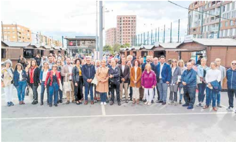
Las autoridades asistentes a la inauguración de la feria.

Además, durante todo el fin de semana se realizaron diferentes actuaciones que animaron la Fira de Turisme de l'Horta Sud, excepto en la tarde del sábado que se tuvo que suspender momentáneamente