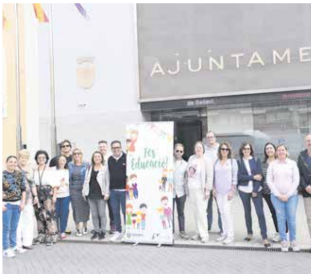
Els responsables dels centres amb l'alcalde.

Després, es va celebrar la jornada de convivència, amb la col·laboració de la Banda Musical Juvenil Santa Cecília, tallers i jocs a l'aire lliure per part de l'Escola Pública d'Adults, AMPES dels centres educatius CEIP San Clemente,