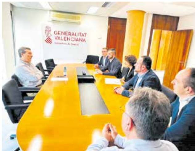
Una de las reuniones con la conselleria.

Tras el cambio de gobierno en la Generalitat, alcaldes socialistas de Manises, Quart de Poblet y Aldaia, del departamento de Salud de Manises crearon la Xarxa d'Alcaldies para certificar que se realizaba la reversión a la gestión pública del hospital. A pesar de que la conselleria anunció que va a ser así, sigue en marcha para "vigilar el proceso".