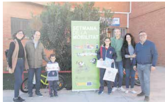
Alguns dels guanyadors del concurs.