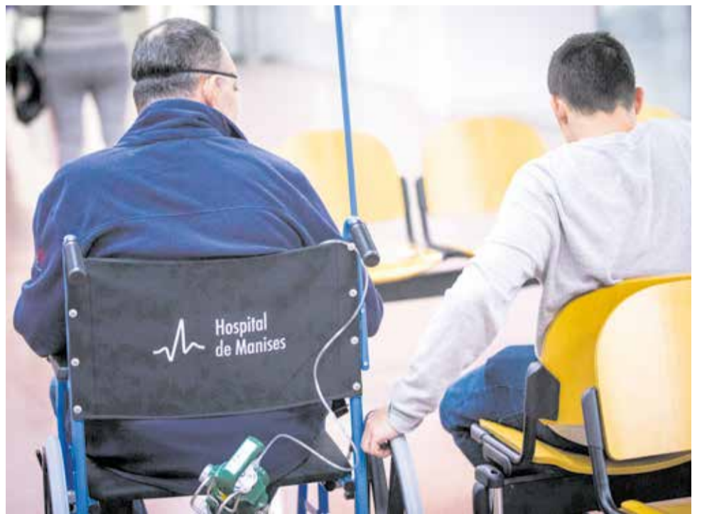
Un paciente espera su turno para ser atendido.

“Por ejemplo, las personas mayores pueden presentar muchas peculiaridades, co-