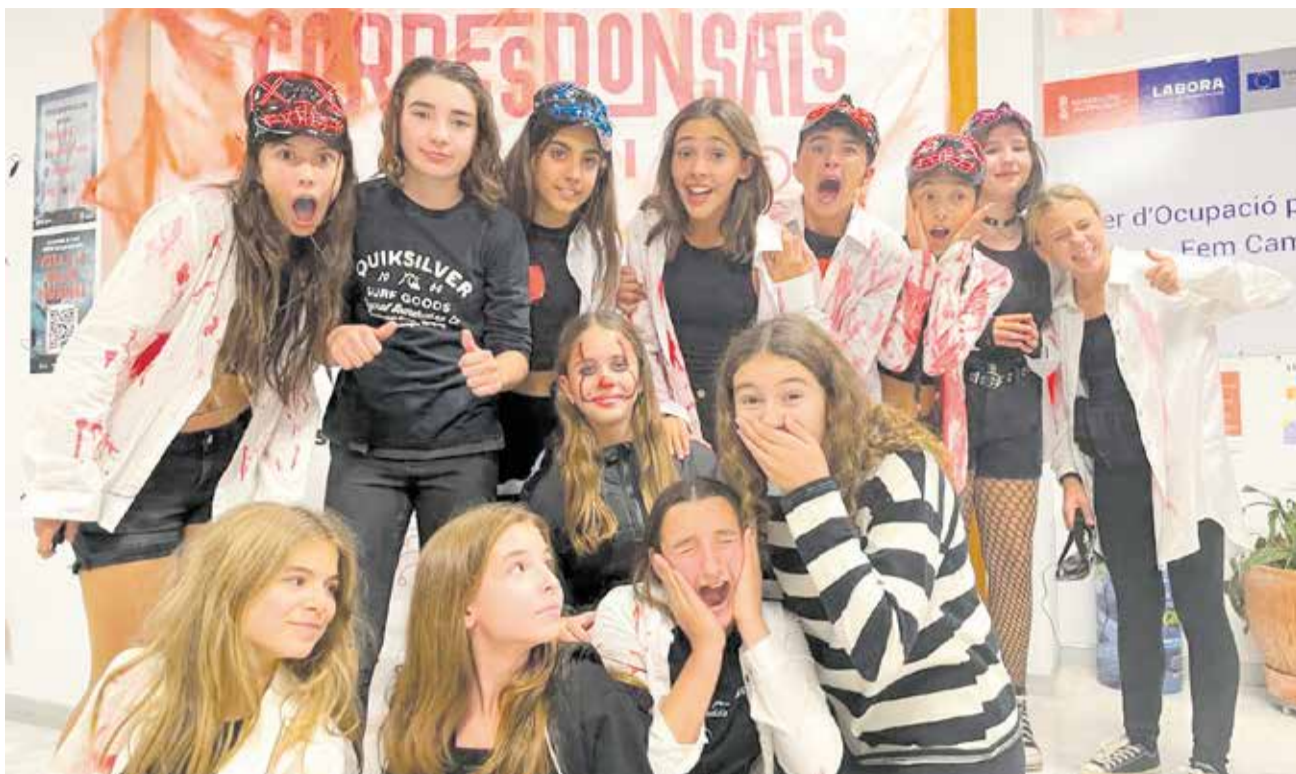
El grup de corresponsals locals protagonitzen l'esdeveniment .