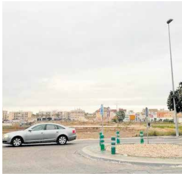
Los terrenos de la Font Baixa de Alfàfar.

La urbanización de la Font Baixa de Alfàfar supone la creación de más de 1.200 nuevas viviendas. El sector