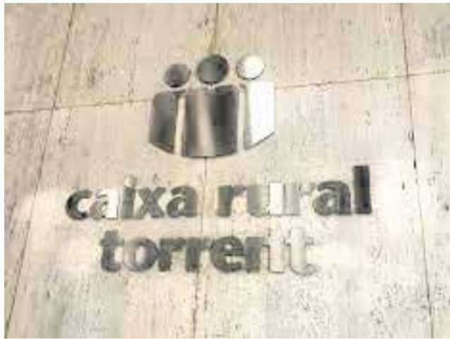
El logo que identifica a la entidad.

Este segundo tomo de la historia gráfica de la entidad recoge más material que ayuda a comprender la trayectoria de Caixa Rural Torrent, tanto en la evolución del negocio como en la actividad del Fondo de Formación y Promoción Cooperativa. El autor de este y el anterior volumen es el co-