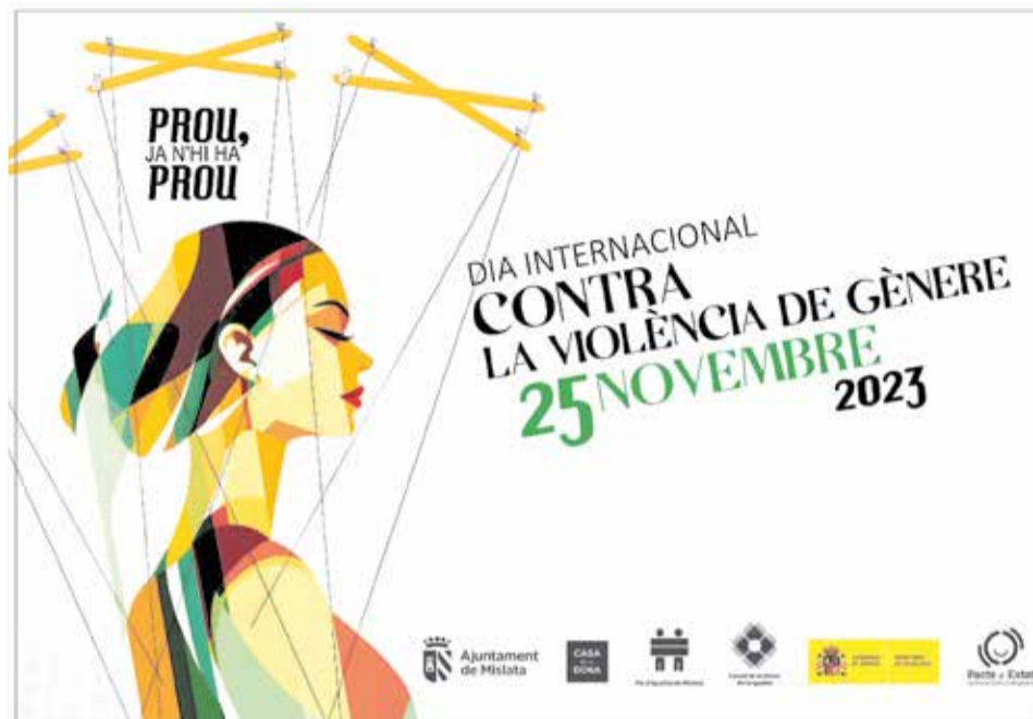
El cartel anunciador de las jornadas de este año.