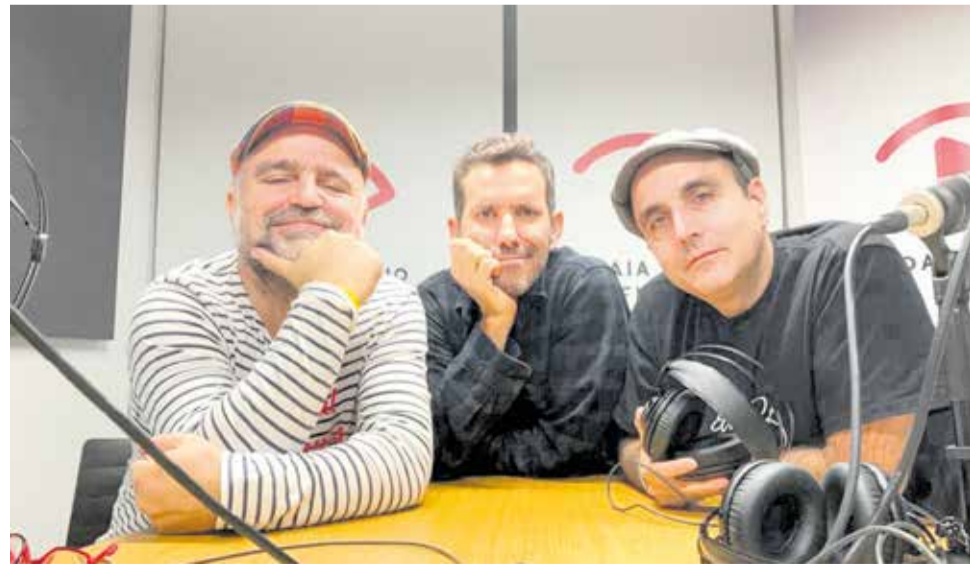
Els components del programa 'La trinchera'.

Vora un centenar de participacions arribaren a Aldaia Ràdio, i totes les persones que va participar al concurs van rebre un detall i les dos guanyadores del sorteig han passat per les instal·lacions, al centre Gent Jove d'Aldaia, per a recollir el seu premi.