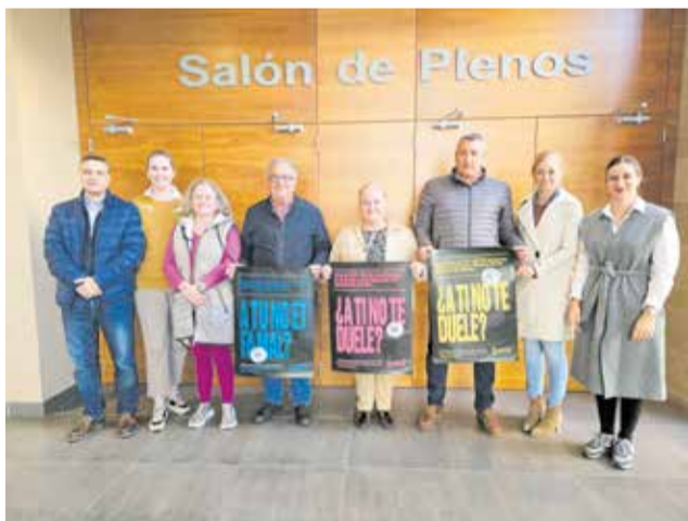
Cartel de la campaña del 25N de la Generalitat.

"Aunque en nuestro país se han logrado grandes avances en la lucha contra la violencia a las mujeres en las últimas décadas, es cierto que todavía hay una gran desigualdad y violencia ejercida