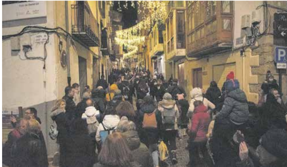
Veïns i vistants en un carrer de Morella amb llums de Nadal.