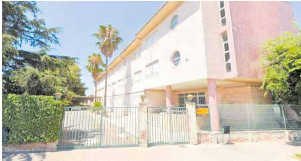
El Instituto José Vilaplana de Vinaròs en la actualidad.