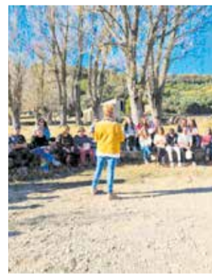
Jornada en Vilafranca.

Així s'ha creat este museu de l'aire lliure, on mitjançant codis QR ubicats per les