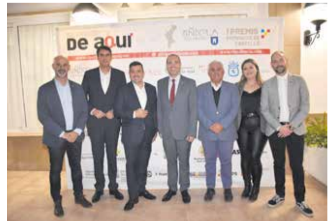
Diferentes instantes del 'photocall' de los I Premios de El Periódico de Aquí Provincia de Castellón.