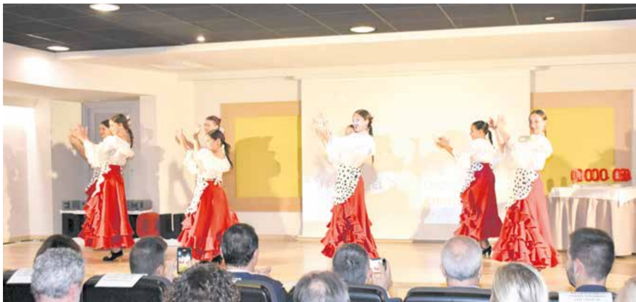
Actuación de las artistas del Centro Cultural Andaluz de Peñíscola.