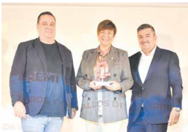
Premio Fiestas al Ayuntamiento de Segorbe. / P.G.