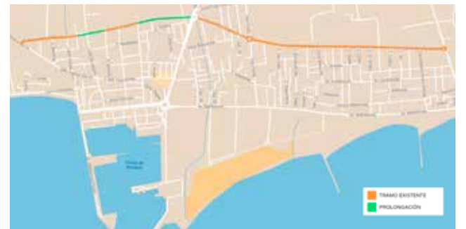
Plànol de l'actuació en l'avinguda Cañada Blanch.