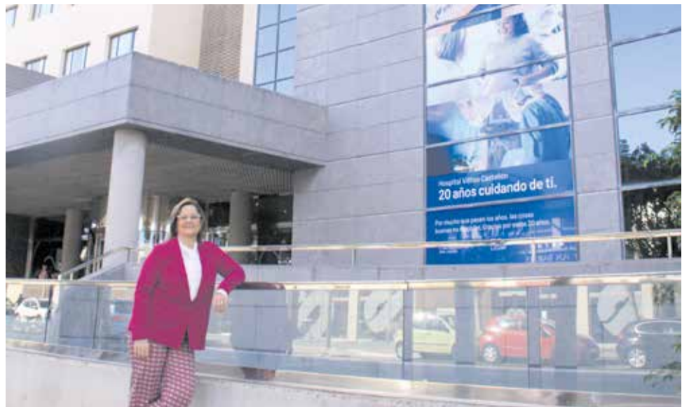
Marzal a las puertas del Hospital Vithas Castellón.

Otro gran proyecto en el que también estamos trabajando es el Vithas One, porque queremos ser un único Vithas, lo que permitirá la información médica del paciente unificada en cualquier hospital Vithas. Ya hemos empezado a trabajar y estamos formando a nuestros empleados para que todo funcione a partir de mediados de febrero del próximo año, que será la fecha en la que esperamos que esté implantado.