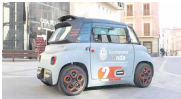
Vehicle elèctric de l'Ajuntament d'Onda.

Els costos subvencionables abasten una varietat d'aspectes essencials, incloent-hi equips, instal·lacions, programari, estudis de viabilitat, obra civil i costos d'explotació necessaris per a l'execució dels projectes. En total, estos elements sumaran una inversió de 35.000 euros, la qual cosa permetrà dur a terme iniciatives clau en pro del desenvolupament sostenible en l'àmbit de la mobilitat urbana.