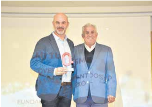
Premio Turismo a les Coves de Sant Josep. / P.G.