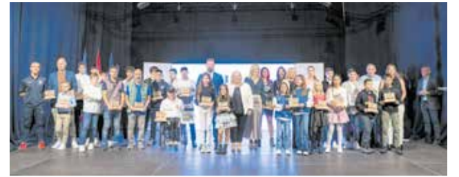
Premiados y autoridades en la XII Gala del Deporte.