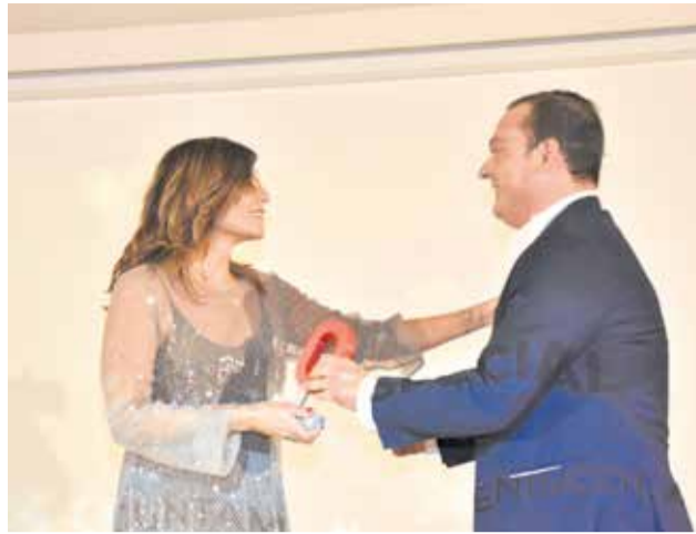
Premio Especial para el Ayuntamiento de Peñíscola por el año Papa Luna.