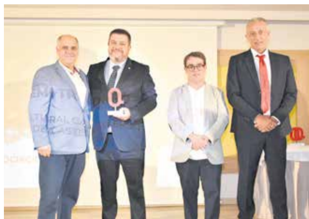
Premio Tradición a los 'Cavallers Templers de Castelló'. / P.G.