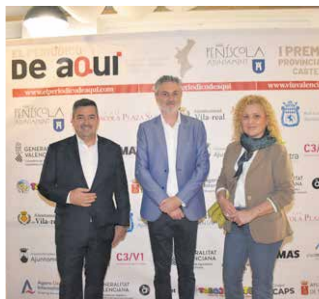
Diferentes instantes del 'photocall' de los I Premios de El Periódico de Aquí Provincia de Castellón.