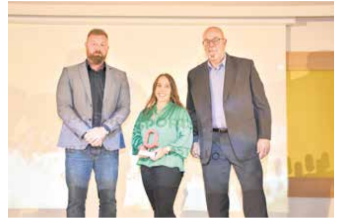
Premio Deportes al Club de Rugby Castelló.