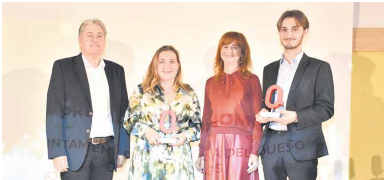
Premio Gastronomía para el Ayuntamiento de Onda y la Fundación de Turismo de Montanejos.