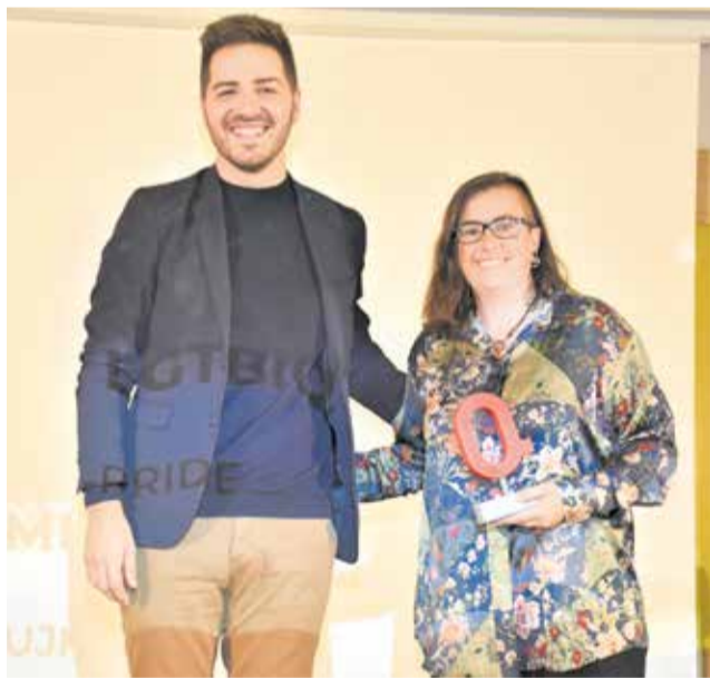
Premio LGTBIQ+ al grupo UJI Pride. / P.G.