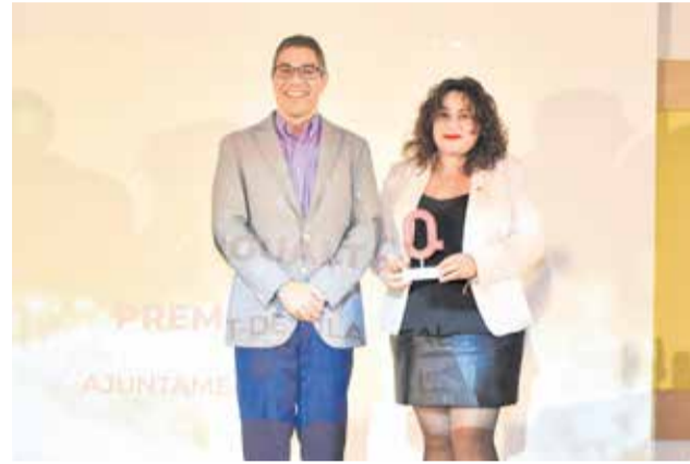
Premio Igualdad al Ayuntamiento de Vila-real. / P.G.