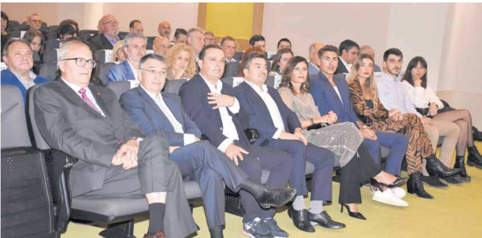
Autoridades y público en la primera edición de los Premios Provincia de Castellón de El Periódico de Aquí, celebrados en Peñíscola.

EL HOTEL & SPA PEÑÍSCOLA PLAZA SUITES ACOGIÓ EL EVENTO, EN EL QUE SE CITARON AUTORIDADES Y REPRESENTANTES DE INSTITUCIONES, ASOCIACIONES Y EMPRESAS DE DIFERENTES LOCALIDADES DE TODAS LAS COMARCAS DE LA PROVINCIA