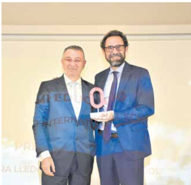
Premio Educación al Ágora Lledó International School.