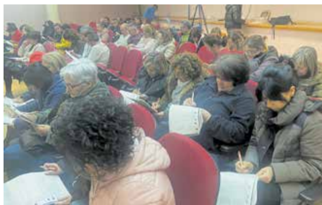
Extreballadors de Marie Claire en Vilafranca.

Es tracta d'un fons europeu que permetrà impulsar