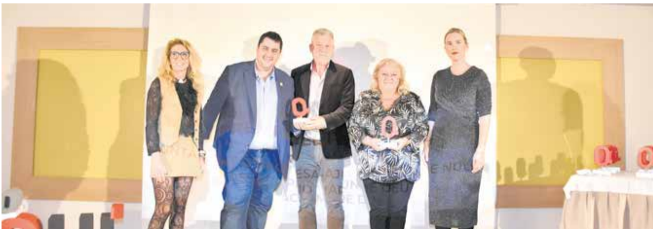
Premio Medio Ambiente a los ayuntamientos de Oropesa y Nules y la Asociación Mare de Déu del Carme. / P.G.

EDUCACIÓN La enseñanza de danza española y flamenco, el centro se transformó en 2017 en un espacio integrador y pluricultural, apoyado por el ayuntamiento. Busca la diversificación de niveles de danza y acoge a familias de diversas nacionalidades, convirtiéndose en un punto de encuentro inclusivo y socializador. Con más de 15 nacionalidades representadas, el Centro Cultural Andaluz de Peñíscola se destaca como la "torre de babel del flamenco en Castellón".