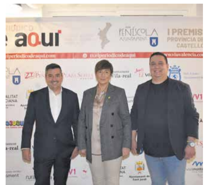
Diferentes instantes del 'photocall' de los I Premios de El Periódico de Aquí Provincia de Castellón.