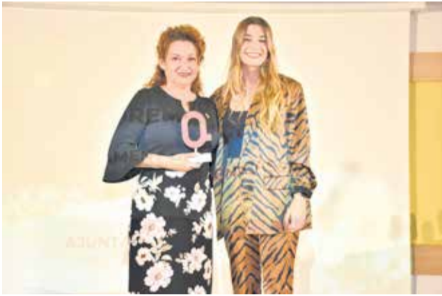
Premio Ocio al Ayuntamiento de Benicàssim. / P.G.