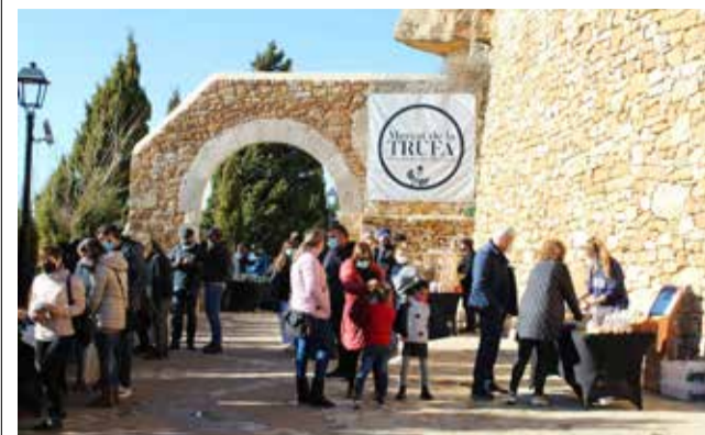
Edición anterior del Mercado de la Trufa de Culla.