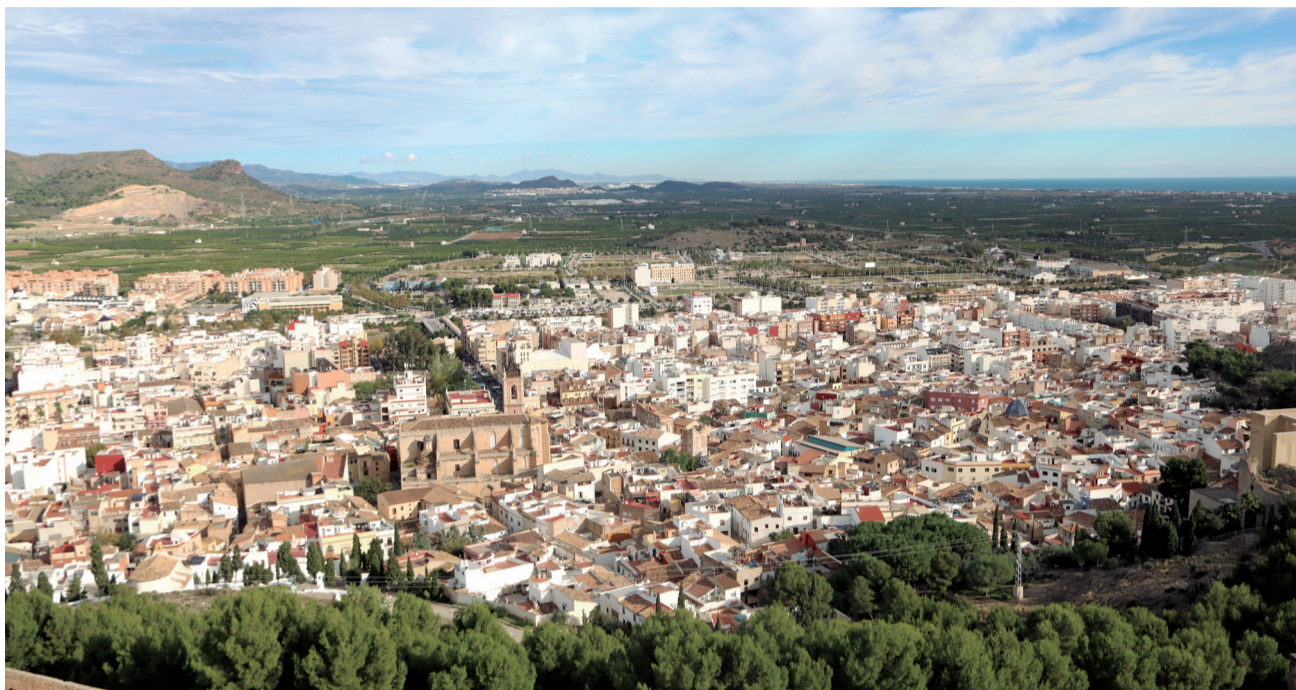
Vista de la capital del Camp de Morvedre.

EL ÓRGANO PROVINCIAL PRESENTA LOS PRESUPUESTOS PARA LOS PRÓXIMOS CUATRO AÑOS