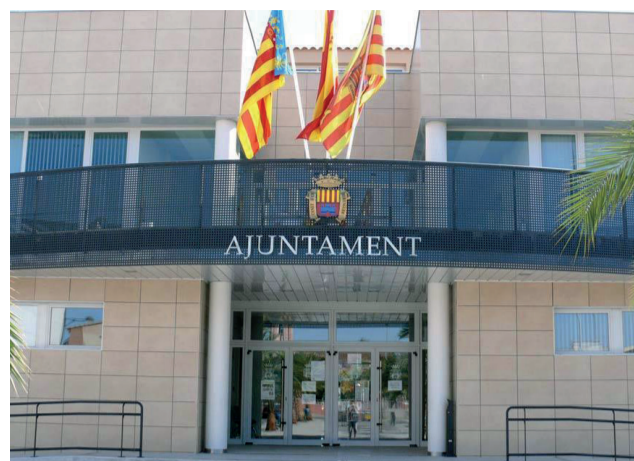
Façana de l'ajuntament de Canet.

El pressupost per a l'any 2024 es presenta com una eina crucial per al desenvolupament i benestar de Canet d'en Berenguer, evidenciant la voluntat de les autoritats locals de gestionar de manera