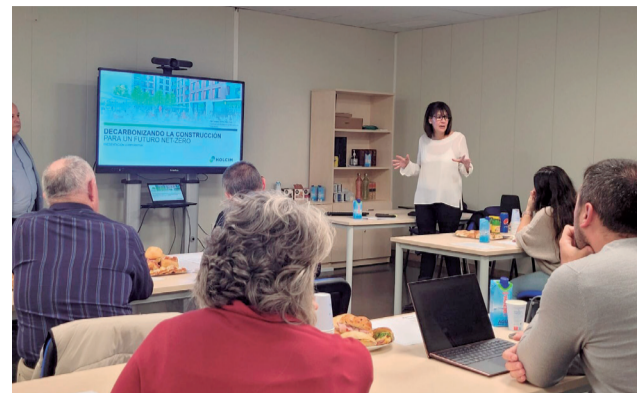
Un instante del encuentro.