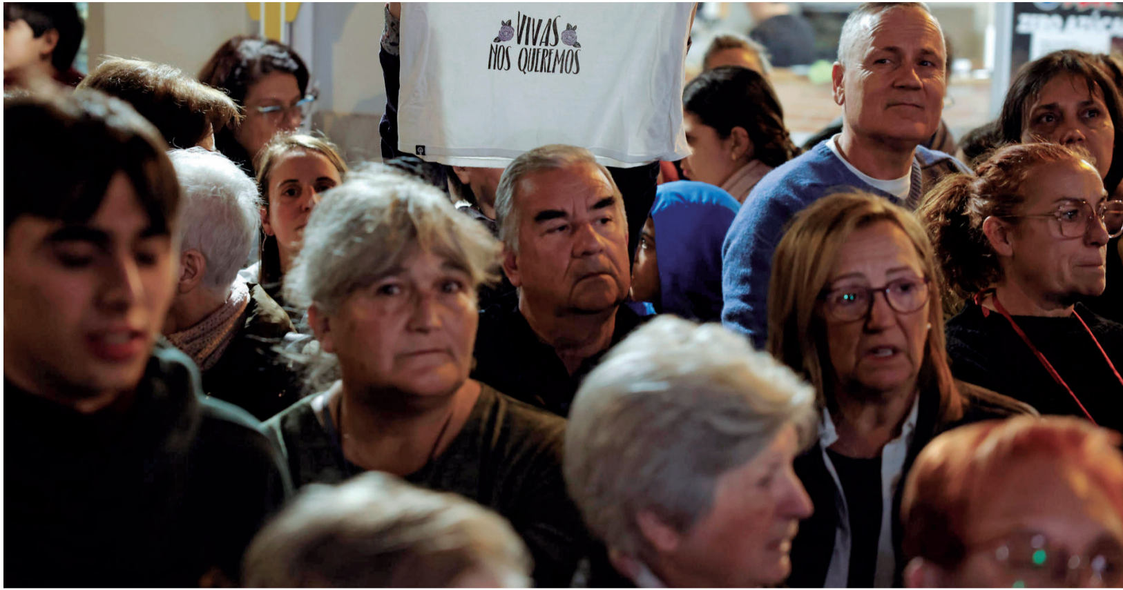
Cientos de personas se concentraron en Sagunt guardando un minuto de silencio y leyendo varios textos.