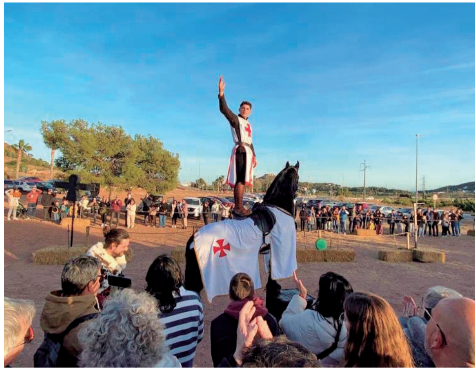
Una de les activitats a Petrés.

Les jornades també varen coincidir amb la reobertura del castell. Després d'anys d'intervencions i esforços incansables per a rescatar-lo de l'oblit, el Castell de Petrés, una joia del palau gòtic valen-