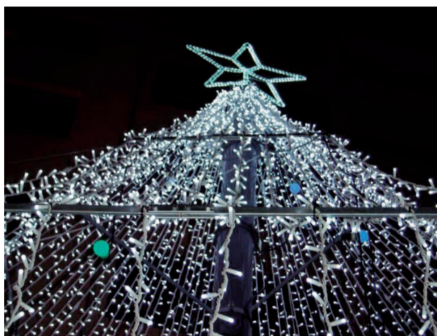
Iluminación de Requena.