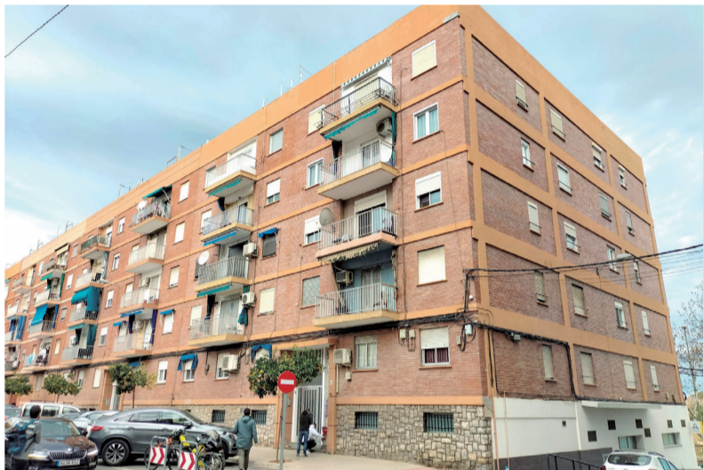
Vivienda donde ocurrieron los hechos.