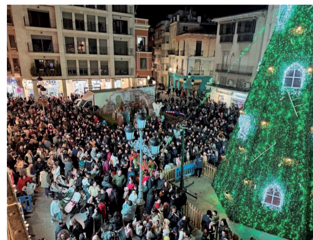
Vista del día del encendido de Sueca.