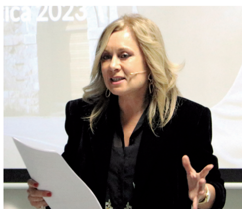
Varias instantáneas de la gala.