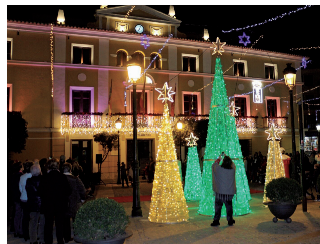
Iluminación navideña en Segorbe.

Nada menos que 62 propuestas ha preparado el Ayuntamiento y diversos colectivos de la ciudad para estas fechas. Y son musicales, deportivas, comerciales, culturales; para mayores, jóvenes y niños; para comercios y particulares, además de las cabalgatas de Papá Noel y Reyes Magos. La pretensión de dinamizar la ciudad especialmente en estas fechas ha supuesto que hayan concursos, de belenes, de escaparates, fachadas y balcones, fotografía, dibujo infantil. También festivales en todos los centros educativos y lúdicos de Segorbe, un correfoc (17 diciembre) que se presenta como una de las novedades más destacadas; conciertos del Grupo Helios, Orquesta Twister, de la Bibap, del Orfeón Alicante, teatro,