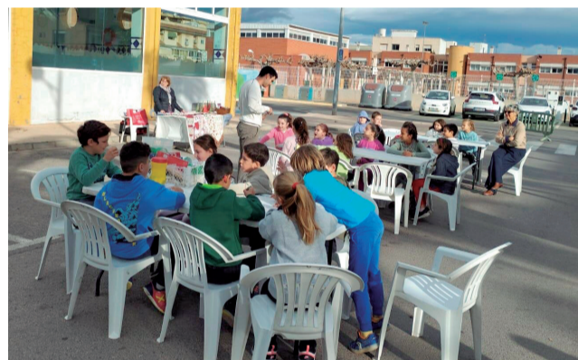
Una de les activitats. / EPDA