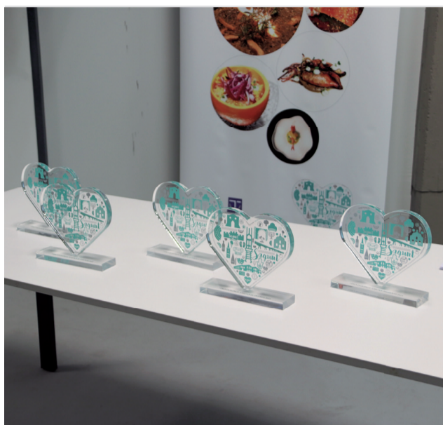
Varias instantáneas de la gala.

El evento concluyó con un homenaje a todas las empresas, autónomos y emprendedores que forman parte del destino Sagunt, destacando la colaboración entre la administración pública y el sector privado para consolidar a Sagunt