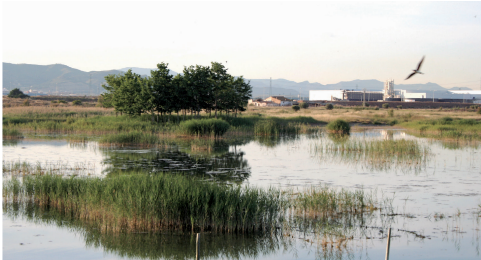
El entorno natural de la Marjal dels Moros, en el término de Sagunt.