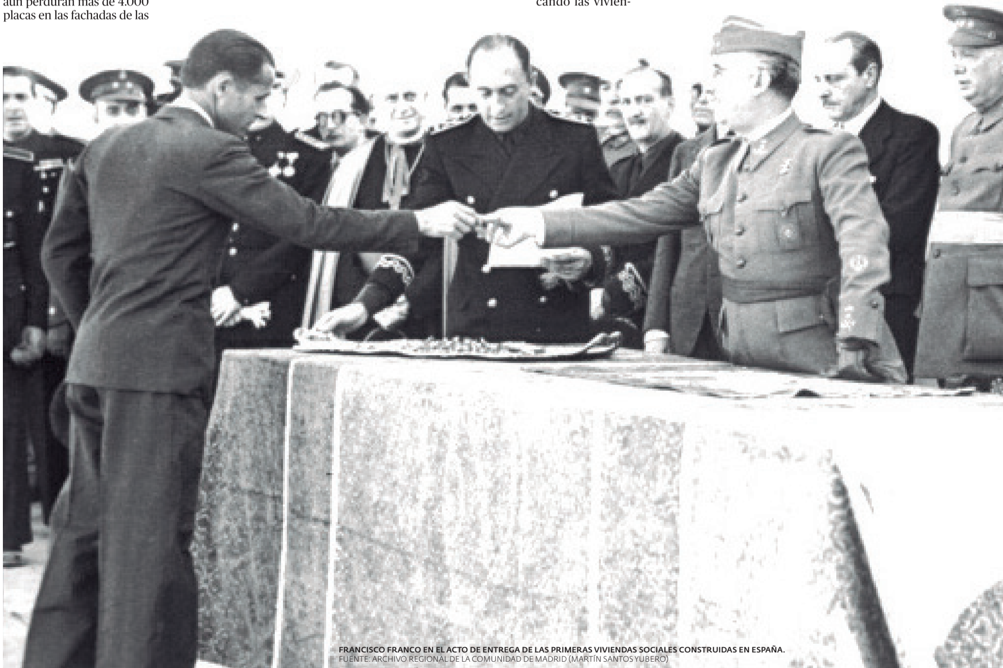
FRANCISCO FRANCO EN EL ACTO DE ENTREGA DE LAS PRIMERAS VIVIENDAS SOCIALES CONSTRUIDAS EN ESPAÑA.

En un esfuerzo por erradicar los vestigios del pasado, el Ayuntamiento de Sagunt