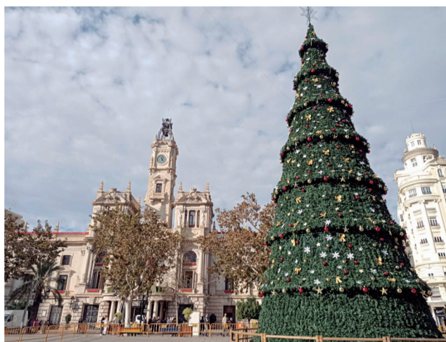
Árbol de la plaza del ayuntamiento de Valencia. /