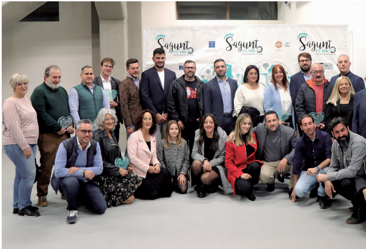
Galardonados y finalistas en la gala.

Para poner en valor la celebración de la gala el alcalde de Sagunt, Darío Moreno, reflexionó sobre la importancia de reconocer el trabajo que realizan asociaciones y particulares para el desarrollo de la ciudad: "Hay veces que es importante que no hablemos de la globalidad, sino que le pongamos nombres y apellidos a las personas, empresas y asociaciones que están ayudándonos a llegar a esos niveles de excelencia que es imprescindible que consigamos por parte de todos y de todas".