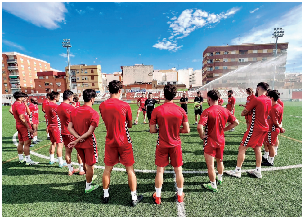
Jugadores del CD Acero en el campo de fútbol del club.

Estamos valorando con el Ayuntamiento cambios y reparaciones en el estadio"