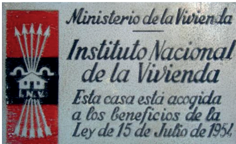
Un ejemplo de las placas franquistas ubicadas en las fachadas.

En el caso de oposición comunitaria, el ayuntamiento puede exigir la retirada de las placas, siendo