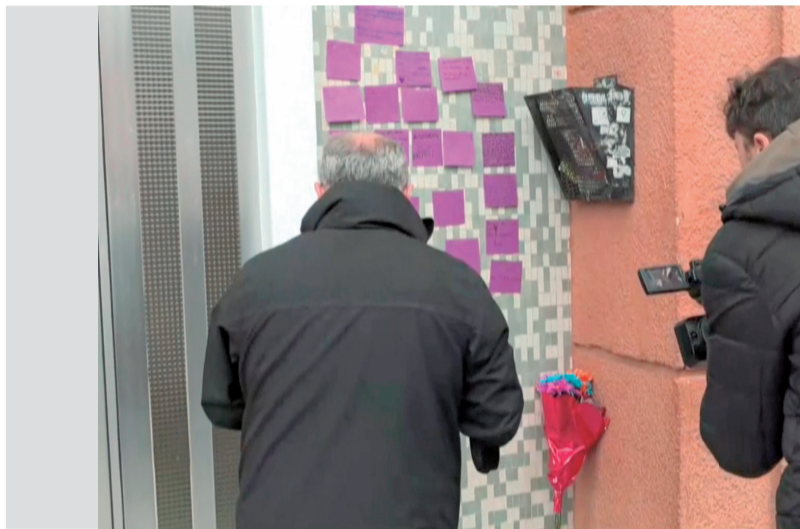
Mensajes de apoyo a la niña que cayó.

■ EL HOMBRE DEGOLLÓ A SU EXMUJER DELANTE DE SUS DOS HIJAS, UNA DE LAS CUALES SE PRECIPITÓ DESDE LA VENTANA