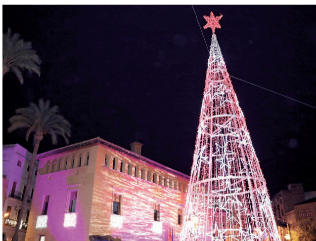
Árbol de navidad de Llíria.