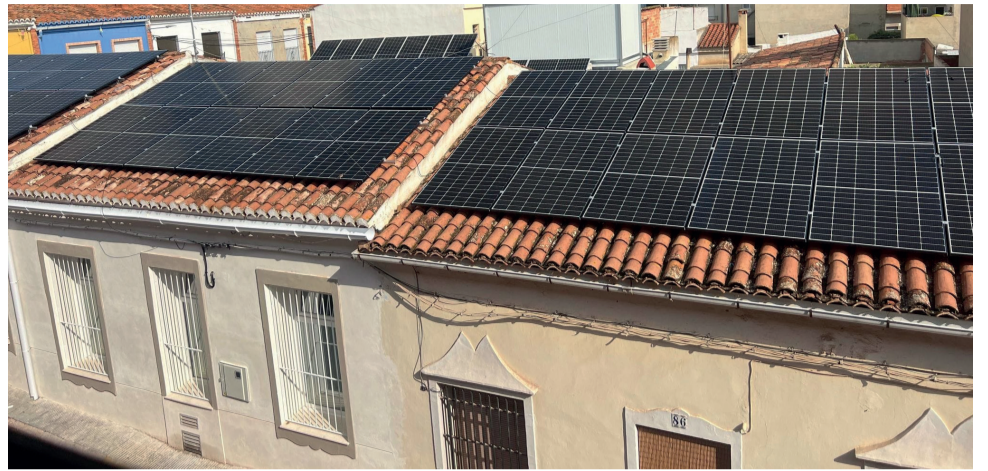
Tercera planta fotovoltaica instal·lada a Benifairó de les Valls.