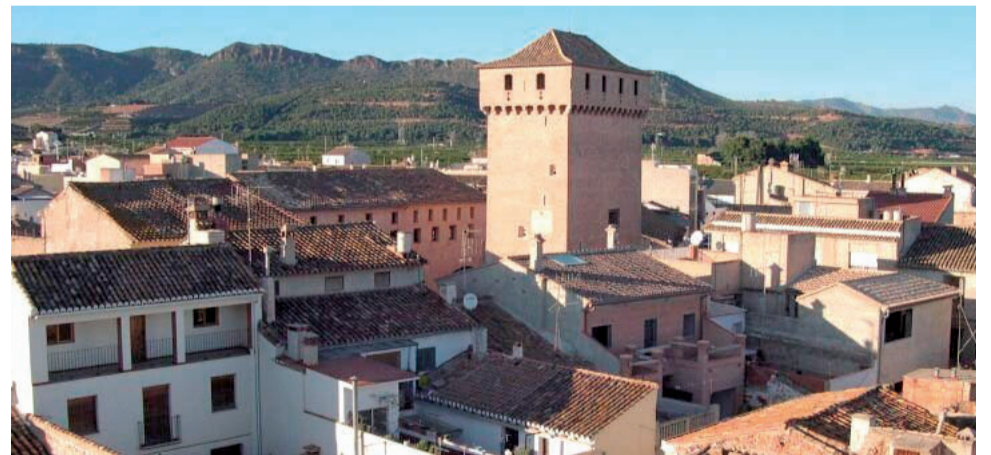
Vista del municipio de Benavites.

en los valores de la cooperación internacional descentralizada municipalista ejercida desde las localidades de la Comunitat Valenciana, mostrándose en calles y espacios públicos del municipio del Camp de Morvedre del 11 al 18 de diciembre. Con el taller de rapsodas, el cual se realizó el 20 de noviembre en el CRA Benavites-Quart de les Valls, se pretendió que el público adolescente contrapusiera sus inquietudes con las de la juventud de los países del sur a través de poesía cantada, el rape o el folk. Por otro lado, el taller de cocina del sur, destinado al público adulto y que se realizó a las 18.00 h del miércoles 13 de diciembre en el Salón de Plenos del edificio del Ayuntamiento de Benavites, tuvo como finalidad fomentar el principio de la solidaridad mediante la elabo-