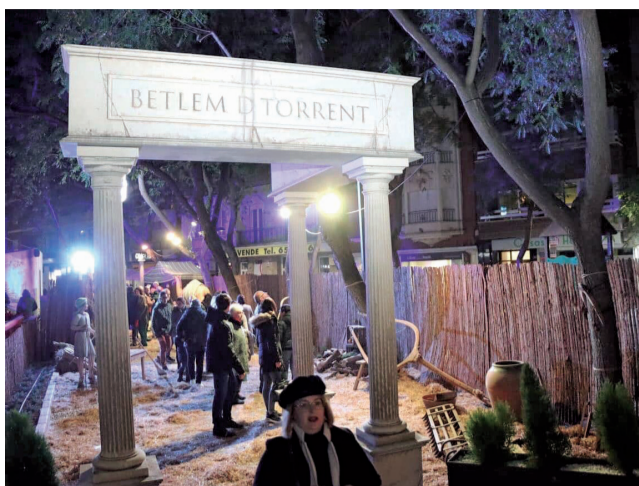
Belén de Torrent.