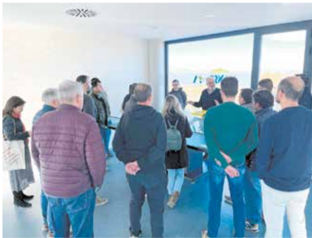
Visita les instal·lacions de la Planta /EPDA

Donar a conèixer, als nous representants del CRiV, les