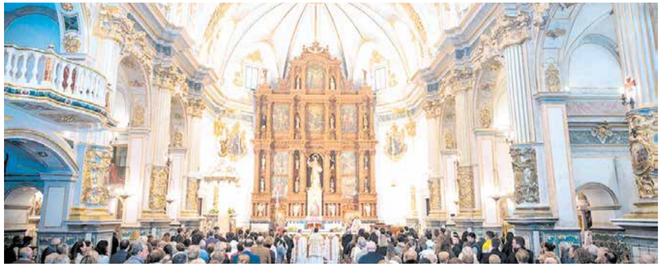
Inauguració de l'Església de Sant Vicent Màrtir, ja finalitzades les obres de rehabilitació i restauració.

La llarga espera per a un final espectacular. El motiu de l'inici d'aquest procés va ser el mal estat en què es troba