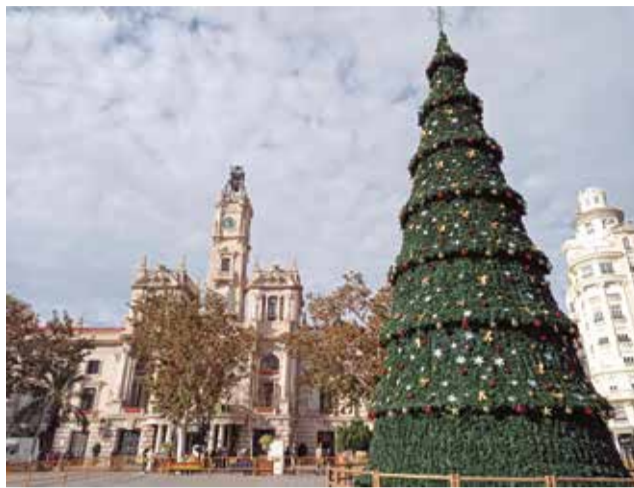
Árbol de la Plaza del Ayuntamiento de Valencia.