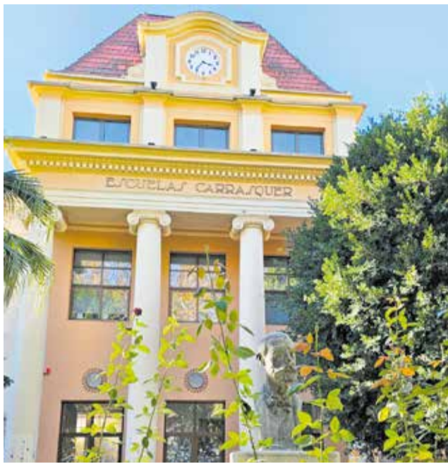
Façana del Col·legi Carrasquer de Sueca.

Entre les activitats proposades, el regidor es planteja una trobada de totes les promocions que han passat pel centre per a poder visitar-lo i contemplar el seu estat actual després de l'ambiciosa