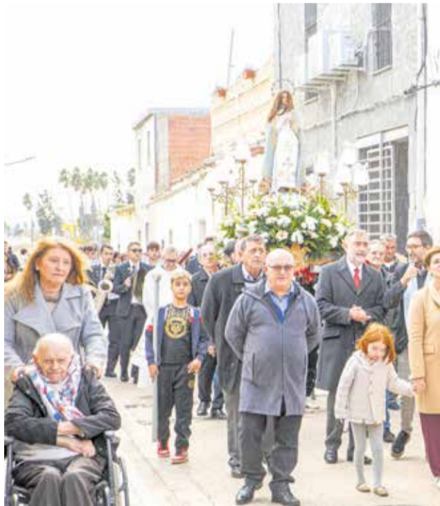
Tradicional processó de la verge

de la Corporació Municipal, així com els festers i festeres de Montortal.