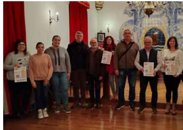
Acte de cloenda de la Trobada de Centres / EPDA