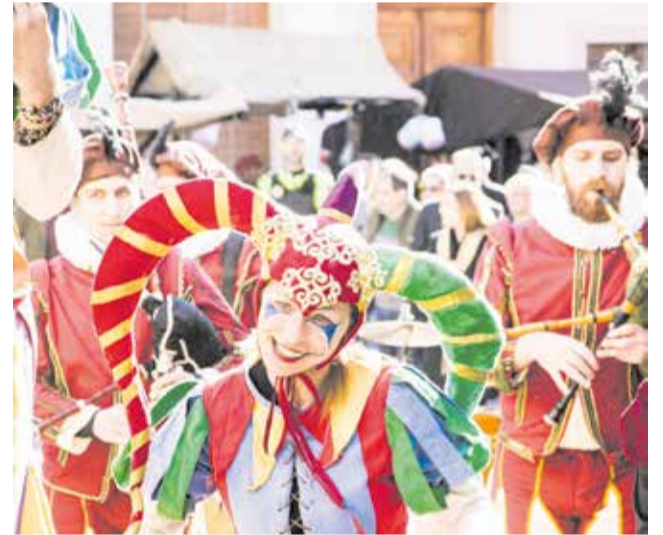
Imatges d'arxiu del Mercat Renaixentista dels Borja. / EPDA