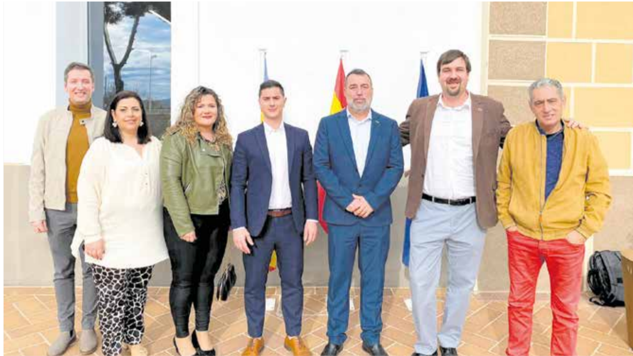
El nou equip de govern a la porta de l'Ajuntament de Montserrat.

► Montserrat necessita un canvi en alguns ser-