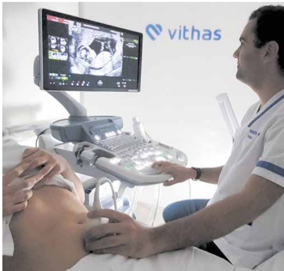
Pruebas y evaluaciones médicas de seguimiento durante el embarazo.

Tal y como ha recordado, las ecografías "permiten evaluar el crecimiento y desarrollo del feto, así como identificar posibles anomalías estructurales como problemas cardíacos, malformaciones en órganos internos o defectos en la columna ver-