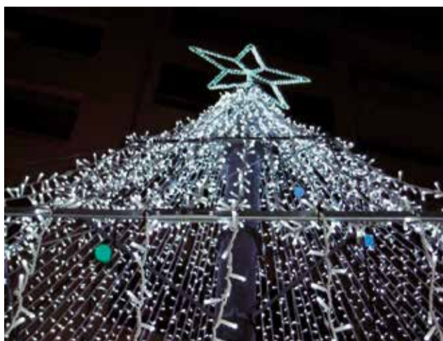
Iluminación de Requena.