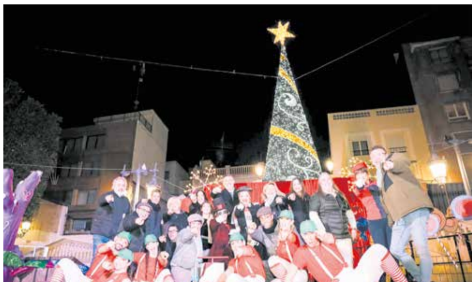
Un dels moments de l'encesa de l'arbre a Cullera.