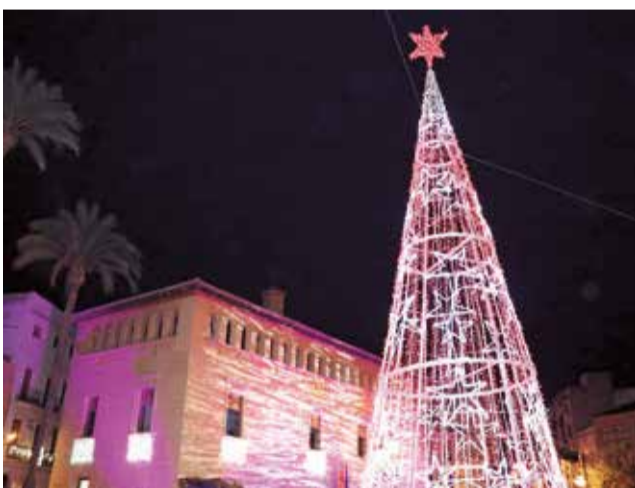
Árbol de navidad de Lliria.

Del 14 al 17 diciembre el Mercado Municipal la plaza del Prado, acogerá la Feria de Arte. Co estantes de colectivos de diferentes disciplinas artísticas.