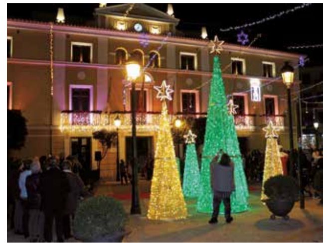
Iluminación navideña en Segorbe.

edición el 28 de diciembre y el escape room 'Rescate en Hogwarts' que organiza el Centro de Información Juvenil el 2 de enero, completan el programa.