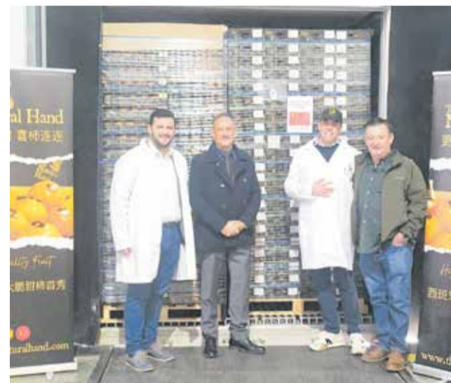
Moment de l'enviament dels caquis a Xina