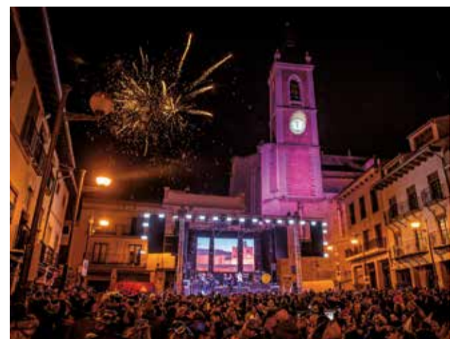
Plaza Mayor de Sagunto en Nochevieja. / R. MARTÍNEZ