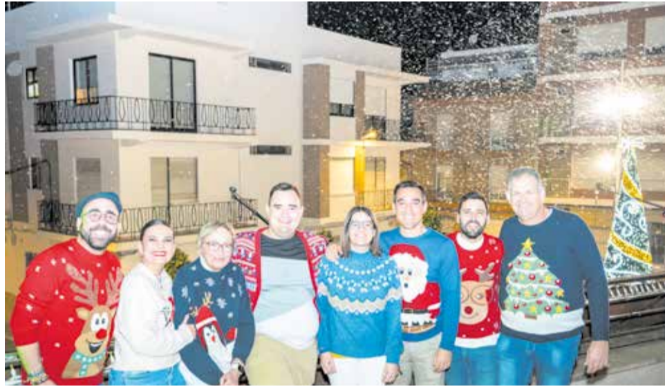
Acte d'encesa dels llums i de l'arbre de Nadal a Carlet

L'acte, envoltat per un arbre de Nadal i un gran