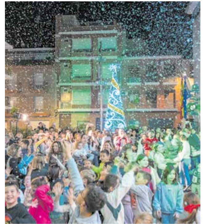
Veïns de Carlet a la festa de l'encesa del poble.

cional dels dies de Nadal. Uns espais plen lluminositat, i ornaments nadalencs per donar la benviguda a les festes.