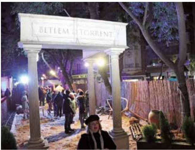
Belén de Torrent.