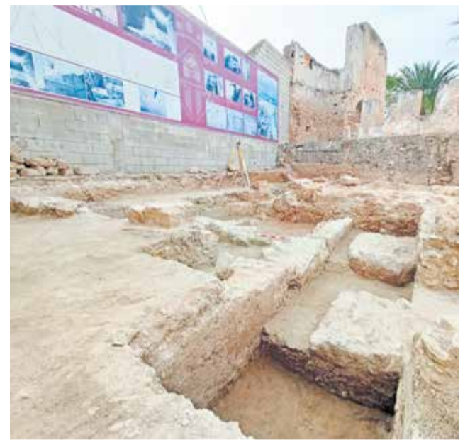
Part de de les excavacions prop del mur.

Els treballs estan previstos que finalitzen el mes de febrer de 2024 per a, una vegada estudiades les restes arqueològiques que es troben, valorar la seua incorporació al projecte, de tal manera que siguen part visible de la visita a l'edifici que s'alçarà integrant i conservant al seu interior els murs que constituïen la Torre de la Casa Reial.