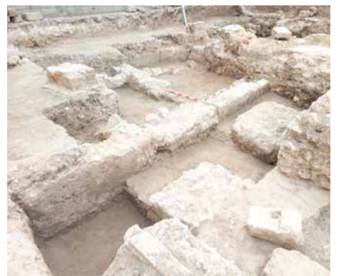
Imatge de prop de les excavacions.

El regidor de Patrimoni Històric, Xavi Pérez, ha assenyalat que les excavacions arqueològiques "són un pas molt important, previ, a la recuperació de la Casa Reial, ja que són necessàries per a poder documentar troballes com estructures, murs o altres elements d'este indret tan simbòlic, de manera que les més importants puguen visualitzar-se a través d'una estructura de vidre en la planta baixa de l'edifici".