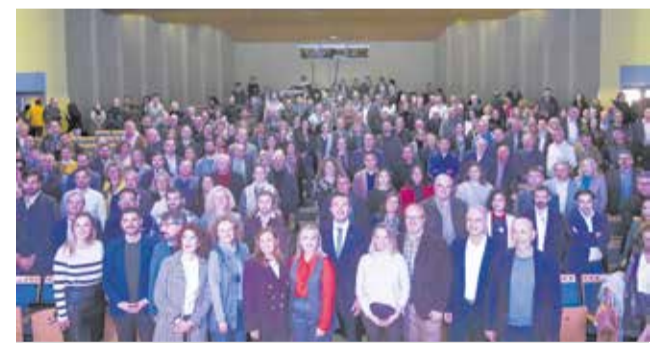
Mompó i Enguix amb els alcaldes.

El màxim responsable provincial ha detallat que el Pla Obert d'Inversions compta amb 340 milions d'euros per als municipis i altres 10 milions per a les mancomunitats.