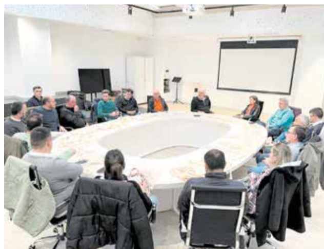
Un dels moments durant al reunió