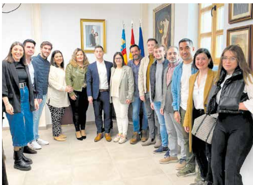
Foto de grup el dia de la toma de posesió en l'Ajuntament.