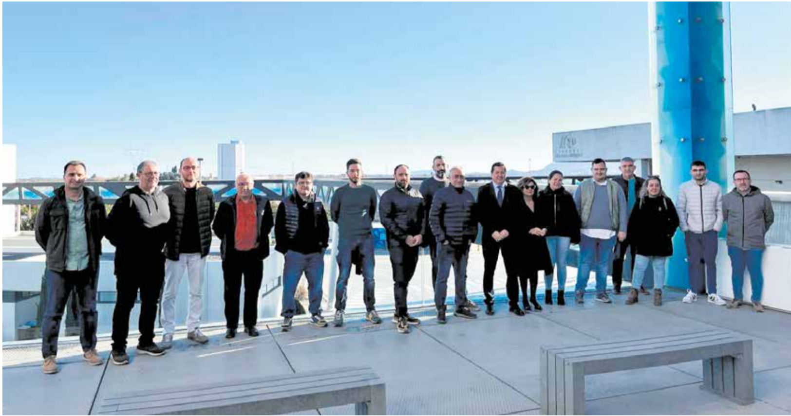
Foto de grup amb tots els alcaldes i responsables públics assistents a la jornada de benvinguda del Consorci de Residus de la ribera

■ LES JORNADES DE BENVINGUDA SERVIREN PER VISITAR LA PLANTA I DONAR A CONÈIXER LES ACCIONS A SEGUIR