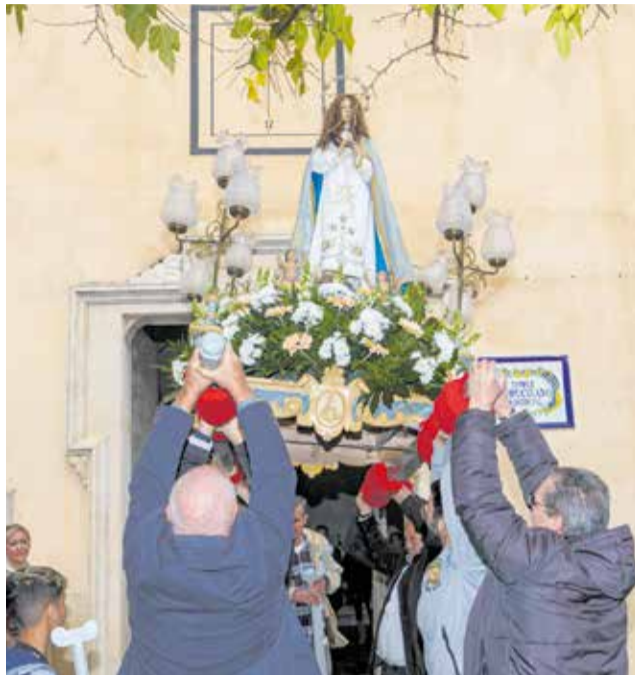
Després del pasacarrer va tindre lloc la missa

Però, el dia gran quedà reservat pel 8 de desembre. Una nova despertà de carcasses i tronadors va anunciar a tots els veïns i veïnes de Montortal la festivitat de la patrona. Al matí la Colla la Rosca encapçalà un passacarrer que finalitzà amb la solemne missa de la Puríssima. Una vegada acabada, es celebrarà la tradicional processó, acompanyats per la banda de música de l'associació Musical Filharmònica Alcudiana, i que donarà pas a una gran traca i vi d'honor al qual es sumaran diferents membres