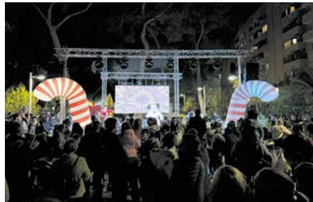
Una Peque Discomòbil va obrir l'acte nadalenc.

Pel que fa al Premi a l'Originalitat i la Innovació, dotat econòmicament amb 200 euros, el guanyador ha sigut el Saló de Té Suni.