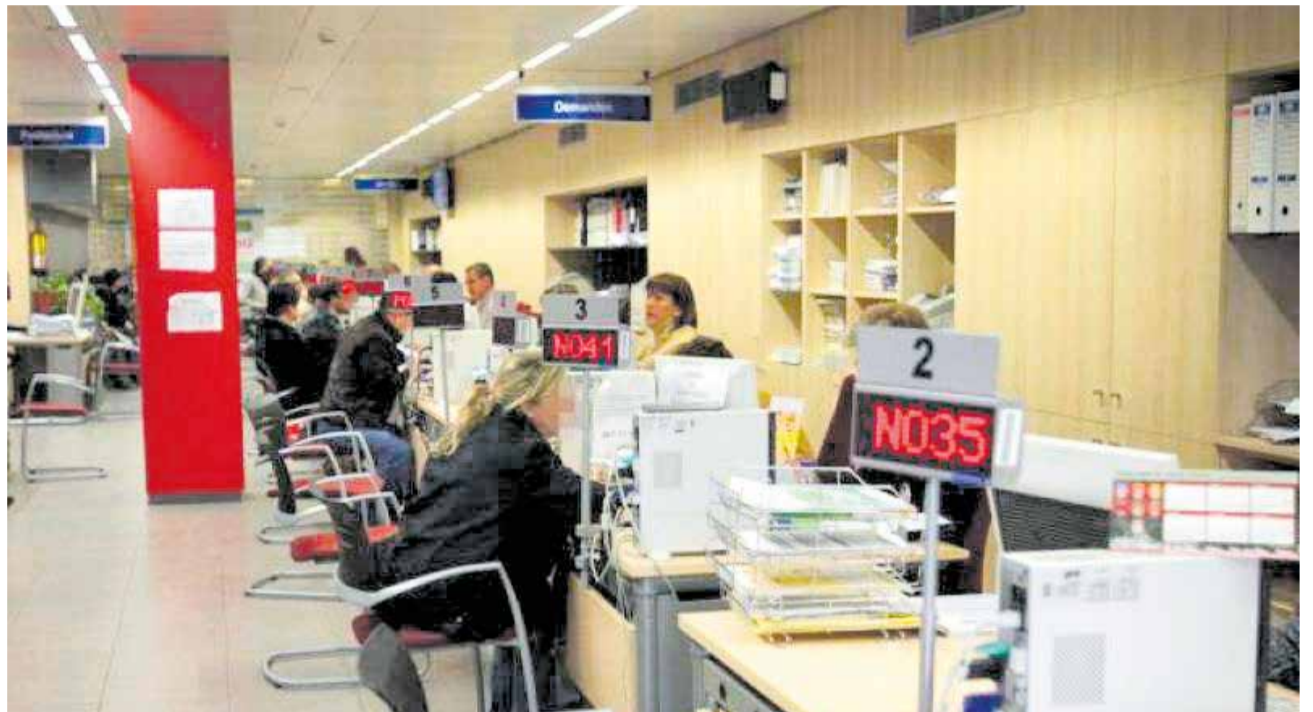
Imatge d'arxiu de les oficines del SERVEF

yes nadalenes dels comerços. Destacar també un visible descens generalitzat en la majoria dels municipis de la comarca amb uns descensos de l'atur entre el 6 i el 10%.