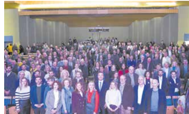
Mompó i Enguix amb els alcaldes.