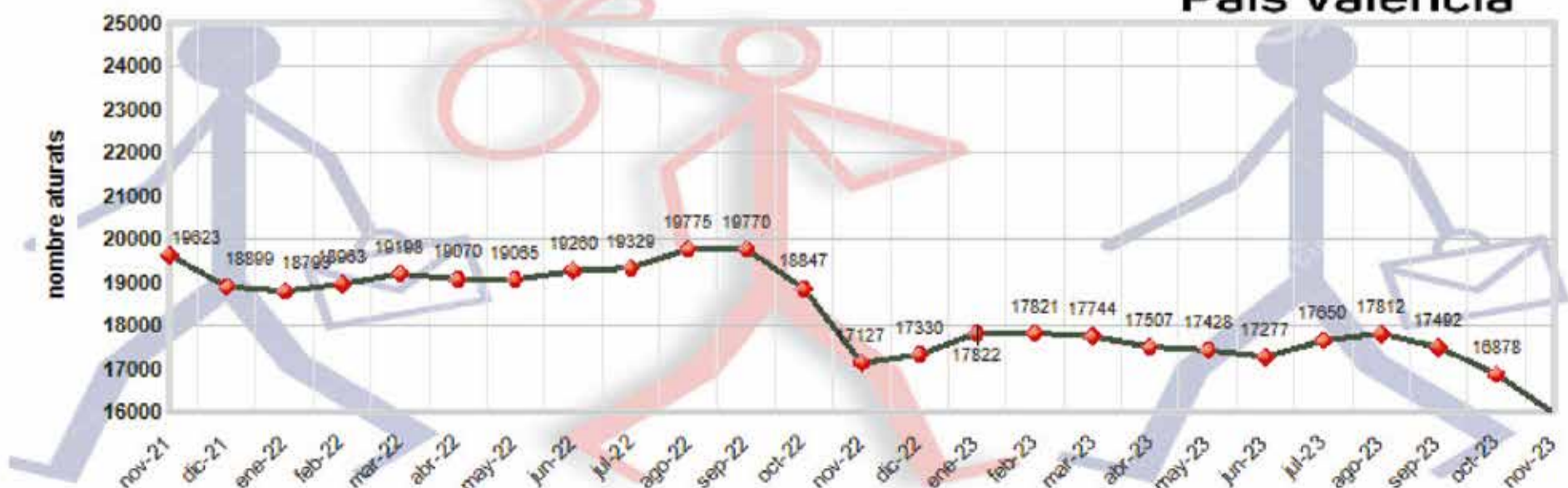
Gràfica anual de nombre d'aturats a la coamarca de la Ribera