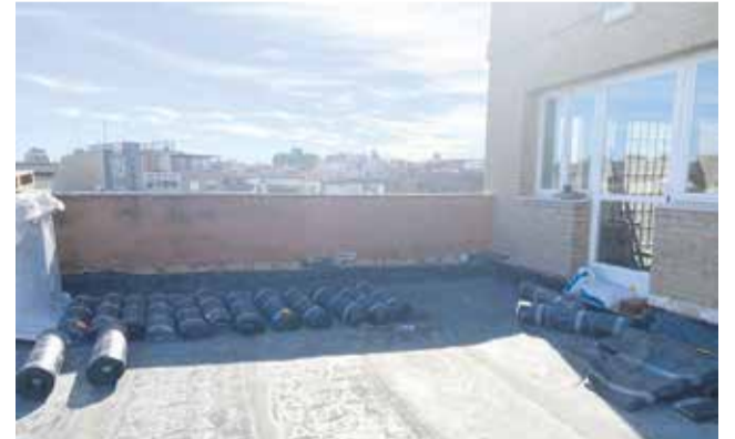
Obres coberta Centre Cultural Enric Valor.

Donada l'àmplia extensió de la zona a actuar, 1.665,15 m2, les obres es duran a terme en dues fases. La primera consistix en la reparació de la coberta del pati de butaques, la segona fase tindrà la seua actuació de millora en la repara-