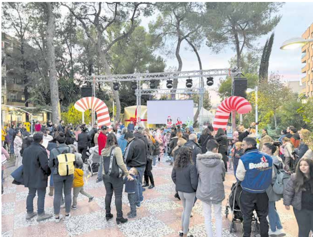
Els veïns de d'Alberic van acudir a l'encesa de llums que va comptar amb animació per als més menuts.

ELS REPRESENTANTS DE L'AJUNTAMENT D'ALBERIC VAN REPARTIR UN BERENAR AMB XOCOLATE ENTRE ELS VEÏNS I VEÏNES ASSISTENTS