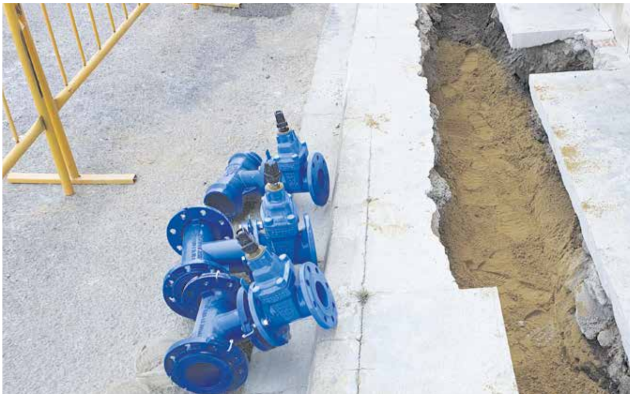
Un dels clavegueram del municipi durant les obres del projecte

Este projecte pretén impulsar l'ús de les noves tecnologies de la informació en el cycle integral de l'aigua per millorar la seua gestió, augmentar l'eficiència, reduir les pèrdues en les xarxes de subministrament i avançar en el compliment dels objectius