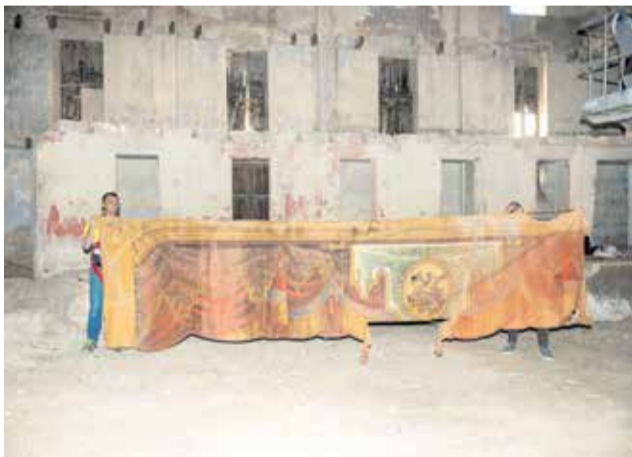
Restauració Bambolinó del Teatre el Siglo

El bambolinó, propietat de l'Ajuntament i obra del pintor i escenògraf Ricardo Alós Sierra, data de l'any 1888, està realitzat amb la tècnica del temple a la cola sense preparació i disposa d'una amplària de quasi 8'5 metres. Es tracta d'un bé emblemàtic que ha perdurat en este centenari edifici amb una funció expositiva en l'embocadura del teatre. El bambolinó ha resistit els avatars del temps ancorat a la seua estructura original.