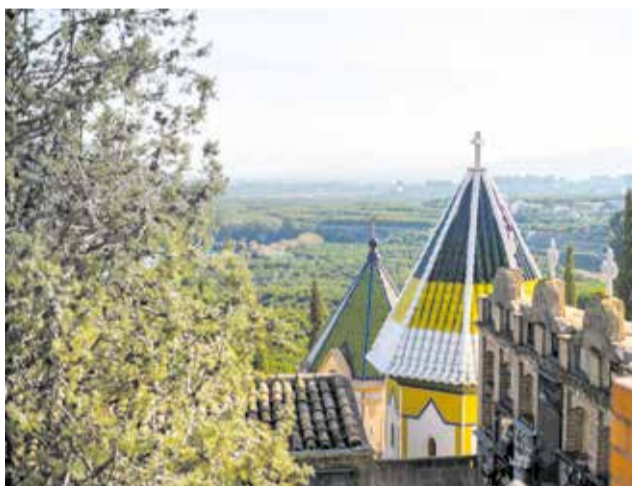
Cementerio Sumcárcer / EPDA