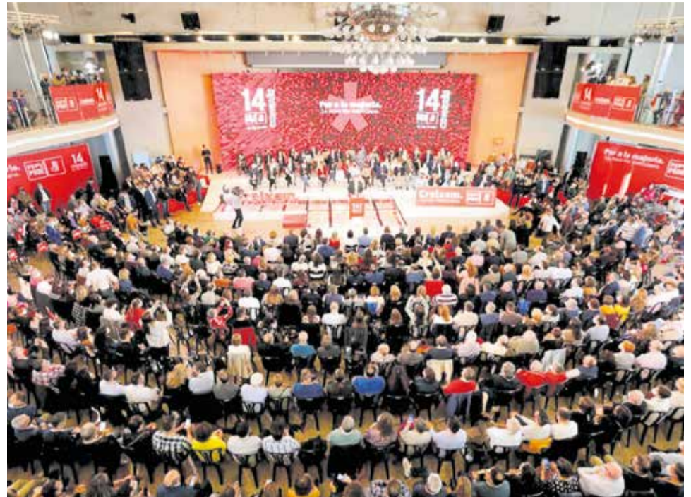
Congreso del PSPV en Benidorm en 2021.