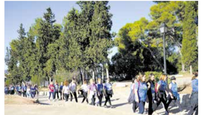
Moment de la marxa

La marxa solidària de 5 quilòmetres ha passat per espais molt emblemàtics de la localitat com ara la muntanyeta