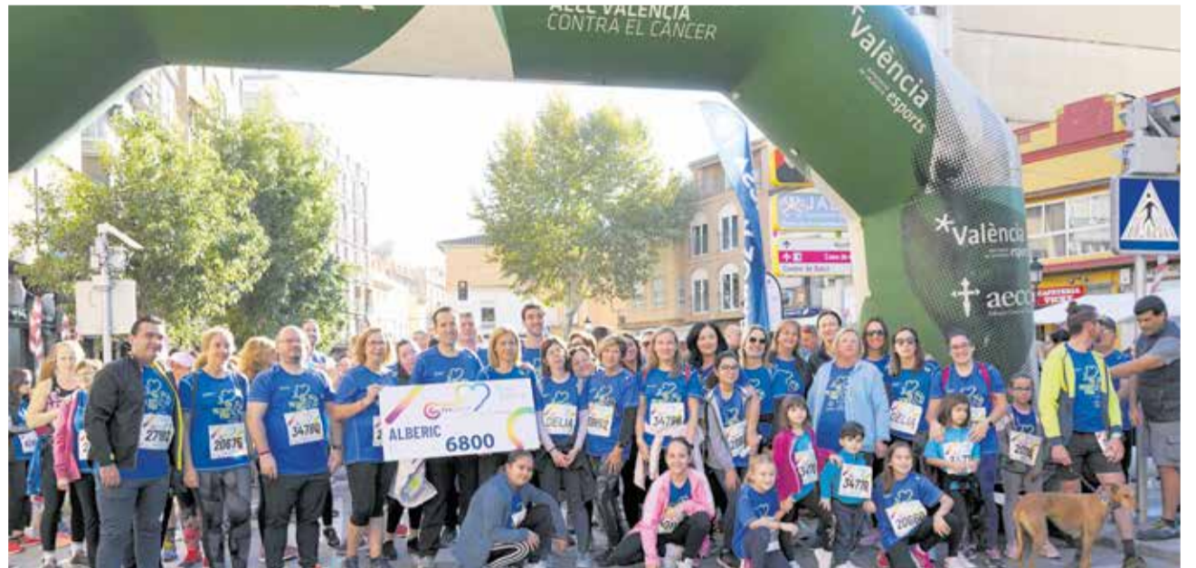
Participants al punt d'eixida de la marxa, amb el xec dels diners recaudats.

la investigació del càncer. Enguany, a Alberic s'han venut 1360 dorsals, el que es tradueix en una recaptació de 6.800 euros. En finalitzar la prova, l'organització va repartir a totes i tots els participants rosquilletes i fruita gràcies a la col·laboració de les empreses Bollo i Anitín. A més, per a tancar el matí es va celebrar una rifa de productes que distints comerços locals van voler donar per a sumar esforços amb la recollida de diners.