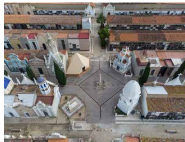
Vista aérea del cementerio de Catarroja.