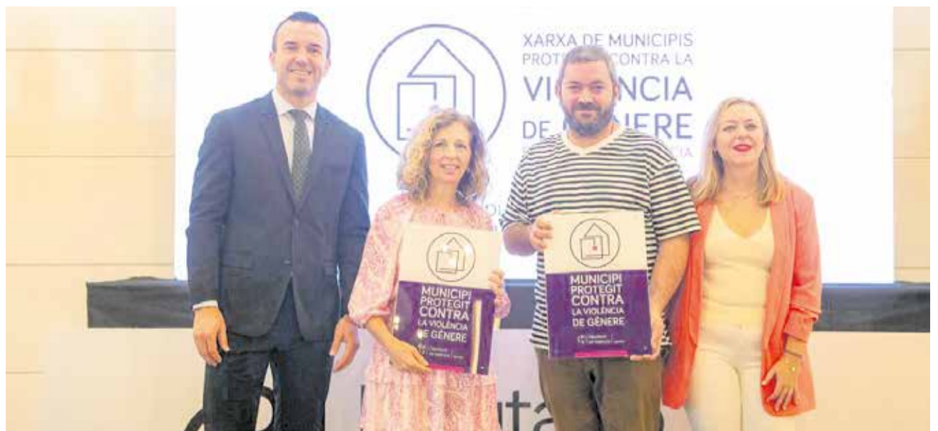
El president de la Diputació, Natalia Enguix i alcaldes de la Ribera Baixa