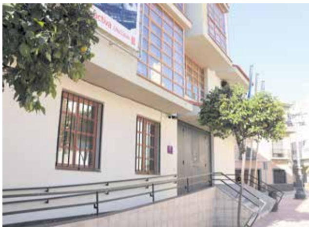
L'Alcúdia a una imatge d'arxiu.

Este projecte finançat per la Vicepresidència Segona i Conselleria de Serveis Socials, Igualtat i Habitatge i pel Sistema Públic Valencià de Serveis Socials és un