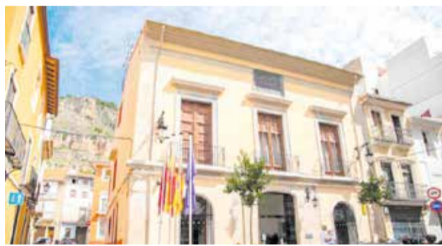
Ajuntament de Cullera. / EPDA

«Seguim amb el full de ruta que iniciem fa huit anys. La nostra prioritat sempre han sigut els veïns i veïnes de Cullera per això mantindrem la inversió social, incrementarem les ajudes a les famílies i a la joventut, i millorarem l'atenció de les nostres persones majors, i tot això, sense pujar els impostos», ha des-