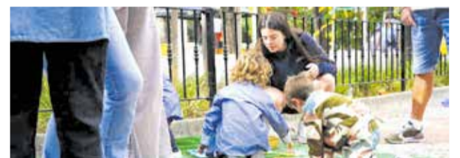
Familias durante la celebración de la jornada

Entre las diferentes actividades que tuvieron lugar, destacaron, manualidades, acciones de fomento de la cultura valenciana, pintacaras i gastronomia. La programación se completó con la representación del sainete valenciano