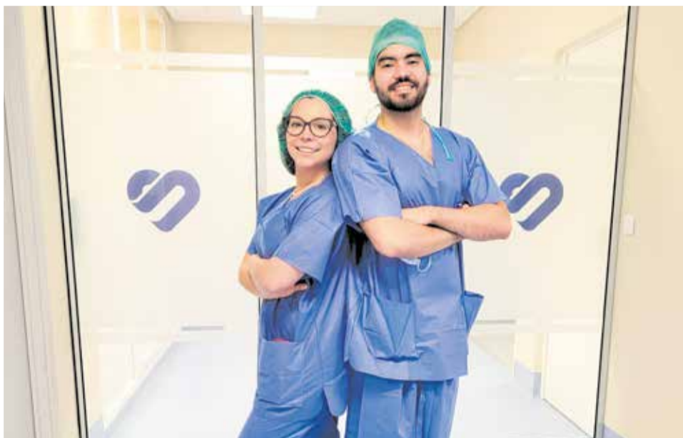
Cirugía capilar HAV. / EPDA

La unidad también realiza mesoterapia capilar. Es un