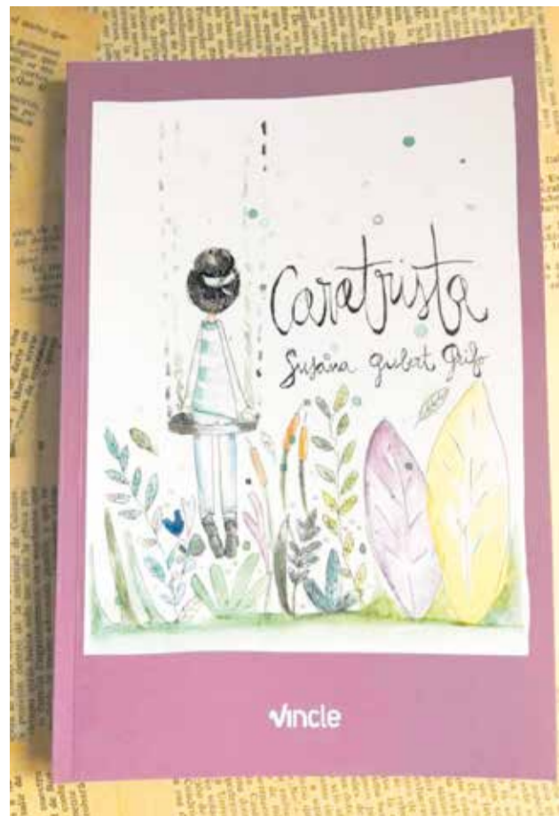
Portada del llibre 'Caratrista'.

En paraules de la fiscal... «Les dones podem ser tan masclistes com els homes. De fet, moltes ho són -o ho som- sense saber-ho, perquè els sesgos masclistes són una cosa que ens han