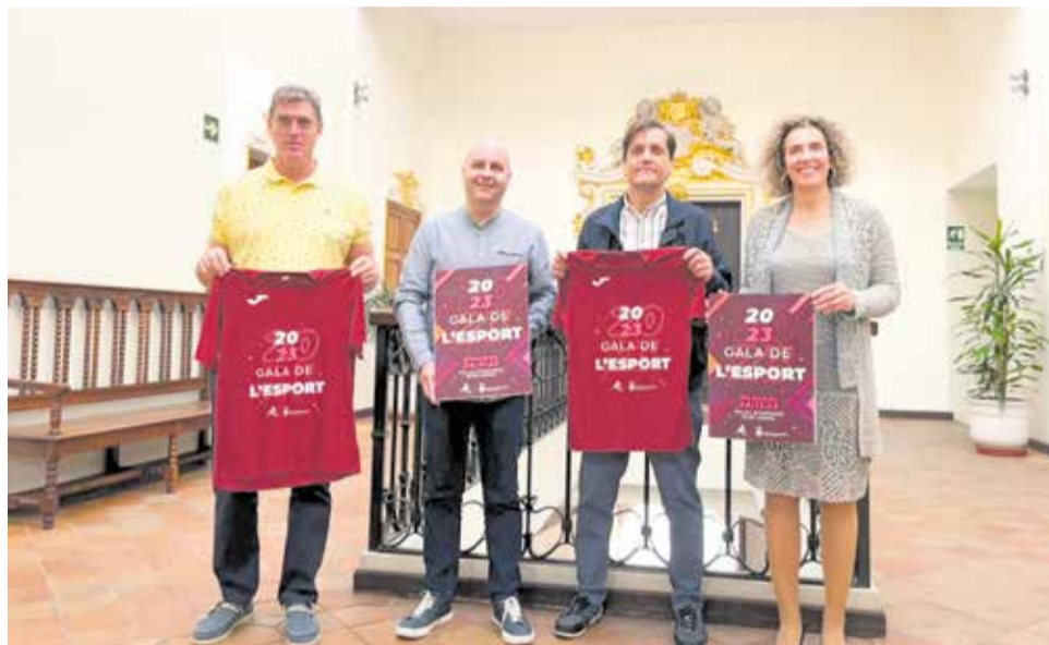
Moment de la presentació de la gala.