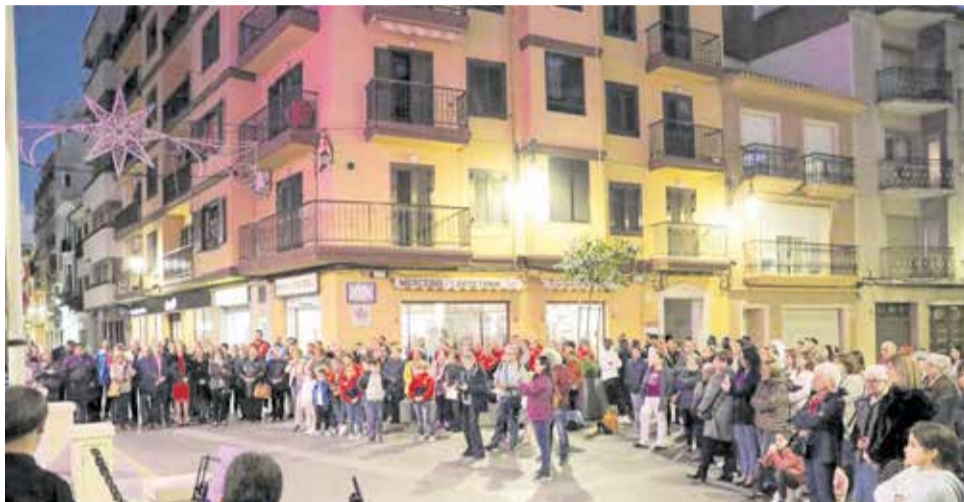
Actes del 25 N de l'any 2022 a Cullera.

«La violència contra les dones i les xiquetes és una de les violacions dels drets humans més esteses, persistents i devastadores del món en l'actualitat. Combatre la discriminació i la desigualtat entre gèneres és la nos-