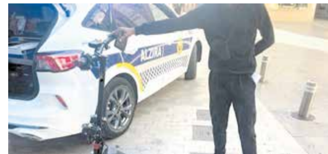
Un dels patinets multats.

sempre és corregir estes actituds incíviques. No podem passar per alt que estos vehicles a més de ser potencialment perillosos per als vianants i els seus usuaris són especialment vulnerables en els accidents amb altres vehicles.