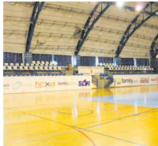
Palau d'esports d'Alzira.