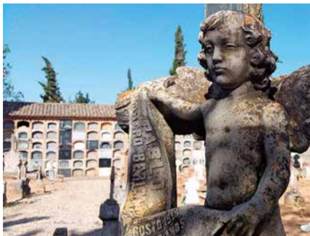
Cementerio de Requena.