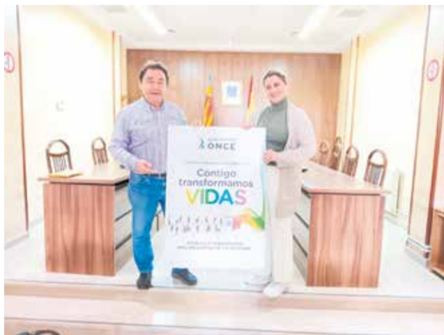
Presentació de l'esdeveniment / EPDA