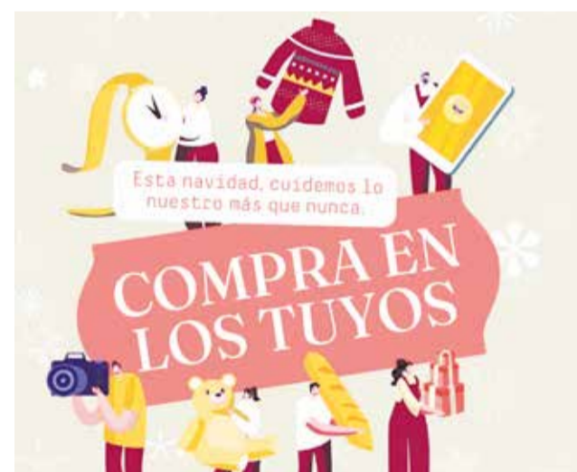
Campanya "en nadal som molt de botigueta"

Llombai afavorix el comerç local amb la campanya comercial "En nadal som molt de botigueta".