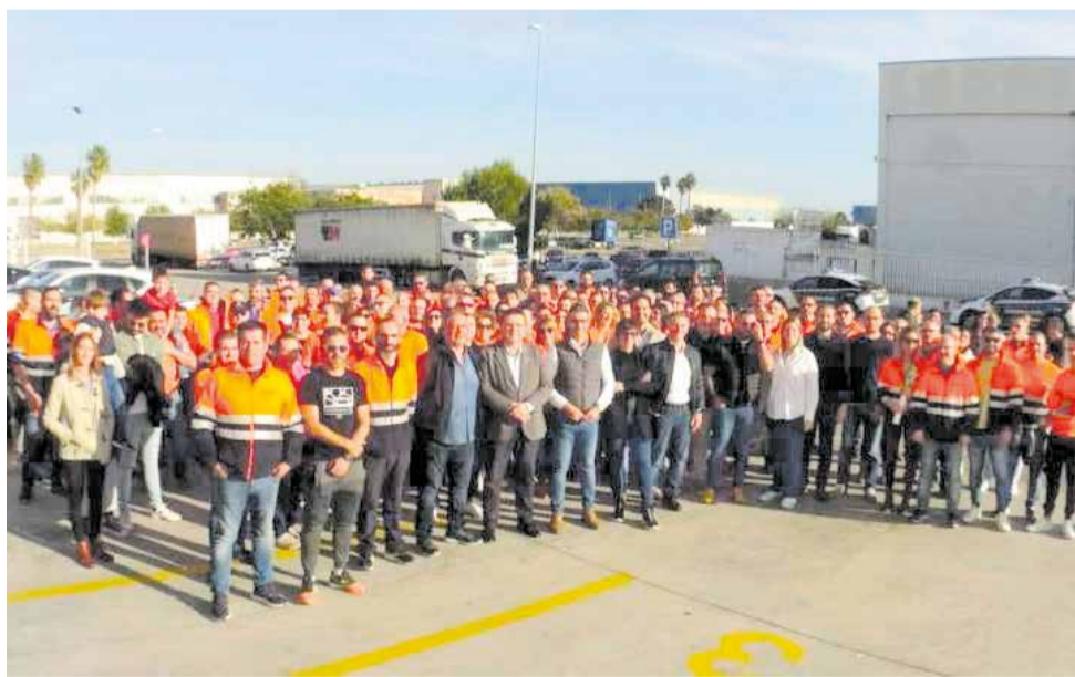
Concentració treballadors Rhenus Automotive.

las puertas de las instalaciones para reclamar una negociación "justa", tras el anuncio de cierre y el despido de los 120 empleados.