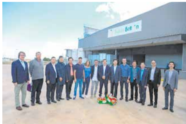
Diferents moments durant la visita a l'empresa fruite Beltrán.

Este encuentre busca establir aliances amb els empresaris locals i facilitar l'exportació arreu del món