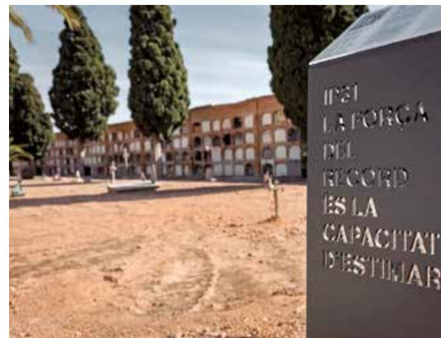
Camposanto de Llíria.

lenciana: el Cementerio Moro. Son las tumbas de numerosos soldados del bando nacional que en la Sierra de El Toro lucharon para rebasar la Línea X,Y,Z y acceder a Valencia en plena Guerra Civil. También murieron soldados republicanos, pero los moros recibieron un trato más digno de sus compañeros victoriosos. Cuentan que los bajaban de la sierra en mulos y dada su creencia religiosa tan sólo se les identificaba con su nombre escrito en un papel y metido en una botella para que aquellas familias que los reclamaban pudieran identificarlos y llevárselos. Pero muchos de ellos no tuvieron esta suerte y quedaron allí, sin memoria ni inscripción alguna, enterrados en el cementerio moro de El Toro. Tan sólo en