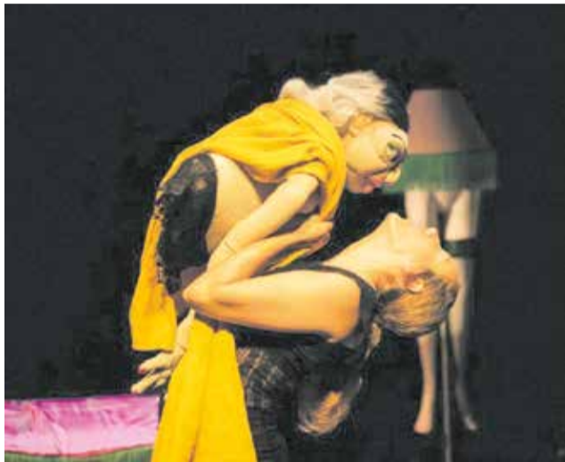
Actuación Odet / EPDA

A continuación, se representarán 'Las malas noches de Amir Shrinayan' en el Centro Cultural Ausias March. Una propuesta de Nigredo y Teatro del Astillero, basada en historias reales, que plasman el precio que pagan los