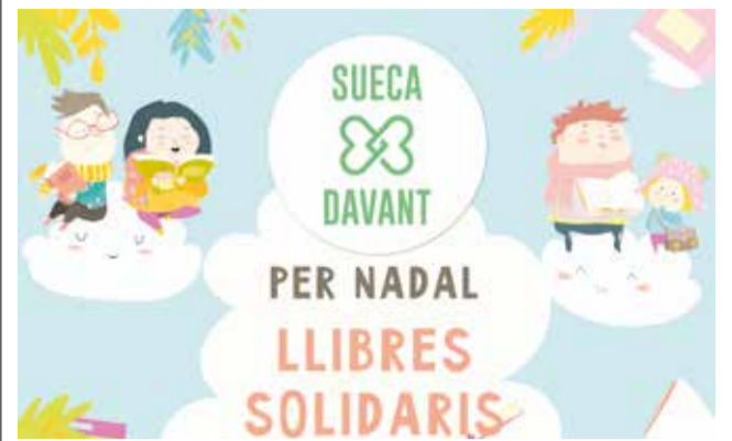
CARTELL LLIBRES SOLIDARIS.