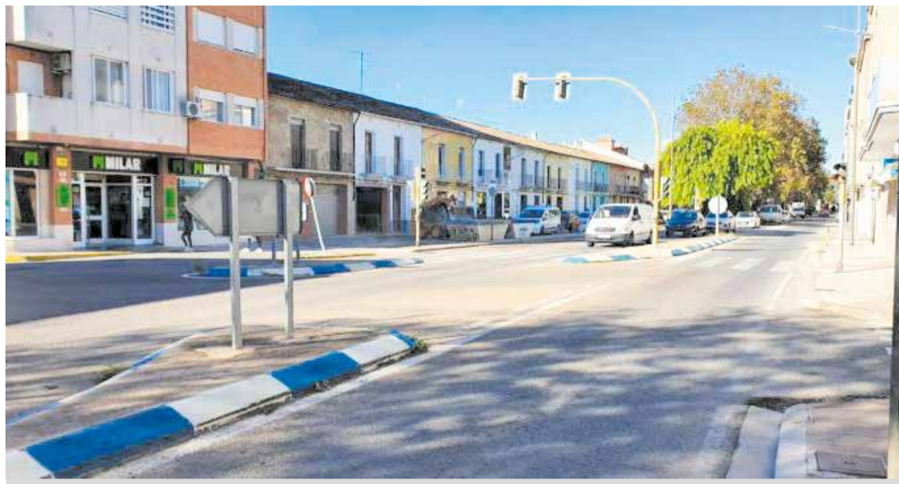
Tram de la carretera nacional N-332 al seu pas per Sueca