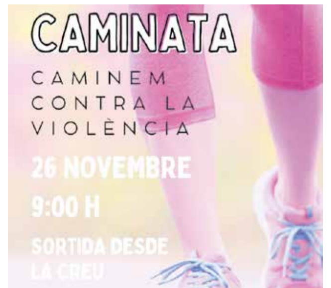
Cartell de la caminata.

La Xarxa de Municipis Protegits de la Diputació de València compta ja amb 211 ajuntaments adherits