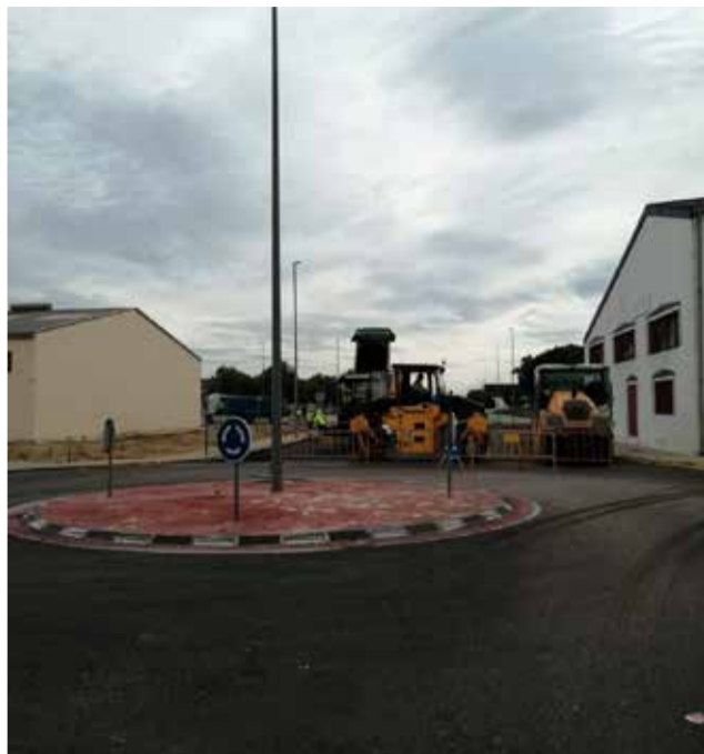
Les màquines treballen en la zona.