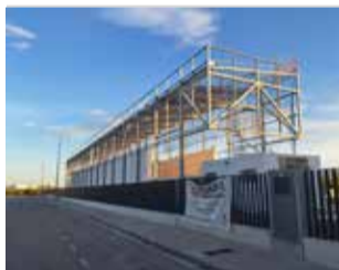
La coberta. / EPDA