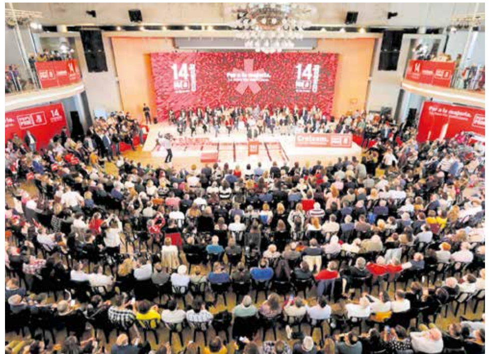
Congreso del PSPV en Benidorm en 2021.