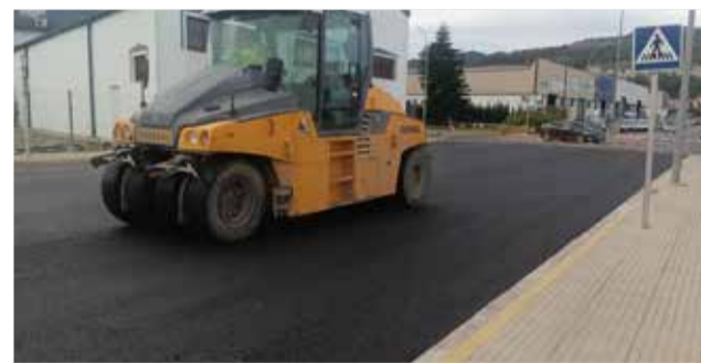
Les actuacions d'asfaltat dels carrers.

la nostra població, ja que genera economia i ocupació".