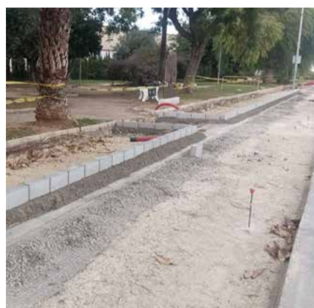
El projecte contempla una ruta saludable.

Esta és una manera d'adaptar-se a les necessitats actuals de les empreses del municipi i que conviden a millorar les condicions per a implantar-se a la zona industrial del Real de Gandia.