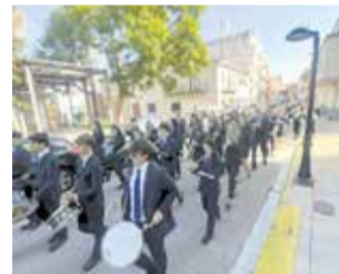
El passacarrer.