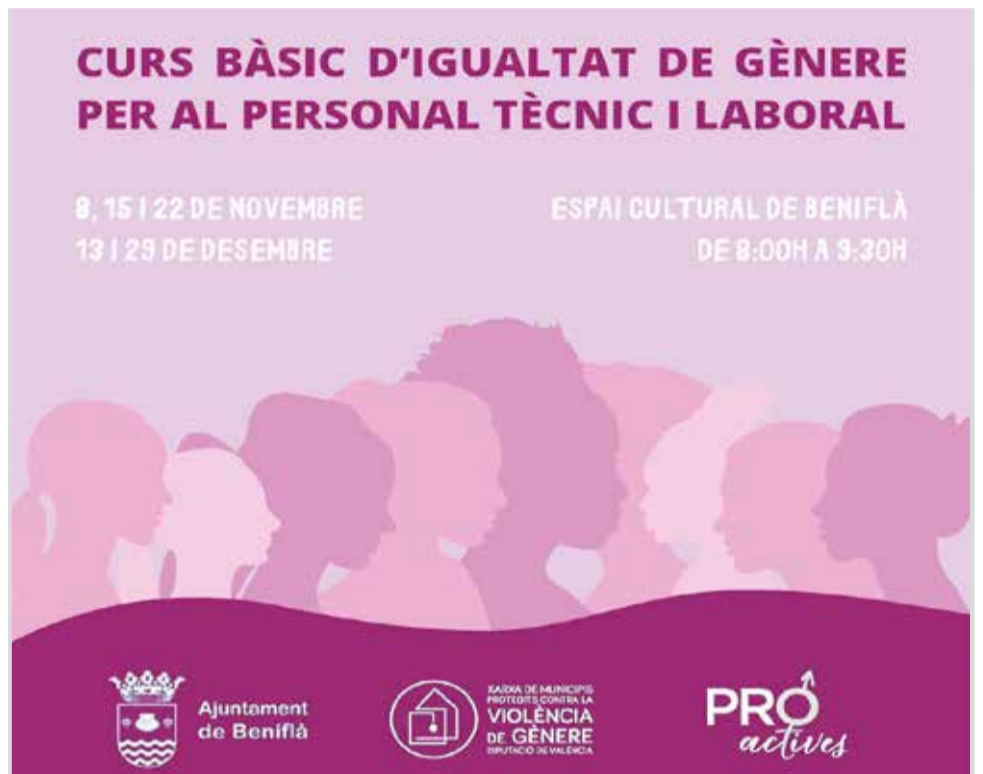
Curs d'igualtat de gènere per al personal tècnic i laboral / EPDA

El president Mompó va lamentar les 3.109 víctimes de violència de gènere registrades a la província en el segon trimestre de 2023, "dades molt preocupants que demostren que esta xacra social, mereix una resposta contundent.