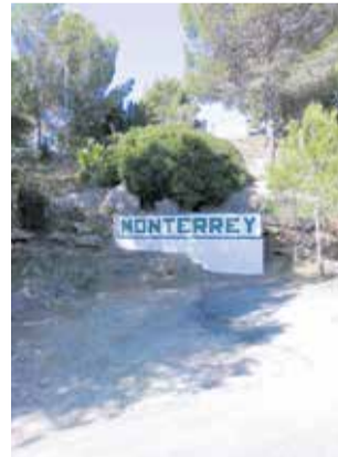
Entrada a Monterrey.

Mascarell dona les gràcies als veïns, Ajuntament, Diputació de València i Generalitat, ja que això ha sigut possible amb la inversió de