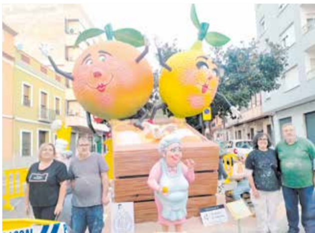
Diferents instants durant el primrredrà.