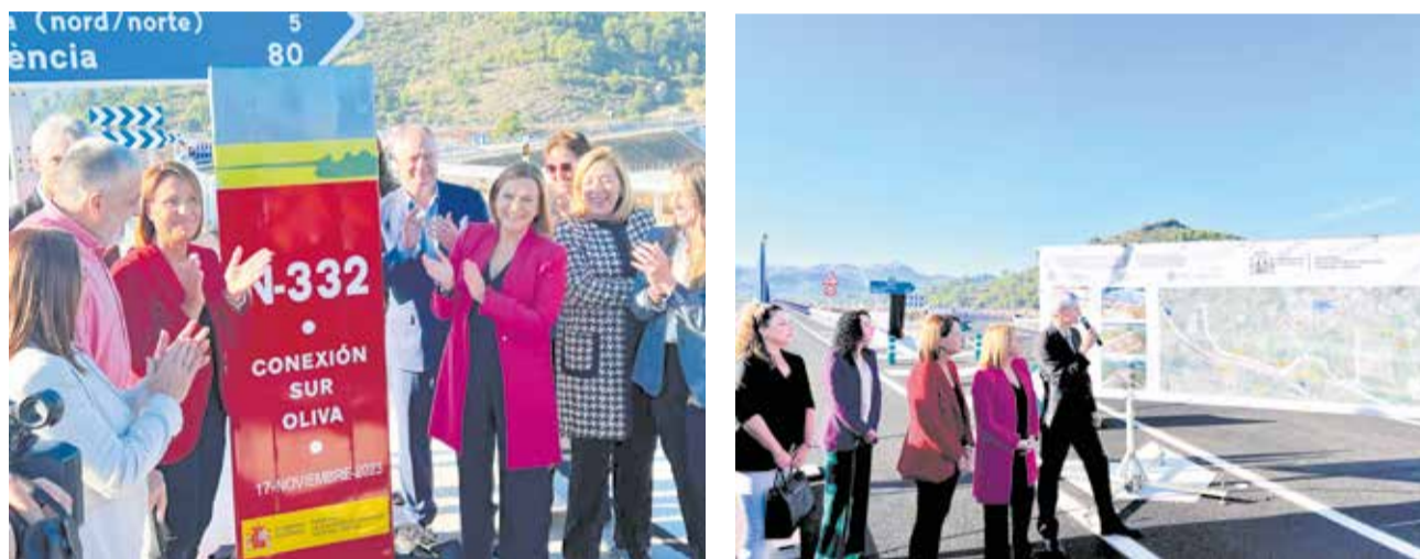
Diferentes instantes de la presentación de la apertura de la Conexión Sur de Oliva.