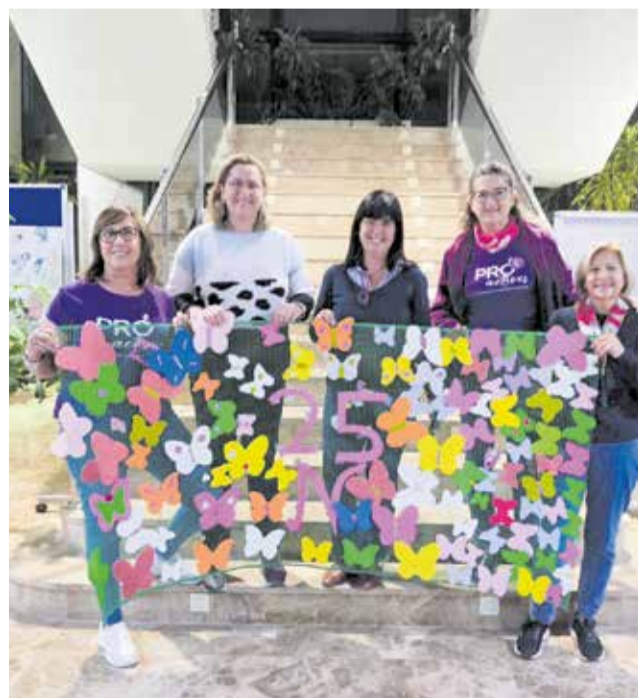
Les regidores amb el tapís de papallones.

D'altra banda, l'Ajuntament de Benirredrà va organit-