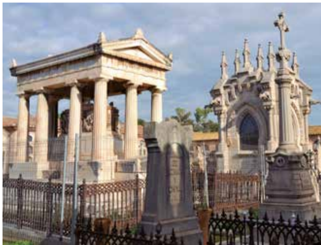
Cementerio General de Valencia.