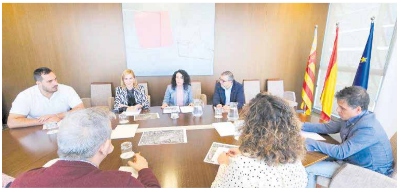
Un dels moments de la reunió amb la consellera de Medi Ambient i la Directora general d'Infraestructures.

El govern local ha demanat amb urgència esta actuació per millorar la seguretat viària a Tavernes de la Vallidigna, a més de guanyar qualitat de vida, ja que farà possible alliberar de contaminació el nucli urbà, que suporta el pas entre 12.000 i 14.000 vehicles diaris. Es tracta d'una reivindicació històrica que ja disposa del projecte bàsic i de la declaració d'impacte ambiental, i que espera que la