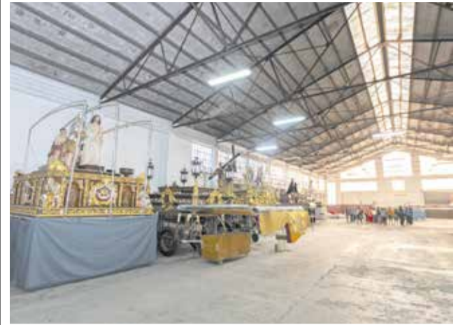
Futur Museu de la Setmana Santa de Gandia / A.O.