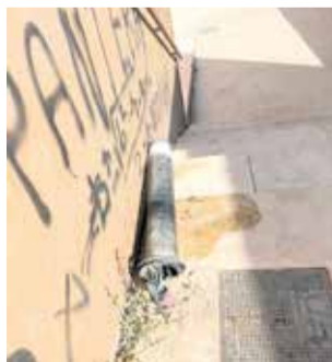
Estado actual del mirador del Serpis de Gandia.

mo un ambiente poco saludable, aumento de la delincuencia y una mala imagen para los gandienses y nuevos turistas.