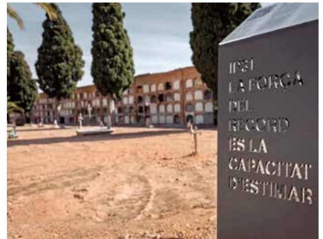
Camposanto de Lliria.

de El Toro lucharon para rebasar la Línea X,Y,Z y acceder a Valencia en plena Guerra Civil. También murieron soldados republicanos, pero los moros recibieron un trato más digno de sus compañeros victoriosos. Cuentan que los bajaban de la sierra en mulos y dada su creencia religiosa tan sólo se les identificaba con su nombre escrito en un papel y metido en una botella para que aquellas familias que los reclamaran pudieran identificarlos y llevárselos. Pero muchos de ellos no tuvieron esta suerte y quedaron allí, sin memoria ni inscripción alguna, enterrados en el cementerio moro de El Toro. Tan sólo en la puerta de entrada, una inscripción en árabe deja constancia de sus tumbas.