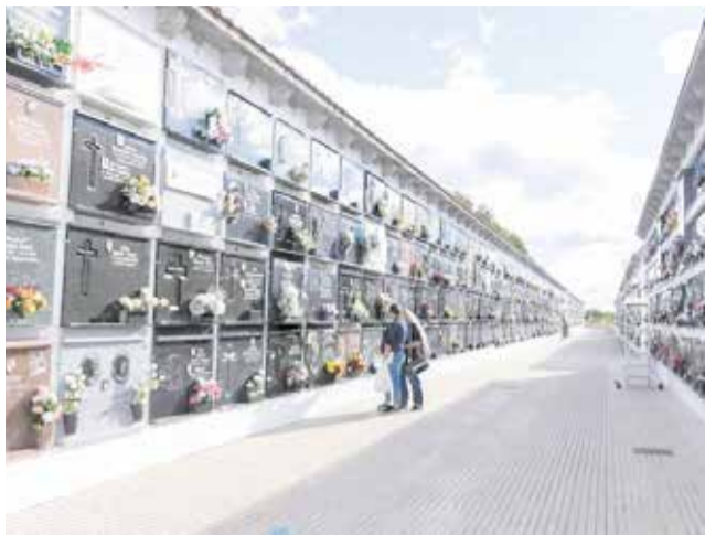
Dos personas en el cementerio de Gandia.