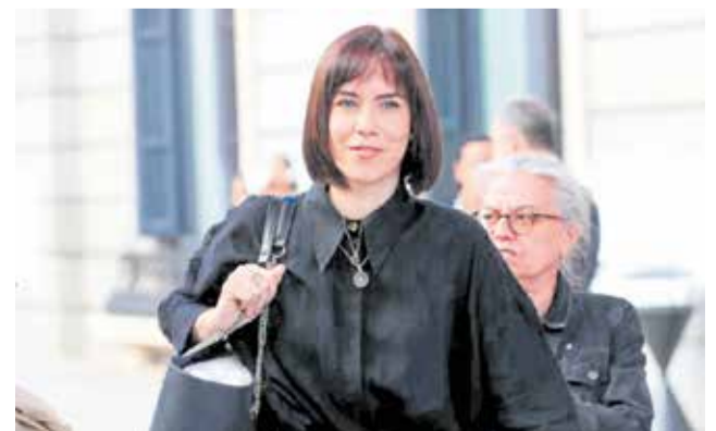
La ministra Diana Morant en una imagen de archivo.

Otro de sus principales objetivos es que la inversión a las universidades alcance al menos el equivalente al 1% del PIB en 2030 - hoy en el 0,7%.