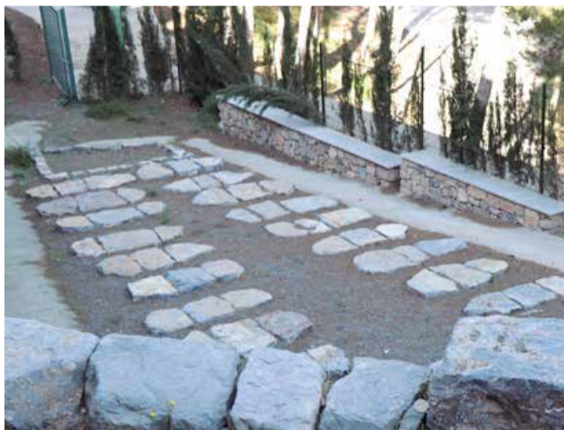
Cementerio judío de Sagunt.

También destacar, la zona de los caídos, erigido tras la Guerra Civil para albergar a religiosas monjas y seglares. O enterrados en tierra como a la antigua usanza, y para acabar encontramos el osario de los republicanos, ciudadanos que lucharon por sus ideales.