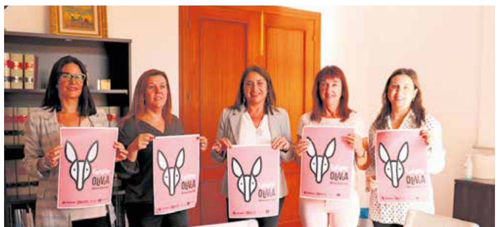
Imatge d'arxiu del programa «Tardor Oliva» 2022