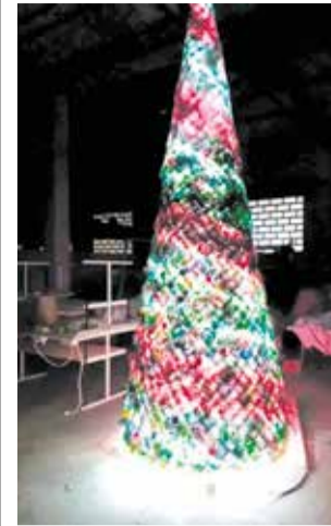
Arbre de nadal fet amb punt de ganxo.