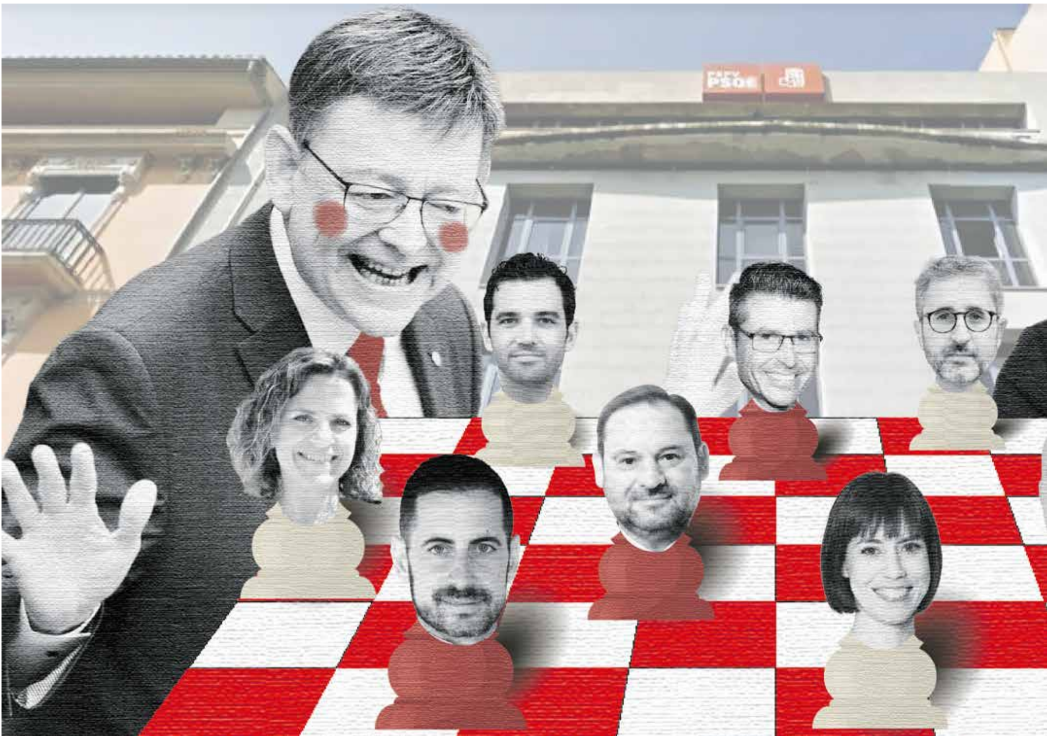
Ximo Puig y Pedro Sánchez juegan una partida de ajedrez en la sede del PSOE en un tablero en el que se representan algunos líderes socialistas de primer orden, entre ellos alca