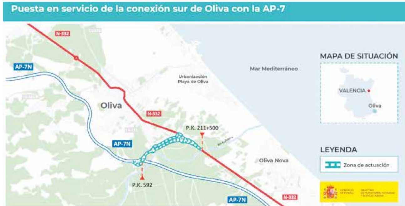
Mapa de situación de la nueva conexión de la carretera N-332 con la AP-7.