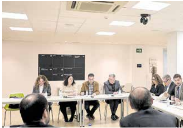
Reunió del Fòrum Econòmic i Social de Gandia

Un altre dels punts que s'han abordat són les línies