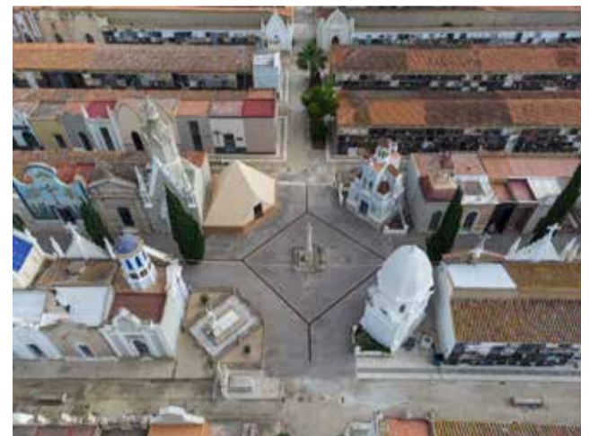
Vista aérea del cementerio de Catarroja.