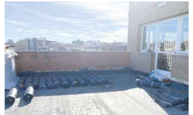
Obres coberta Centre Cultural Enric Valor.

Donada l'àmplia extensió de la zona a actuar, 1.665,15 m2, les obres es duran a terme en dues fases. La primera consistix en la reparació de la coberta del pati de butaques, la segona fase tindrà la seua actuació de millora en la repara-