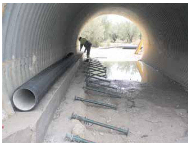
Obres per a l'abastiment d'aigua potable / EPDA

Una vegada obtinguts els resultats analítics i l'aprovació del Departament de Salut Pública de Manises s'ha confirmat l'aptitud de l'aigua i, per tant, a partir d'ara, aquesta passa a identificar-se com aigua potable apta per al consum.