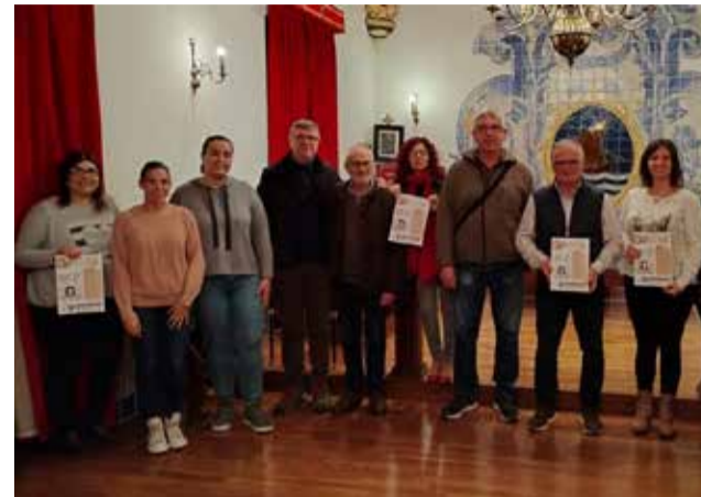
Acte de cloenda de la Trobada de Centres / EPDA