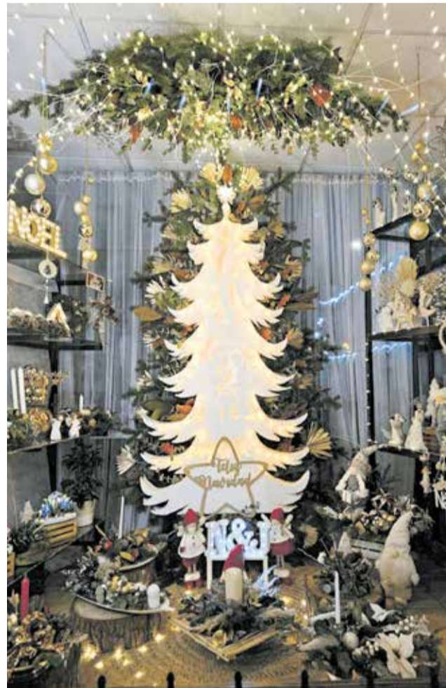
Primer premi aparadors 'El Jardí de Neus i Javi'.