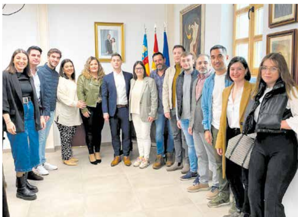
Foto de grup el dia de la toma de posesió en l'Ajuntament.