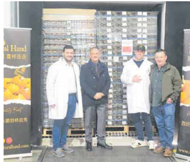
Moment de l'enviament dels caquis a Xina