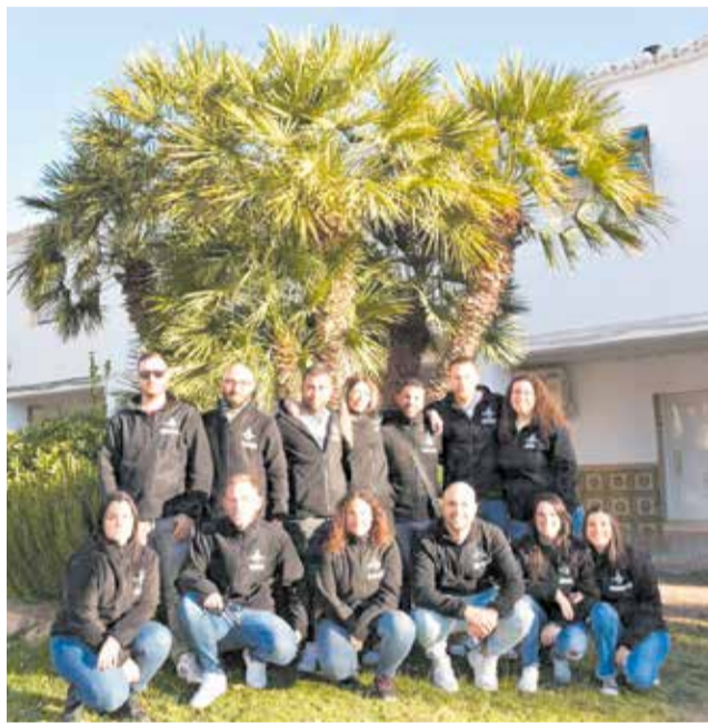
Clavarios de San Antón 2024 de Marines.

El sábado de 10 a 14 horas se celebrará una gran Fiesta Infantil en la Plaza del Ayuntamiento. A las 12 horas, el Grupo de Danzas "El Fascar" actuará en la Plaza Hermano Vicente Coll y a continuación habrá un aperitivo para los asistentes. A las 19:30 horas tendrá lugar la Solem-