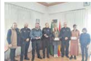
Recepción. / EPDA