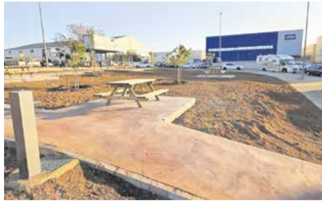
Área de descanso en el polígono de Loriguilla.