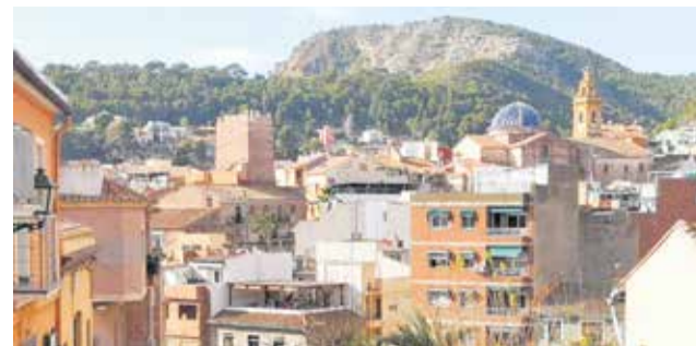
Vista del municipi de Serra.