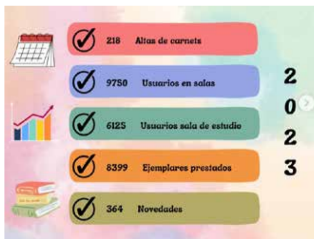
Balance de la Biblioteca Municipal de Benaguasil.

Otro dato muy significativo es que un total de 6.125 personas han hecho uso de la sala de estudio, un espacio funcional y adecuado a las necesidades de los estudiantes que la frecuentan.