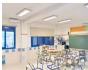
Aula en Benissanó.