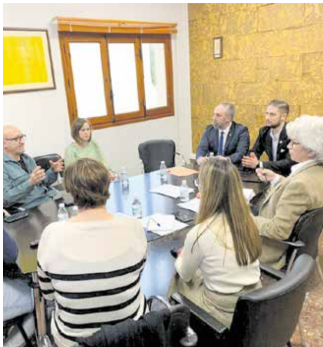
Varios instantes durante la reunión celebrada en el ayuntamiento de Náquera.

La reunión sirvió como plataforma para exponer en