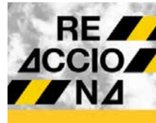
Plan Reacciona.

La actuación de sustitución de red de fibrocemento es una fase más de las que el Ayuntamiento ha ido realizando a lo largo de los años con el objetivo de eliminar totalmente los tramos que aún quedan en el municipio y sustituirlos por otros materiales, generalmente polietileno de alta densidad.