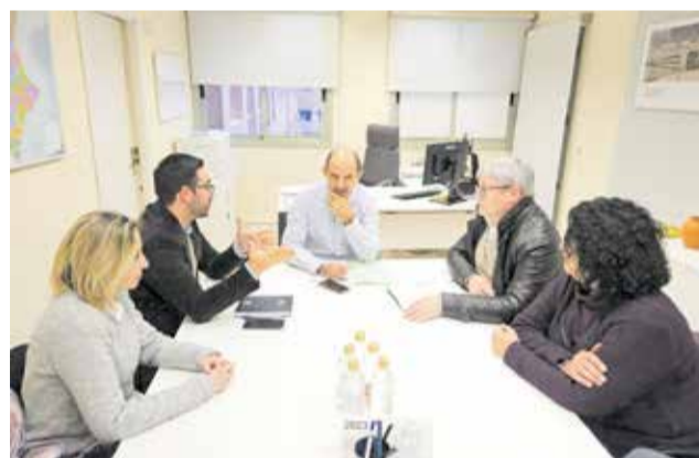
Reunión en la Conselleria de Educación.