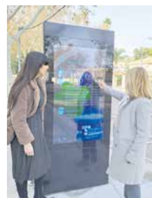
Tótem interactivo.

Estos tótems interactivos son un sistema informativo y publicitario, que permite al visitante apreciar de ma-