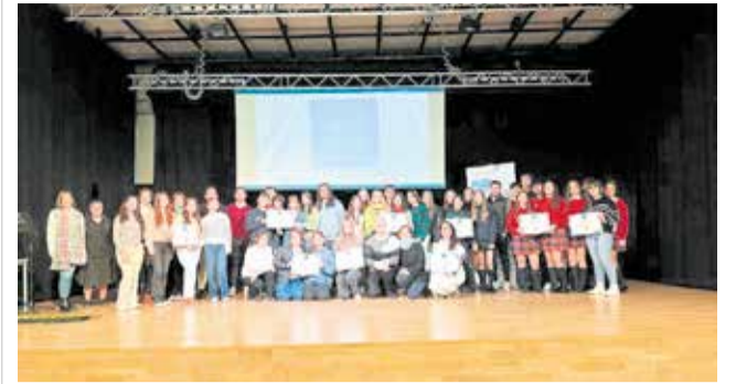
Final del proyecto europeo 'Girls4Tech' en Puçol.