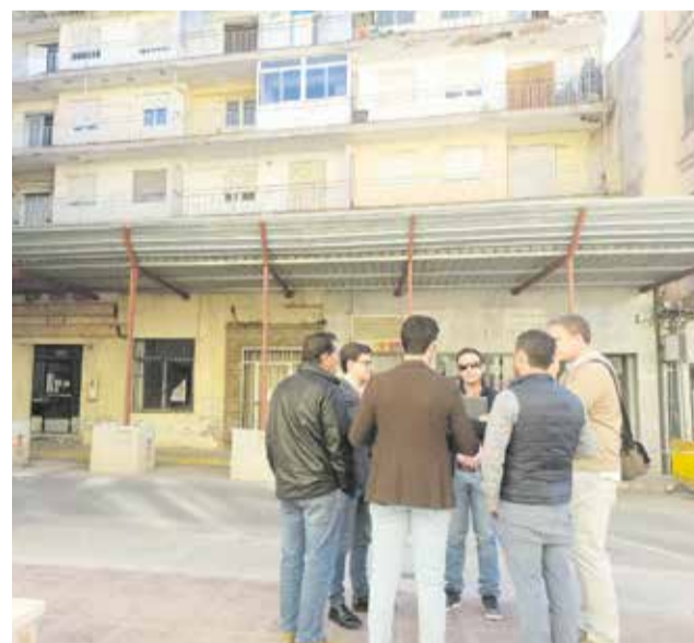
Reunión técnica previa a la demolición ante el edificio de 'la Cens' de la Pobla de Vallbona.

Los trabajos desde los despachos del consistorio se han acelerado en los últimos me-