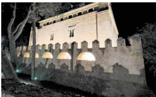
El Castell de Benissanó amb la nova lluminària.