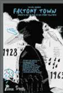
FICCIÓN SONORA FACTORY TOWN

Feria Internacional de Turismo DEL 24 AL 28 DE ENERO 2024