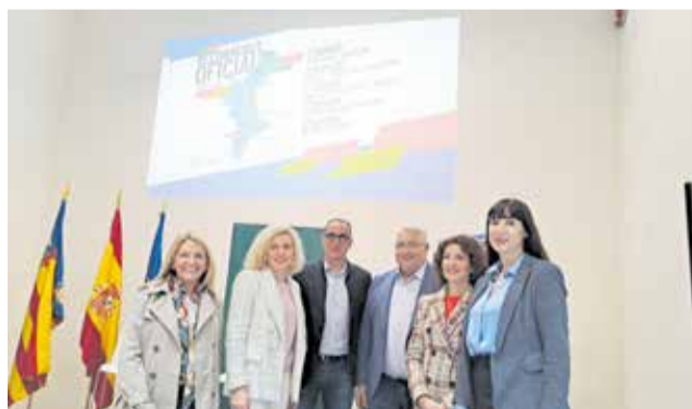
Rueda de prensa de la VCV de la Diputación.