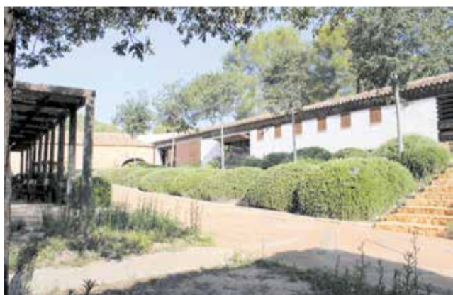
Albergue Bassa Barreta de Vilamarxant.