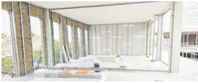
Estado actual del nuevo colegio de Loriguilla.

El pavimento antideslizante de las zonas expuestas a la lluvia también se ha avanzado, así como la prueba de la perfilera de las ventanas y el sate del sistema aislante exterior de la fachada.