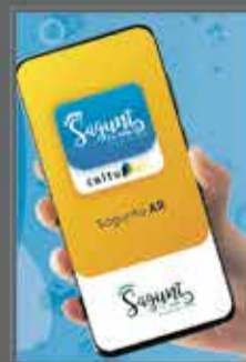
APP MOVIL REALIDAD AUMENTADA