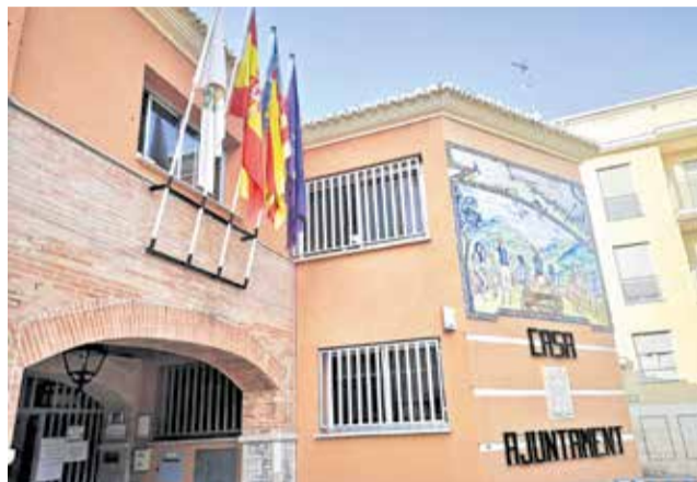
Façana de l'Ajuntament de Serra.

La millora del servei començarà notant-se a les partides de neteja viària i manteniment dels espais i infraestructures que augmenten en un 567 % respecte de l'any anterior, fins als 196.000 euros. La substitució del conveni de col·laboració amb la Societat Civil de Pro-