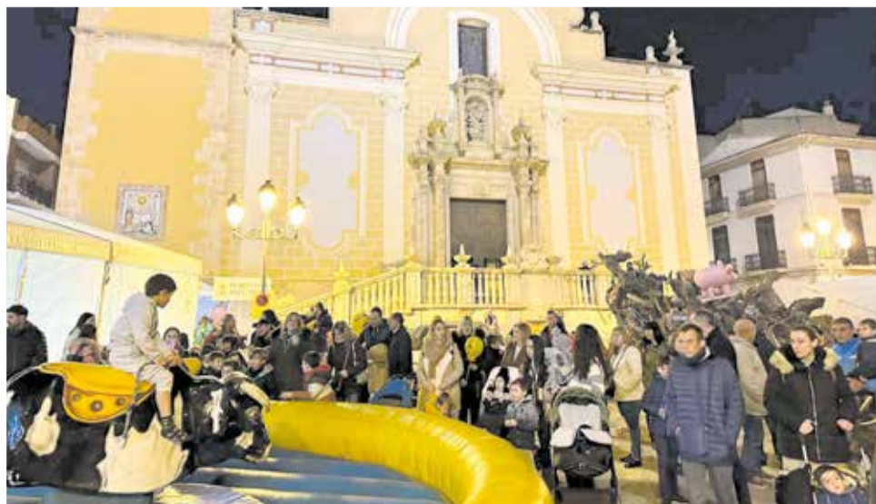
Diferentes actos de la festividad de San Antonio Abad 2024 en Benaguasil, organizados por la Clavaria y el Consistorio.