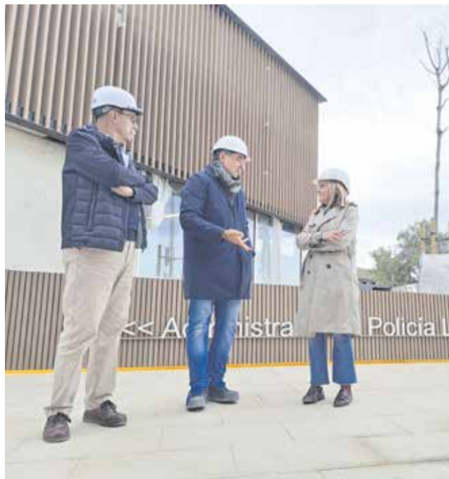
Visita a las instalaciones del nuevo Centro Cívico de Bétera para conocer el estado de las obras.

Un espacio abierto a la ciudadanía que permitirá al Consistorio ofrecer un servicio público, cercano y de calidad. Ya que Bétera está en continuo auge poblacional y en cuestión de 4 años ha dado un importante giro demográfico llegando a sobrepasar ya los 27.500 habitantes.