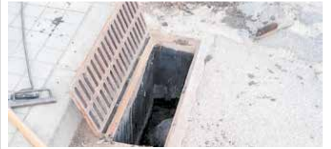
Trabajos de limpieza en San Antonio.