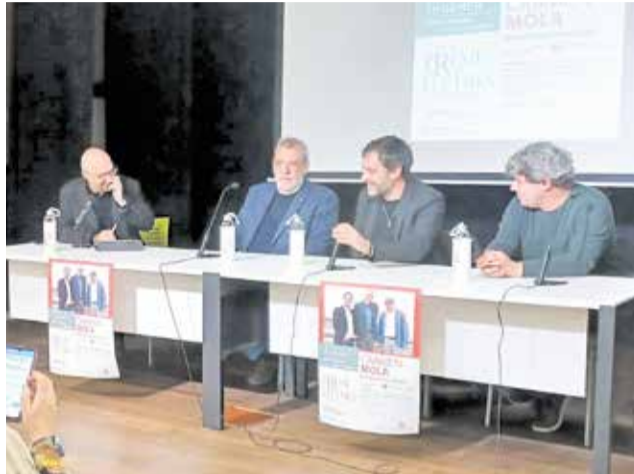
VII Premi de les Lletres de l'Eliana.

Prop de 200 persones es van donar cita per a gaudir d'una trobada cultural amb els autors de la 'La novia gitana', 'El infierno' o el thriller històric 'La Bestia', amb el qual es van alçar amb el Premi Planeta 2021. La primera de les seues novel·les, publicada l'any 2018, va inaugurar la sèrie de la inspectora Elena Blan-