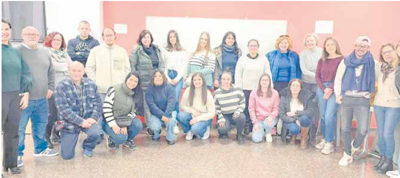
Participantes en los nuevos talleres de empleo del Ayuntamiento de Casinos.

El pasado viernes 12 de enero empezaron los talleres de empleo que, en el ámbito de la creación y diseño de páginas web, como en el de la administración, formarán a veinte vecinas y vecinos de la localidad. Por tercer año consecutivo, Casinos obtiene talleres de empleo para fomentar formación remunerada en sectores de alta empleabilidad. Como ha explicado el alcalde de la localidad, Miguel Navarré, "los talleres de empleo en Casinos tienen una elevada demanda, puesto que el sector de las nuevas tecnologías es clave en la formación de personas que o bien estando desempleadas, o bien a través de una mejora de empleo, quieren mejorar su formación para luego aumentar las posibilidades de insertarse en el mercado laboral, que de por sí es muy competitivo".