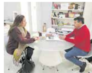
Reunión. / EPDA