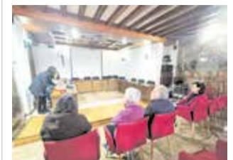
Sorteig. / EPDA