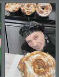
CORONA SAGUNTINA CHOCOMEL