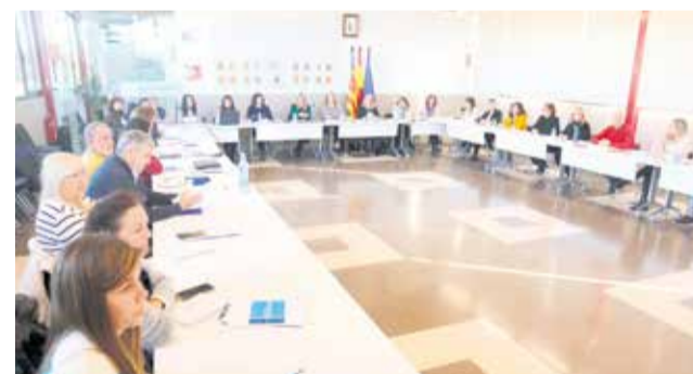
Consell d'Inclusió i Cohesió Social.

El Departament de Promoció Econòmica i Ocupació també va compartir les accions realitzades en consonància amb les línies estratègiques del pla de 2023-2026.