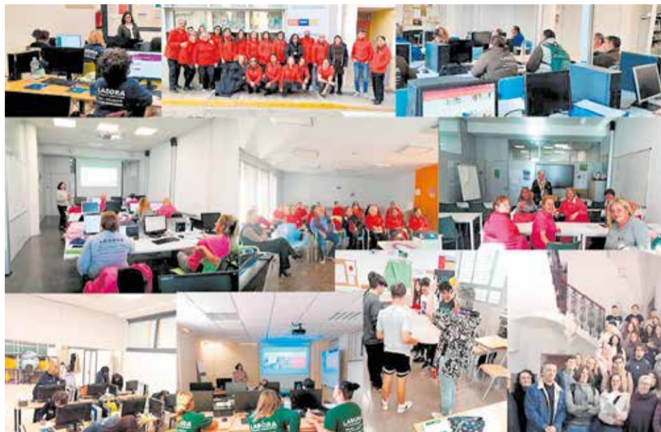
Diferents iniciatives del PACTE Camp de Túria de la Mancomunitat.

Este esforç es reflecteix en els Tallers d'Emprenedoria per a Ajuntaments, on s'impartixen coneixements clau sobre com iniciar i desenvolupar projectes d'èxit en col·laboració. Es-