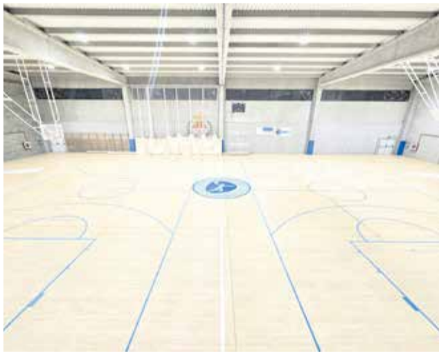
Pabellón Municipal de Loriguilla.

La inversión realizada asciende a 9.310,10 euros (iva incluido), e incluye el control lumínico por un módulo Gateway y tecnología Zigbee, permitiendo así iluminar la pista con tres potencias (200W, 100W, y una intensidad menor para labores de mantenimiento o limpieza). Además, un mapa de seis es-