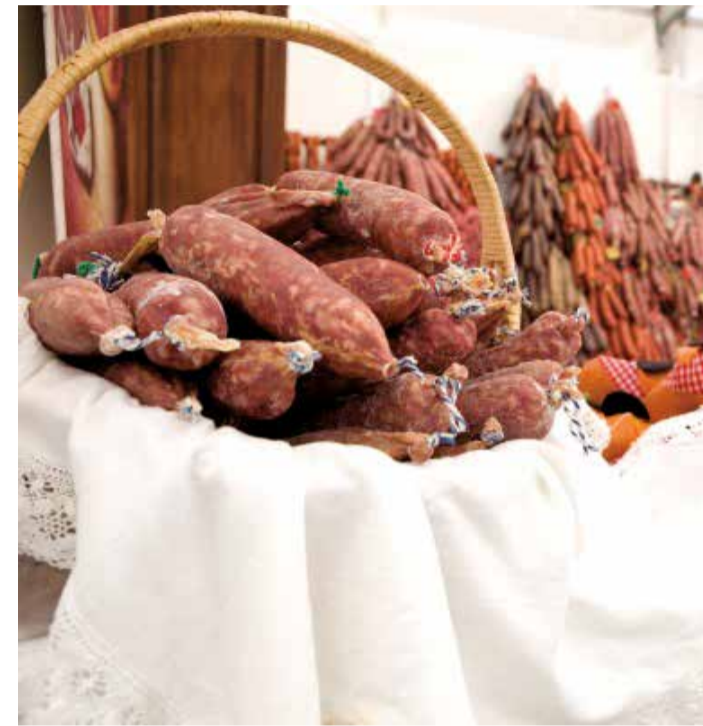
La feria del embutido de Requena.

El proyecto se enmarca dentro del Plan Agrícola Municipal de la Concejalía de Defensa de la Huerta y Fomento de la Actividad Agrícola de Raquel Casares, una guía puesta en marcha en el año 2020 en colaboración con los propios agentes agrícolas de Alboraya con el fin de visibilizar su trabajo, dar respuesta a sus necesidades y gestionar ayudas orientadas a mejorar su actividad.