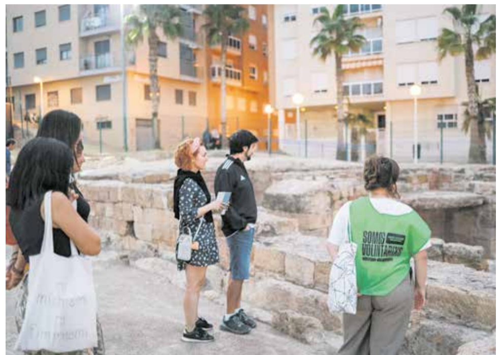
Visita a las Termas romanas en el Open House Valencia.