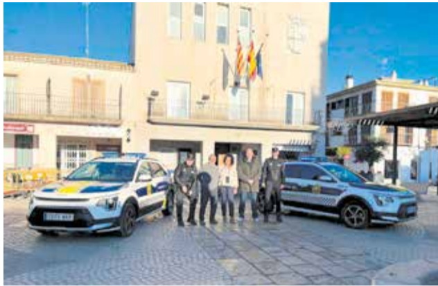
Nuevos vehículos de la Policía Local.

Esta acción se enmarca dentro del programa de actuaciones previstas para incrementar la seguridad en San Antonio de Benagéber y