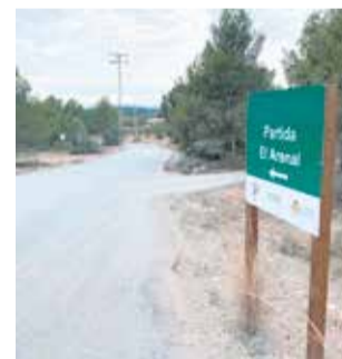
Cordel de la Garrofera.

Entre las actuaciones que se han llevado a cabo, están el arreglo de la vía con zahorra compactada y la posterior pavimentación con un Doble Tratamiento Superficial (DTS), la ampliación del tramo para