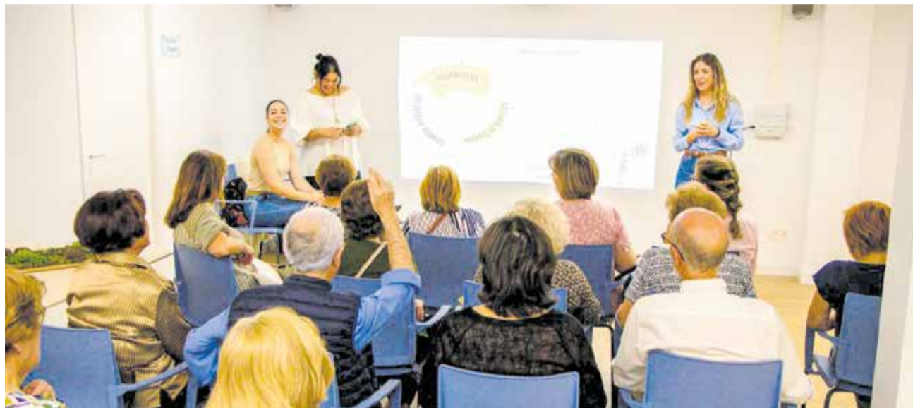
Participantes en una charla sobre salud mental en Benaguasil.

Se trata de una iniciativa puesta en marcha por el