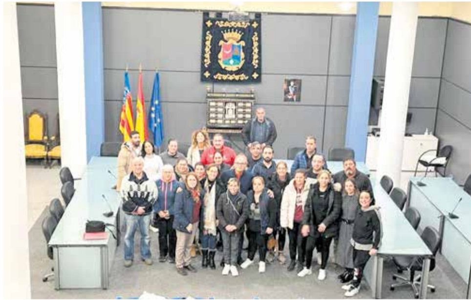
El alcalde recibe a los participantes en el taller 'Benaguasil Sostenible IV'.

El taller de empleo está integrado por 10 alumnos trabajadores de la especialidad de jardinería y 10 alumnos trabajadores de la especiali-