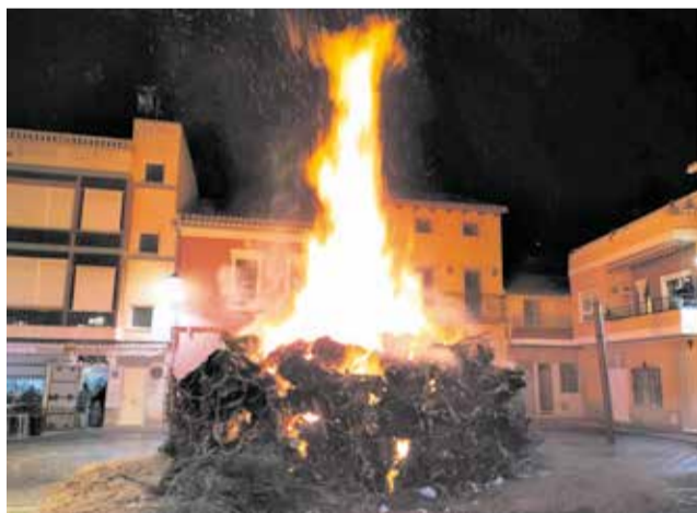
Hoguera de San Antón en Olocau en 2023.