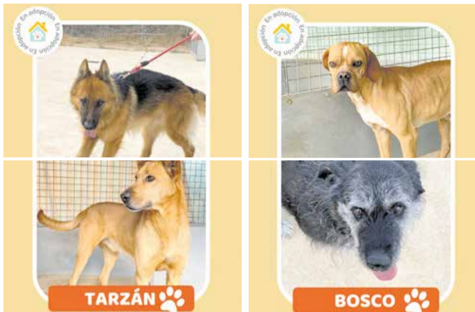
Los perros que se encuentran en adopción.

to muy agitado y enérgico. De este modo, desde el Ayuntamiento de Ayora pretenden ayudar a las mascotas que se han quedado sin dueño, que necesitan cuidados y un nuevo hogar.