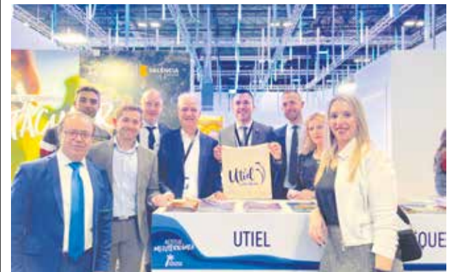
Stand de Utiel en Fitur.