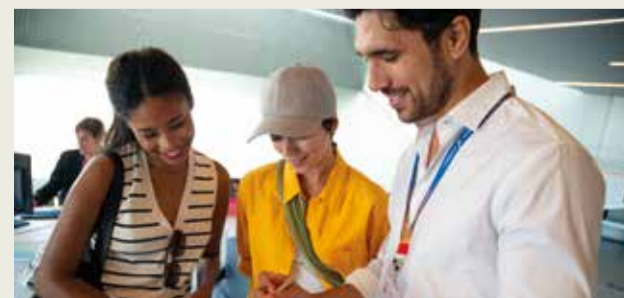
Professionals del sector turístic. / EPDA