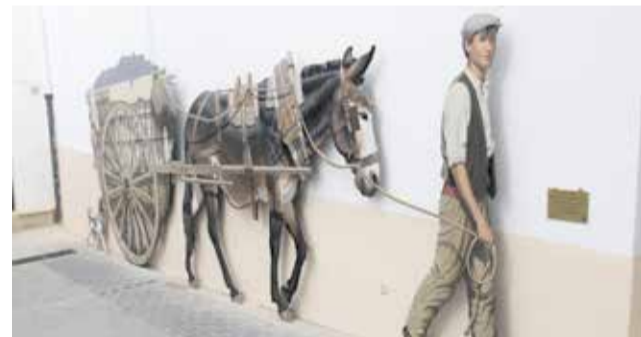
Escultura donada a la ciudad de Utiel.