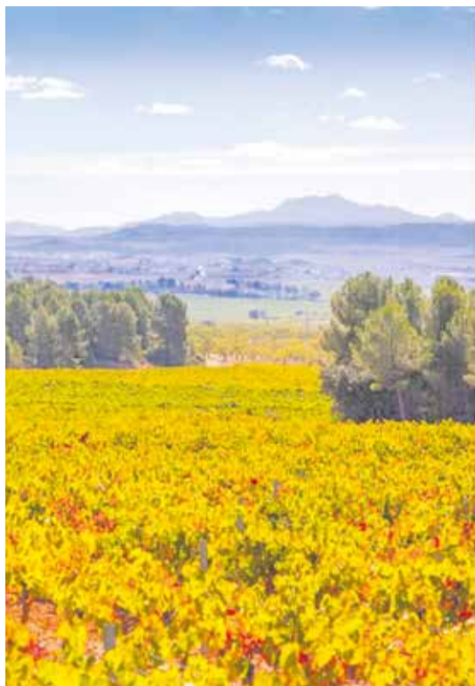
Plan de Sostenibilidad Turística en Destino Tierra Bobal.

En el Eje 2, Movilidad sostenible e itinerarios accesibles, se ha finalizado el proyecto técnico para facilitar la accesibilidad para personas con diversidad funcional y visual de nueve miradores de Tierra Bobal (uno por municipio) con la instalación de una rampa que permita el acceso a sillas de ruedas hasta el lugar de los paneles interpretativos, un panel adaptado a la diver-