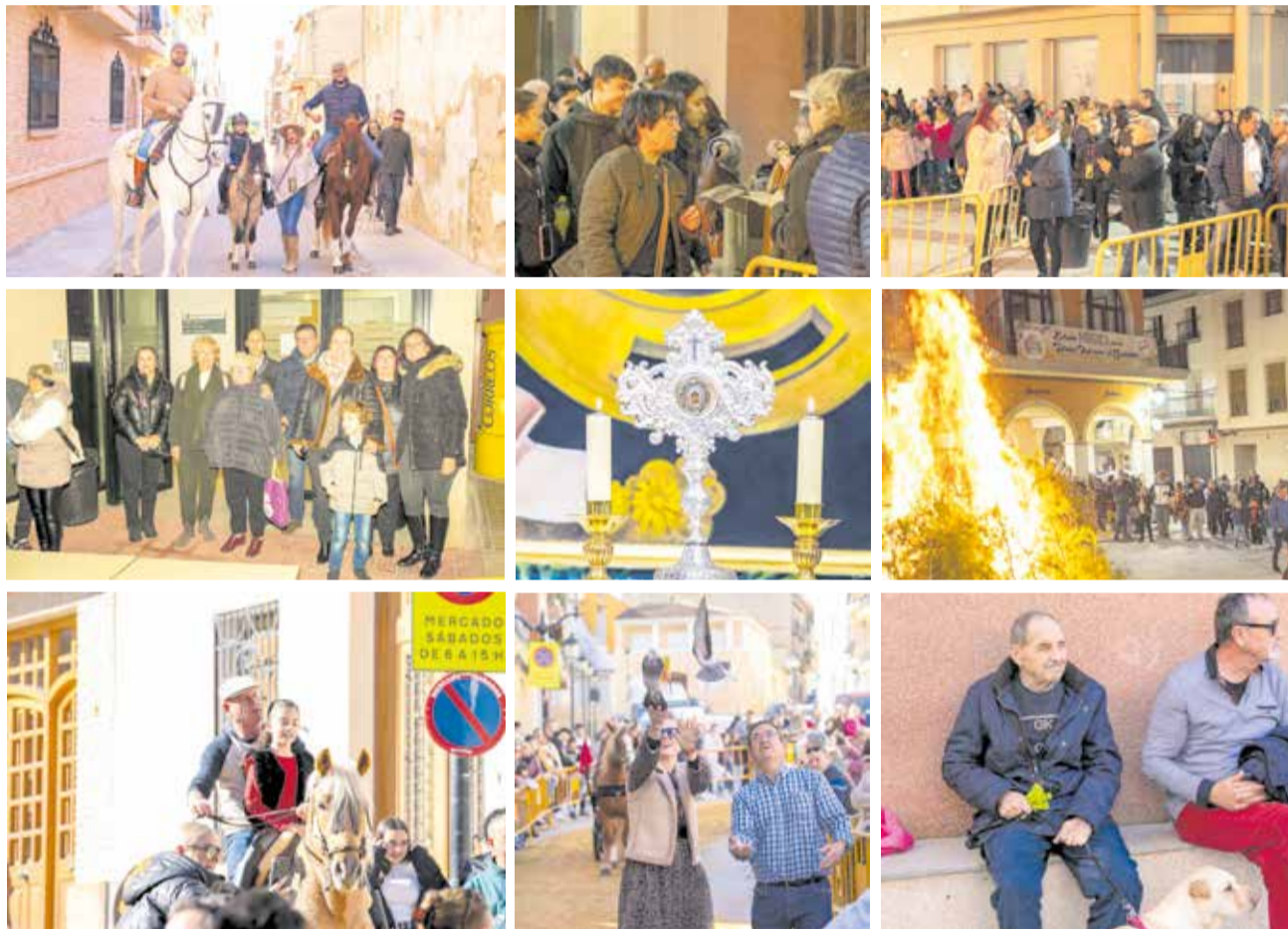
Diferentes momentos de la hoguera de San Antón y la bendición de los animales en Godelleta.

Cuando todo ello finalizó se procedió a la tradicional bendición de los animales de la mano del párroco de la localidad D. José. Todos recibieron con el típico rollo de San Antón a casa.