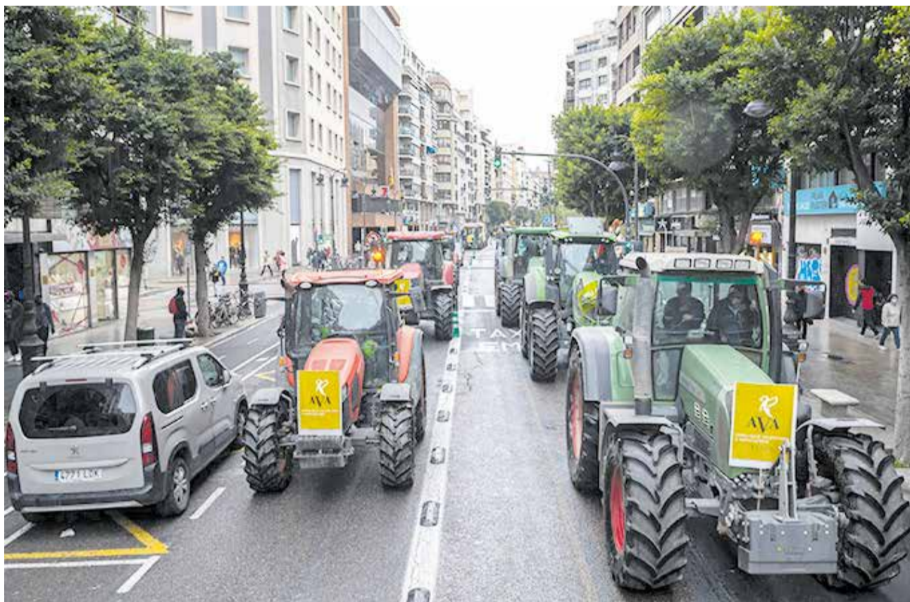
Una de las manifestaciones de productores agrarios en Valencia.

La dramática crisis de rentabilidad que están sufriendo los viticultores valencianos, especialmente en Utiel-Requena (la comarca más productora de vino de la Comunitat), a causa de los bajos precios de los vinos tintos, la escalada de los costes de producción y la sequía, motiva que el primer acto de protesta impulsado por AVA-ASAJA tenga lugar en esta zona. Decenas de tractores y agricultores de la comarca se congregarán el viernes 26