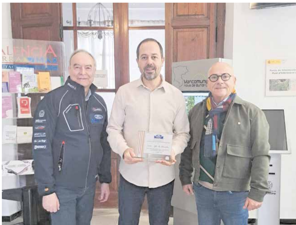
El alcalde Vicente Montó junto a los organizadores del Rallye Ciudad de Valencia.

El alcalde Vicente Montó también indicó que este curso la población de Macastre tendrán la oportunidad de disfrutar de un "gran acontecimiento internacional del motor por nuestras carreteras". Además, quiso recalcar que desde su equipo de gobierno siguen trabajando para "posicionar a nuestro pueblo en esta ocasión a través del deporte".