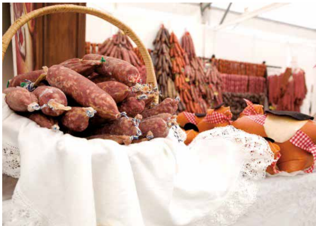
La Feria del Embutido de Requena.

No obstante si lo que se quiere es comprar productos de la huerta prácticamente a diario, Alboraya ha puesto en marcha una iniciativa pionera, se trata de 'De l'Horta a casa', una plataforma online de venta directa de productos de proximidad de los agricultores de la huerta local. A través de es-