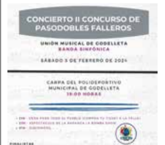
Cartel del concurso.