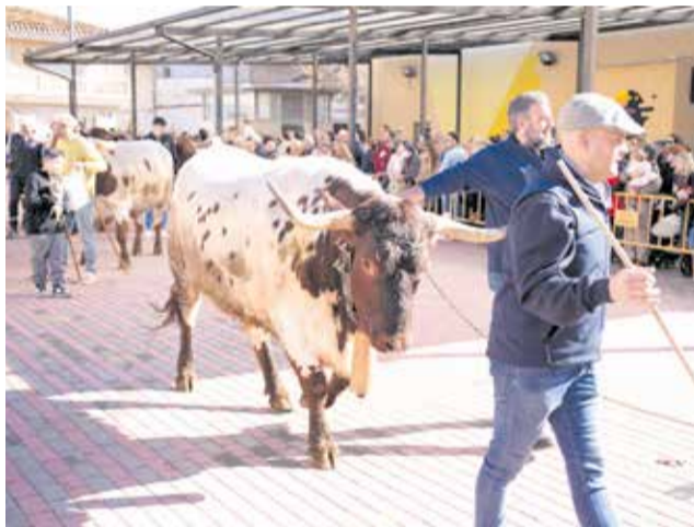
Algunos de los animales bendecidos. / EPDA