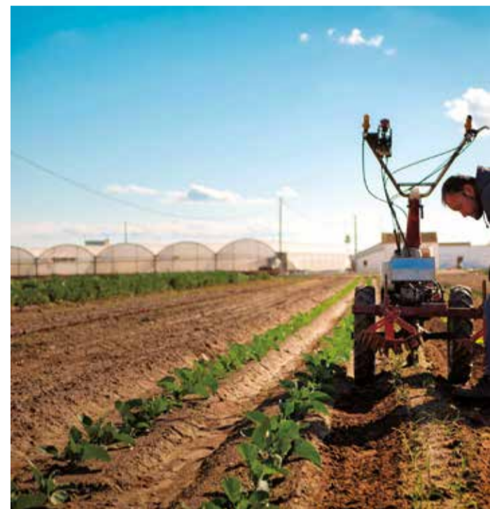
Un campo de l'Horta Nord.