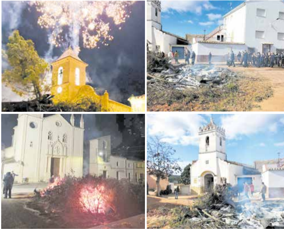
Diferentes instantáneas de la hoguera de San Antón en Venta del Moro.

Las festividades en honor a San Antón comenzaron el 20 de enero con una serie de actividades religiosas y culturales. Los eventos incluyeron una misa en honor a San Antón en la Iglesia Parroquial de Venta del Moro, seguida por una procesión que recorrerá las pintorescas calles del municipio. La población tuvo la oportunidad de participar en la bendición de animales, una tradición que refleja la devoción a San Antón, el patrono de los animales.