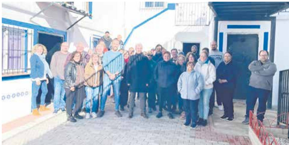
Participantes del Taller de Empleo "Utiel Mejora IV".

La Dirección General de LABORA - Servicio Valenciano de Empleo y Formación concedía en esta con-