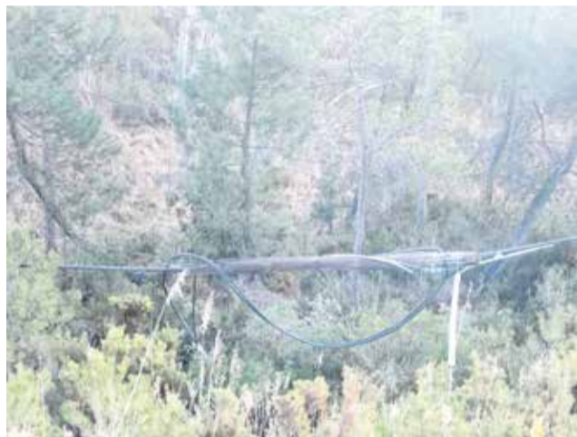
Paso de la fibra de Telefónica por Chera.

Desde el ayuntamiento de Chera no se esconde el ma-