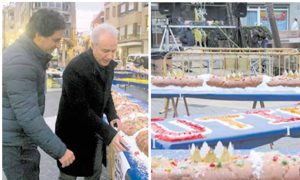
El Roscón de Reyes Gigante de Utiel endulzó a más de 2000 personas.

XXL: 600 huevos de gallinas criadas en suelo, 150 kilos de harina, 300 naranjas, 15 kilos de mantequilla, 15 litros de leche, 100 kilos de azúcar y otros cien de fruta confitada con la esencia especial del agua de azahar.