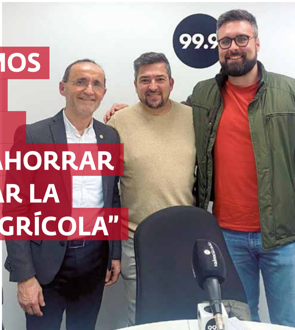
El presidente de la Mancomunidad Alto Turia, Rafael Darijo.

► Una solicitud en la convocatoria, donde tú tienes un certificado de eficiencia energética con un nivel de eficiencia energética y con una descripción de posibles mejoras para mejorar un 30%. Con que seas capaz de mejorar un 30%, es decir, con cambio de ventana, con cambio de climatización, con cambio tal vez de pinturas que sean más aislantes, y con una iluminación más inteligente y más sostenible, la Unión Europea te puede dar desde un mínimo del 50% hasta un 100% y hasta un máximo de 22.000