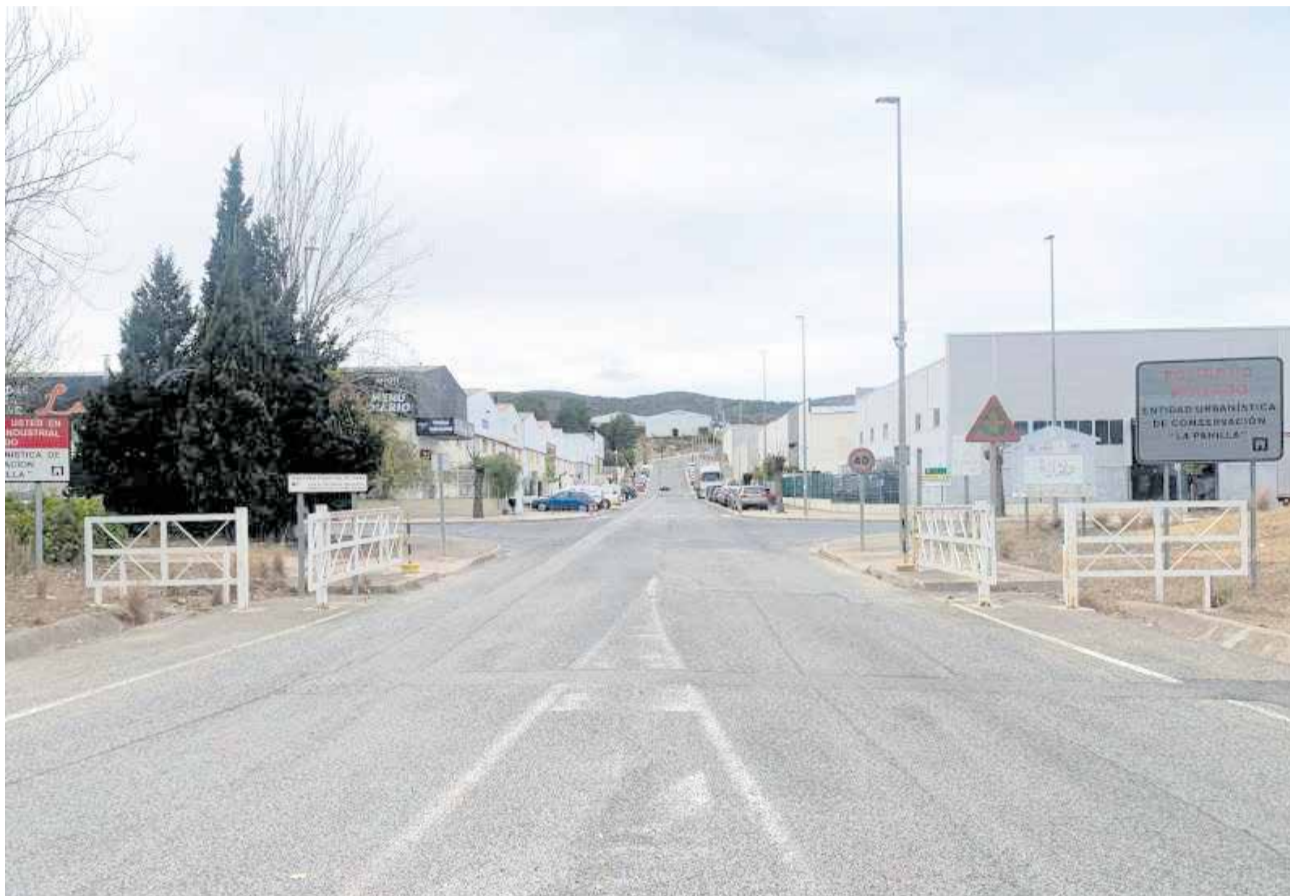
Polígono industrial La Pahilla de Chiva / EPDA

Por su parte, el ayuntamiento expresó la firme voluntad de apoyar a la Entidad Urbanística en la búsqueda de subvenciones, analizan-