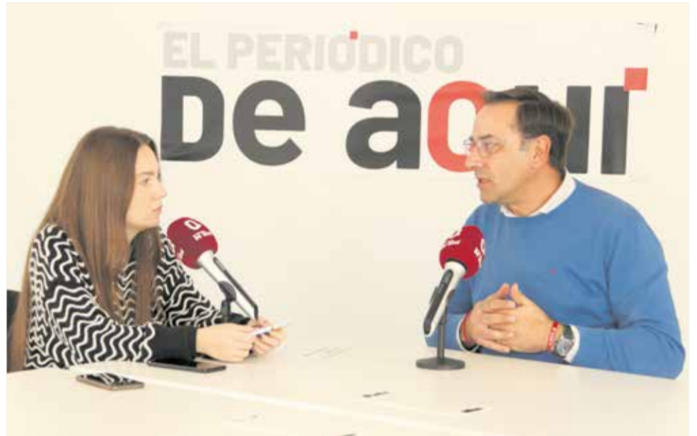
Un momento de la entrevista en la sede de El Periódico de Aquí.

El proyecto Adapt@+t busca poner en valor y profesionalizar los sectores implicados en nuestra comarca: turismo, agricultura y comercio"