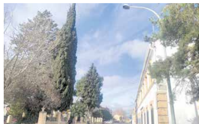
Renovación del alumbrado público de Utiel.