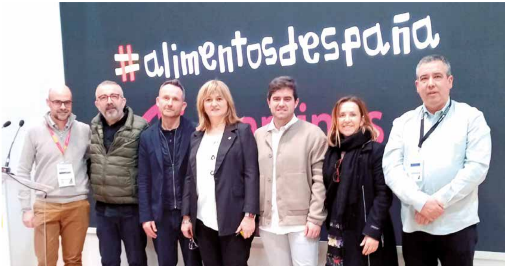
El Consorci de la Ribera i de la Mancomunitat de la Ribera Alta participaren a Fitur amb diverses presentacions