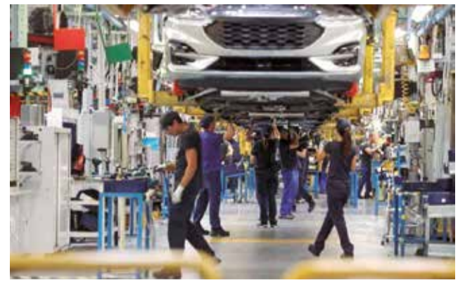
La fábrica de Ford en Almussafes.