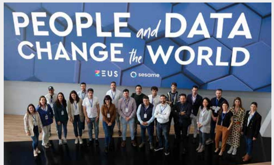
Representantes del programa.

'Operación Consolida' ofrece un completo programa de formación, dividido en 10 bloques, cubriendo áreas esenciales como innovación, ventas y finanzas. Las sesiones serán dirigidas por empresarios referentes, quienes compartirán sus conocimientos desde sus propias sedes corporativas.