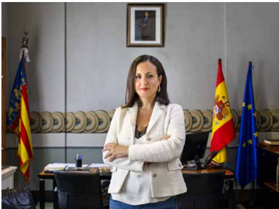
Carolina Almiñana, alcaldessa de Carcaixent.