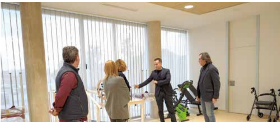
El DG de Servicios Sociosanitarios confirma el estado del Centro de Día de Alberic / EPDA

l'autorització definitiva en les pròximes setmanes per a que les i els usuaris que ho necessiten puguen, per fi, utilitzar este Centre de Dia en els pròxims mesos".