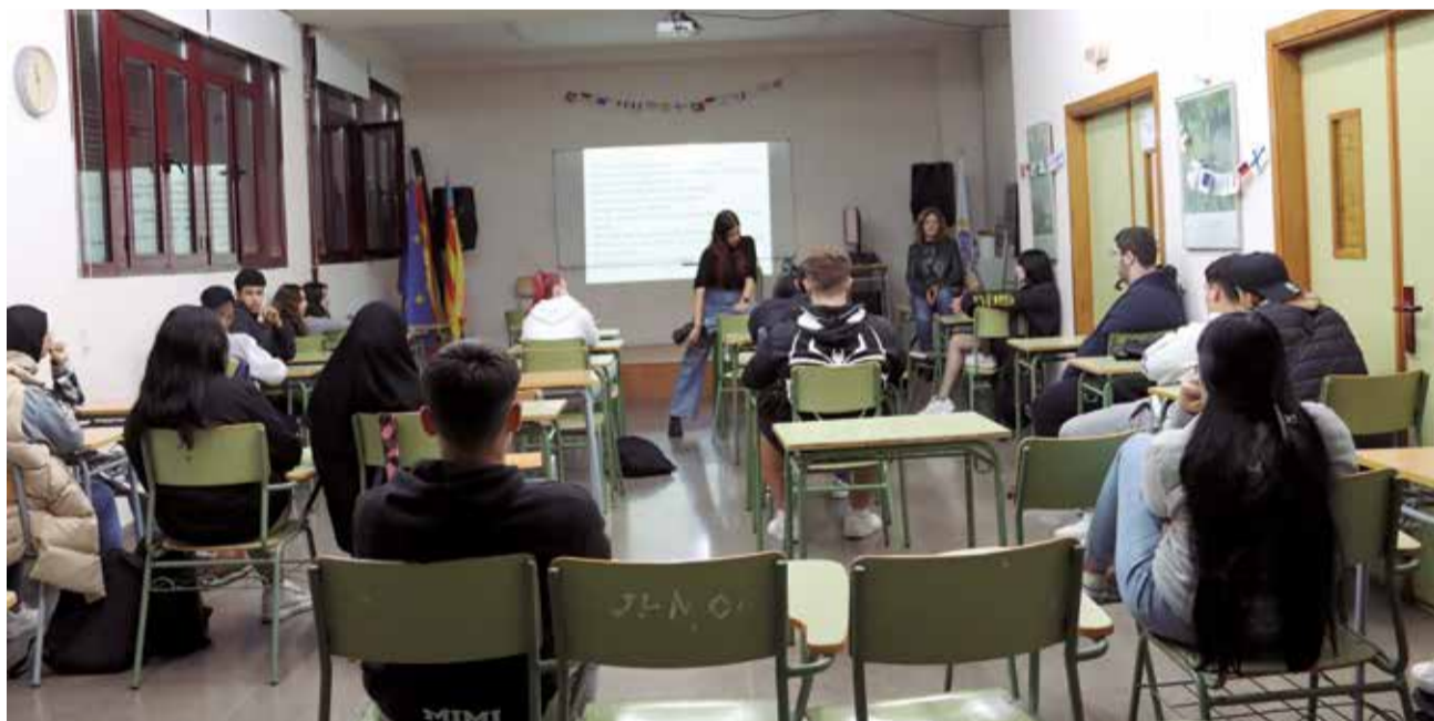
Vista d'una classe amb adolescents del municipi.