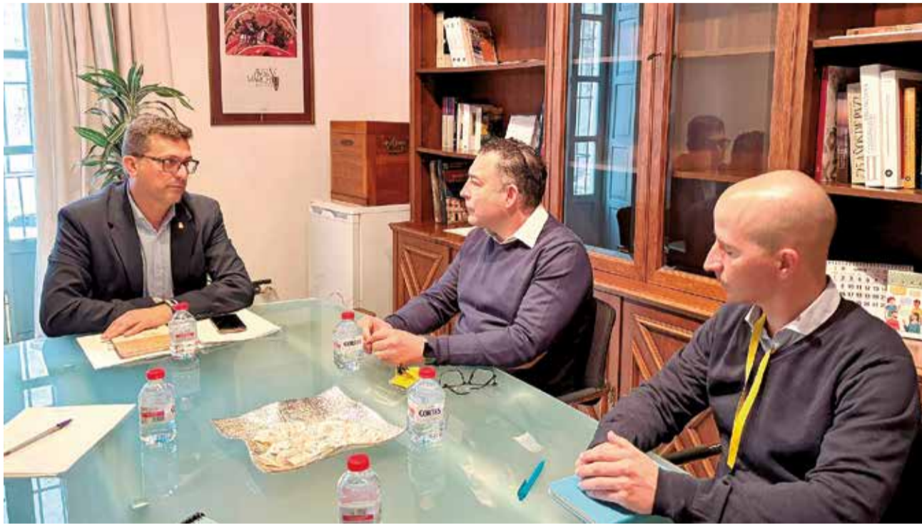
El diputat d'Innovació, Juan Ramón Adsuara, es reuneix amb representants de Telefónica

Així, i amb l'objectiu de "donar respostes personalitzades a les necessitats de cada ajuntament afectat, des de la Diputació organitzarem trobades en els quals els assessorarem per a eliminar la bretxa que supo-