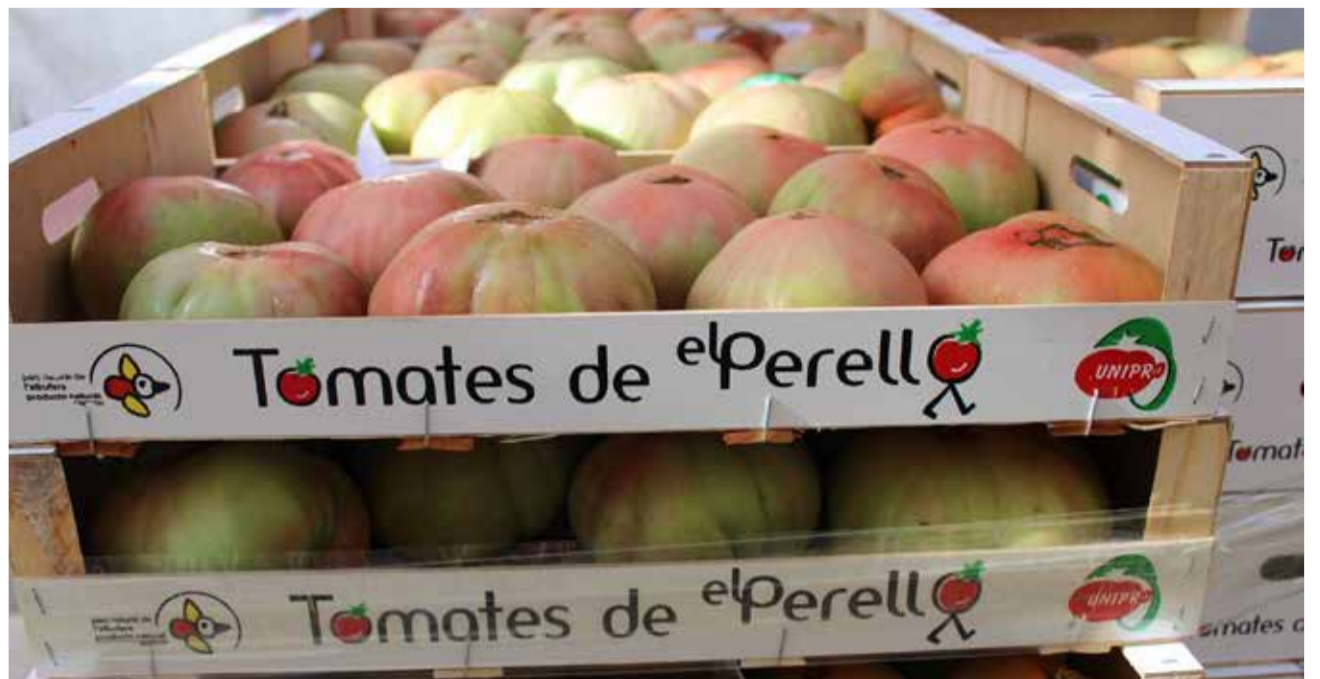
Tomates d'El Perelló.

Les tomates d'El Perelló no només són apreciades localment, sinó que també han guanyat reconeixement a nivell nacional i internacional per la seua excel·lent qualitat. La seua versatilitat a la cuina els converteix en un ingredient indispensable per als amants de la bona