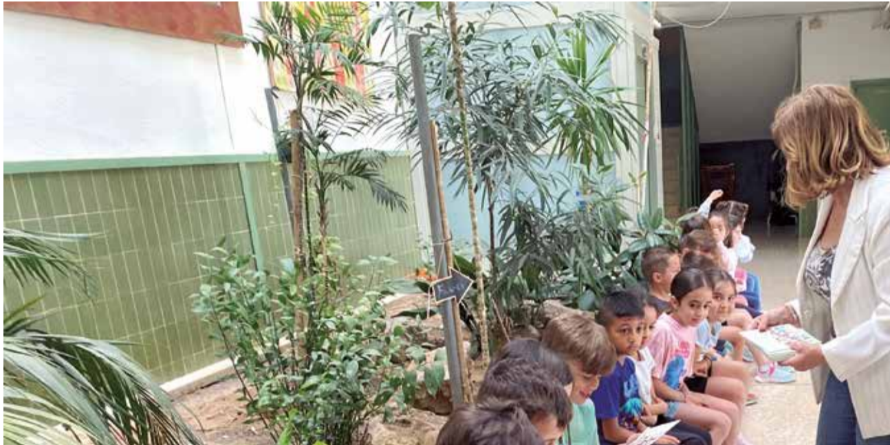
Alguns alumnes d'infantil de l'Alcúdia