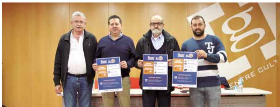
Presentació Copa FBCV en Guadassuar.