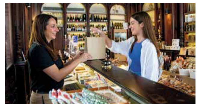
El trato amable y cuidado por los detalles.

característica y promover la hospitalidad en el sector turístico, realizando acciones formativas que fomenten ese trato amable y cariñoso hacia aquel que nos ha elegido para visitarnos.