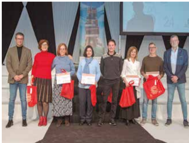
Imatge dels docents jubilats