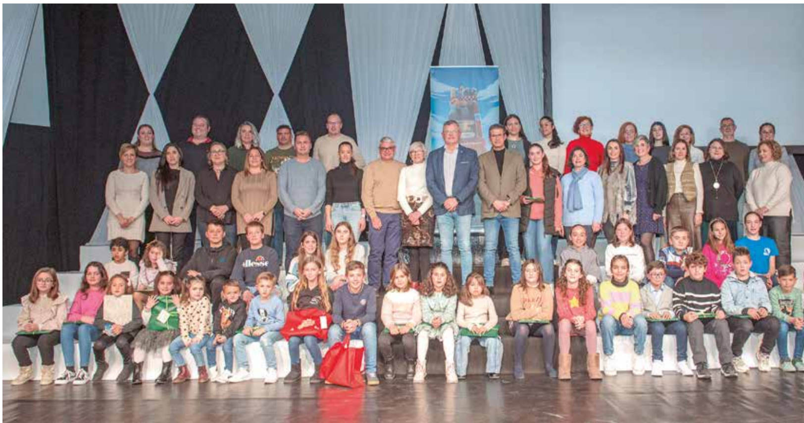
Foto de grup de tota la comunitat educativa d'Almussafes

DES DE LA REGIDORIA D'EDUCACIÓ S'HA PLANTEJAT UN PROGRAMA QUE INVOLUCRA A ALUMNAT I PROFESSORAT