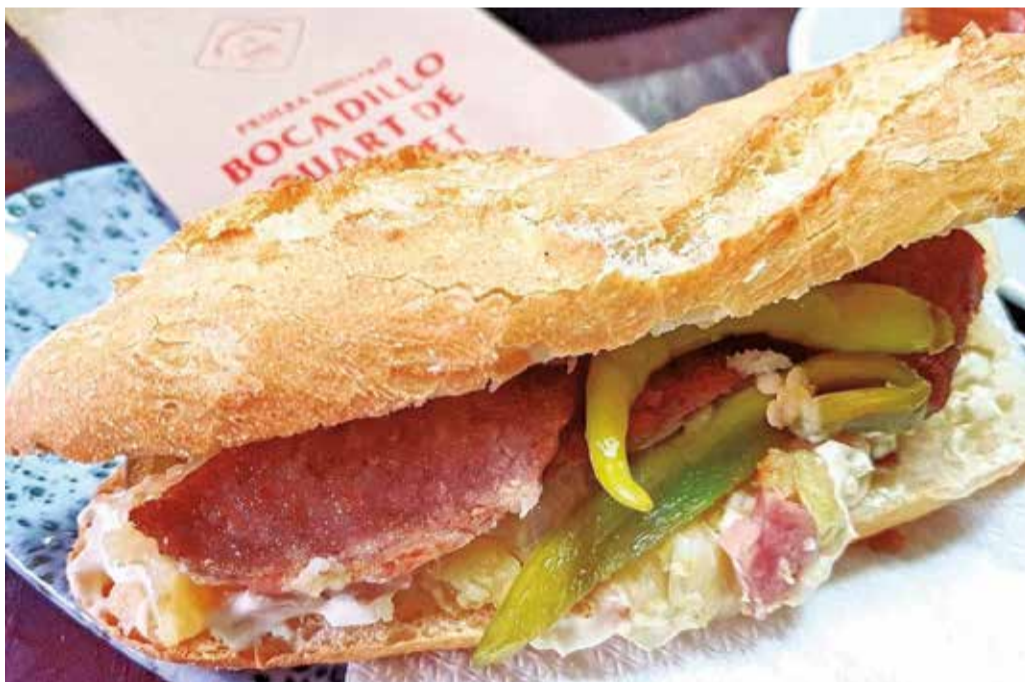
Bocadillo 'Quart de Poblet', típico del pueblo que le da nombre.

tidos de aceitunas y piparras, y para terminar un buen cremaet de ron.