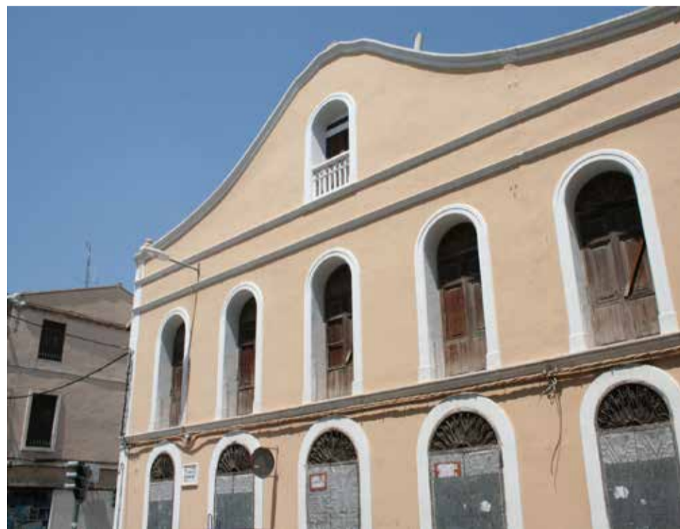
Façana del Teatre El Siglo de Carlet.