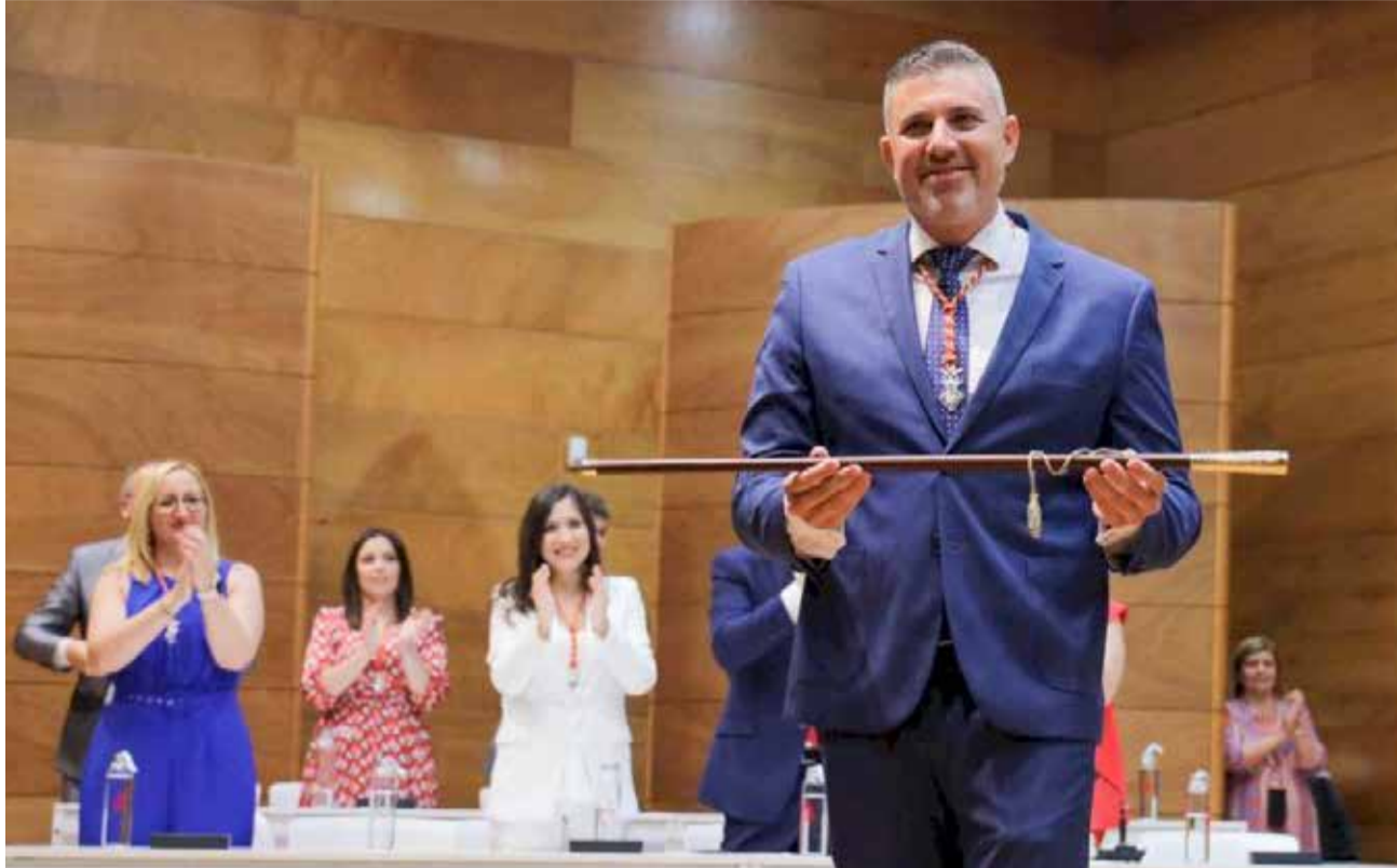
Jordi Mayor, alcalde de Cullera, con la vara de mando.