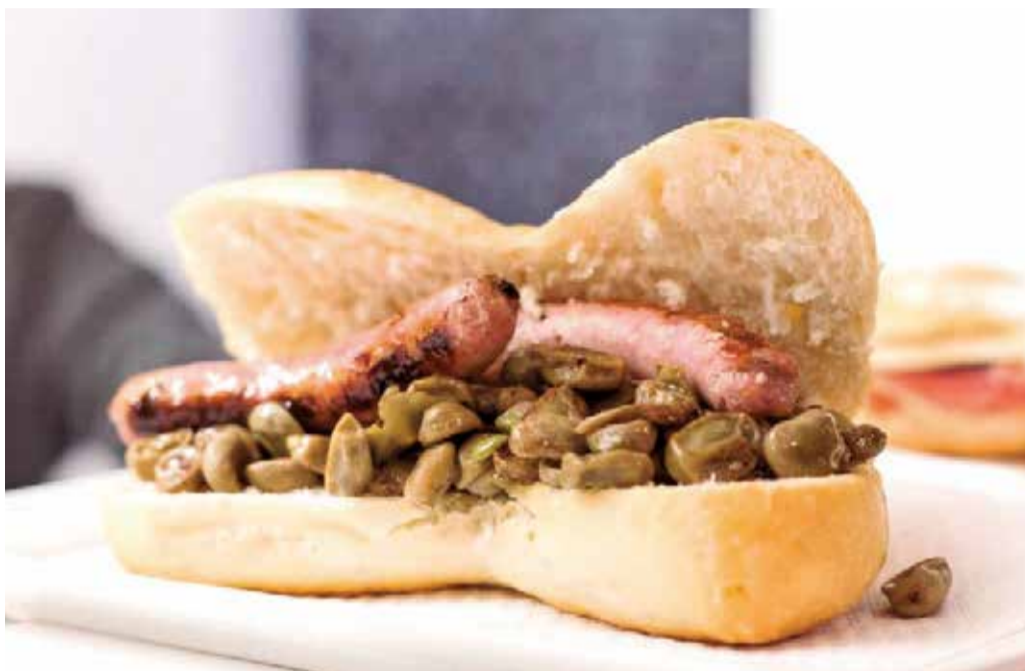
La 'pataqueta', un bocadillo típico del Camp de Morvedre que se come los jueves.