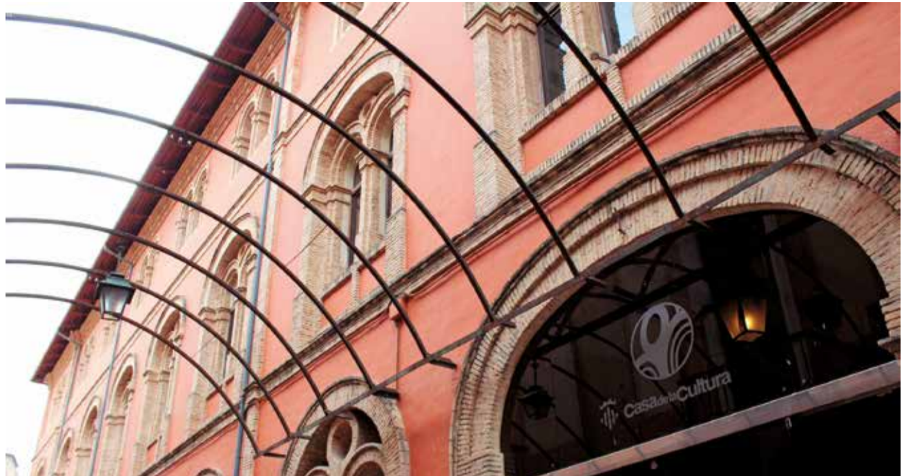
Casa de la Cultura de Alzira.

Las numerosas charlas, ponencias o mesas redondas promoverán un clima de aprendizaje enriquecedor