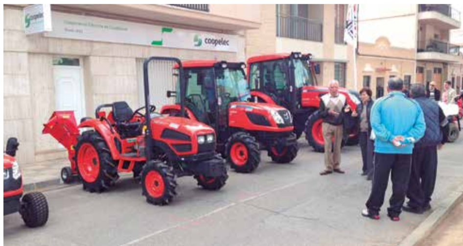
Foto d'arxiu de la Fira Agroguadassuar.

Afegir també que una potència global en el mercat del processament de hortalisses prendrà part en aquest esdeveniment com a patrocinador d'honor d'aquesta XXVII Edició d'Agroguadassuar. EUROCEBOLLAS, després de complir recentment 25 anys al servei de la innovació en aquest sector, ens acompanyarà durant la durada d'aquestes jornades professionals, lúdiques i de màxim