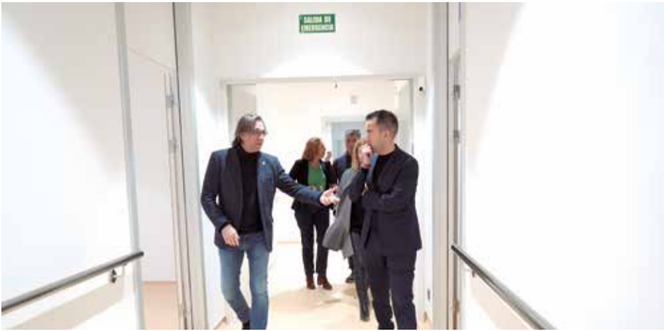
Moment de la visita del DG Servicios Sociosanitarios al Centre de Dia d'Alberic / EPDA