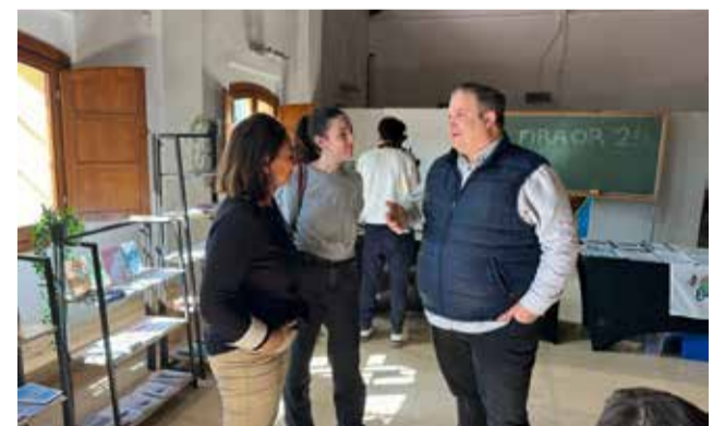
Fira Orienta't en l'edició de l'any passat.

Al llarg de tres jornades, els dies 6, 7 i 8 de febrer, l'alumnat està participant en sessions formatives, ja siga durant les visites concertades pels propis centres educatius en horari de matí, o per les vesprades, en les sessions programades de portes obertes a tota la ciutadania. "Estem molt satisfets amb