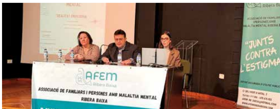
Jornadas de Psicoeducación de Salud Mental en Sueca.

El salón de actos de la Casa de la Cultura ha acogido esta mañana la VIII Jornada de Psicoeducación en Salud Mental titulada 'Realidad emocional', organizada por la Asociación de Familiares y Personas con Malaltia Mental Ribera Baixa (AFEM RB) con la colaboración del Ayuntamiento de Sueca, a través de la Concejalía de Acción Social, y del Hospi-