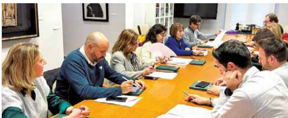
Un instant de la jornada.