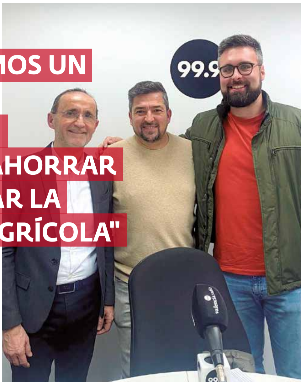
El presidente de la Mancomunidad Alto Turia, Rafael Darijo.

► Una solicitud en la convocatoria, donde tú tienes un certificado de eficiencia energética con un nivel de eficiencia energética y con una descripción de posibles mejoras para mejorar un 30%. Con que seas capaz de mejorar un 30%, es decir, con cambio de ventana, con cambio de climatización, con cambio tal vez de pinturas que sean más aislantes, y con una iluminación más inteligente y más sostenible, la Unión Europea te puede dar desde un mínimo del 50% hasta un 100% y hasta un máximo de 22.000 euros. Pero si la comunidad de vecinos decide también hacer eso, en los espacios comunes, también. Pero si un ayuntamiento quiere hacerlo con barrios enteros, ya se