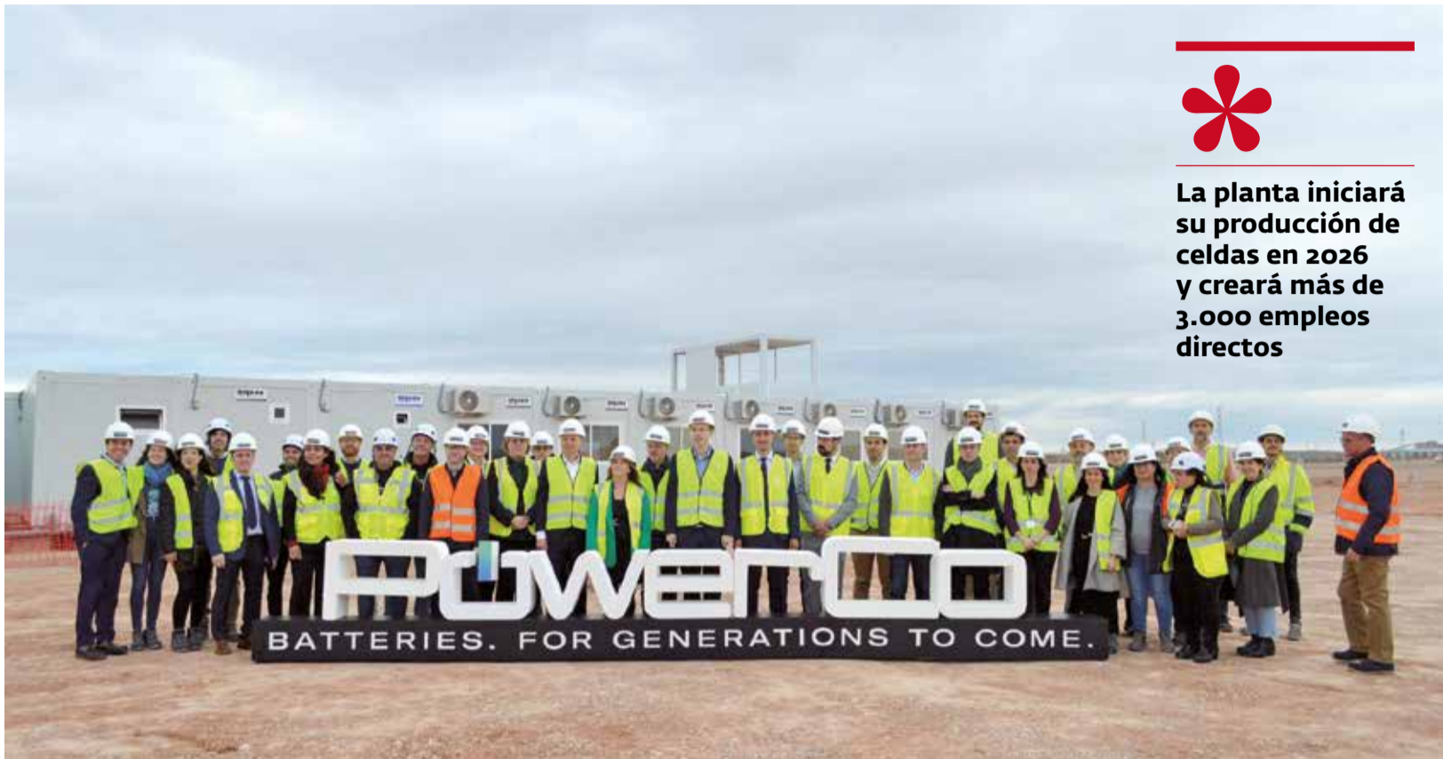
Directivos, trabajadores y autoridades municipales en los terrenos donde se asentará la factoría.