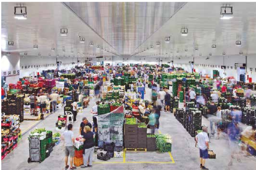
Tira de Contar de Mercavalencia.

En esta línea, la concejalía de Comercio y Mercados del Ayuntamiento de Sagunt trabaja día a día por potenciar el consumo en los mercados interiores y exteriores del municipio. Lo hacen a través de una gran variedad de iniciativas a lo largo del año.