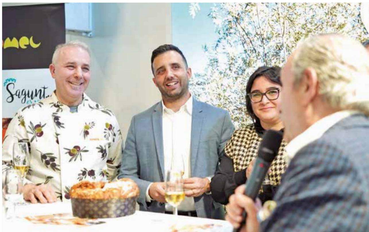
Un instante de la degustación del dulce de la pastelería Chocomel en Fitur.

Sagunt, por su posición estratégica entre las sierras Calderona y Espadán, junto al río Palancia y el mar, es un enclave histórico desde la antigüe-