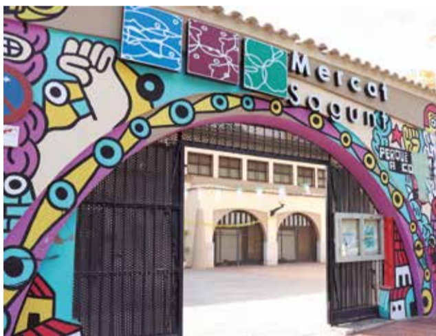
Exterior e interior del mercado municipal de Sagunt, en la plaza Cronista Chabret.

Las ventajas que ofrece comprar en nuestros mercados no son pocas. En primer lugar, la frescura y la calidad. Los productos llegan directamente del productor al consumidor. Las frutas, verduras, carnes y productos artesanales exhibidos en los establecimientos son cultivados y elaborados en