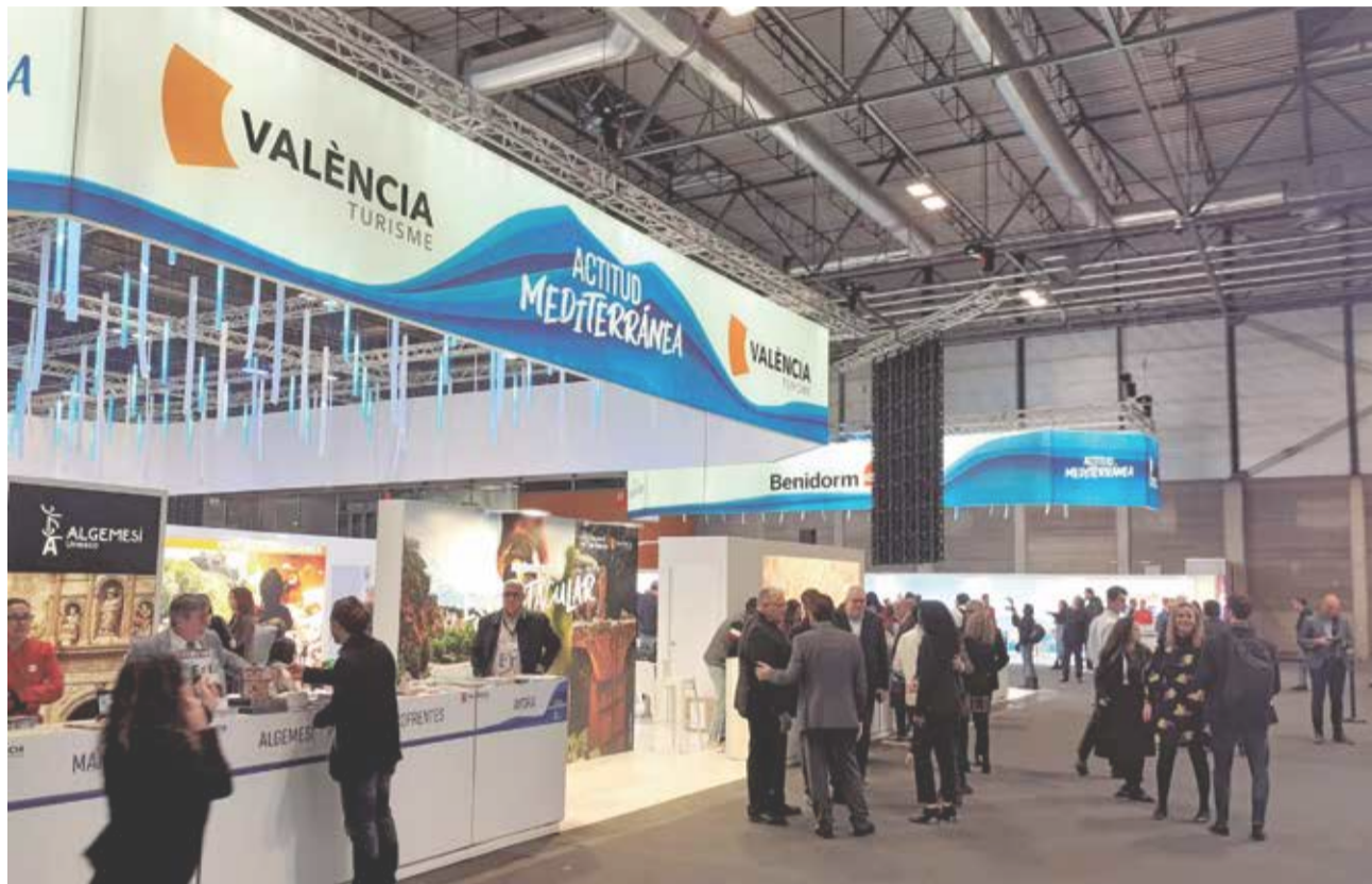
Stand de 'Fem Turisme', donde estaba el Albalat dels Tarongers.

Por otro lado, el municipio forma parte de la Ruta Cultural de España del Camino del Cid. Albalat dels Tarongers se enorgullece de su conexión con las huellas literarias e históricas de Rodrigo Díaz de Vivar, el Cid Campeador. El Ramal de Castellón, que atraviesa esta población, es parte integral de la Red de Sellado del Salvoconducto del Camino del Cid, ofreciendo a los