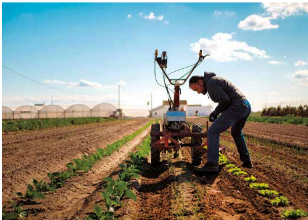
Un campo de l'Horta Nord.

A través de esta web, los productores agrícolas adheridos poseen una completa