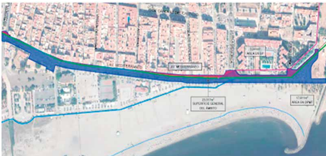
Avenida del Mediterráneo del Port de Sagunt. / EPDA