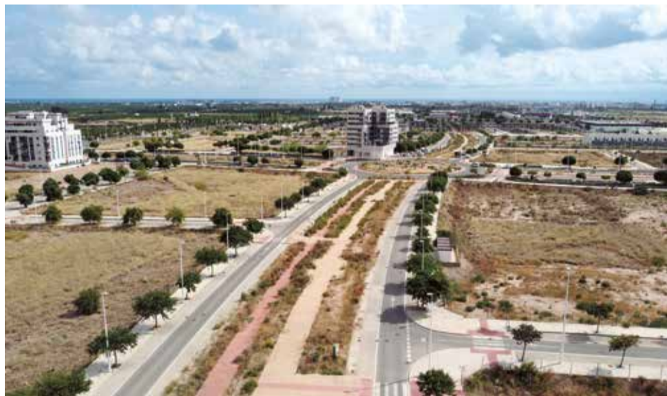
Varias parcelas de la zona de Internúcleos.

La medida afectará a varios terrenos de la zona internúcleos, la del norte del Palancia, en Sagunt, y en el Port, en la zona de la Gerencia o en el sur del barrio San José, entre otros. Según detallaba Moreno, “en total, son 12.000 viviendas que urbanísticamente ya tienen luz verde, pero están por construir. No es una cuestión que pueda esperar y, por supuesto, desde las administraciones no podemos quedarnos con los brazos cruzados. Menos todavía en un municipio en crecimiento, a todos los niveles, donde tenemos que garantizar que las inversiones económicas se traduzcan en prosperidad y bienestar para el vecindario. El acceso a una vivienda digna es un derecho recogido en la Constitución Española que se tiene que hacer cumplir”.