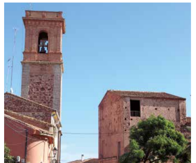
Benifairó de les Valls.

Finalment, els projectes més votats i que es duran a terme són la construcció d'una barrera protectora a la carretera de Benifairó de les Valls a Quartell, l'adequació