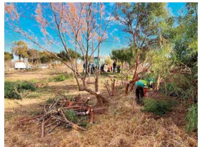
Una de las zonas que se ha limpiado.

En dicho informe se alertaba de los peligros de la excesiva presencia de este tipo de hierbas y plantas, de ahí que la Demarcación de Costas en Valencia haya autorizado al Consistorio a intervenir en estas zonas competencia del Ministerio para la Transición Ecológica y el Reto Demográfico.