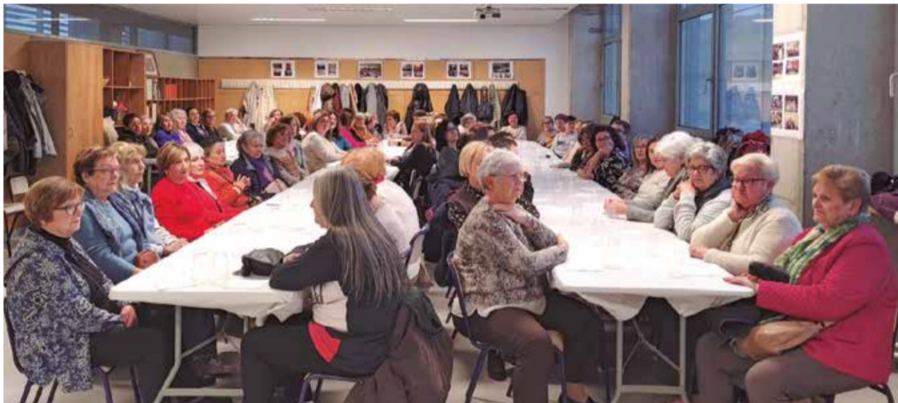
Un instante de la merienda el día de la inauguración en el nuevo local.