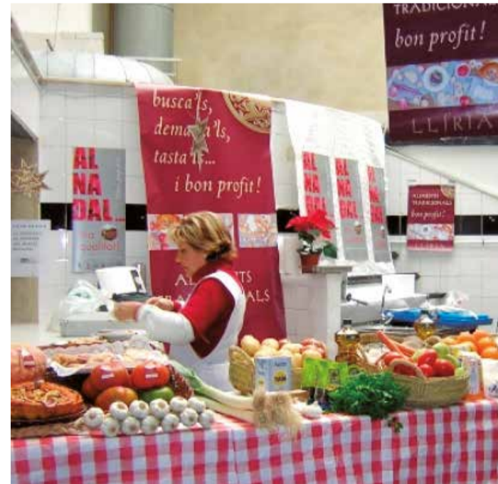
Una tienda del mercado municipal de Llíria.

ficha con fotografías de sus productos, su precio y una cesta de la compra. La plataforma ofrece dos posibilidades de recogida, una en el local en el que trabaje el productor, o también a domicilio. de esta forma, el consumidor puede adquirir estos alimentos a un precio más bajo al prescindir de los distribuidores.