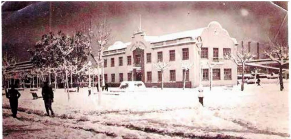
Sagunt y el Port cubiertos de nieve en enero de 1946.