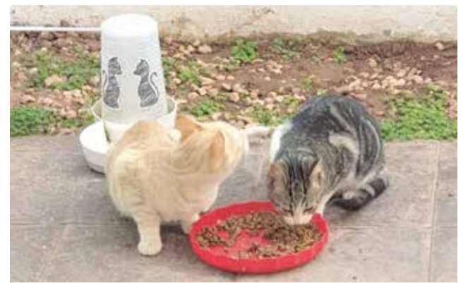
Felinos de Gilet en una imagen de ADAG. / EPDA