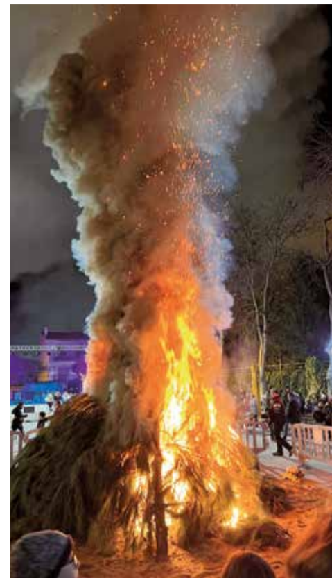
Dos de las actividades de Sant Antoni el año pasado en Canet.