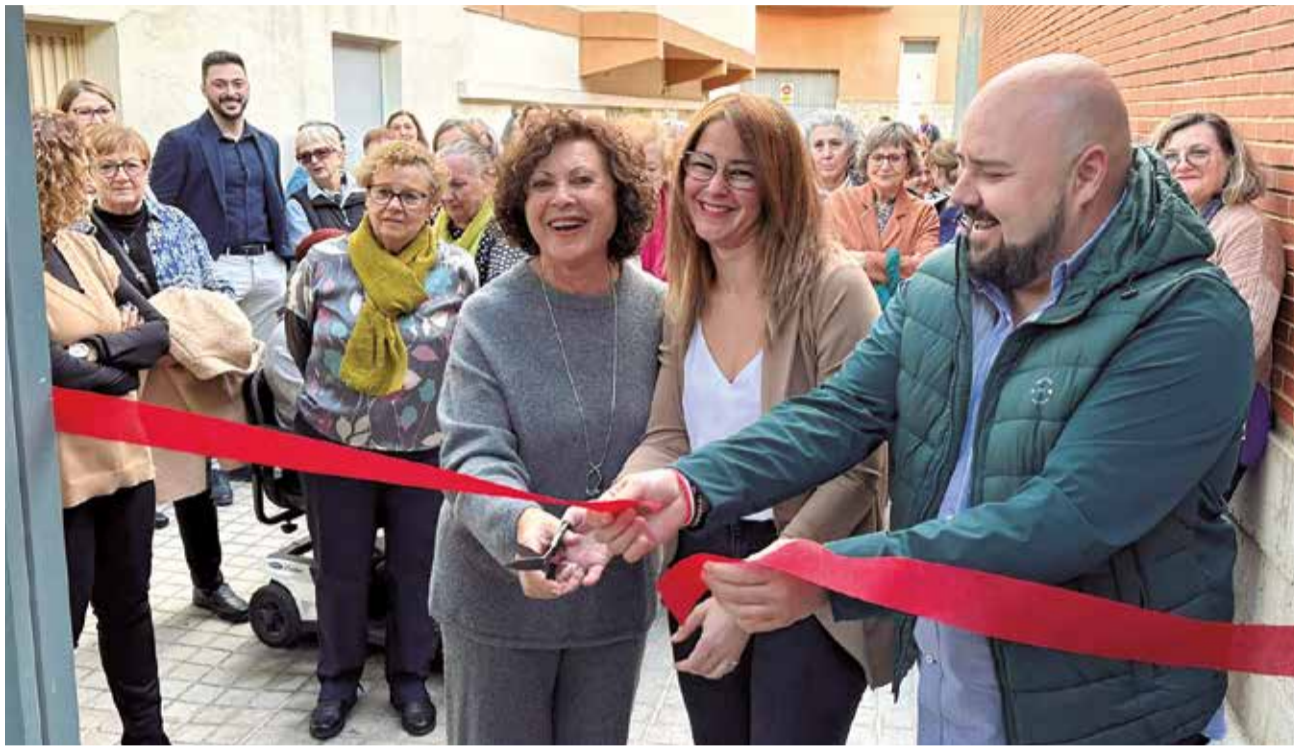
El alcalde de Gilet y representantes de las Amas de Casa inaugurando el nuevo local.