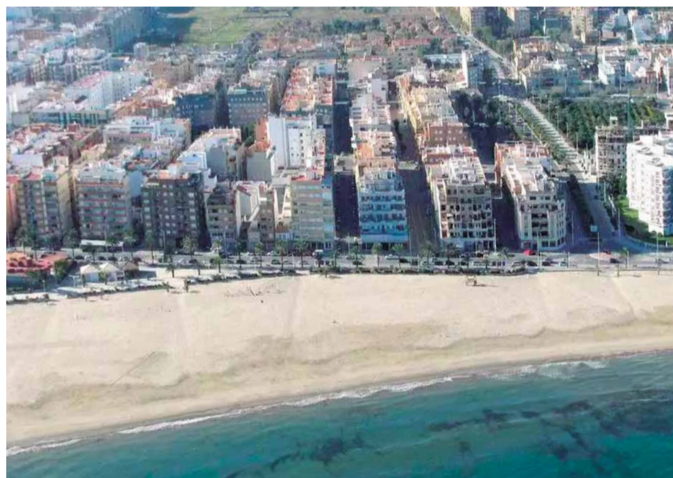
Canet d'en Berenguer, donde el arriendo ha subido un 23,9%.

En cuanto a los precios, Benidorm es la ciudad más cara con 15,88 euros por metro cuadrado, seguido de Canet d'En Berenguer (15,05 euros/m 2 al mes), Valencia capital (14,55 euros/m 2 al mes), El Campello (12,46 euros/m 2 al mes), Alicante / Alacant (12,21 euros/m 2 al mes), Santa Pola (12,05 euros/m 2 al mes), Altea (11,95 euros/m 2 al mes), Dénia (11,05 euros/m 2 al mes), Gandía (10,95 euros/m 2 al mes), Benicasim / Benicàsim (10,66 euros/m 2 al mes) y Torreveija (10,54 euros/m 2 al mes).