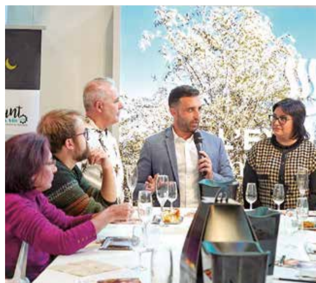
Una instantánea de la feria.