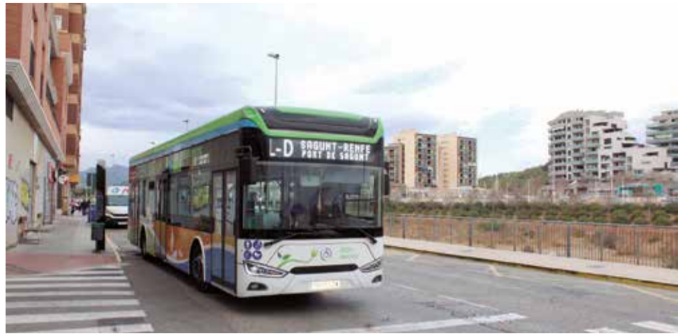
Bus interurbano que une Sagunt con el Port de Sagunt.