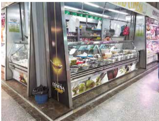
Interior del mercado municipal del Port de Sagunt.