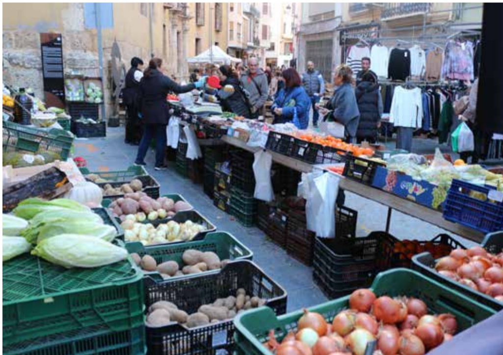
Mercado exterior de Segorbe, capital del Alto Palancia.