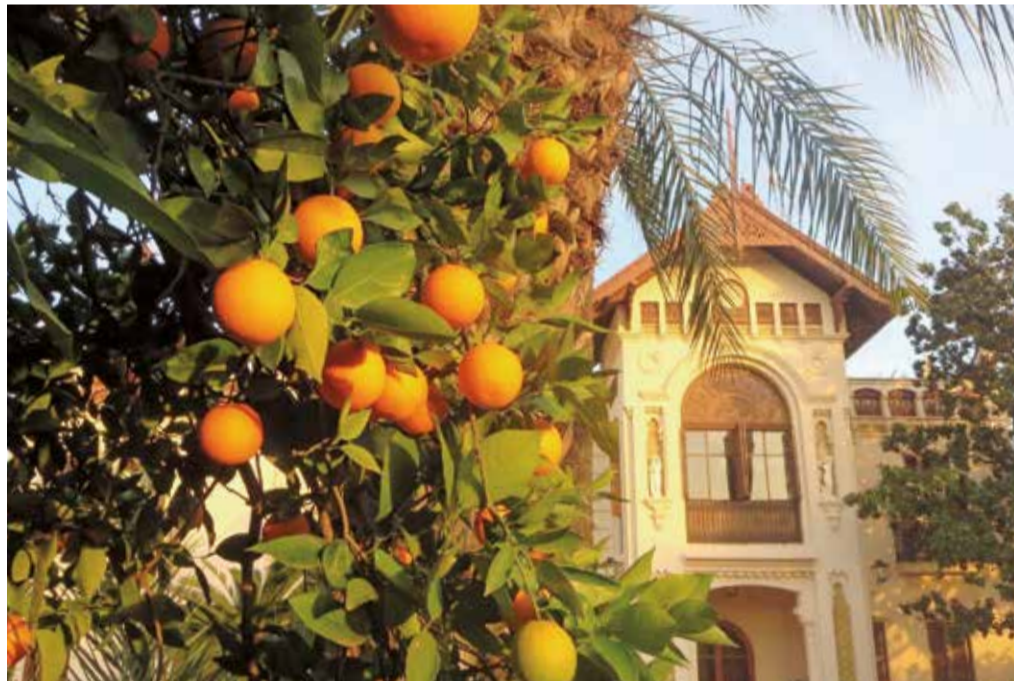
Naranjas de Carcaixent, el producto estrella de la comarca de la Ribera.