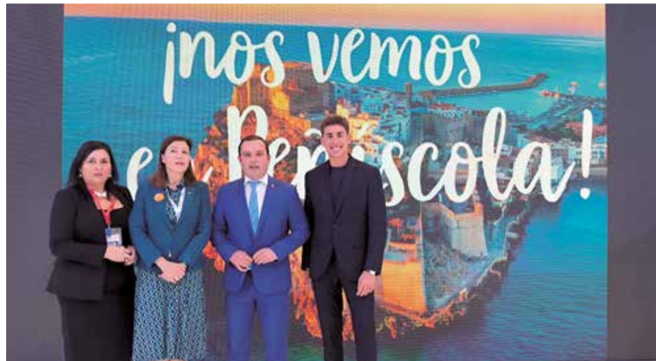
Presentación de las nuevas rutas turísticas de Peñíscola en Fitur.