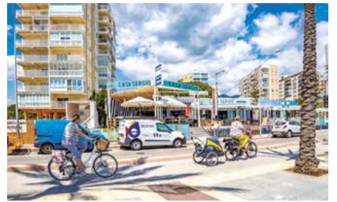
Usuarios de bicicleta en Benicàssim.