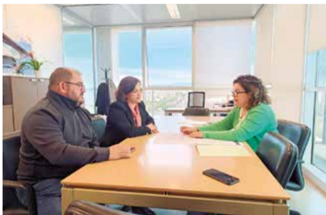
Reunió amb la directora general d'Infraestructures.

L'objectiu de l'Ajuntament és unir este vial amb les carreteres que ixen de la localitat cap a Vilafranca i Castelló i, en la mesura que siga possible, evitar el pas de vehicles pesants pel centre del municipi. A més, també permetrà que els vehicles que tenen com a origen o desti-