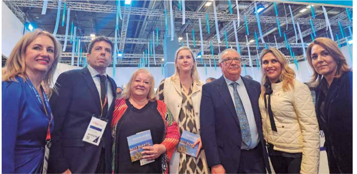
Representantes del Ayuntamiento de Oropesa del Mar junto a autoridades de la Generalitat y la Diputación.

Una de las jornadas más emocionantes para el municipio fue el pasado sábado,