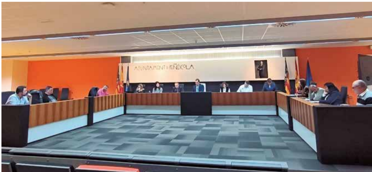
Un instant durant la sessió plenària de l'Ajuntament de Peníscola.

"Este full de ruta, que aterra els Objectius de Desenvolupament Sostenible de les Nacions Unides a la realitat i necessitats del nostre municipi, és un document viu, fruit d'un procés participatiu, en el qual la ciutadania ha exposat els principals reptes que enfrontem junts com a poble", ha manifestat, posant en valor el procés participatiu impulsat des de l'administració per a la seua confecció.