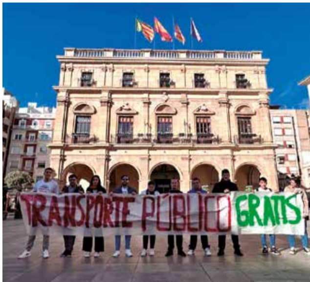
Concentración frente al ayuntamiento de Castelló.

La asociación juvenil de la ciudad, que forma parte del Consell Municipal de la Joventut, ha denunciado también “el veto del concejal de Movilidad a hablar con nosotros, a pesar de representar alrededor de 2.000 firmas de jóvenes de la ciudad. Quien algo teme, algo esconde. Desde Som Jovens vamos a seguir informando de este hecho a los ciudadanos, ya que entendemos que un cargo público debe respetar siempre a los