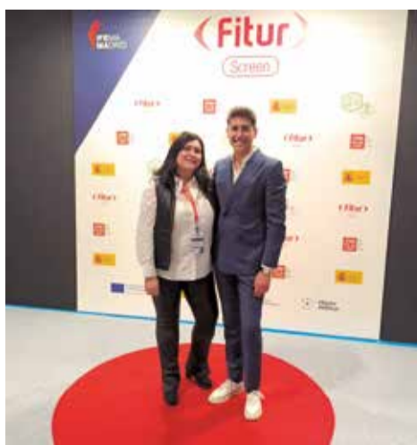
Peñíscola en Fitur Screen.

"Nuestra proyección como destino ha crecido con el impacto promocional que ha supuesto la emisión de series nacionales e internacionales en las que aparece Peñíscola como escenario y coprotagonista del re-