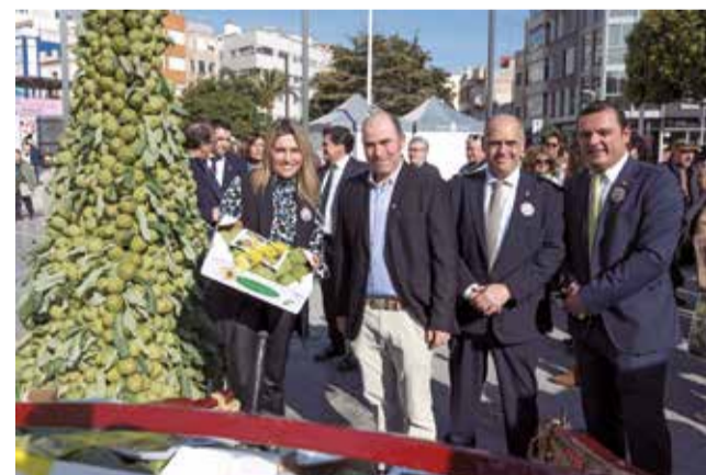
Visita al Mercat Gastronòmic de Benicarló.

La presidenta de la Diputació va assistir el 27 de gener al Mercat Gastronòmic, emmarcat en la XXXI Festa de la Carxofa, declarada Festa d'Interés Turístic Autònom, i va ressaltar la importància de la carxofa per a la gastronomia de la província i el seu potencial per a ser un dels productes referents.