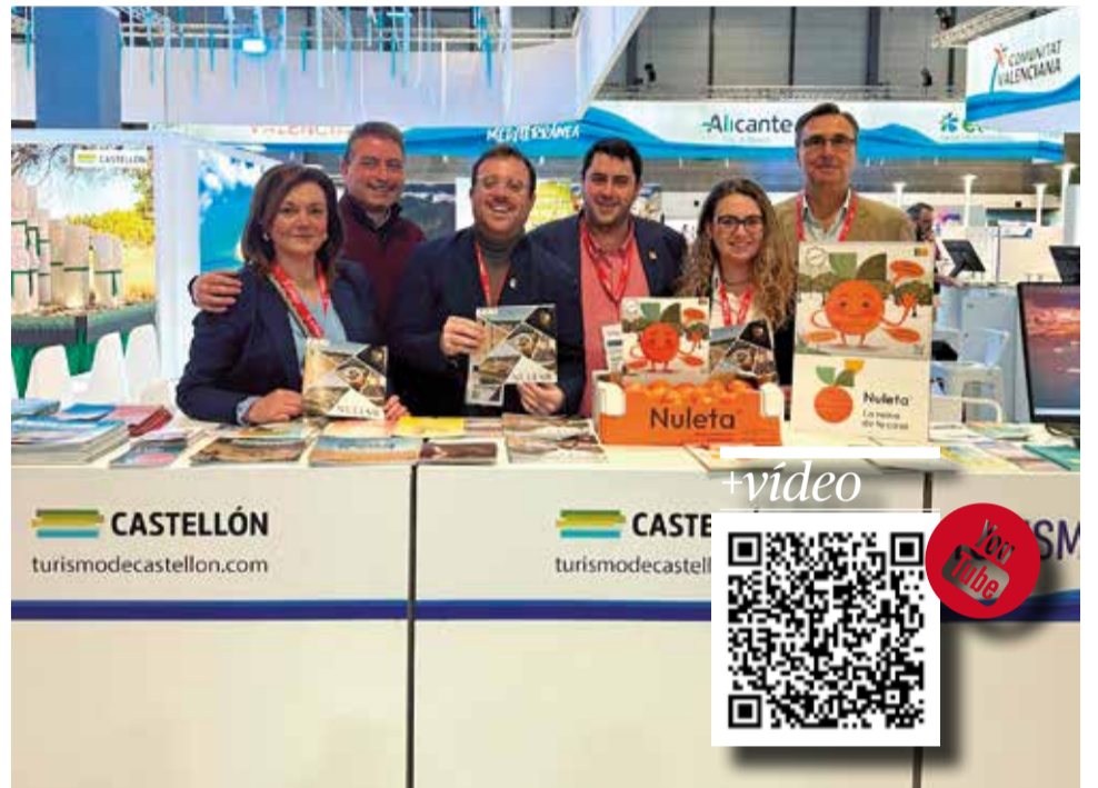
Nules presenta la Nuleta a l'estad de la província de Castelló en Fitur.

A més de presentar esta campanya que inclou un vídeo promocional a l'estand de la província de Castelló i en el de Pobles Màgics d'Espanya, des de l'Ajuntament s'han concertat diverses reunions amb empreses de l'àmbit turístic, per a conèixer les novetats que poden implantar-se en l'oferta turística local.