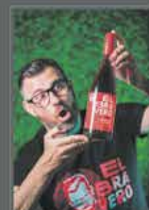
VERMUT EL BRAVERO