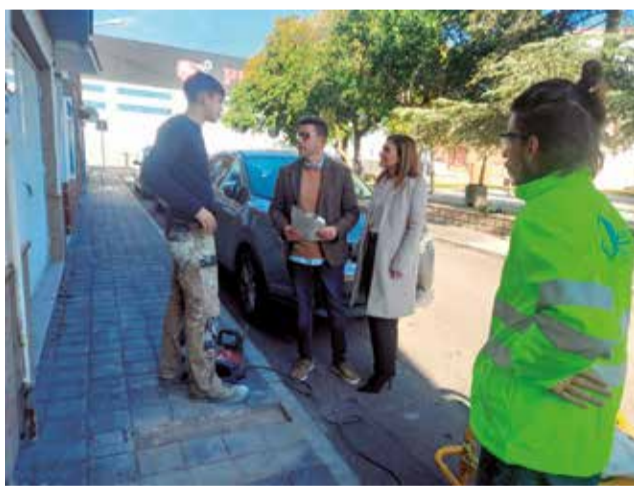
Visita a los trabajos en el barrio Pío XII.

Según ha explicado la alcaldesa, el consistorio hace valer el plazo de garantía de un año desde la finalización de los trabajos ofertados por la empresa adjudicataria. En este sentido, el edil ha insistido en la labor de supervisión que se realiza desde los servicios técnicos municipales de las distintas intervenciones urbanísticas que se realizan.