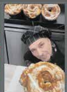
CORONA SAGUNTINA CHOCOMEL