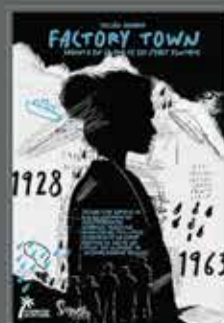
FICCIÓN SONORA FACTORY TOWN

Feria Internacional de Turismo DEL 24 AL 28 DE ENERO 2024