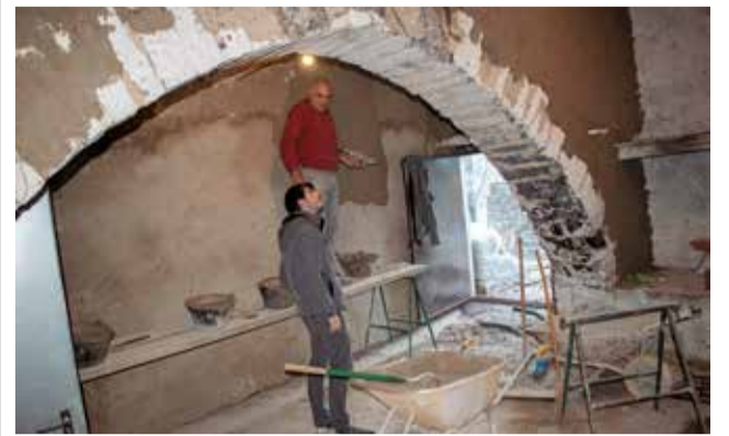
Obres al santuari de Vallibana de Morella.