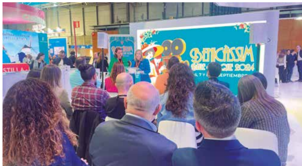
Presentación de la 13ª edición de la Belle Époque de Benicàssim en Fitur.

Marqués añadió que “Benicàssim se ha convertido en el mejor de los escenarios modernistas, porque la historia y el arte se respiran en cada rincón de la costa benicense, gracias a la construcción a finales del siglo XIX y