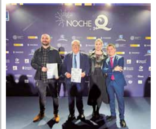
Recibimiento del distintivo.