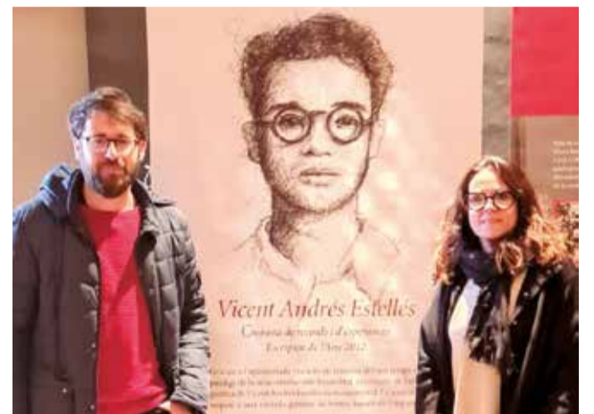
Representants de Vilafranca en la presentació.

Al llarg de l'any s'informarà de les activitats que Vilafranca acollirà. "És un honor per a nosaltres reconèixer el llegat d'Estellés en el poble valencià i universal. És una de les figures artístiques valen-