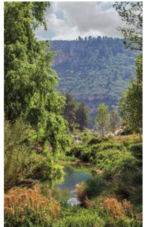
Paraje en el Alto Palancia.

La Mancomunidad del Alto Palancia está integrada por El Toro, Barracas, Pina de Montalgrao, Fuente la Reina, Villanueva de Viver, Higuera, Pavías, Caudiel, Benafer, Viver, Torás, Bejis, Teresa, Sacañet, Jérica, Gaibiel, Matet, Algimia de Almonacid, Vall de Almonacid, Navajas, Altura, Almedijar, Castellnovo, Geldo, Azuébar, Chóvar, Sonja y Sot de Ferrer.