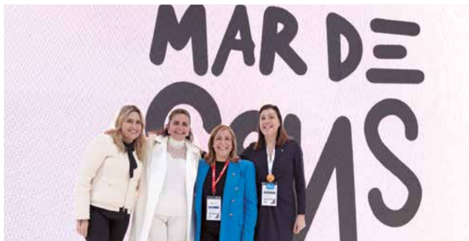
Presentació del festival 'Mar de Sons' de Benicàssim en Fitur.