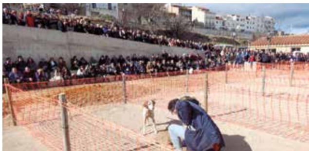
Edició anterior de la Mostra de la Trufa Negra.

El cap de setmana del 23 al 25 de febrer, un grapat d'activitats completen l'agenda de la Mostra, com ara el sopar i lliurament de la Trufa d'Honor de l'Alt Maestrat 2024.