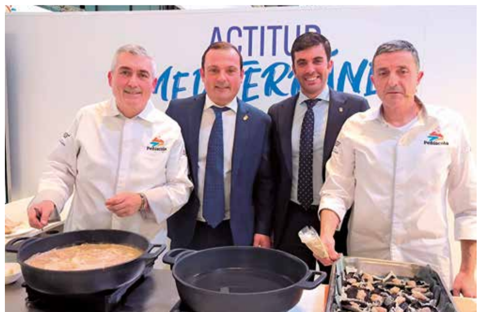
Showcooking de la Asociación Gastronómica de Peñíscola en Fitur.

Peñíscola triunfa en Fitur con su gastronomía mediterránea