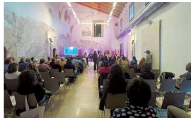
I Jornadas Abolicionistas en el Castell de Riba-roja.