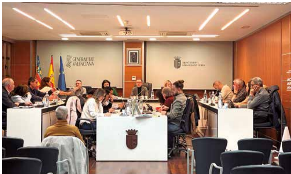
Pleno del Ayuntamiento de Riba-roja de Túria.

El plan de comunicación 2024-2025 supondrá la puesta en marcha de otras iniciativas como información periódica a través del portal del empleado público, publicación principales acciones realizadas en la web municipal, realización de una newsletter semestral con las prin-