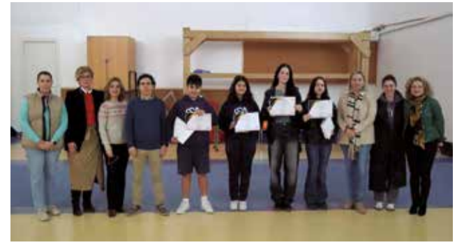
Entrega dels IX Premis TecnOK.