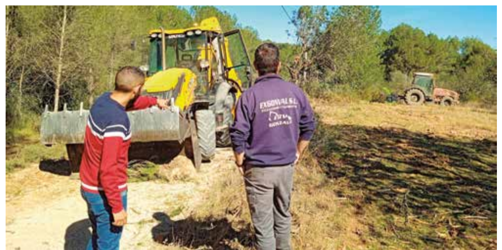
Els treballs forestals al camí.

L'OBJECTIU DE LES OBRES ÉS MILLORAR EL PAS DELS VEHICLES MUNICIPALS, D'EMERGÈNCIES I VEÏNS