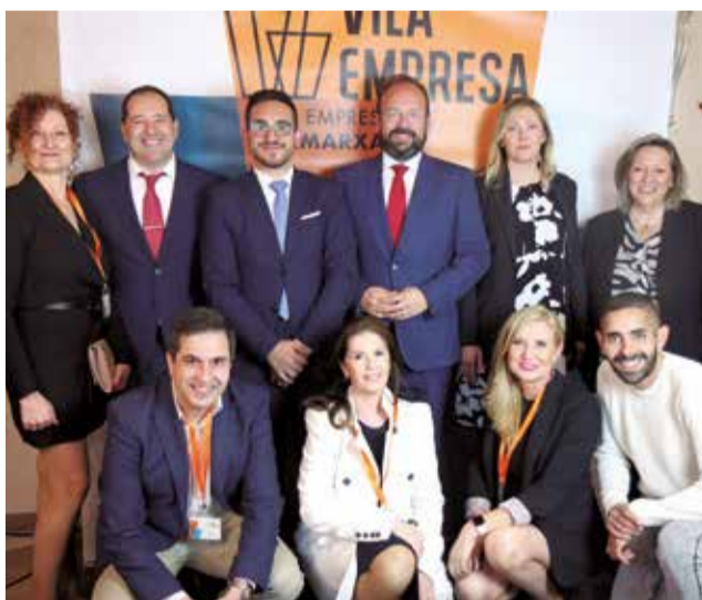
Els empresaris participants en la gala.

Finalment va concloure amb un vi d'honor per