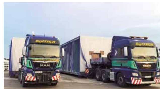
Dos vehículos de la flota de la empresa.

res. Las más de tres décadas dedicadas a los transportes “más especiales” avalan su eficacia. La firma se caracteriza por su experiencia que influye en los máximos estándares de calidad y una entrega que garantiza en todo momento la satisfacción de sus clientes.