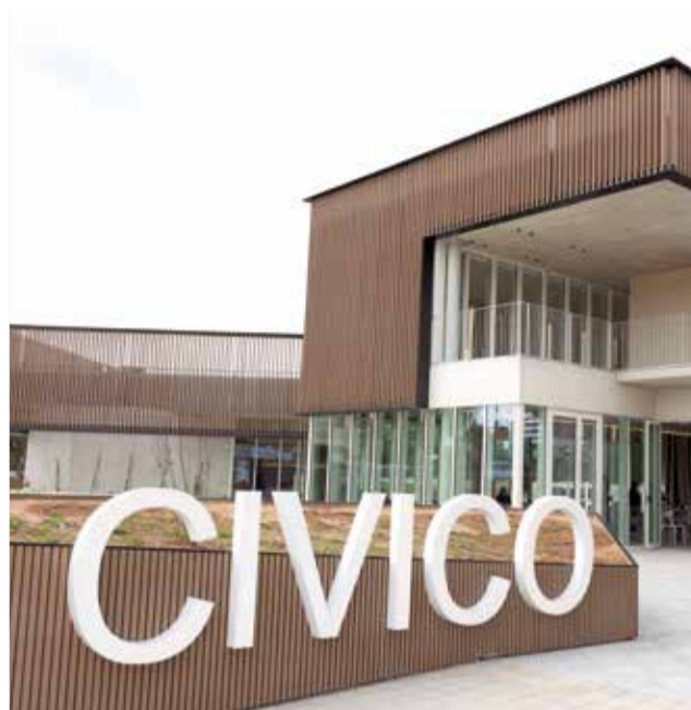
Nuevo Centro Cívico de Bétera.

Con una inversión de 2,5 millones de euros, el Centro Cívico se erige como un símbolo de inclusión, participación y servicio a la ciudadana,