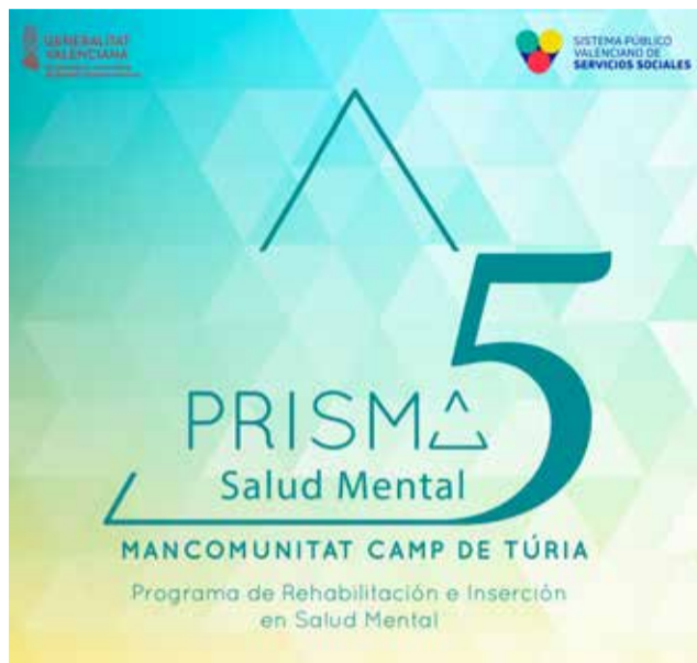
Cartell del 5é aniversari de PRISMA.

Durant estos cinc anys, PRISMA s'ha convertit en un recurs rellevant per a les persones amb problemes de salut mental de la comarca. Actualment, compta amb 95 usuaris amb problemes de salut mental greu i ja han accedit a ella 157 persones en total des del seu inici. PRISMA era un recurs que estava previst instal·lar-se en dos municipis: primer, en 2019, ho va fer a Bétera i dies més tard a Vilamarxant. No obstant això, a mesura que les seues ac-