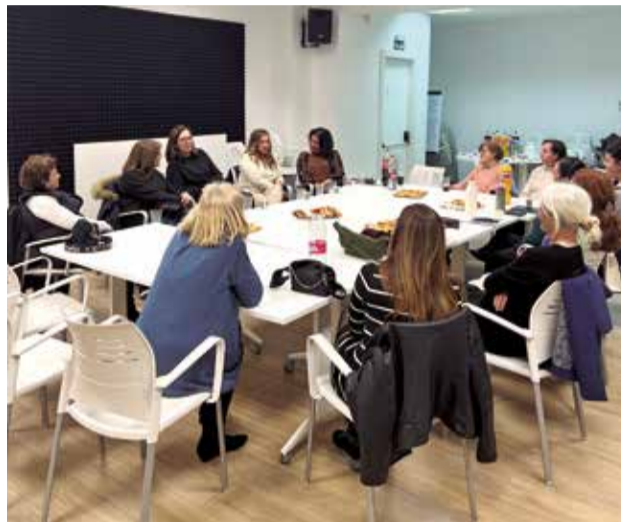
Café violeta en San Antonio de Benagéber.

Este Ayuntamiento tiene muy clara la importancia de asegurar que las voces de las mujeres sean escuchadas y sus contribuciones sean valoradas. Por ello, no solo celebramos el 8M como un