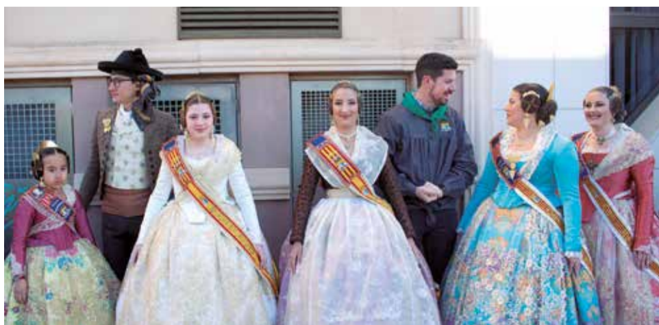
Diferentes instantes durante los primeros actos de las Fallas 2024 de la Pobla de Vallbona.