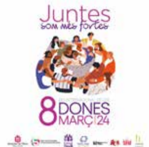
Cartell del 8M.

Paral·lelament, durant estos dies la façana de l'Ajuntament s'ha il·luminat amb motiu de la commemoració, la Biblioteca ha publicat la seua habitual guia de lectura en matèria d'igualtat, l'Oficina de Promoció del Valencià també ha fet pública una playlist