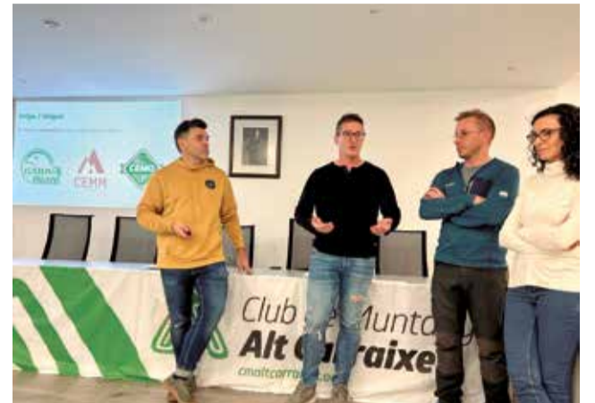
Un momento de la presentación.

Se trata de una nueva asociación que aúna los clubs ya existentes en las poblaciones de Olocau (CEMO), Marines (CEMM) y Gátova (Gátova TRAIL) con la intención de sumar fuerzas. Según el CMAC, "el objetivo principal es el de dinamizar las modalidades deportivas de montaña y escalada en el ámbito federado, y la práctica del ciclismo de montaña, contemplando el deporte como actividad física en el medio natural y rural, como medio de relación social y de defen-