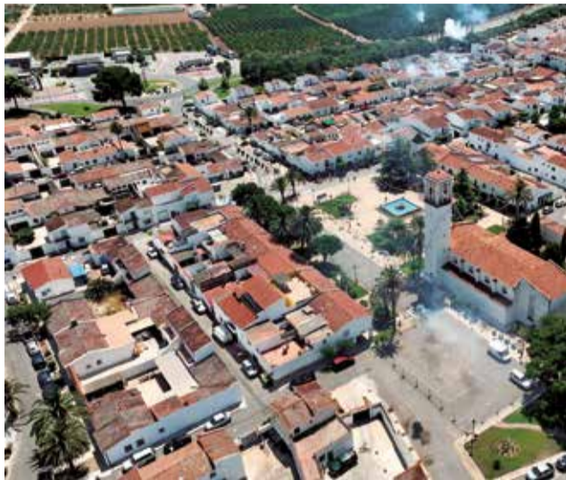
Una vista aérea de Marines.

En el apartado de gastos, una buena parte va destinada al ámbito social, como el mantenimiento del Aula de Respiro, la Escoleta Infantil y las actividades juveniles y deportivas. En este último ámbito, está prevista la reparación de la pista de basket-