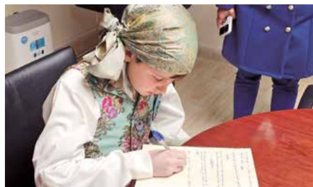
Varios instantes durante la Crida de las Fallas 2024 en Loriguilla.