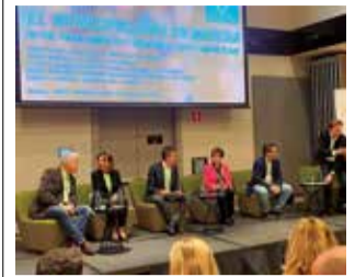
Encuentro en Madrid.