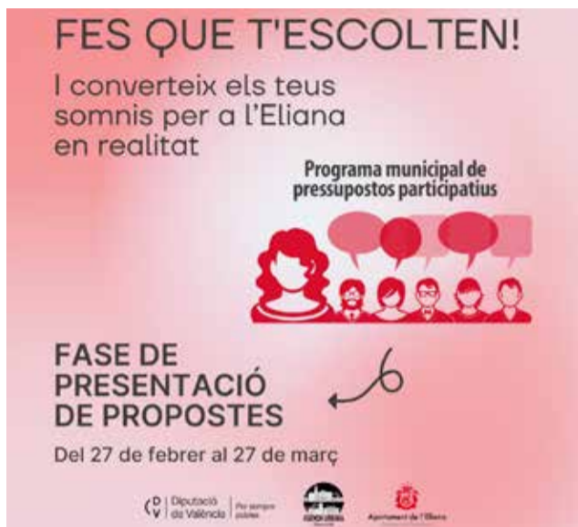
Cartell de la campanya de l'Eliaana.

Les propostes presentades no han d'excedir un valor d'execució de 100.000 euros, han de ser competència municipal, no han d'estar ja executades o en projecte