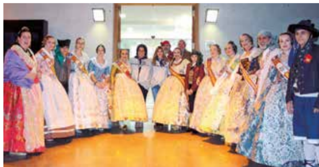
Varios instantes durante la Crida 2024.

quiso olvidarse de la tragedia que "ha oscurecido nuestro corazón los últimos días", en referencia al incendio en el barrio de Campanar de Valencia, mostrando su "solidaridad con las familias afectadas" y "recordando a todos aquellos que ya no están entre nosotros".