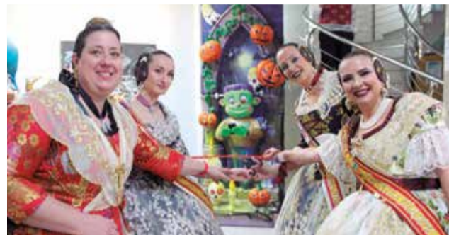
Inauguración de la Exposición del Ninot.

falleros y falleras reunidos en la Plaza.