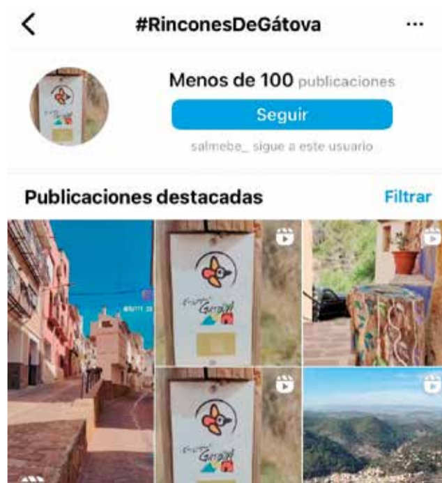
Publicaciones compartidas bajo el hashtag #RinconesDeGátova en Instagram.

tros negocios puedan vivir no solo de nuestros vecinos, sino también de un turismo respetuoso y sostenible, que es el papel que debemos asumir en el Ayuntamiento", explica Morán, quien invita "a todos aquellos que nos quieran visitar", asegurando que "repetirán por la calidad de nuestros productos, la calidez de nuestra gente, la pureza de nuestros paisajes y la fraternidad que se vive en nuestras fiestas".