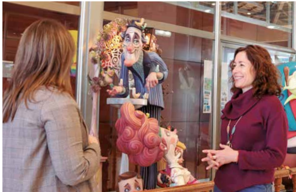
Un instant durant l'entrevista, junt al ninot indultat d'enguany.

M'agradaria donar-li més protagonisme al foc, que també és molt nostre, i recuperar la tradició amb una macrodespertà el dia de la Crida”