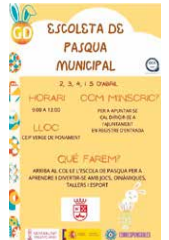
El cartell anunciador.