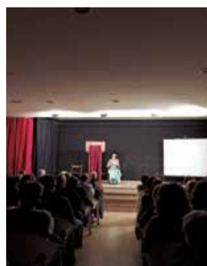
Públic assistent.

Com a introducció, Brínguez va realitzar un breu discurs en el qual va destacar la importància d'invertir en Igualtat, de promoure la coeducació i l'educació sexual i afectiva, i d'apostar per una