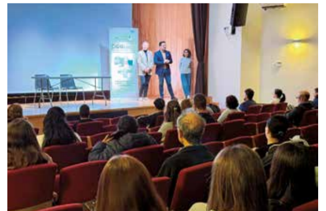
Curs de manipulador d'aliments a Vilamarxant.

"Estos cursos són una eina molt important i sempre que puguem col·laborar amb la Mancomunitat, posarem tota la nostra obstinació a continuar generant sinergies que estimulen la formació i l'ocupació", explica Troyano.