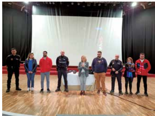
Charla en la Casa de la Cultura de Bétera.

“La formación es fundamental en esta época del año donde los valencianos y valencianas hacemos uso del material pirotécnico. Nuestros niños y niñas tienen que ser conscientes de los peligros que entraña no actuar responsablemente ante el material pirotécnico y por eso, trabajamos codo con codo con nuestra Policía Local para que les expliquen y les den consejos para una utilización adecuada”, ha desta-