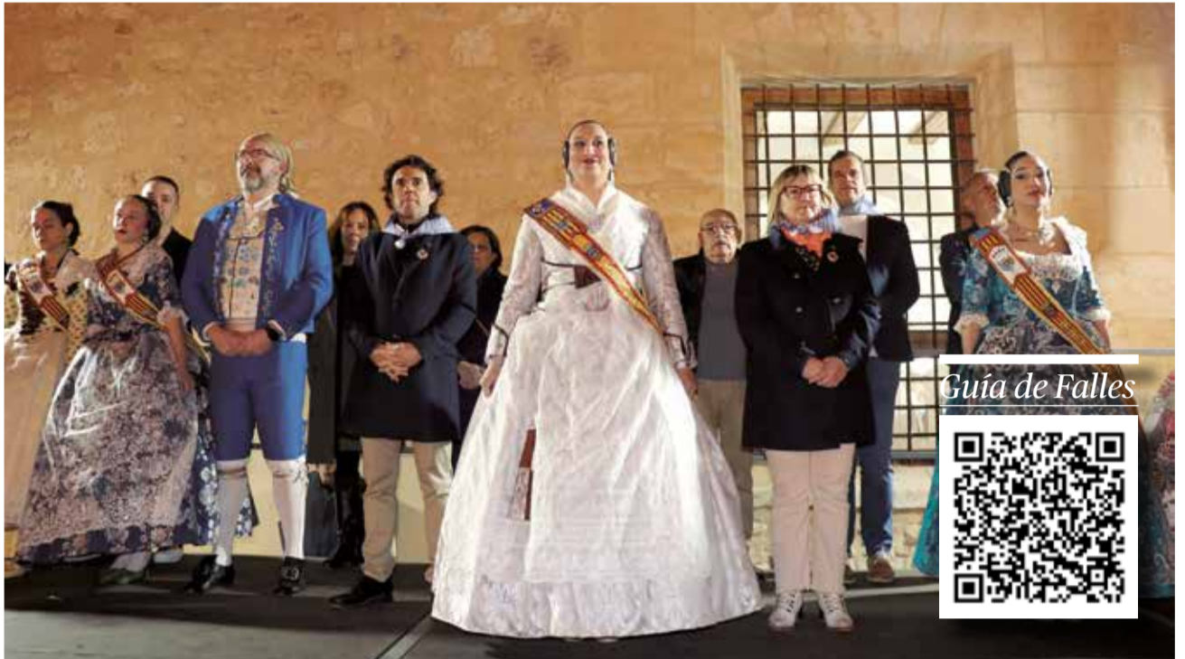
Autoritats municipals i representants de les Falles de Lliria durant la Crida.

A partir del dia 15, s'entrarà en la setmana gran de les Falles 2024, amb la plantà dels monuments o la Ronda d'Albaes Falleres oferida, un any més, pel Grup de Danses i Rondalla "El Tossal" de Lliria.