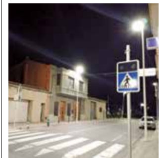
La luz en los pasos.