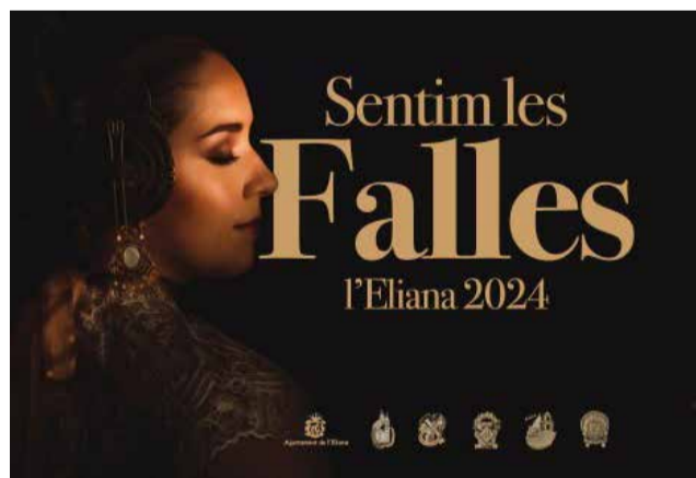
Cartell de les Falles 2024 de l'Eliana.

La setmana fallera començarà el dijous 14 de març amb la Plantà, quan els