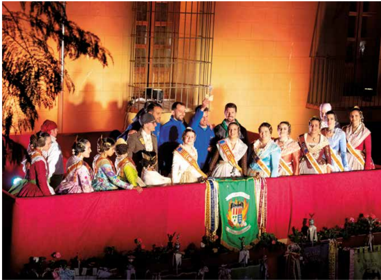
Crida de les Falles 2024 de la Pobla de Vallbona en Poeta Llorente.

La cubierta del parque será el escenario en el que, con las fallas ya plantadas y decorando toda la Pobla, se realizará la entrega de premios a las fallas ganadoras de este 2024. A partir de las 18:30 horas comenzará una