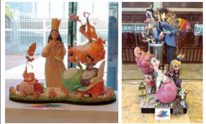
Ninots infantil y grande de la falla Carrer de Llíria.