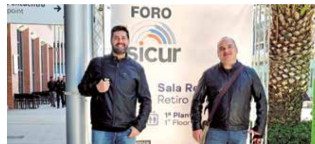
Representantes municipales en Madrid.