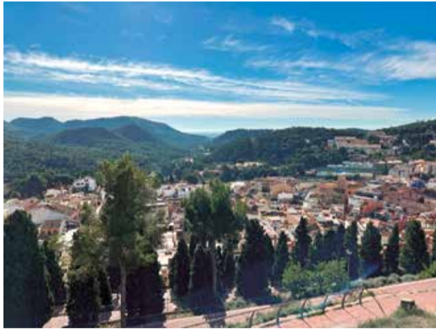
Vista de Serra des del Calvari.