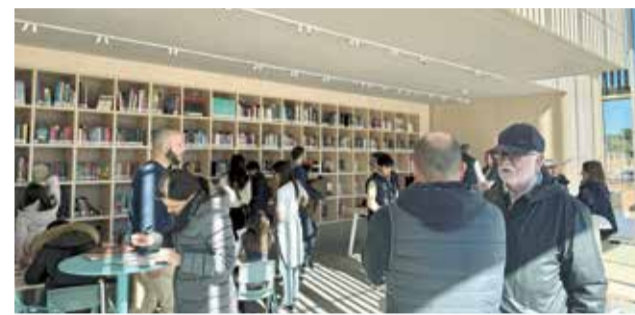
Inauguración y jornada de puertas abiertas.

da la ciudadanía. Tanto es así que las salas se cederán para celebrar actos y reuniones vecinales de las urbanizaciones. Además de ser un espacio para la convivencia y el desarrollo cultural, el Centro Cívico de Bétera también albergará actividades para todas las edades, desde cuentacuentos en inglés hasta clubes de lectura, con el objetivo de promover la educación y el entretenimiento para todos los públicos.