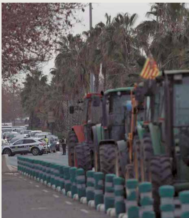
Els tractors prenen els carrers.

Les organitzacions professionals agràries de la Comunitat Valenciana, l'Associació Valenciana d'Agricultors (AVA-ASAJA), ASAJA Alacant, LA VA UNIR Llauradora i Ramadera, la Coordinadora Llauradora del País Valencià (CCPV-COAG) i la Unió de Xicotets Agricultors i Ramaders (UPA-PV), amb el suport de les Cooperatives Agro-alimentàries de la Comunitat Valenciana, han establert un pla d'acció conjunt per a denunciar la crítica situació que pateix el sector agrari. Des de fa unes setmanes estan realitzant una sèrie de mobilitzacions que van començar en el port de Castelló i que han continuat a la província d'Alacant i en el port de València. Paral·lelament, el sector sol·licita mantindre reunions amb delegació de Govern i Generalitat Valenciana