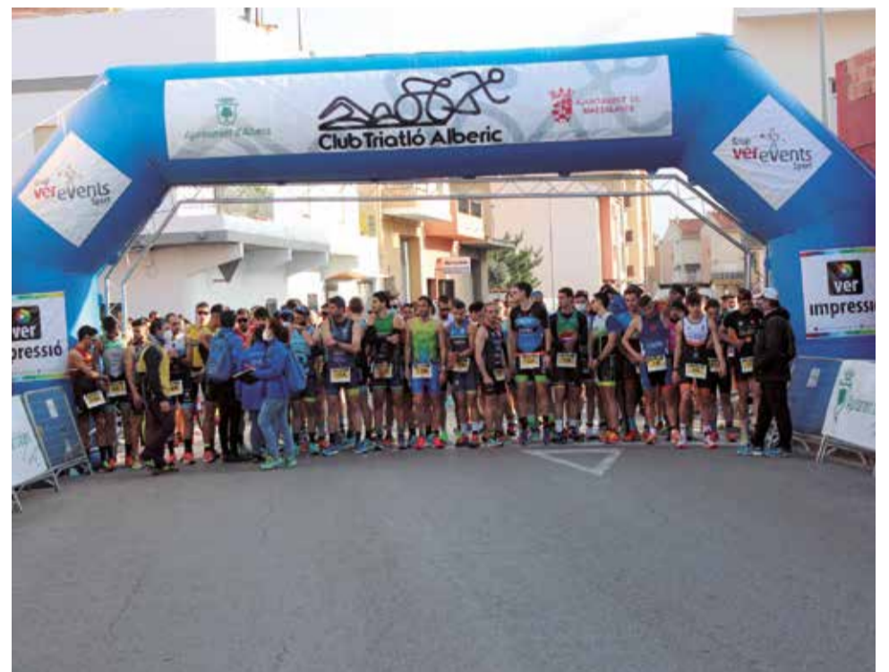
Foto d'arxiu competició Triatló d'Alberic.

prova de la Lliga de Clubs i serà Campionat Autonòmic, i això ens permet comptar amb la participació dels i les millors duatletes i triatletes de la Comunitat Valenciana. Des de la regidoria d'Esports volem seguir apostant pels nostres clubs i per fer del nostre poble una capital esportiva".