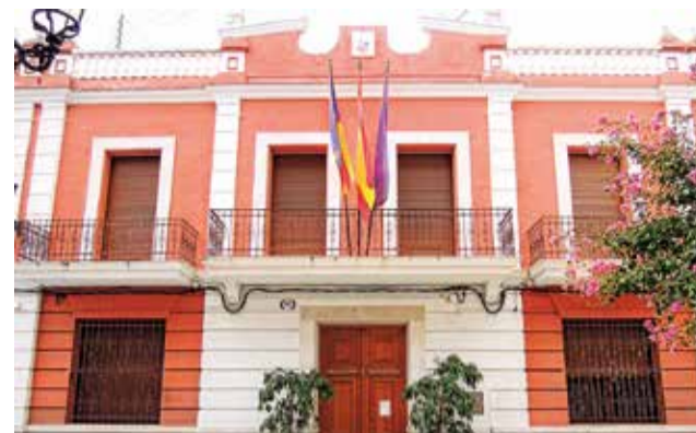
Ajuntament de l'Alqueria de la Comtessa / EPDA