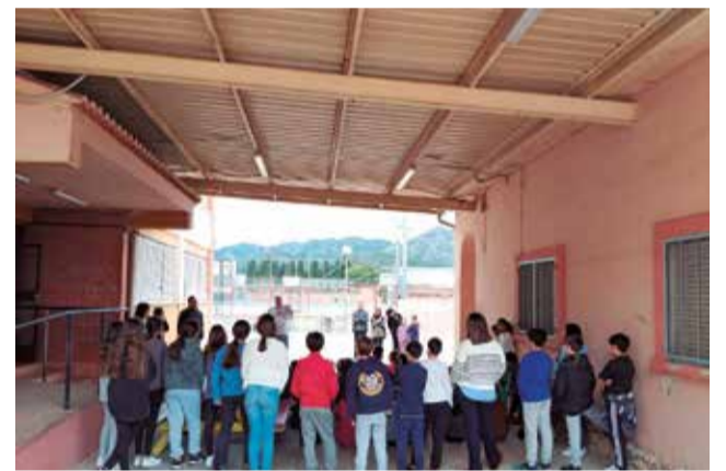
Moment de l'entrega dels premis.