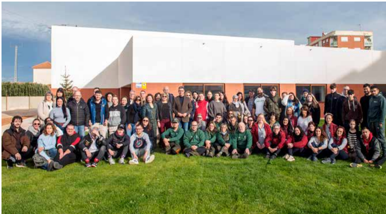
Recepció de benvinguda a l'alumnat participant en els set tallers mixtes de formació i ocupació

Aquest any 2024, l'Ajuntament d'Almussafes continua apostant per la generació d'ocupació a través de la seua adhesió a diferents programes promoguts per altres administracions, però en els quals la corporació municipal participa activament, tant amb aportacions econòmiques com amb la posada a la disposició d'aquestes iniciatives dels recursos materials i personals disponibles. «Implementarem aquesta lí-