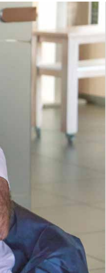
el Sercotel Plana Parc.

el tratamiento en frío en las naranjas que vienen de Sudáfrica para evitar que entren plagas en este caso. Por lo tanto, yo creo que allí no tienen una visión clara, única y exclusivamente de trabajar temas agrarios, si no vamos nosotros con un objetivo claro.