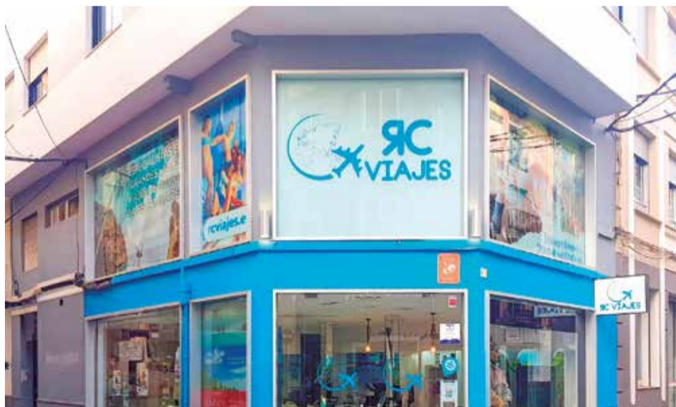
Instalaciones y fachada RC VIAJES / EPDA