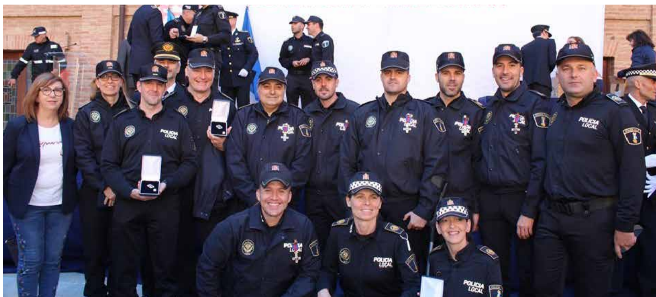
Arxiu d'imatges del cos de la Policia Local d'Alzira. / EPDA