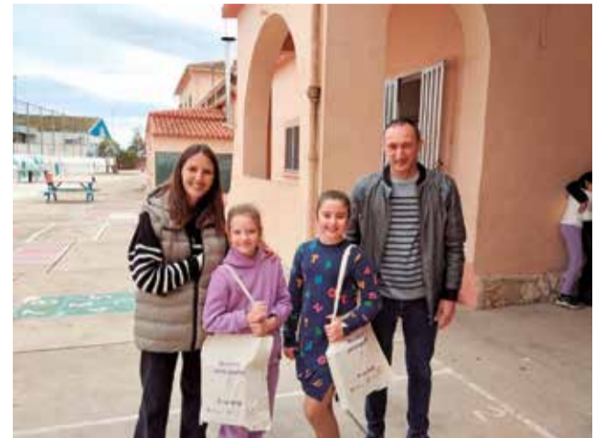
Premis Concurs "Benifairó per la igualtat"

El jurat va estar constituït pels mestres de l'escola CEIP Jaume II el Just. Des de la regidoria, veuen molt positiu este tipus d'accions, als col·legis. El dibuix i el lema guanyadors representaran la imatge del dia de la dona del 2024.