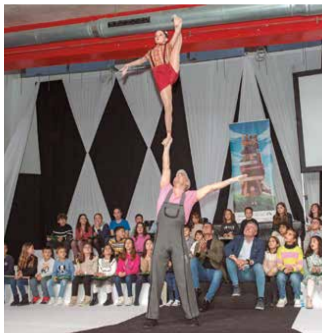
Una de les actuacions de la Gala.

A continuació, l'escenari va rebre als tres estudiants del CEIP Almussaf que han