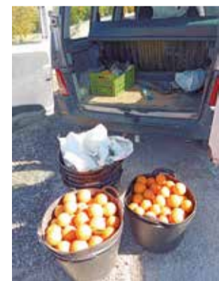
Taronges incautades.

A l'arribada dels vehicles policials els infractors encara es trobaven al lloc dels fets i els agents van poder interceptar el vehicle en què viatjaven i la mercaderia robada. La Policia Local va consultar les dades policials i va comprovar que tenien antecedents per altres delictes i una d'elles per tinença