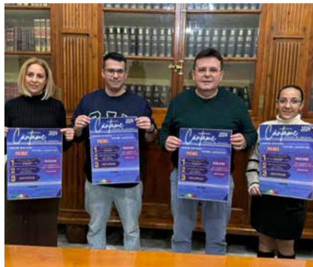
Presentació de la iniciativa.

El concurs, que es desenvoluparà durant diversos mesos, inclourà sessions de càsting, gales eliminatòries i la gran final, que se celebrarà al Centre Municipal Bernat