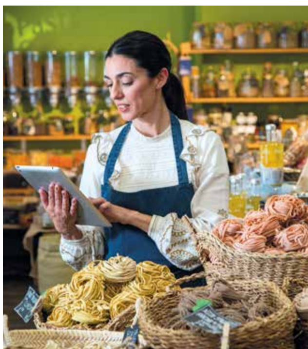
Los comercios ofrecen los mejores productos.

El turismo gastronómico se ha convertido en una razón importante para elegir la Comunitat Valenciana. A la gran oferta cultural, patrimonial, a sus playas y sus paisajes de interior, se suma también poder disfrutar de la dieta mediterránea, una de las gastronomías más sa-