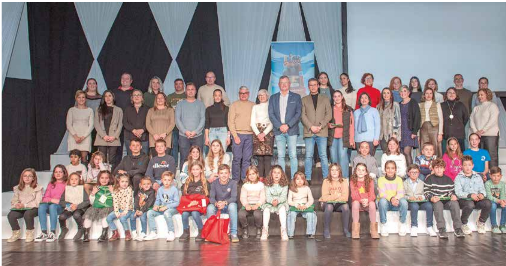
Foto de grup de tota la comunitat educativa d'Almussafes

DES DE LA REGIDORIA D'EDUCACIÓ S'HA PLANTEJAT UN PROGRAMA QUE INVOLUCRA A ALUMNAT I PROFESSORAT