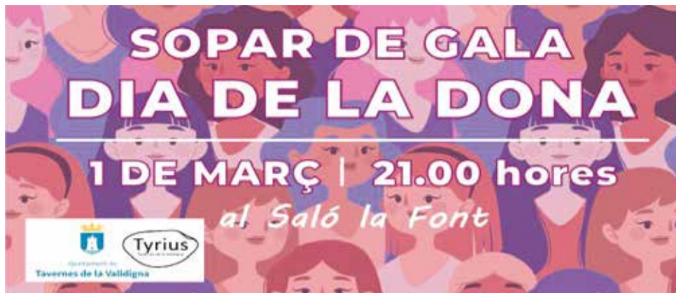
Cartell sopar de Gala Dia de la Dona.