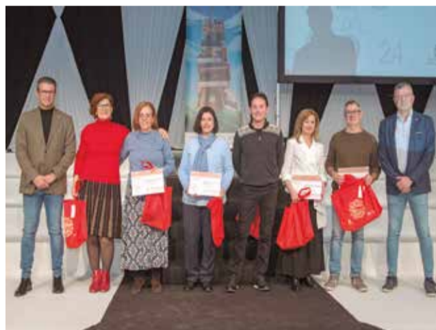
Imatge dels docents jubilats