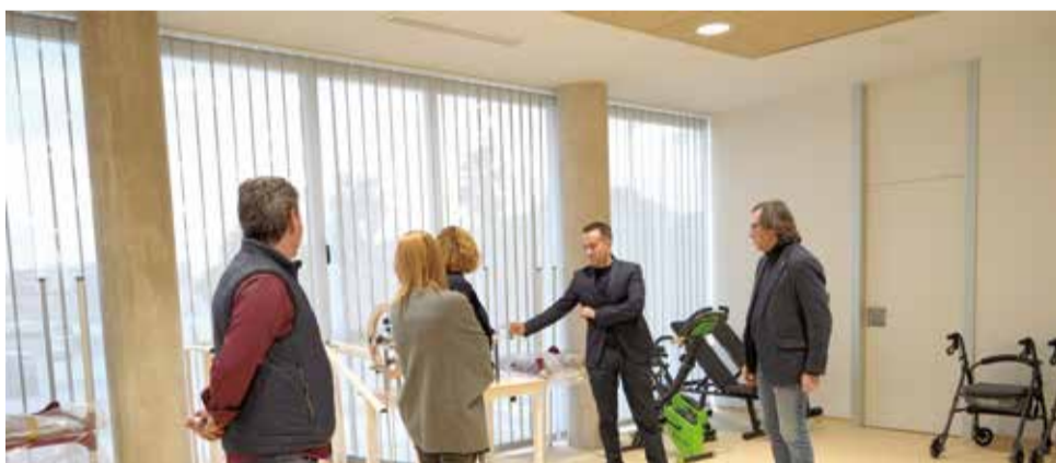
El DG de Servicios Sociosanitarios confirma el estado del Centro de Día de Alberic / EPDA

l'autorització definitiva en les pròximes setmanes per a que les i els usuaris que ho necessiten puguen, per fi, utilitzar este Centre de Dia en els pròxims mesos".