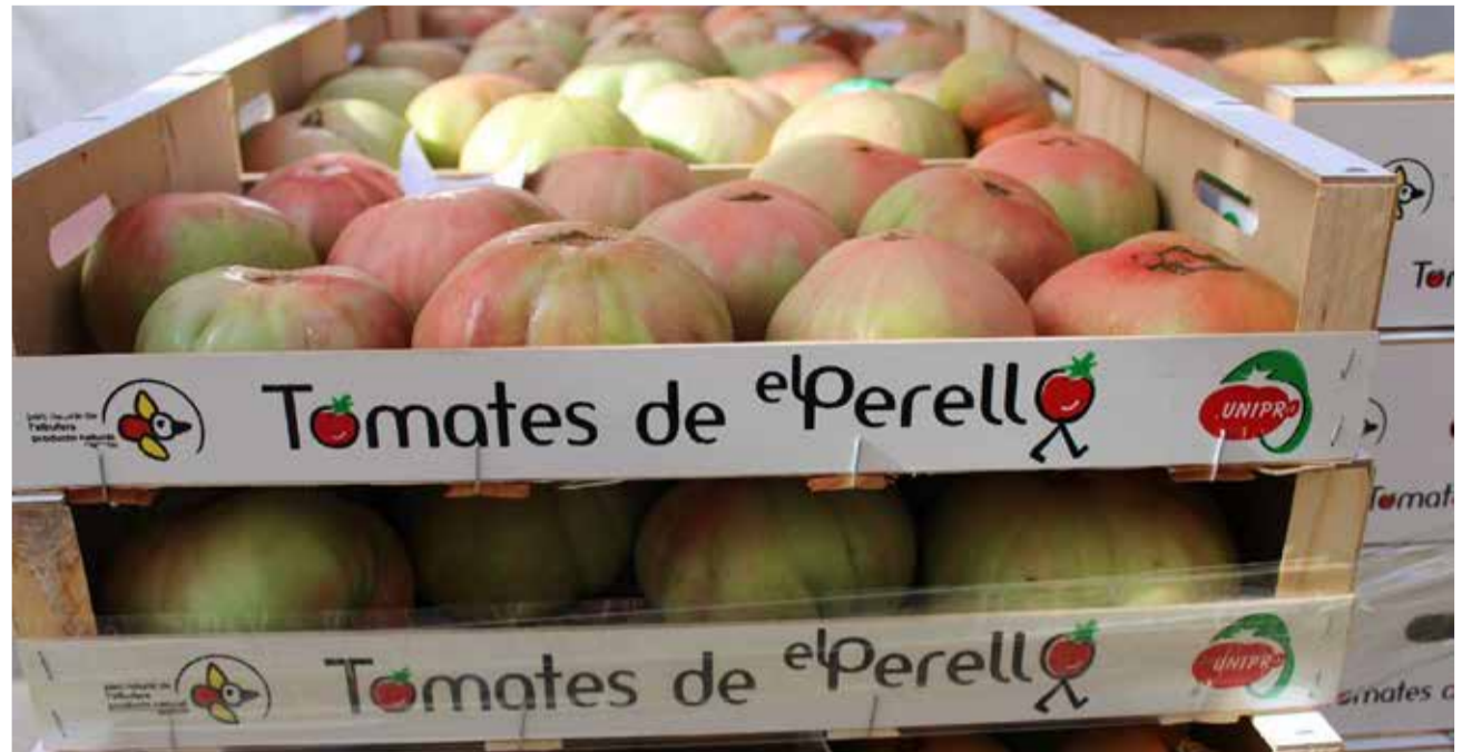
Tomates d'El Perelló.

Les tomates d'El Perelló no només són apreciades localment, sinó que també han guanyat reconeixement a nivell nacional i internacional per la seva excel·lent qualitat. La seua versatilitat a la cuina els converteix en un ingredient indispensable per als amants de la bona