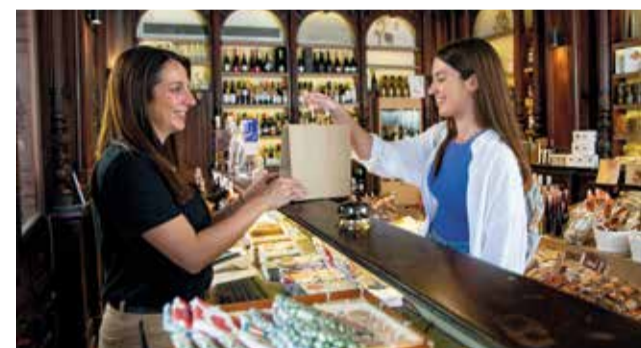
El trato amable y cuidado por los detalles.

característica y promover la hospitalidad en el sector turístico, realizando acciones formativas que fomenten ese trato amable y cariñoso hacia aquel que nos ha elegido para visitarnos.