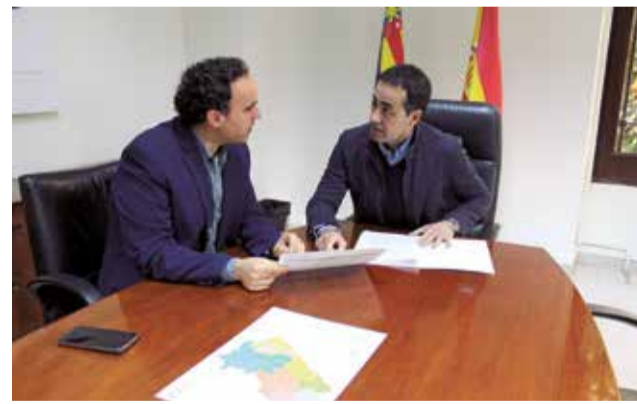
Reunión entre los diputados Andrés y Folgado.

La Junta de Gobierno celebrada el pasado 27 de febrero aprobó el acuerdo para la adjudicación del contrato derivado del acuerdo marco de suministro de energía eléctrica, que tramita la central de contratación. “Con esta aprobación activamos uno de los ejes principales de actuación de Diputació Resol, un plan que tiene como objetivo reducir el gasto energético de