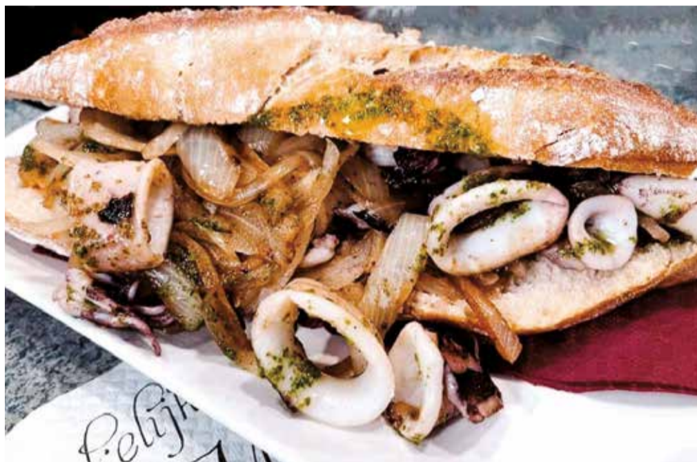
Un bocadillo de calamares, cebolla y picadillo.

Un almuerzo popular valenciano ha de ir, casi obligatoriamente, acompañado de pan. Y aunque no lo haga en forma de bocadillo, en el Camp de Túria y, especialmente, en Riba-roja de Túria, la 'pelaeta' ocupa el podio en cuanto a almuerzo típico se refiere. Se trata de una coca de pan, ya que la masa lleva agua, harina de trigo, levadura y sal, que es conocida también en otros municipios como 'coca en oli', 'coca saladà' o 'coca de cansalà', entre otros. Una masa crujiente y esponjosa que se acompaña de ingredientes como la longaniza, el chorizo, la morcilla, el tocino y/o la sobrasada en su superficie. Sin duda, un manjar característico de la comarca