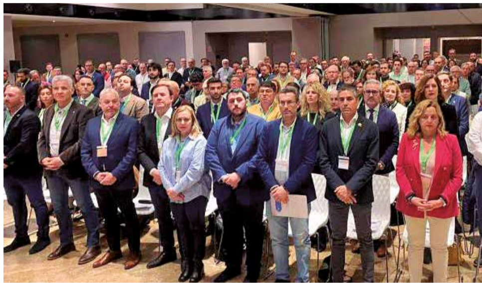
Asistentes a la Confederación Municipalista durante el minuto de silencio.

En el discurso inaugural, posterior al minuto de silencio por la víctimas del incen-