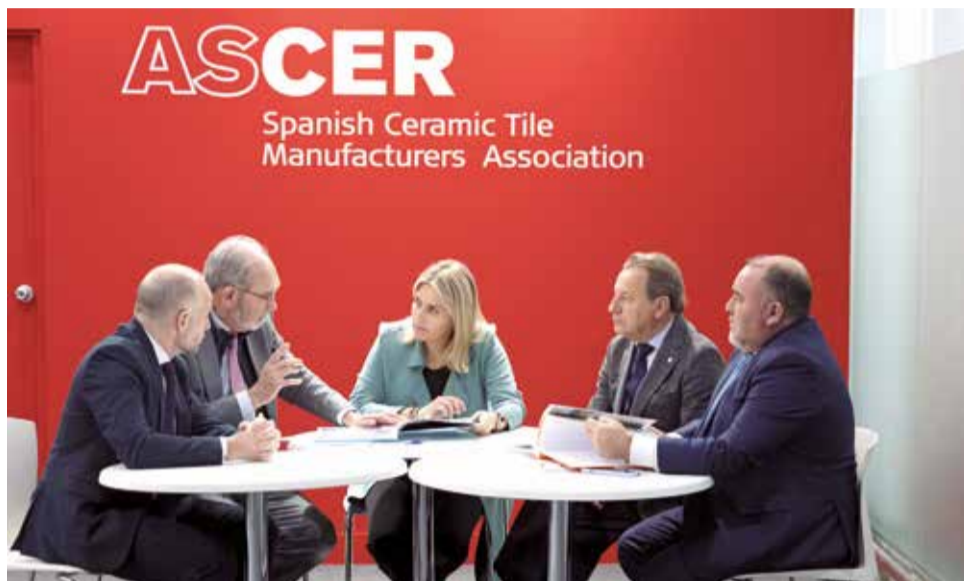
Reunión entre la Diputación de Castellón y Ascer en Cevisama.

Esta reunión es un ejemplo de la estrecha colaboración entre ambos entes y, como ha