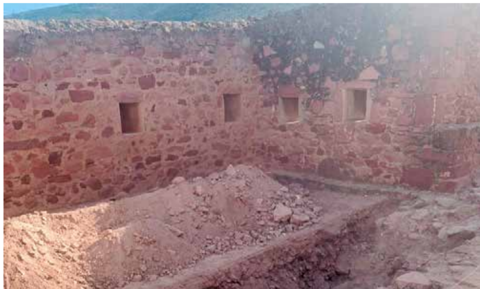
Trabajos en el Castillo de Vilafamés.

Las obras de adecuación del entorno arquitectónico del castillo de Vilafamés han empezado con las primeras tareas de señalización y excavación de las zonas donde se actuará. Así pues, con los trabajos de rehabilitación se pretende conseguir una correcta adecuación de accesos y recorridos interiores del recinto, con el fin de mejorar la accesibilidad y seguridad de los peatones dentro del recinto, proteger las áreas pendientes de excavación/intervención arqueológica y la conservación de los paramentos defensivos de la fortificación del recinto. Todo, con una inversión del consistorio que asciende hasta los 111.455,20 euros, obtenidos a partir de una subvención lanzada por Presidencia de la Generalitat Valenciana destinada a promover la protección, el fomento y el desarrollo del patrimonio y