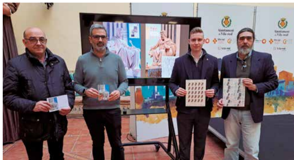
Presentación del sello conmemorativo del 750 aniversario de Vila-real.

Además, mientras se realizan los pertinentes trámites ante Correos, la Asociación