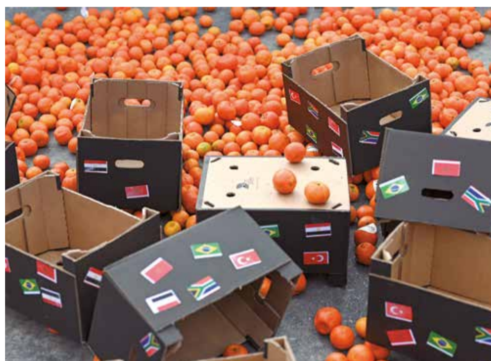
Cajones de naranjas volcados durante la protesta ante el Puerto de Castellón.