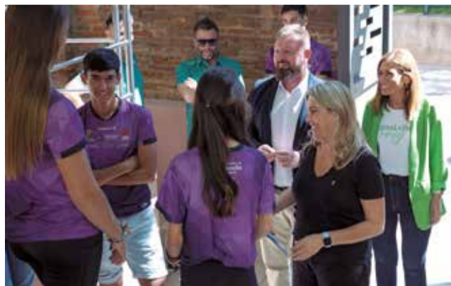
Recepción del Club de Atletismo Playas Castellón.

El proceso de selección se realizará en diferentes fases. En primer lugar, el alumno tendrá que rellenar un formulario de inscripción que se podrá encontrar en la web del centro y, junto a este, tendrá que anexar la documentación solicitada. Esta primera fase se realizará del 8 al 25 de abril de 2024.