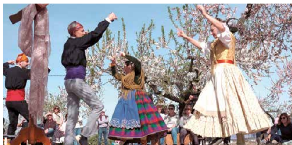
Espectacle 'Ametlers a escena' en Albocàsser

"L'evolució és molt positiva perquè la gent que ve un any repetix al següent i, al seu torn, ho explica als seus coneixuts i ningú s'ho vol perdre",