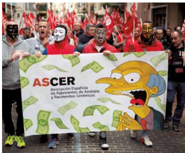
Manifestantes por el centro de Castelló.