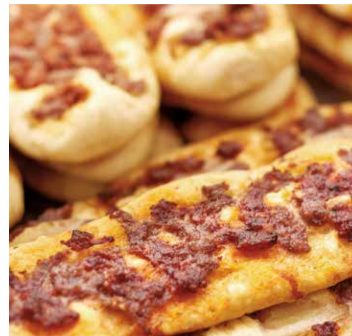
La 'pelaeta', típica de la comarca del Camp de Túria.

La comarca de la Ribera, acoge el bocadillo más conocido en toda la Comunitat Valenciana, denominado almussafes, (almussafes en valenciano), y llamado así por la localidad de Almussafes. Para su realiza-