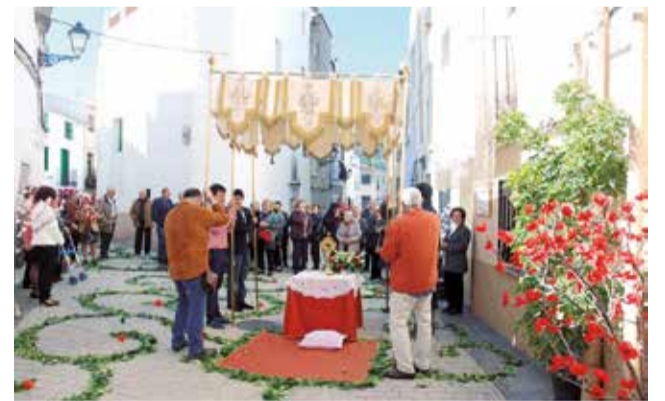
Edició anterior de la 'Festa del Reservat'.

A més, amb motiu dels 500 anys de la construcció de