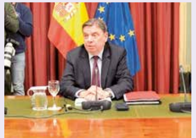
El ministro de Agricultura, Luis Planas.

- Apoyo al sistema de seguros agrarios combinados (284,5 millones de euros en 2024, más las aportaciones necesarias para su estabilidad), con adaptaciones de las líneas para tener en cuenta las