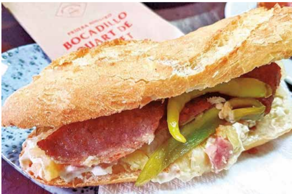
Bocadillo 'Quart de Poblet', típico del pueblo que le da nombre.

tidos de aceitunas y piparras, y para terminar un buen cremaet de ron.