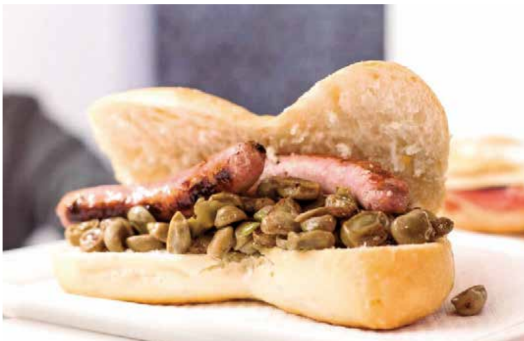
La 'pataqueta', un bocadillo típico del Camp de Morvedre que se come los jueves.