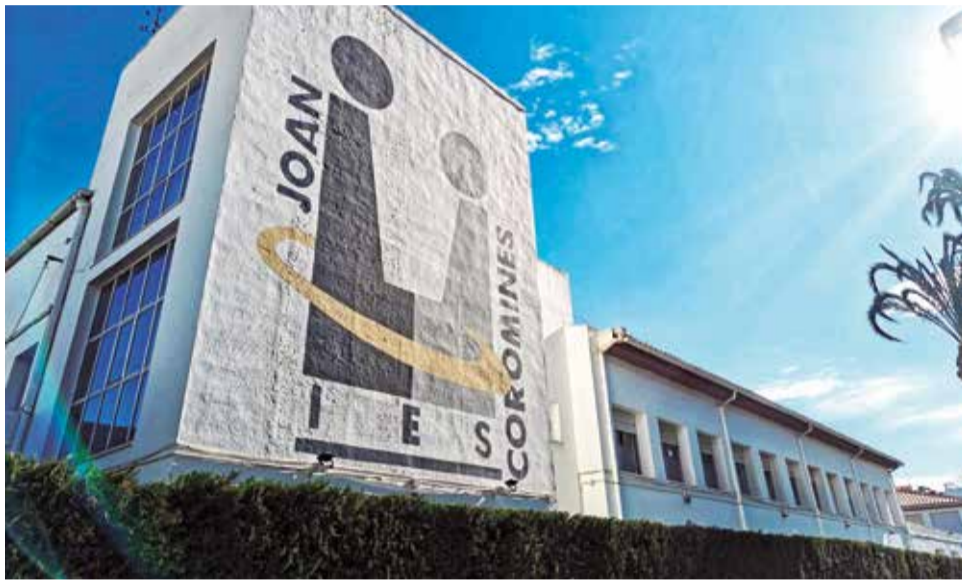
Estat actual de l'Institut Joan Coromines de Benicarló.