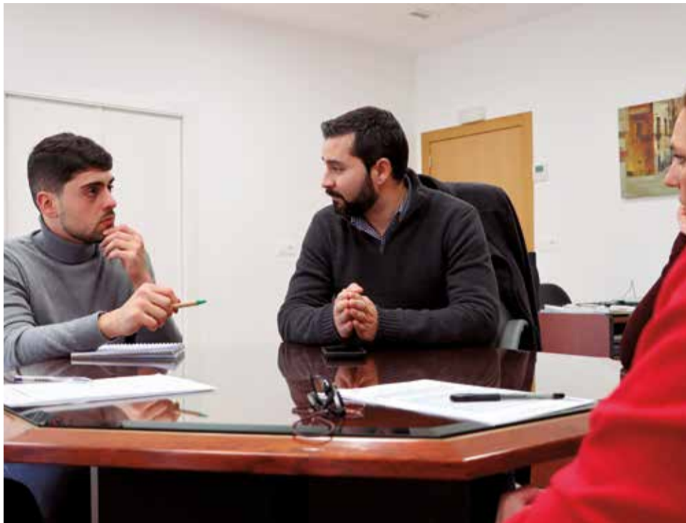
Comissió tècnica d'habitatge per a revitalitzar el barri antic de l'Alcora.

El regidor ha recordat que el govern de l'Alcora s'ha marcat com a meta revitalitzar el barri antic i, per a això, "és fonamental fomentar l'adquisició d'habitatges en esta emblemàtica zona de la nostra localitat".