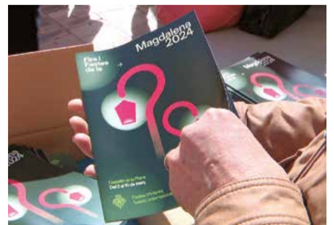
Entrega del llibret de la Magdalena.

Una altra de les novetats de les quals podran gaudir els castel·lonencs durant la setmana gran és l'ofrena a la Mare de Déu de Lledó del dissabte 9 de març, que tornarà a celebrar-se només amb el format tradicional a la vesprada.