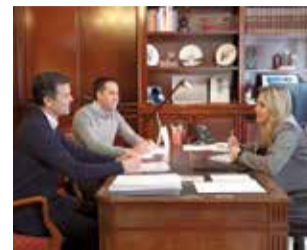
Reunión. / EPDA