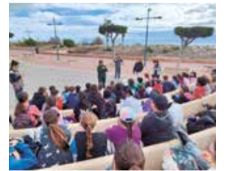
Jornada a Peníscola.