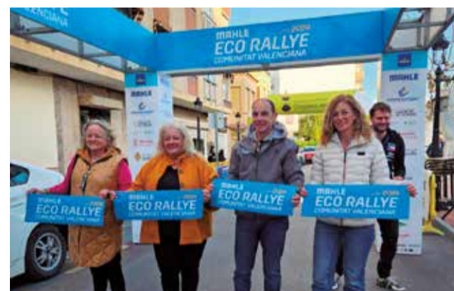
Parada del Eco Rallye en Oropesa del Mar.