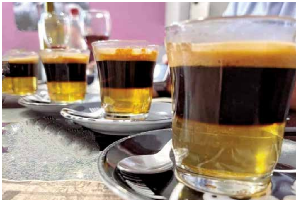
El 'cremaet', que acompaña a un buen 'esmorzar'.

valenciana, que se suele complementar, como en el buen almuerzo valenciano, de caicos y olivas.