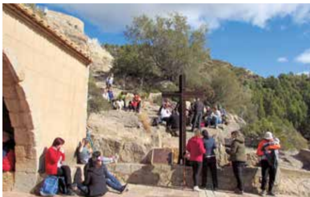
Esmorzar al Salvador de l'Alcalatén.

Esta commemoració consistix en una caminada, una missa i un esmorzar comunitari, un acte "molt important perquè celebrem el naixement de la nostra parròquia de sant Pere Màrtir a partir del fet dels trasllats de la campana i la pila i, al mateix temps, fem un homenat-