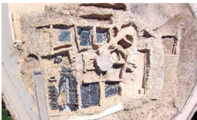
Jaciment iber del Puig de la Misericòrdia.

Cal destacar que per part de la Diputació s'han donat per finalitzades estes feines que es van iniciar per primera vegada el 2013 amb la finalitat de conservar i posar en valor el ja-