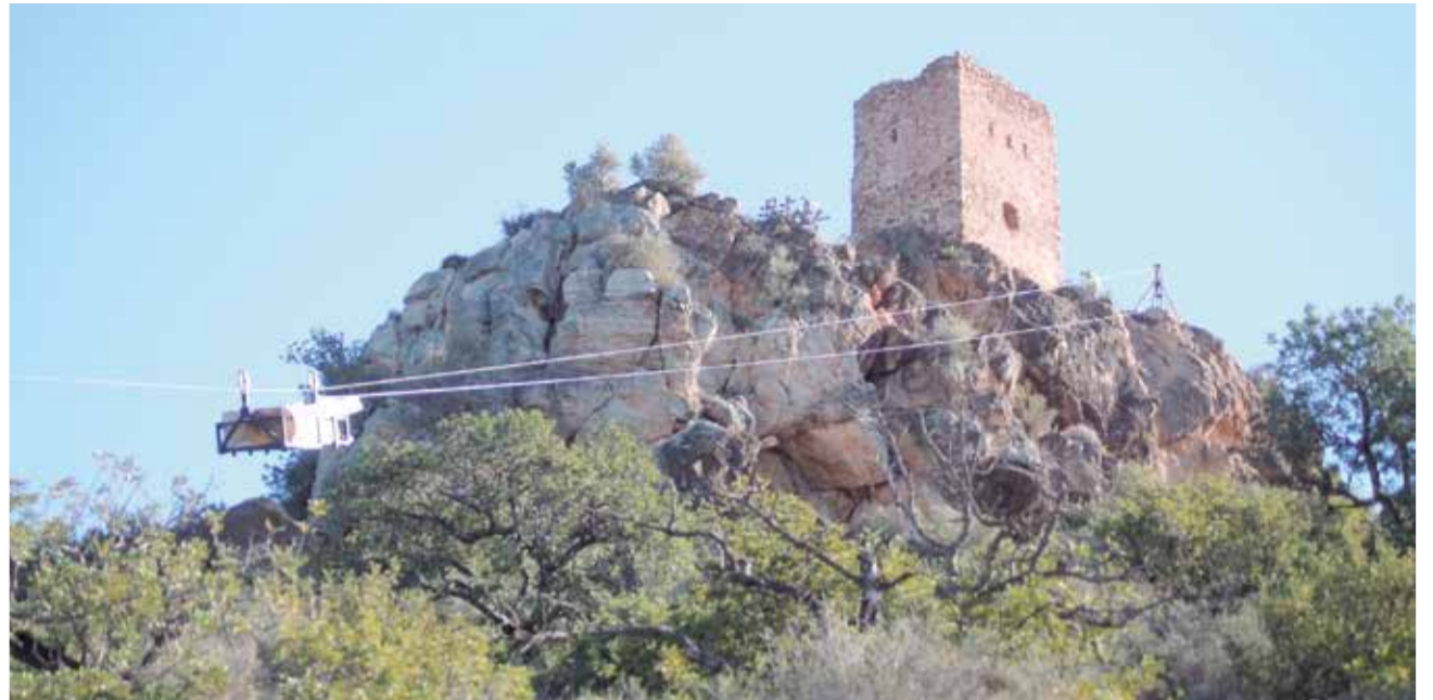
Trabajos en la 'Torre de l'Agüelet' de Almenara.

De esta manera se acometerá la necesaria obra de restauración y consolidación de la emblemática torre siguiendo los pasos e