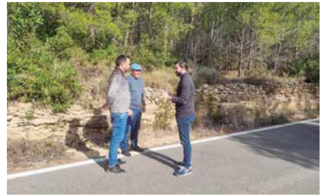
Representants municipals a la CV-192.