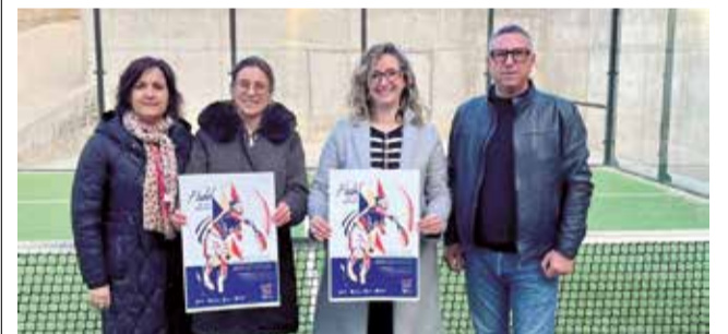
Presentació del torneig en Benassal. / EPDA