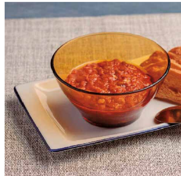
Titaina de tonyina, típica de los poblados marítimos de Valencia.

ción se unta el pan con sobrasada, se añade cebolla pochada y queso para a continuación tostarlo hasta que la grasa de la sobrasada impregne el pan y el queso posteriormente se funda. Además existen diversas versiones de almussafes a las que se le añaden jamón o tocino. Así mismo, este bocadillo puede prepararse como tosta, un emparedado abierto o sándwich abierto.