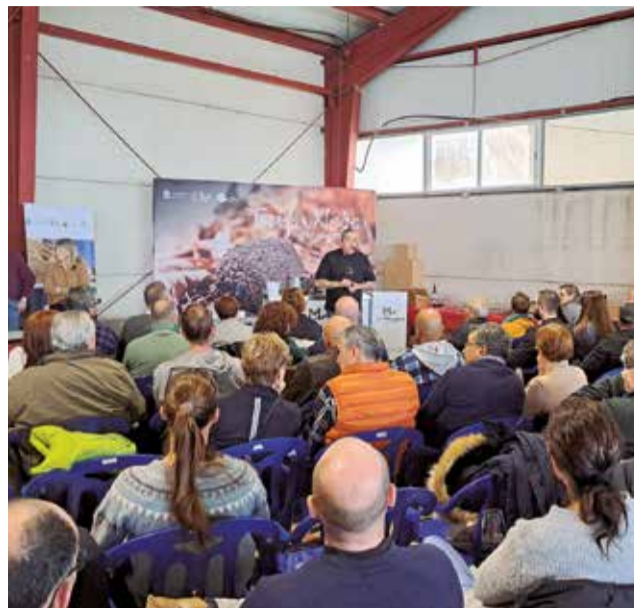
Diverses activitats de la XX edició de la Mostra de la Trufa de l'Alt Maestrat celebrada a Culla.

El divendres 23 de febrer, després d'un exquisit sopar trufada en el Restaurant La Solaneta de la localitat, es va celebrar el lliurament de la Tòfona d'Honor de l'Alt Maestrat 2024. Este reconeixement destaca la dedicació excepcional del Centre Públic Integrat de Formació Professional Costa de Flor del taronger (COSDA) en la formació en restauració i la promoció dels produc-