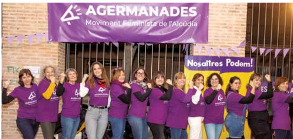
La festa de presentació es va realitzar al Parc de Patinatge de l'Alcúdia.

La diversitat del públic present va reflectir la vocació inclusiva i participativa de