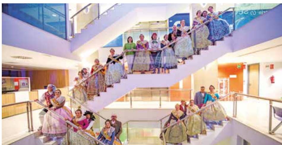
Tots els representants fallers del municipi van assistir a l'acte.

CENTENARS DE VEÏNS DEL MUNICIPI VAN EIXIR AL CARRER PER A REBRE L'APERTURA DELS ACTES FALLERS D'ESTE EXERCICI 2024