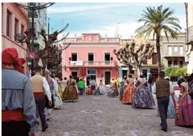
Alguns dels moments de la Crida al balcó de la Vila