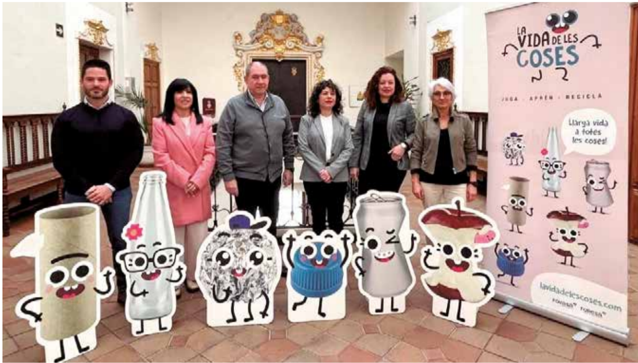
Presentación del proyecto: 'La vida de las cosas', de mano de la Concejalía de Agricultura y FOVASA/ EPDA

A los alumnos se les hace entrega de un cómic y se pone a disposición del profesorado todo el material visto en clase para poder profundizar en caso de estar interesados. Se pone a disposición, también, la APP del proyecto y la Web en la que poder ver los videos de las sesiones, realizarse fotos con los