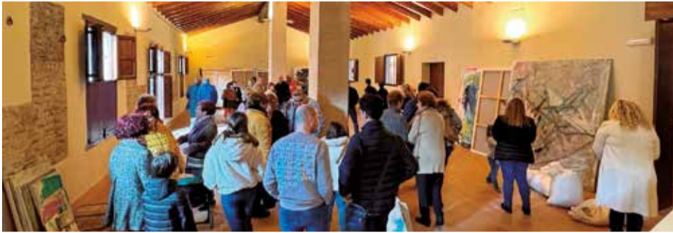
Una de les exposicions a la Setmana de la Dona d'Albalat.