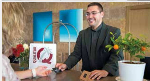
Los establecimientos ofrecen los mejores servicios.