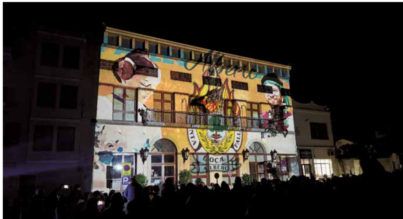
Els fallers del municipi d'Alberic es reuniren en la Plaça Constitució per donar la benvinguda a la festa fallera