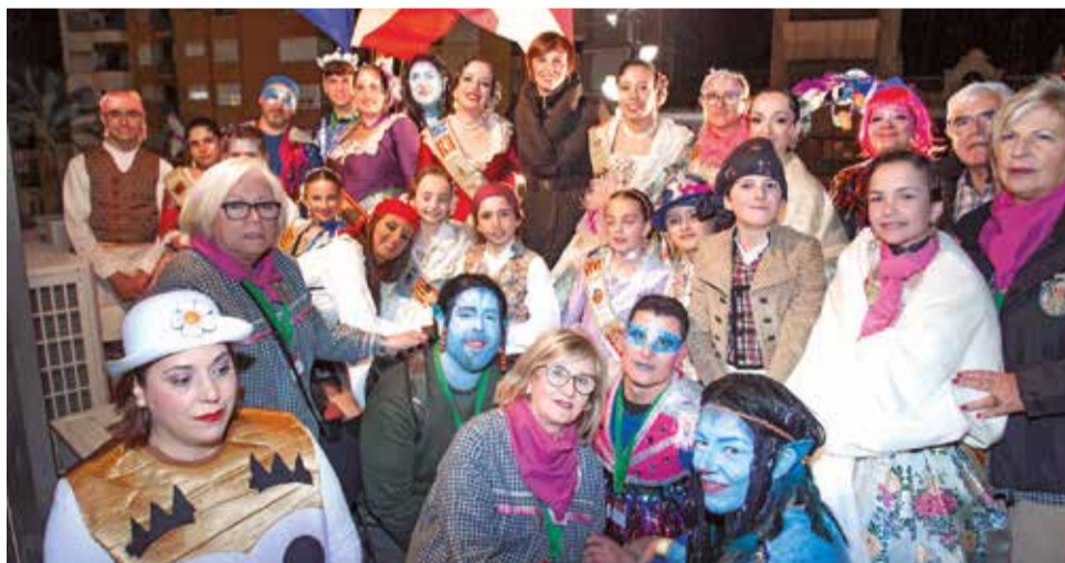
Grupo Junta Local Fallera.