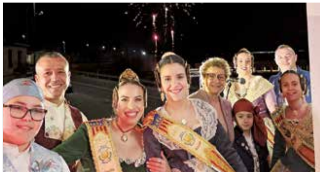
Moment de la Crida de Massalavés.

Continuaren el passat dimecres 6 de març, a les 17:30 hores en la Càmera Agrària de Massalavés, la xarrada "Cor i dona", i impartida pel prestigiós cardiòleg Plácido Orosa, que parlava dels factors de risc des de la perspectiva de sexe i gènere.