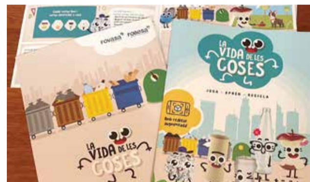
A los alumnos se les hace entrega de un cómic.