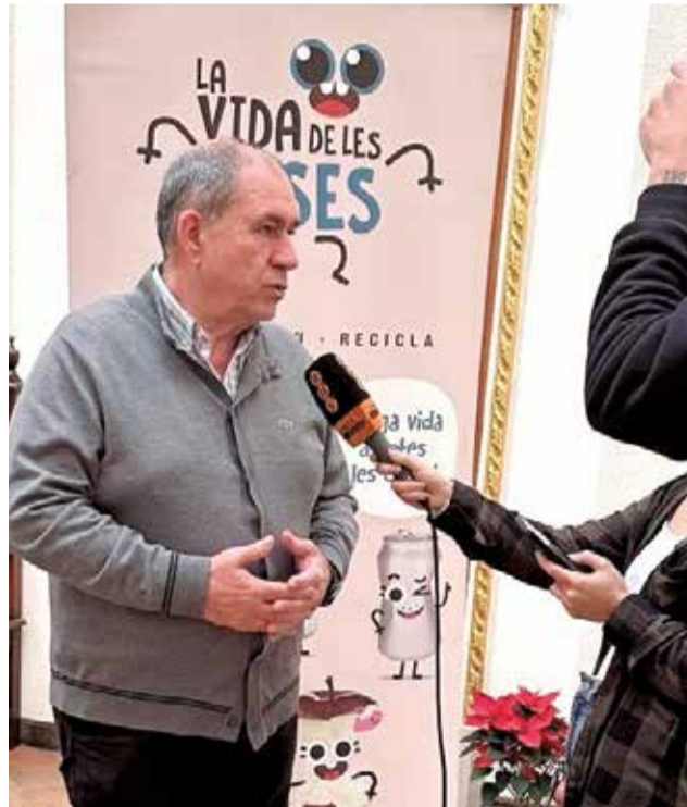
El concejal de agricultura atendiendo a los medios.