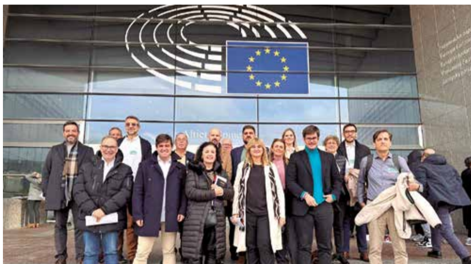
Imatge a les institucions europees amb la junta de govern.

gons una llei europea, ens obliguen a ficar-la. Així que des de la Mancomunitat es farà la gestió als municipis. I també es realitzaran una sèrie de jornades tècniques per ajudar als tècnics del municipi perquè puguen fer bé els seus càlculs, aprofitant el que la Mancomunitat ja sap.