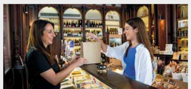
El trato amable y cuidado por los detalles.

mestre. Para conocer las fechas y los requisitos para acceder, solo hace falta entrar en: www.cdt.gva.es .