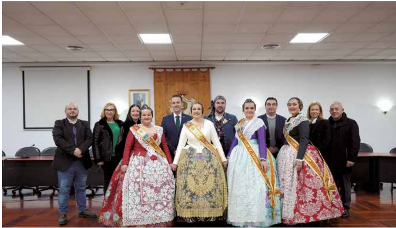
Alberic ha donat inici este cap de setmana al calendari faller del 2024 amb la Crida i la tradicional calvacada

Seguidament a la projecció sobre la façana de l'Ajuntament, i tot seguit als parlaments de les i els re-