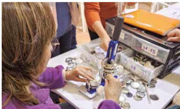
Taller de xapes igualitàries / EPDA

Seguidament, tindran lloc el cap de setmana, paelles i piscodansa, i la setmana que vé una excursió a la Pressa de Tous