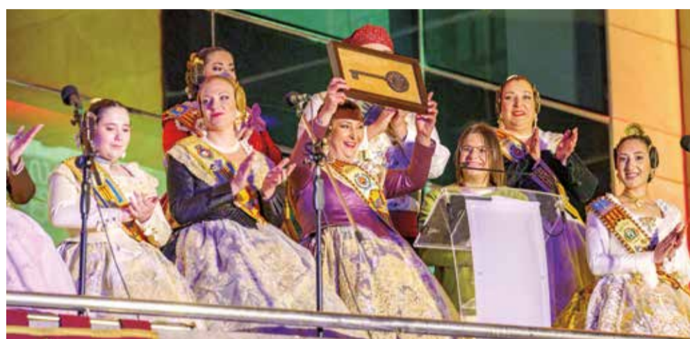
Des del balcó de l'Ajuntament es va convidar la ciutadania a viure la festa.