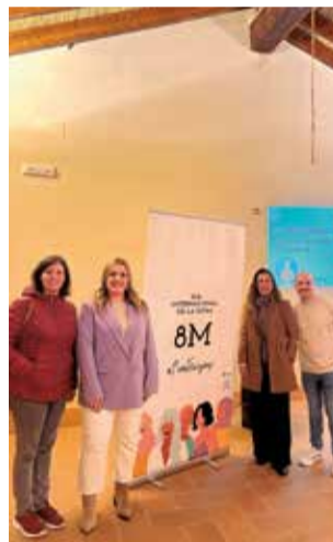
'Les imprescindibles'.

Per finalitzar, el dia 9 de març el teatre col·loqui 'INFINITA', a la casa de la cultura.