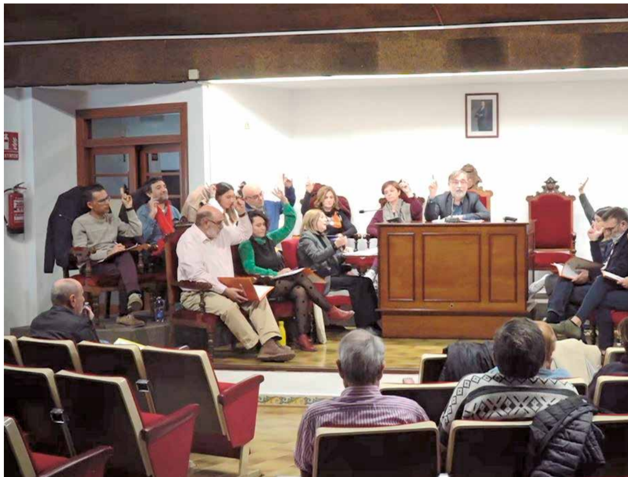
Un dels moments de l'últim plenari, on es va aprovar diferents punts en matèria d'igualtat

Hem de crear junts una societat on no hi hagen bretxes de gènere en l'ocupació, l'aspecte social i cultural, així com en l'emprenedoria, on la corresponsabilitat i la conciliació de la vida laboral i familiar siga una realitat, on hi haja equilibri entre dones i homes als òrgans de direcció i als llocs de decisió i participació. Per totes i cadascuna d'elles, la lluita en pro de la igualtat i la justícia social ha de ser incessant, des d'una aposta política paritària on les polítiques d'igualtat han de ser transversals i impreg-