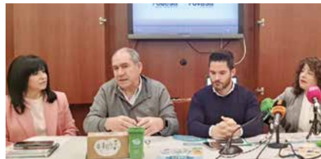
El concejal, técnicos y la responsable municipal.