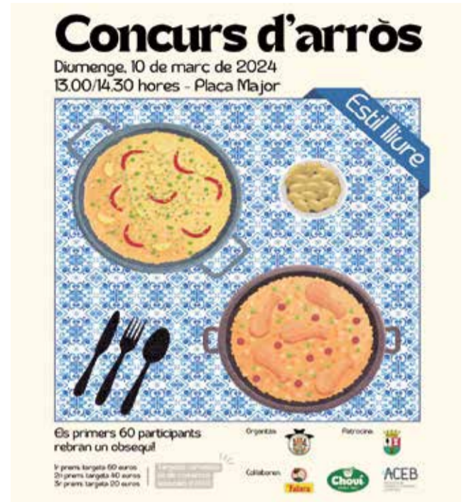
Cartel Concurso de arroz.

Desde la Junta Local se han establecido un total de tres premios en metálico con la colaboración de la Asociación de Comercios y Empresas de Benifaió (ACEB) para los tres mejores platos. Tres premios en metálico de 60 euros, 40 euros y 20 euros