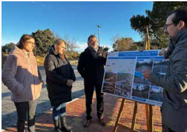
La alcaldesa y la directora general.

La directora general de Obras Públicas, Transporte y Movilidad Sostenible, Roser Obrer, junto a la alcaldesa de Altura, Rocío Ibáñez, ha visitado la zona y ha destacado la inversión de un millón de euros de la Generalidad para "mejorar las prestaciones de