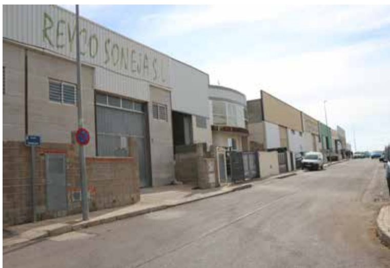
Polígono industrial de Soneja.