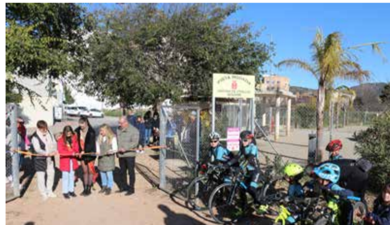
Corte de la cinta inaugural.