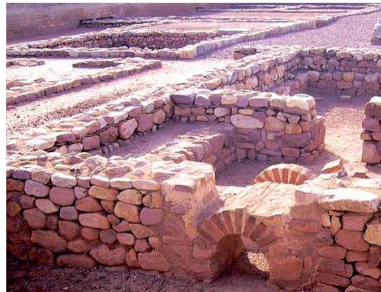
Villa Romana de Benicató, un yacimiento arqueológico ubicado en la localid

ra recorrer, a pie, en coche o en bicicleta, y así conocer de cerca los elementos y espacios que componen su riqueza.