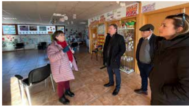
Diputados y representantes de Fanzara.