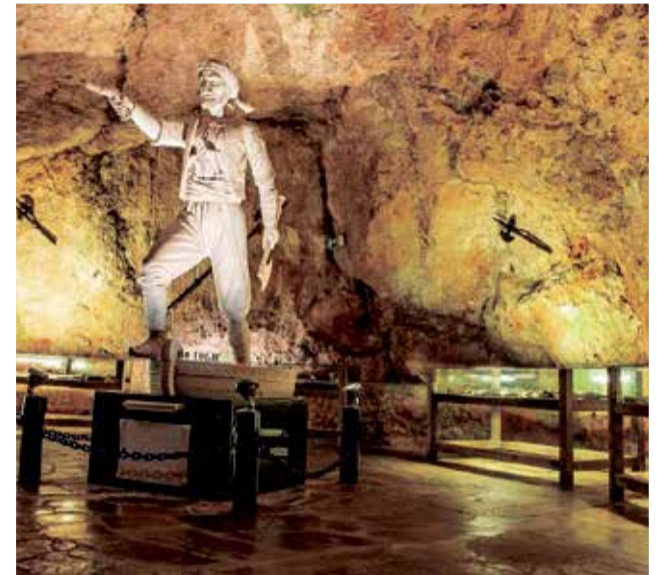
Cueva del Dragut de Cullera. / EPDA