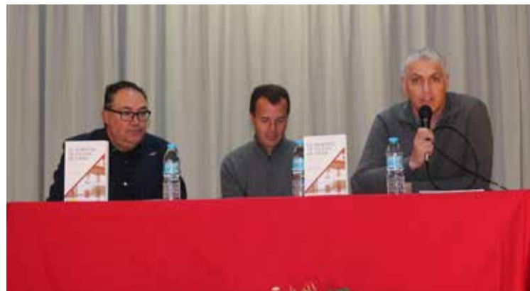
Los autores durante la presentación del libro.