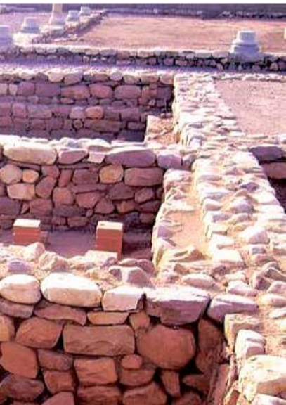
dad de Nules.