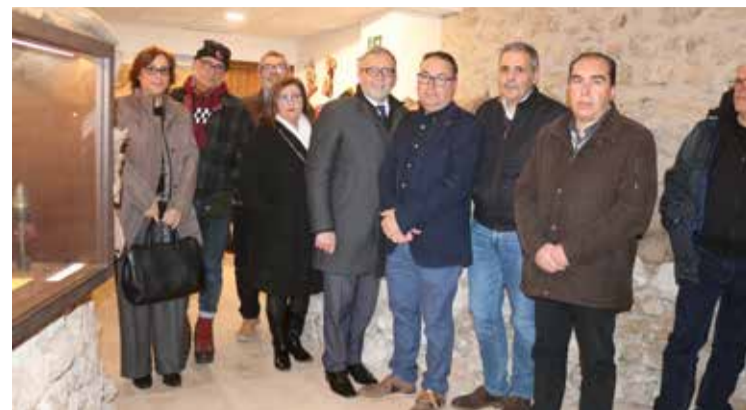
Autoridades en la inauguración.