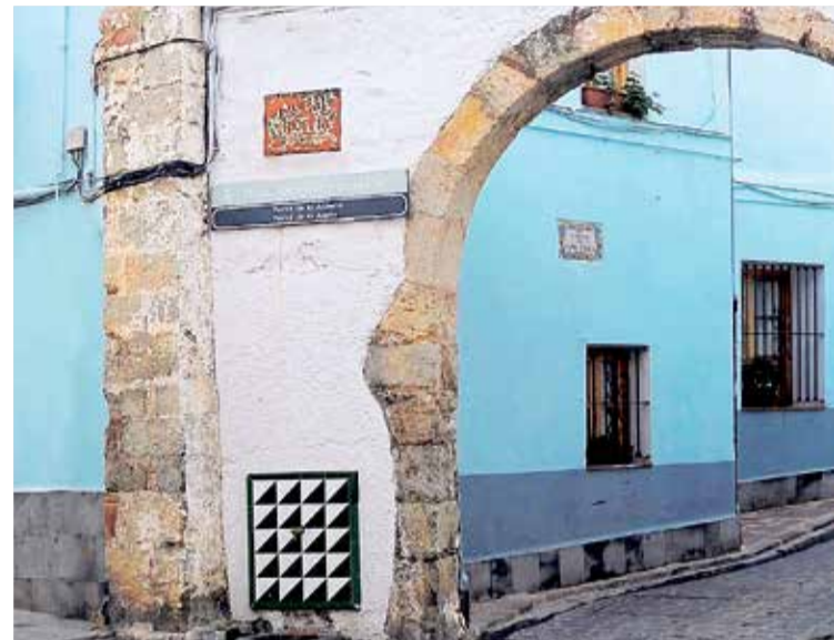
Entrada a la zona de la judería de la ciudad de Sagunt.

Nules es tierra de marjal y naranjos, de patrimonio y cultura. Una localidad pa-