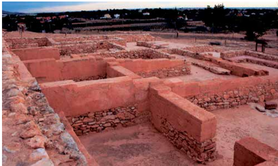
Yacimiento del Tòs Pelat de la ciudad de Moncada.

Cada vez son más los municipios de la Comunitat Valenciana que optan por dar a conocer su riqueza patrimonial mediante atractivas propuestas que van desde visitas guiadas a rutas teatralizadas que trasladan al visitante a otros momentos de la historia. A continuación, se han seleccionado algunas de estas iniciativas que se realizan en distintos municipios de las comarcas valencianas.