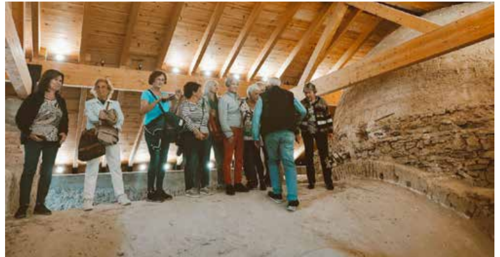
Se pretende mostrar los recursos del municipio.

Todas aquellas personas que estén interesadas en par-