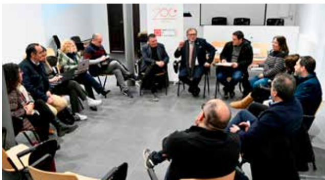
Diputados reunidos con alcalde de Montanejos.