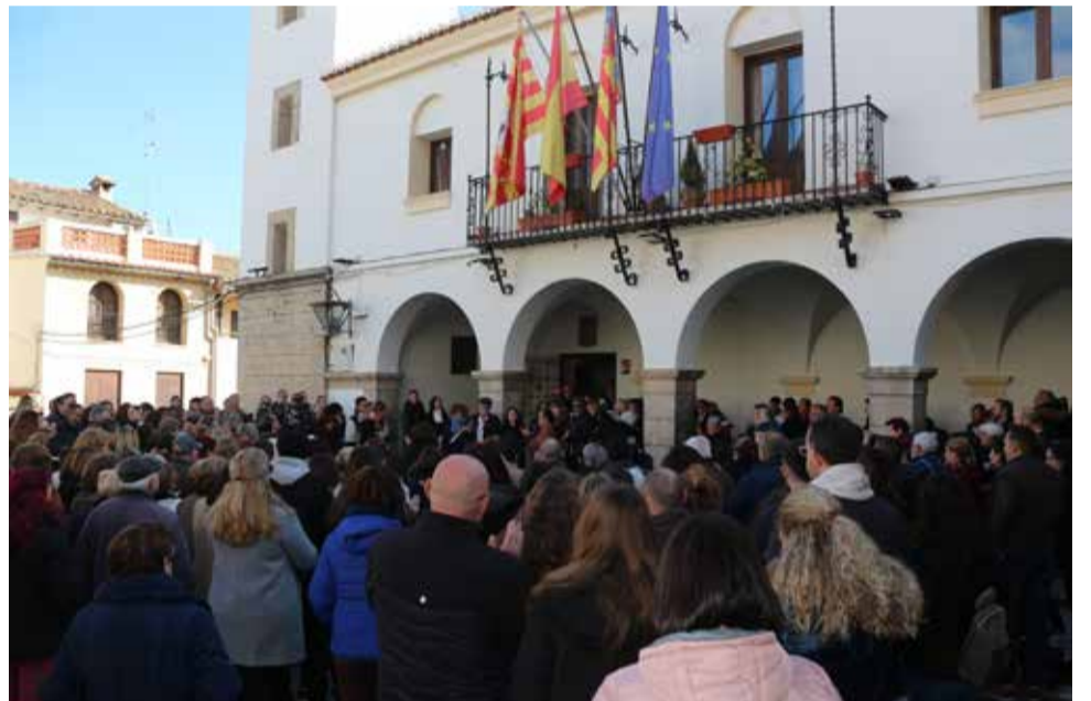
Minuto de silencio en la plaza del Ayuntamiento de Jérica