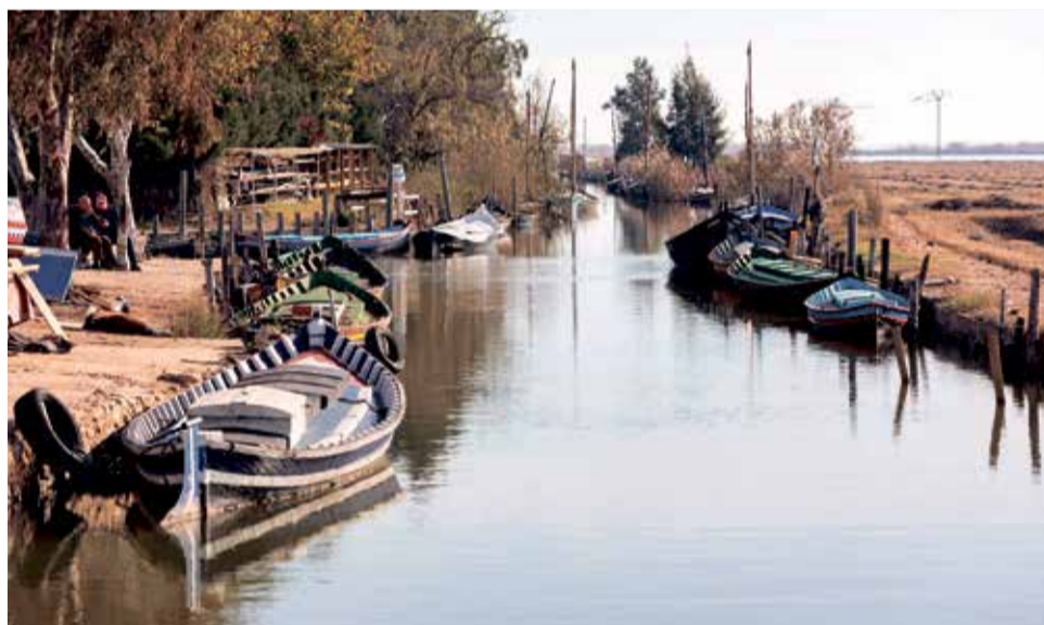
El Parque Natural de l'Albufera es una explosión de biodiversidad y paisajes.

del primer barroco valenciano, dejando su huella en la Catedral de Valencia entre otras. Es la estancia más exquisita de la Iglesia Parroquial San Juan Bautista, que junto al Convento de Carmelitas Descalzas, la ermita del Socós o la vetusta Torre de Anibal o del Molino, ade-