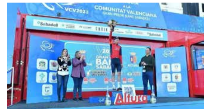
Representantes de Altura con el ganador.