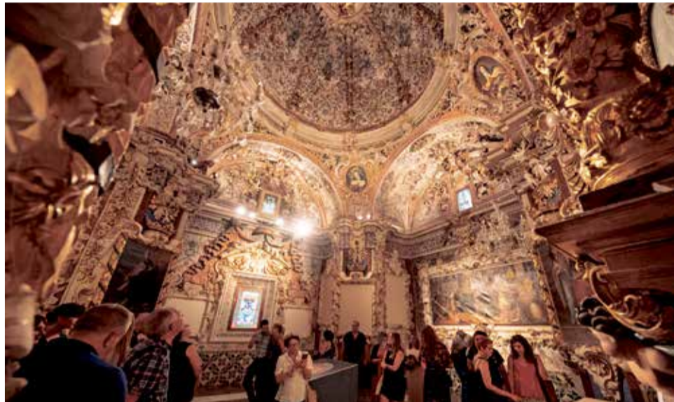
Capilla barroca en el municipio de Caudiel.