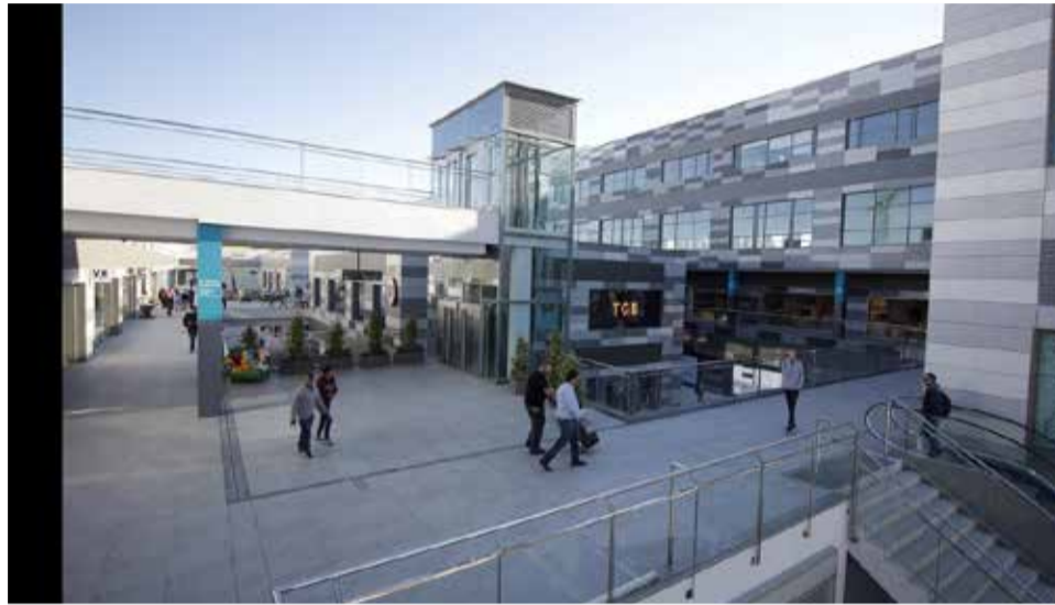
Centro Comercial Lepicentre.

Mientras se producen estas aperturas, los clientes del Centro Comercial, pueden disfrutar de las segundas rebajas que siguen presentes en los locales de Lepicentre con precios espectaculares y de la mejor zona de ocio infantil del Norte de Valencia con LEPILANDIA donde los padres pueden mantener entretenidos y divertir a los más pequeños de la casa con las