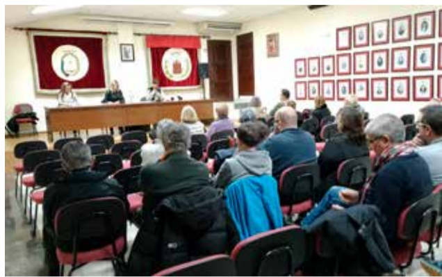
Reunión del patronato local.