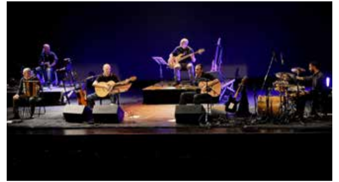
Celtas Cortos actuará en Montanejos en verano