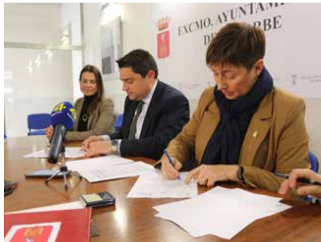
Firma del contrato en el Ayuntamiento.

En virtud de este convenio, el Centro Hípico va a tener uso educativo, asistencial y deportivo y Segorbe se convierte en sede de la UCV con el consiguiente impacto económico para la ciudad y la comarca del Alto Palancia. "Estamos muy orgullosos de que la UCV haya sido la adjudicataria del concurso de licitación para la explotación de este centro que se convierte en el único de estas características en la región al combinar el uso docente, un uso asistencial con el hospital ve-