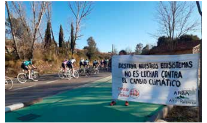
Una pancarta al paso por Sacañet.