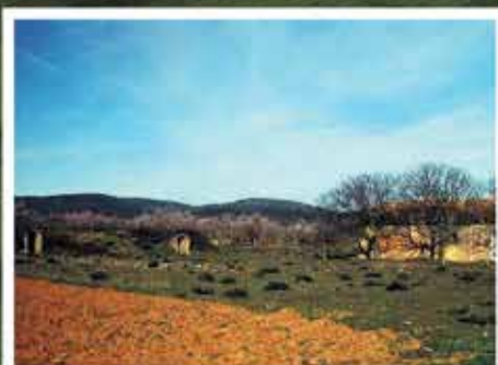
Campo de aviación