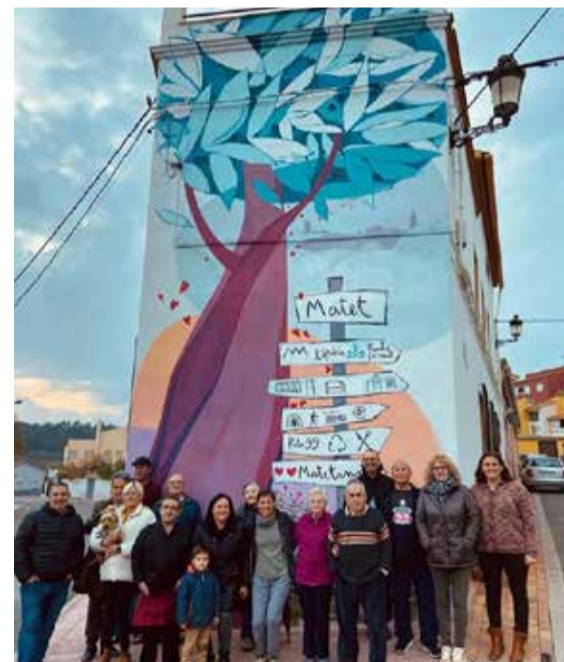
La alcaldesa con vecinos.

La alcaldesa ha señalado que "desde hoy nuestro pueblo es todavía más bonito si cabe. Y lo es gracias a la generosidad de grandes vecinos y al empeño de todo un pueblo que se siente orgulloso de sus raíces".