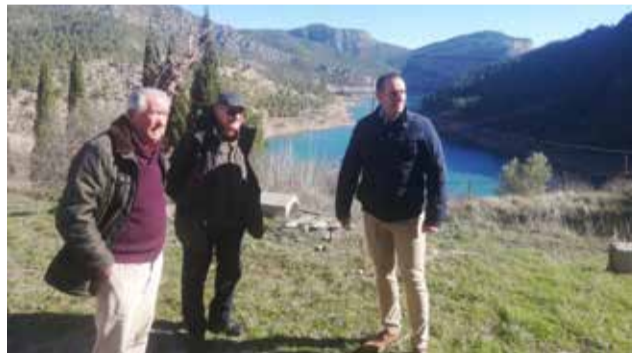
En Puebla de Arenoso con concejales.