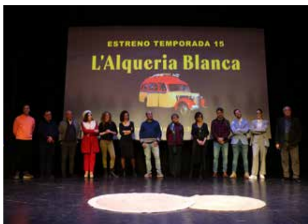
Actores y productor de la serie.