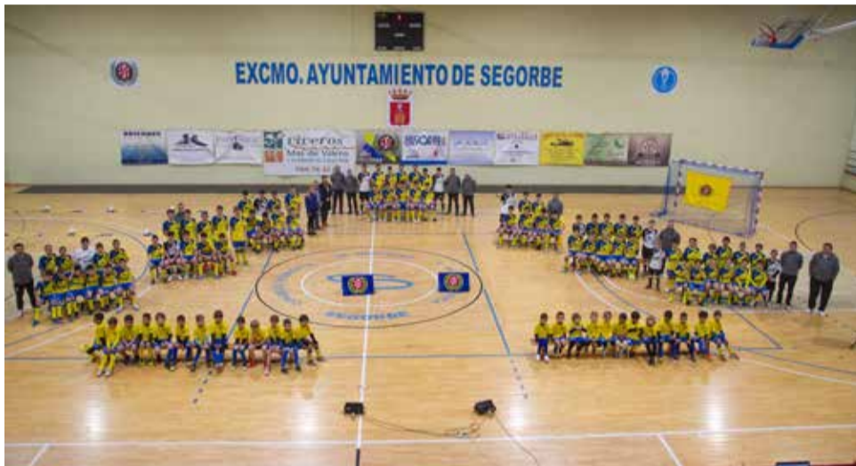
Todas las plantillas sobre el parquet.

En total, más de 120 jugadores entre los siete equipos federados y la escuela de iniciación que tiene el club y la veintena de técnicos que se están encargando de su preparación. Son jugadores que forman parte de selecciones