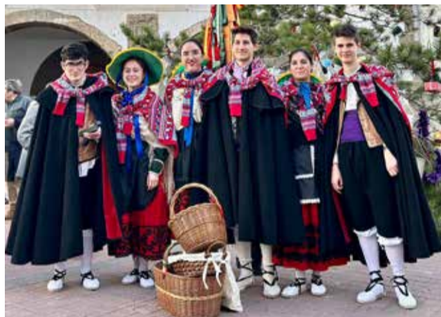
Los mayores de Pina con novedades.