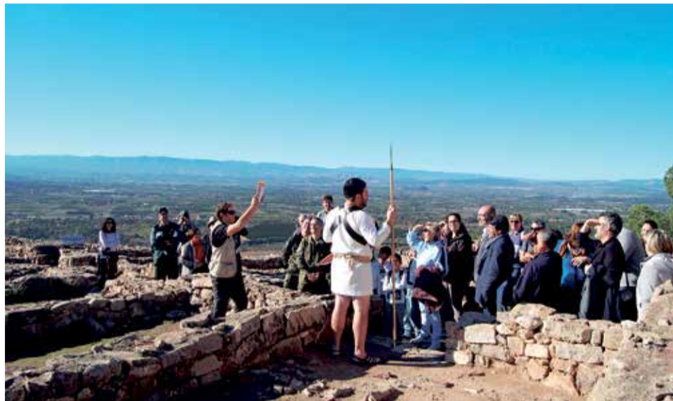
Vestigios íberos de El Puntal dels Llops en el término de Olocau.

El Tòs Pelat estuvo ocupado desde el siglo VI al IV a.C. La ciudad u oppidum tuvo una extensión de 3 hectáreas y en ella pudieron llegar a vivir unas 600 personas. Aunque queda mucha superficie para excavar se sabe que hubo calles y plazas y que, en el barrio de