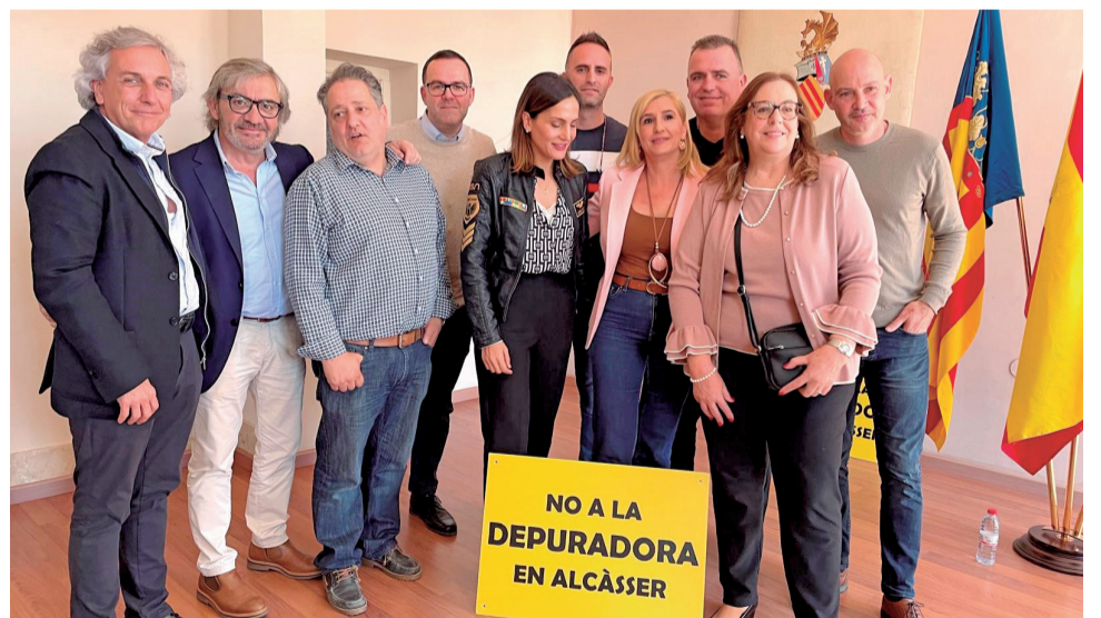
La consellera, Pradas, con la plataforma vecinal y autoridades locales.

En esta línea, Pradas señaló que una de ellas podría ser la ampliación de la depuradora de Pinedo. Además