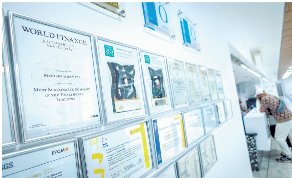
Algunos de los certificados obtenidos por el Departamento de Salud.