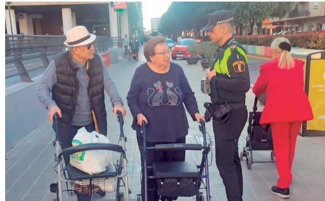
Un agente habla con los vecinos.