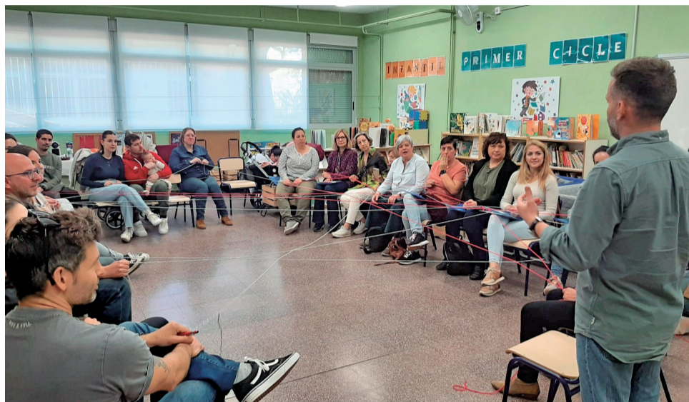
Els participants en la primera sessió del curs.

El curs està compost per huit sessions que es desenvoluparan al llarg dels mesos d'abril i maig. En la primera sessió a més d'aconseguir que els pares es coneguen, s'ha pretès explicar en què consisteix aquesta iniciativa en la qual es busca afavorir un ambient participatiu i dinàmic i constituir una xarxa de suport entre els pares i que es