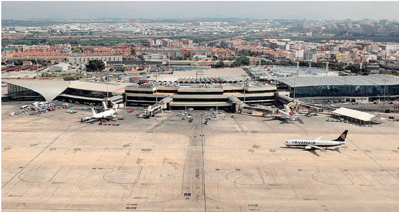
Los aviones en la pista de las instalaciones del aeropuerto de Manises.

de Manises, donde están las instalaciones aeroportuarias, que ocupan casi el 18% de todo el término municipal”.