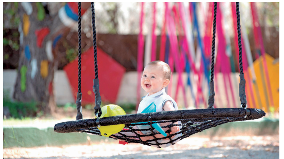
Una alumna de Educación Infantil del centro.

Las familias interesadas en el Wild Camp o en el proceso de admisión tienen a disposición los siguientes canales: WhatsApp: 657 82 48 03, Instagram: @bambu_infantil y web: bambuinfantil.com