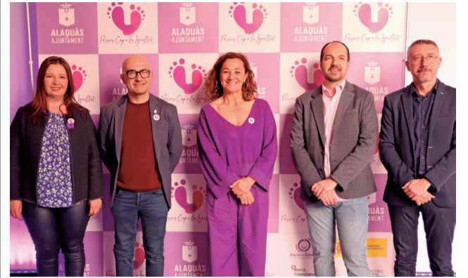
Las autoridades locales en la jornada.