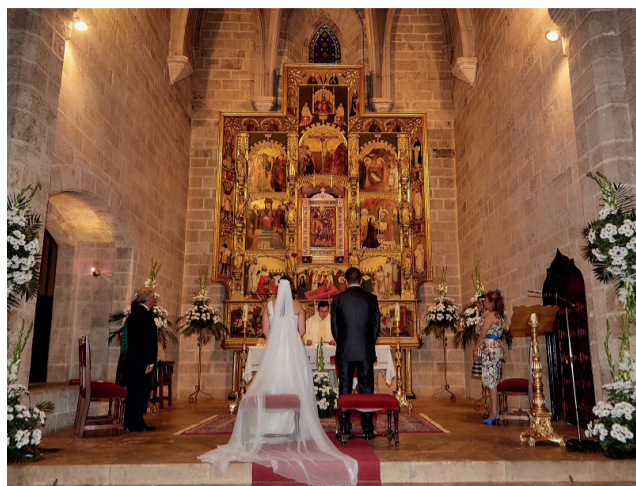
Una boda en la iglesia del Monasterio del Puig.

El valor patrimonial de este elemento va más allá de lo local, puesto que este claustro de Beniparrell pertenecía al considerado como segundo convento de la orden Carmelita Calzada más importante de la provincia, por detrás del Carmen de Valencia. Ade-