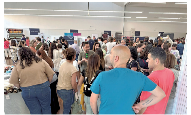
La muestra en el Antic Mercat.