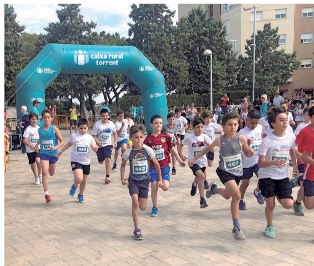
Los participantes en la pasada edición.

Las inscripciones se pueden realizar a través de la web www.deporticket.com o escaneando el código QR que aparece en el cartel de la prueba. También se podrán efectuar el mismo día