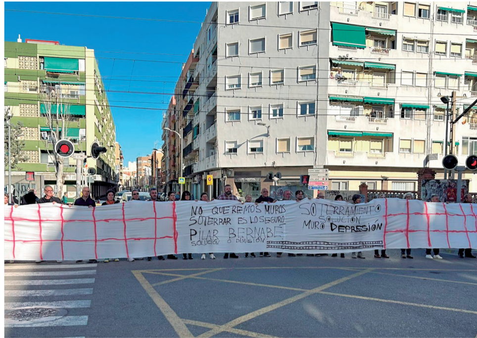
Concentración de la Plataforma por el Soterramiento.

Sin embargo los vecinos de estas tres localidades no quieren soluciones a medias, sino el ansiado soterramiento que acabe definitivamente con las muertes y la barrera