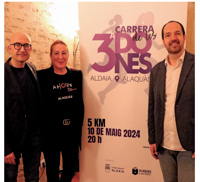
Los alcaldes en la presentación.

Preguntados ambos alcaldes por este periódico ante la posibilidad de poder ampliar el itinerario de la carrera hasta otros municipios aledaños, han asegurado que pese a no cerrarse en el futuro a esta opción, obligaría a muchos más permisos y a ampliar el recorrido.