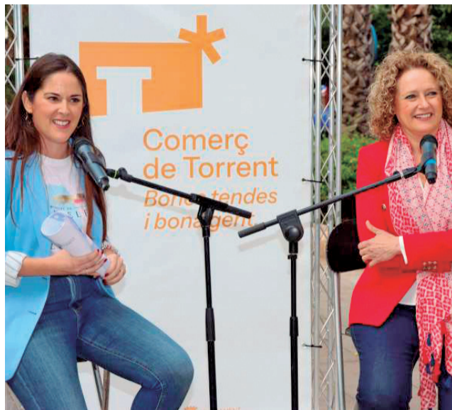
La alcaldesa y la concejala de Comercio.

El éxito de la campaña se refleja también en el aumento del número de establecimientos participantes, con 393 comercios de diversos sectores, un 10% más que en la campaña anterior. Esta amplia participación ha permitido ofrecer una mayor variedad de opciones a los consumidores y ha contribuido a una mayor di-