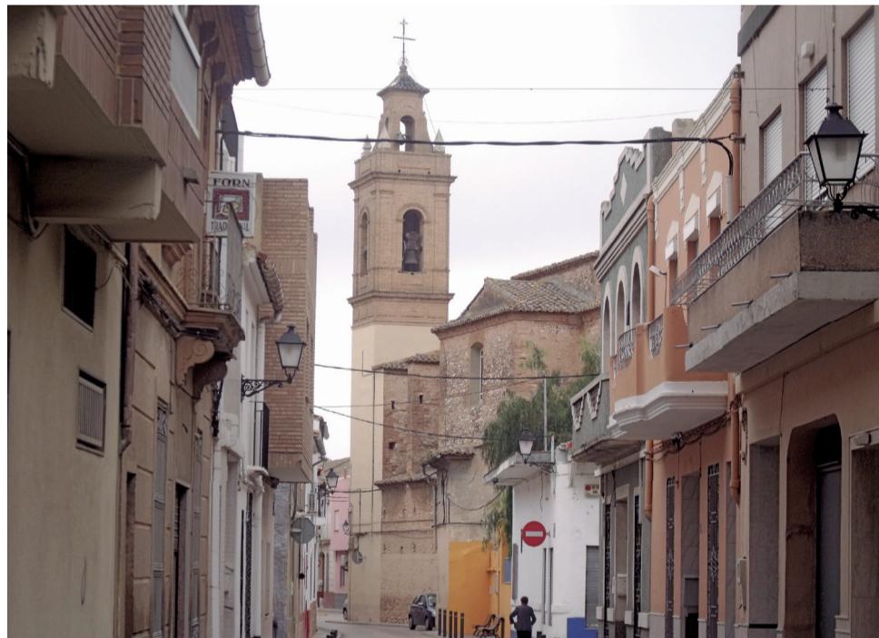
Iglesia de Santa Bárbara de Beniparrell.