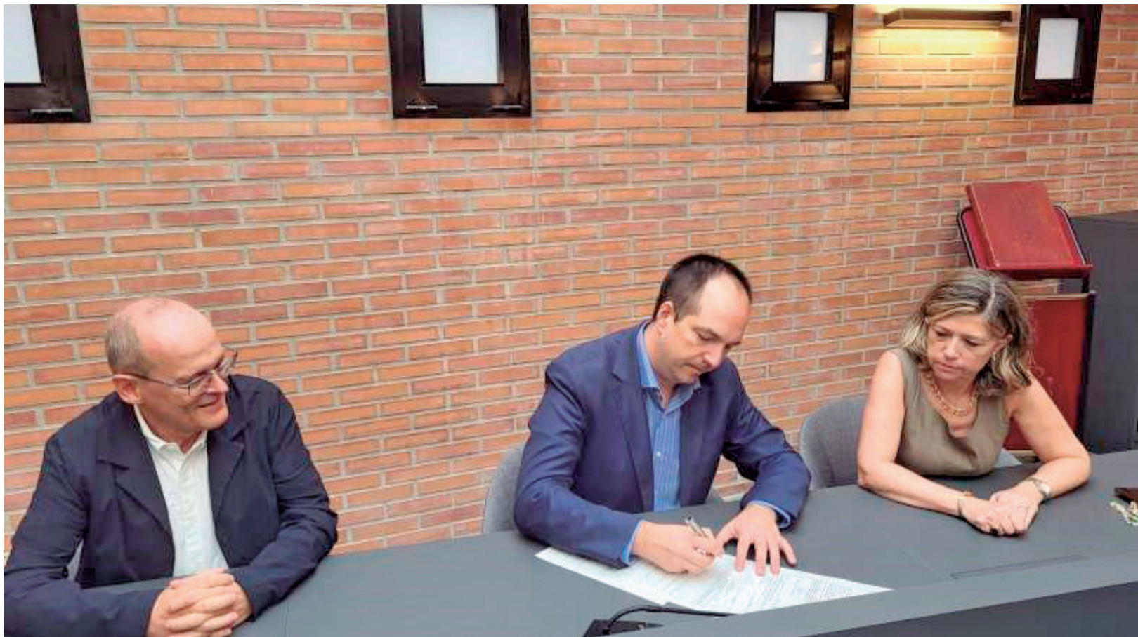
El alcalde, Guillermo Luján, firma el convenio con la UPV para el desarrollo del sector.