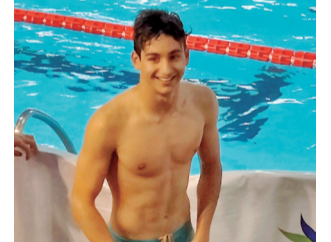
El nadador. / EPDA