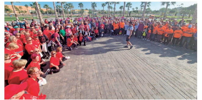
Los participantes en el evento.

mado una marea roja que ha recorrido diferentes puntos del término municipal de Albal, con visita incluida a la ermita de Santa Ana y al Bosque Mediterráneo, que son dos de los principales atractivos culturales de la localidad.