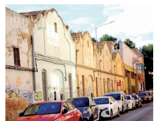
Las naves del polígono.