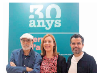
Els autors. / EPDA