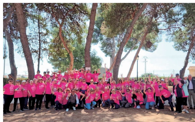
Els participants del municipi.