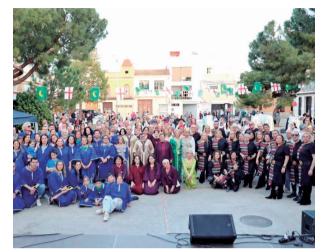
Els participants. / EPDA