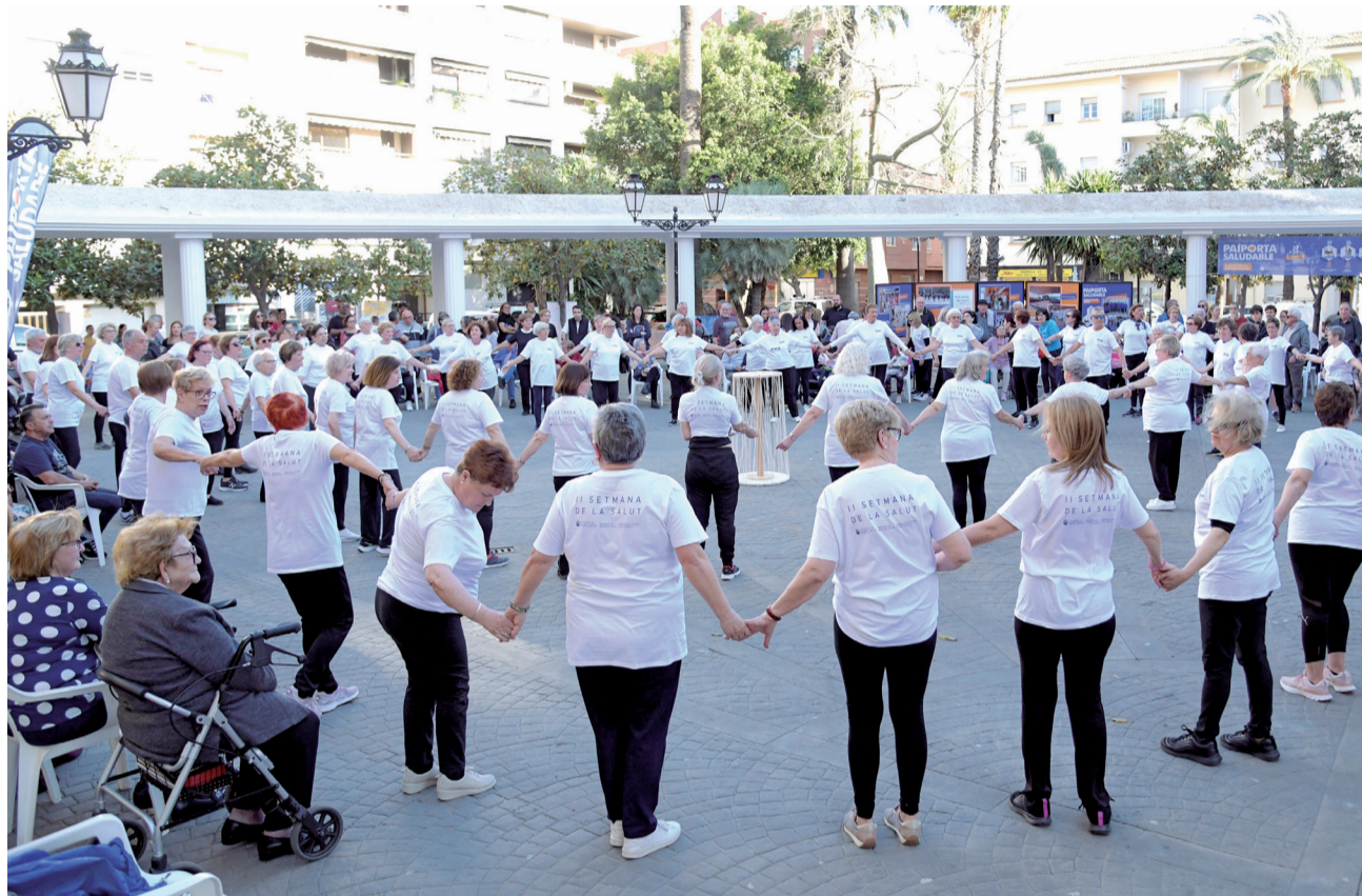
Las participantes en una de las actividades de la III Semana de la Salud.

"Todos estos servicios que ofrece el Ayuntamiento de forma gratuita están a disposición de toda la población y, con estas jornadas, pretendemos que se conozcan y que la ciudadanía pueda informarse