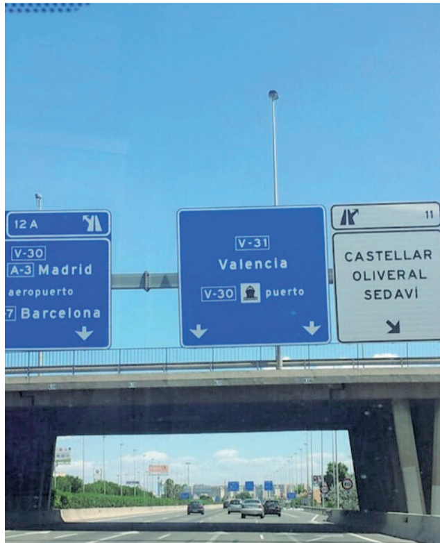
Una de las salidas de la Pista de Silla.

Las afectaciones al tráfico durarán previsiblemente