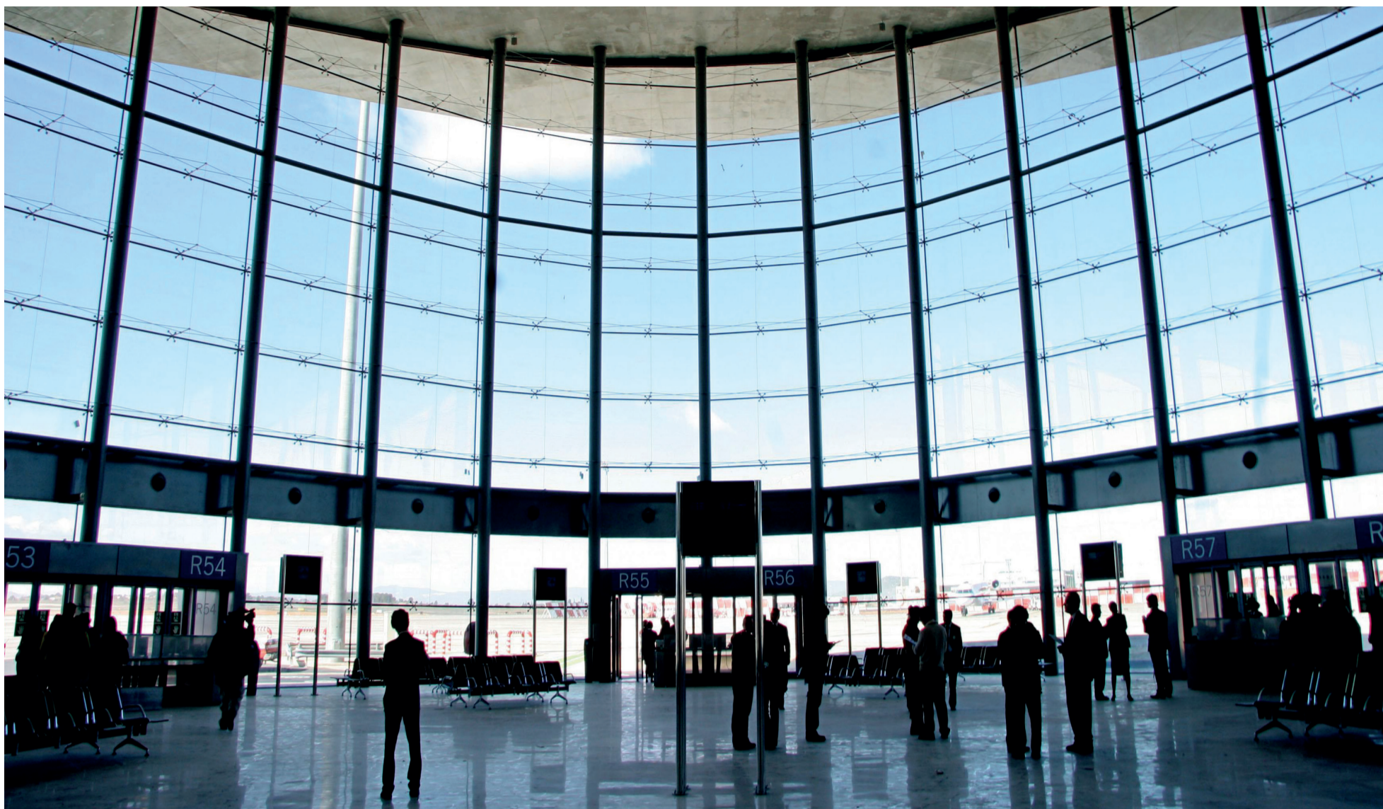
Usuarios esperan a su vuelo dentro de la instalación del aeropuerto de Manises.