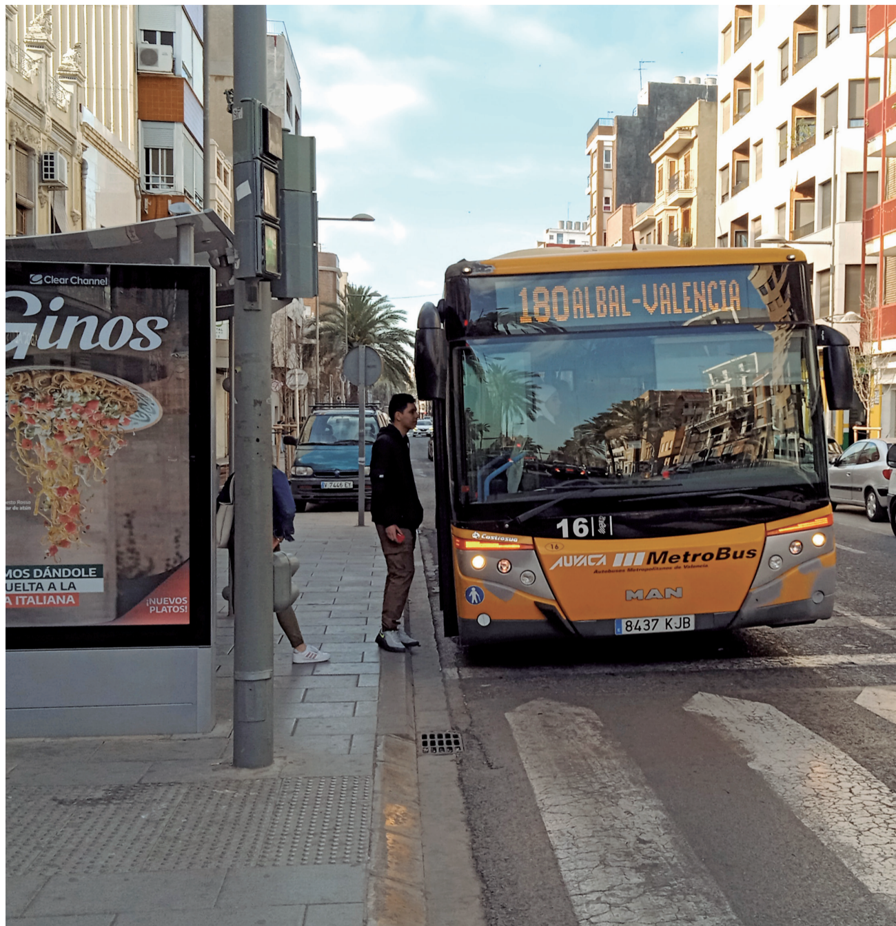
Una autobús que hace una de las rutas de la zona sur.

Por su parte la CV-106. Valencia Metropolitana Oest se ha adjudicado a Fernanbus, S.A para dar servicio al corredor noroeste metropolitano y conectar la capital con: Alaquàs, Aldaia, Burjassot, Chiva (Calicanto), Manises, Mislata, Paiporta, Paterna, Picanya, Quart de Poblet, Torrent y Xirivella, lo que representa una población de 441.000 habitantes, pues no se incluye la ciudad de Valencia. Este corredor tiene una demanda