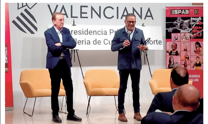
L'alcalde arreplega el guardó.