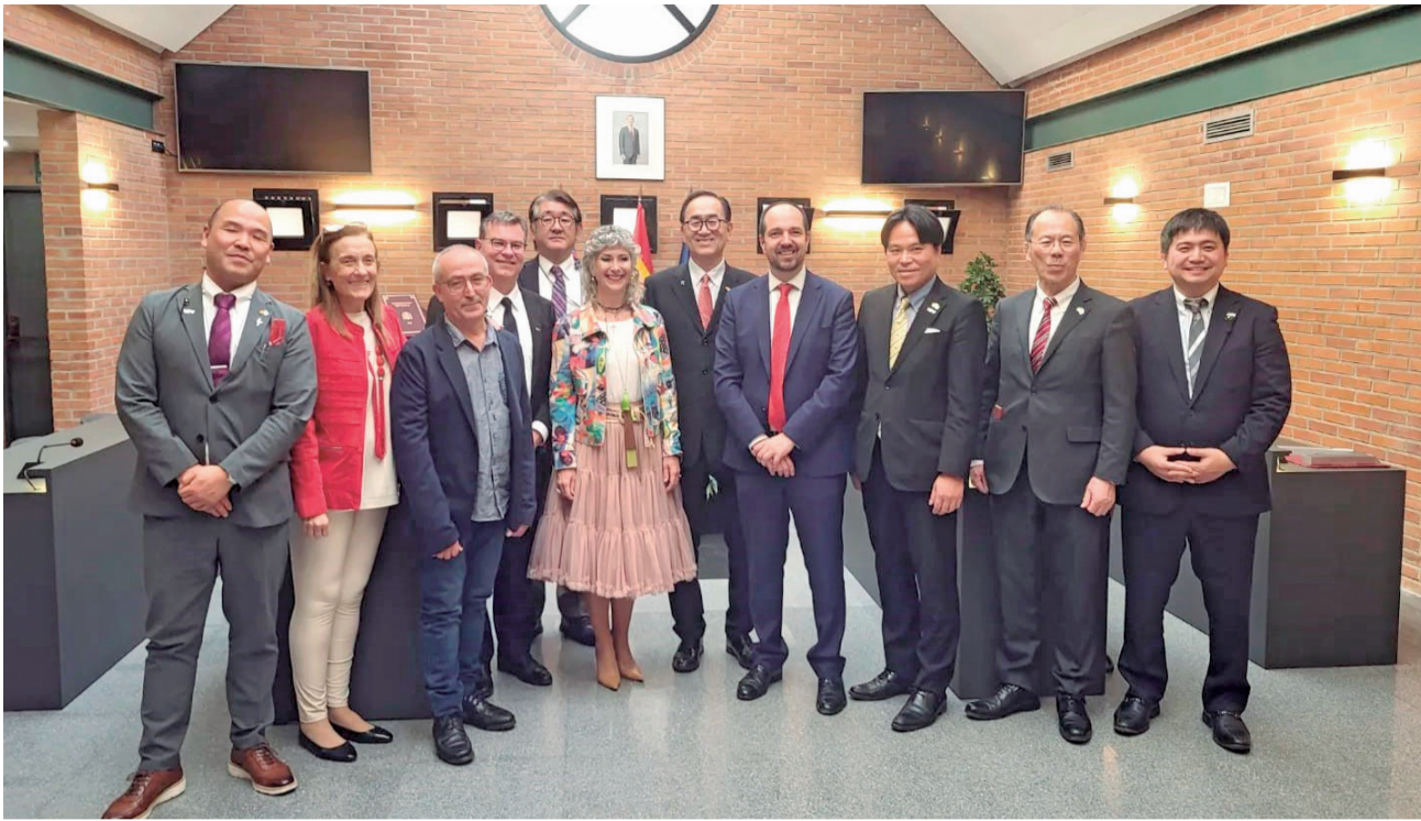
La corporación municipal recibe a los representantes de Mie.