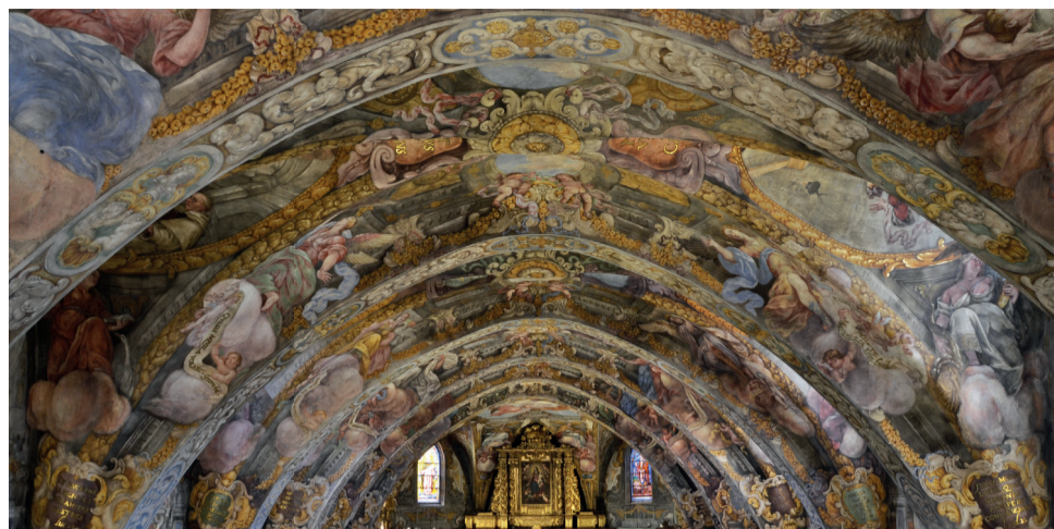
Frescos de la iglesia de San Nicolás de Valencia.

Son muchas las iglesias, ermitas y parroquias de la Ribera Alta i Baixa de gran interés cultural y religioso donde hacer una parada y poder visitar y conocer su esplendor e historia, pero en este caso vamos a destacar la Iglesia de Santa Catalina en Alzira, declarada bien de interés cultural y patrimonio histórico de España. La iglesia arcipresbital de Santa Catalina Virgen y Mártir, es un templo de estilos gótico y barroco. Se trata de una importantísima muestra de la arquitectura del gótico valenciano de la época de la Reconquista.