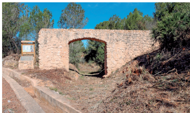
El elemento patrimonial hidráulico.