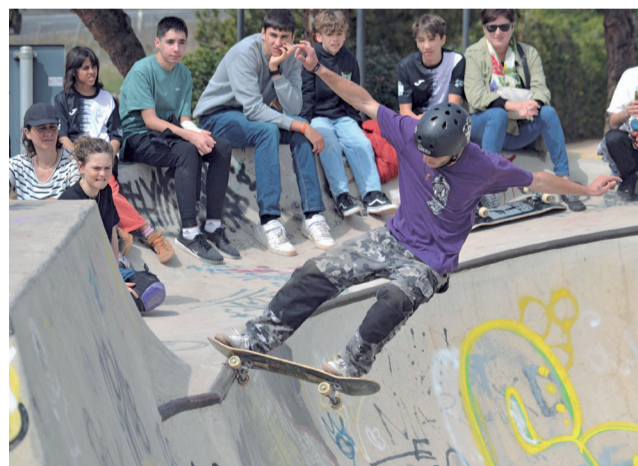
Uno de los participantes.