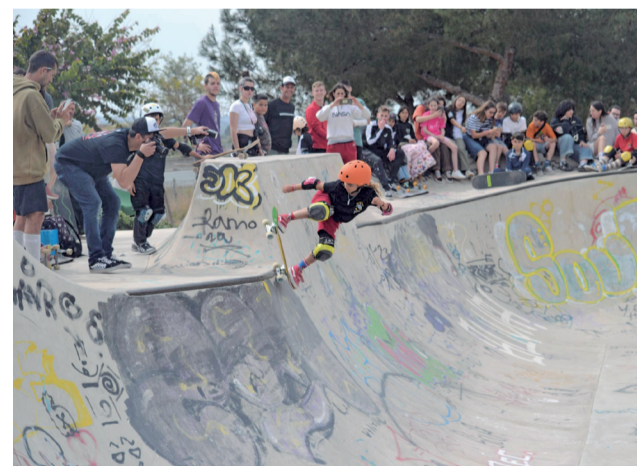
El circuito de Albal, en la competición.

que lo hacen muy atractivo para los aficionados y los profesionales, que durante varios días estuvieron viniendo a entrenar para adaptar sus trucos. Gracias a estas competiciones y a la inminente puesta en marcha del club de skate de Albal, queremos