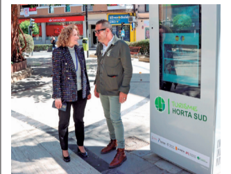
Uno de los tótems.