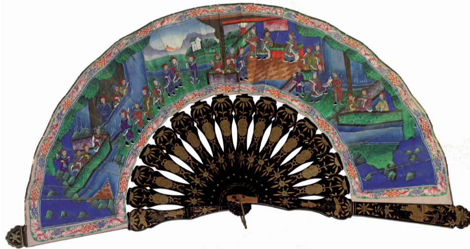
Un palmito en el que se representa una audiencia pública.

Pero también laten en el aire palmitos vanguardistas del Modernismo y el Art déco e incluso abanicos asiáticos que muestran paisajes exóticos del lejano oriente, estilos todos ellos que no son tan conocidos por la ciudadanía. Con el fin de dar a conocer estas joyas, el Museo del Palmito de Aldaia (MUPA) acoge dos exposiciones temporales simultáneas con abanicos de la colección permanente del museo. Se trata de "El arte del Modernismo en nuestros palmitos" y "Vestigios de palmitos asiáticos a casa nuestra". Palmitos incógnitos e inexplorados, rincones artísticos que merece la pena descubrir.