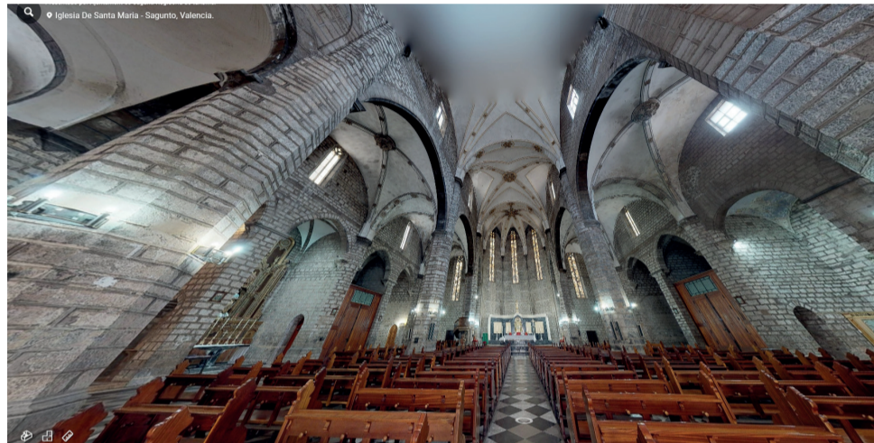
Iglesia de Santa María de Sagunt.