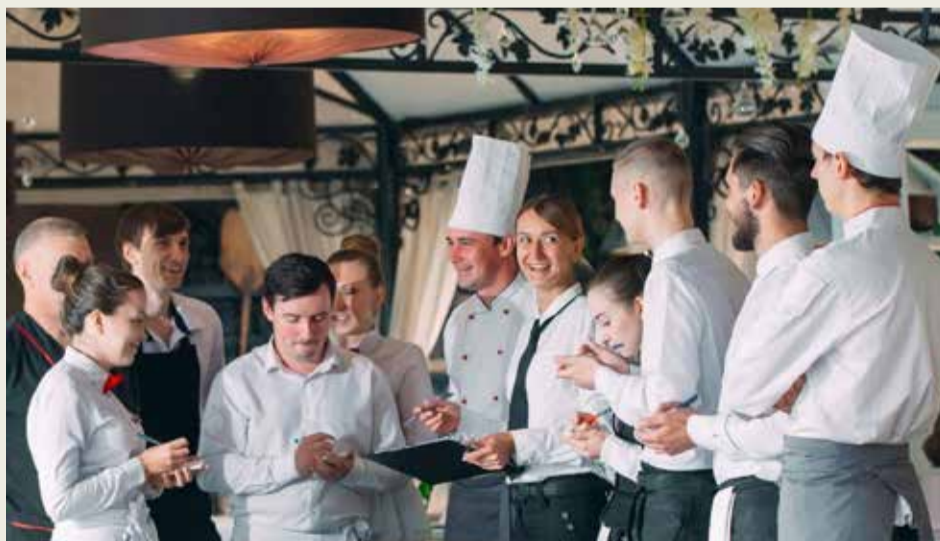
Profesionales del sector de la hostelería.

De hecho, solo pueden publicar sus currículums en CdTJobs los estudiantes de la