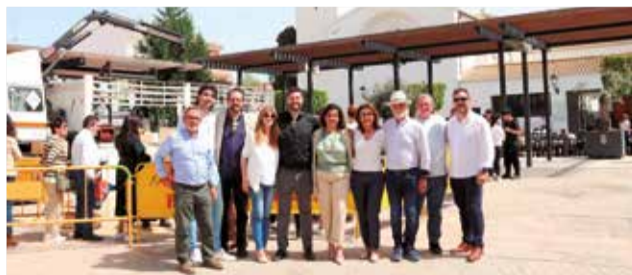
Paella gigante y autoridades en la plaza.

de reconocimiento con el objetivo de destacar la exitosa trayectoria de un total de 21 vecinos.