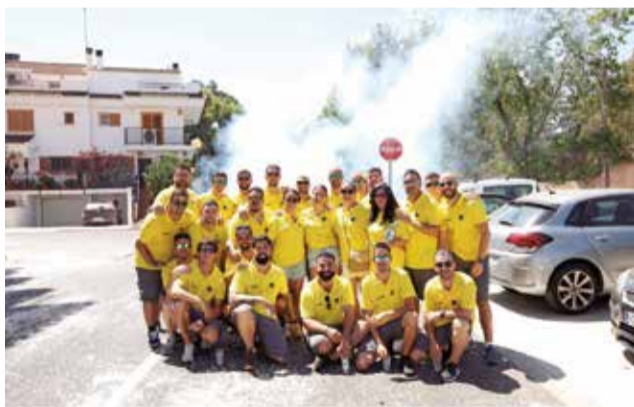
Mayorales y Obreras 2024 de Bétera.