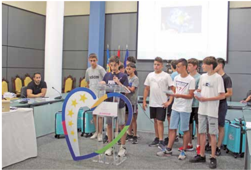
Imagen de archivo del programa BRIDGE 2030.

Esta iniciativa contará con 50 participantes de entre 13 y 18 años, los cuales desarrollarán habilidades de gestión de proyectos, comunicación, networking, diseño de conte-