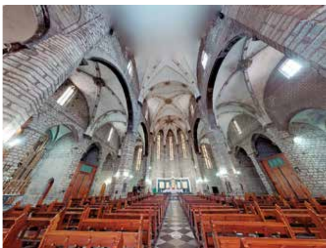
Iglesia de Santa María de Sagunt.

bien de interés cultural y patrimonio histórico de España. La iglesia arciprestal de Santa Catalina Virgen y Mártir, es un templo de estilos gótico y barroco. Se trata de una importantísima muestra de la arquitectura del gótico valenciano de la época de la Reconquista que evoluciona a través del tiempo. Estilísticamente se encuentra dentro de un eclecticismo neoclásico barroco del que es la mejor muestra la portada barroca de la plaza de Santa Catalina realizada por Gaspar Dies, muy similar a la de San Andrés de Valencia. En su interior se custodian las reliquias de San Bernardo de Alzira, patrón de la ciudad y en la capilla del Sagrario, se venera la imagen de Nuestra señora de la Murta, copatrona de la ciudad.