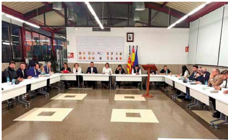
Sessió plenària de la Mancomunitat Camp de Túria.

En termes generals, el departament de Benestar Social i Sanitat de la Mancomunitat Camp de Túria és el que ha obtingut major finançament en els comptes supramunicipals amb un 67% i 2.013.979 euros. Després, el departament de Promoció Econòmica, Ocupació i Esports amb el 17,83% i