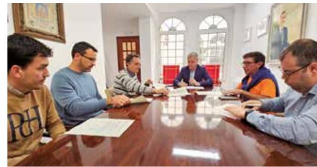
Moment de la firma d'un contracte en l'Eliana.