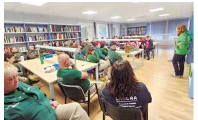
Un instante durante la charla.

Además, fue interesante comprobar la implantación de esta técnica en los centros educativos, donde los estudiantes participan activamente en la creación del compost que servirá para nutrir los suelos y enriquecer las plantas.