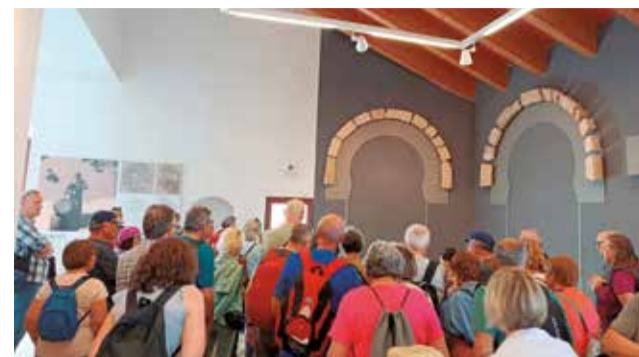
Un grup de turistes de l'Imsero en Riba-roja.