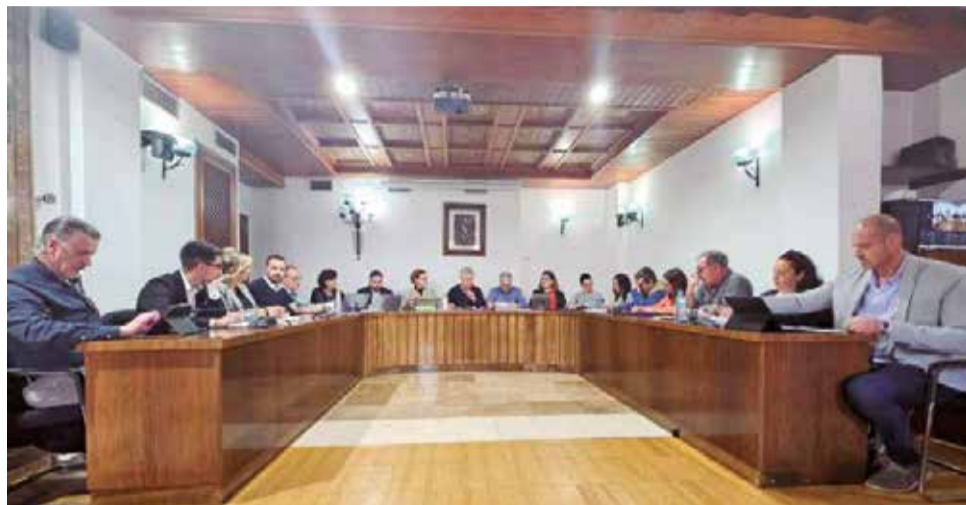
Sessió plenària de març de l'Eliana.

Quant als crèdits extraordinaris aprovats, destaquen els 230.000 euros per al nou aparcament del poliesportiu; 290.000 euros a ampliar la xarxa d'aigua de qualitat 2-la destinada a reg i altres usos o 300.000 euros per a renovar la xarxa d'aigua potable.