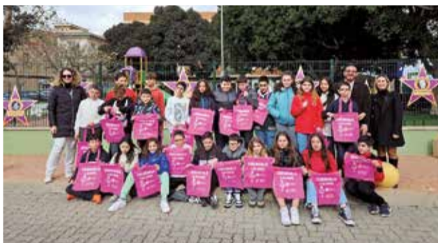
Varios instantes del 8M en Vilamarxant.