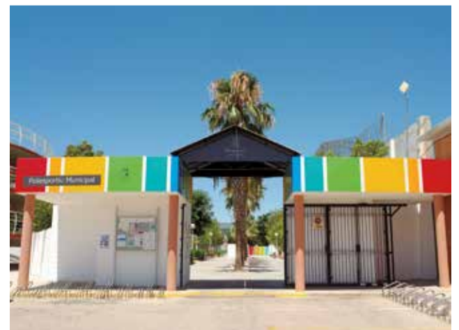
Polideportivo municipal de Benaguasil.

El plazo de solicitud de las subvenciones se encuentra abierto hasta el próximo 22 de mayo. Las personas interesadas en acceder a estas nuevas ayudas pueden encontrar las bases, así como la hoja de solicitud en el tablón de anuncios de la página web municipal del Ayuntamiento de Benaguasil, benaguasil.eu.