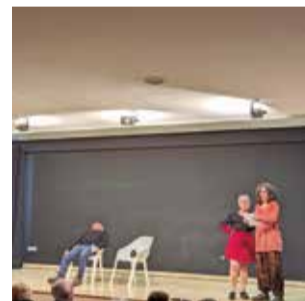
Mostra de Teatre. / EPDA

D'altra banda, la Mostra del Taller de Teatre Infantil del CRA Alt Carraixet i del Taller de