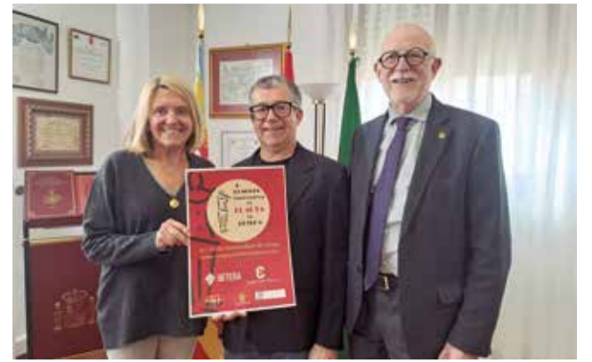
Presentación del cartel del Congreso de Flauta.