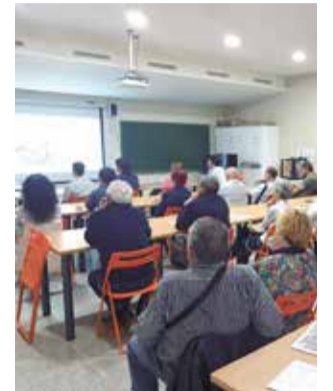
Asistentes a la charla.

El próximo sábado, 13 de abril, se celebrará una nueva jornada en la que se explicará