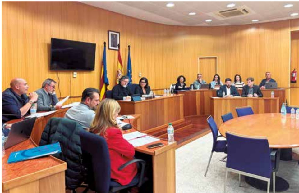
Un instante durante el pleno de marzo de San Antonio de Benagéber.

El Ayuntamiento encargará ahora un informe al Centre d'Estudis Locals (CEL-SAB) para explicar los elementos que componen el escudo de San Antonio de