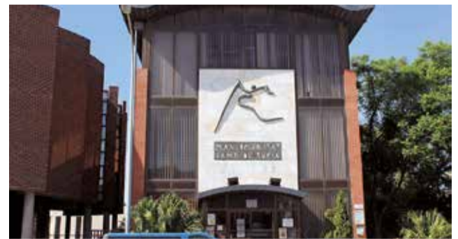
Seu de la Mancomunitat Camp de Túria.

El procés es va iniciar als ajuntaments durant l'any 2022 i, després de les decisions dels governs del PP, encapçalats per Benaguasil i Domeño, de no aprovar els estatuts d'àmbit comarcal en els seus respectius ajuntaments, s'ha pres la decisió de deixar sobre la taula la qualificació d'àmbit comarcal.