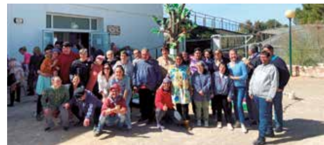
Jornada fallera al Centre Ocupacional. / EPDA