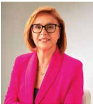
Lola Celda.

► La socialista Lola Celda va ser la primera dona a prendre la vara d'alcaldessa en la comarca en 1998 en el municipi de Marines, un càrrec que manté des de l'any 2003 ininterrompudament. Celda també ha sigut presidenta de la Mancomunitat, diputada provincial i secretària general del PSPV de la comarca.