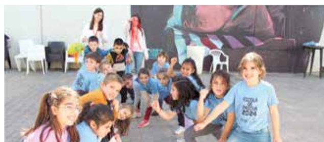
Participantes en la escuela de Pascua.

padres y madres que continúan trabajando durante las vacaciones. En este sentido, desde el Consistorio han destacado la importancia de proporcionar alternativas para lograr la conciliación familiar: "un año más hemos puesto en marcha esta iniciativa para facilitar la conciliación laboral y familiar, y que ofrece una variedad de activida-