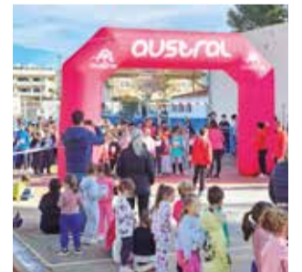
Día del Deporte.