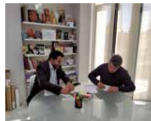
Moment de la firma.