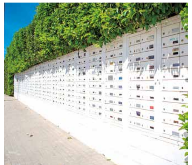
Buzones en una urbanización de la Pobla.