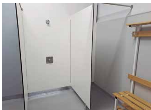
Noves dutxes en les 'Escoles velles' de Benissanó.