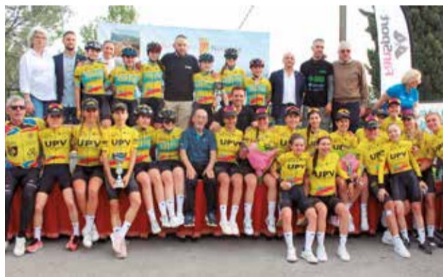
UPV Women's Cycling Team, vencedor absoluto.

El trofeo es la primera de las diez carreras que componen la II Challenge Fan Sport de Ciclismo Femenino, organizada por la Comissió de Dones de la Federació de Ciclisme de la Comunitat Valenciana. La carrera, una manga única sobre un espectacular circuito de 70 kilómetros que ascendía en varias ocasiones el Alto de Canteras, incorporó a las ciclistas cadetes y máster 40 y 50 en el primer paso por Nàquera, después de que las corredoras junior, élite/sub23