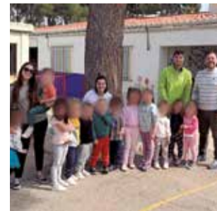
Visita de Rubio.