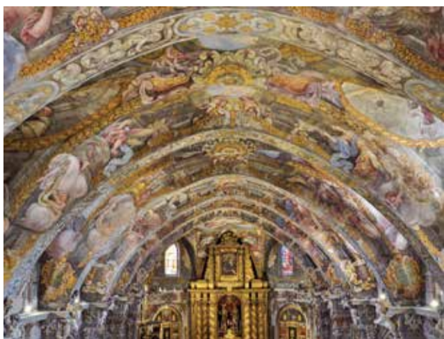
Frescos de la iglesia de San Nicolás de Valencia.