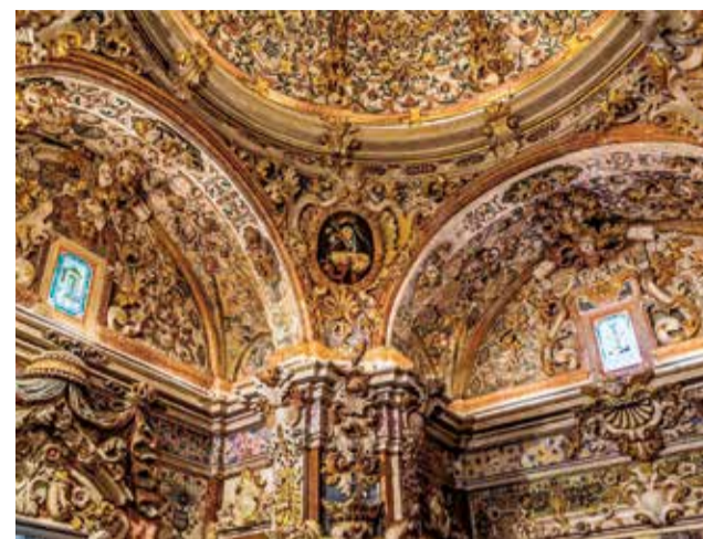
Bóveda del Camarín de la Virgen del Niño Perdido.

Según la tradición oral, la ermita se construyó en el mismo sitio donde un pastor de Torrent la encontró en 1289, dentro del hueco de una olivera. De ahí la devoción que le profesan y que convierten el Replà donde se ubica, en un espacio de culto muy especial y privilegiado.