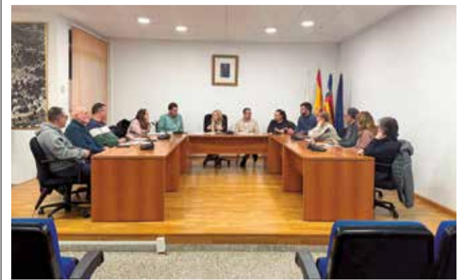
Mesa intersectorial de salut de Serra.