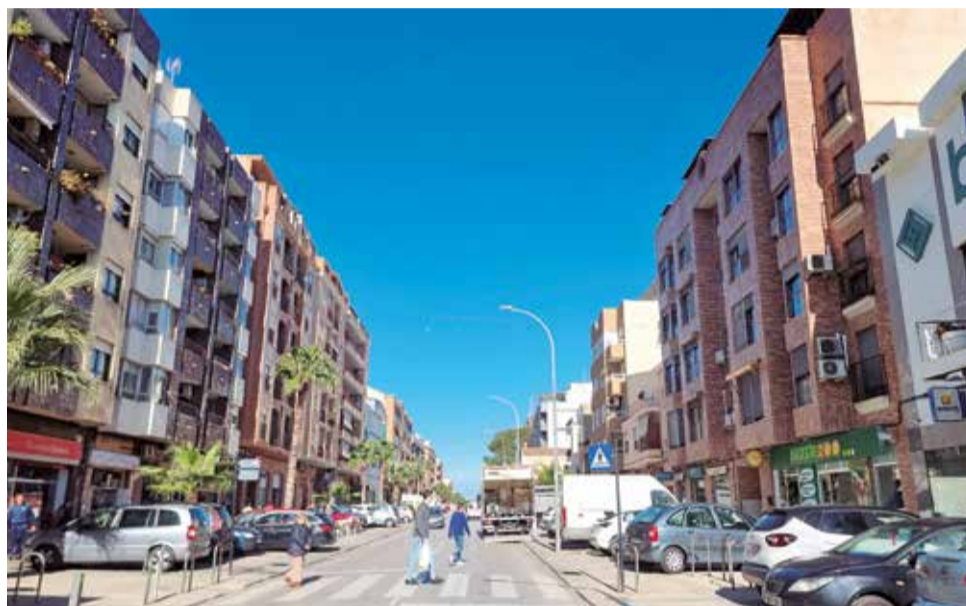
Imatge d'arxiu d'edificis d'habitatges en Riba-roja de Túria.

Esta parcel·la va ser cedida el setembre de 2022 a l'EVHA, Entitat Valenciana d'Habitatge i Sòl, dins del Programa 6 de Fons MRR, d'ajuda a la construcció d'habitatges per a lloguer social en edificis energèticament eficients del Pla de Recuperació, Transformació i Resiliència regulats en el Reial decret 853/2021, de 5 d'octubre.