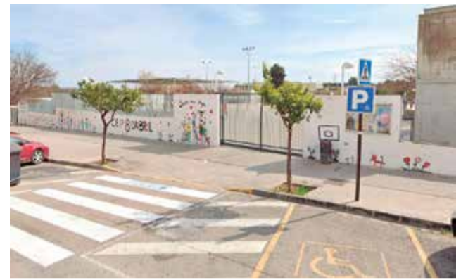
CEIP 8 de Abril de San Antonio de Benagéber.