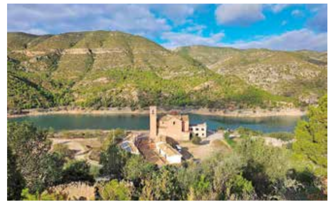
Pantano y pueblo viejo de Loriguilla.