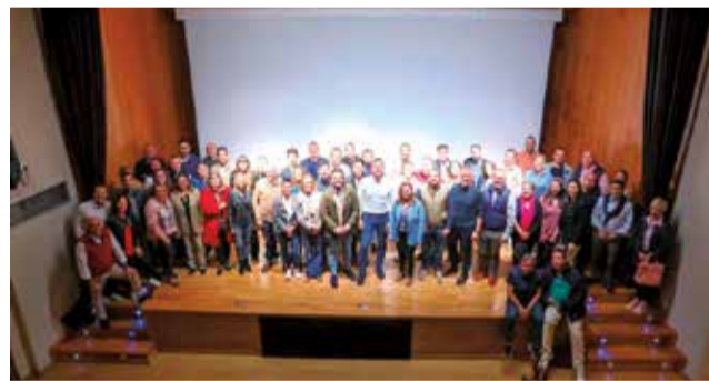
Reunió comarcal del PP.