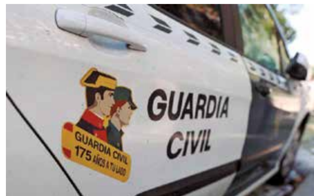
Vehicle de la Guàrdia Civil.