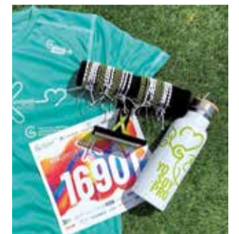
Productos solidarios.

Desde la organización han recordado que la recaudación íntegra de este acontecimiento deportivo será destinada a la investigación contra el cáncer, por lo que animan a los vecinos a sumarse a la causa y par-