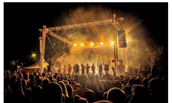
Concert de La Fúmiga en Lliria.