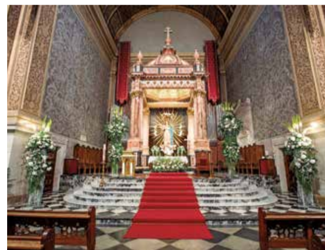
Iglesia de La Asunción de Nuestra Señora de Lliria.