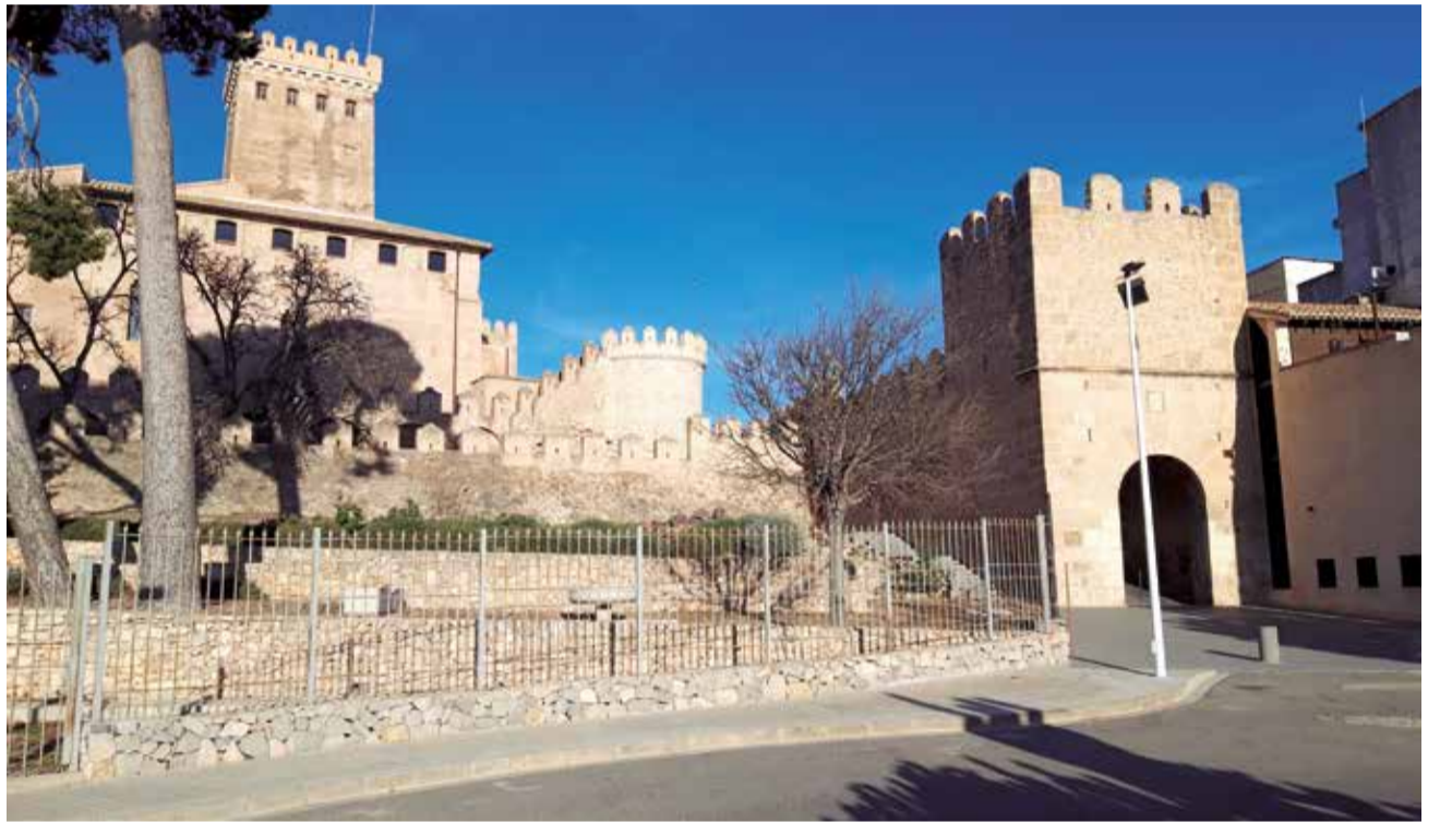
Portal de Llíria y castillo de Benissanó.

La población de Benissanó, con su recinto amurallado, daba entrada a este Antiguo Camino Real por el Portal de Valencia y tras cruzar la po-