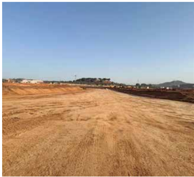
Obras de urbanización del sector I-12 en Loriguilla.

Este pulmón verde abarcará una superficie comparable a más de la mitad de los jardines de Viveros en Valencia, divididos en dos áreas por la nueva carretera. Además, el Consistorio, consciente del impacto positivo en la salud ocupacional y la generación de empleo, aspira a crear un espacio de descanso rodeado de vegetación, destinado especialmente a los trabajadores del área industrial.