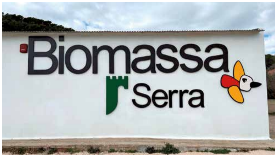
Planta de biomassa al municipi de Serra.

En paraules de l'alcalde, Alicia Tusón: "Estem d'enhorabona perquè rebre esta subvenció suposa un nou impuls per a la