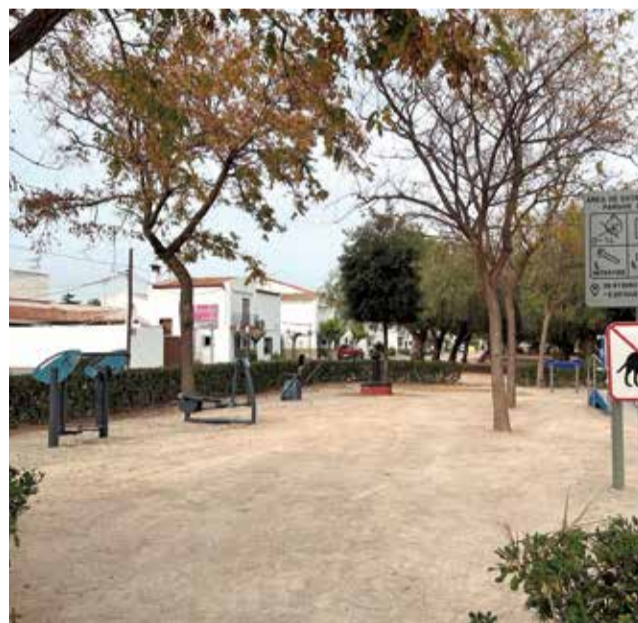
Nuevo parque saludable en Marines.

Según la alcaldesa, Lola Celda, "tenemos una gran oferta de actividades deportivas, que viene favorecida