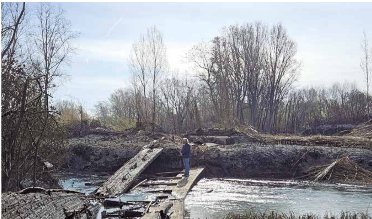
Estat actual de la zona del Parc Natural del Túria afectada per l'incendi.

EL FOC, QUE ES VA ESTENDRE RÀPIDAMENT, VA OBLIGAR A DESALLOTJAR UN ALBERG AMB 80 PERSONES