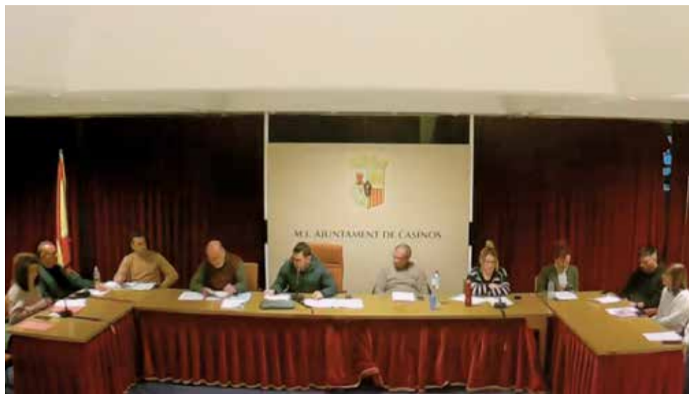
Pleno ordinario de marzo del Ayuntamiento de Casinos.

El primer edil explicó que en el último semestre de 2023 dio instrucciones para amortizar los últimos préstamos que otras corporaciones contrajeron en otras legislaturas: "Uno de los principales ejes de la política presupuestaria ha sido la eliminación de la deuda contraída mediante amortizaciones anticipadas de préstamos, que pasó de los 900.000 euros en 2019 a los