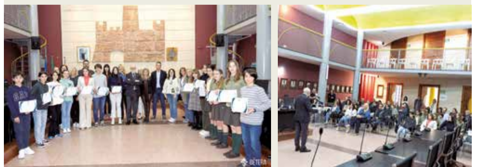
► El Ayuntamiento de Bétera ha organizado un acto institucional para felicitar a 14 estudiantes de Primaria y Secundaria de los centros públicos, concertados y privados del municipio que han sido distinguidos por la Conselleria de Educación.