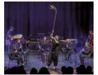
Concert en Leiria.