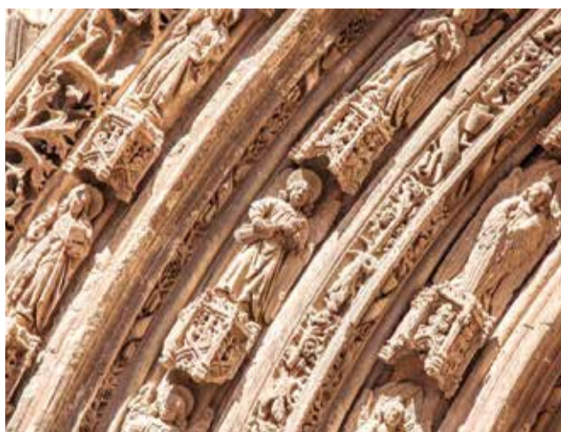
Arco del templo de Santa María de Requena.