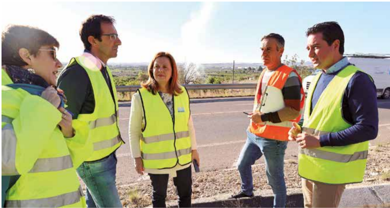
Visita institucional al tram de la CV-3706 en el qual es realitzaran les millores.

En este sentit, Mazzolari, ha explicat que "l'Ajuntament de la capital del Camp de Túria ja comptava amb un projecte constructiu, però el cost de l'actuació era inassumible per les arques municipals. Per això, s'ha optat per la fórmula del conveni, que ens estalvia el temps i els diners que implicaria la redac-