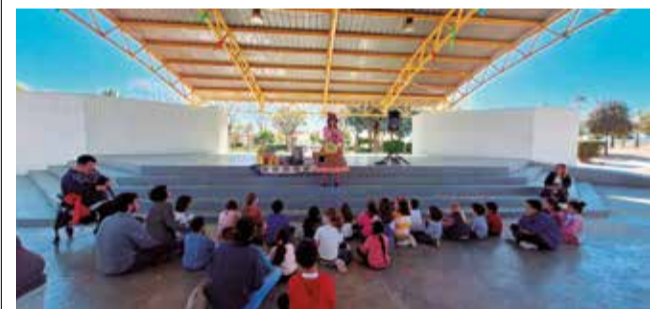
Actividad infantil en Marines.