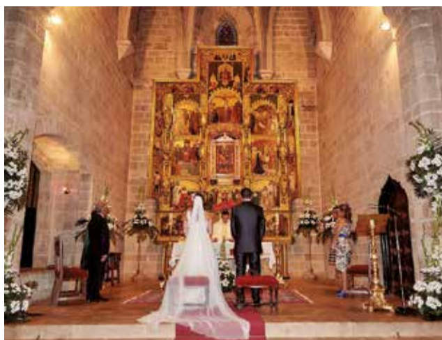
Una boda en la iglesia del Monasterio del Puig.