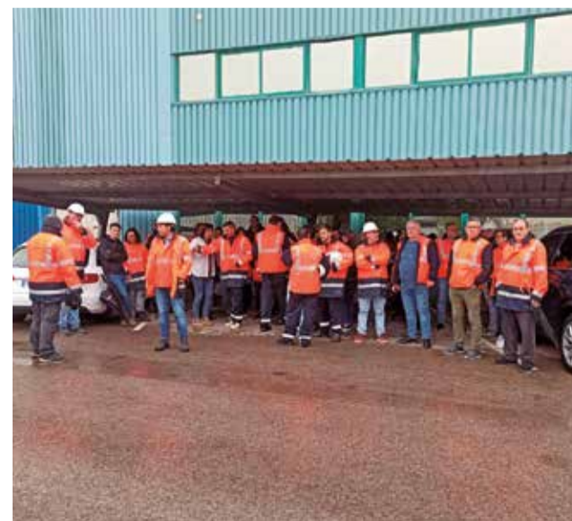
Trabajadores protestan en la planta de Sagunt.

senkrupp Galmed. La lucha continúa en defensa de los puestos de trabajo y la viabilidad industrial en la comarca.