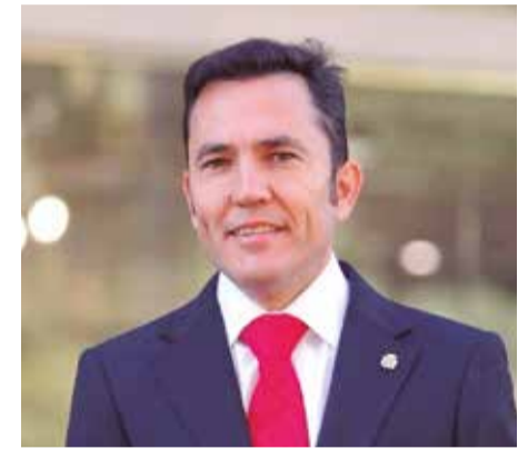
Alcalde de Canet | PERE ANTONI CHORDÀ