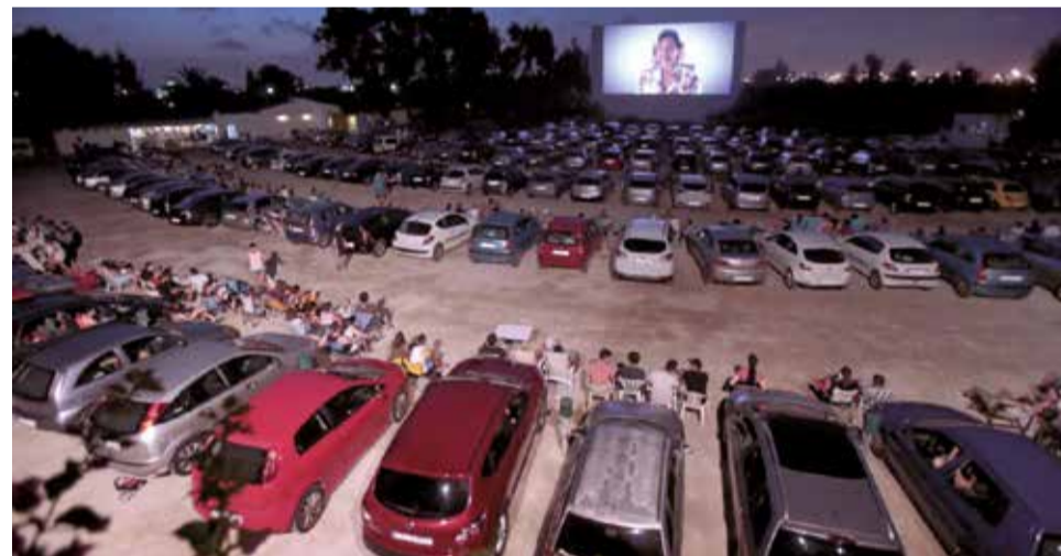
Espectadores en el Autocine Star en Pinedo.

que las personas propietarias puedan sentarse mientras sus mascotas disfrutan. Además, se han habilitado dos entradas de puerta doble, de forma que los canes puedan jugar con seguridad y sin salir del área.