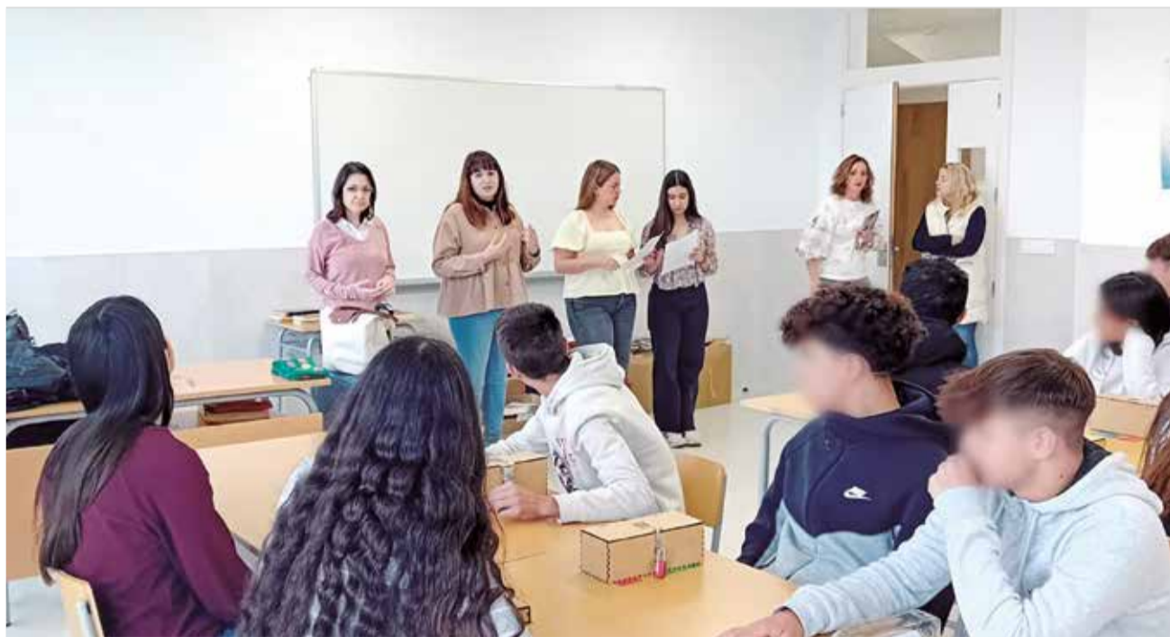
Estudiants en un centre educatiu de la comarca.

L'empresa Euskape va dissenyar i va executar un emocionant Scape Room en cada centre, amb temàtiques específiques relacionades amb els ODS. Estes activitats lúdiques i educatives van brindar a l'alumnat l'oportunitat de submergir-se en desafiaments interactius mentre aprenien sobre la impor-