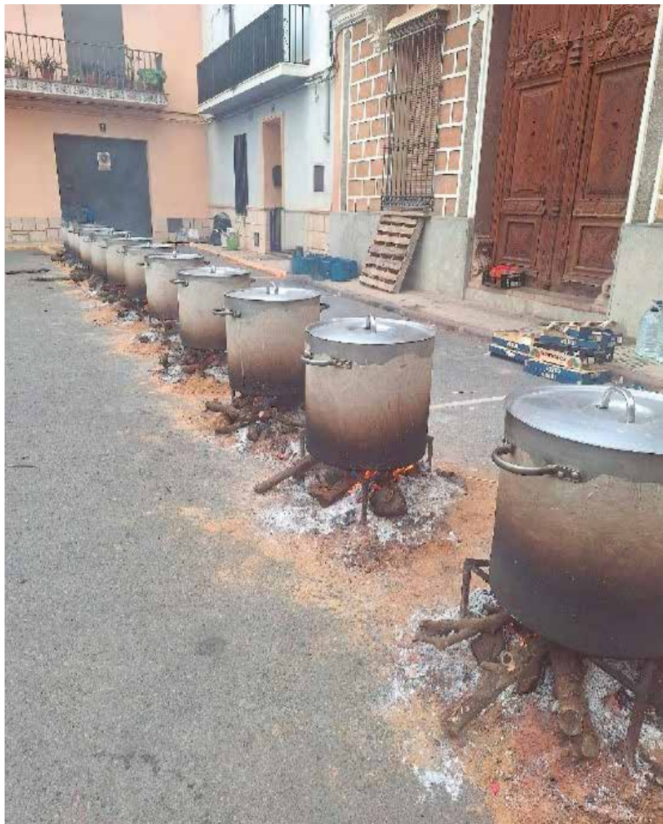
Les calderes de Sant Pelegrí d'enguany.

I qui és sant Peregrí? Aquest era un sant italià, concretament de la ciutat de Forlì, que va morir l'1 de maig de 1345. Peregrino Laziosi, que era el seu nom complet, va nàixer en 1265 i era fill d'una família