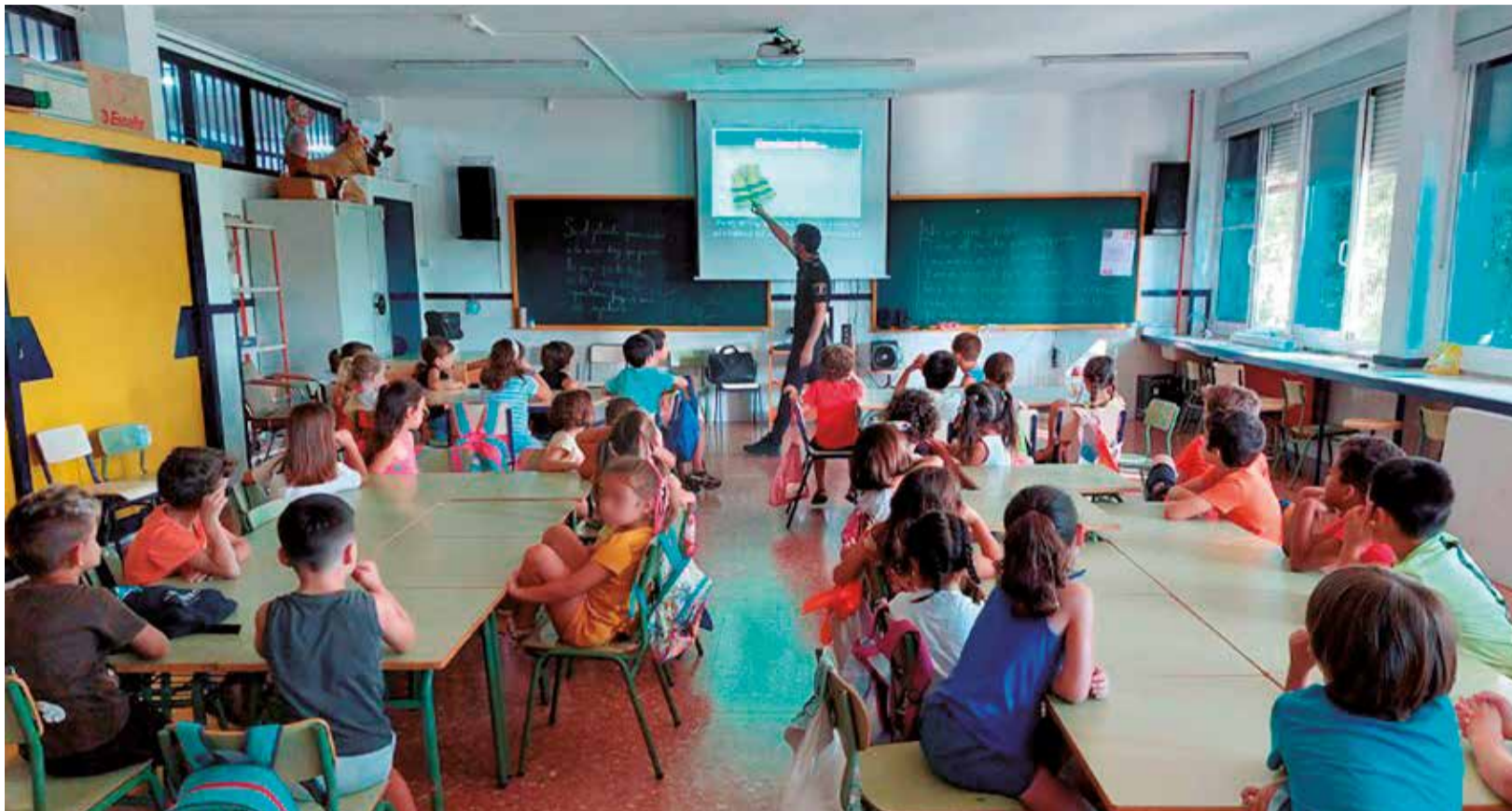
Alumnado de Infantil en un centro educativo de la ciudad.