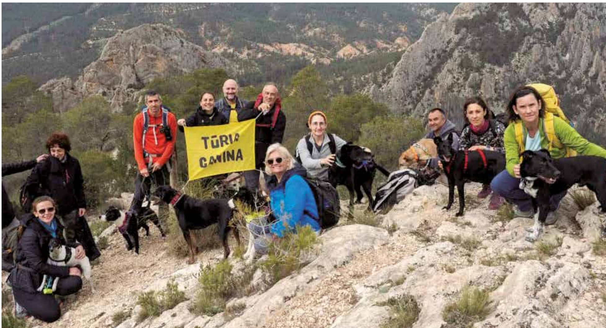
Ruta senderista canina de la asociación Túria Canina de Riba-roja de Túria.