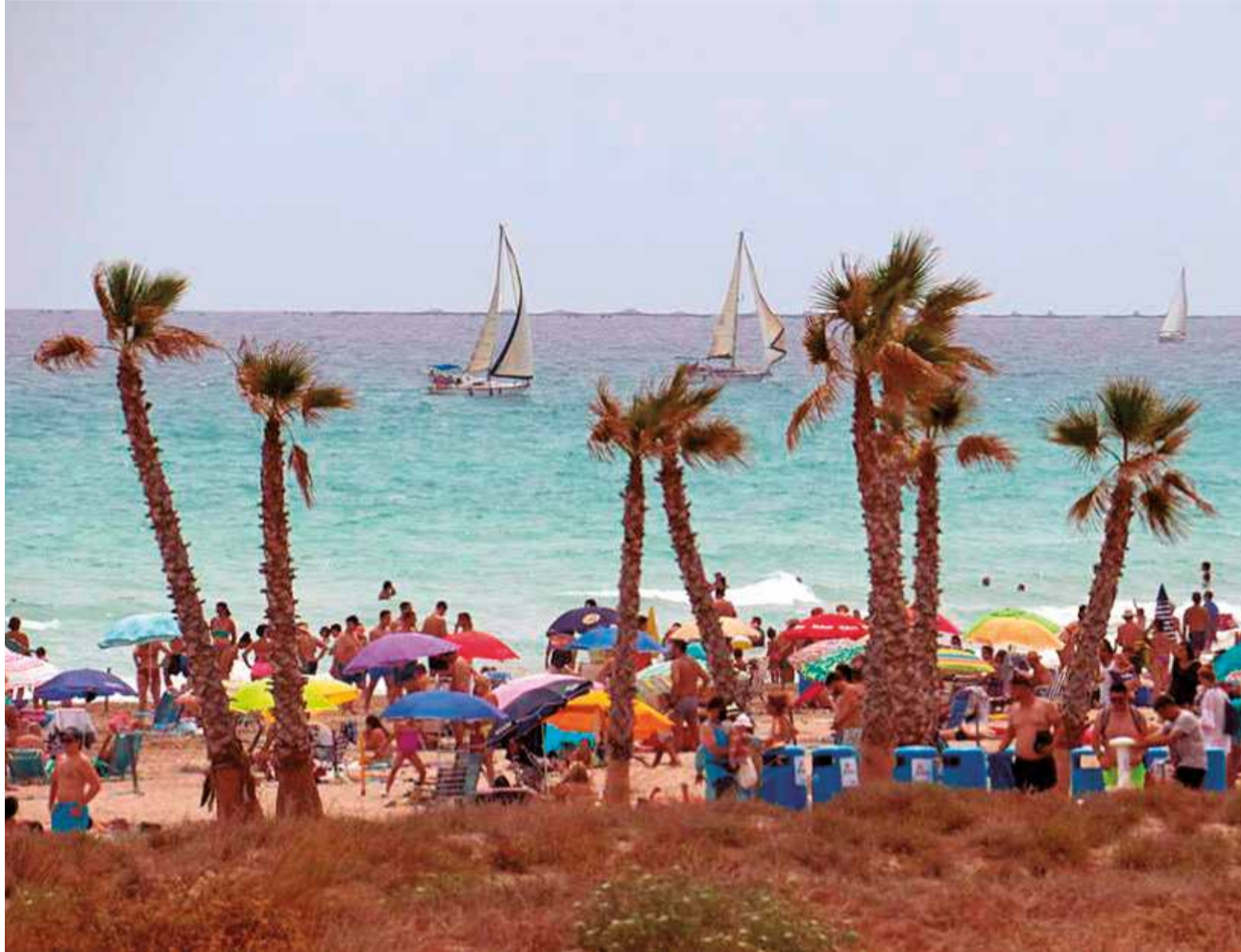
Turistas en la playa del Racó de Mar de Canet d'en Berenguer.