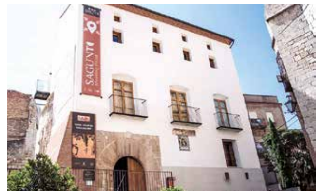
Casa dels Berenguer, en Sagunt.

la memoria histórica desde la perspectiva de género, explican desde el Área de Igualdad, así como de recuperar la voz de mujeres que lucharon y creyeron en una sociedad más justa e igualitaria y de cómo la pervivencia de esta represión ha llegado hasta la actualidad.