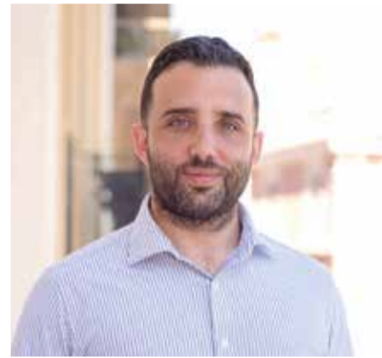
Alcalde de Sagunt | DARÍO MORENO