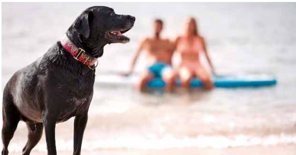
Un perro en la playa del Port de Sagunt.