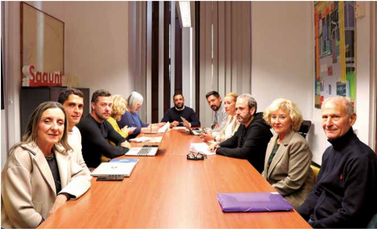
La Comisión Especial de Playas, reunida en el ayuntamiento de Sagunt.