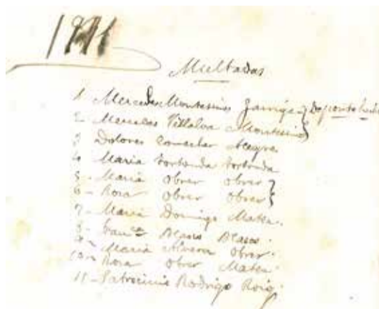
Expedit de les manifestants.

Els dos esdeveniments em fan pensar en la solitud històrica de les dones, de totes elles. Elles tenen més complicat dir prou a les injustícies que els hòmens. Veig la població femenina que en tants països és amagada a casa perquè no siga escoltada. Percep amb dolor les xiquetes que no poden estudiar. També sent a aquelles que s'autoexclouen en la nostra societat, perquè creuen que les paraules i les accions d'un home són més creïbles.