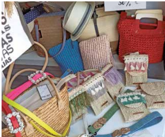
Tienda de complementos La Petite Lune.