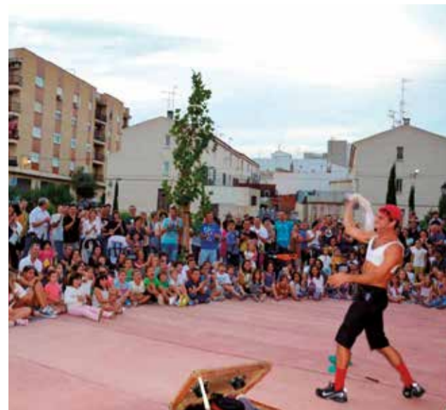
Diversos instants d'una edició passada del festival a Faura.

una visió intel·ligent. Més de 163 companyies teatrals, projectes musicals, performances, exposicions, murals, estrenes i tallers de joc dramàtic han passat pels seus carrers, places i horts, abastant totes les disciplines de teatre i arts de carrer. FaurArt forma part de tota una generació de públic educat amb l'art, que acu-