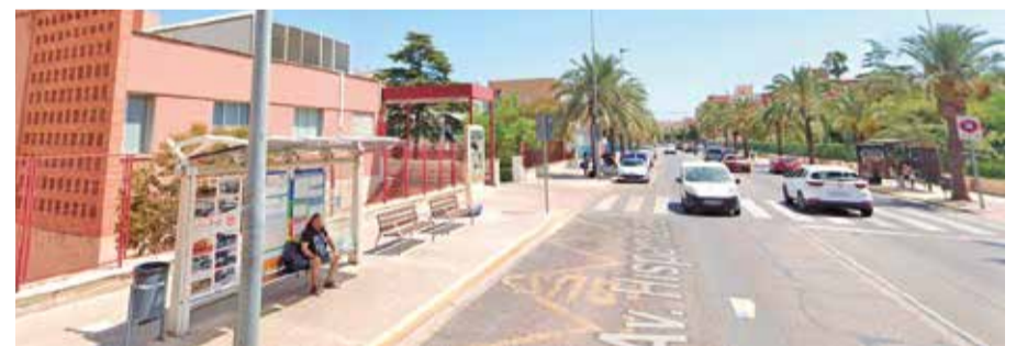
Para de autobús junto al Centro de Especialidades del Port.