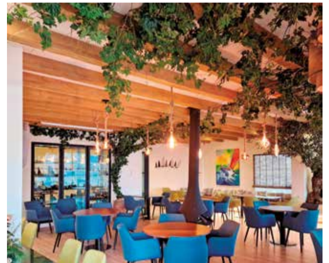
Restaurante La Perla, en Canet d'en Berenguer.