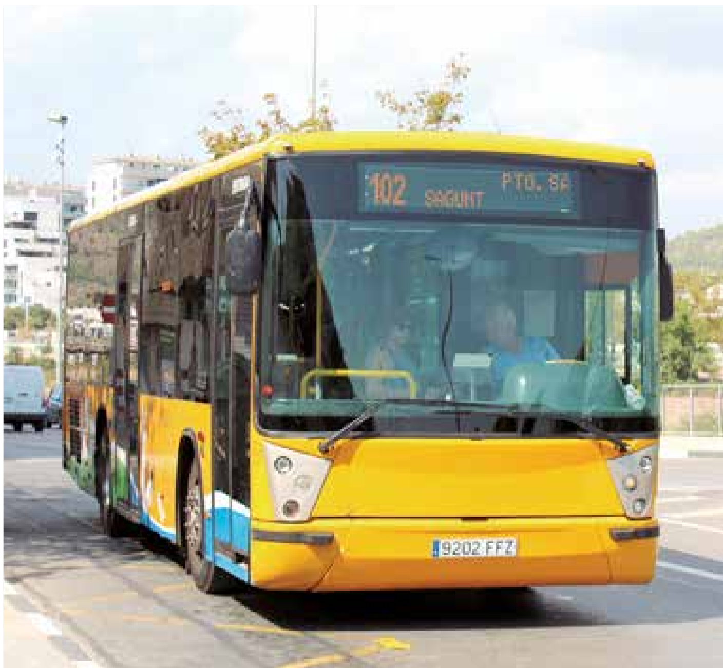
Un autobús interurbano de la línea Sagunt-Port de Sagunt.

Entre estas tres líneas, hay una que afecta al Camp de Morvedre y es la CV-102. Valencia Metropolitana Nord, que se ha adjudicado a Autos Vallduxense, S.L. (AVSA) con la previsión de que entre en funcionamiento este 2024. Cubrirá la conexión entre Valencia con: Albalat dels Sorells, Alboraià, Port Saplaya, Almàssera, Almenara, Bonrepòs i Mirambell, Canet d'En Berenguer, Platja de Canet, El Puig de Santa Maria, Platja del Puig, Emperador, Foios, La Pobla de Farnals, Platja de la