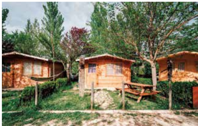
El Slow Life Camping en Venta del Moro.

La playa canina se encuentra junto a la pasarela conocida como la 'Senda Blava' y no cuenta con servicios específicos para perros