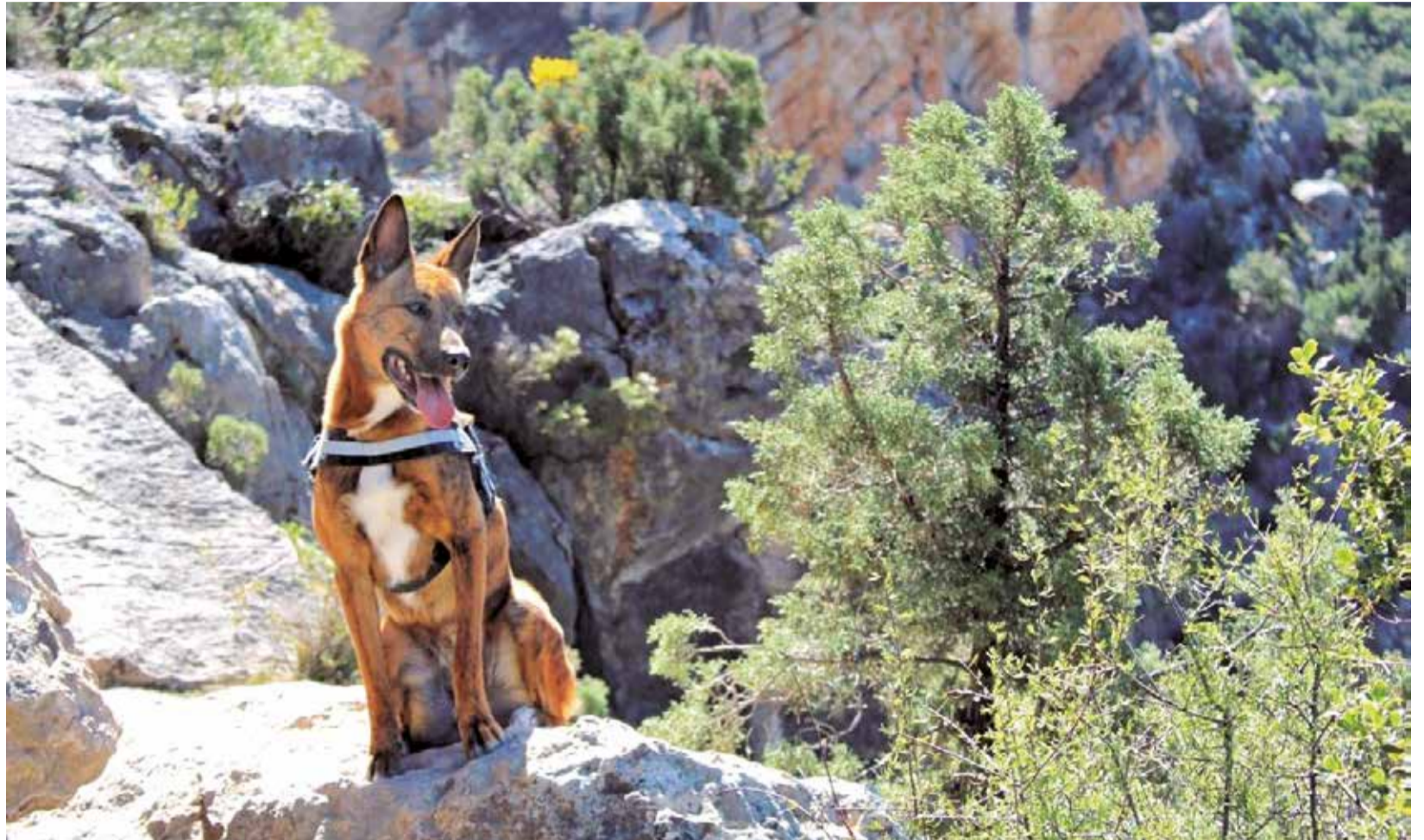
Un perro durante una ruta senderista en Chelva.

Si nos adentramos en el interior de la provincia de Valencia, es más complicado encontrar espacios cerrados habilitados para la socialización y el esparcimiento de nuestras mascotas. Pero estos espacios se encuentran en el entorno en sí mismo. La comarca de La Serranía y sus montes ofrecen una gran variedad de rutas para hacer senderismo, la mayoría habilitadas para realizarlas con perros. Una de ellas es la Ru-