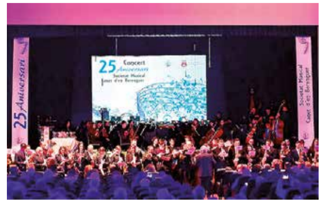
Una activitat en l'auditori de Canet.

D'altra banda, dins de la XXI edició de la campanya de concerts d'intercanvis musicals que se celebra del 29 de març al 15 d'octubre, el 18 de maig tindrà lloc la rondalla 'Sant Pere' i Coral Rondalla 'La Senyera' a les 19 hores en l'auditori.