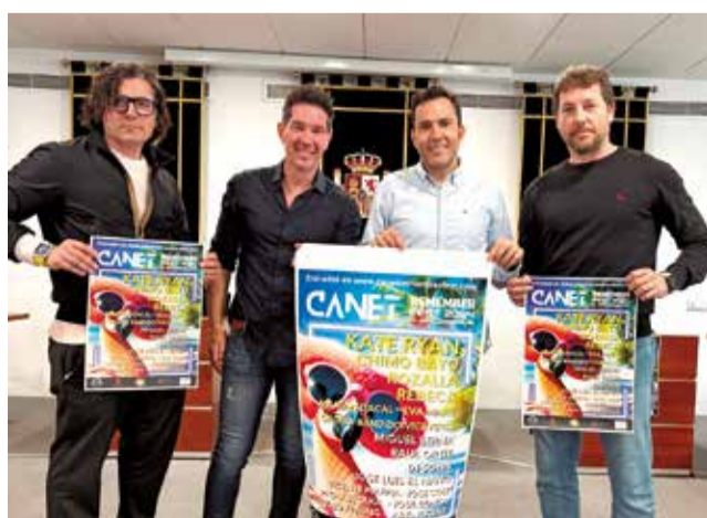
Presentació de la segona edició del festival.

"Esta activitat posarà el fermall d'or a la temporada estival. La iniciativa forma part del nostre projecte per desestacionalitzar el turisme, un dels nostres principals objectius en esta legislatura. La responsabilitat que hem adquirit és la d'aconseguir que la temporada alta dure durant els 365 dies de l'any", expressava l'alcalde. I és que activitats com esta permeten allargar la temporada estival durant unes setmanes més aprofitant el bon temps.