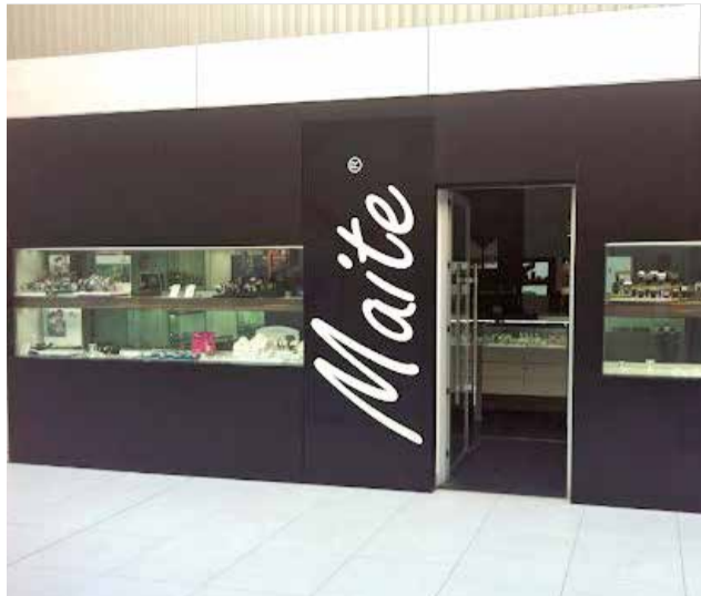
Local de Joyería Maite en el CC Lepicentre.

Para una celebración memorable, nada mejor que una cena o una comida. Puedes reservar en el restaurante La Perla, de Canet d'en Berenguer, Els Pins con su comida tradicional auténtica, en Estivella o el restaurante El Mirador de Sagunt.