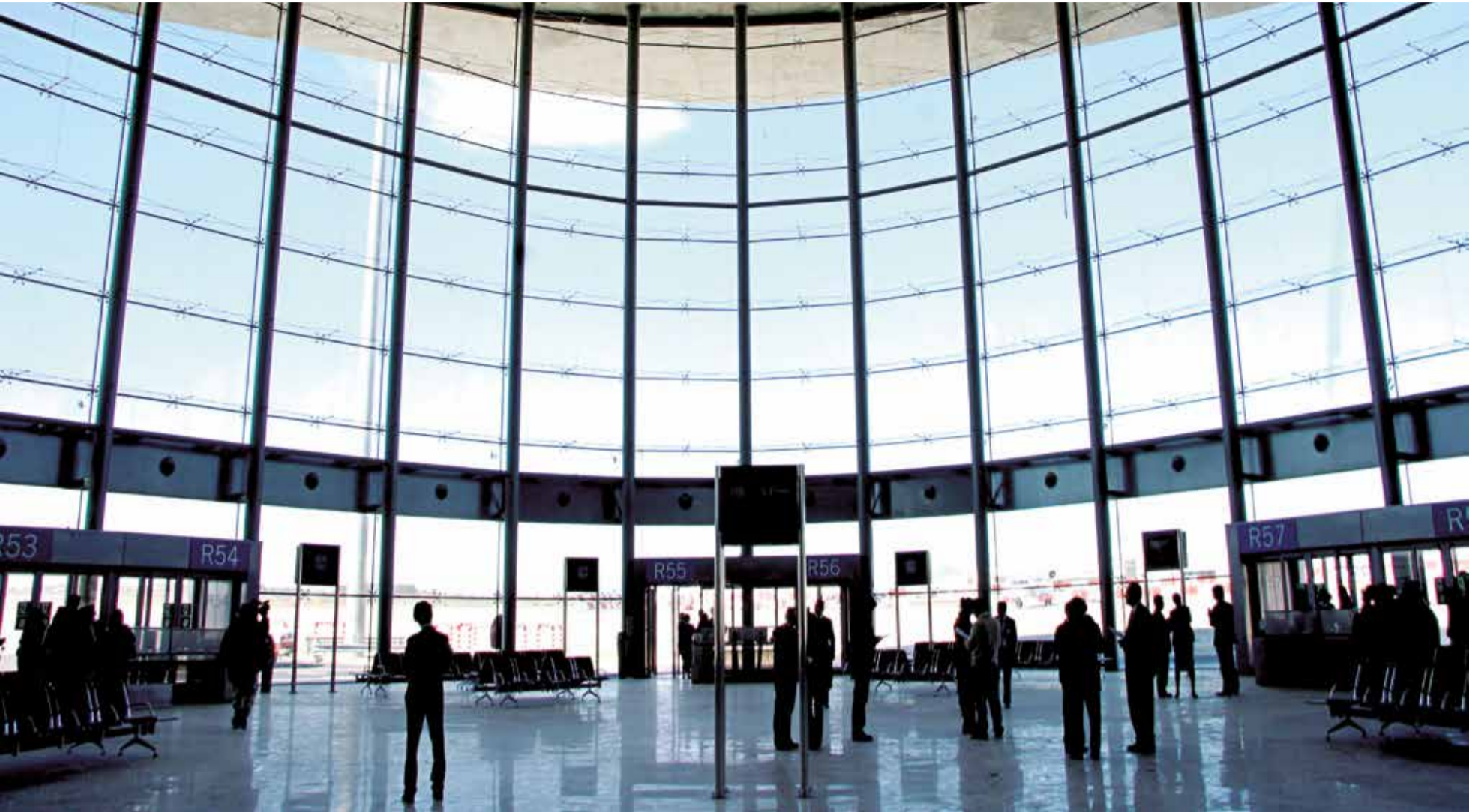
Usuarios esperan a su vuelo dentro de la instalación del aeropuerto de Manises.