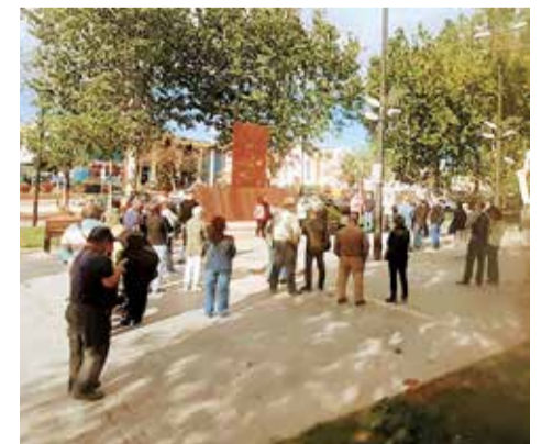
Concentración en Valencia por el cierre de Galmed y acto en el Port el 1 de mayo.