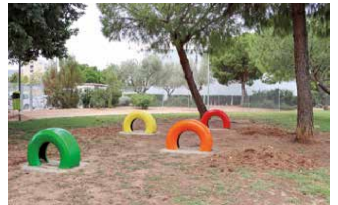
Juegos en el parque canino de Torrent.

La zona cuenta con varios elementos para que los animales puedan jugar y hacer ejercicio, y una fuente de agua potable. Además, dispone de dispensadores de bolsitas para recoger los excrementos, fomentando así que la ciudad permanezca más limpia al mismo tiempo que