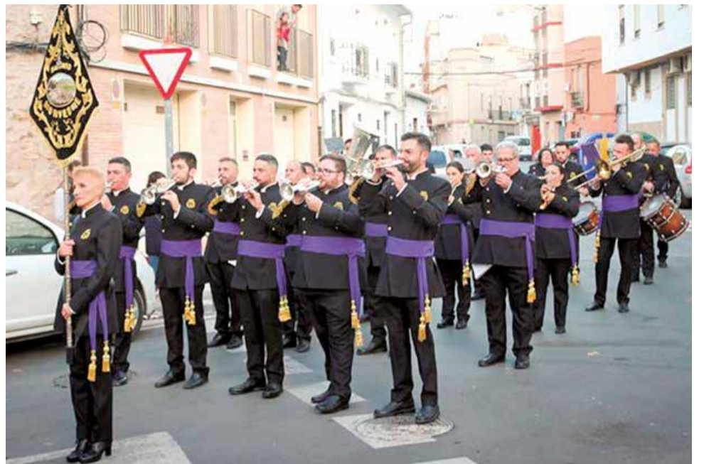
Banda de Cornetes i Tambors de Morvedre, en un acte de la Setmana Santa.