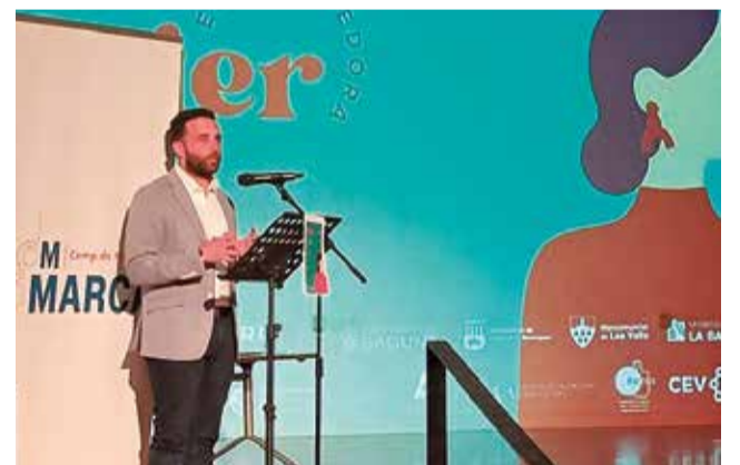
El alcalde, Darío Morneo, en la jornada.

La gran acogida de la Jornada de la Mujer Emprendedora refleja el interés y el compromiso de la comunidad por impulsar el crecimiento y la equidad en el tejido empresarial.