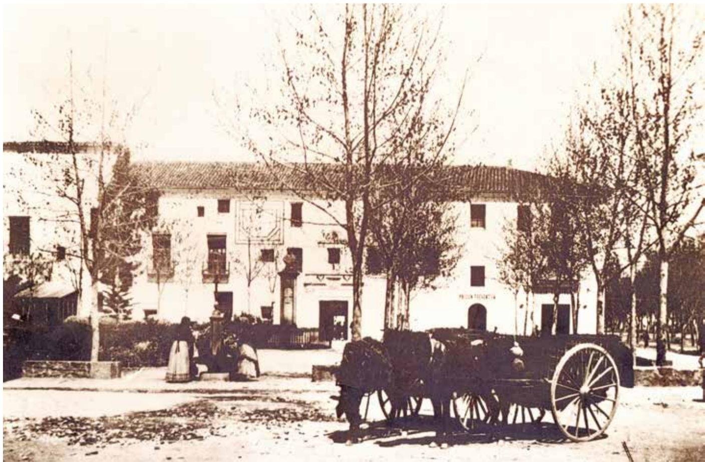
Vista general de Sagunt i convent.

amb algunes dates claus com la de la seua fundació l'any 1294, en el qual els jurats de Sagunt van sol·licitar als franciscans el seu establiment a