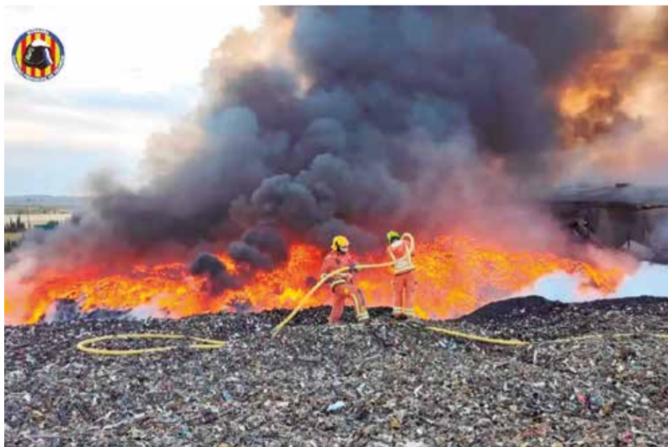
Incendio en San Antonio de Requena.

mismo. "Las administraciones trabajamos de la mano para tratar de recuperar la normalidad lo antes posible", ha destacado el director general.