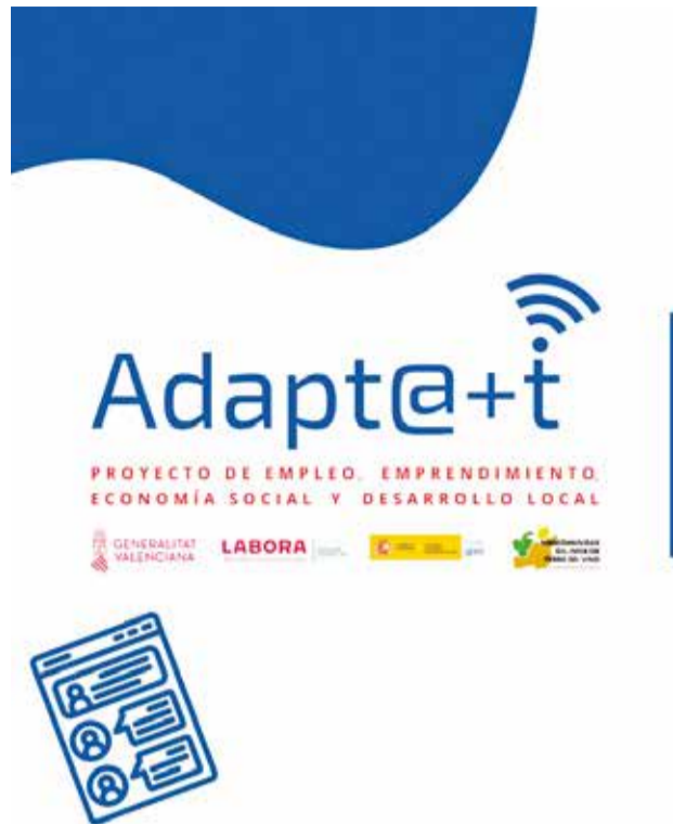
Circuito de Empleo de la Mancomunidad del Interior Tierra del Vino.

El Circuito de Empleo de Adapt@+t ha realizado una primera sesión con un grupo de electromecánica y otro de mecanizado, junto al de-