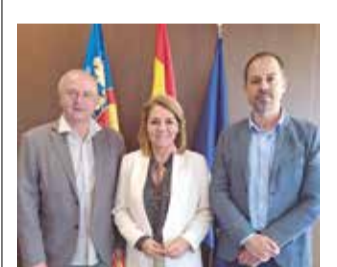
Reunión en Macastre.