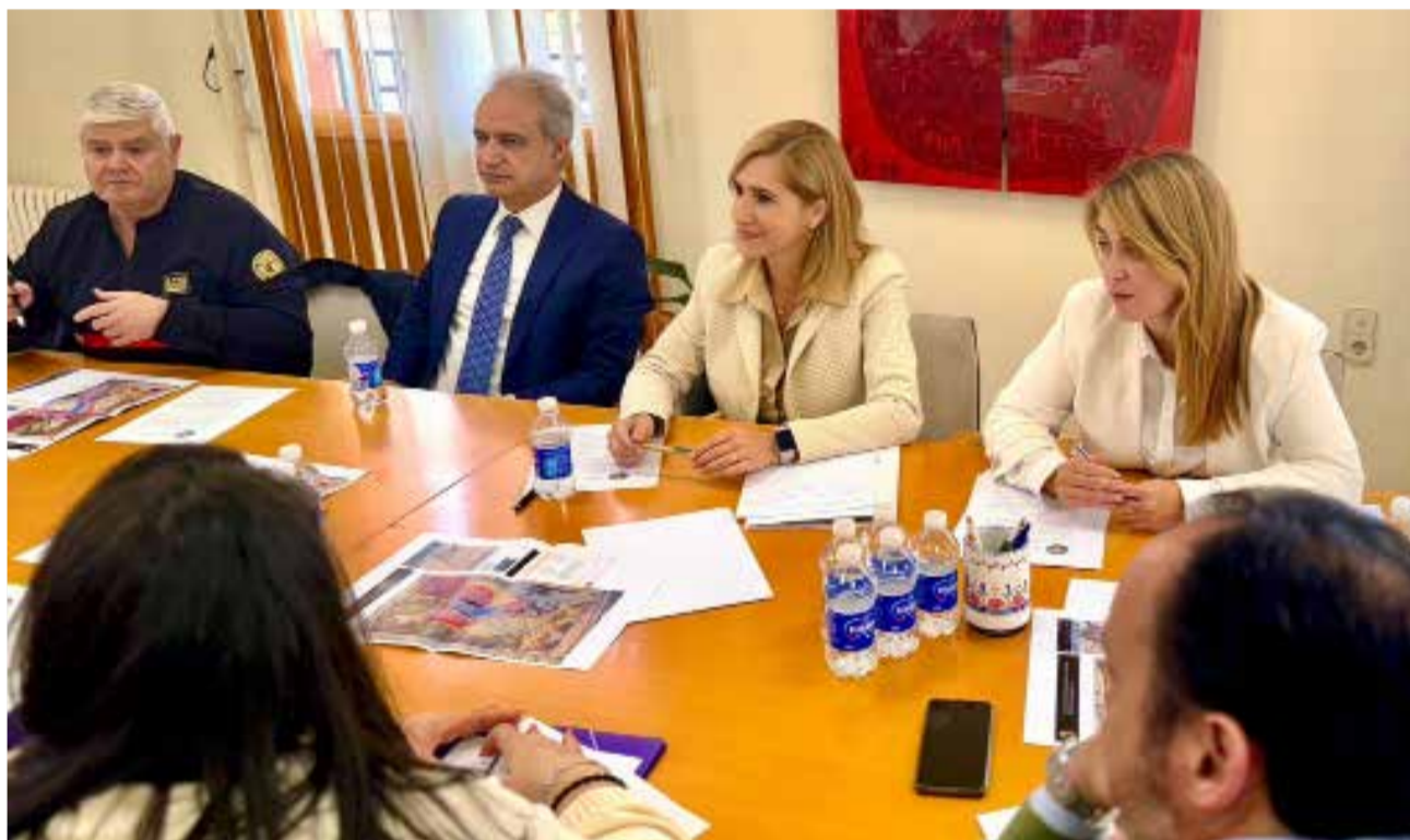
Un momento durante la reunión de la Generalitat Valenciana en Requena.

biente ha tratado de respaldar a los vecinos en la medida de sus posibilidades y competencias. Desde la Dirección General de Calidad y Educación Ambiental, una vez confirmado que el incendio no se sofocaría de forma rápida, se procedió a instalar