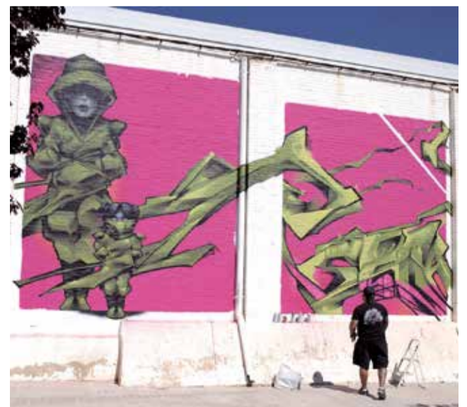
Algunas de las obras que formaron parte del festival de arte urbano Graffitea Cheste 2024.