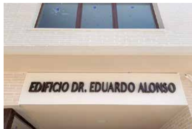
Edificio Dr. Eduardo Alonso de Macastre.