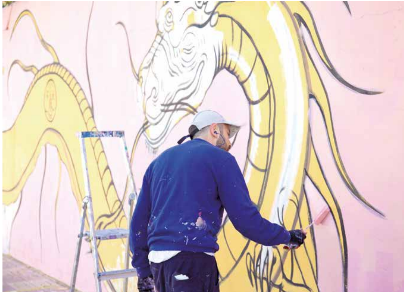
Los artistas pintaron libremente en los muros cedidos por la población de Cheste. / EPDA

“Este espectáculo nos enseña que allí donde unos solo ven basura, otros son