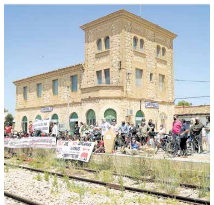
Estación de Camporrobles.

el trazado o, como alternativa, “prolongar veinte kilómetros la línea C-3 de Valencia a Utiel para dar servicio al municipio a quien el Gobierno central ha condenado a ser un pueblo fantasma”. En este sentido, Pradas ha recordado que la decisión del Mi-