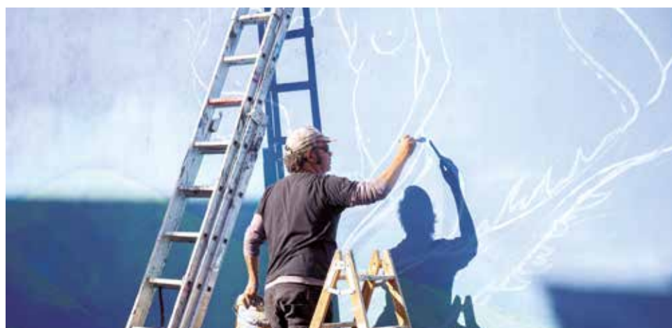
Las rutas guiadas tuvieron récord participativo.