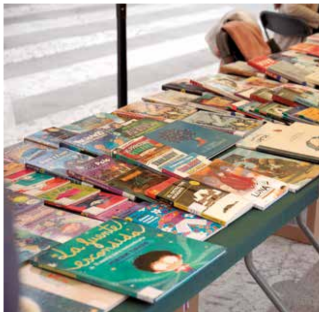
Algunos de los expositores de la Feria del Libro de la localidad chestana.

“La feria del libro es una tradición desde hace muchos años, normalmente son los centros educativos los que montan los puestos para re-