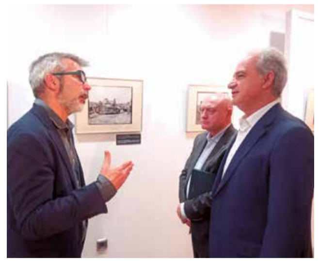
El alcalde de Utiel durante la inauguración.