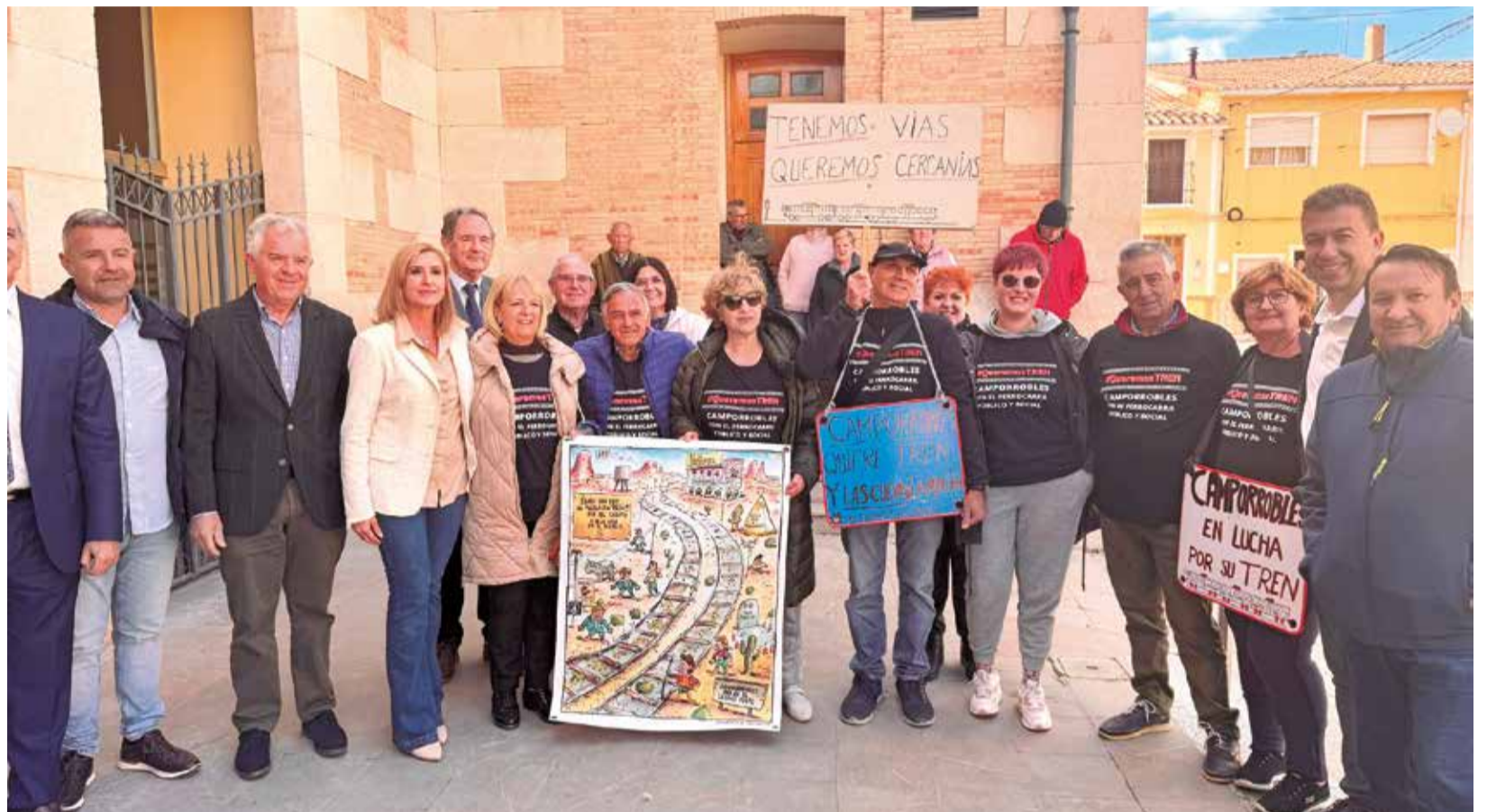
Visita de la consellera Salomé Pradas a Camporrobles.

Precisamente en Camporrobles, la consellera ha instado al Ministerio de Transportes y Movilidad Sostenible a solicitar fondos Next Generation de la Unión Europea para volver a poner en marcha