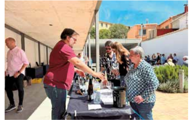
Diferentes momentos de la Ruta del Tapeo de Utiel.