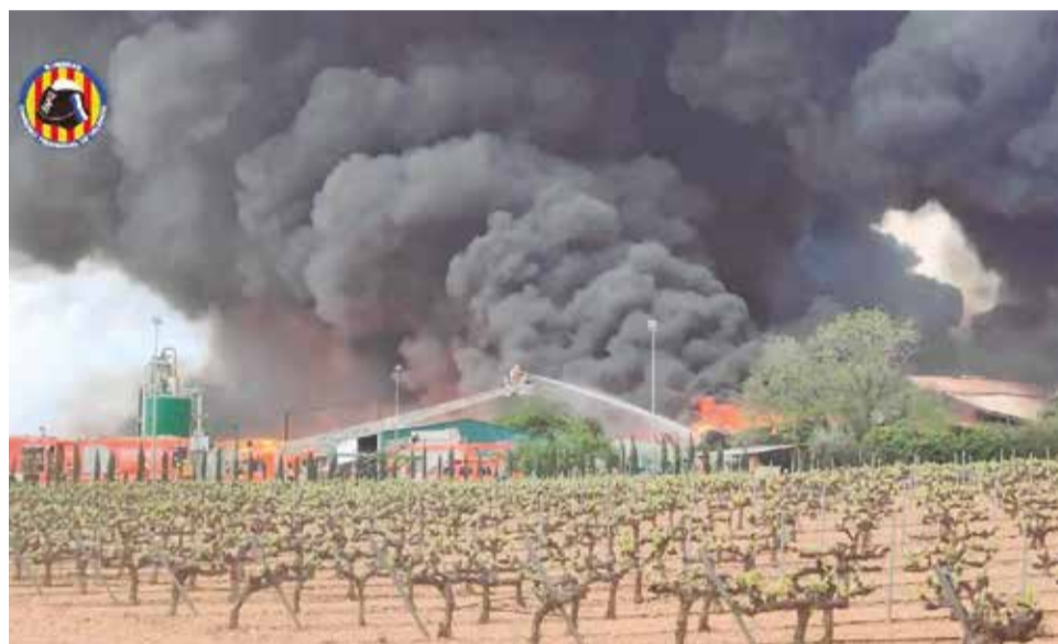
Diferentes instantáneas de las labores de extinción del incendio de Requena.