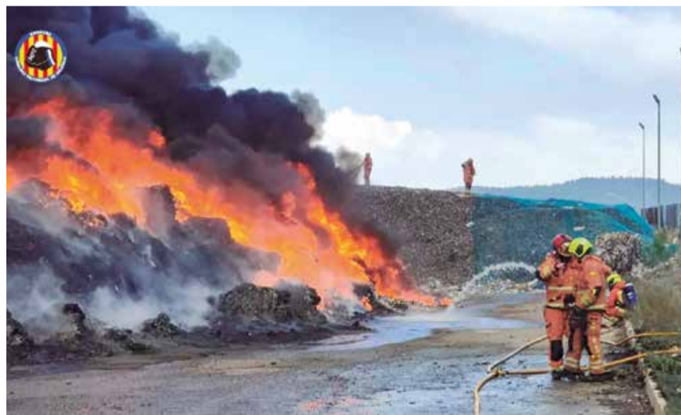
Los bomberos trabajando sobre la planta de reciclaje de Requena.