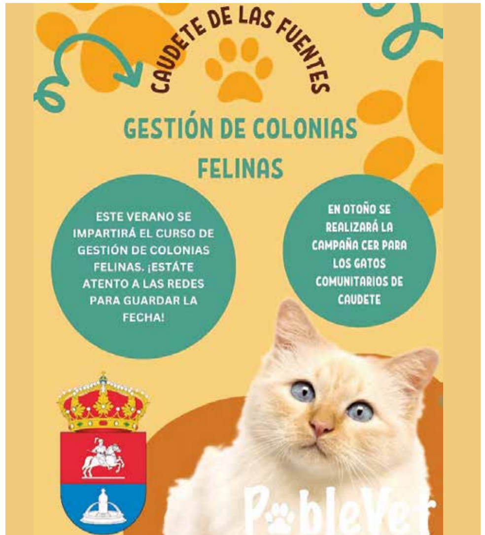
Campaña de la gestión de colonias felinas de Caudete de las Fuentes./ EPDA

“Por nuestros vecinos, por salubridad y por el bien de los gatos vamos a hacer un esfuerzo entre todos para acabar con este problema” finalizan.