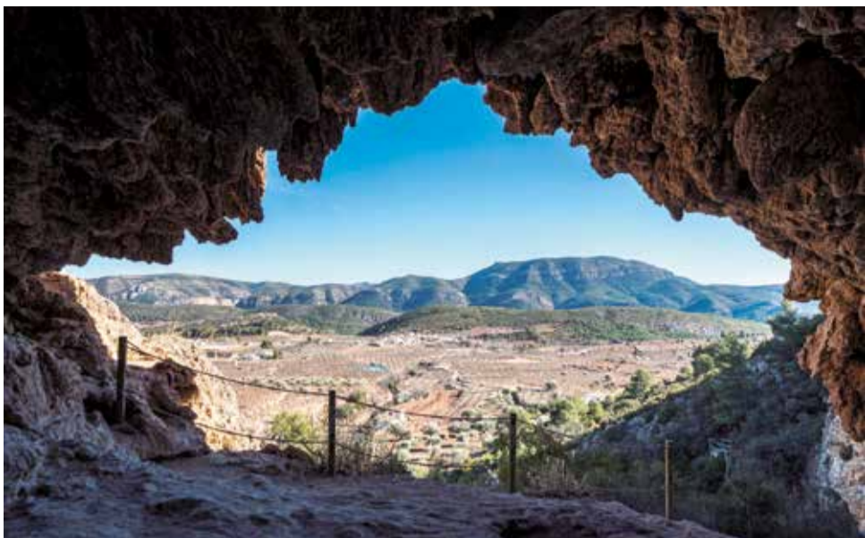
Vista aérea de Chera.