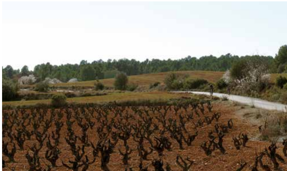
Ciclorruta próxima a un viñedo.

El contrato se ha adjudicado a la empresa Señalización y Equipamientos para Entornos Naturales, S.L. por un va-