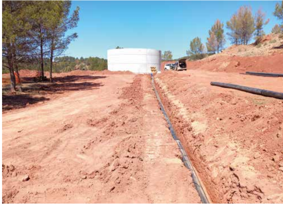
Depósito de agua en Requena.

Esta actuación se incluye dentro de los ocho depósitos de agua para luchar contra los incendios forestales que