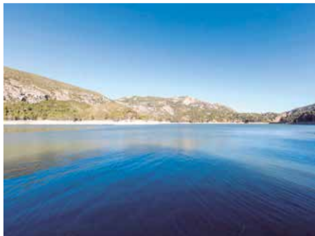
Embalse de Buseo en Chera.

También puedes recrearte con sus numerosas fuentes,