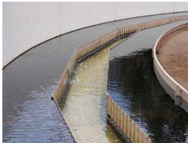
Foto archivo de una depuradora.

El acuerdo plenario ahora adoptado permite modificar el proyecto inicial, dando