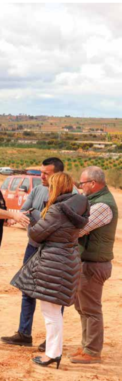
En la planta de reciclaje.

dinación con la Generalitat, para extinguir el fuego, según ha informado la Diputación en un comunicado.