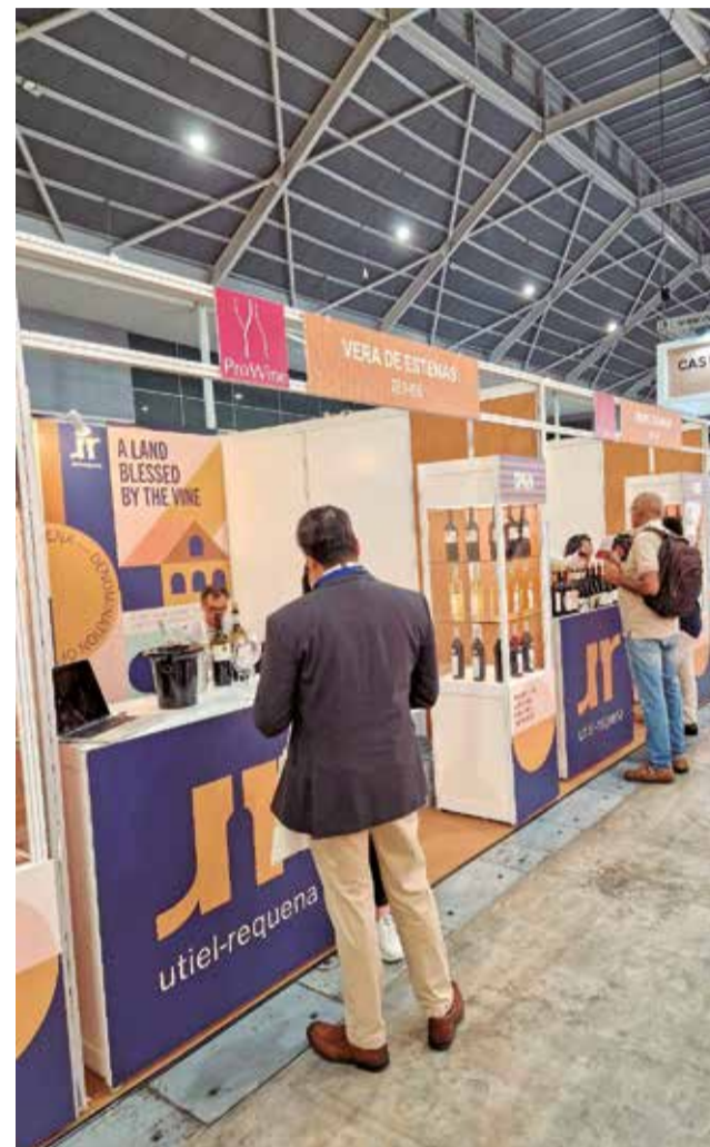
El stand de la DO Utiel-Requena en la feria ProWine.

Gracias a la realización simultánea de ambas ferias y su gran afluencia de público, las bodegas cuentan con la atmósfera perfecta para ampliar y reforzar las relaciones comerciales con clientes, importadores, distribuidores y sumilleres de distintas partes de todo el mundo.