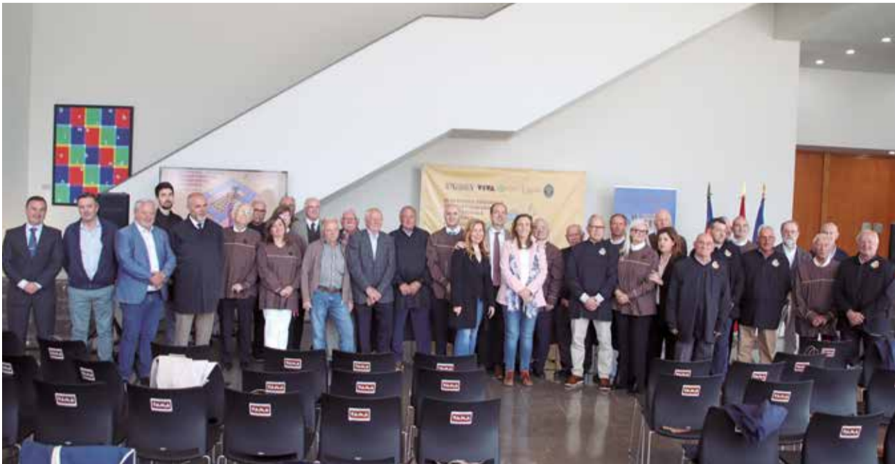
Las autoridades locales con los participantes en la jornada. / EPDA