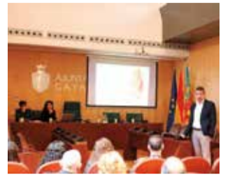
Presentació del pla.