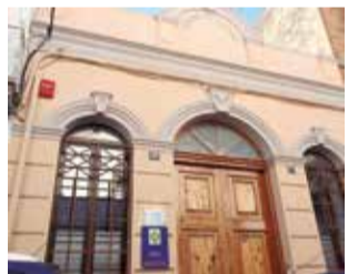
El edifici. / EPDA