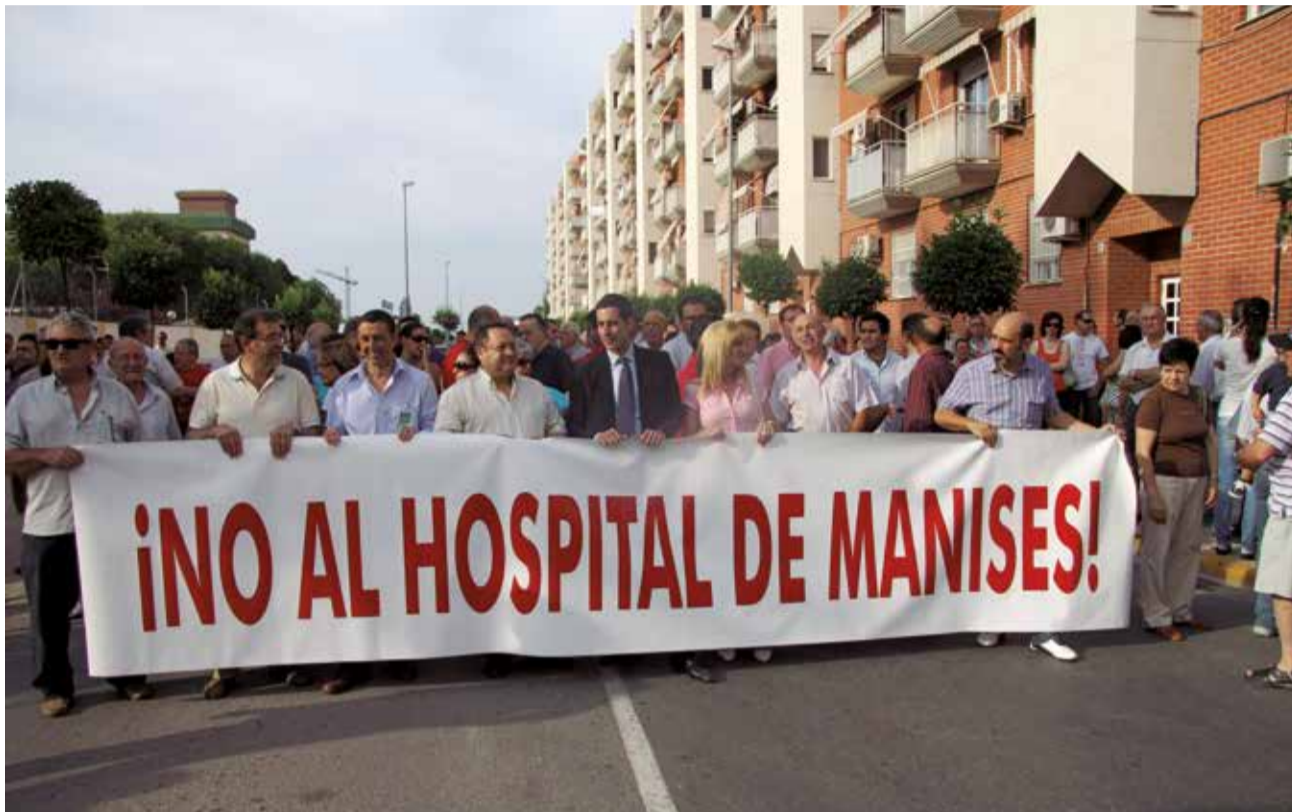
Una manifestación en Mislata reclama la reversión de la gestión.

"No podíamos permitir que nuestros vecinos y vecinas siguieran sufriendo las consecuencias de un modelo privatizador en claro retroceso, como demuestra la creación de nuevas 400 plazas para profesionales, anunciada por el conseller. Ahora seguimos teniendo un compromiso con la ciudadanía y vamos a es-