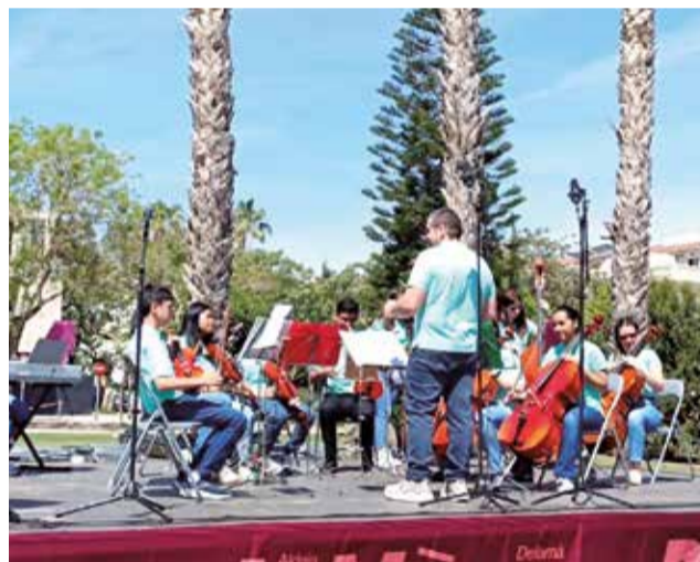
El ambiente y las actuaciones que se organizaron durante la feria.