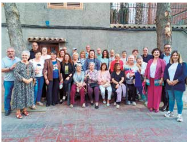
La inauguració de l'exposició d'artistes locals.

També es va celebrar la xarrada sobre 'El cementiri, memòria d'un poble a càrrec de El Bolitxo i els veïns pogueren disfrutar d'una visita cultural a Burjassot.