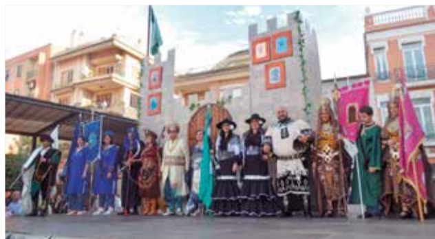
Els càrrecs en les Ambaixades i la rodà de banderes.

de diversos edils de la corporació municipal.