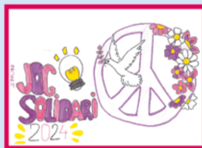
DISSENY GUANYADOR DEL JOC SOLIDARI 2024