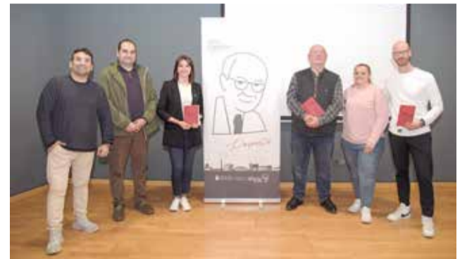
La presentación del programa. / EPDA

EL PROGRAMA INTEGRA ACTIVIDADES PARA DAR A CONOCER AL POETA