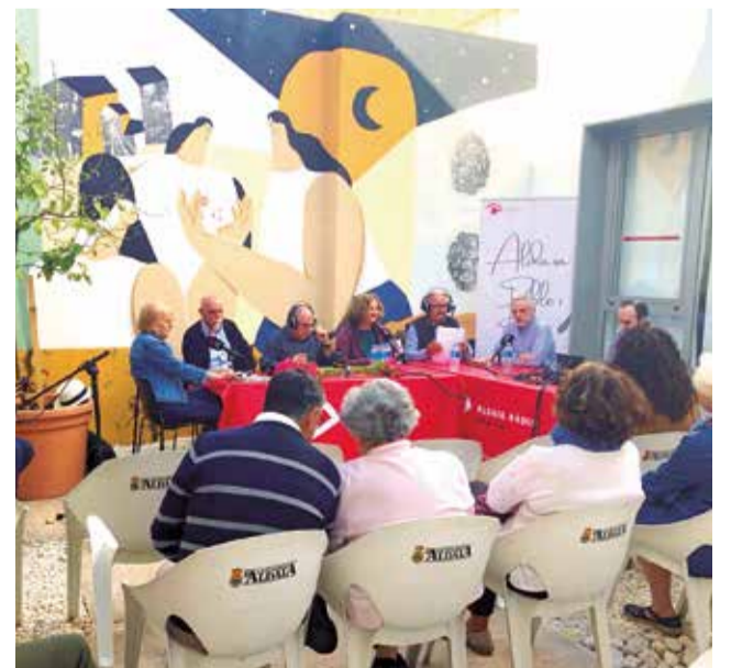
Un moment del programa.

La idea, segons els impulsors d'este espai, és seguir "contribuint al foment de la cultura escrita i recitada a través de les ones de la ràdio pública, junt al públic aldaier que vulga sumar-se a parlar de la bellesa de les paraules i de la vida".