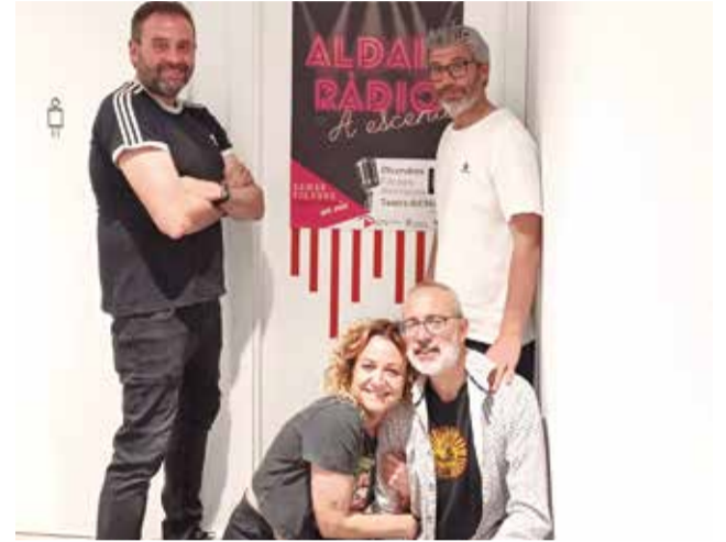
L'equip de 'Sense Filtres'.

La iniciativa consistix en portar un dels programes d'entreteniment realitzats habitualment en l'estudi a este nou format divertit i fresc Així, l'equip del programa 'Sense Filtres' podrà mostrar al públic assistent el seu espectacle que incorporarà sorpreses, risses i participació. Una idea, a més, que pretén implicar a altres agrupacions o formacions aldaieres,