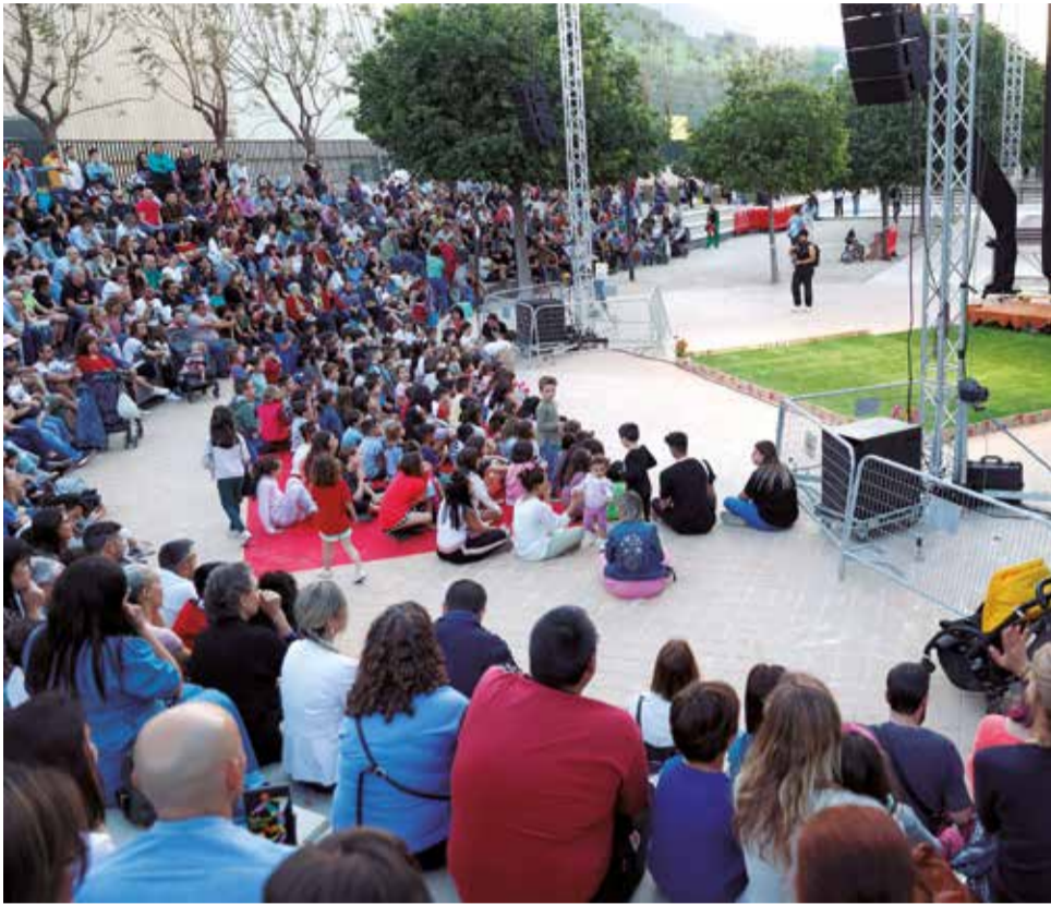
El público asistente a un espectáculo del año pasado.