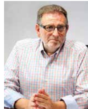
Jesús Ros. / EPDA

► Jesús Ros es otro de los alcaldes emblemáticos de la comarca, con 25 años presidiendo la corporación municipal por el PSPV en Torrent. Su mandato fue de 1987 a 2004, en esta etapa dejó la vara de mando para ser diputado en Les Corts. Después, regresó con más fuerza para ostentar la alcaldía de 2015 a 2023.