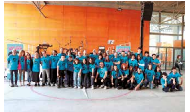
Els participants en la jornada.