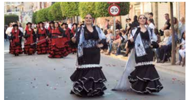
Els capintans en la Desfilada de gala.

rats de la festa de Moros i Cristians. Primer es va celebrar l'Ambaixada Mora, on el bàndol simulà la conquesta del castell i en la matinada tingué lloc la Retreta, acompanyada d'una discomòbil.