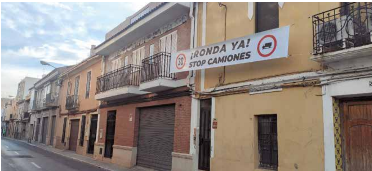
Una fachada con una pancarta colgada por los vecinos.

“En esta calle, nada cumple con las normas, ni la anchura de las aceras, por supuesto su