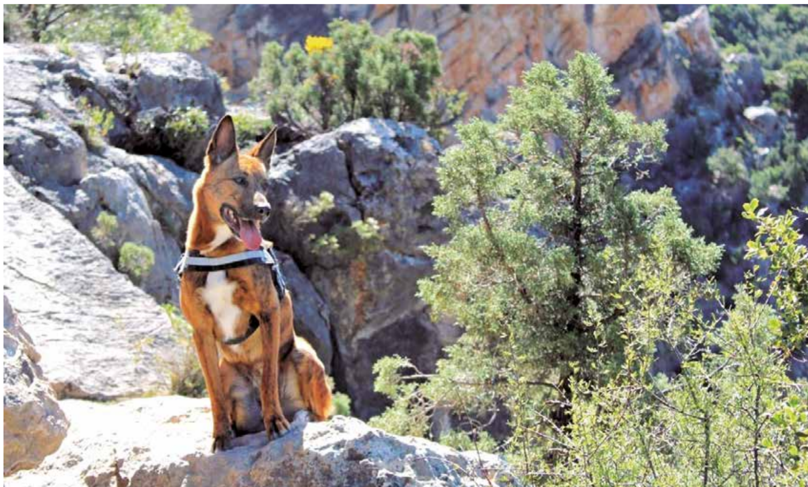
Un perro durante una ruta senderista en Chelva.

Si nos adentramos en el interior de la provincia de Valencia, es más complicado encontrar espacios cerrados habilitados para la socialización y el esparcimiento de nuestras mascotas. Pero estos espacios se encuentran en el entorno en sí mismo. La comarca de La Serranía y sus montes ofrecen una gran variedad de rutas para hacer senderismo, la mayoría habilitadas para realizarlas con perros. Una de ellas es la Ru-