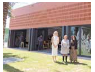
Les instal·lacions.