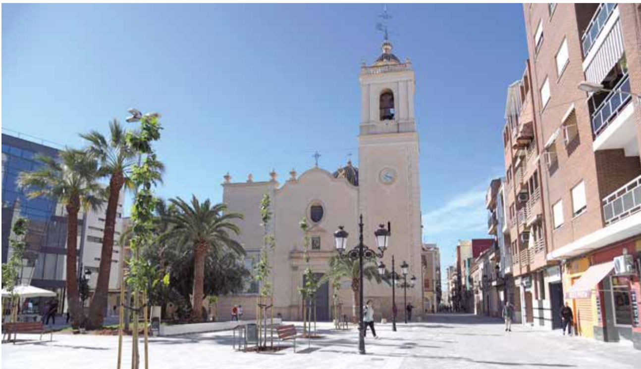
La imagen actual tras la renovación del espacio. / EPDA