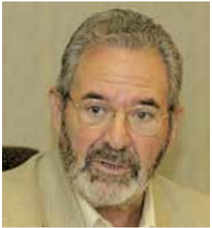
Bertomeu Bas.

► Bertomeu Bas fue alcalde de Paiporta durante siete legislaturas por el PSPV y presidente de la Mancomunitat de l'Horta Sud en 1983, un cargo en el que se mantuvo durante un mandato de cuatro años, siendo el segundo en ocuparlo tras constituirse la institución comarcal. Falleció en agosto de 2022 tras una larga enfermedad.