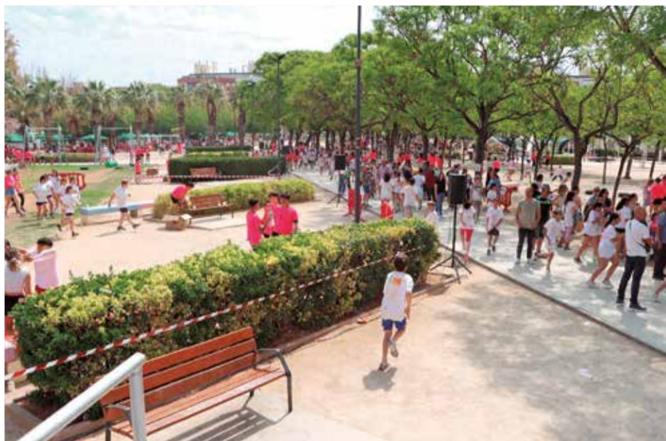
Els assistents a la festa de l'any passat.

participació de la ciutadania. Milers de persones, entre associacions, entitats i veïns i veïnes participen i s'involucren cada any en esta jornada que inclou diferents espais destinats a la infància i la joventut. Com a novetat, este any es llegirà un poema de Vicent Andrés Estellés, amb motiu de la commemo-