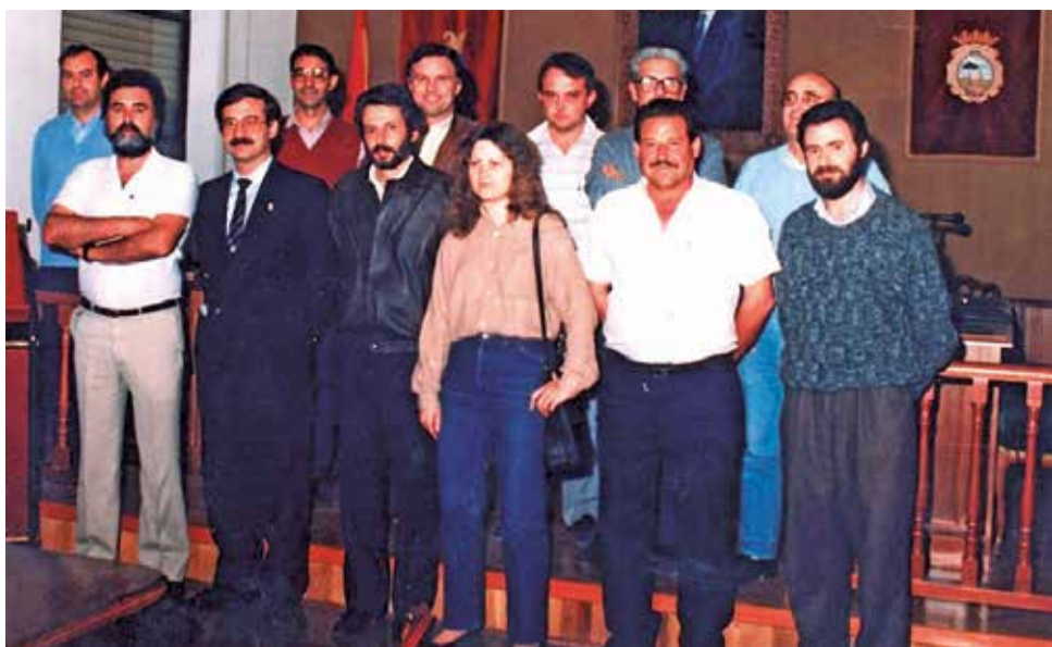
La corporación municipal de Picanya en 1983.

sa recogió el testigo y recuperó la vara de mando para los socialistas hasta la actualidad.