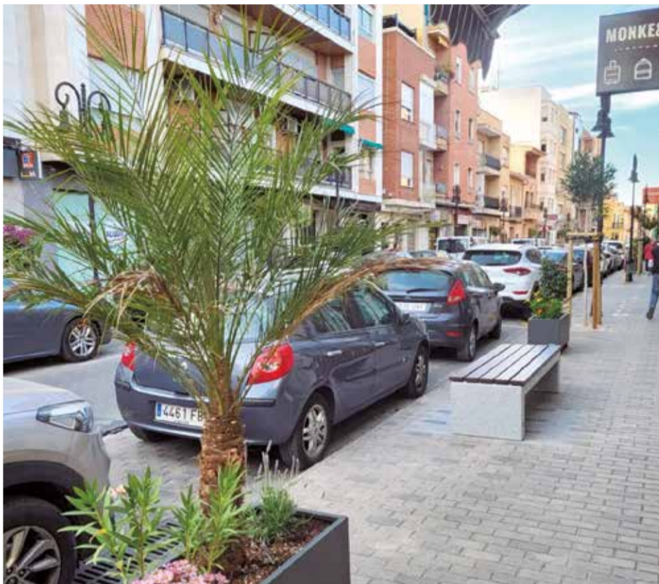
Un dels carrers on es va a actuar.

Per part seua, l'alcalde, Guillermo Luján, indica que amb