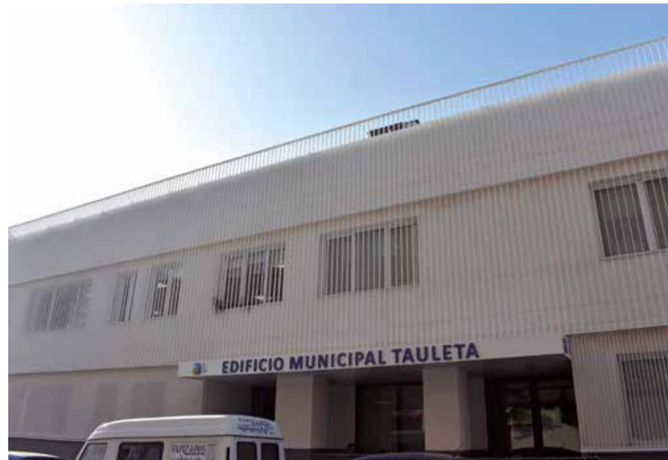
El nuevo edificio la Tauleta.

Se da la circunstancia de que la adjudicación de las obras, con incremento de precio, se realizó a la empresa Bertolín, la misma a la que se le dio la polémica remodelación del campo de fútbol sin licitación pública un mes antes de las elecciones municipales de mayo de 2023, como adelantó El Periódico de Aquí.