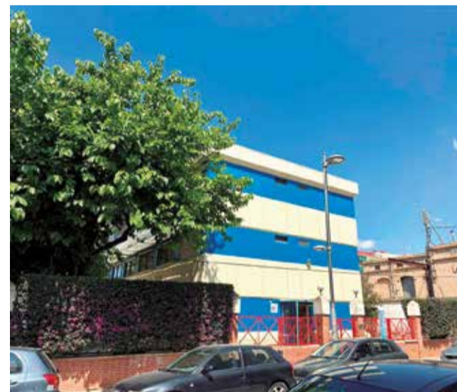
Las instalaciones de la EPA. / EPDA

De 2021 hubo que devolver 120.000 euros por falta de ejecución y justificación. Además, el traslado de los servicios sociales de ese edificio le ha costado a Alfafar más de 100.000 euros anuales en concepto de alquileres y adaptación de los espacios.