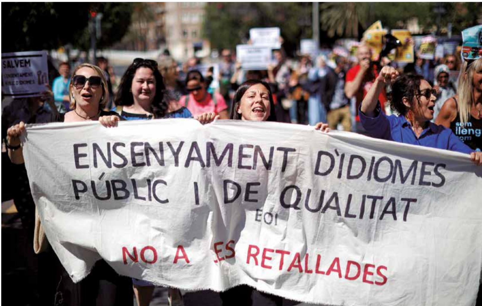
Profesorado de la Escuela Oficial de Idiomas de Valencia en una concentración "contra los recortes propuestos."