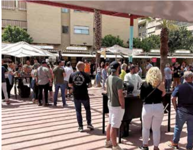
Una de les jornades de l'esdeveniment.

Una àmplia varietat de negocis locals va oferir els seus productes en cura del cos, indumentària, calçat, automòbils, psicosalud, begudes i alimentació amb les tapes més exquisides i combinats deliciosos, en un ambient festiu i acollidor, amb ofertes exclusives per als visitants, brindant una oportunitat única per a descobrir i gaudir de les botigues i serveis de la localitat, acompanyat de música en viu i un ambient agradable. Els visitants pogueren votar a la millor tapa a través