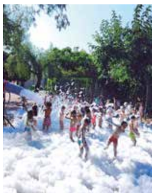
Una actividad.

Las plazas ofertadas ascienden a 525 plazas a un precio de 60 euros la escuela completa. También se puede elegir por semanas específicas, cuyo precio es de 15 euros. Las inscripciones se tramitarán del 20 al 30 de mayo, con periodo de pago del 31 de mayo al 10 de junio.