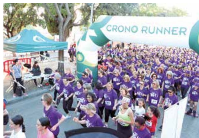
El tret d’eixida de la prova.

d’Alaquàs, Coratge Missions, Ct Rehab Deporte Aldaia i Sense Límits. Cal destacar, a més, el caràcter solidari de la prova, ja que la recaptació està destinada a l’Associació Alanna.