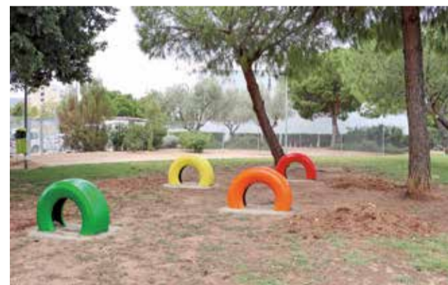
Juegos en el parque canino de Torrent.

La zona cuenta con varios elementos para que los animales puedan jugar y hacer ejercicio, y una fuente de agua potable. Además, dispone de dispensadores de bolsitas para recoger los excrementos, fomentando así que la ciudad permanezca