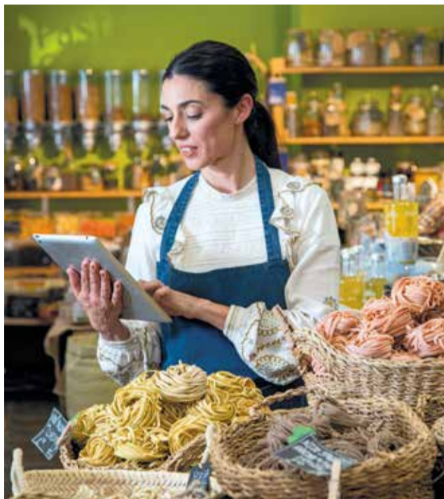
Los comercios ofrecen los mejores productos.

Se trata de un valor intangible, difícil de medir pero que solo aporta beneficios. Un gesto amable, una sonrisa, un trato afable marcan la diferencia en la experiencia