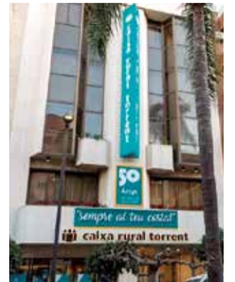
La sede de la entidad.

A lo largo de sus más de 50 años de historia, esta en-