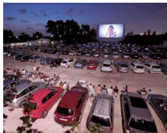
Espectadores en el Autocine Star en Pinedo.

especiales con nuestros amigos peludos mientras disfrutamos de una buena película. Cualquiera de estas opciones ofrecen una experiencia cinematográfica incomparable para todos, tanto humanos como animales. Valencia se consolida así como una ciudad donde el entretenimiento se combina perfectamente con el amor por nuestras mascotas.