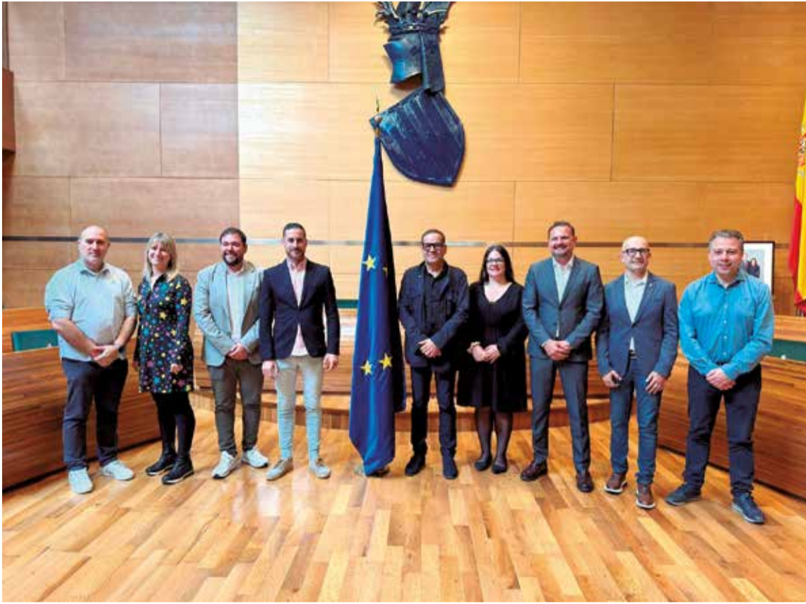
El presidente de la Mancomunitat, José F. Cabanes, con los diputados.