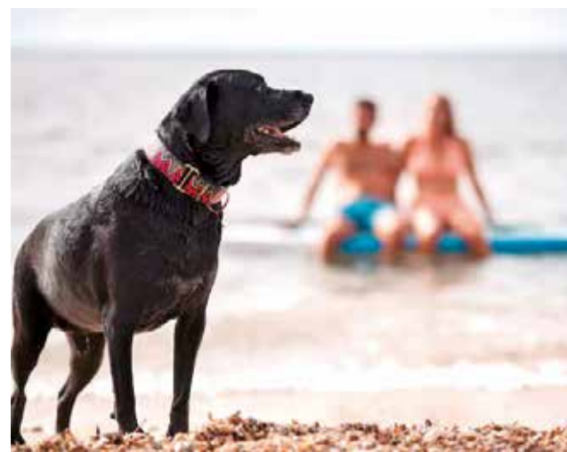
Un perro en la playa del Port de Sagunt.

que hacen posible disfrutar del cine con nuestras mascotas. Estos espacios brindan una atmósfera única para relajarse, disfrutar del buen clima y compartir momentos