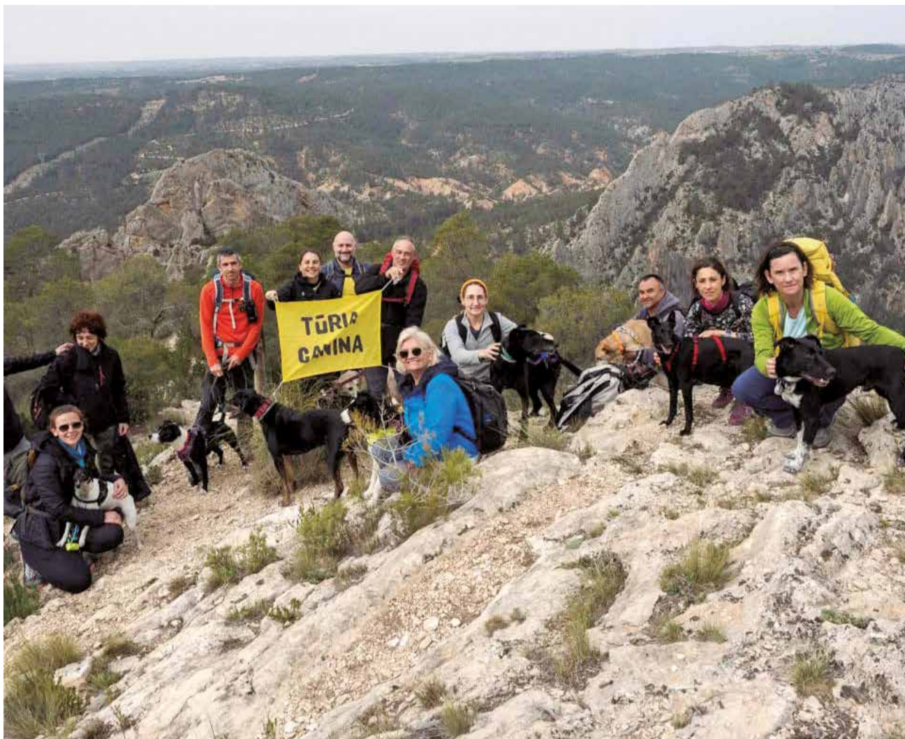
Ruta senderista canina de la asociación Túria Canina de Riba-roja de Túria.

lisis clínicos y nutrición natural. Además, ponen microchip a las mascotas y realizan cirugías, así como radiografías, ecografías y ecocardiogramas. También tratan a felinos y animales exóticos. Una de las máximas de la clínica es la de tratar a sus pacientes "con el máximo cariño y la mejor de las profesionalidades".