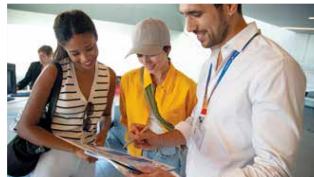
El trato amable y cuidado por los detalles. / EPDA