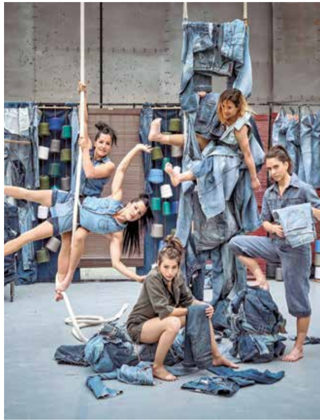
Capicua Circ actúa en esta edición.