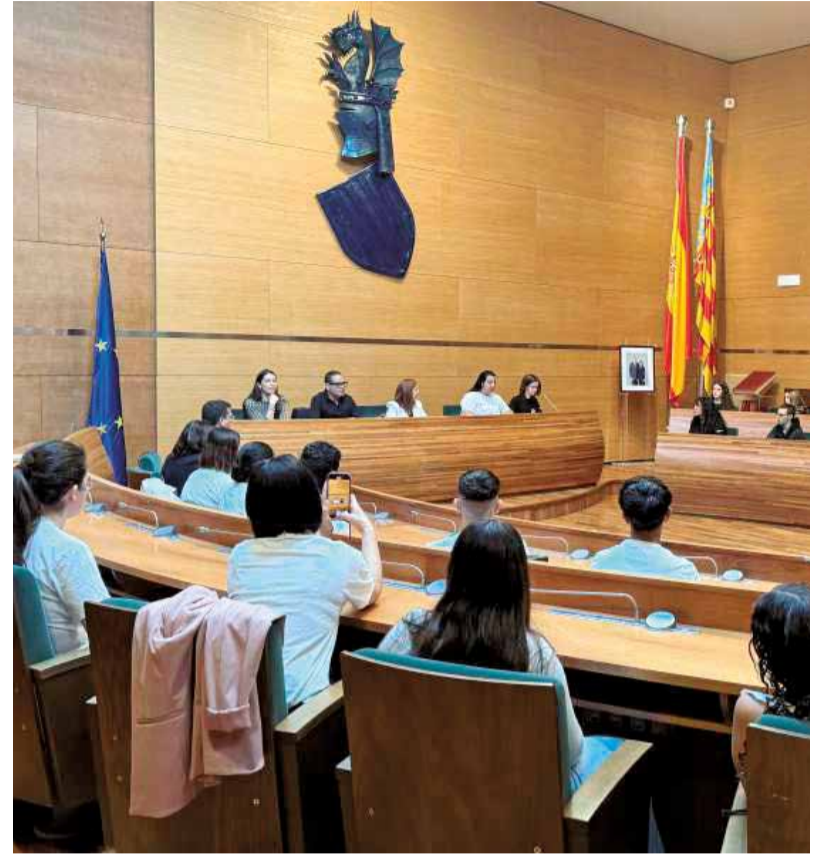
Los alumnos en la sede de la corporación provincial.

EL ACTO CONTÓ CON LA PARTICIPACIÓN DE TRES CENTROS DE LA COMARCA CON EL DISTINTIVO DE EMBAJADORES DE EUROPA