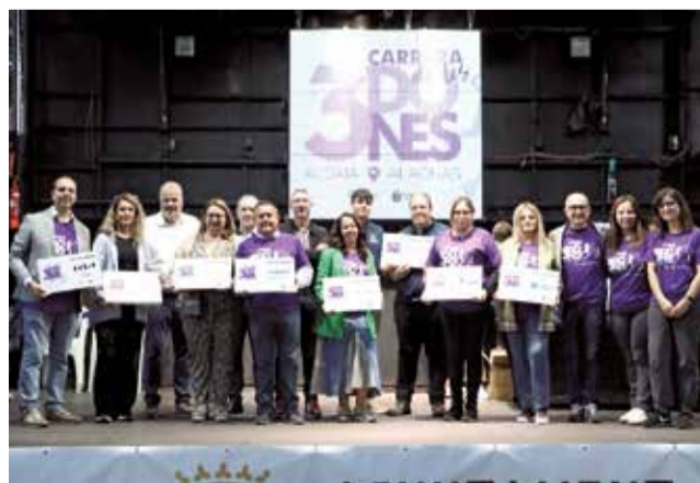
L’entrega de diplomes.

En l’organització han col·laborat també el Club de Atletismo Vila de Alaquàs, el club de Triatlón Triculpelat