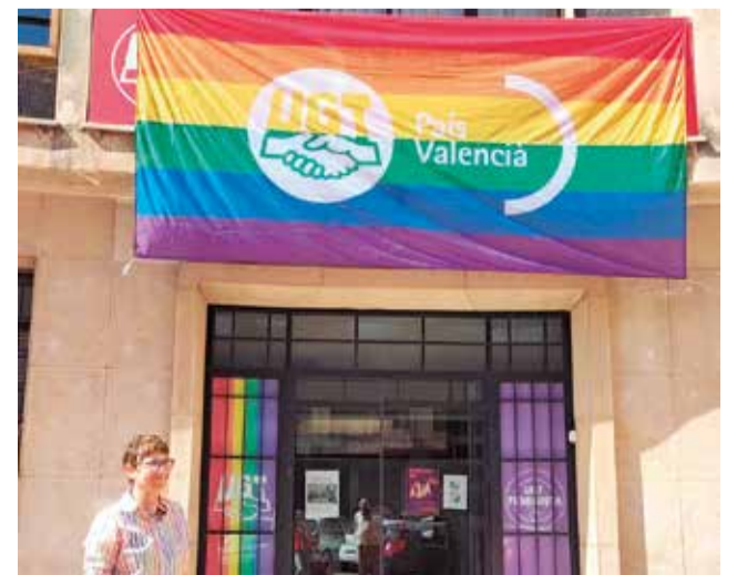
Bandera LGTB en la sede de UGT.

dos respecto a los derechos de las personas LGTBI. Es intolerable que determinadas fuerzas políticas quieran desmontar los cimientos de una sociedad tolerante e igualitaria como la nuestra”, expresaba el secretario general, Darío Moreno. Así, las concejales y concejales del PSPV-PSOE han difundido un video reflejando situaciones cotidianas que estereotipan, discriminan o violentan a las personas LGTBI.