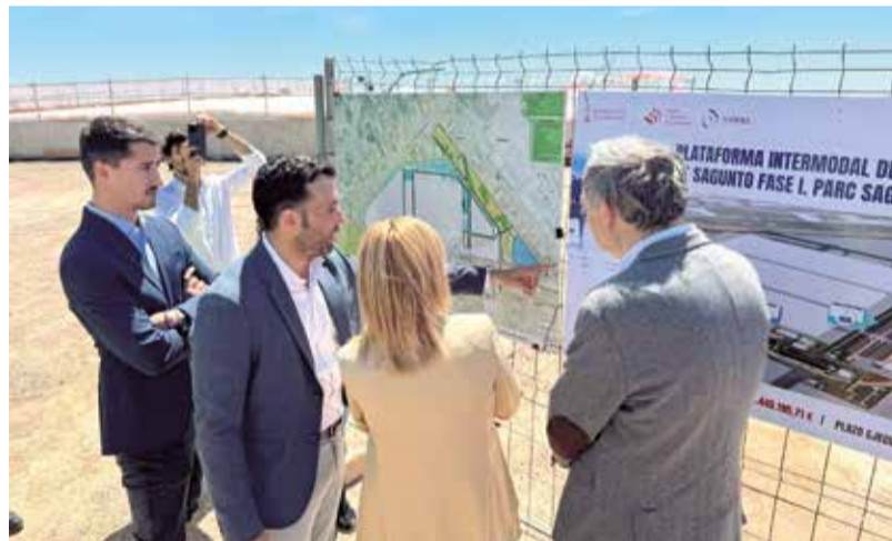
Autoridades municipales y autonómicas en su visita a las obras de la Plataforma Intermodal, ubicada en Parc Sagunt II.