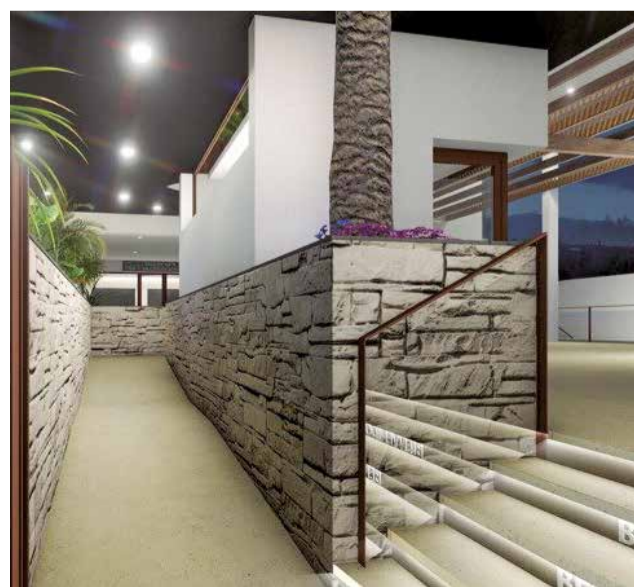
Vista virtual del proyecto.