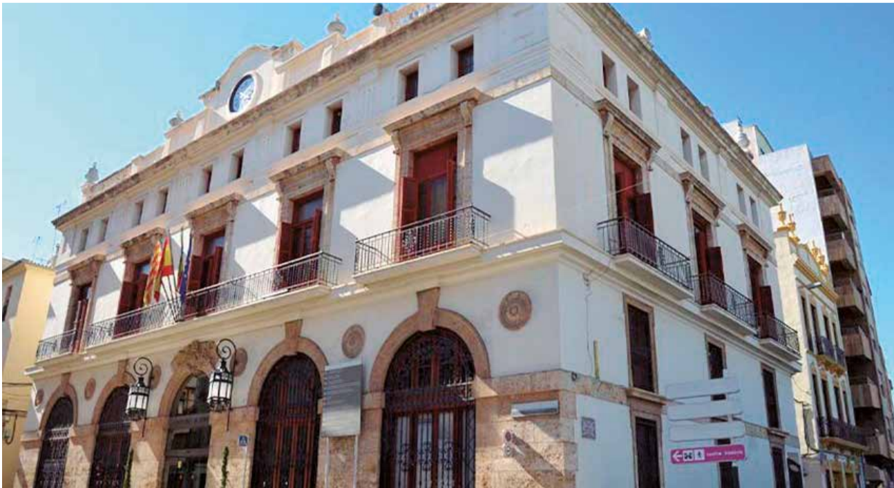
Fachada del ayuntamiento de Sagunt.