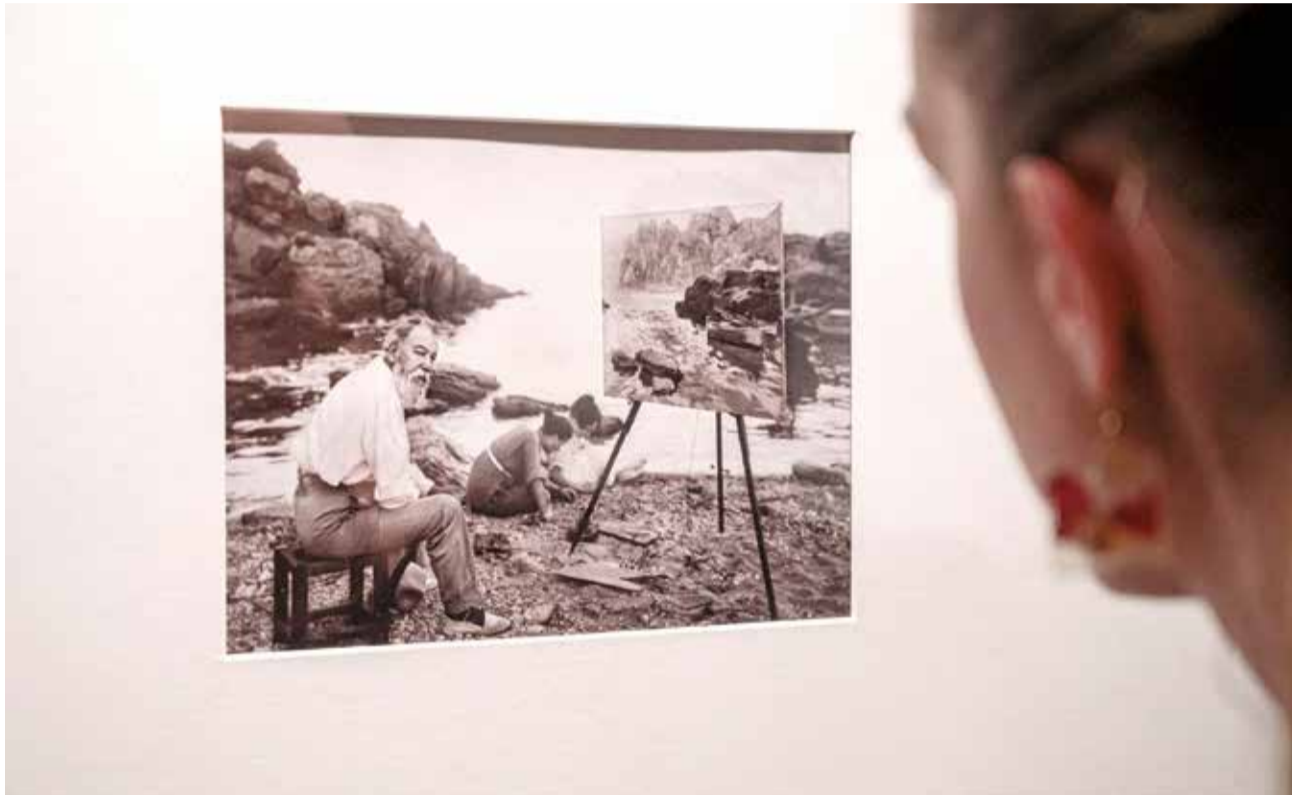
Una de las instantáneas que se podrán contemplar en la muestra.

El valor documental y antropológico que atesoran estas imágenes se completa con la mirada singular con la que se acercan a esa realidad española fotógrafos célebres de la época como Charles Clifford, Jean Laurent, Kurt