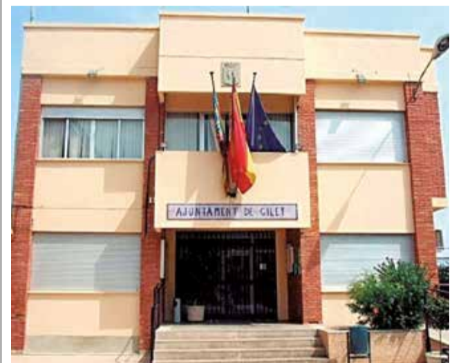
Fachada del ayuntamiento de Gilet.

"Se pretende hacer que la comunicación entre el Ayuntamiento y los ciudadanos sea más directa, eficiente y accesible", añade Costa. Esto representa un avance significativo en la estrategia de transparencia del municipio, permitiendo a los habitantes de Gilet recibir noticias, alertas y actualizaciones importantes sobre la gestión municipal en tiempo real, ya sea a través de dispositivos móviles o en persona.