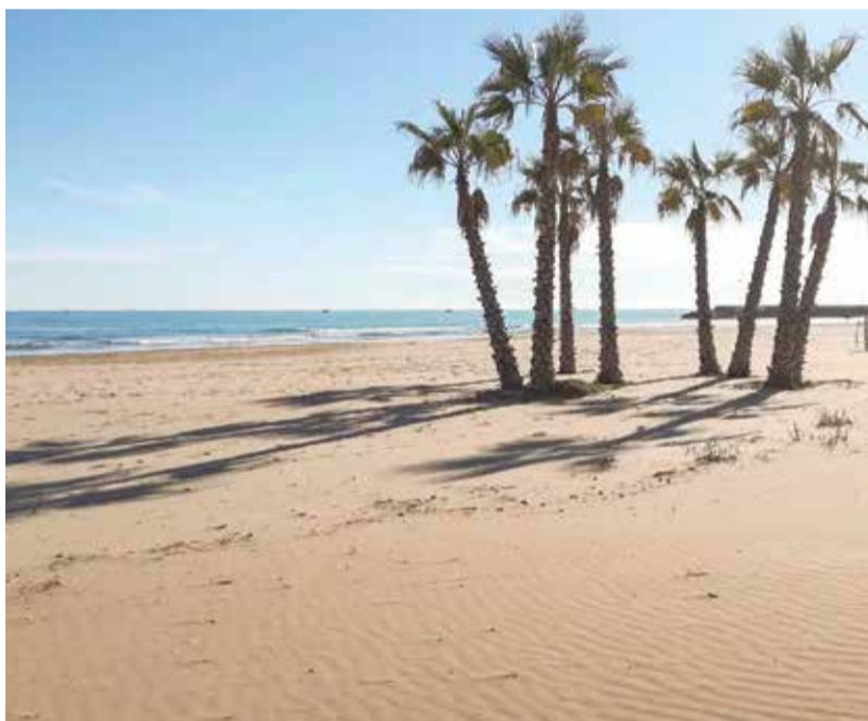
Platges de Sagunt i Canet d'en Berenguer.

LES PLATGES DEL PORT DE SAGUNT, CORINT, ALMARDÀ, MALVARROSA I EL RACÓ DE MAR DE CANET REBEN EL DISTINTIU