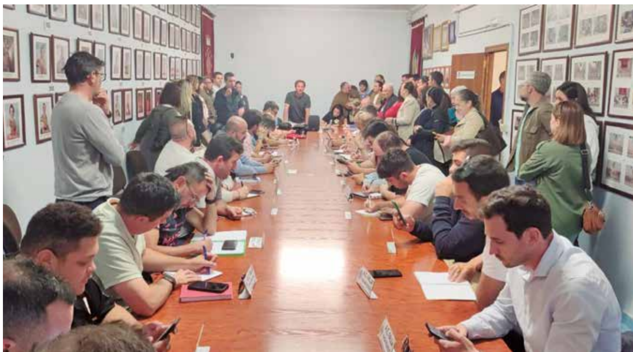
Reunió de presidents de les comissions falleres de la comarca la vesprada de l'elecció.

Un dels punts destacats de la seua proposta és la inclusió d'un equip divers i compromés, on la paritat de gènere i la combinació d'experiència i joventut són prioritàries. Aquest equip, segons Morte, encarna la il·lusió i el compromís del col·lectiu faller, adoptant el programa dissenyat amb la participació de tots els sectors de la comunitat.