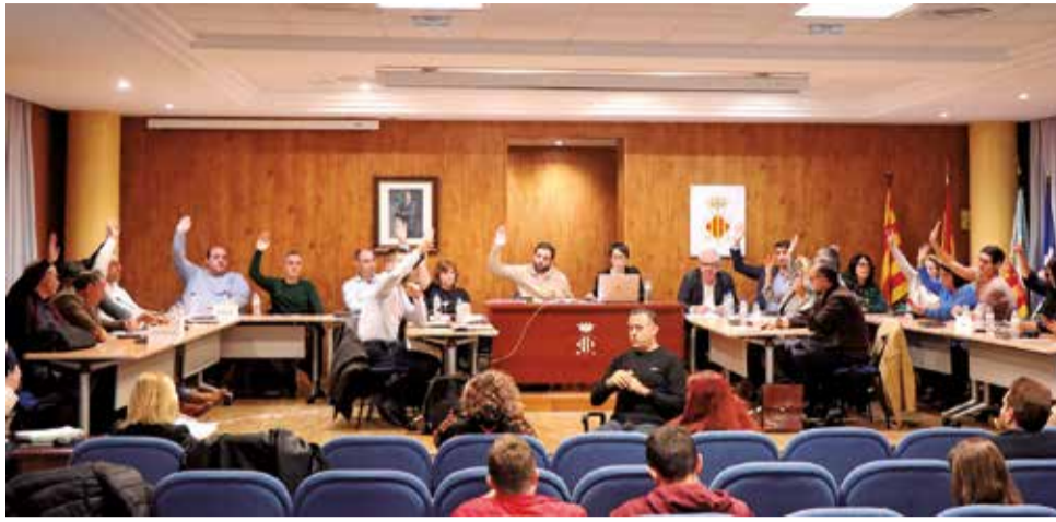
Un pleno del Ayuntamiento de Sagunt.