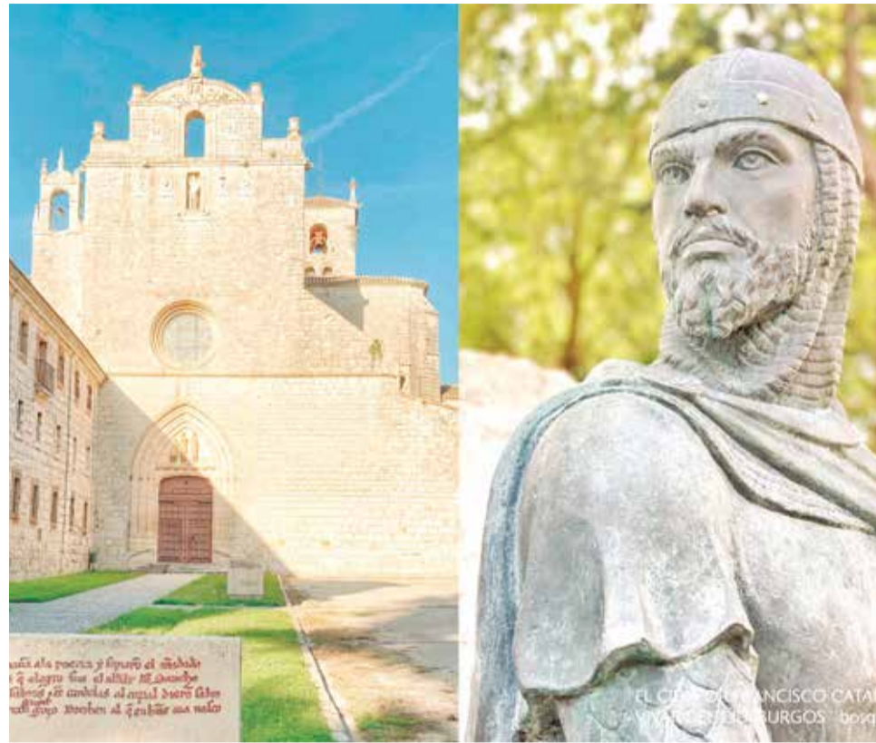
Promoció de les activitats pel Dia del Camino del Cid/ EPDA

Les localitats d'Algímia d'Alfara, Algar de Palància, Torres Torres i Benavites, a banda d'Ontinyent i El Puig de Santa María, acolliran les accions programades per