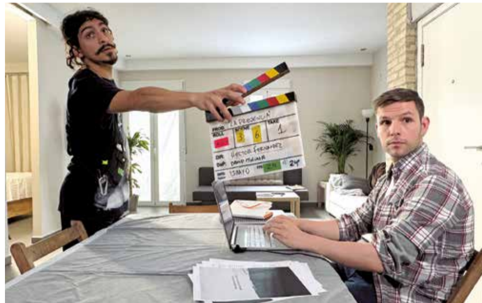
Un instant del rodatge.

Les persones interessades poden ampliar la seua informació a través del correu joventut@aytosagunto.es o telefonant al 96 268 34 39.