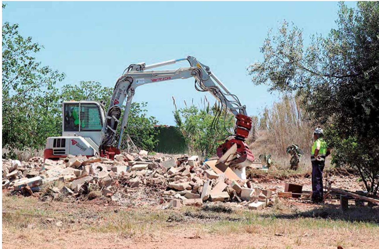
Operarios trabajan en la demolición de las construcciones ilegales en la zona del delta del Palancia.

En la misma línea, el director general de Medio Natural, Raúl Mérida, que visitó junto a las autoridades municipales el estado de las obras, explicaba que la intervención –que comprende el proyecto de demolición de las construcciones ilegales y el de adecuación de la desembocadura del Palancia– “revitalizará las zonas que actualmente están en estado de degradación”. “Llevamos