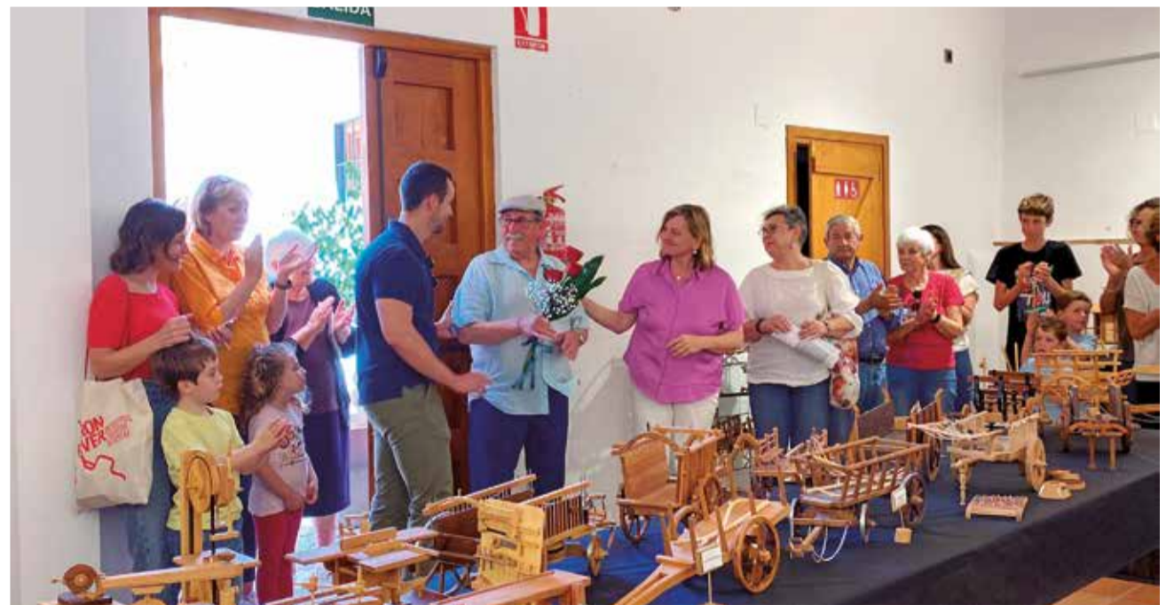
Homenatge a l'artista el dia de l'exposició.

L'exposició inclou més de cent peces, entre les quals es