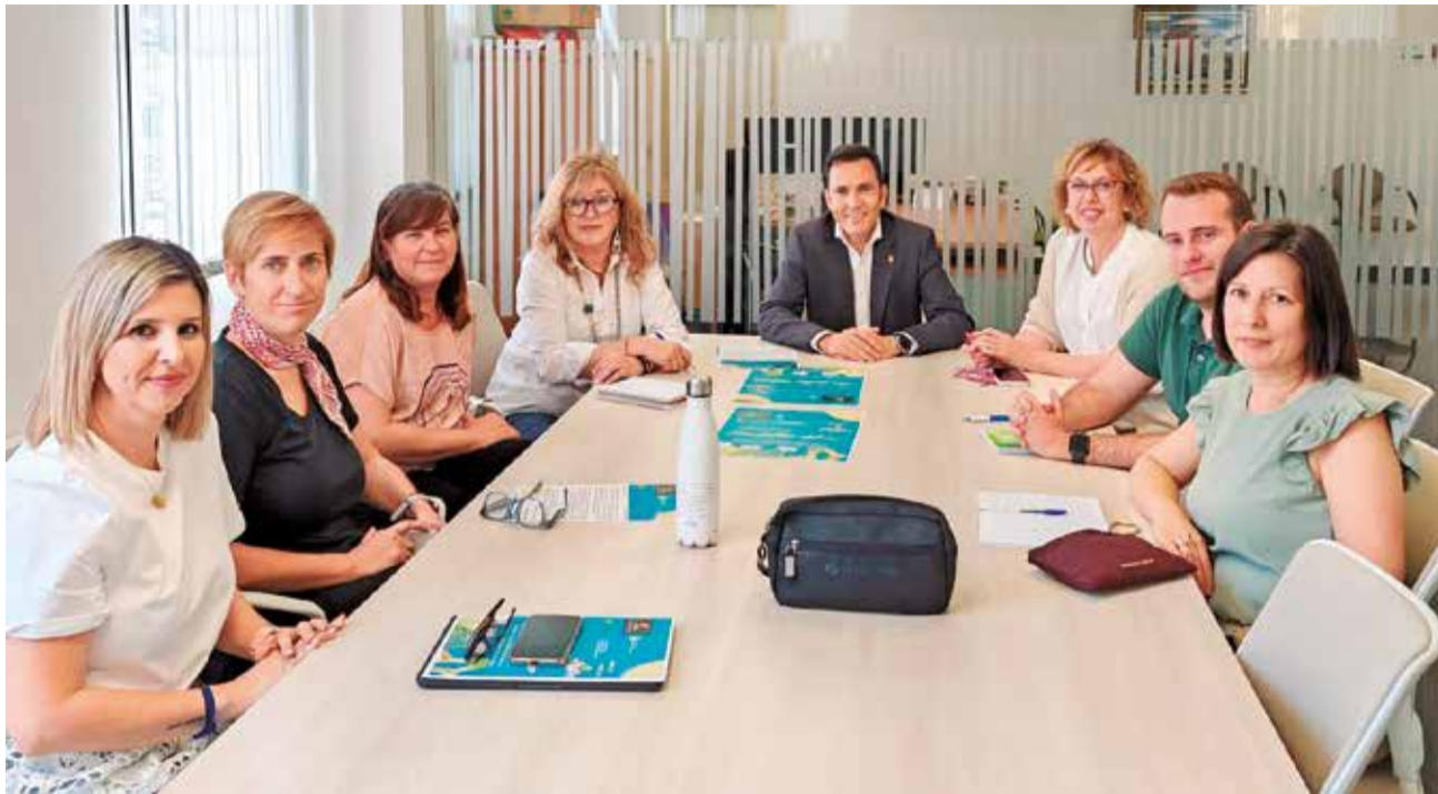
Elaboración de la campaña en el ayuntamiento de Canet d'en Berenguer.