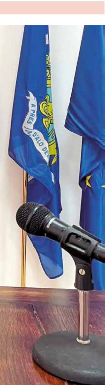
riòdico de Aquí. / EPDA

professores del centre i a les mares i pares de l'associació de representants.