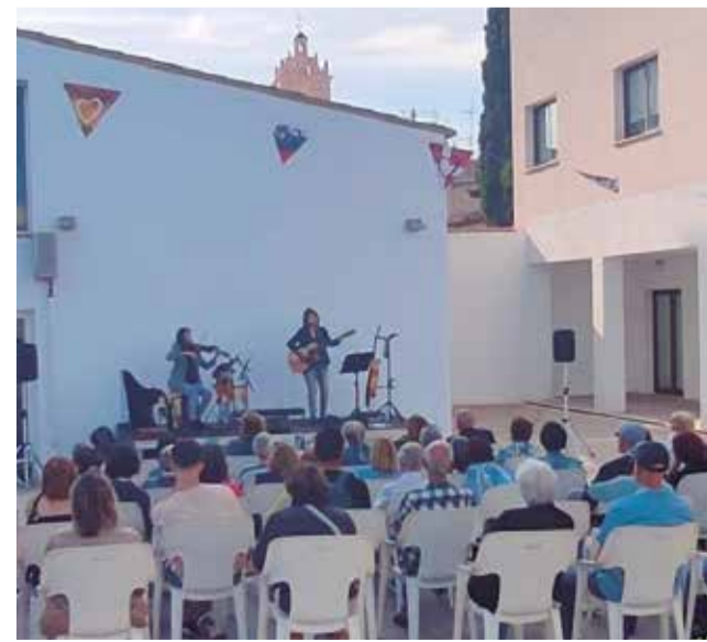
Un instant de l'actuació de la cantautora.