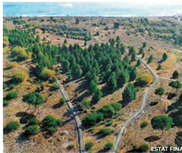
Estado final tras las actuaciones.