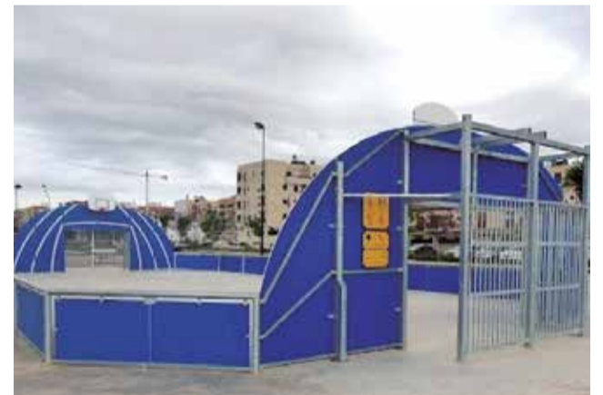
Pista de Quart de Poblet, una propuesta del PP.

Maribel Sáez finaliza: “Una ciudad activa y saludable es una ciudad feliz, está en nuestras manos y hay que ponerse a trabajar para que logremos ser una ciudad lo más sana posible”.