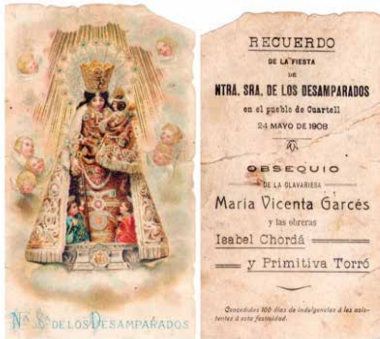
Estampa de la festa celebrada a Quartell el 1908.

El fet que en la comarca trobem altars en les esglésies des del segle xviii confirma que la ciutat de València exercix de capital d'un territori. La imatge erigida eixa centúria en l'hostal de Montalt, dins del terme d'Albalat dels Tarongers, o l'ermita inaugurada a Algímia d'Alfara el 1713 hi fan entendre l'antiga vigència de la devoció mariana. Abans, ja en l'any