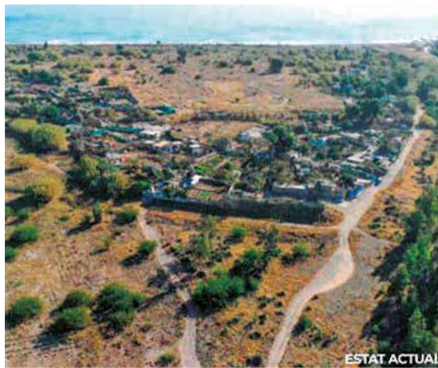
Estado actual del espacio verde.