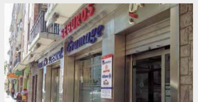
Establecimiento en Puerto de Sagunto.

Av. Camp de Morvedre, 89 Tlf: 96 267 00 00