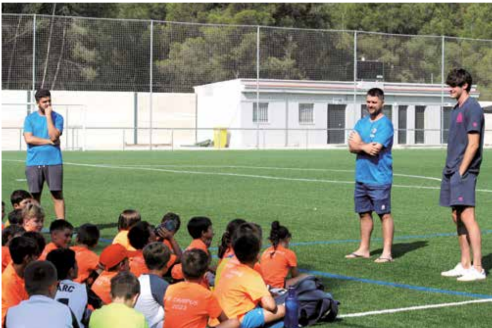
Escoleta d'Estiu de Gilet en l'edició de l'any passat.