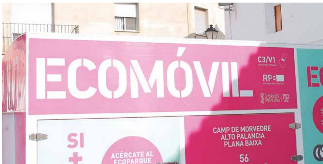
Ecoparques móviles del Consorcio Palancia Belcaire.

ciativa medioambiental Si más reciclas menos pagas, en la que se premia a las personas usuarias y a las actividades que separan en origen los residuos urbanos y cuyo destino es la red consorciada e informatizada de ecoparques del Área de Gestión C3/V1 permitiendo su reutilización, reciclaje y valorización.