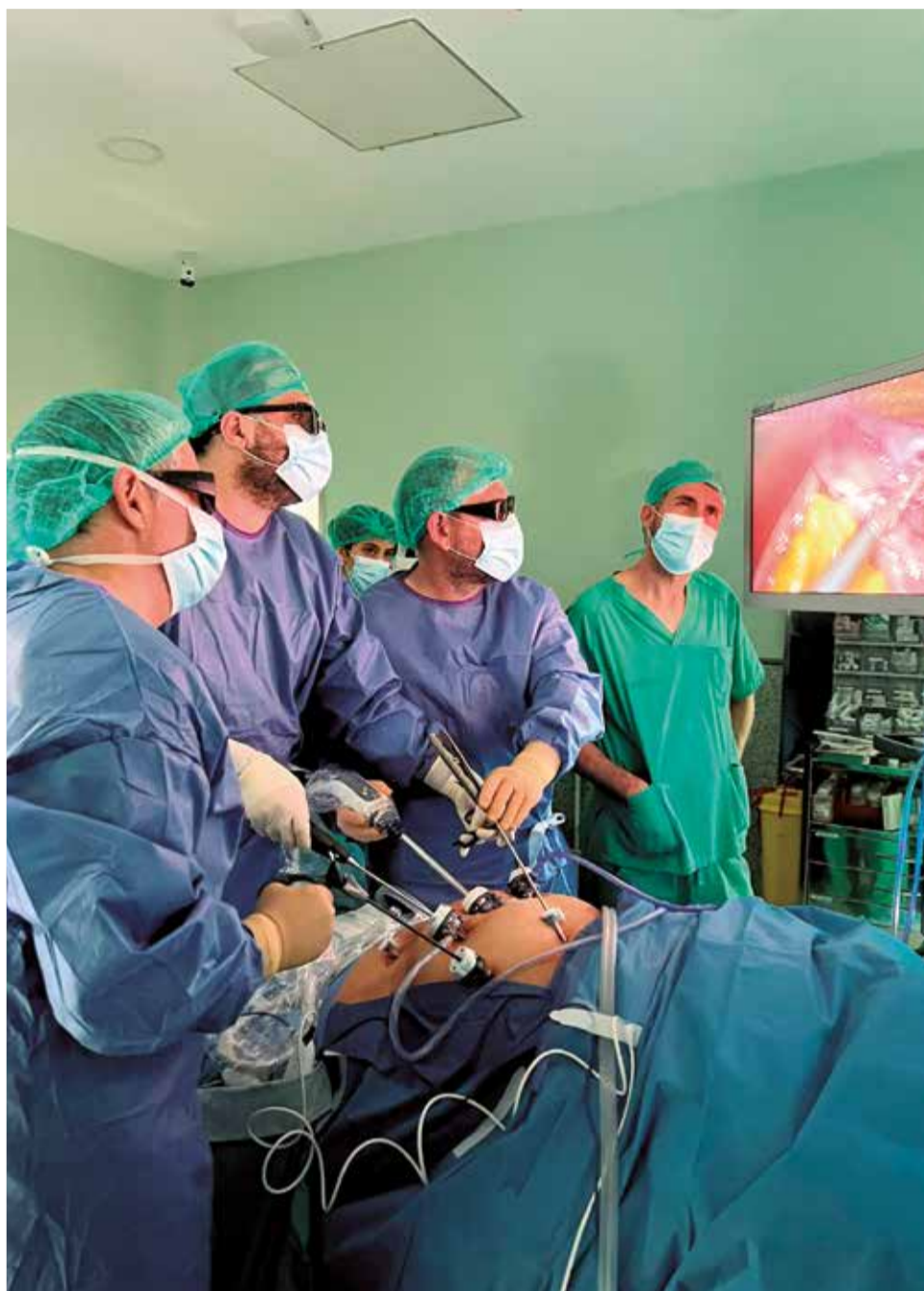
Un instante de la cirugía en el Hospital de Sagunt.

Por último, pero no menos importante, dado que, en el departamento de Sagunto, lamentablemente, no había hasta la fecha una dietista nutricionista, conseguimos que, gracias a la industria farmacéutica y a través de la fundación FISABIO, pudiéramos disponer de una dietista nu-