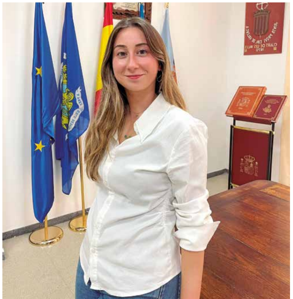
L'alcaldesa després de l'entrevista.

Destacant la situació de sequera que estem patint a tot el món, en concret, al Camp de Morvedre i en especial La Font de Quart, s'està estudiant junt amb la resta de municipis l'aplicació de decisions i mesures per poder conservar l'espai públic i fer front a esta situació tan delicada que estem patint, on tots eixim perjudicats. El camp és altra de les preocupacions de l'actual equip, ja s'han iniciat els treballs de neteja de les séquies públiques i la compra de portes per a poder evitar la pèrdua d'aigua.