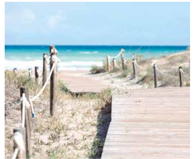
Playa Racó de Mar de Canet d'En Berenguer.

Durante la temporada estival, el Parque de Benicalap es el lugar ideal para refugiarse de las altas temperaturas en la capital del Turia, gracias a su piscina lúdica con toboganes acuáticos