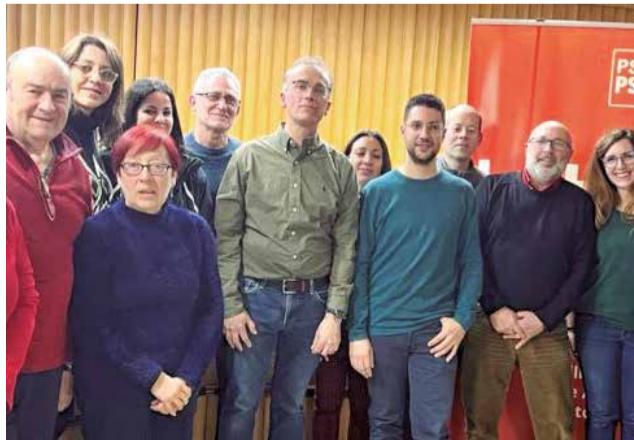
El PSPV-PSOE de Buñol.

Según el PSOE, el objetivo del pleno “no era aprobar el pago de estas facturas, que ya tendrían que estar pagadas pues algunas vienen de hace casi un año, sino anular el reparo de legalidad impuesto por los técnicos municipales a la gestión del gobierno actual”. El partido ha destacado la “ironía” de la situación, recordando que en el pasado, el PP se había opuesto firmemente a levantar reparos similares, “incluso amenazando con acciones legales, lo cual demuestra una falta de coherencia y res-