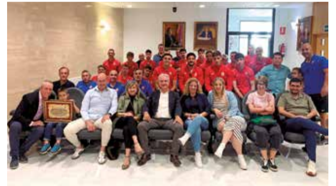
El CD Utiel en el salón de plenos del Ayuntamiento.

Tanto el entrenador como el presidente del CD Utiel, Ja-