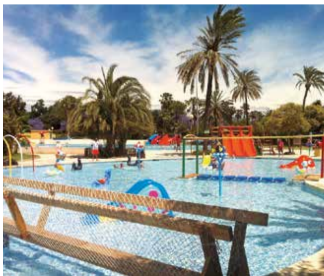
Piscina en el Parque de Benicalap en Valencia.