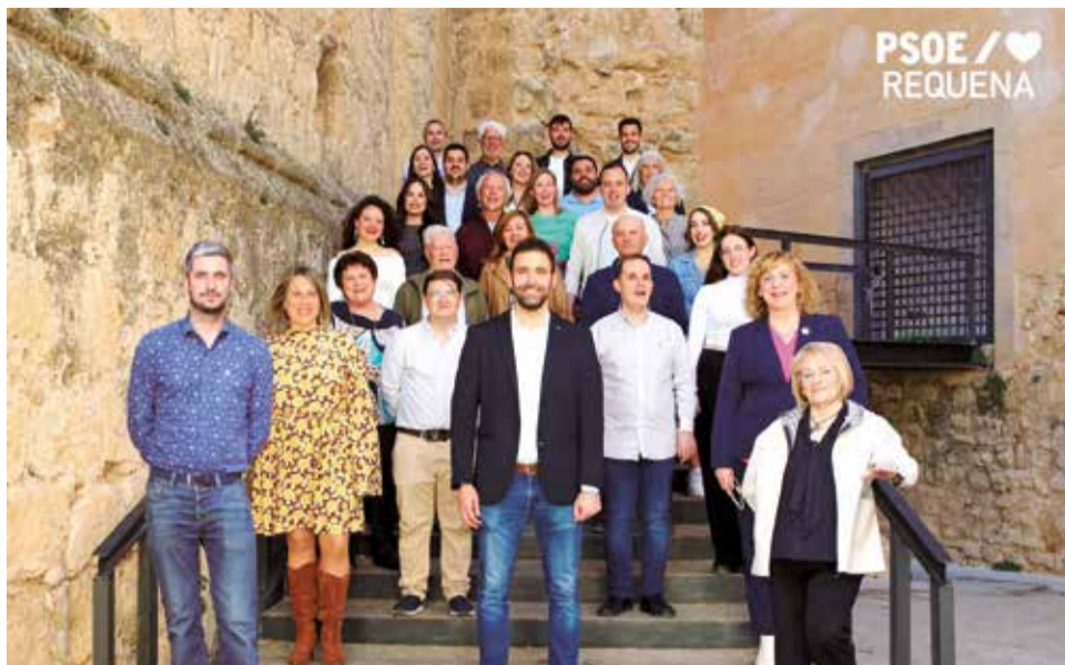
Representantes del PSOE de Requena.

agrario de esta comarca el pasado mes de febrero todos los grupos políticos del Ayuntamiento de Requena aprobaron un manifiesto de apoyo total al sector. En el punto 3 del mismo recalcan la flexibilidad en la burocracia, "cosa que parece que el equipo de gobierno de nuestro