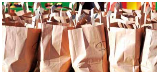
Bolsas de la compra.

lugar donde se realizan las compras. Además, en el marco del Plan de Sostenibilidad Turística en Destino (PSTD) de Tierra Bobal, se han realizado córneres de producto local en establecimientos turísticos para comercios y hostelería de la comarca, que favorecen la visibilidad de producto local e incitan a su