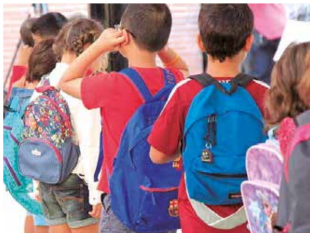
Alumnado de un colegio.

Con el inicio de las vacaciones escolares, muchos padres se enfrentan al desafío de encontrar actividades productivas y enriquecedoras para sus hijos. Las escuelas de verano se