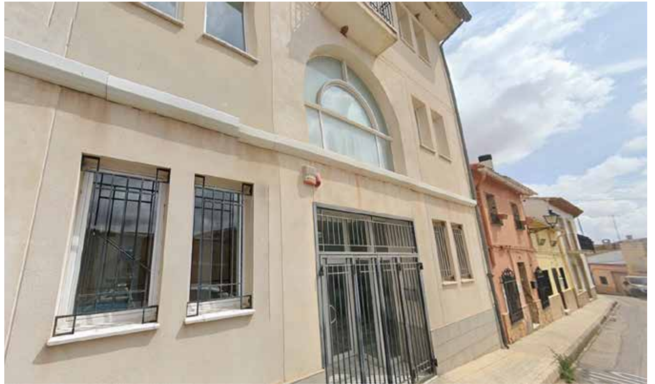
Edificio del conservatorio de música ubicado en la calle Castillo número 24 de Caudete de las Fuentes

El pasado mes de marzo, el Ayuntamiento de Caudete de