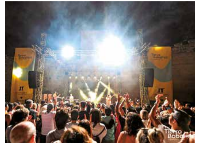
Edición anterior de Tierra Bobal Fest

La Cata Territorios, en la que se presentarán vinos de los territorios que forman