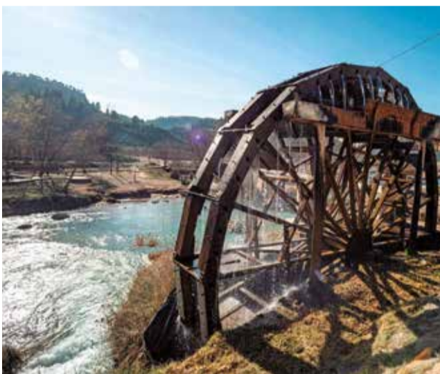
Parque Natural de las Hoces del Cabriel.

nocido por su vegetación y sus paisajes. La Murta, con sus bosques verdes y el histórico Monasterio de los Jerónimos, invita a explorar senderos sombreados y a disfrutar de la tranquilidad que solo la naturaleza puede ofrecer. Sus rutas de senderismo, como la que lleva al Cavall Bernat, ofrecen vistas panorámicas espectaculares y son perfectas para los amantes de la aventura. La Casella, por su parte, es famosa por su fauna y flora diversa, incluyendo la observación de muflones. Sus áreas de descanso y merenderos permiten disfrutar de un picnic al aire libre rodeado de frescura y belleza natural.