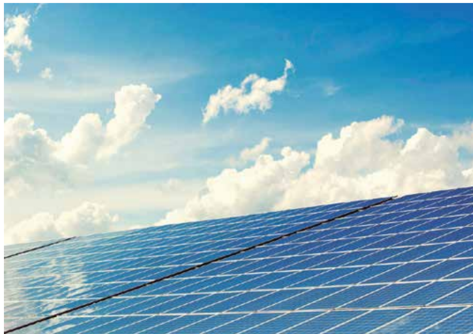
Placas fotovoltaicas.

La acción además, pretende servir de referencia a iniciativas similares que puedan ser emprendidas por colectivos, empresas o particulares del municipio, dando forma, de este modo, a un nuevo modelo de autoconsumo que permita reducir considerablemente, tanto