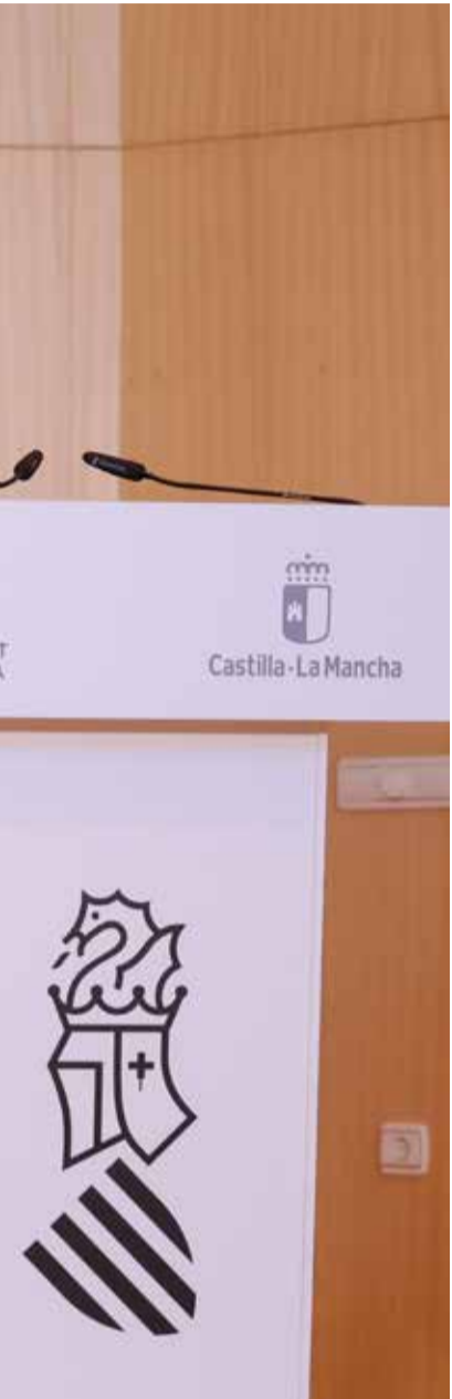
idades autónomas. / EPDA