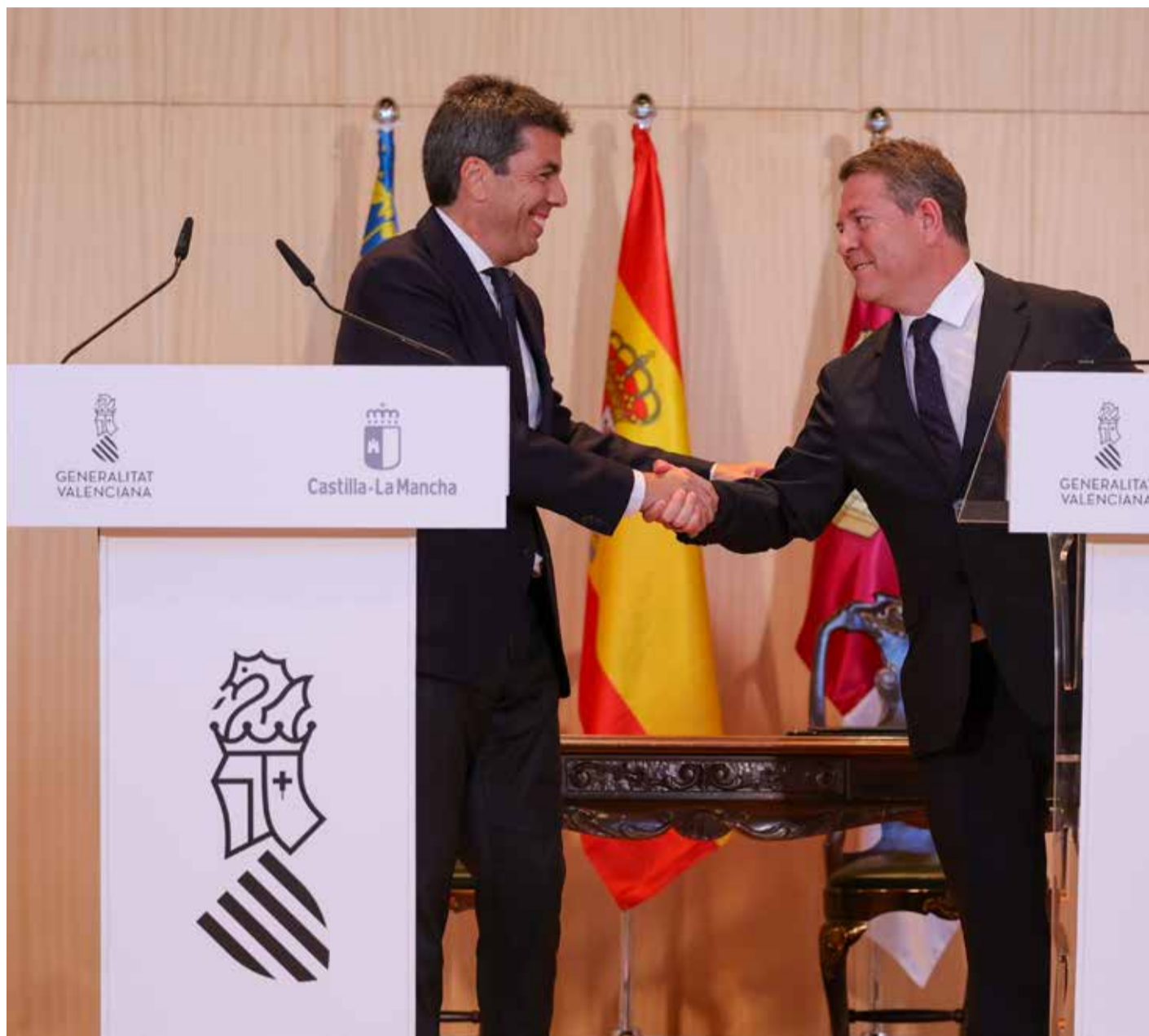
Carlos Mazón y Emiliano García-Page, presidente de Castilla-La Mancha, estrechan lazos sanitarios para ambas comunidades.

Durante su discurso, el president también ha asegurado que para avanzar en esta equidad y solidaridad sanitaria es necesario una reforma urgente del sistema de financiación "para tener las mismas herramientas y condiciones que nos permita garantizar los servicios públicos de nuestros ciudadanos".