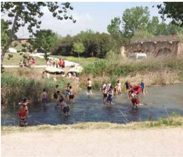
Área recreativa l'Explanada en Riba-roja.

naturales como la Fuente de Sant Lluís o el azud del Pantano. La vegetación te acompaña en todo el recorrido, y hay momentos en los que semeja un túnel donde bajan considerablemente los grados de la temperatura.