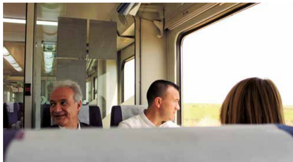
Los tres representantes políticos populares durante el trayecto. / LAURA FLORENTINO