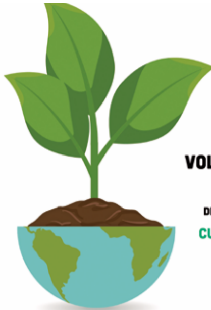
Cartel del voluntariado ambiental de Ayora.

Si estás interesado o interesada, por favor, descarga aquí la ficha de solicitud y entrégala rellena en el Ayun-