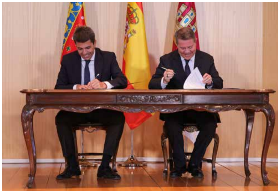
Mazón y García-Page firmando el acuerdo.

Finalmente, ha trasladado su agradecimiento a todo el personal sanitario "por su esfuerzo y complicidad para atender a las personas" y ha señalado su compromiso "para ofrecer las mejores herramientas y reconocimientos para prestar adecuada-