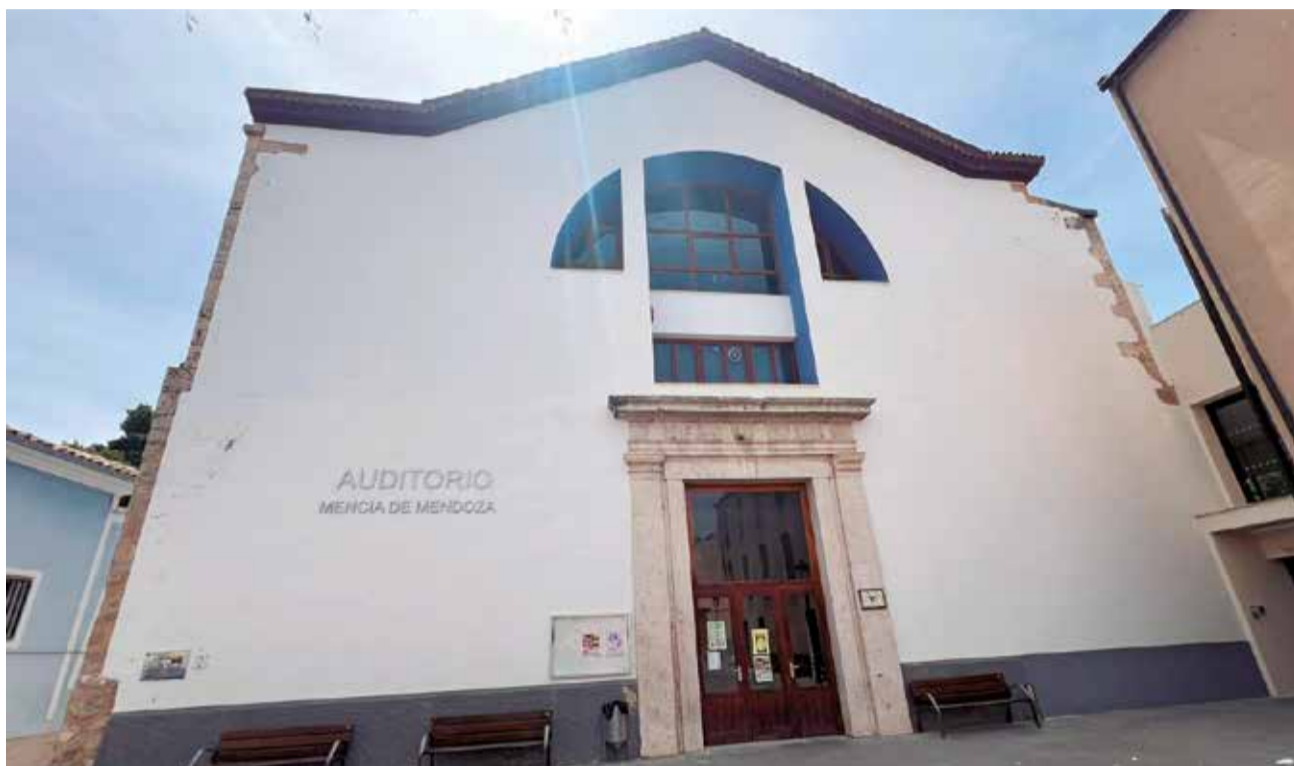
Auditorio Municipal Mencía de Mendoza de Ayora. / EPDA

En la categoría Empresas a GH Arquitectos. En Medio Ambiente a la Junta Central de Usuarios de la Masa de Agua Subterránea Requena Utiel (JCUMARU). Dentro de Gastronomía la Muestra del Embutido Artesano y de Calidad de Requena recibirá la estatuilla por poner en valor la gastronomía local con esta feria que este año ha cumplido su XXIX edición. En la categoría Turismo se le otorgará el galardón al Ayuntamiento de Chera por la recuperación de la Escalereta del Tío Eliseo y el Castillo de Chera. En Sanidad a la Generalitat Valenciana y al gobierno de Castilla-La Mancha por el acuerdo sanitario impulsado por ambas comunidades autónomas. En Bienestar Social al Aula Respiro Cheste, un proyecto impulsado por