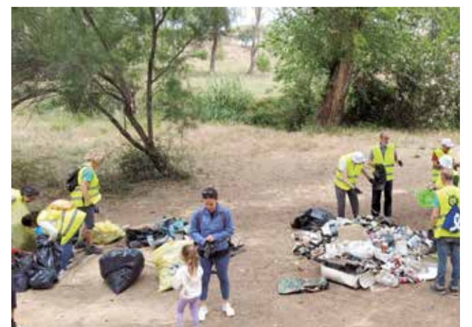
Diferentes momentos durante la jornada de concienciación en Godelleta.