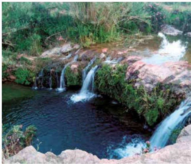
Charca del Carraixet en Moncada.

y la limpieza de la playa son prioritarias. Es, por cierto, una de las únicas playas habilitadas con todos los servicios para personas con movilidad reducida. Además de su belleza, este destino destaca por la amplia gama de actividades que el Ayuntamiento ofrece para enriquecer la estancia de los visitantes. Propuestas deportivas al aire libre, cine nocturno en la arena, talleres culturales, eventos festivos para animar las noches de verano o 'foodtrucks' son algunas de las propuestas. Y no sólo eso. Canet cuenta con una excelente infraestructura turística, con hoteles y restaurantes de alta calidad y para todos los gustos y bolsillos.