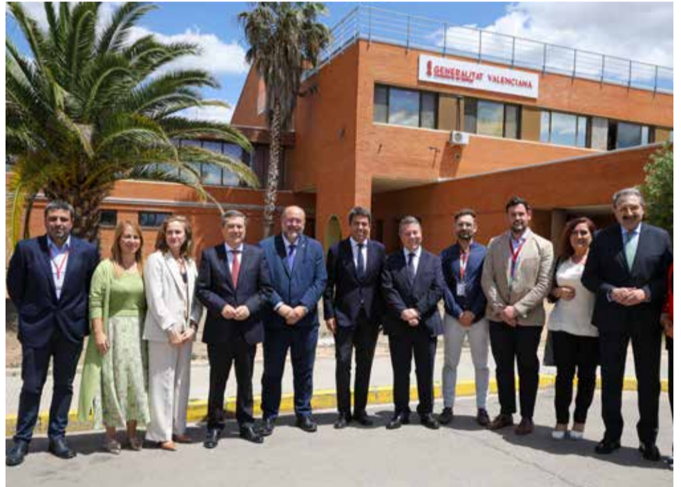
Representantes de la Generalitat en el Hospital de Requena.

pacios para potenciar la innovación en las políticas sanitarias públicas. A través de este compromiso, la Comunitat Valenciana y Castilla-La Mancha facilitarán la