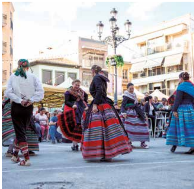
Diferentes instantáneas durante la feria Vinachest.