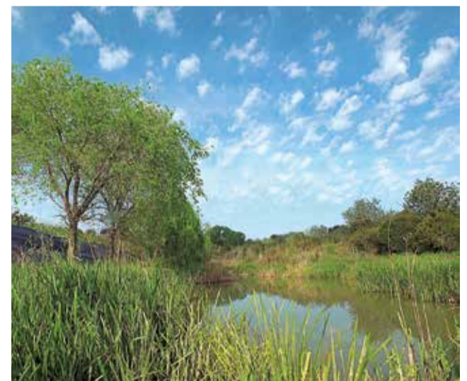
Clot del Bailén de Torrent.