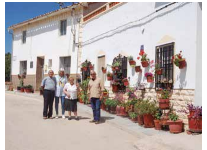
Algunos de los participantes del concurso de Venta del Moro.