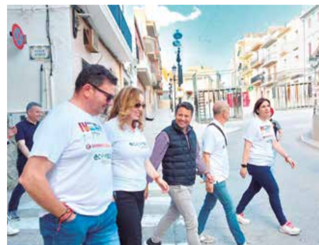
Diversos momentos durante el festejo de la IV Feria del Toro de Cuerda.