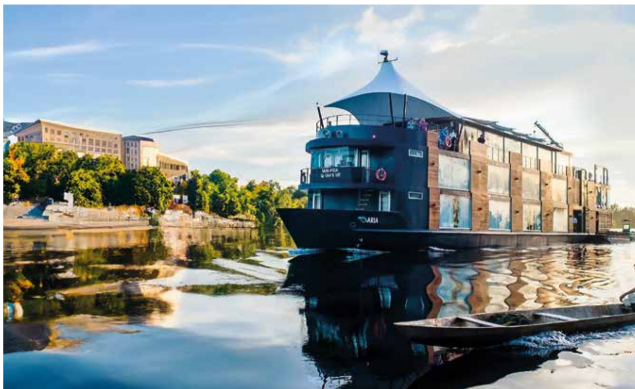
Rutes exòtiques a bord.

Hem observat diverses tendències interessants este 2024. Els creuers de luxe, per exemple, ofereixen serveis exclusius i d'alta gamma, com suites espaioses i gastronomia de primera classe. Els creuers d'aventura es centren en destinacions