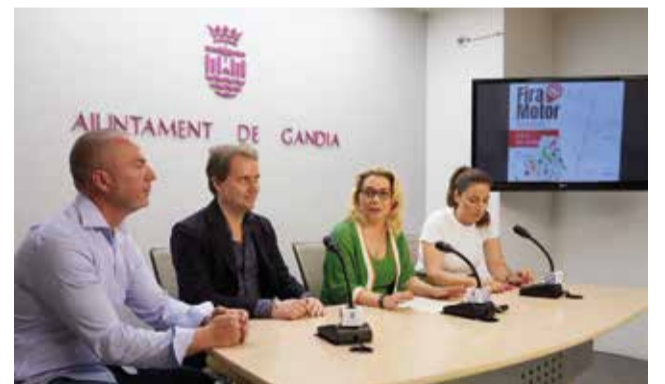
Roda de premsa Fira del Motor.