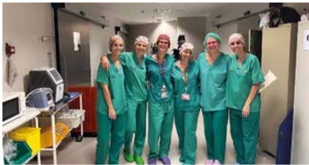
L'equip encarregat de les intervencions.

En concret, l'implant mamari definitiu es col·loca per davant del múscul pectoral major i per davall del teixit subcutani sense que hi haja manipulació muscular, de manera que es reduïxen les molèsties postoperatòries i les possibles deformitats en la mama reconstruïda.