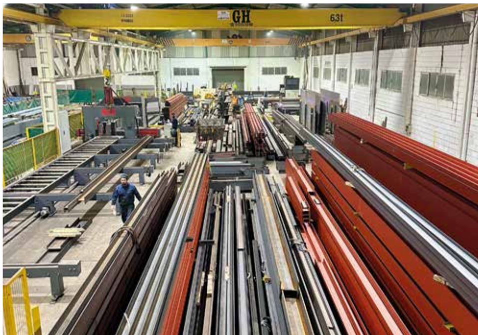
Inстал·lacions Turmetal. / TURMETAL

► I com veus la digitalització hui en dia? Sobretot ací a la comarca, on hi ha hagut moltes ajudes, especialment del Kit Digital. Veus el sector de la comarca preparat per a la digitalització que està arribant o queda molt lluny? Parlem de