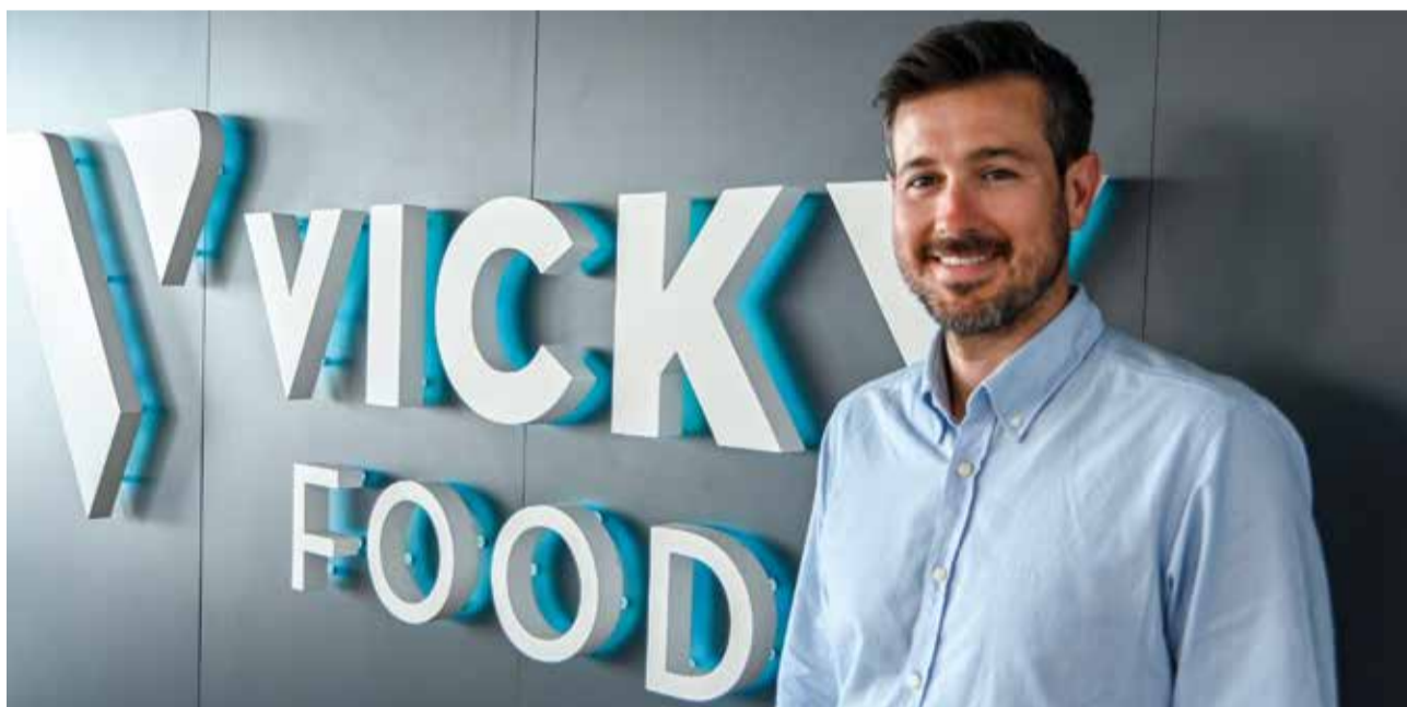
Instal·lacions Vicky Foods.

i de voltants que treballa ací amb nosaltres, però no només ells, sinó també els seus familiars. De fet, en el meu departament hi ha casos de treballar amb diversos membres de la mateixa família, i no sempre és bonic. Discutim molt, sobretot amb el meu pare. A més, hi ha treballadors que coneixes des de la infància. Aquest és un poc l'ambient, tant per a mi com per a molts treballadors que tenen el seu grup d'amics també dins l'empresa. Hi ha bon rotllo i mals rotllos, com en tota família. És una cultura molt familiar i, al ser gent que coneixes, el tracte no pot ser com el d'una multinacional que et veu quasi com un número; són persones que coneixes i, moltes vegades, també coneixes la seua família.