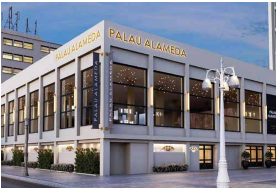
Instal·lacions Palau Alameda en València.

ductor i estar molt present també en l'edifici, i per això vam fer Àtic, un restaurant amb vistes a l'Albereda on els capvespres són màgics, ja que el sol es pon darrere de l'skyline' de la ciutat i projectem el nostre famós "tardeo" perquè els nostres clients el gaudisquen.