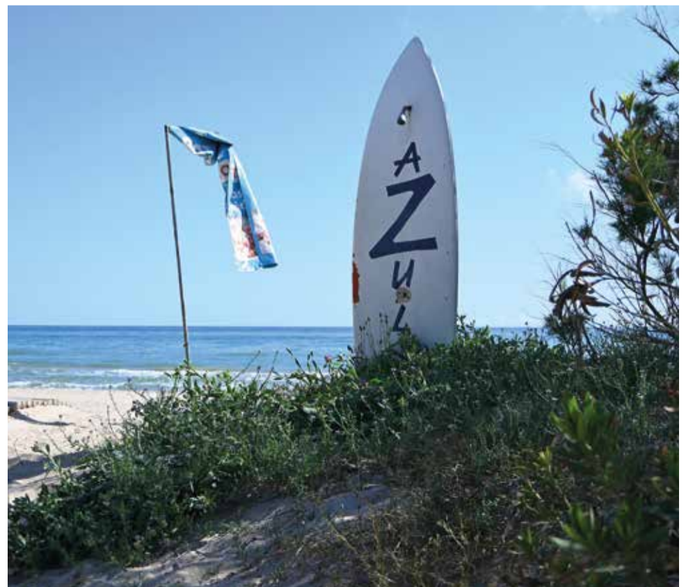
La bandera blava oneja a la platja d'Oliva.

Amb aquesta nova bandera blava, Oliva reforça el seu compromís amb el turisme sostenible i de qualitat, promocionant un entorn segur i agradable per a tots els que trien aquest racó de la Safor per a les seues vacances.