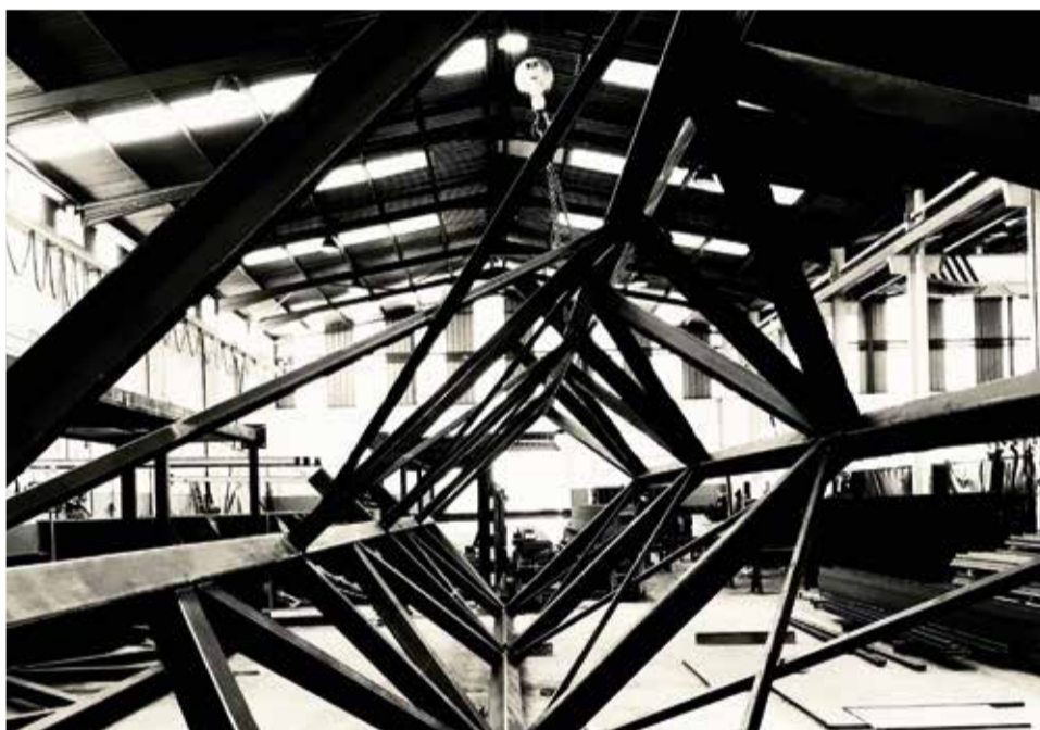
Estructura metàl·lica de Turmetal.