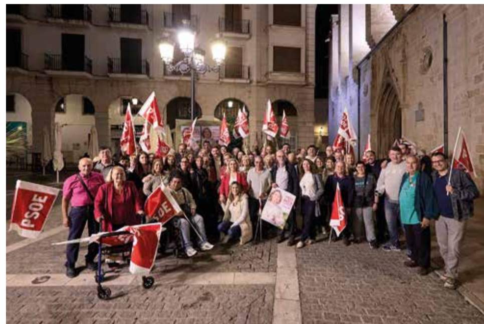
Els Socialistes de Gandia. / PSPV-PSOE

Al mateix temps, va afirmar que “en estes eleccions ens juguem que els ultres no siguen