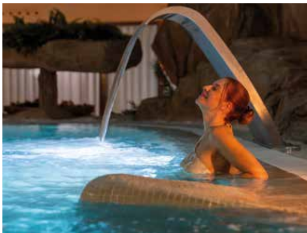
Moments de relaxació. / OLIVA NOVA

A continuació, serà molt gratificant acudir a la zona de termes composta per saunes finlandeses, banys turcs i diferents tipus de dutxa que fomenten la sudoració, dilaten els vasos capil·lars i eliminen les toxines del nostre cos.