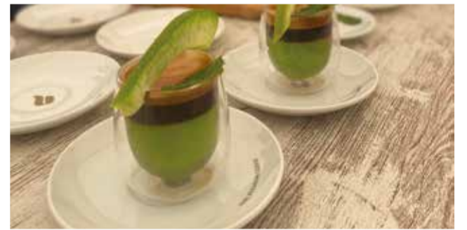
El diferets cremaets.

gastronomia valenciana i cultura des de la Generalitat. Finalment, el president de la Diputació de València, Vicent Mompó, va explicar que «és una oportunitat per promocionar el millor de la nostra terra i demostrar que la província de València brilla en qualsevol època de l'any perquè a part d'unes platges espectaculars, que també, tenim una rica i diversa gastronomia, tradició i cultura, entre altres meravelles».