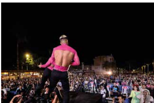
El públic disfrutant de la gala.