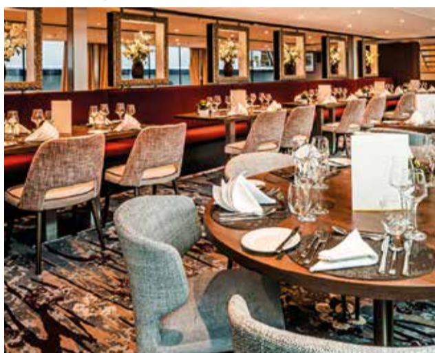
Servei de restaurant. / RC VIAJES

exòtiques i experiències úniques, com l'exploració de l'Antàrtida o les Galápagos. Els creuers fluvials, que naveguen per rius importants com el Danubi i el Rin, ofereixen una perspectiva més íntima i cultural. D'altra banda, els creuers familiars estan dissenyats per a satisfer les necessitats de les famílies, amb activitats per a totes les edats.