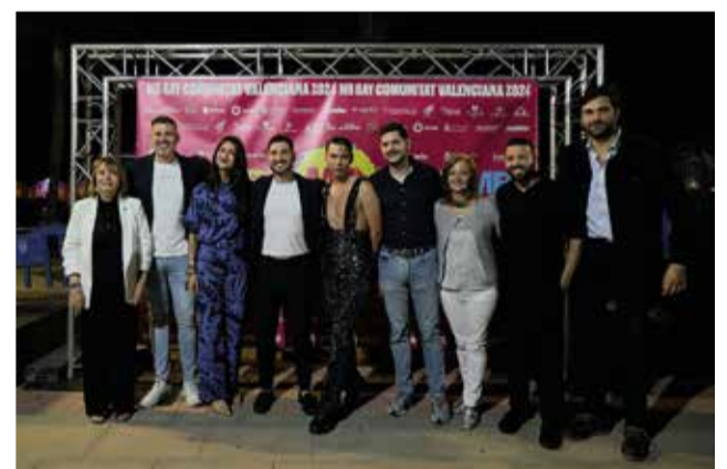
'Photocall' de la Gala Mr. Gay.

A més, els assistents van tenir l'oportunitat de conèixer millor la cultura i l'oferta turística de Gandia, incloent els seus llocs històrics, platges i gastronomia, reforçant així el posicionament de Gandia com a destinació turística de referència per a la comunitat LGBTIQ+.