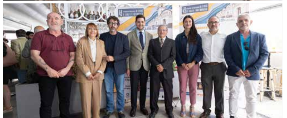
'Photocall' de la roda de premsa. / ÀLEX OLTRA