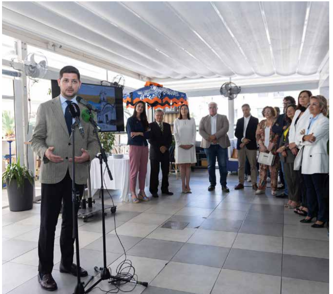
Presentació de la 49 edició del Concurs Internacional de Fideuà i Gastronomia.

"El millor ha de vindre, perquè tenim els mimbres, tenim l'enorme responsabilitat d'escollir la millor fideuà del món i aquesta no és una responsabilitat qualsevol, per això busquem un jurat a l'altura de les circumstàncies, capaç d'escollir entre aquests 30 participants la millor fideuà del món". "Aquest esforç l'hem de compensar amb un turisme a l'altura, aquest any estrem una fantàstica ubicació, l'Espai Baladre de la