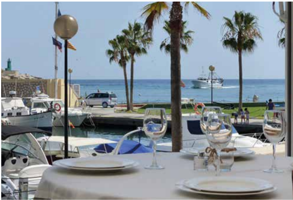
El restaurant El Hogar del Pescador en el Grau de Gandia.

Les persones que vull en el meu equip han de tindre actitud i ganes de créixer com a premissa principal, han de saber treballar en equip i generar un bon clima laboral, estant a l'altura del que l'empresa necessita”