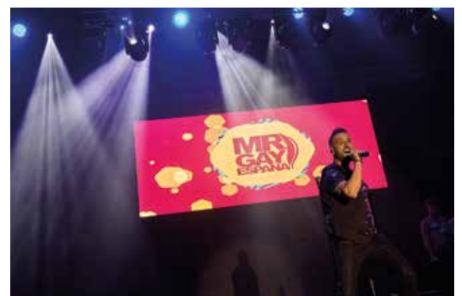
Espectacles de la gala.