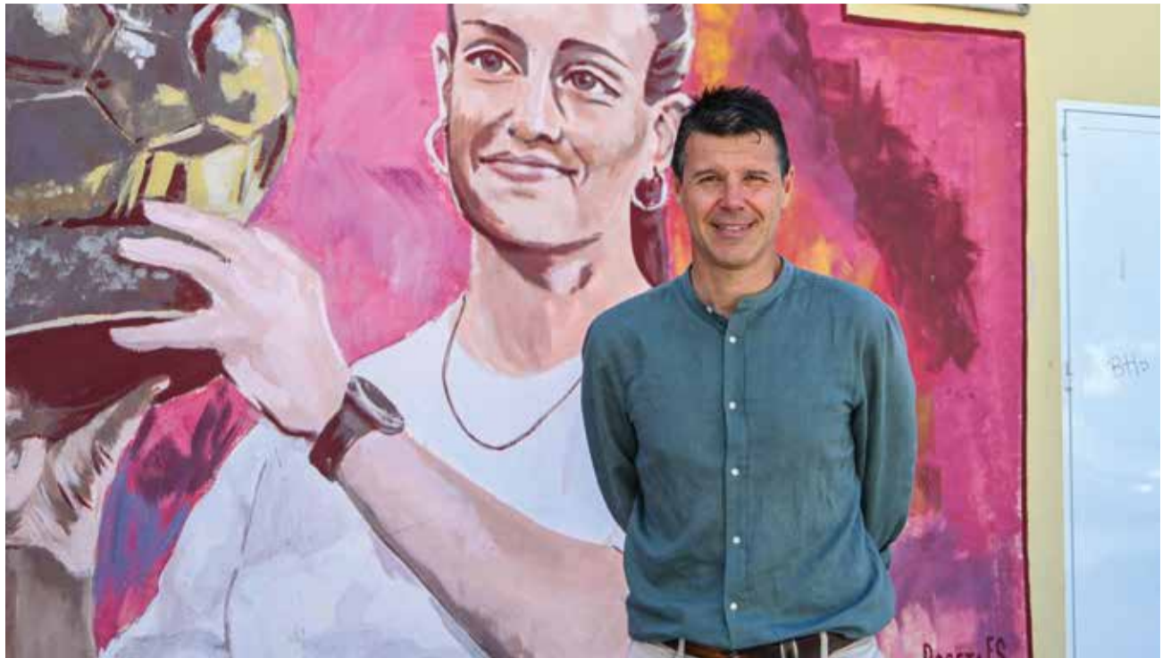
Mural en homenatge a l'esport femení.

► Aquesta és la millor manera de demostrar que alguna cosa s'està fent bé, està clar que no solament és mèrit d'aquest Govern, i que alguna cosa tindran que veure també els bons professionals que tenim, excel·lents entrenadors i entrenadores, clubs que estan treballant molt bé i per descomptat els/es esportistes que s'esforcen cada vegada més per aconseguir resultats òptims. Pràcticament totes les setmanes l'alcalde rep a algun/a esportista de Gandia per a felicitar-lo per la marca o resultat aconseguit en alguna de les proves en què ha participat. Com a persona d'equip que em con-