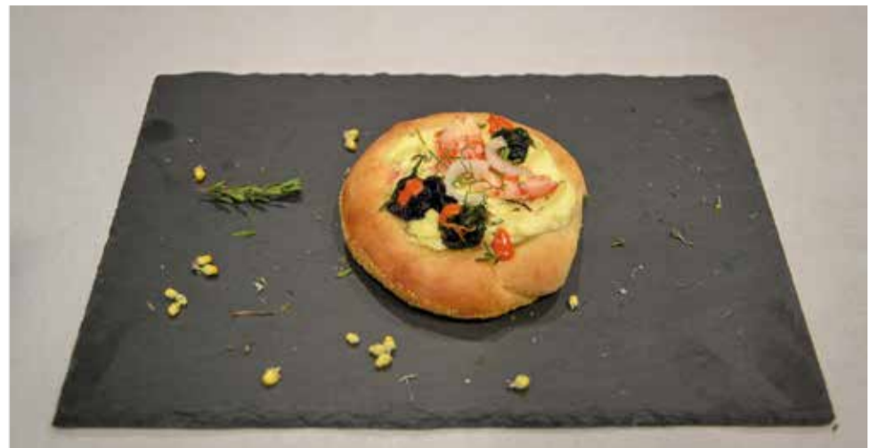
Coca guayadora del 'V Concurs Nacional de Coca Ciutat d'Oliva'.

El jurat, compost per distingides personalitats del món gastronòmic, entre ells xefs guardonats i experts en crítica culinària, va avaluar