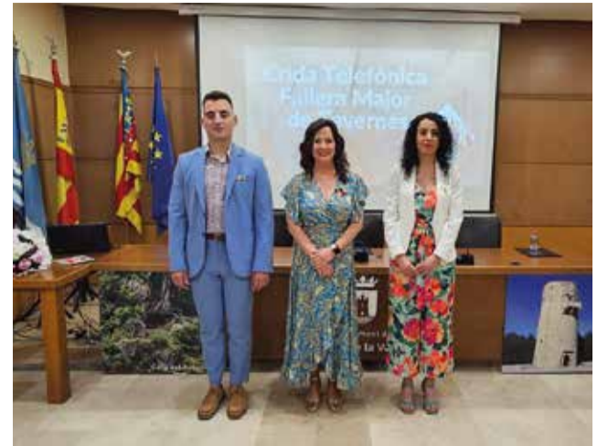
Proclamació de Fallera Major.