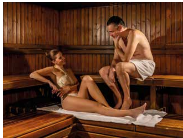
Saunes per disfrutar d'Oliva Nova.