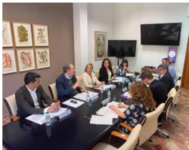
Reunió a l'Ajuntament de Gandia.

Finalment, s'ha pactat, a proposta de l'Ajuntament de Gandia, una taula a tres amb el Ministeri per a tractar l'enllaç amb l'AP-7.