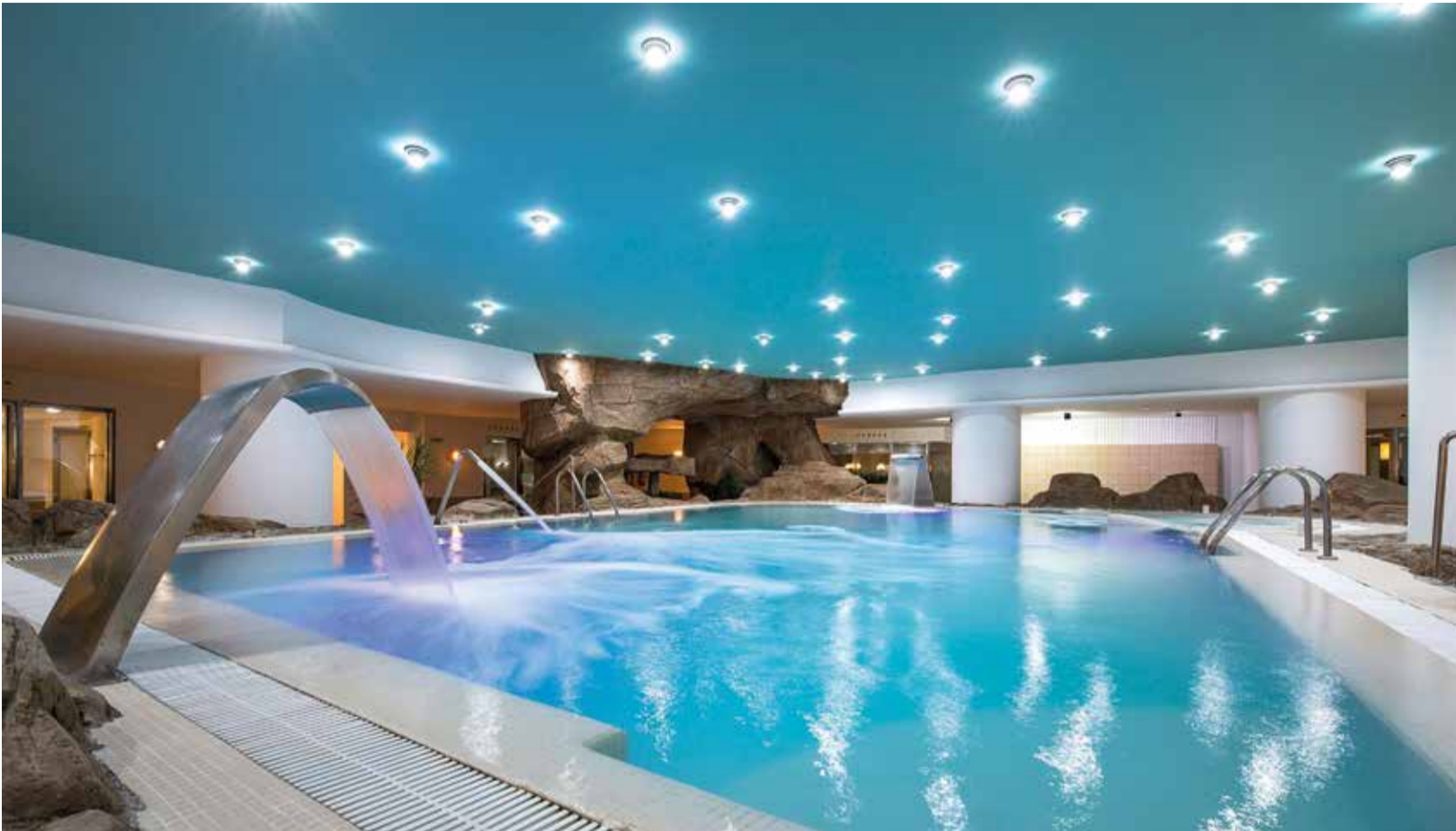
Circuit spa d'Oliva Nova Wellness Spa. / OLIVA NOVA