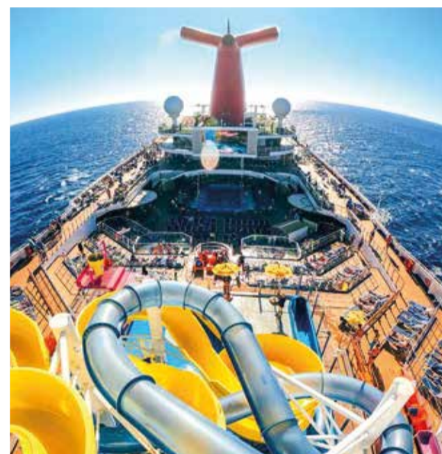
Parc d'aigua dins del creuer.

creuers que poden proporcionar recomanacions personalitzades basades en les teues preferències i necessitats. Tenim accés a ofertes i descomptes exclusius que no estan disponibles al públic en general, el que et permet estalviar diners en la teua reserva. A més, oferim assistència integral des de la planificació del viatge fins al retorn, incloent reserves, vols, trasllats, assegurances i atenció al client. Reservar amb RC Viajes t'ofereix la tranquil·litat