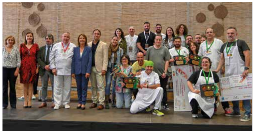
Entrega de premis.

minuciosament cada creació, destacant la qualitat i originalitat de les propostes presentades.