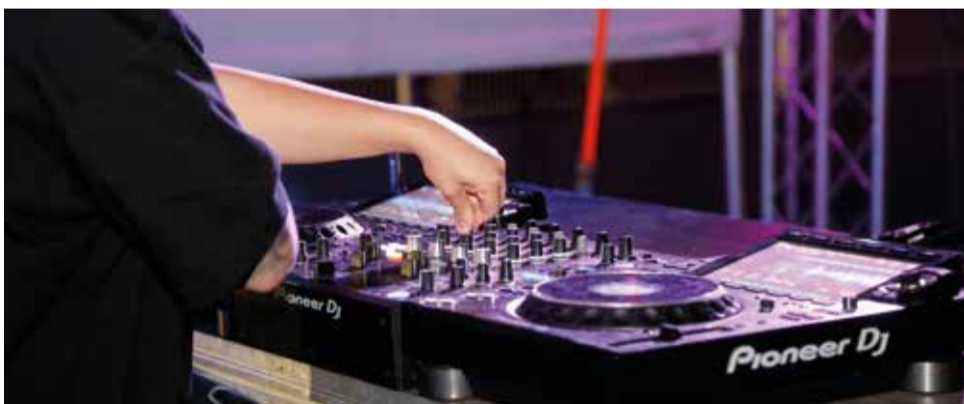
Espectacles de l'edició del Festillop 2023.