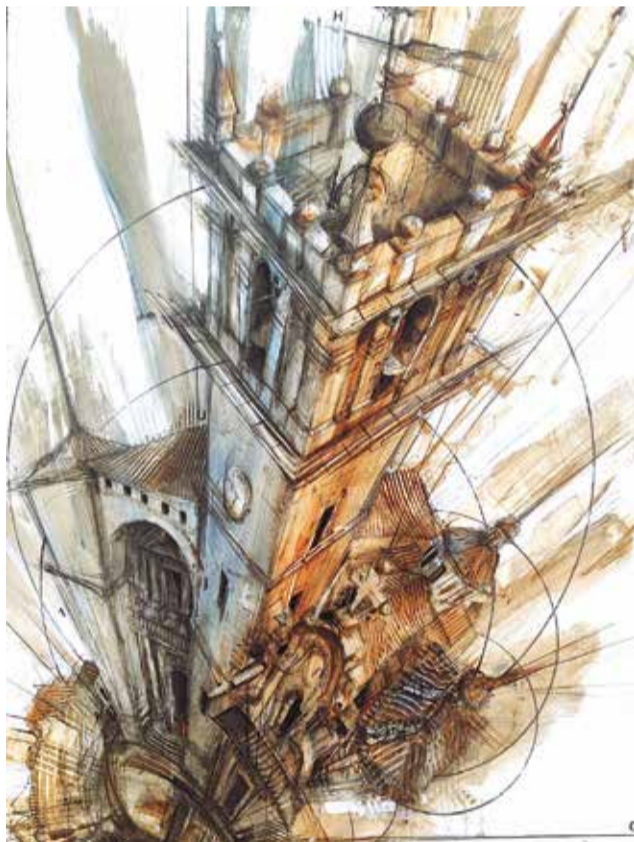
Tercer premio.

La entrega de premios tuvo lugar en el claustro de la Casa de la Cultura de Ayora donde se expusieron todas las obras en un espacio abierto al público