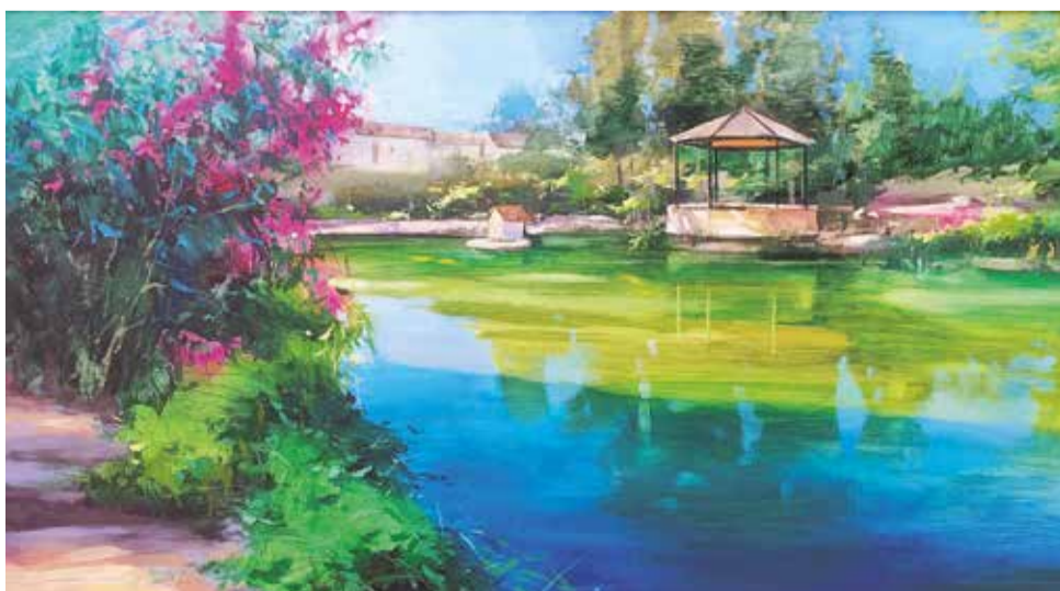
Cuarto premio.