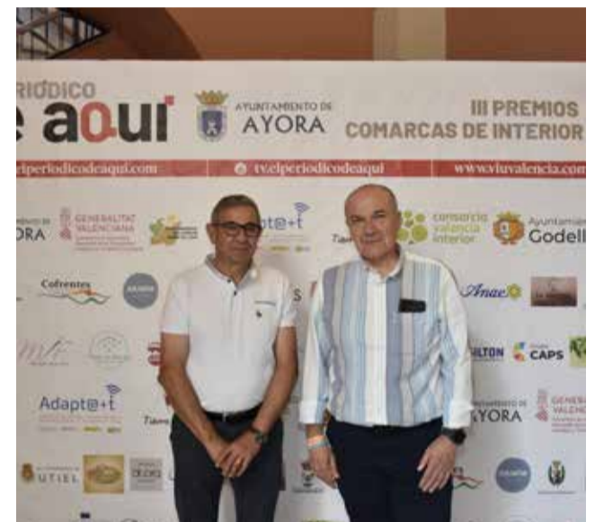
Instantáneas de algunos de los asistentes a la tercera edición de los premios de comarcas de interior celebrados en el Auditorio Municipal de Ayora.