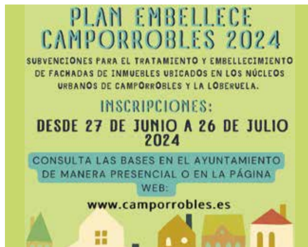
Cartel del plan 'Embellece Camporrobles'.

Las condiciones son: el inmueble deberá estar ubicado en el casco urbano de los núcleos urbanos de Camporrobles o de La Loberuela; El edificio debe contar con los requisitos legales de uso y no debe estar en situación de fuera de ordenación; las fachadas intervenidas deben dar a vía pública; se pueden incluir las paredes mediane-