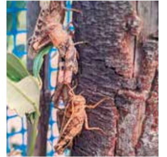
Saltamontes en Requena.

Según ha destacado en un comunicado, la inédita presencia de estos insectos está causando ya importantes daños en los cultivos de la zona, especialmente viñedos (uva para elaboración de vino y