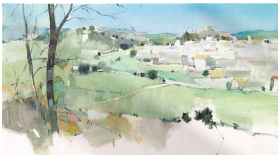
Quinto premio.