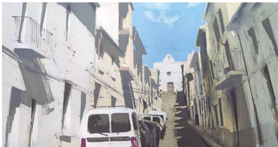
Primer premio. / EPDA

La técnica para realizar las obras era libre, y también fueron admitidos todos los procedimientos pictóricos, así como tendencias y corrientes estéticas o abstractas (salvo reproducciones por ordenador o similares). La temática era Ayora, su casco urbano, su entorno o sus gentes. El jurado estuvo compuesto por personas relacionadas con el mundo del arte y la pintura, así como algún representante del consistorio de Ayora.