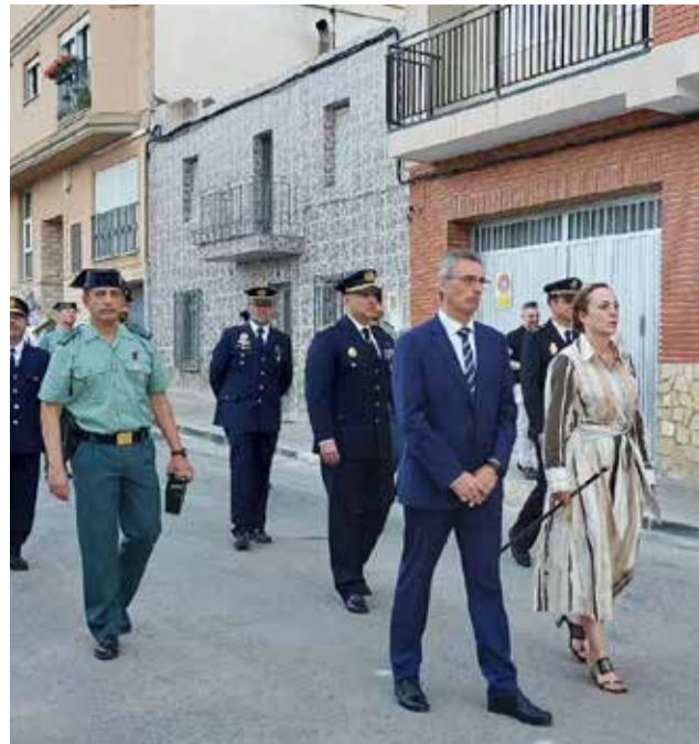
Algunos momentos durante la festividad en honor a San Pedro Apóstol en Godelleta.