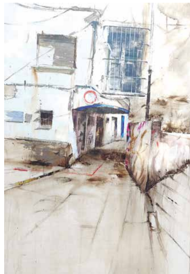
Segundo premio.