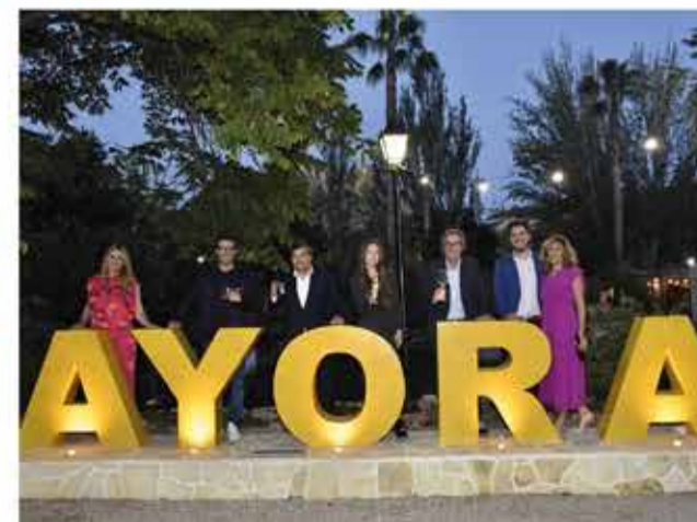
Instantáneas de algunos de los asistentes a la tercera edición de los premios de comarcas de interior celebrados en Ayora.