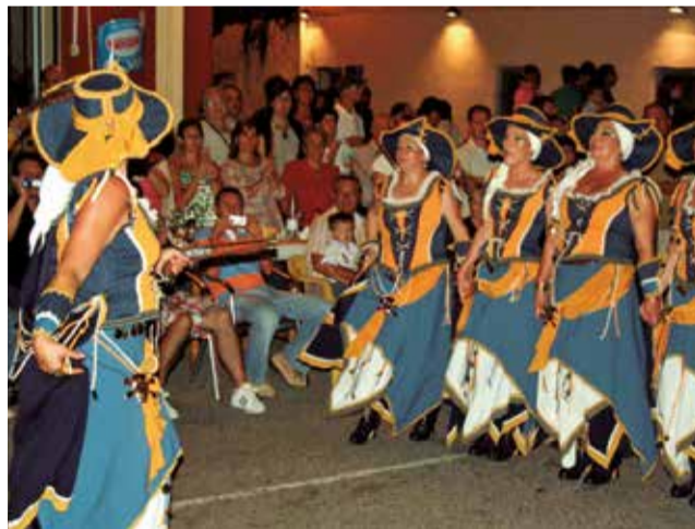
Foto archivo de las fiestas de Chera.

El sábado 3 de agosto el musical 'Barbiaventura' animará y llenará de música y color el municipio. Además, también habrá una disco-