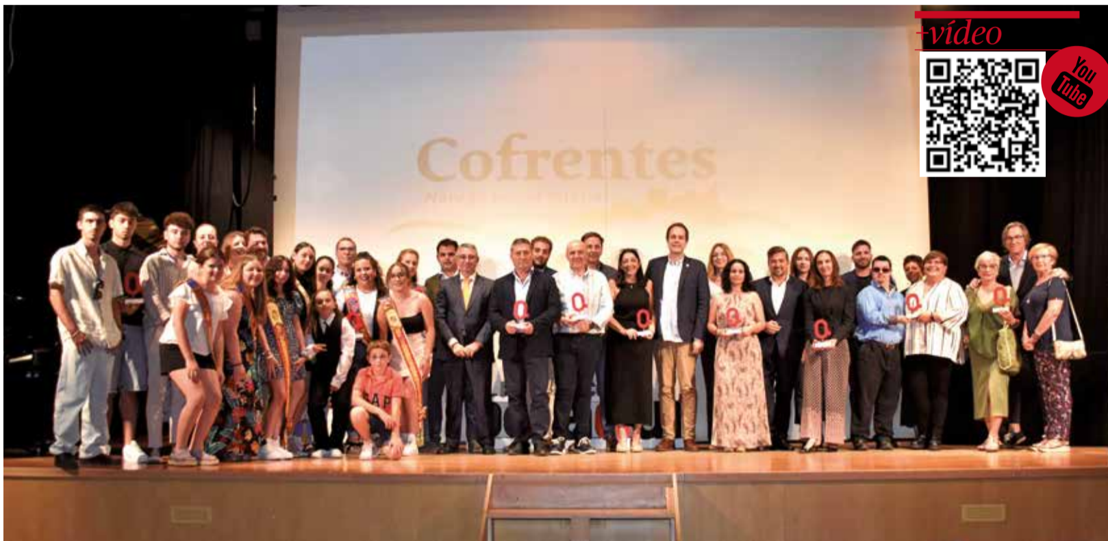
Instantánea de todos los premiados después de la gala en el Auditorio Mencía de Mendoza de Ayora.

LA EOI DE UTIEL, GH2 ARQUITECTOS O EL AULA RESPIRO DE CHESTE FUERON ALGUNOS DE LOS PREMIADOS DE ESTA EDICIÓN