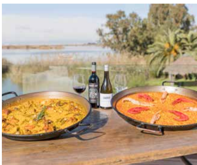
El arroz es el ingrediente estrella.

gambas en escabeche también, la cazuela de bogavante y huevos o las vieiras rellenas, son algunos de los entrantes que podemos encontrar. Sus pescados, siempre frescos y de la mejor calidad. Puedes encontrarlo en C/ Valencia, 5 (dentro de la piscina municipal de Cofrentes). O hacer tus reservas en el teléfono 628 12 50 21. Visita su web www.lapiscinarestaurantecofrentes.com .