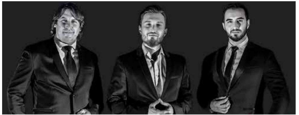
Tributo a 'Il Divo' en Cheste.

julio. Además, el 27 de julio, tendrá lugar una fiesta de almuerzos, organizada por los Clavarios 2025.