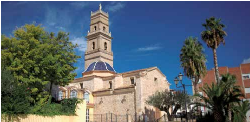
Caudete de las Fuentes.

En un mundo cada vez más consciente de la importancia de la sostenibilidad, la gestión de residuos se ha convertido en un pilar fundamental para la preservación del medio ambiente y la salud pública. Así pues, el Ayuntamiento de Caudete de las Fuentes ha recibido una subvención del Área de Medio Ambiente de la Diputación de Valencia para la implantación de actuaciones contenidas en su Plan Local de Gestión de Residuos, por importe de 29.513,11€ (Boletín oficial de la Provincia de Valencia nº15, de 22 de enero de 2024). Esta subvención financiará la adquisición de papeleras de reciclaje selectivo para la vía pública y la adquisición