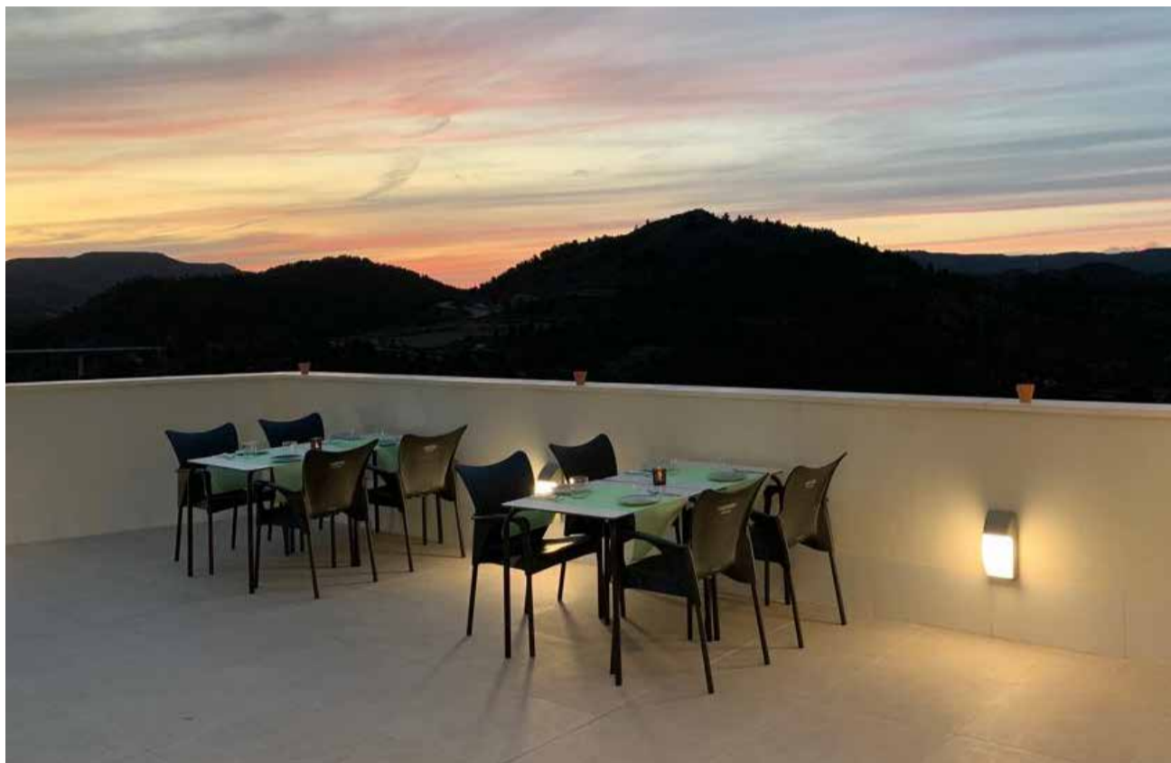
Terraza con vistas a la montaña en Cofrentes.

Un lugar único que fusiona la riqueza y los productos naturales y tradicionales con la creatividad de platos de la nueva cocina.