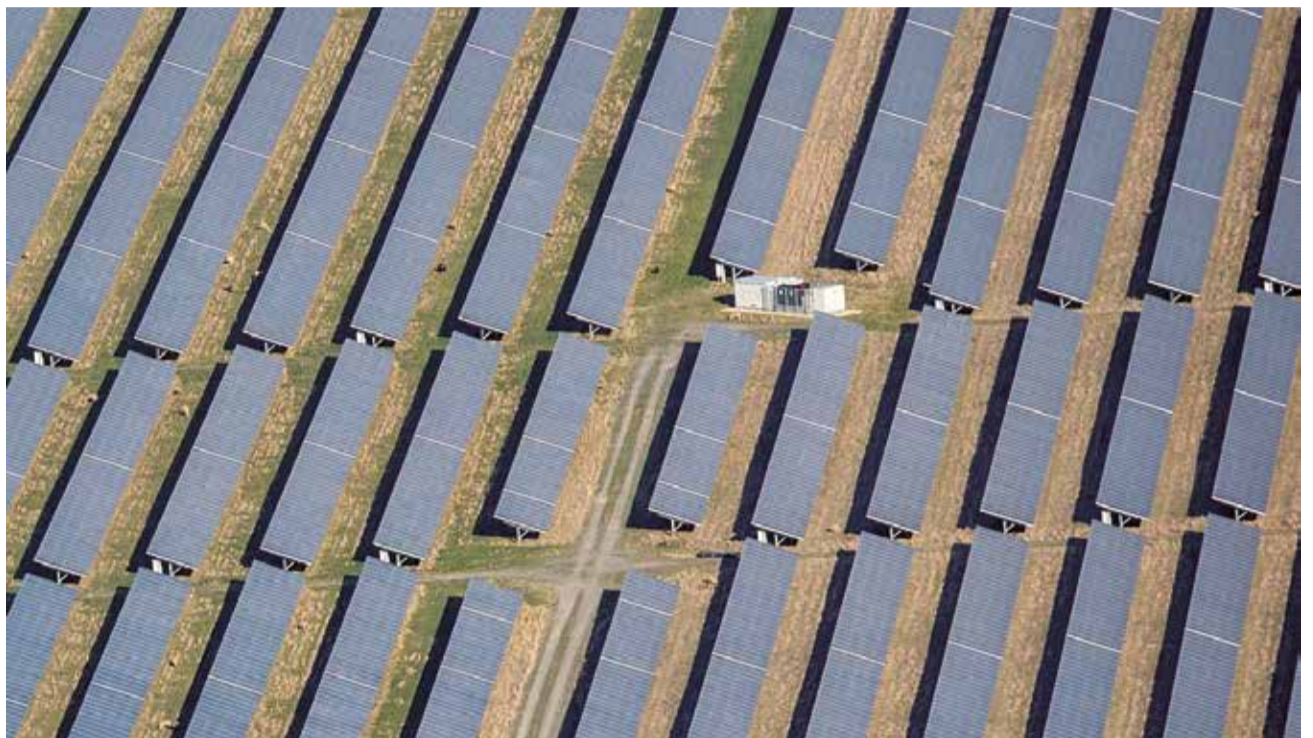
Macroparque fotovoltaico.

Cabe señalar, que el proyecto de macroplanta de Brihuela está considerado como uno de los más grandes de España, representando una superficie total de afectación superior a 1.000 campos de fútbol, siendo, en definitiva, 10 veces superior a la superficie ocupada por el casco urbano del municipio.