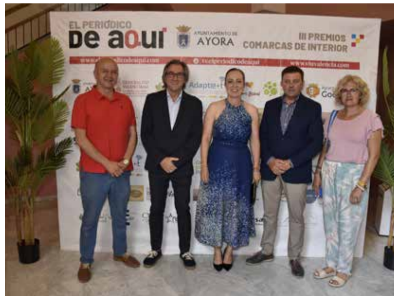
Instantáneas de algunos de los asistentes a la tercera edición de los premios de comarcas de interior celebrados en Ayora.