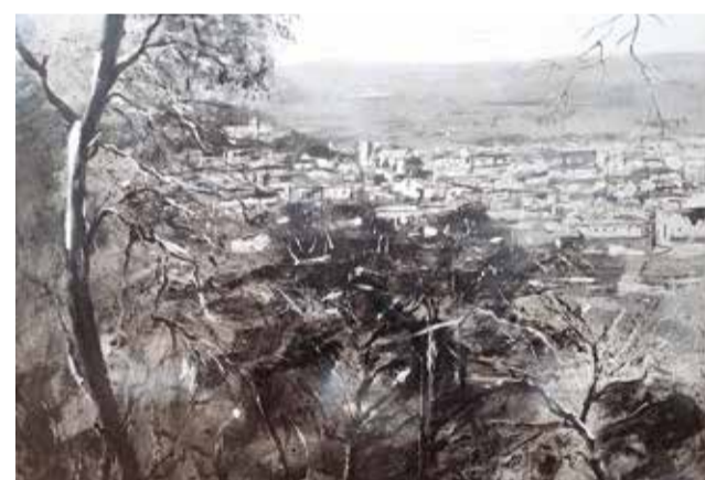
Sexto premio.