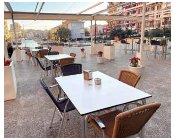
Restaurante Enclave de Mar en Port Saplaya.

algo más de un año, se ha destacado por ofrecer una experiencia culinaria excepcional dentro de una ubicación realmente privilegiada, rodeada por la naturaleza y los paisajes únicos que rodean la localidad. Dentro de la carta podemos encontrar una amplia variedad de platos realmente deliciosos y siempre con ese toque único que da una identidad propia a cada bocado. El menú, cuidadosamente elaborado, ofrece una variada selección de platos que van desde los clásicos de la cocina regional hasta propuestas audaces que desafían los límites de lo convencional: las