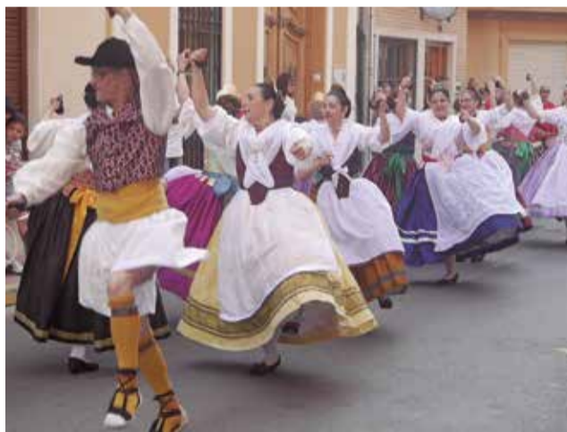
Programa 'D'Arrel' de la Diputación.

D'Arrel supone una amplia muestra de demostraciones de nuestra cultura popular, desde las danzas de cada comarca, pasando por conciertos de grupos y cantautores valencianos, 'correfocs', cenas populares al calor de la música y actividades infantiles como conciertos o talleres de baile. En este sentido, las actividades programadas en Chi-