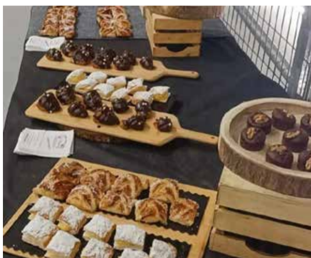
Horno La Victoria, en Port de Sagunt.