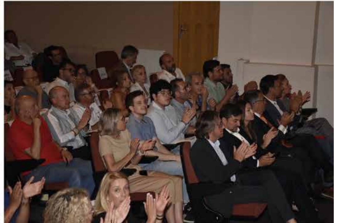
Instantáneas con los diferentes premiados y premiadas en la gala de Ayora.