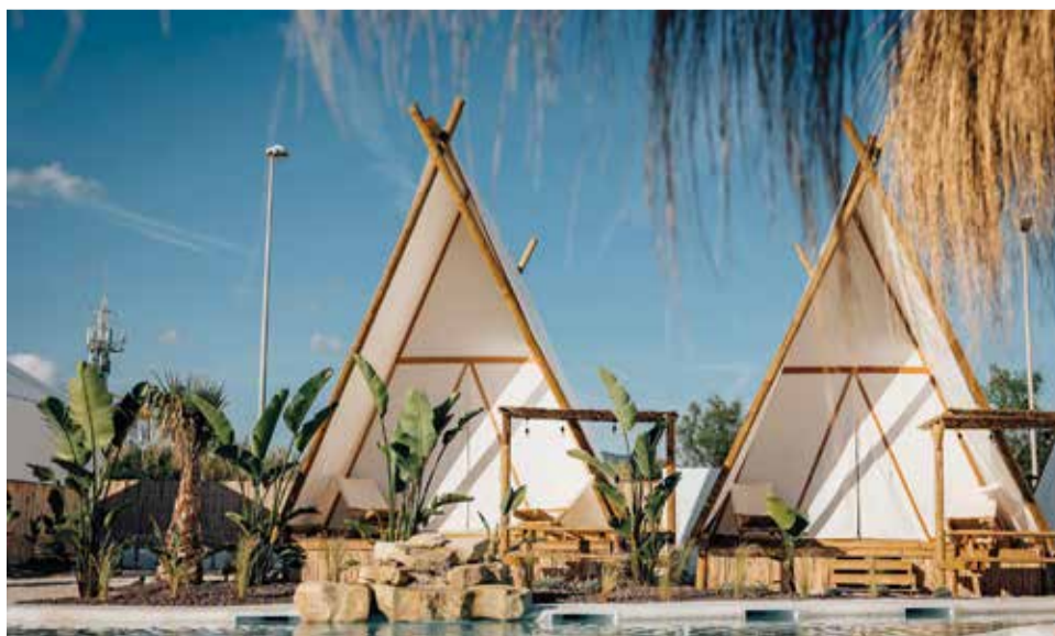
Glamping Kikopark.