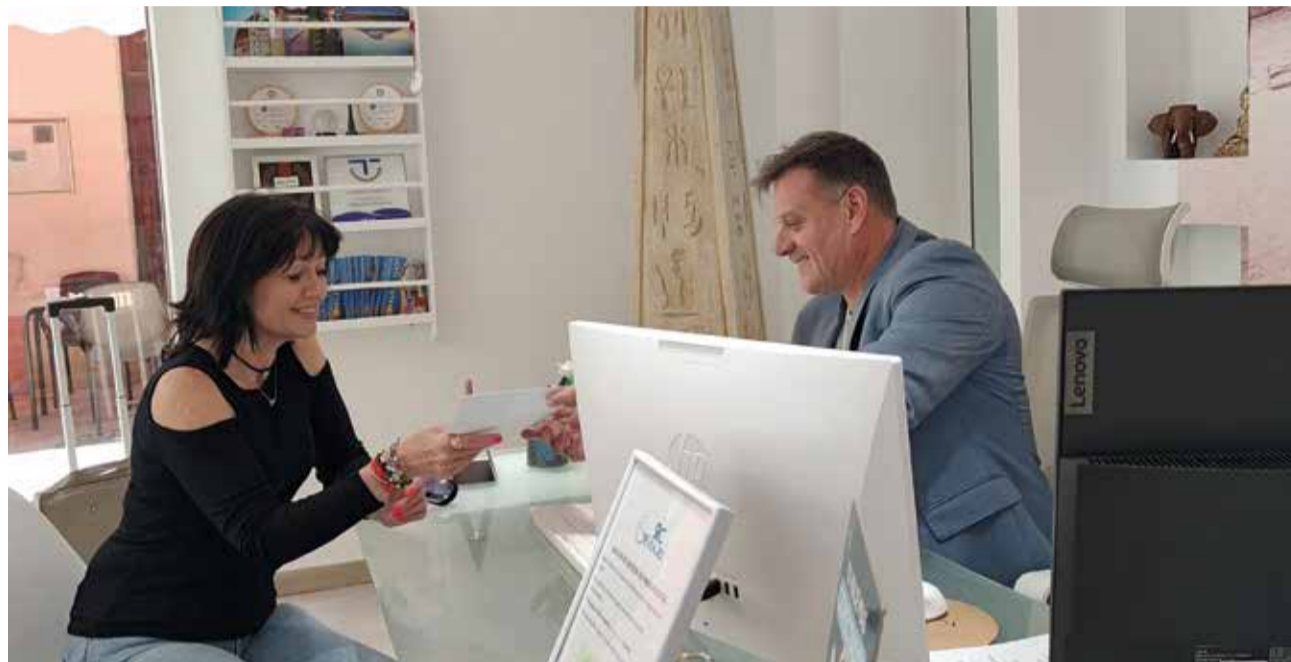
Atenció al client en RC Viajes. / RCVIAJES

Tindre una assegurança específica per a viatges és crucial. "L'assegurança bàsica