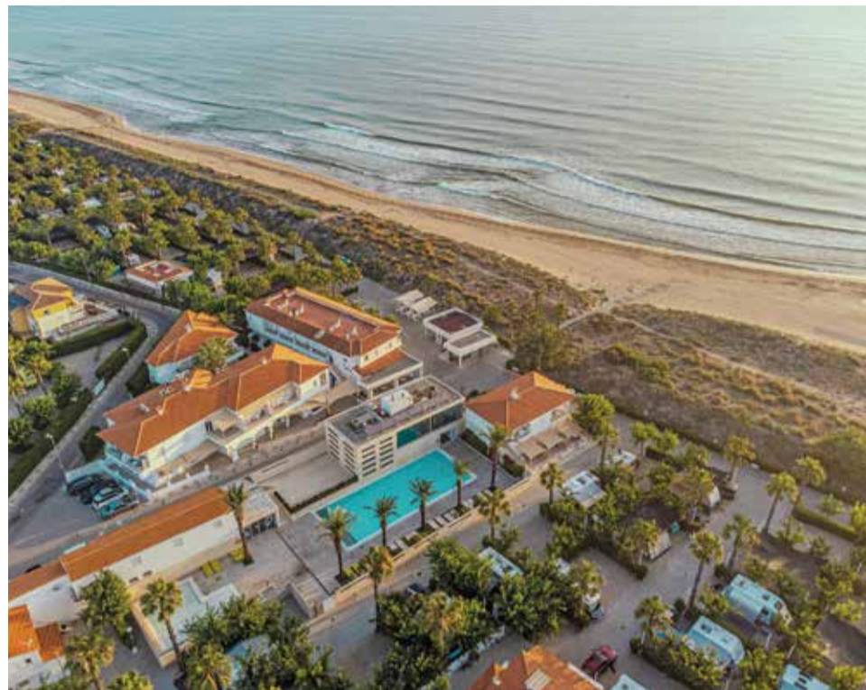
Instal·lacions de Kikopark a Oliva.

En definitiva, Kikopark continua la seua trajectòria com un referent en el sector turístic, oferint experiències úniques i de qualitat en un entorn natural incomparable, amb un compromís ferm amb el futur i la sostenibilitat.