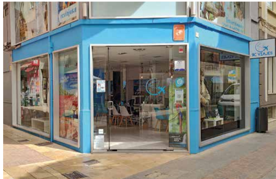
Establiment de RC viajes. / RCVIAJES

En RC Viajes, la seguretat dels clients és una prioritat. L'agència compta amb mesures anti-phishing i un certificat SSL en la seua web rcviajes.es. "A més, sempre mostrem els nostres números de llicència i contacte", indica el seu Director. Durant els viatges, RC Viajes inclou un servei de reclamació gratuït en cas de qualsevol incidència amb els vols i un telèfon d'atenció 24 hores sense cost addicional. Per a compres en línia, ofereixen una aplicació mòbil dispo-