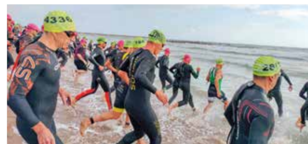
I Triatló 'Health and Mind' Oliva.

seua famosa Fira Gastronòmica al passeig Alcalde Juan Sancho i el 'Mercat del Llaorador' al passeig Jaume I. Els assistents van gaudir d'un ambient increïble on es van poder conèixer els productes típics de la zona. Entre les activitats destacades, el divendres a la nit va actuar el grup 'La Tardor', seguit per DJ locals. Dissabte es va disputar la final del 'Festival de la Cançó', i diumenge va tancar amb l'actuació del grup MEGòC (Modern