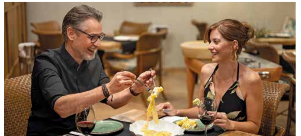
Gastronomia en La Plaza Oliva Nova.