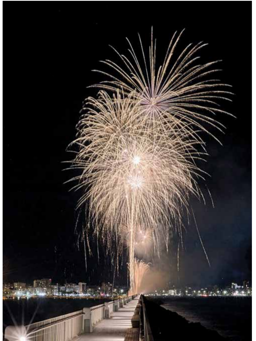
Espectacle pirotècnic de la nit de San Joan.

Frase destacada cita: Balbina Sendra: "Les persones que acudisquen a celebrar aquesta festa trobaran una platja plena d'oportunitats i opcions per gaudir gràcies a la col·laboració publicoprivada"