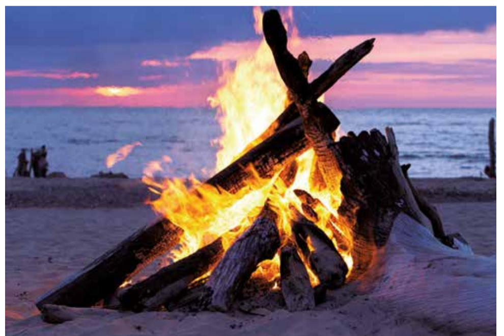
Foguera de la Nit de Sant Joan.

Tavernes de la Vall digna també ha preparat un programa variat per a la Nit de Sant Joan. Les activitats començaran a les 20:00 h amb un teatre infantil i un taller de reciclatge, on es representarà l'obra "Lota la Charlota" a l'avinguda de La Marina, a la zona de la Tourist Info. A les 23:00 h, la Colla de Dimonis de Mislata oferirà un correfoc, amb eixida des del final