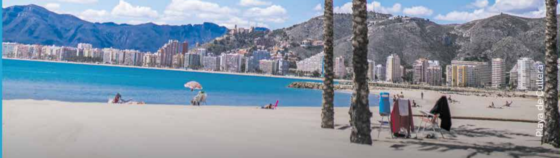
Playa de Cutlera