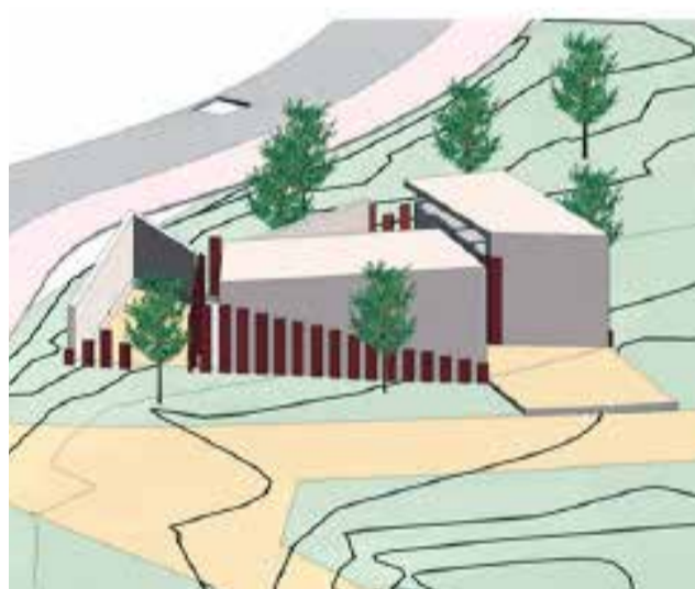
Diversos planos de los nuevos baños en los jardines de la Gerencia.