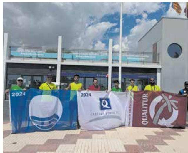
Distintius de la platja de Canet.