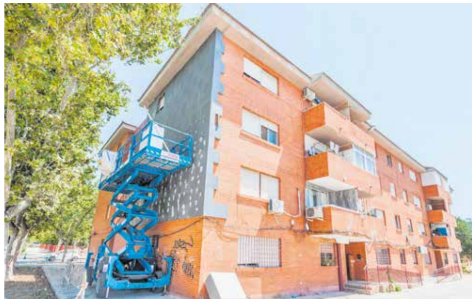
Bloque de viviendas públicas en el barrio de Baladre.

249, al que le siguen Carcaixent con 140 y Alberic con 118 y la capital, Alzira, con 97. El resto de municipios de la comarca que cuentan con viviendas públicas son Benifaió (35), Alginet (32), Castelló (31), Càrcer (18), Benimuslem (16), Massalavés (15), Carlet (14), Gavarda (5), Turís y la Pobla Llarga con dos