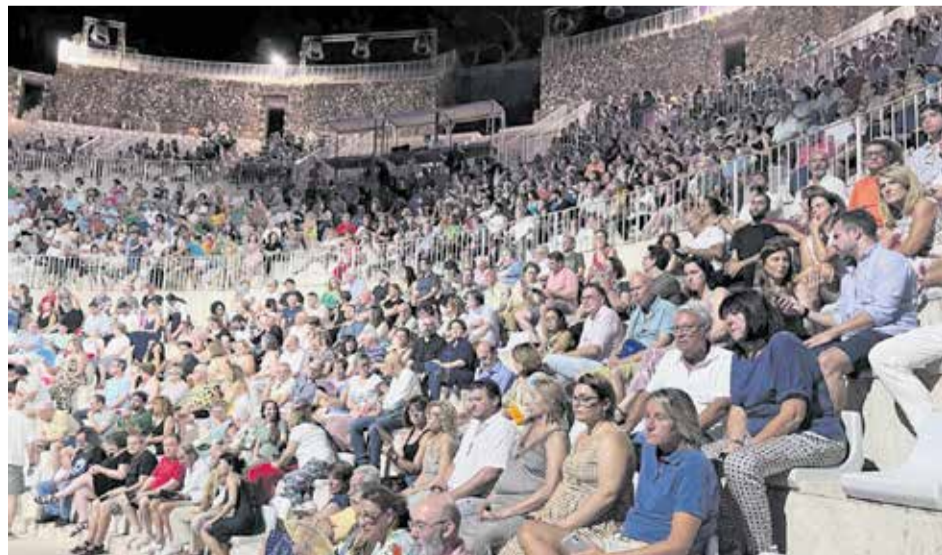
Un instante del festival en su decimocuarta edición.

Finalmente y tras la incertidumbre, el festival Sagunt a Escena sí se celebrará este año también en la que ha sido su casa durante todos estos años. La de este año, la edición número 41, se celebrará del 1 al 25 de agosto con una programación donde las obras maestras del teatro clásico se reimaginan a través de una lente contemporánea e innovadora.