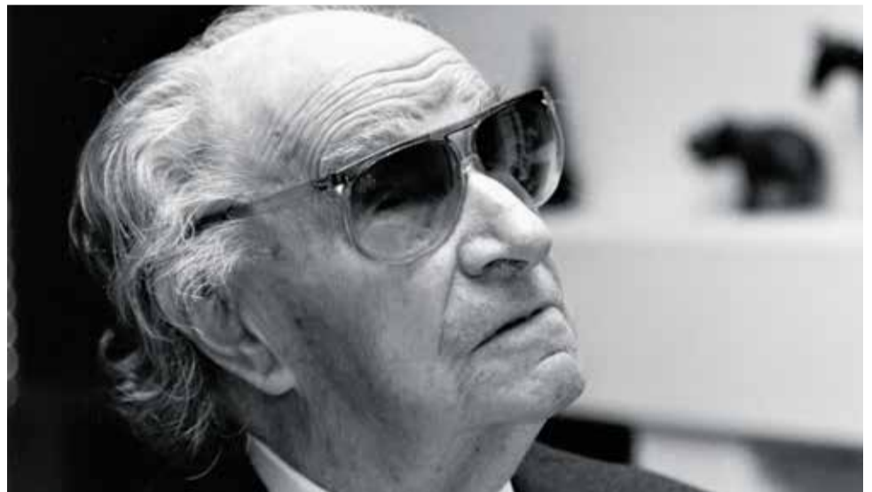
El mestre, en un moment de la seua vida. / EPDA