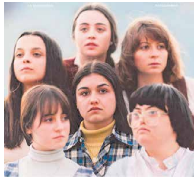
Actrius protagonistes de la pel·lícula.

La pel·lícula transcorre a l'Espanya de 1982, quan alguns celebraven ja la victòria de Felipe González, mentre que una altra part del país es resistia al canvi. En eixa segona part es troben les protagonistes d'esta història, en el centre per a adolescents embarassades de Peñagrande, a Madrid, un dels molts reformatoris impulsats per Carmen Polo des de la institució franquis-