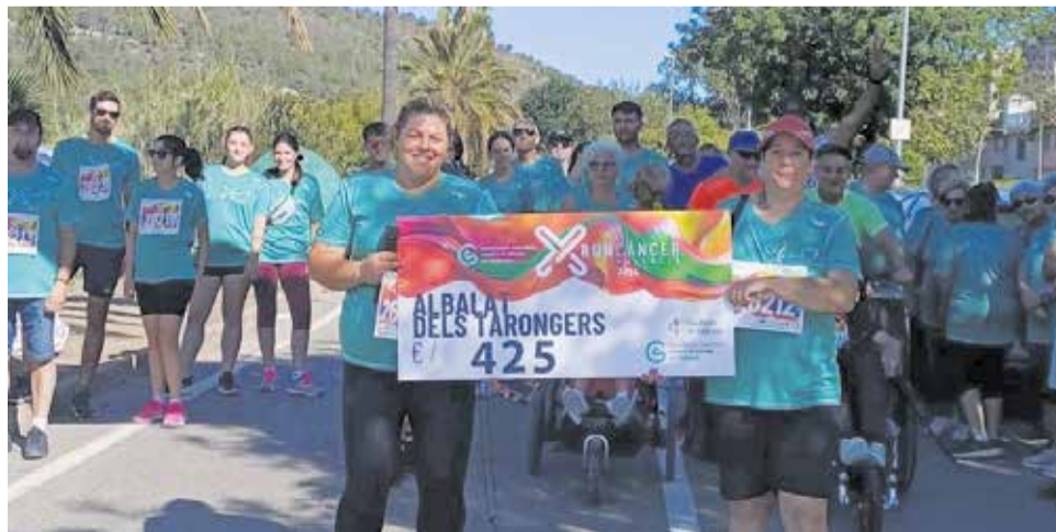
Alcaldeessa i tinent d'alcalde, junt amb altres participants.

Gràcies als seus dorsals 100% solidaris es varen aconseguit recaptar 425 euros, que se sumen al total del circuit, que s'acosta als 107.000 euros aquest 2024.