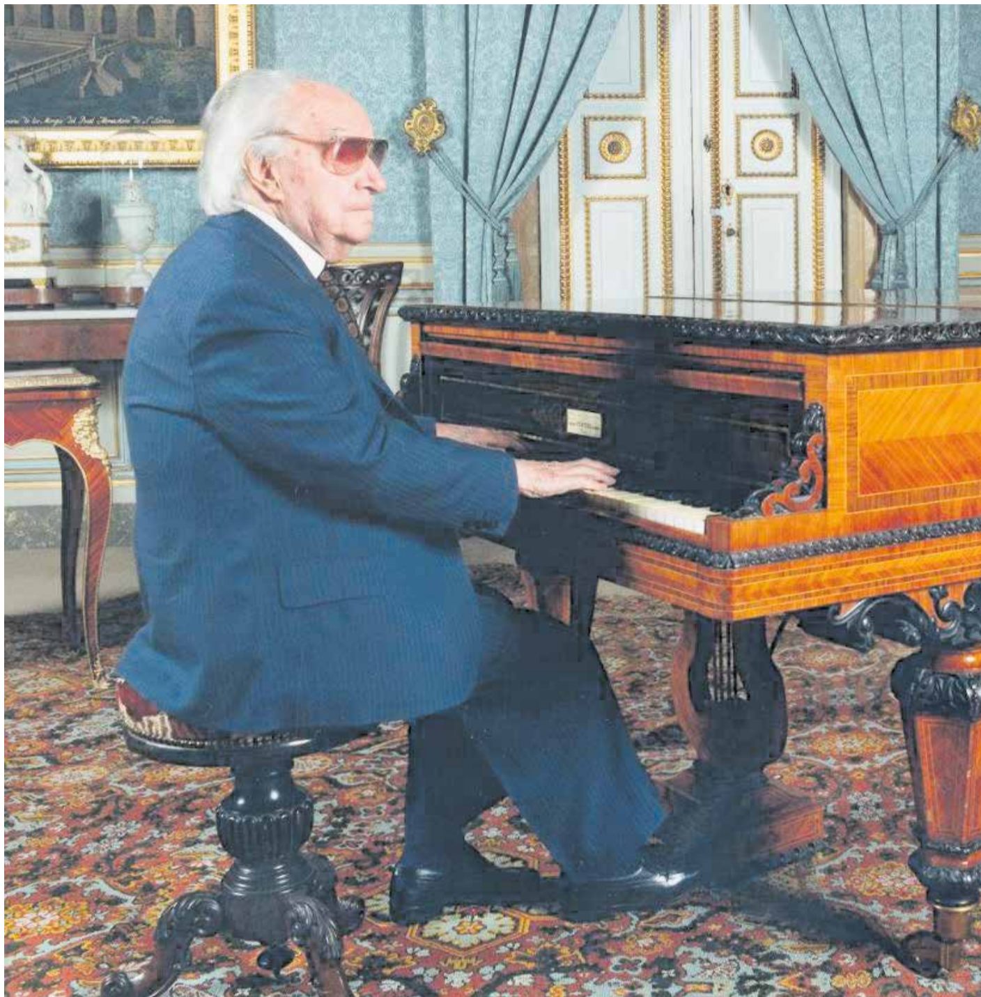
El mestre Joaquín Rodrigo, al piano, en un moment de la seua vida.

L'obra està composta per a orquestra i es caracteritza per la seua rica orquestració i melodies que evocuen el paisatge i la història de Sagunt. Rodrigo utilitza