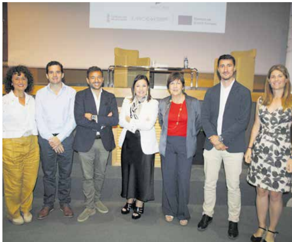
Jornada de Cultura Empresarial organizada por Asecam.

tacaron la importancia del bienestar de los trabajadores y la definición de perfiles competenciales para me-