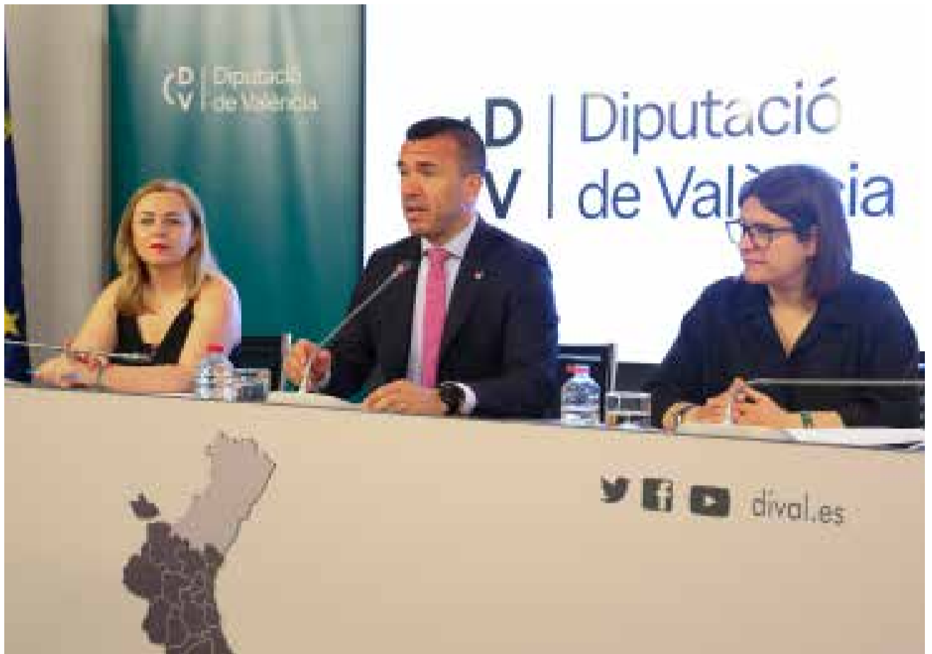
Presentació dels Fons de Cooperació 2024 de la Diputació de València.

En este sentit, Vicent Mompó ha explicat que l'adhesió al nou Fons de Cooperació és voluntària, i això permet igualment que les diputacions puguen establir la seua pròpia fórmula de repartiment. “El nostre full de ruta passa per estar més prop dels municipis, especialment els més xicotets, i això és el que hem reflectit en la proposta de repartiment que portarem al ple de juny, que cuida als pobles amb menys recursos seguint els criteris aplicats per esta institució en els anys anteriors”.