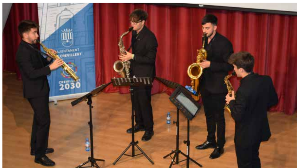
Meraki Sax Quartet en una actuació.