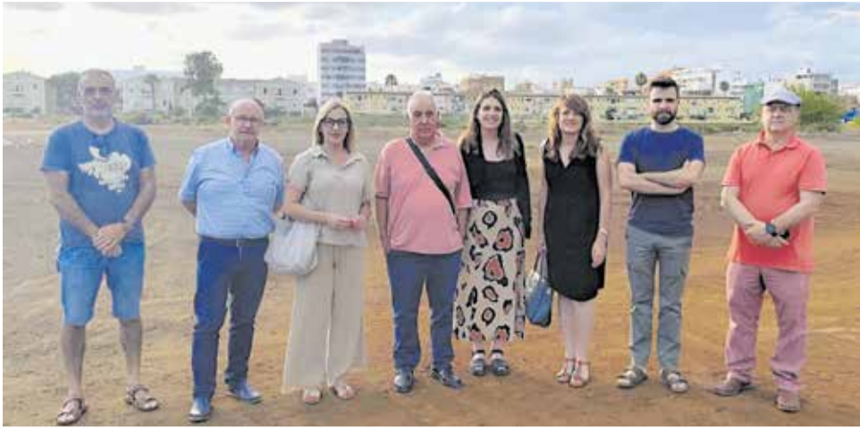
Diputados y concejales de Compromís en los terrenos del Malecón.