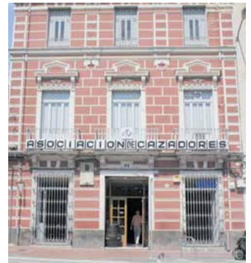
Casa natal de Joaquín Rodrigo.