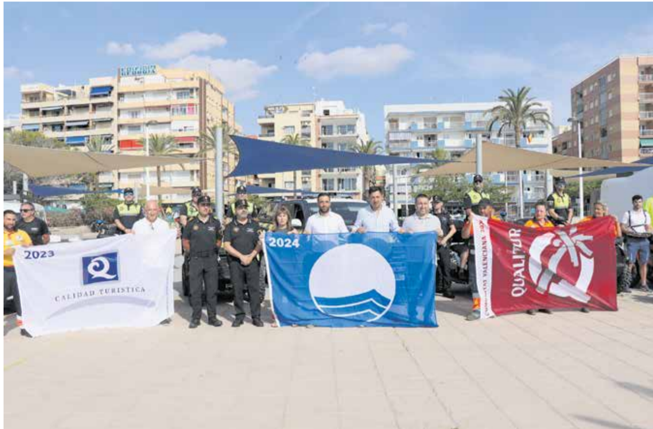
Presentació del dispositiu de platges per a este estiu. / EPDA

Així mateix, hi ha dos ambulàncies amb un metge i