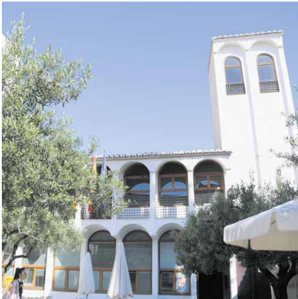
Façana de l'ajuntament de Quartell. / BORJA PEDRÓS

De la mateixa manera, l'edil del PP ha enlletgit al govern de coalició que "després d'estar durant tant de temps