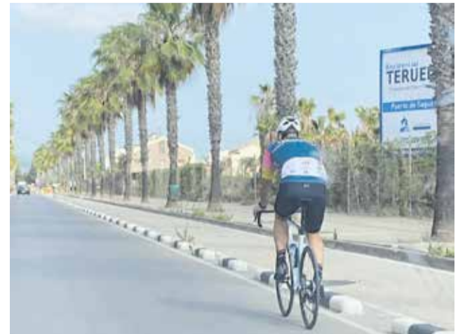
Ciclista circula por la calzada en lugar del carril bici.

Sáez insiste en que por el carril bici “no pasa prácticamente ninguna bicicleta” y que “estas siguen utilizando otros carriles para su circulación”. “La realidad es que el uso del carril bici está siendo bien distinto al esperado. Nos hemos dado cuenta de que los peatones están haciendo uso de los carriles bici para circular. Y es que se han convertido en el único lugar seguro por el que poder caminar tranquilamente sin encontrar un socavón o