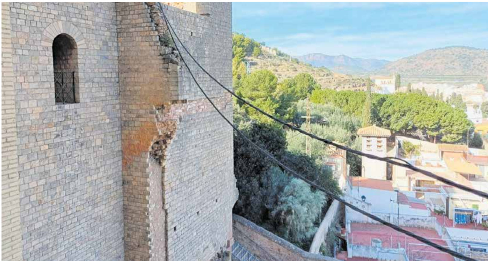
Cable provisional que iluminaba el Teatro Romano desde los años 90.

UNA INVERSIÓN DE 45.000 EUROS ACABA CON LA "LUZ DE OBRA" QUE ILUMINA EL MONUMENTO DESDE LOS AÑOS 90