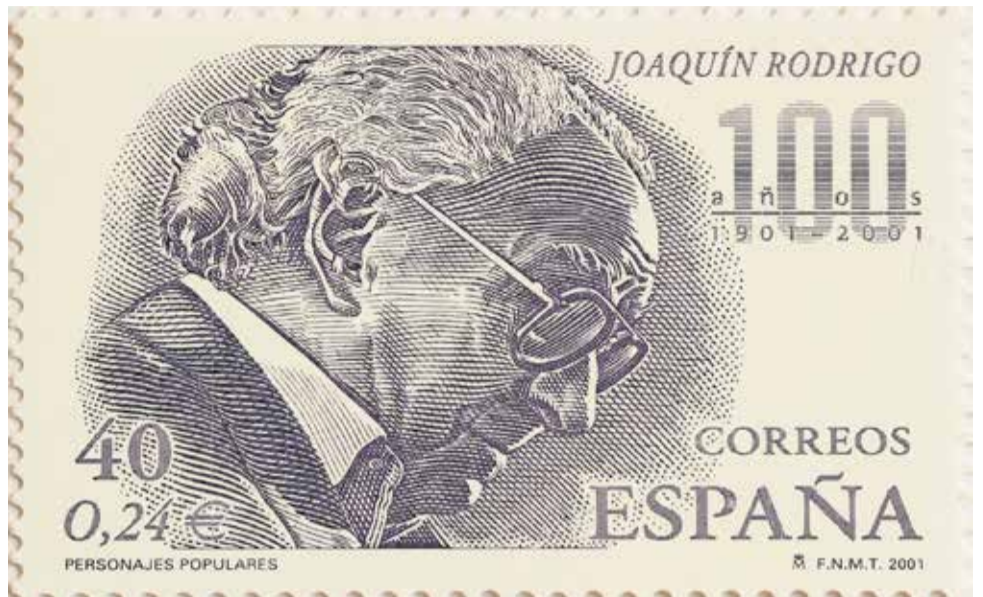
Segell de Correus pel centenari del naixement de Joaquín Rodrigo.

La música de Rodrigo per a 'La destrucció de Sagunt-