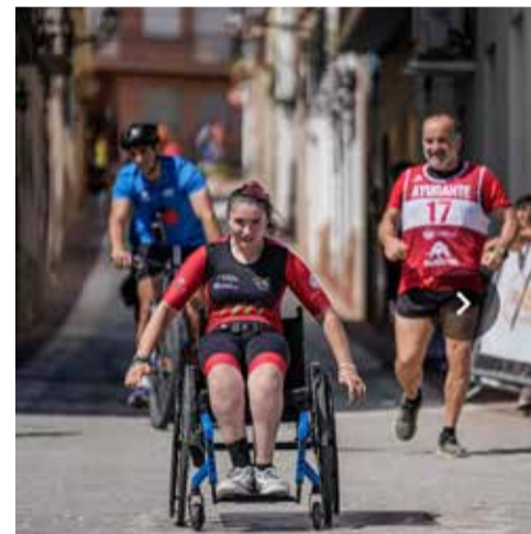
Diversos instants de la jornada a Gilet.