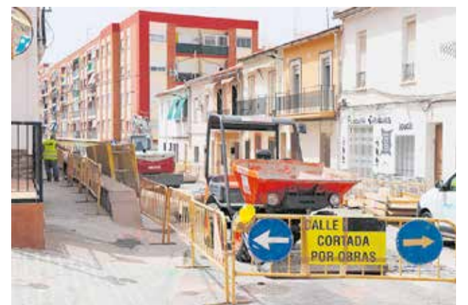
Obras en las calles.

en los accesos a las calles Caballeros, José Lerma y Gilet. No obstante, desde el consistorio “se informará con claridad de las prohibiciones y, en todo caso, se dará un itinerario alternativo de entrada y salida, para que las personas residentes no tengan problemas a la hora de acceder con sus vehículos”, ha detallado el edil de Mantenimiento y Aguas.