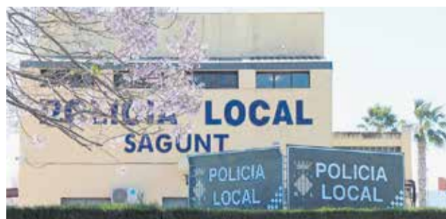
Sede de la Policía Local de Sagunt.

En los pliegos de licitación de las obras, publicados recientemente, se especifica que no habrá financiación europea. Esta reforma, licitada en dos ocasiones anteriores con un presupuesto cercano a los 650.000 euros y cubierto al 50% con fondos europeos, quedó desierta en am-