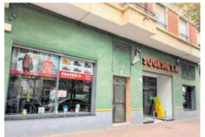
El nuevo local en la Av. País Valencià (Sagunt).

Este nuevo modelo de tienda brindará a los profesionales del sector la oportunidad de acceder a una amplia gama de productos y servicios especializados. Durante la semana inaugural, del 8 al 13 de julio, Sugesa tendrá un horario especial de apertura, atendiendo de manera ininterrumpida de 8:30h a 18:30h. Los visitantes podrán beneficiarse de ofertas exclusivas y disfrutar de sorpresas especiales que se desvelarán en la tienda.