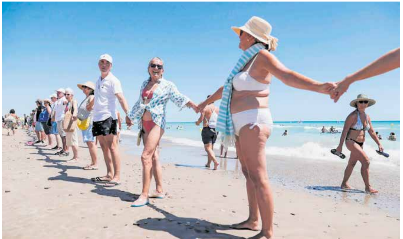
Cadena humana organizada el año pasado en las playas de Sagunt.

El anuncio de la iniciativa se ha producido tras el III encuentro de Somosmediterranea, celebrado en Oropesa de Mar, donde representantes de 53 asociaciones de todo el litoral español han discutido estrategias para abordar los desafíos actuales del Reglamento de Costas y otros temas relevantes para la conservación ambiental costera del país. Una problemática que afecta sensiblemente al