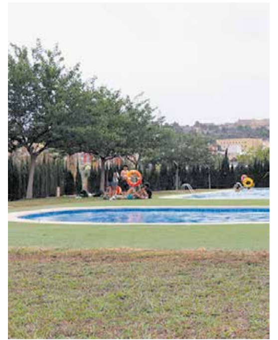
Nuevas pistas de pádel en el polideportivo René Marigil (izquierda) y piscina descubierta (derecha).