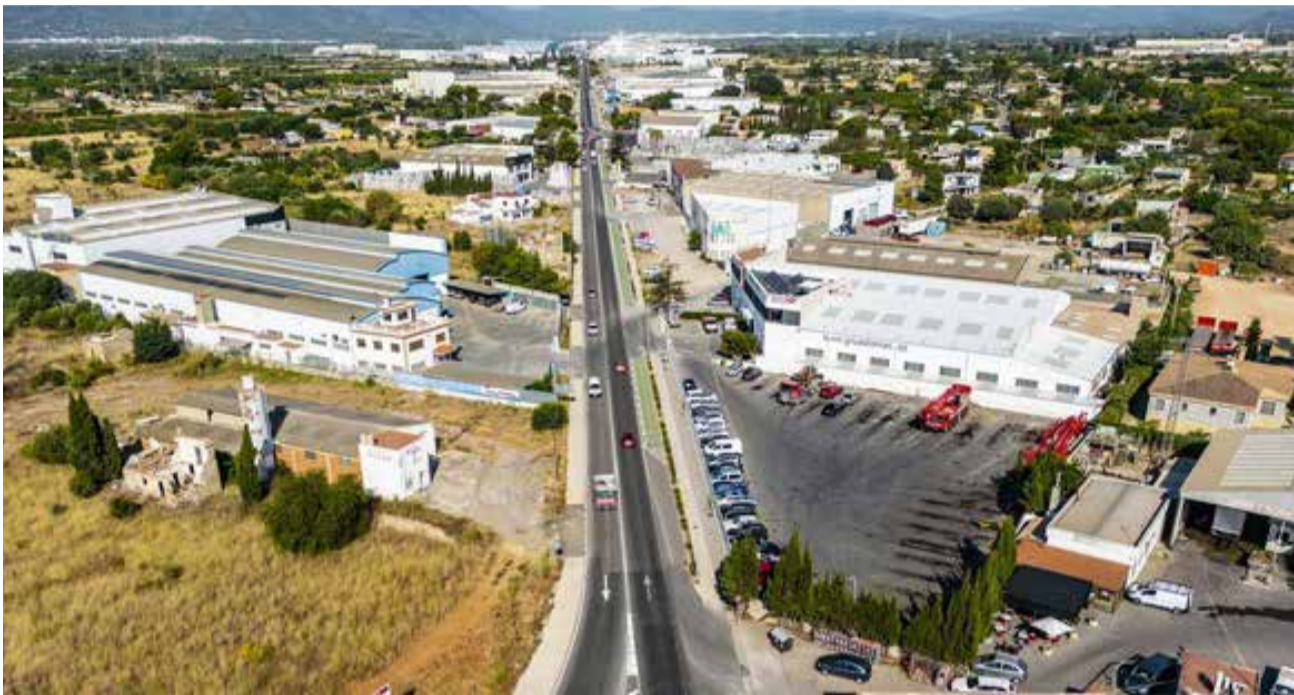
Vista d'una àrea industrial de Vila-real.

EL CONSISTORI INVERTIRÀ EN L'ÀREA DEL CAMÍ ARTANA I LA ZONA DELS CARRERS RIU I ANDALUSIA