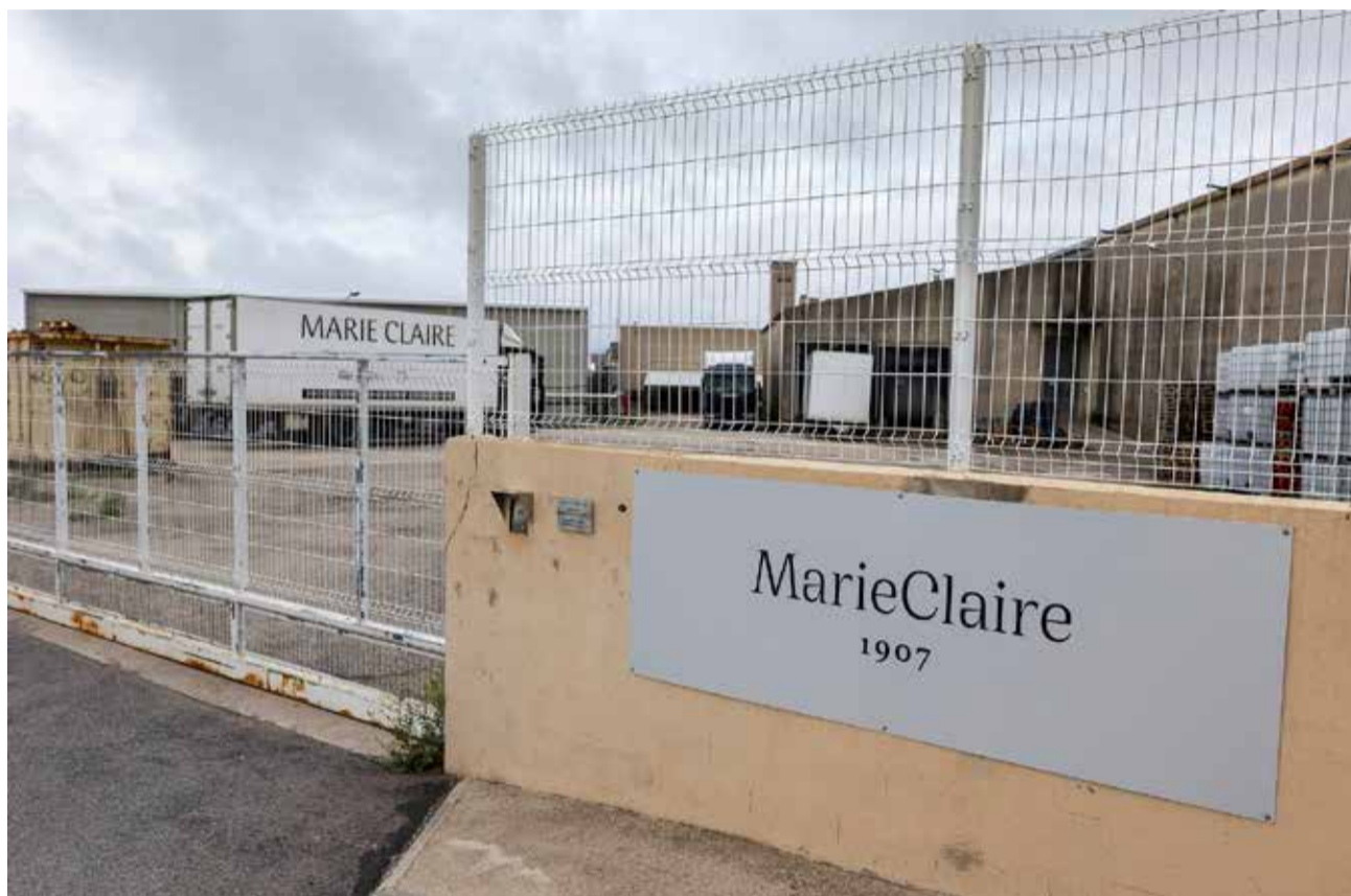
Imagen de archivo de las instalaciones de Marie Claire en Vilafranca.

El auto recoge el análisis de las dos ofertas presenta-