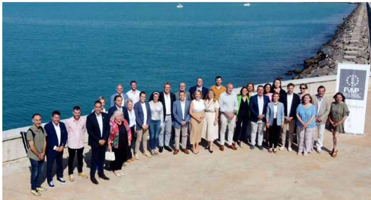
Constitució del Fòrum de Municipis de Costa en el port de Burriana.

La consellera Salomé Pradas va manifestar la importància que per a la Generalitat té la costa valenciana, "donat el gran nombre de quilòmetres, platges i ports del litoral que té el nostre territori". A més, va deixar clar que, "a més del gran valor turístic i econòmic que apor-