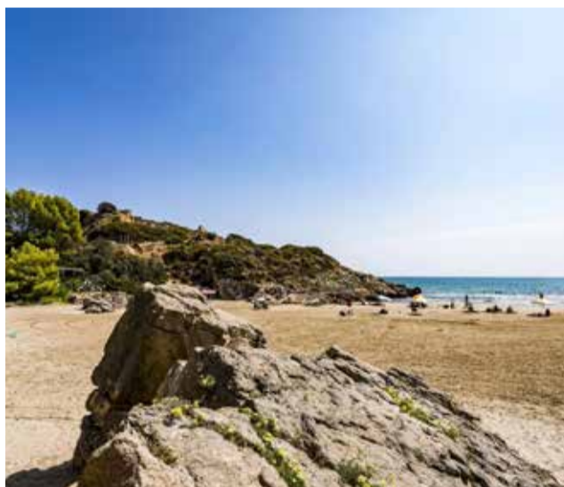
Cala del Retor en Oropesa del Mar.