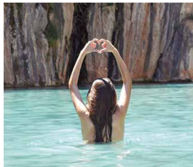
Fuente de los baños en Montanejos.