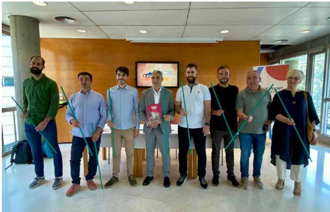
Presentació del 55 Sexenni de Morella al CdT de València.

Este acte va servir per a exposar l'essència d'esta festivitat, que data de 1672, quan Morella va patir una epidèmia de pesta negra. Els morellans i les morellanes van decidir traslladar a la Mare de Déu de Vallivana des del Santuari fins al municipi i es va fer el miracle: la pesta negra va desaparèixer. Des d'eixe moment, els veïns van decidir organitzar una festivitat popular, que es va celebrar per primera vegada l'any 1678 i se celebraria cada sis anys. Este és un dels aspectes més especials d'esta festa, va assegurar l'alcalde, ja que "no són unes festes que va crear l'Ajuntament o l'Església, sinó els veïns de Morella", va afegir Sangüesa. El primer edil també va voler ressaltar que són els diferents gremis de la ciu-