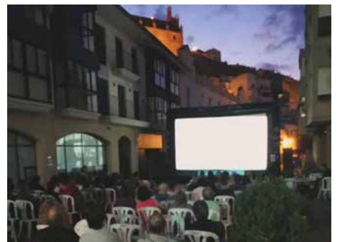
Jornada inaugural del FIV de Vilafamés.

Com a novetat, enguany s'entregarà el Premi Contra la Violència Masclista, creat per mediació de la regidoria d'Igualtat del municipi.