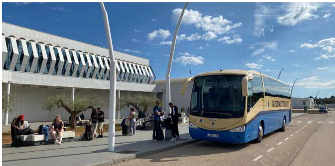
Diversos passatgers esped'autobús de l'aeroport de Castelló.

L'aeroport de Castelló disposa d'un servei discrecional d'autobús, amb horari adaptat al dels vols, que connecta l'aeroport amb l'estació d'autobusos de la ciutat de Castelló. Este servei, gestionat per la companyia Autos