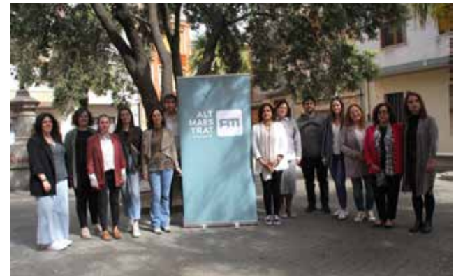
Presentació de la nova imatge a Benassal.