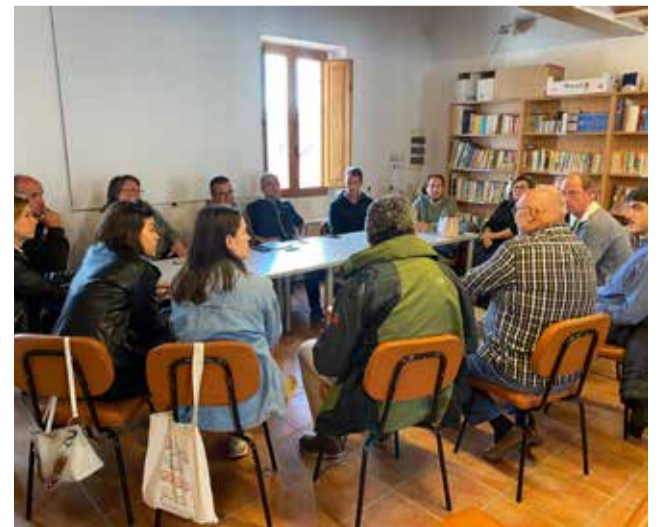
Un instant durant la reunió.

Des de la Mancomunitat s'advertix que la situació és dramàtica: alguns municipis duen ja mesos portant camions cisterna per al consum humà, però no hi ha aigua per al ramat.