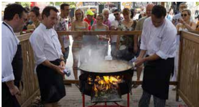
Edició anterior del Concurs de Paella de Sueca.

Com a acte previ, el diumenge 14 de juliol, a la per-