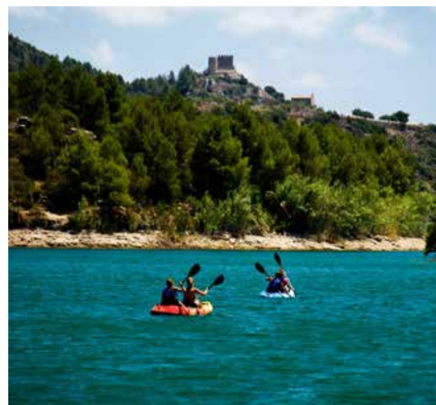
Kayak en el embalse de l'Alcora.

La Fuente de los Baños de Montanejos cuenta con zonas de agua donde la temperatura es de 25°C a lo largo de todo el año