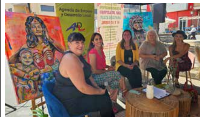
I Feria de Emprendimiento Art Woman.