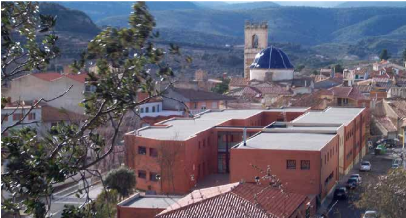
Vista del CEIP Alcalde Fabregat de Benassal.

LA CONSELLERIA RECTIFICA I ACCEPTA LES AL·LEGACIONS DEL CONSELL ESCOLAR MUNICIPAL