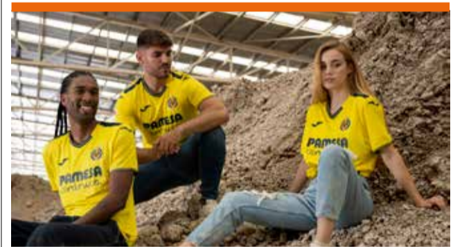
► El Villarreal presenta su nueva equipación para la temporada 24-25, en la que mantiene su línea habitual, aunque en esta ocasión con más detalles de color azul, y rinde homenaje al sector de la cerámica.

España debutará en los Juegos Olímpicos el 24 de julio frente a Uzbekistán en el Parque de los Príncipes. Después se trasladará a Burdeos, sede de sus dos siguientes encuentros en la fase de grupos: el día 27 de julio ante República Dominicana y el 30 de julio frente a Egipto. Los tres partidos se disputan a las 15.00 horas CEST (-2 GMT).