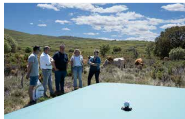
Visita a l'explotació d'Ignacio Roca a Catí.