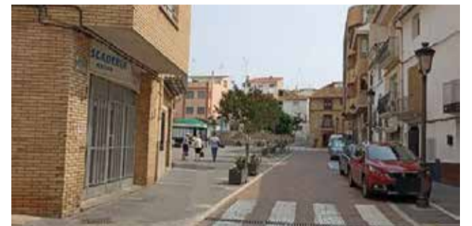
Avenida Santuario de Altura.

Por su parte, los vecinos y vecinas cuya vivienda se sitúa en la Calle del Pilar, Travesía del Pilar y calle Escrig, deberán acceder a sus viviendas por la calle del Pilar durante el corte al tráfico del tramo indicado de la Avenida Santuario.