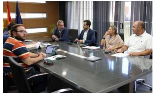
Un instant durant la presentació del pla. / EPDA