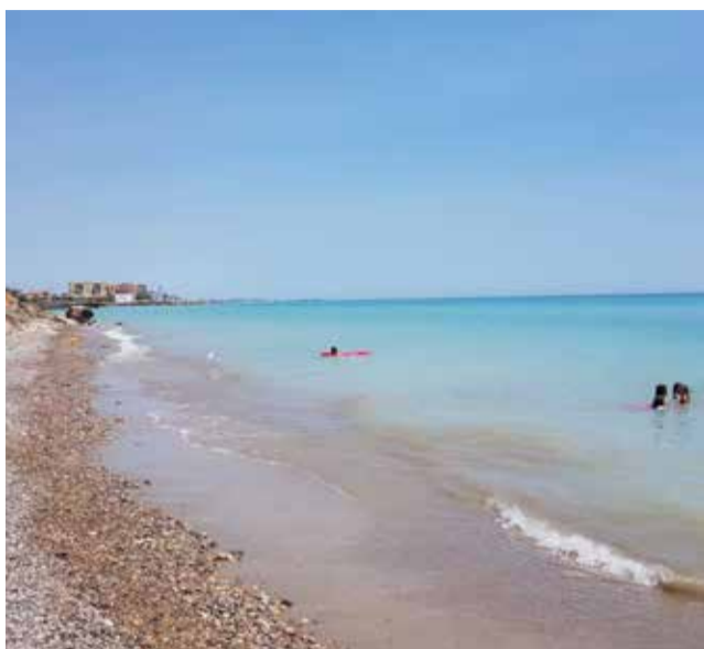
Playa del Rajadell de Nules.