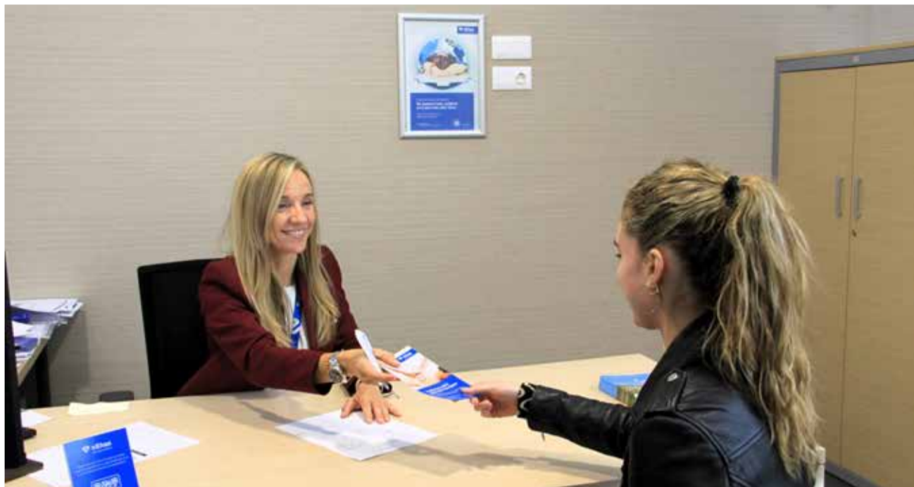
Atención personalizada al paciente internacional de Vithas.

Según datos facilitados del aeropuerto de Castellón, desde el mes de mayo hasta noviembre, está prevista