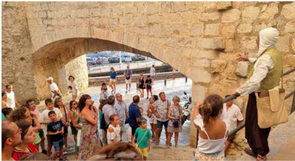
Visita guiada per la Ciutadella de Peníscola.

Durant els mesos centrals de la temporada com són juliol i agost, Peníscola oferirà als seus visitants un conjunt d'activitats culturals, lúdiques i esportives que complementen els atractius patrimonials, històrics, naturals i de sol i platja amb els quals compta la destinació.