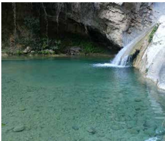
Toll del Salt en Lucena del Cid.

población con su fuente es sumamente conocida y representa uno de los atractivos turísticos más importantes del municipio con repercusión en su economía y también en aspectos culturales, gastronómicos, sociales... Ya lo fue en la antigüedad: se cuenta que el gobernador almohade de Valencia y señor de estas tierras, Zeit Abu Zeit para que sus mujeres se mantuvieran siempre bellas, las mandaba a los Baños teniendo en cuenta las propiedades minero medicinales de sus aguas para evitar el deterioro de su piel.