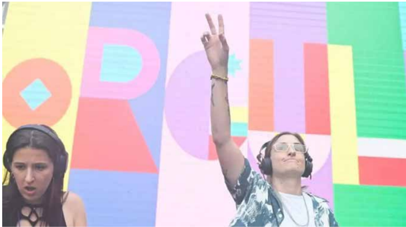
Una de las actuaciones durante la fiesta del Orgullo de Castelló de la Plana.

Los principales partidos de la oposición tampoco tardaron en desvincularse del Orgullo de Castelló. El PSPV argumentó su decisión al considerar que el Ayuntamiento ha querido "despreciar el trabajo desarrollado por la Plataforma LGTBIQ+ durante los