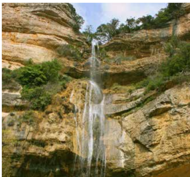
Salt de Robert en la Tinença de Benifassà.

En la comarca de l'Alcalatén, encontramos el municipio de Lucena del Cid, que cuenta con más de 130 kilómetros cuadrados de naturaleza en plena montaña y se encuentra a solo 33 kilómetros de la costa. Se trata de uno de los términos municipales con más desnivel de Europa, unas características geográficas que hacen que su clima sea suave en invierno y fresco en verano.