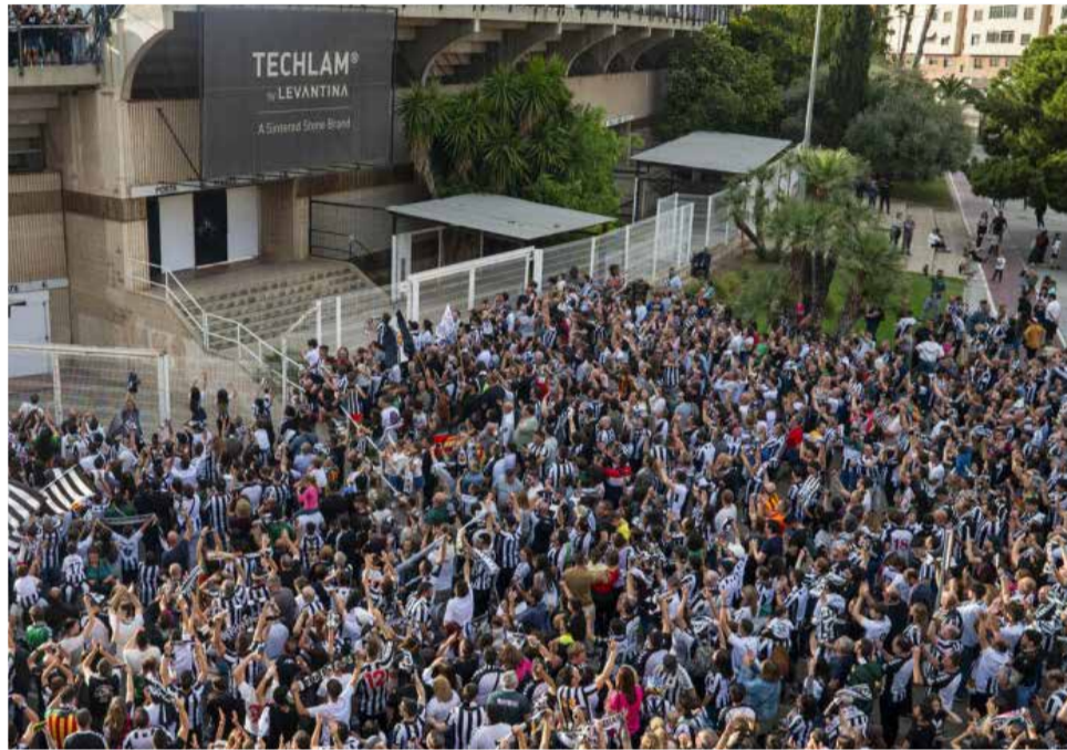
Fiesta de celebración del ascenso del CD Castellón.

El técnico trató de convencer a Medunjanin de continuar una temporada más en activo, aunque éste decidió