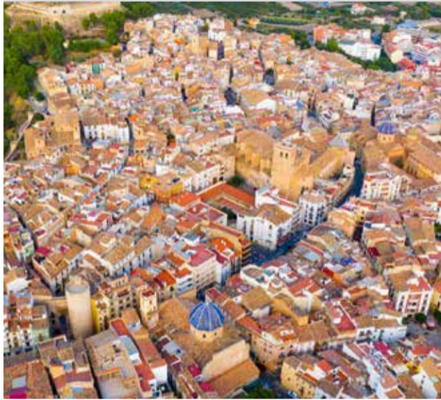
Vista del casco antiguo de Segorbe.

Como novedad, se podrán solicitar las ayudas con carácter retroactivo al 1 de enero de 2024, para todas aquellas personas que hayan embellecido las fachadas del casco antiguo en esta anualidad.