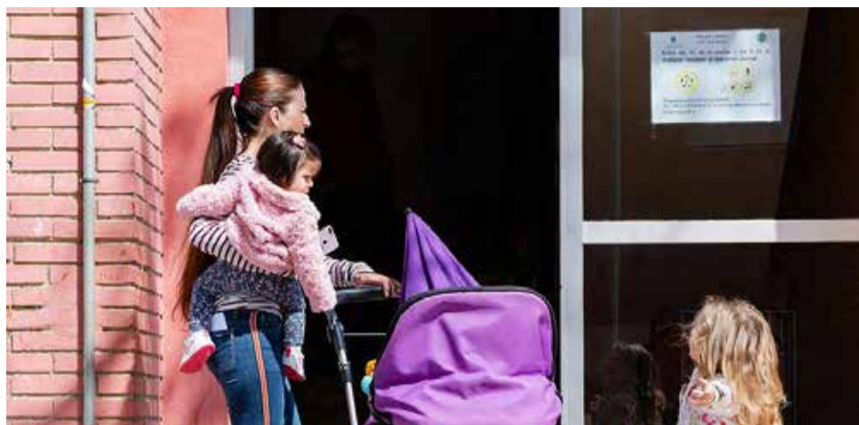
Una mujer y dos niñas en un edificio del grupo La Moleta en la Vall d'Uixó.

A ello se une que el proceso para poder acceder a una de estas viviendas es un tanto farragoso. El demandante debe apuntarse como tal en el registro y es la entidad la que inicia la adjudicación dependiendo de las necesidades de las familias (si la vivienda se