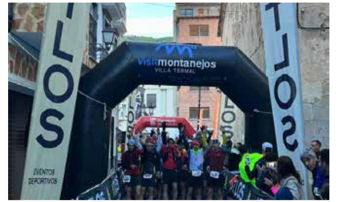
Edición anterior del Trail de Montanejos.