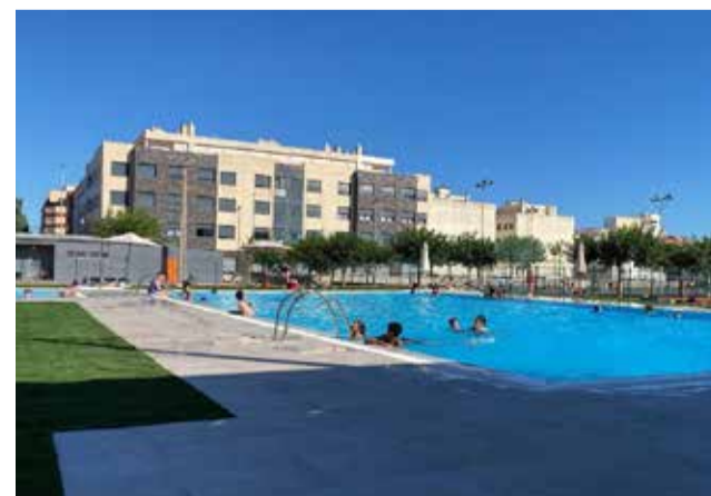
Piscina descoberta del municipi de Nules.