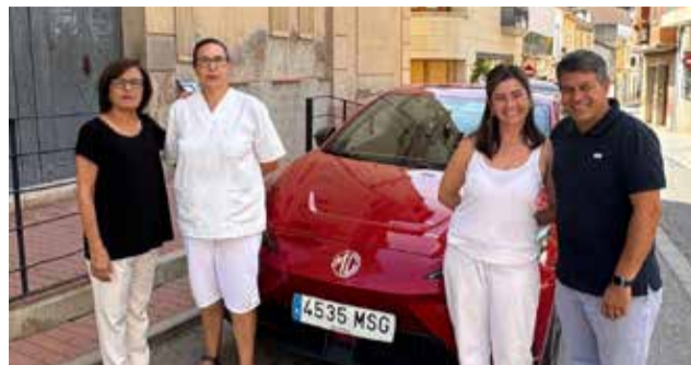
Nou vehicle elèctric de l'Ajuntament d'Olocau.