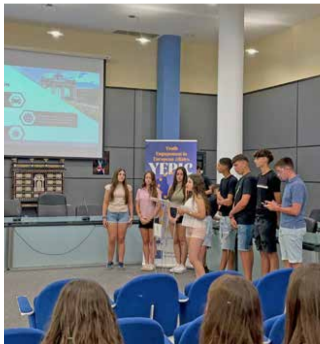
Presentación de propuestas y equipo ganador del proyecto europeo YEPIC en Benaguasil.

Divididos en grupos el alumnado ha expuesto sus