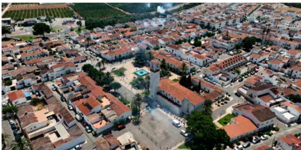
Vista del municipio de Marines.