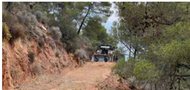
Una màquina treballa a una pista de Serra.

L'Ajuntament de Serra ha reparat recentment 3,9 quilòmetres de pistes forestals del terme municipal, incloses en el Pla de Prevenció d'Incendis. Uns treballs, que compten amb una inversió de 25.592,02 euros i que es troben dins de la subvenció Reacciona 2023 de la Diputació de València per a la prevenció d'incendis forestals. Entre les actuacions es troben un escarificat de l'esplanada del camí, refina-