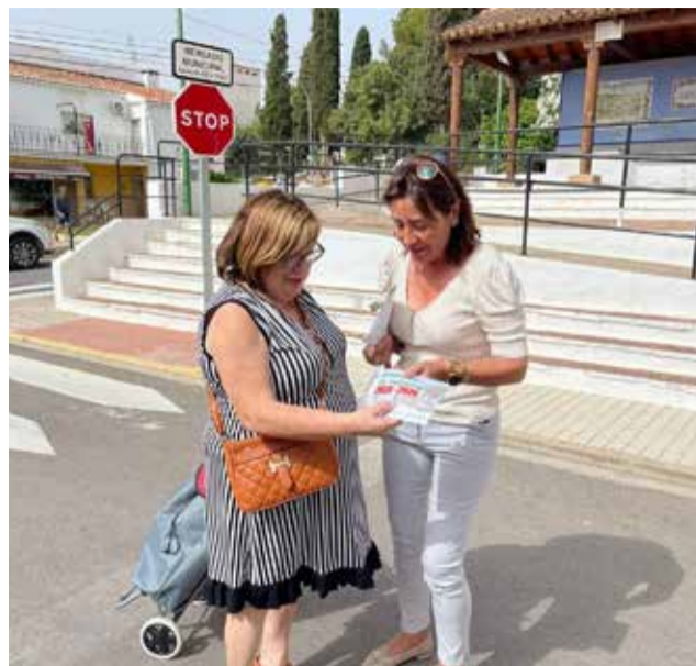
El equipo de gobierno de Loriguilla reparte la guía de rendición de cuentas a vecinos y vecinas.

La guía incluye información sobre el personal, el presupuesto general, la deuda pública, las inversiones, las subvenciones concedidas y solicitadas, así como los teléfonos de interés. También las cuentas de la empresa pública Lorisum.