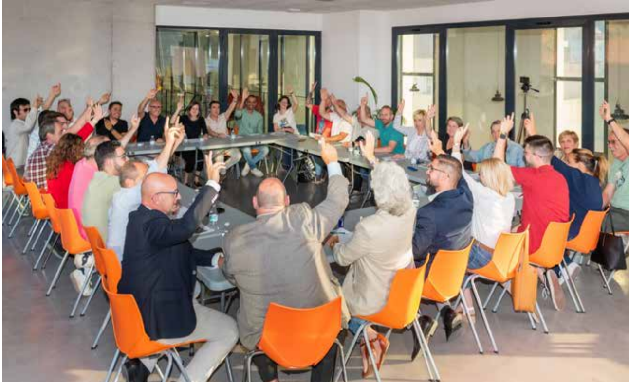
Votación de la declaración en la sala de cristal del edificio Vinyes de Nàquera.

Además de la aprobación de la declaración, durante el encuentro, la concejala de Edu-