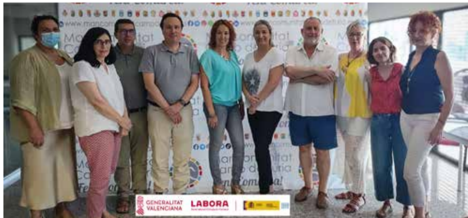
Consell Rector del PACTE Camp de Túria.