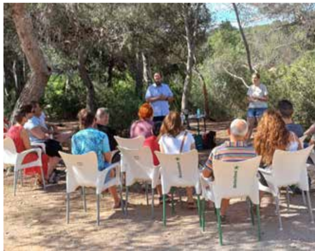
Jornada de reciclatge a Vilamarxant.