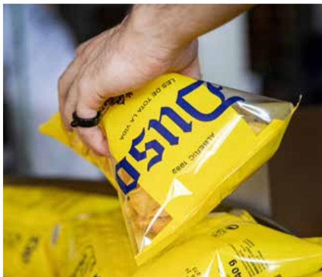
Bolsas de Papas Duso, "Les de tota la vida".

za y los productos naturales y tradicionales de esta zona, con la creatividad de platos de la nueva cocina. Desde su apertura hace ya algo más de un año, se ha destacado por ofrecer una experiencia culinaria excepcional dentro de una ubicación realmente privilegiada, rodeada por la naturaleza y los paisajes únicos que rodean la localidad. Dentro de la carta podemos encontrar una amplia variedad de platos realmente deliciosos y siempre con ese toque único que da una identidad propia a cada bocado. El menú, cuidadosamente elabora-