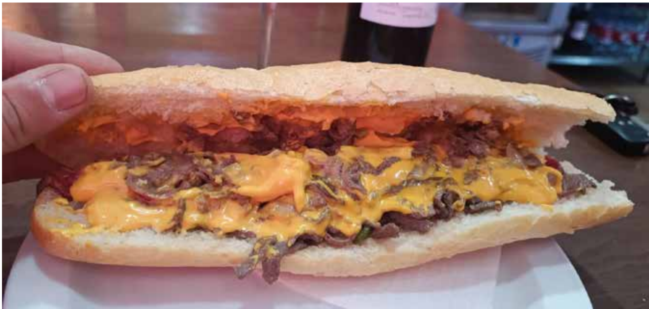
Bocadillo de La Nueva Terraza de San Antonio de Benagéber.