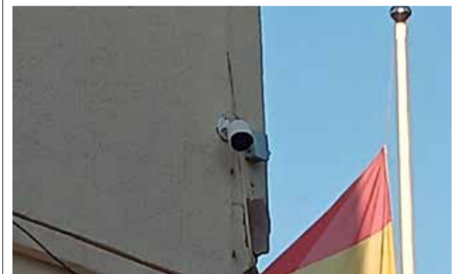
Cámara instalada en Casinos.