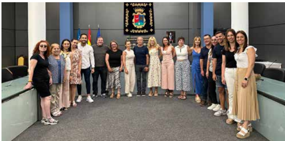
Acto de constitución del Consejo de Salud y la Mesa Intersectorial.