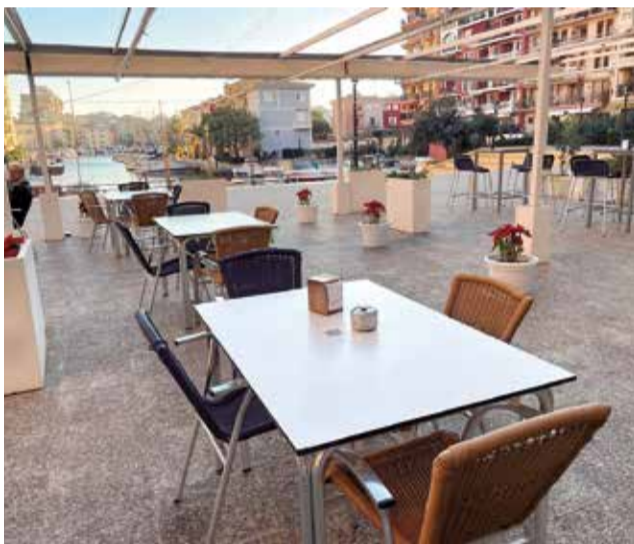
Restaurante Enclave de Mar en Port Saplaya.