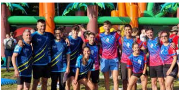
Olimpiadas locales en La Garnache.