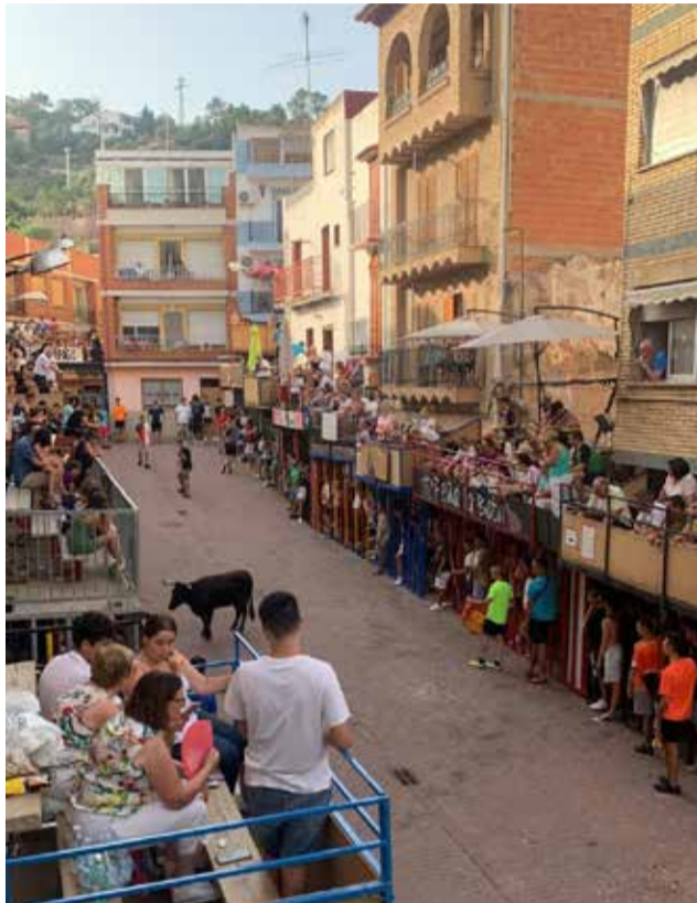
Actos taurinos en el municipio de Gátova.

"La Peña El Tendido, se ha esforzado al máximo durante todo el año para ofrecernos unos festejos con un cartel de toros y vaquillas espectacular", ha añadido el concejal de festejos.