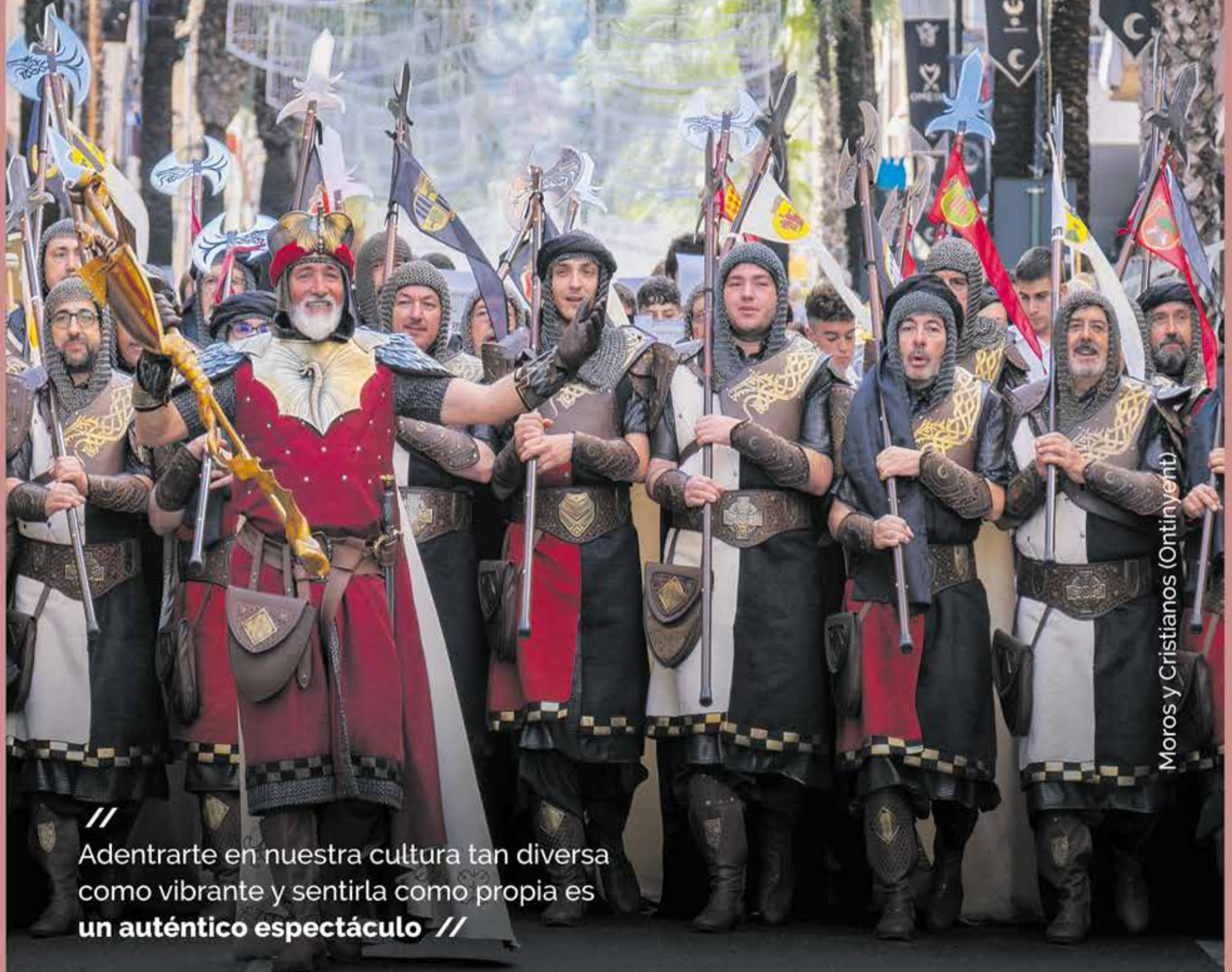
Moros y Cristianos (Ontinyent)

// Adentrarte en nuestra cultura tan diversa como vibrante y sentirla como propia es un auténtico espectáculo //