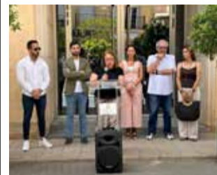
Lectura del manifiesto.