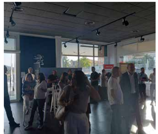
Varios instantes durante la presentación oficial del nuevo Peugeot 3008 en Edauto Benissanó.