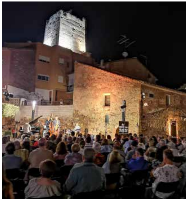
Diversos concerts del IV Festival de Música de Cambra de la Calderona de Serra.