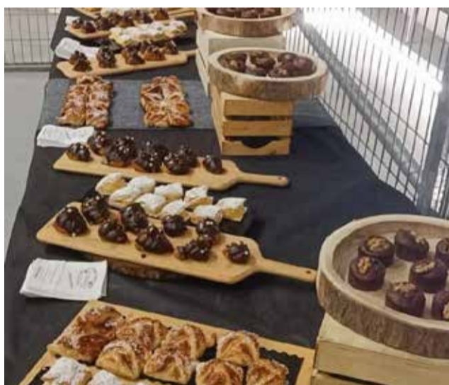
Productos del Horno La Victoria de Sagunt.

Así pues de lunes a sábado, en La Nueva Terraza nos po-