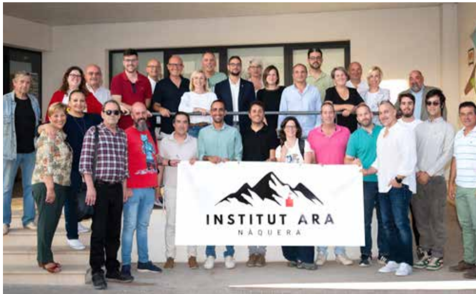
Unión entre partidos políticos y comunidad educativa.

Más de 300 alumnos de Nàquera y Serra se han visto obligados a desplazarse hasta el IES Les Alfàbegues de Bétera durante el último curso