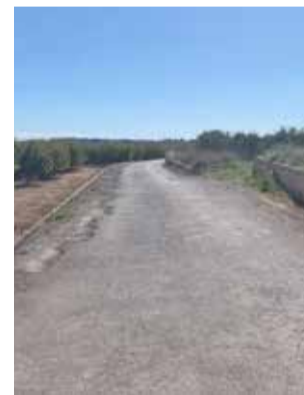
Camino rural.

En cuanto a los viales urbanos se va a proceder al reasfaltado de las calles L'Entrada (N.º 136-154), Almas (N.º 100-130), Llíria (N.º 107-113), Segorbe (N.º 5-13), La Ribera, Poble Vallbona (N.º 14-24), Del Mig (N.º 20-32), Pallises (Acce-