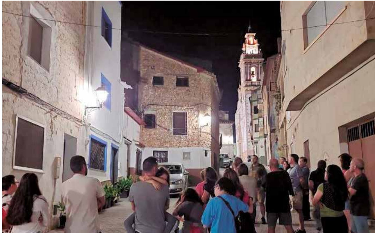
Visita guiada nocturna en el municipio de Tuéjar.

La ciudad ofrece algunos itinerarios para conocer los secretos de la urbe por la noche. Uno de los tours nocturnos más populares es el de 'Misterios y leyendas a la luna de Valencia', el cual parte de La Lonja de Valencia y tiene una duración de 90 minutos. En la actividad, un guía cuenta a los visitantes los misterios, leyendas y enigmas que ocultan las calles y edificios del centro de la ciudad. El tour ofrece precisamente un por la Valencia menos conocida y los enigmas ocultos del cap i casal. Una opción que permite al visitante conocer