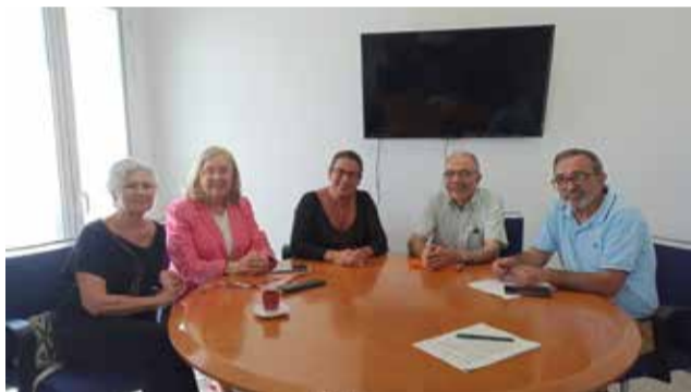
Encuentros con representantes vecinales.

Salud, una infraestructura muy esperada por toda la comunidad.