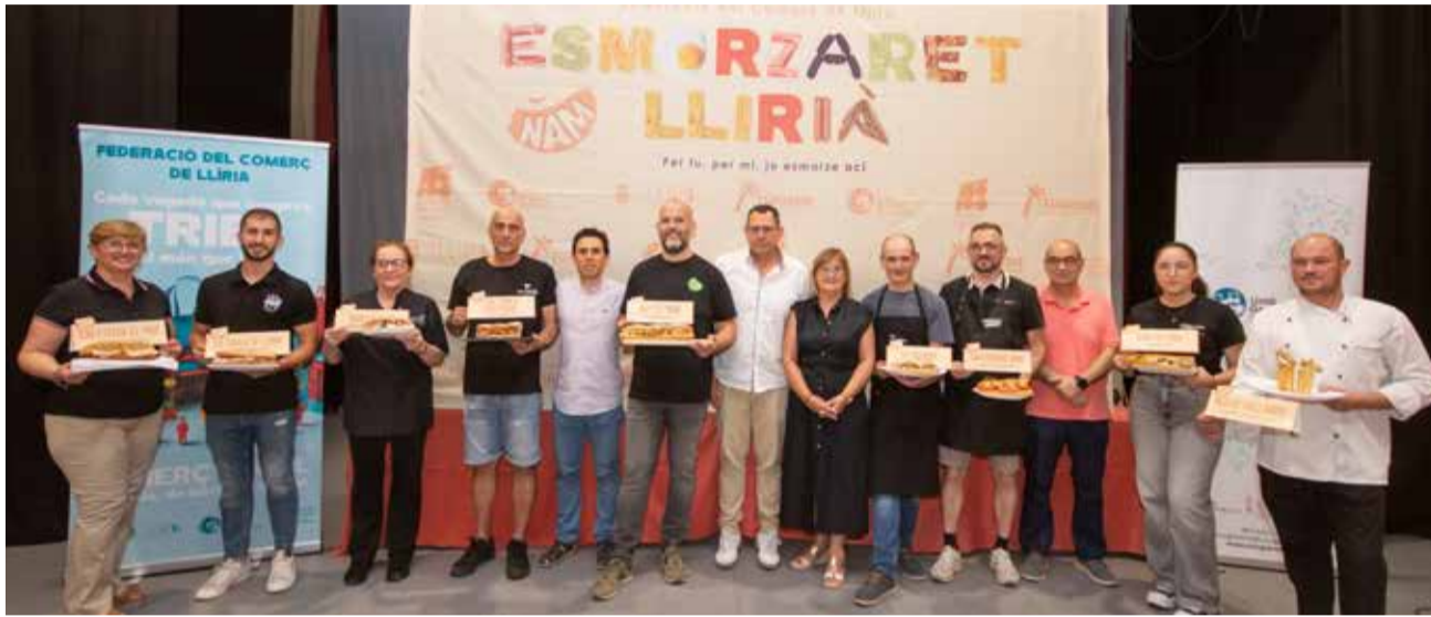
Presentació de la campanya 'Esmorzaret Llirià' a la Llar de les Persones Majors de Lliria.

En este període, els clients que visiten els locals podran