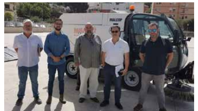
Nueva máquina barrendera en Nàquera.

es "claramente insuficiente", según fuentes municipales, por lo que ya se está trabajando para licitar, en cuanto este venza, un contrato que cubra las verdaderas necesidades del municipio.