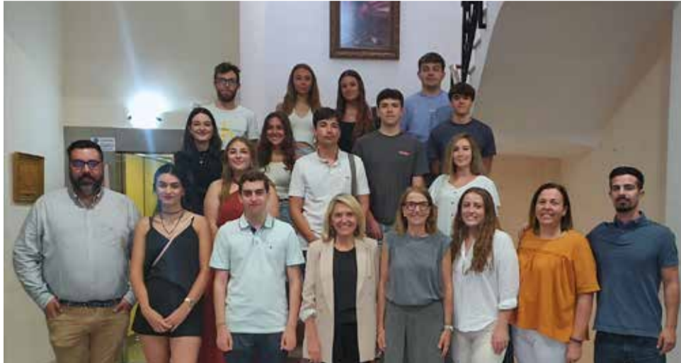
Recibimiento en el Consistorio.