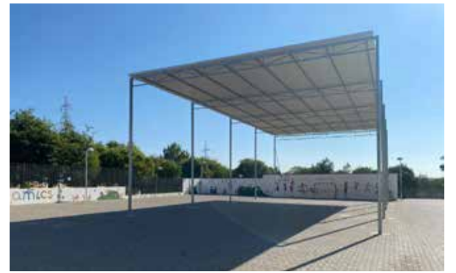
Nueva cubierta en el CEIP 8 de Abril.