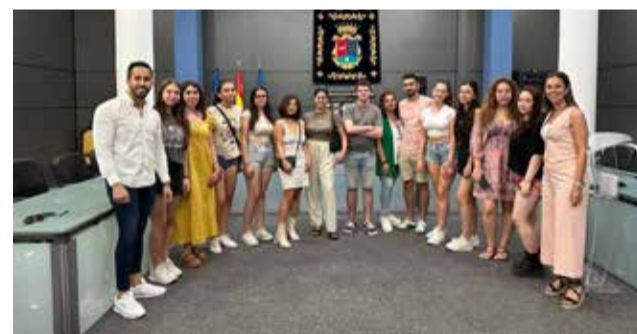
Recibimiento de los alumnos en el consistorio.