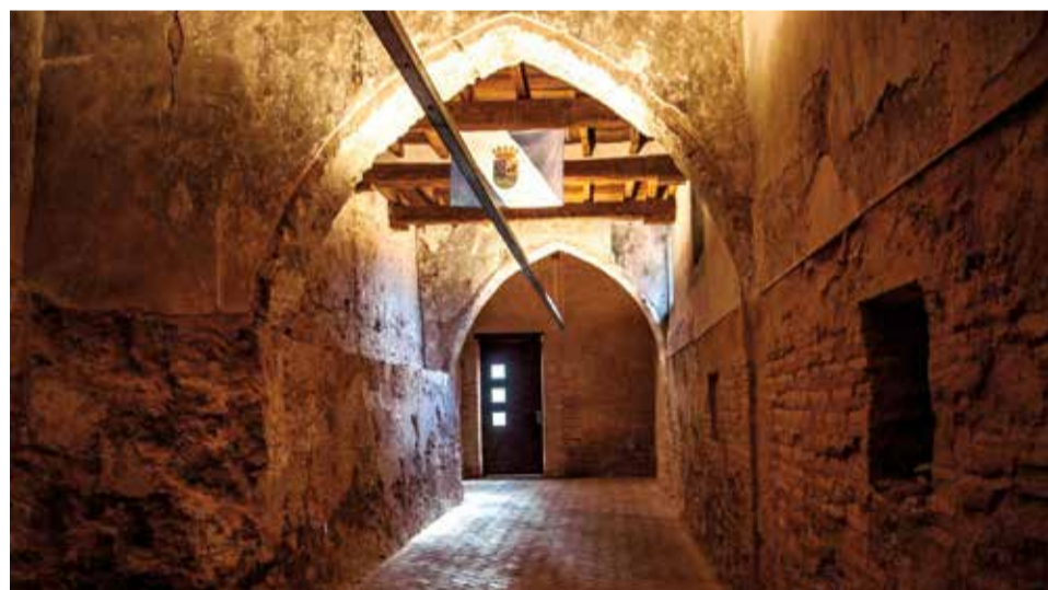
Castillo de Benissanó.

Tuéjar se prepara para una nueva edición de su ya tradicional Ciclo de Visitas Guía-