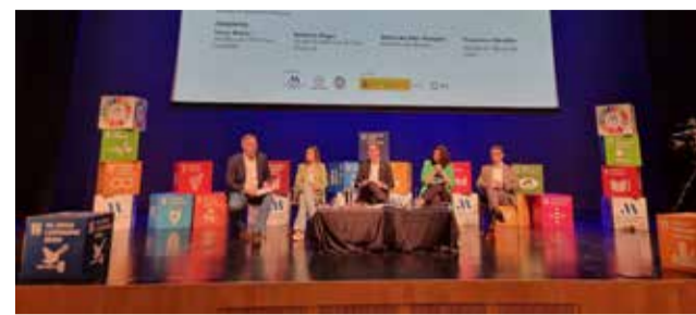
Inici de la campanya en la Fira de les Associacions.