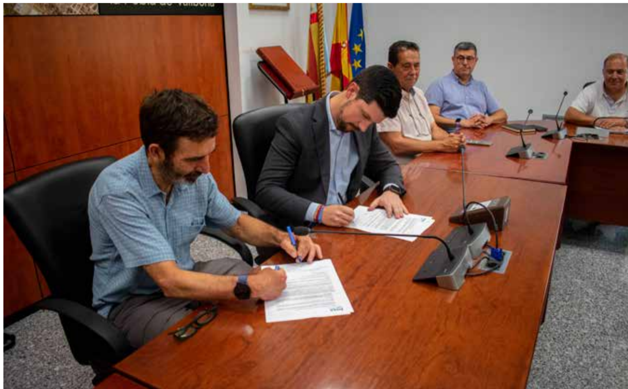
Un instante durante la firma del acuerdo para adquirir el 'Mas Nou'.

"Hemos sentado las bases para hablar de historia de nuestro municipio, ya que al final se trata de la recuperación de un edificio muy emblemático, carismático y que