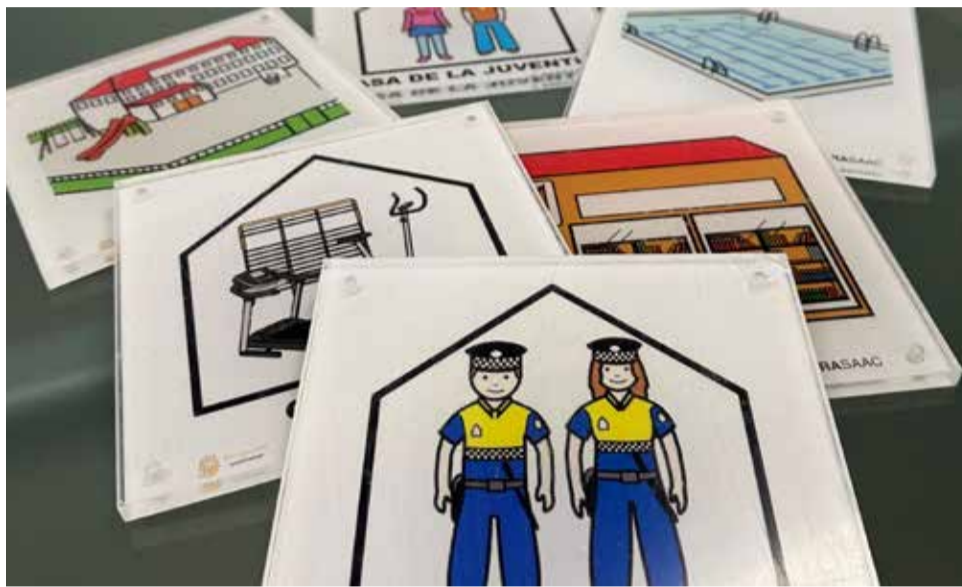
Pictogramas que identificarán diferentes espacios de Benaguasil.

En total serán 20 las señalizaciones que se colocarán en las puertas de edificios como el Ayuntamiento, el retén de policía local, los edificios culturales y deportivos pero también en otros lugares como los centros escolares,