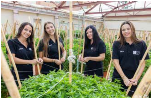
Las Obreras de Bétera en la "desullà".

Un trabajo que consiste en ir quitando las “flores” de las majestuosas plantas para que