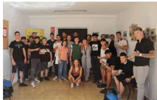
Estudiants del PFQB Camp de Túria.

d'Operacions Auxiliars de Manteniment de Carrosseria de Vehicles i un altre d'Operacions Auxiliars de Manteniment en Electromecànica de Vehicles. El professorat dels dos cursos ha proporcionat una formació integral amb una duració total de 960 hores.