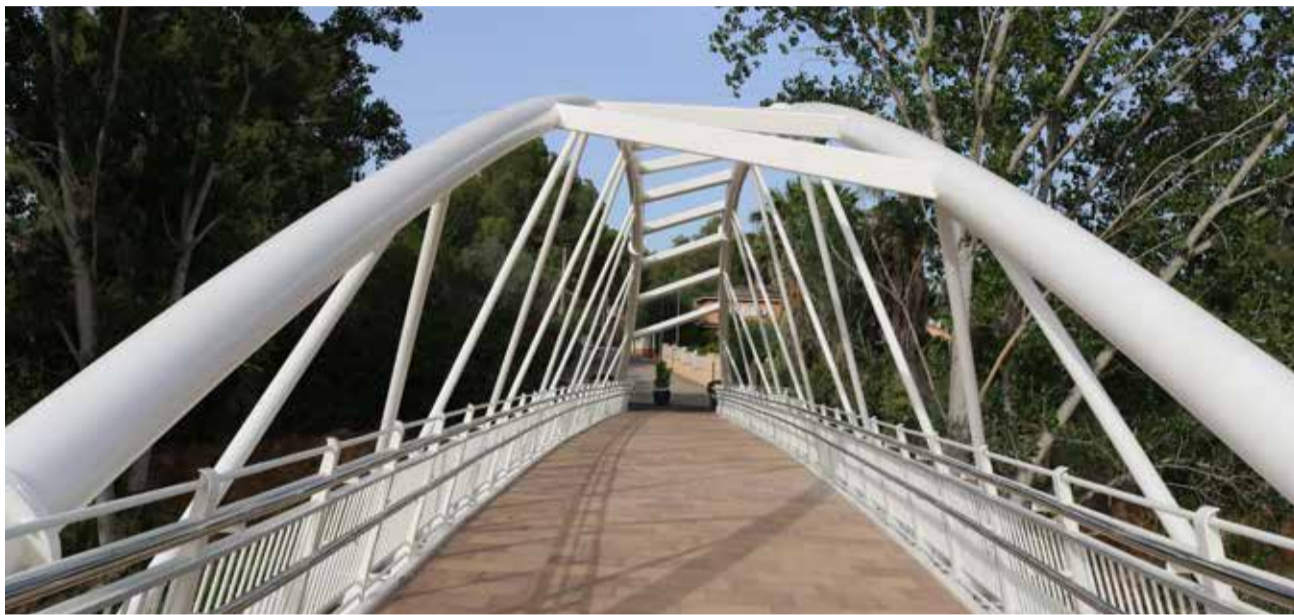
Nueva pasarela sobre el Barranco de Mandor de Riba-roja de Túria.

LA INFRAESTRUCTURA UNE LAS URBANIZACIONES DEL NORTE CON LA ESTACIÓN DEL CLOT