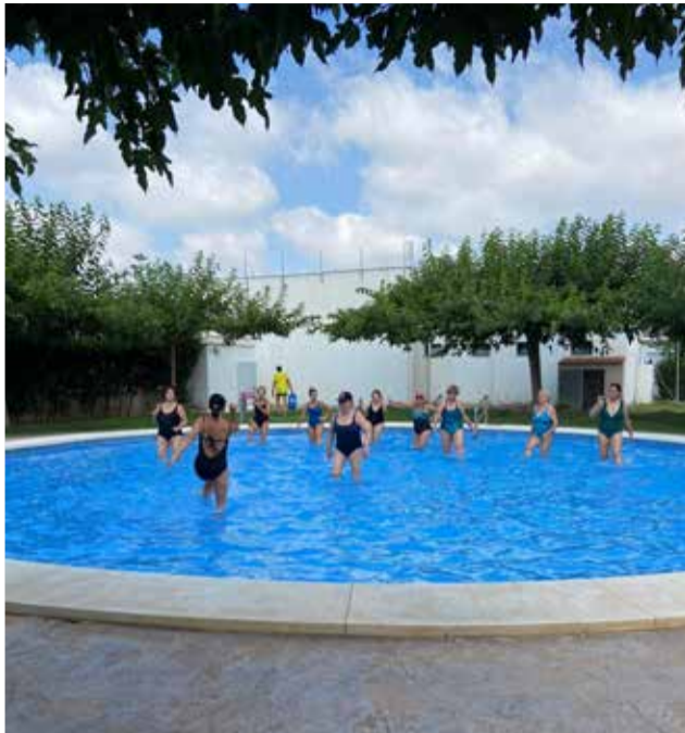
Diferentes actividades de la Semana Deportiva de Domeño, que se celebra en julio.

De esta forma, los participantes pueden disfrutar practicando deportes como natación, fútbol, frontón, aquagym, ping pong, paseo en bici, senderismo y petanca, sin olvidar el tradicional lanzamiento de hueso de oliva y azada, pero también jugando al parchís, dominó, guiñote, ajedrez y fútbolín.