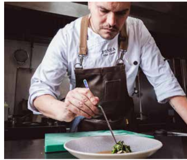
Chef del restaurante Pinea de Ayora.

Además, destaca su servicio de catering, ya que son especialistas en la organización de eventos y celebraciones, con la creación de productos fabricados de manera tradicional, con la par-