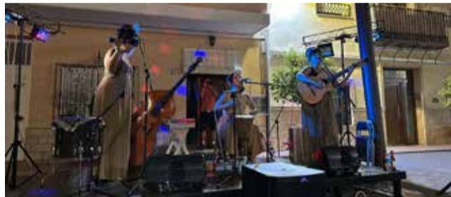
Concert de Doña Manteca. / EPDA

En la novena edició del Festival En Viu, que compta amb la subvenció i el suport de la Diputació de València i de l'Ajuntament d'Olocau i que organitzen la Regidoria d'Educació, Cultura i Joventut i l'associació Sincronies, actuaran el trio de veus Doña Manteca (5 de juliol, en la Plaça Major), l'orquestra de salsa Plena 79 (12 de juliol, en el parc 'La Deseada' de La Lloma), el grup de folk Besarabia (19 de juliol, en el parc 'Els Pins' de Pedralvilla) i la cantautora i compositora valenciana Ana Zomeño (26 de juliol, en la Plaça Major).