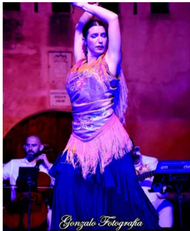
Diverses actuacions del Festival Internacional de Música de Benissanó.

la qual s'ha pogut veure una formació tan inusual com un grup de cinc arpes, provinents de Barcelona i València o el duo de guitarra i veu que tant va agradar al públic assistent a la terrassa del Castell.