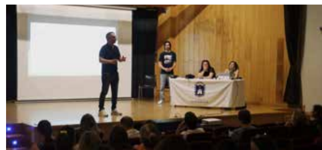
Reunió a la Casa de la Cultura de Vilamarxant.