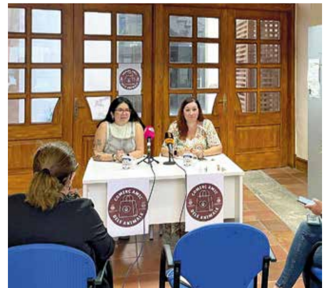
Les regidores de Comerç i Salut i Benestar Animal.

Les regidories de Comerç i Benestar Animal enceten una campanya per a identificar comerços que permeten l'entrada de mascotes