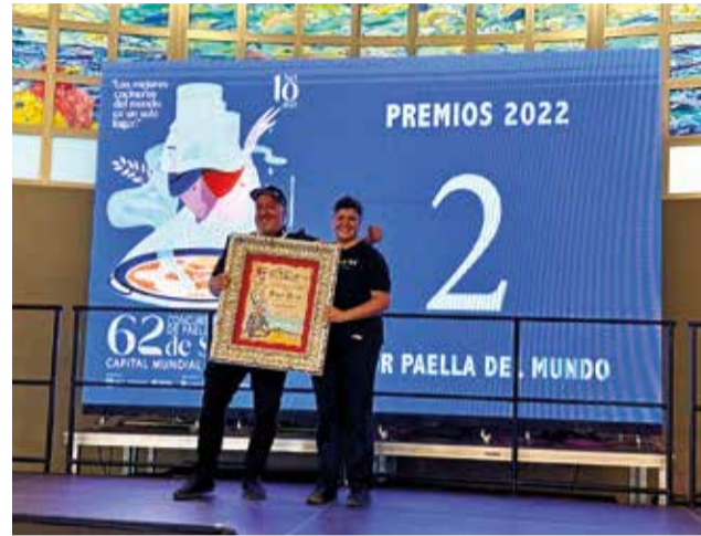
Els guanyadors del segon premi.