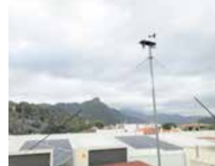
Estació meteorològica. / EPDA