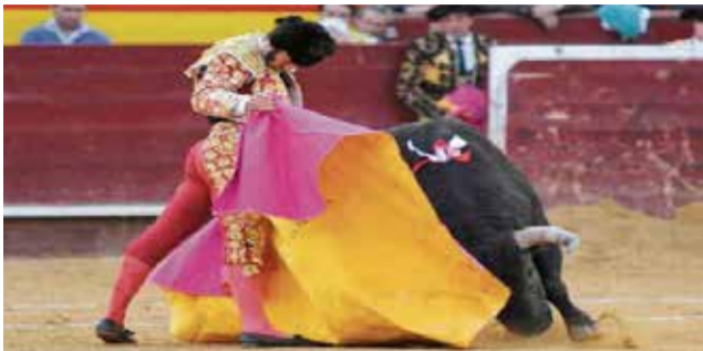
Morante de la Puebla en Valencia.