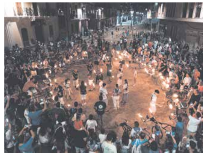
Concentración carretones embolados.