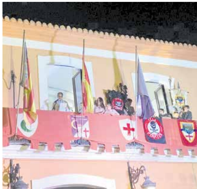
Pregó de Moros i Cristians 2022 de Villalonga.

El diumenge 8 es podarà fi a la programació de Moros i