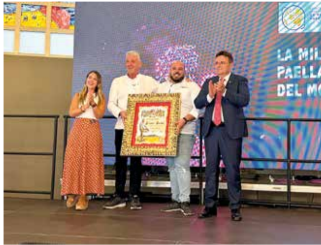
Primer premi del concurs de paella.