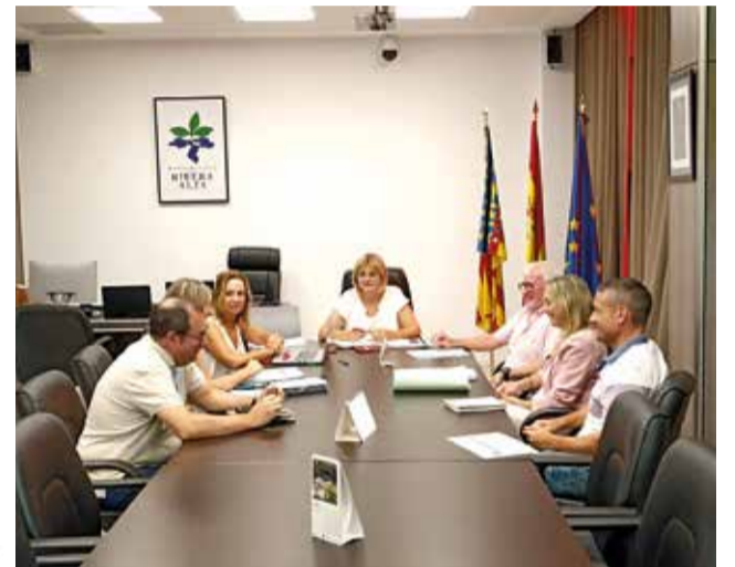
Primera reunió a la Mancomunitat.

com estratègica, a tots els municipis. I també volem acostar la Mancomunitat a totes les localitats, per a que els serveis es donen de veritat en tots els llocs i que arriben de veritat, que siga itinerant, oberta i haja participació. M'agradaria molt comptar amb