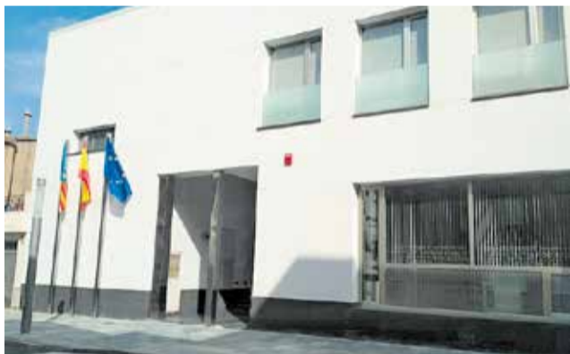
Edifici consistorial del Real de Gandia.