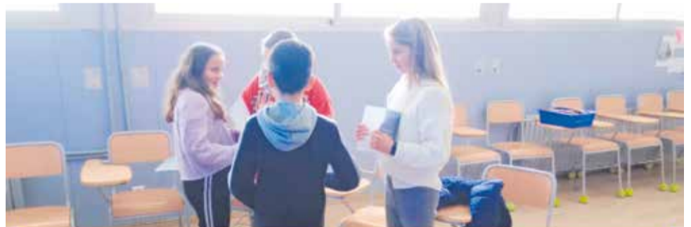
Equip energètic de l'escola (dalt) i una de les sessions formatives (baix). / EPDA