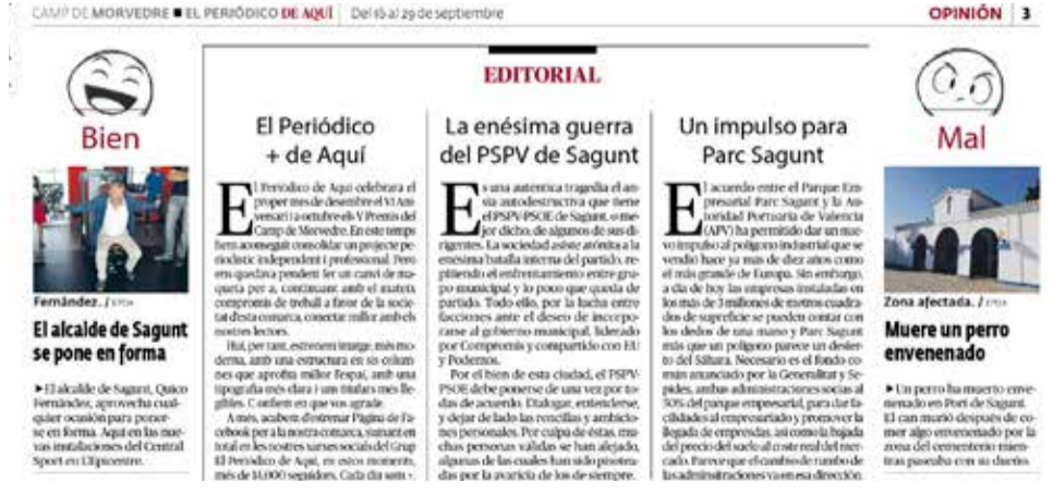
Editorial publicado el 16 de septiembre de 2016.

fer un canvi de maquera per a, continuant amb el mateix compromís de treball a favor de la societat d'esta comarca, conectar millor amb els nostres lectors. Hui, per tant, estremem imatge, més moderna, amb una estructura en sis columnes que aprofita millor l'espai, amb una tipografia més clara i uns titulars més llegibles. Confiam en que vos agrade".