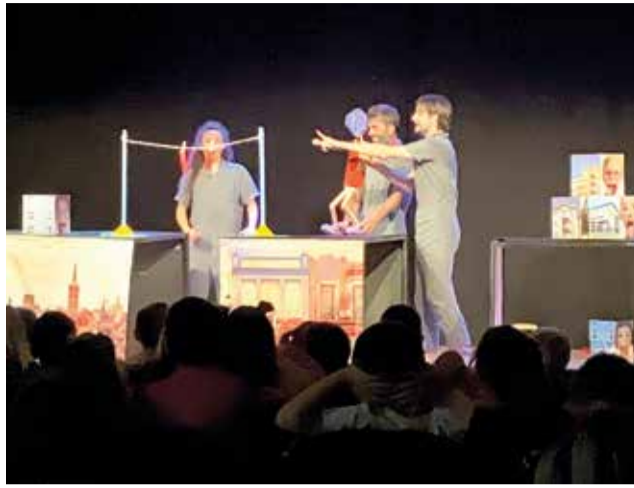
Una de les obres teatrals a Montserrat.

Per als adults esperem puguen gaudir, gratuïtament fins cobrir