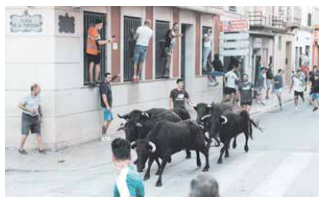
Encierro de vaquillas matinal del día 9.