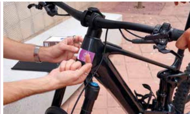
Campanya 'L'Alcúdia amb bici'.