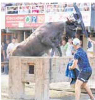
Toros en Segorbe.