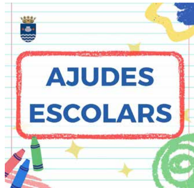
Cartell informatiu de les ajudes.

El termini de presentació de sol·licituds es tanca el divendres 13 d'octubre