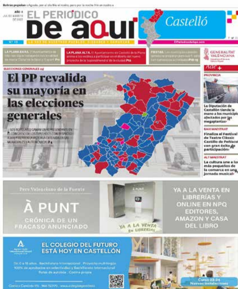
Esta es la tercera y actual cabecera de El Periódico de Aquí.