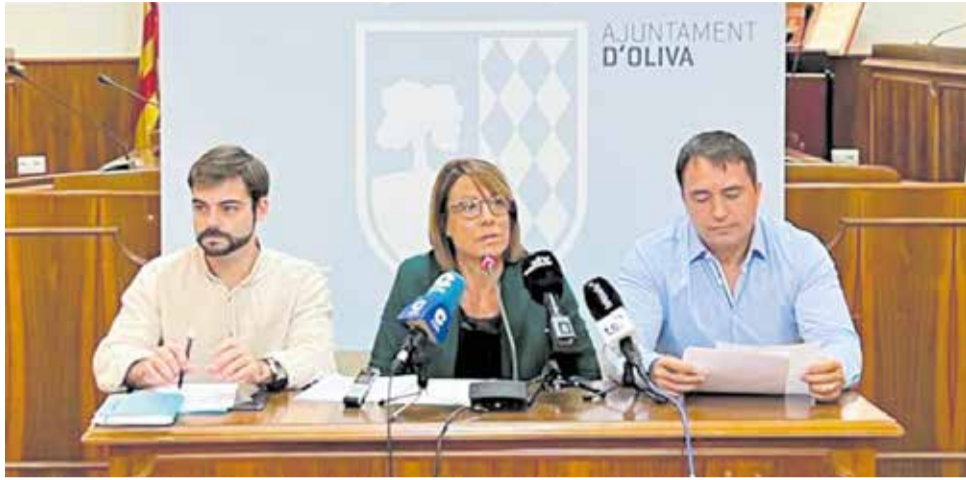
Roda de premsa del balanç de la gestió del govern d'Oliva.