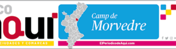
Periódico de Aquí. / EPDA