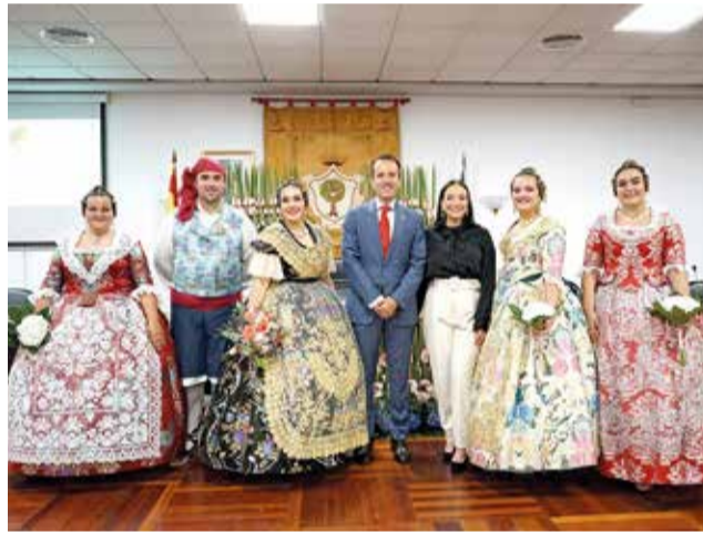
La Fallera Major amb la seua Cort d'Honor.