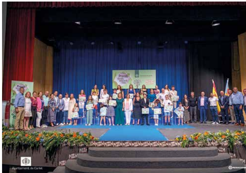
Tots els guardonats i guardonades.