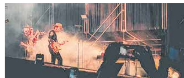
Actuaciones de Vetusta Morla, Arde Bogotá y Leiva en el Mediterránea Festival 2023.

vivir la frescura e ilusión de los festivales (su fraternidad y alegre peregrinación) con la nostalgia y cariño del ambiente entrañable, que impregnaba las fiestas populares, donde participaba todo el mundo, niños, adultos y mayores.