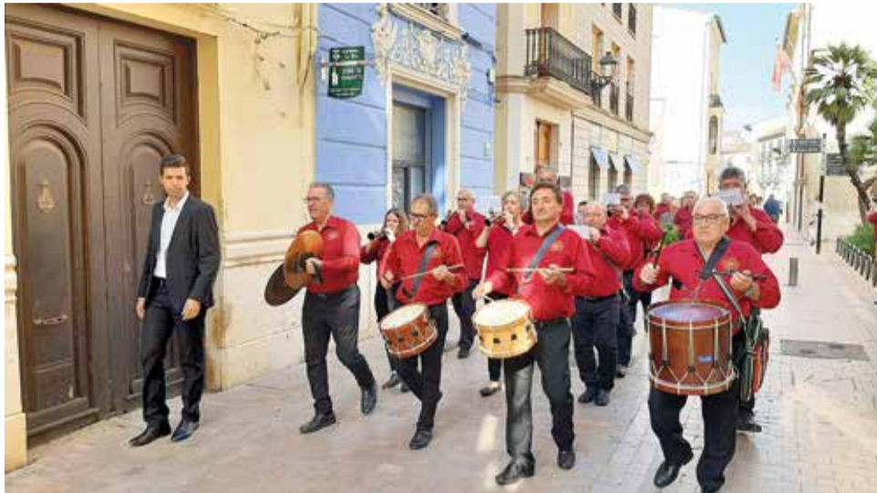
Celebració del 9 d'Octubre a Alzira.

La Fúmiga tornarà a tocar un any més en este concert, del qual ja són uns clàssics. També estarà a l'escenari la frescor de Maluks, tres valencianes i una manxega residents a Benimaclet. La formació arriba a Alzira després