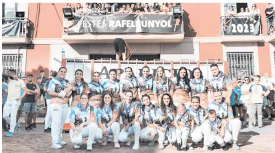
Las integrantes de Centre 2023.