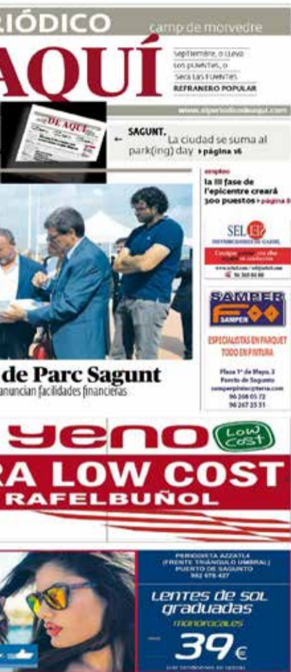
Camp de Morvedre estrenó diseño.