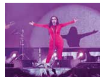
Diferents instants durant els actes de la Fira i Festes 2023 de Gandia.