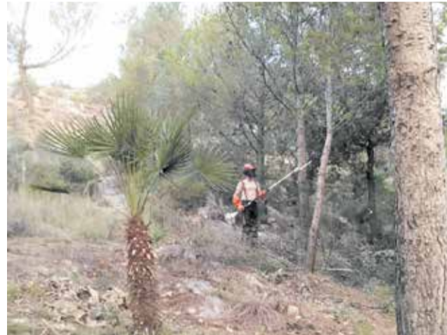
Un treballador de la brigada de Benirredrà.