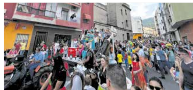
Actes de les festes d'octubre de Villalonga 2022.

de focs d'artifici, orquestra i macrodiscomòbil.