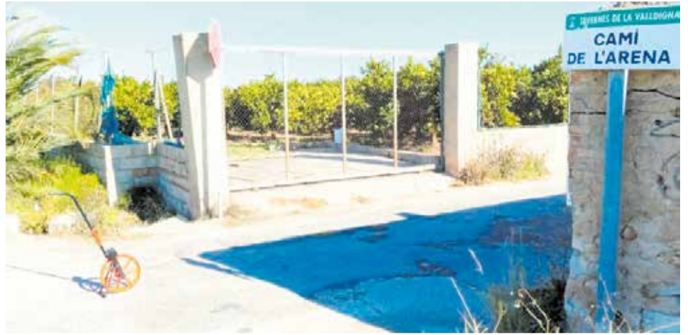
Camí de l'Arena de Tavernes de la Vallidigna.