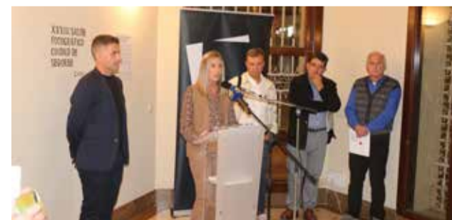
Inauguración de la exposición.