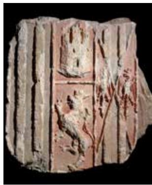
Escudo ducal.