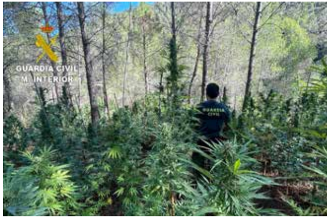
Detenida una persona.

En el momento de explotación de la operación se detuvo a un varón que se encon-