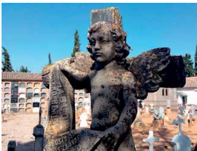
Cementerio de Requena.

nicipal, los asistentes pueden ir descubriendo cada uno de los 12 tótems, con códigos QR, que incluyen una pieza audiovisual diferente, con una perspectiva propia sobre el horror que supuso esta etapa funesta para la población civil. La ruta termina en el eje central del cementerio, donde está instalado el memorial. Un monumento hecho con una mezcla de arcilla y botánica, pero, especialmente, con el material más importante de todos: la convicción de reparar el recuerdo de aquellas personas asesinadas de forma inhumana e injusta.