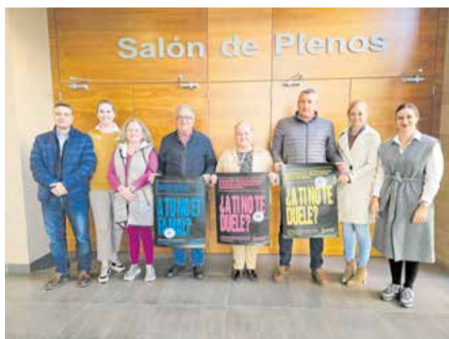
Cartel de la campaña del 25N de la Generalitat.

"Aunque en nuestro país se han logrado grandes avances en la lucha contra la violencia a las mujeres en las últimas décadas, es cierto que todavía hay una gran desigualdad y violencia ejercida