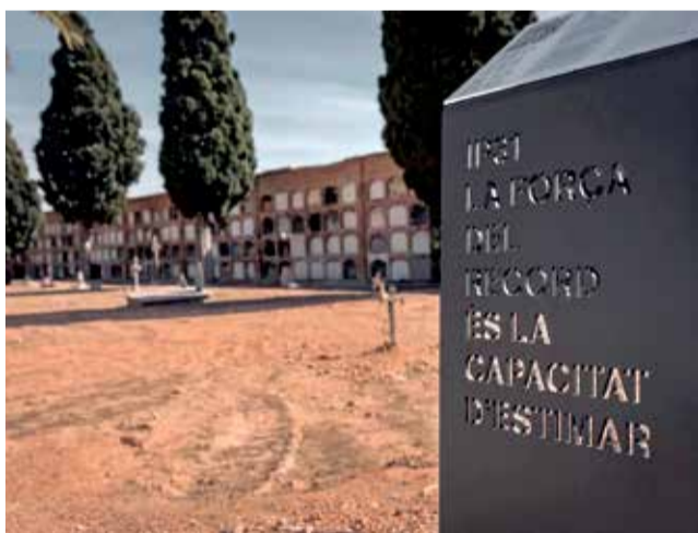
Campo santo de Liria.

Tan sólo en la puerta de entrada, una inscripción en árabe, entre los barrotes de hierro forjado, deja constancia de sus tumbas.