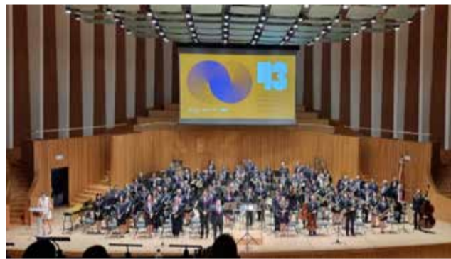
Actuación de la banda de Jérica en Valencia