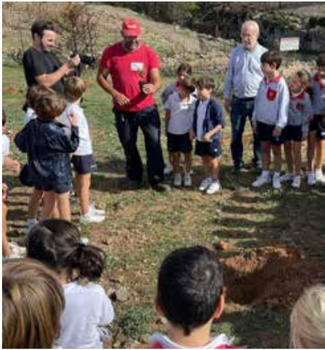
Primeros alumnos del proyecto.

De una catástrofe ha nacido un proyecto medio ambiental, donde se educa a los niños y personas participantes, en dos aspectos, uno las consecuencias de no cuidar la naturaleza con la destrucción que ello supone y el segundo aspecto más relevante, educar y hacer creer que las personas somos actores y promotores en la construcción de un mundo mejor a través de la repoblación y cuidado de este espacio natural.