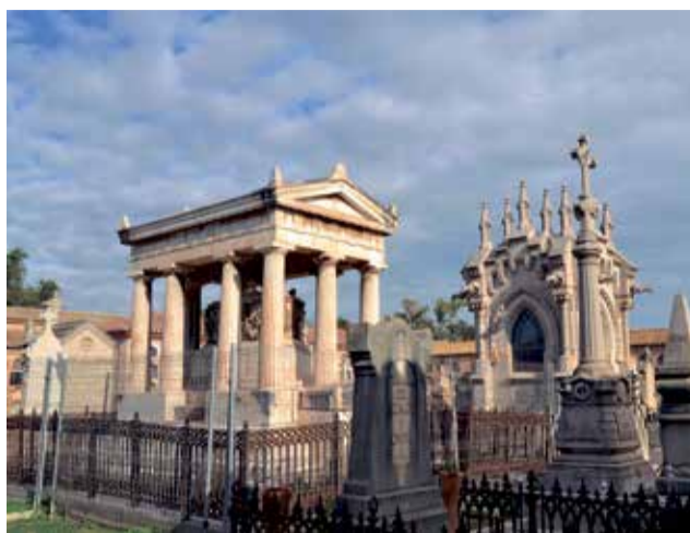
Cementerio General de Valencia.

y de memoria histórica. Entre sus paredes hay documentadas más de 150 fosas, con al menos 2.237 personas que fueron asesinadas por la dictadura entre 1939 y 1956. Por esta misma razón, se está tramitado su consideración como Bien de Relevancia Local, junto con el llamado Paredón de España (el Terror), el lugar a escasos metros del camposanto en el que fueron fusilados miles de presos, y el Camí de la Sang, que une ambos puntos y que recibe su nombre por el reguero de sangre que dejaba el traslado de los cuerpos. Desde 2016 se han sucedido hasta una veintena de exhumaciones de fosas comunes, identificaciones por ADN y la devolución de los restos de represaliados a sus familiares, que han