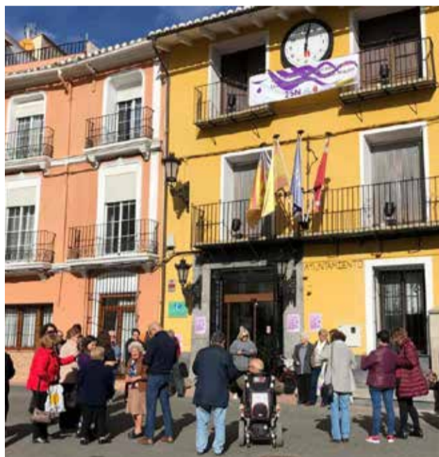
Concentración en Castellnovo.

El Ministerio de Igualdad, por medio de la Delegación del Gobierno contra la Violencia de Género, quiere recordar que el teléfono 016, las consultas online a través del email 016-online@igualdad.gob.es, el canal del WhatsApp en el número 600 000 016 y el chat online, accesible desde la página web violenciagero.igualdad.gob.es/ , siguen funcio-