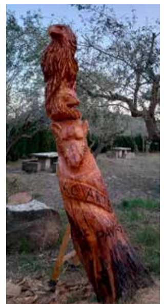
La talla robada.

Con la paciencia que da la sabiduría y el arte de sus manos, transformó el viejo árbol en una figura en la que aparecían representadas las cabezas de un jabalí, un zorro y un águila, tres animales muy comunes por los bosques que circundan esta fuente que aflora sus aguas junto a la pista que desde Pavías lleva a Matet por el corazón del Parque Natural de la Sierra Espadán, y que con es-