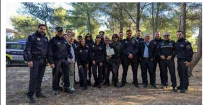
Policía Local de Segorbe con el homenajeado.