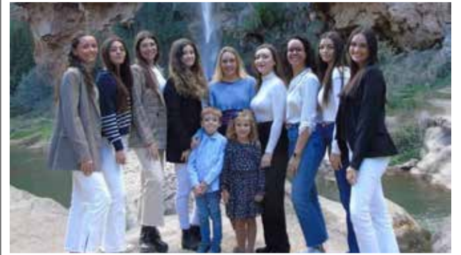
La corte de honor con la reina./ EPDA