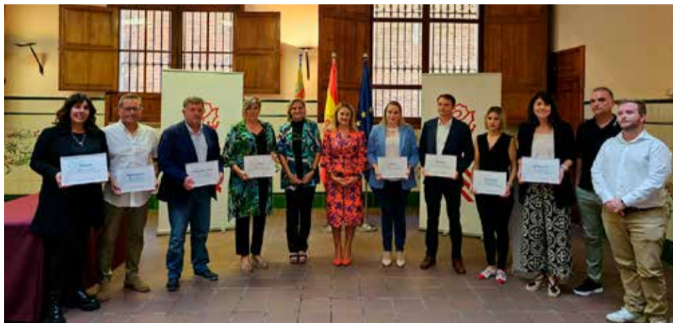
Representantes de Altura, Navajas y Villahermosa con los distintivos

Nuria Montes ha querido poner en valor el trabajo que realizan los ayuntamientos para lograr ser reconocidos como Municipios Turísticos de la Comunidad Valenciana. Para la Consellera "estos distintivos nos ayudan, como destino, a ser más competitivos y a generar mayores oportunidades económicas". Asimismo, Montes ha mos-