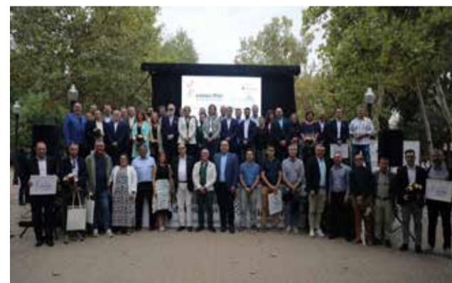
Entrega de las 'Flores de Honor'.