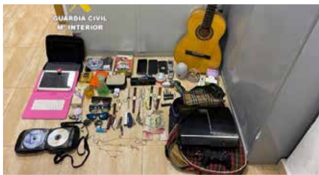
Objetos hallados en la investigación.