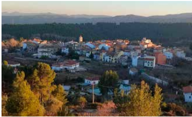
Vista general de Benafer.

Y es que desde el consistorio se ha detectado que en los últimos años existe un claro descenso de la población, "hecho que implica graves consecuencias para el Municipio ya que puede llegar un momento en que la escasa población impida atender unos servicios públicos adecuados y dignos, por otra parte, imprescindibles en los tiempos actuales. Y no disponiendo de los servicios aludidos, aún se incrementará más la tendencia a no residir en la localidad" ha señalado su alcaldesa. Sara