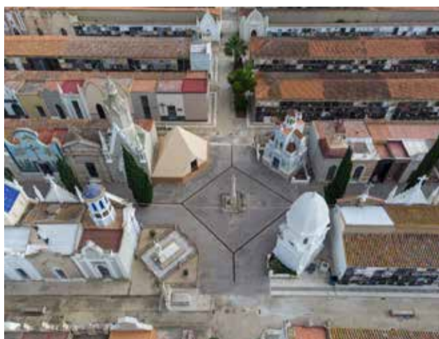
Vista aérea del cementerio de Catarroja.