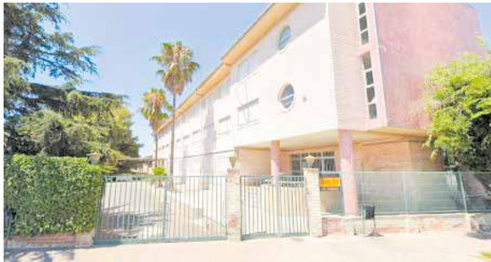
El Instituto José Vilaplana de Vinaròs en la actualidad.