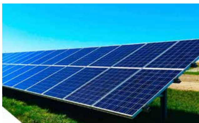
Se colocarán en edificios municipales.

La instalación en concreto ayudará a rebajar significativamente la factura de energía eléctrica del Ayuntamiento, uno de los mayores lastres de la hacienda municipal. Además, el uso de este tipo de energía limpia responde a los valores de la Agenda 2030 que el Ayuntamiento se comprometió a cumplir según un acuerdo plenario.