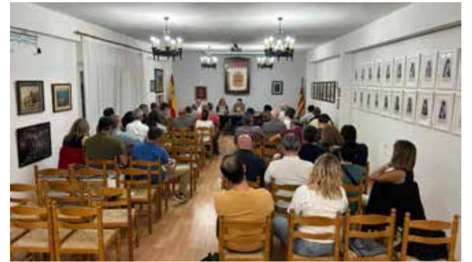
Sesión plenaria en Torás.

El pleno acordó la composición de la Junta de Gobierno, que tendrá una representación proporcional de los tres grupos políticos conformados en la entidad y en la que también se ha procurado dar cabida a la totalidad de los 28 municipios integrados en la Mancomunidad.