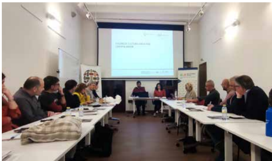
Se estudiarán proyectos innovadores en el medio rural.

Las jornadas de Acción Rural se han planteado como un foro de debate y colaboración en busca de sinergias y apoyo mutuo de los proyectos más destacados del interior de las comarcas de Castellón. Desde la organización se ha pretendido poner en común las diversas experiencias y diseñar estrategias comunes para construir una nueva ruralidad. Para conseguirlo, se han realizado diferentes rondas de presentaciones en las cuales los responsables de ca-