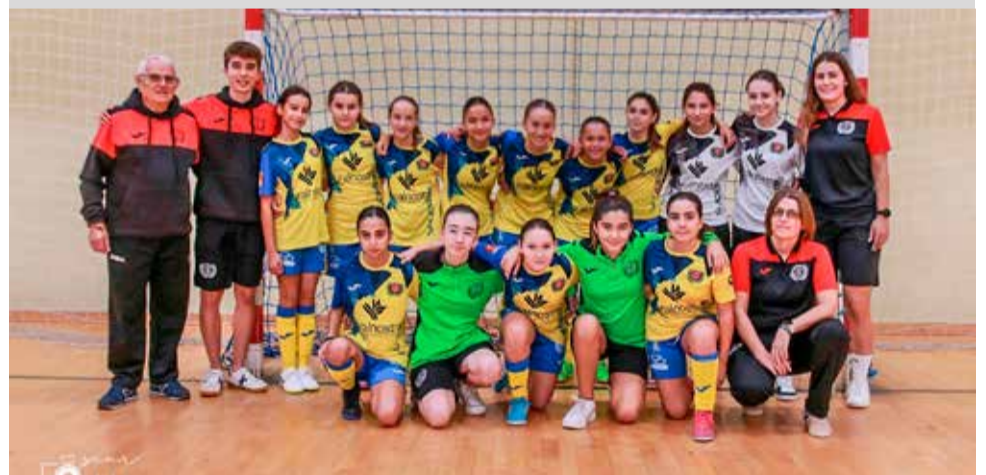
► Primer encuentro oficial del equipo femenino del CDFS Segorbe y lo hizo por todo lo alto, con una espectacular victoria por 5-3 ante el Alzira FS.