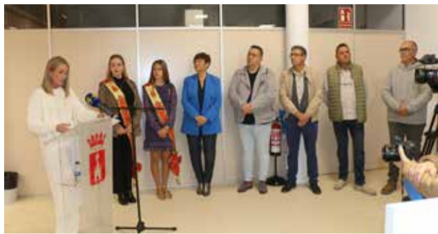
Reinas y autoridades en la inauguración.