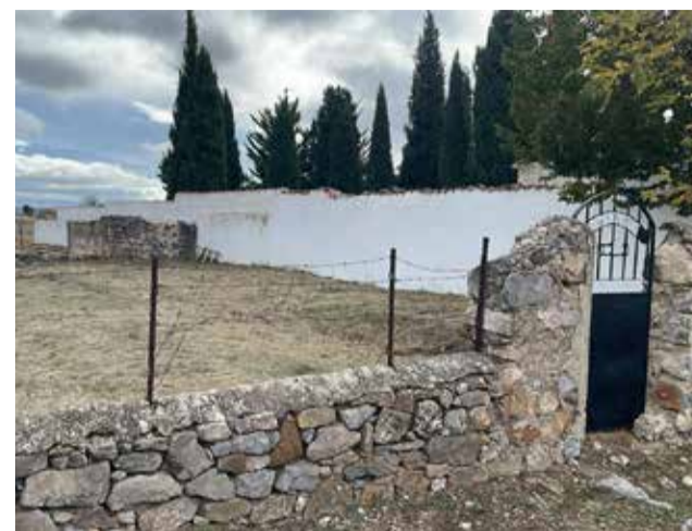
Cementerio moro de El Toro.

sias de la que se conserva el rótulo, además de un osario separado del recinto sagrado para los enterramientos 'fuera del catolicismo'. Las leyendas son habituales en los camposantos y Catarroja no es una excepción, entre los ilustres que descansan entre sus paredes está el joven escritor y poeta Bertomeu Llorens, enterrado en el panteón familiar con sus títulos de filosofía y letras entre sus manos en 1946, y al que los estudiantes de la localidad suelen dejarle ofrendas cuando llega la época de exámenes. También yace el cuerpo del torero Antonio Carpio, que fue trasladado embalsamado en 1922, siete años después de morir por una cornada en la plaza de toros de Astorga.