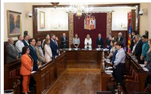
Pleno de la Diputación.