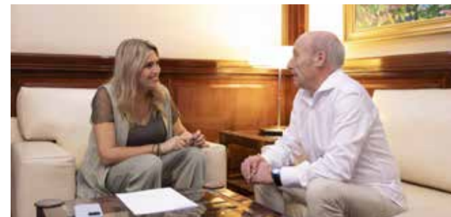
Barrachina con el alcalde de Toga.