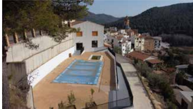
Lona azul en Espadilla.

Desde entonces, el IVAM ha organizado sucesivas salidas para conocer las diferentes propuestas artísticas, los lugares y las personas que los acogen. Dos años después de los primeros pasos, celebramos un nuevo encuentro para visitar las intervenciones en tres de estos pueblos y, de la mano de los artistas, volver a conversar con sus habitantes.