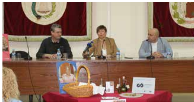
Presentación de las jornadas.