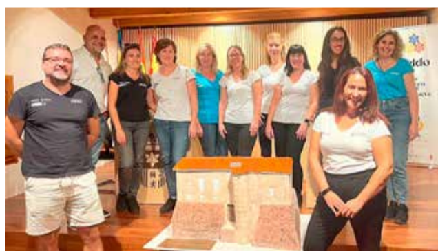
El alumnado presentó la maqueta