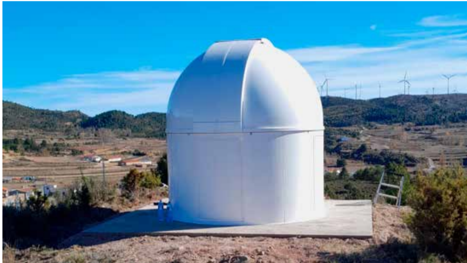
El observatorio con las obras terminadas.

Este observatorio se haya lejos de cualquier foco de contaminación lumínica y con una amplia visión del firmamento que unido a la altitud de la población a más de 1.1000 ms.n.m hacen de