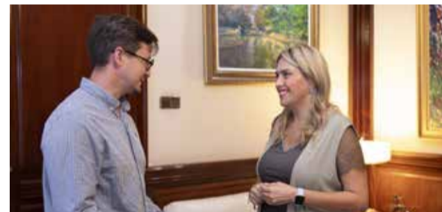
La presidenta con el alcalde de El Toro.