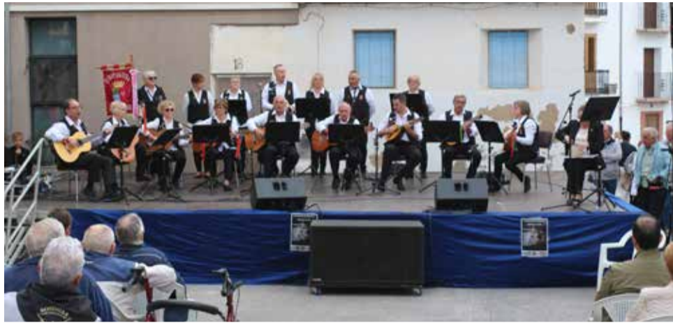
La Rondalla de Soneja en plena actuación

A lo largo de la mañana del citado día se realizó un desfile de todos los grupos, por las calles más céntricas de la localidad y la imposición de banderines que tuvo lugar en la plaza del Rosario que, a rebose de público, escuchó las cinco primeras intervenciones a cargo de la Rondalla de Castellnovo (C), La Agrupación Folclórica 'El Portal' de Sarrión (T), la Rondalla 'Raíces de Gátova' (V), la Ronda-