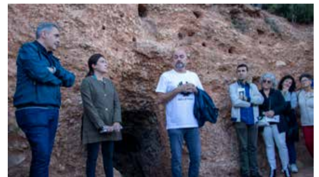
Forma parte del patrimonio bélico de Soneja