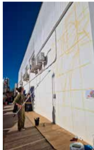
Trabajo en el mural.

Las actividades de sensibilización ciudadana seguirán las siguientes semanas, con acciones relacionadas con la conmemoración. El 29 de noviembre y el 1 de noviembre se realizará el taller 'Del afecto a los mitos', destinado a usuarias del Programa de Itinerarios de Inclusión Social, en el que se abordará la manera en que la creencia del amor romántico crea dificultades en la vida personal y en las relaciones con otras personas. La intención del taller es propiciar un espacio de debate y reflexión entre mujeres en el que, con plena confianza, puedan dar su visión sobre las relaciones afectivas que han vivido u observan a su alrededor.