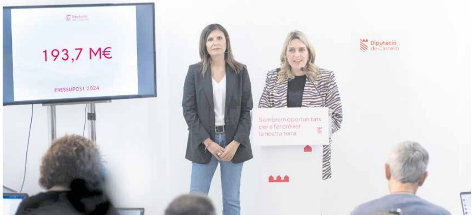
La presidenta de la Diputació, Marta Barrachina (dreta), i la vicepresidenta, M a Ángeles Pallarés (esquerra), presenten els comptes.

Respecte als recursos per a donar resposta a les necessitats, este epígraf aconseguix els 16.255.907,67 euros i engloba, d'una banda, Diputació Resol (1.785.373 euros), que inclou un pla de transició energètica consistent en la instal·lació de fonts d'energia