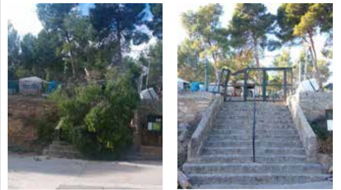
Pino sobre la escalera y daños en la puerta.