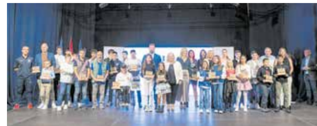
Premiados y autoridades en la XII Gala del Deporte.