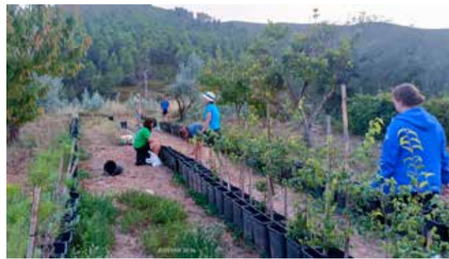
Una de las actuaciones del taller de empleo / EPDA