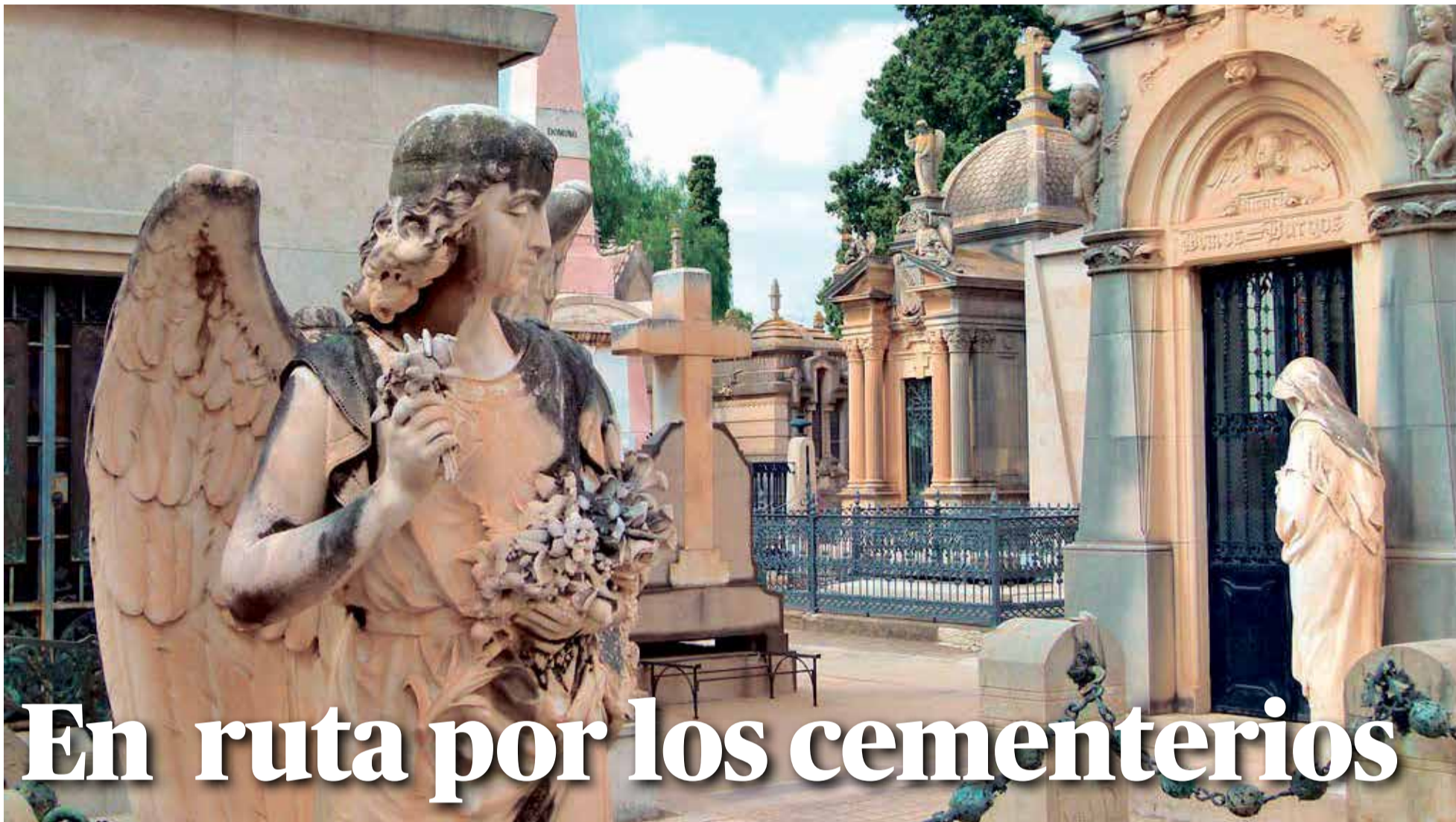
Panteones neoclásicos del Cementerio General de Valencia, designado como el mejor camposanto de España.