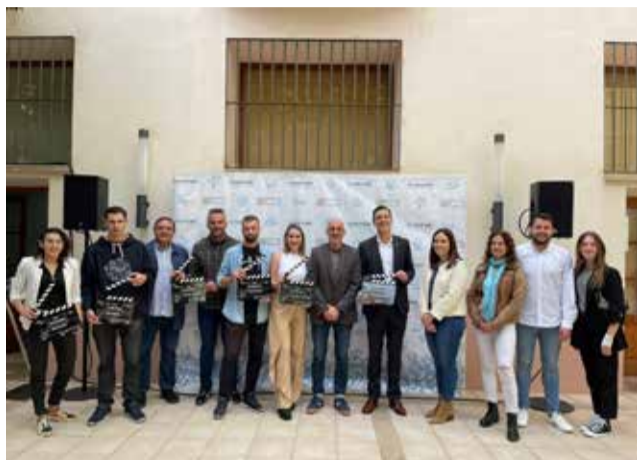
Azuébar y Zucaina entre los seleccionados.

El diputado de Cultura, que estuvo acompañado por el director del festival Sergi González, ha reconocido que "la provincia de Castellón es tierra de artistas y tenemos que darles las herramientas