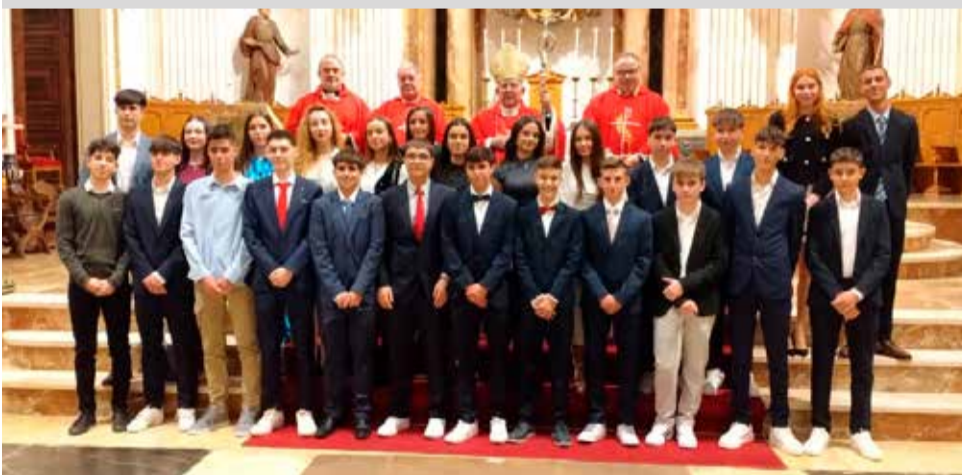
► Más de una veintena de jóvenes recibieron en la Catedral-Basílica la confirmación por parte del Obispo, Casimiro López Llorente que cumplía 73 años.