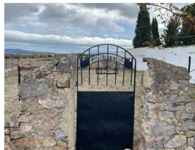
Puerta de acceso al cementerio moro de El Toro.