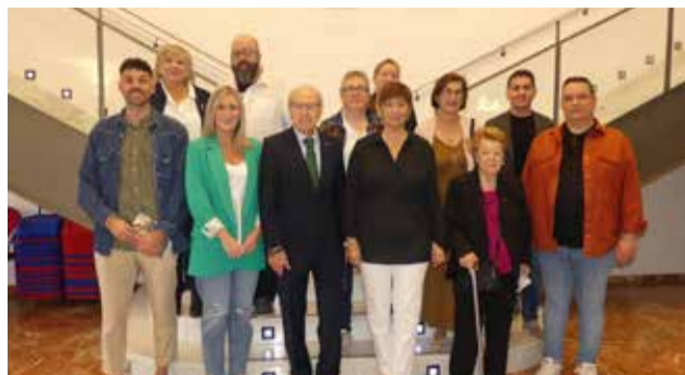
Autoridades y ponentes en el simposio.