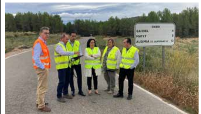
Visita a las obras con los técnicos.