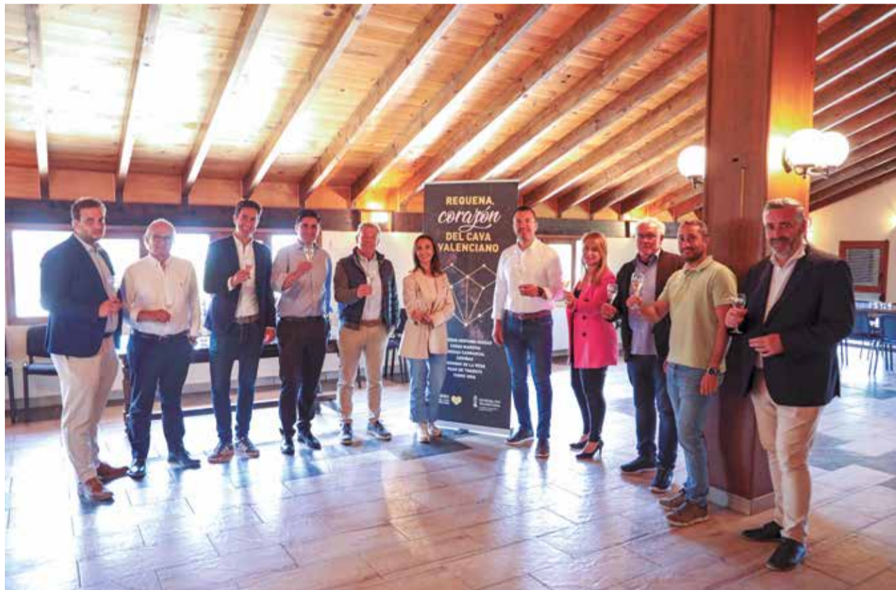
Presentación de la candidatura de Requena a Ciudad Europea del Vino.

producen una media de 2,15 millones de hectolitros de vino al año.