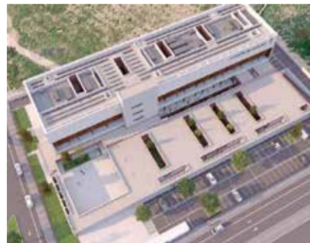
Recreació del futur Palau de la Justícia de Sagunt.

l'edifici com són la Clínica Forense, el Jutjat de guàrdia, el Gabinet Psicosocial i l'Oficina d'Assistència a les Víctimes.