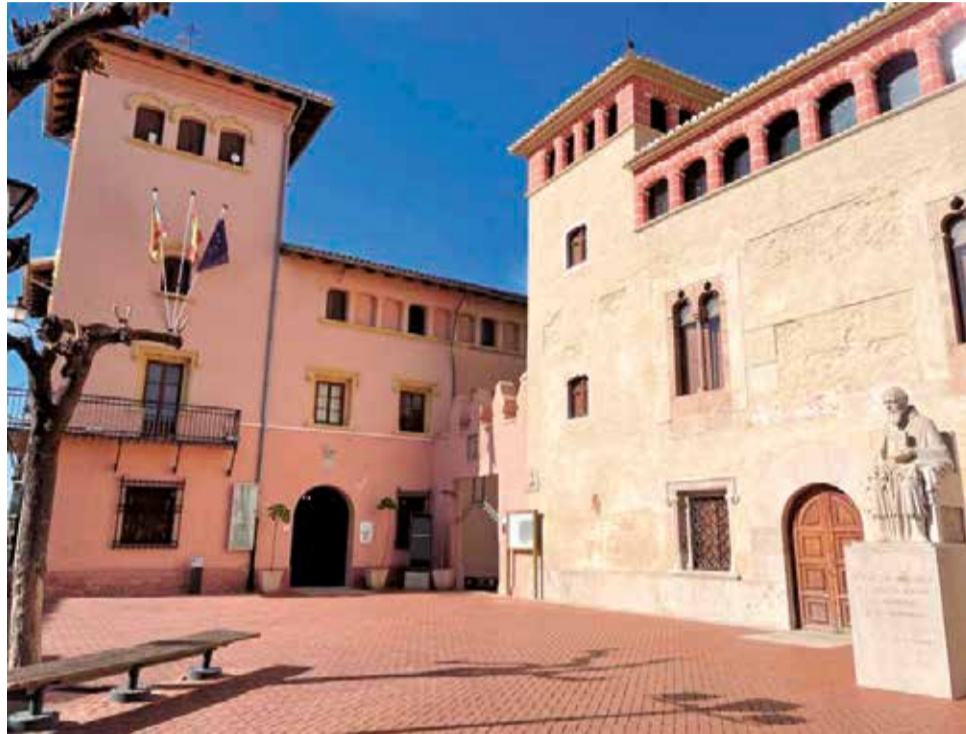
La façana de l'ajuntament d'Alfara del Patriarca.

Així mateix, la instructora es va inhibir de les actuacions en favor dels Jutjats de Violència sobre la Dona de València, que són competents per a prosseguir la investigació, conforme a la Llei Integral de *Viogen, en tindre la