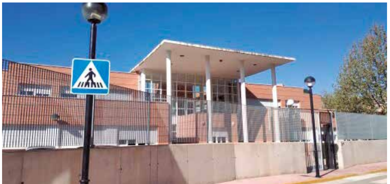
IES Fernando III de Jalance.