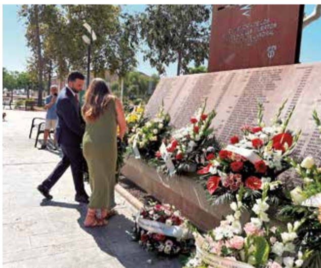
Un instant de l’homenatge el 12 d’agost.