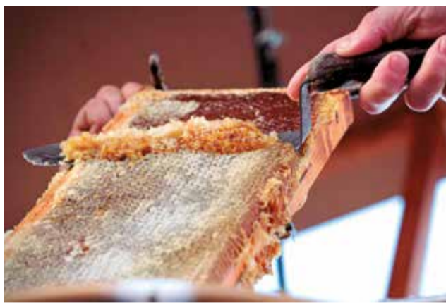
Corte de la Miel de Ayora.

El jurado será designado por el Ayuntamiento de Ayora,