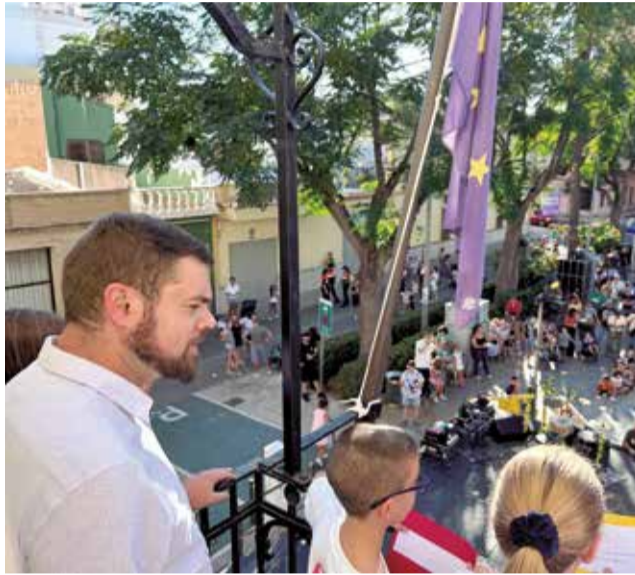
El pregó infantil des del balcó de l'ajuntament.

La novetat d'este any ha sigut la primera edició de les Festes Majors Infantils, que s'han celebrat del 9 al 13 de setembre. Esta iniciativa, liderada per les regidories d'Infància i Festes, i en col·laboració amb el Consell d'Infància i Adolescència Municipal (CIAM), ha buscat involucrar als xiquets i les xiquetes en la planificació i el desenvolupament d'activitats adaptades als seus gustos i interessos. Els menuts han disfrutat, després de donar el tret d'eixida amb el