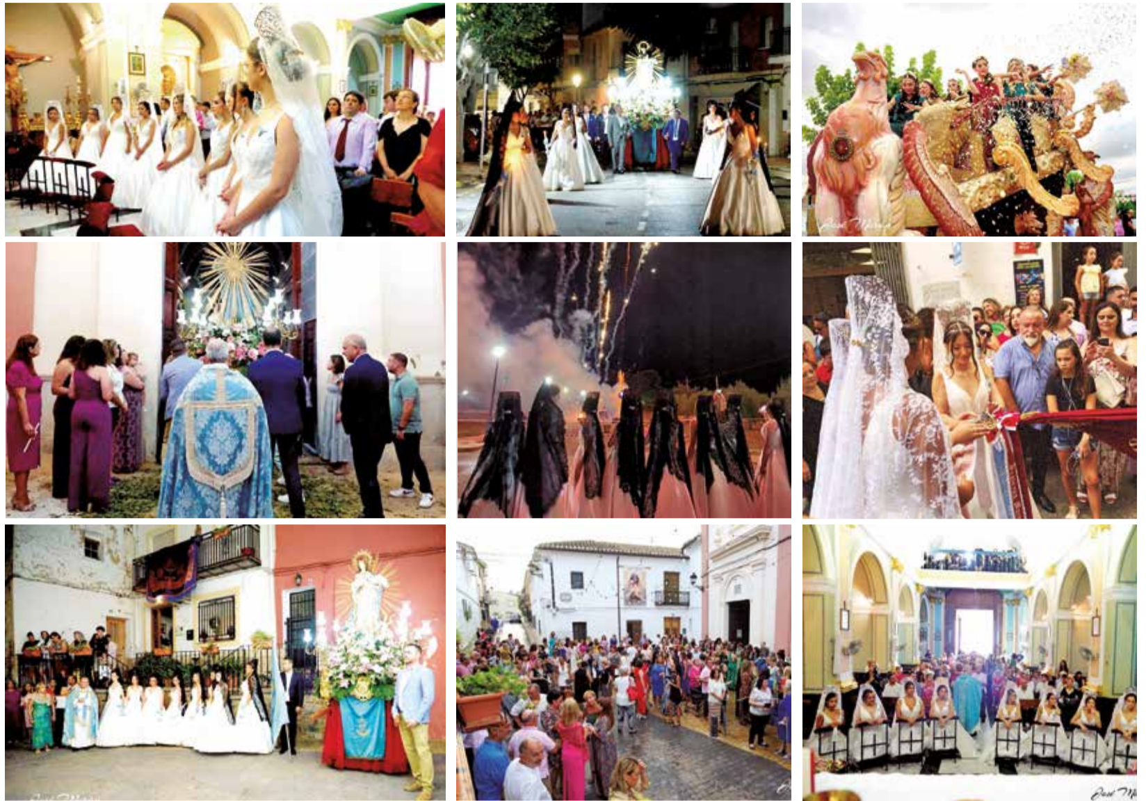
Diferentes instantáneas sobre el acto homenaje al centenario de las Clavarias de Macastre.

“Agradecemos a la parroquia y al ayuntamiento toda la ayuda recibida y por supuesto aplaudimos el trabajo realizado por la banda este fin de semana, puesto que sin su compañía ninguno de los actos que se han llevado a cabo durante el fin de semana hubiesen sido ni la mitad de emotivos. Por supuesto no podemos olvidarnos de nuestras familias y amigos, quienes nos han acompañado en todo momento y se han dejado la piel por vernos disfrutar y sonreír en nuestro gran día”, indicaban las Clavarias de Macastre en un mensaje publicado en redes sociales.