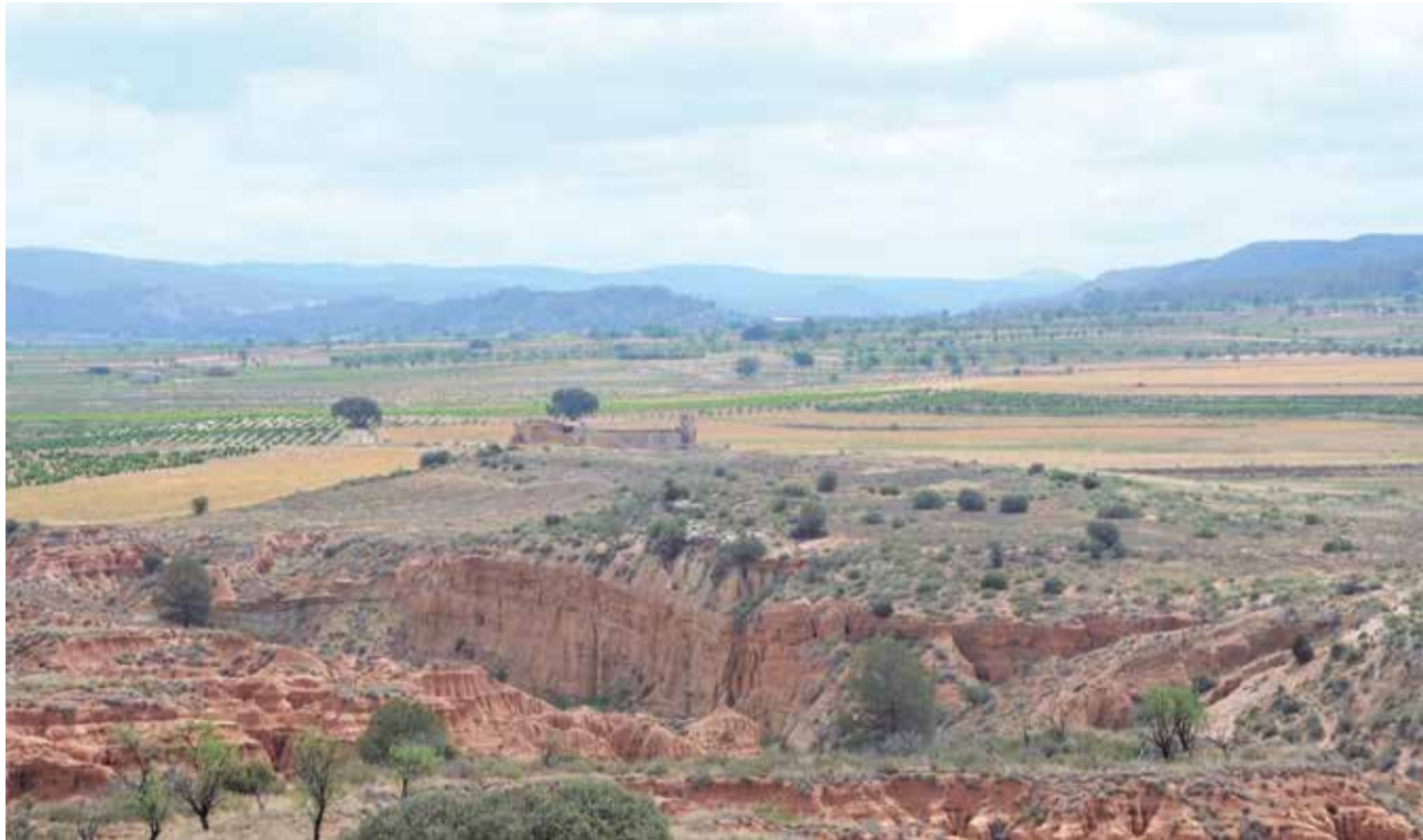
Yacimientos en la Plana de Utiel-Requena.

El estudio de materiales de prospección arqueológica procedentes de la Rambla de Los Morenos (Requena), recuperados con motivo de la delimitación del Parque Cultural del vino en la Antigüedad demuestran la existencia de seis yacimientos del Paleolítico medio con numerosos res-