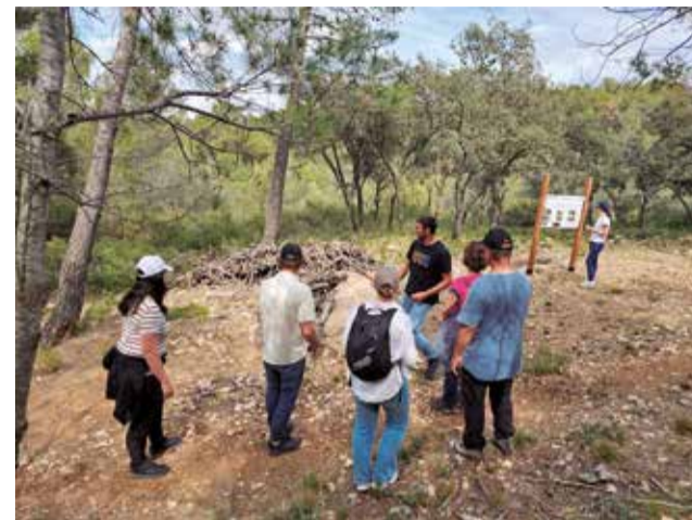
Estudiantes de Suecia en su visita a Requena.

Concretamente, una veintena de estudiantes de segundo curso y cuatro profesores del centro dependiente de la Diputació de València formarán parte de este proyecto y visitarán durante una semana la Escuela Georgikon School Sátoraljaújhely de Hungría y la Escuela Forestal Södra Viken de Suecia. Estos centros educativos visitaron este año las instalaciones de la Félix Jiménez a través del programa Erasmus+; alumnado del centro húngaro llevó a cabo prácticas en el ciclo de viticultura durante tres semanas en bodegas de Requena. Asimismo, también enmarcado en este programa, el departamento forestal de la escuela recibió el pasado mes