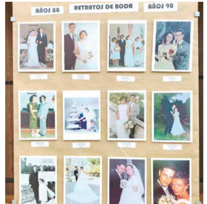
Algunas de las instantáneas expuestas en la muestra de Jaraguas.

transportan a la época de los años 40, cuando las bodas eran sencillas pero cargadas de simbolismo; pasando por los años 50, con una mezcla de austeridad y resurgimiento; hasta llegar a los 90, donde la modernidad y los cambios sociales empezaban a hacerse notar en los festejos.