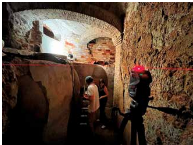
Los estudiantes en las bodegas excavadas.

Los participantes trabajan por equipos para medir y dibujar una selección de bodegas excavadas puesta a disposición voluntariamente por sus propietarios para posteriormente digitalizar y