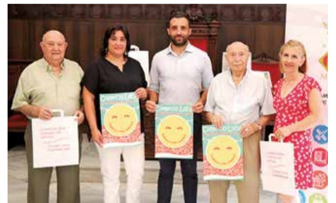
Presentació de la campanya a l’ajuntament.

La campanya consisteix a sortejar premis en metàl·lic entre els clients dels 572 comerços adherits a la mateixa per a incentivar als ciutadans i ciutadanes al fet que s’acosten a conèixer l’àmplia oferta de comerç local de la ciutat i a realitzar les seues compres en ell. Els comerços adherits es donaran a conèixer pròximament a través de la web del comerciant i les xarxes socials. A més es podrà identificar l’establiment gràcies