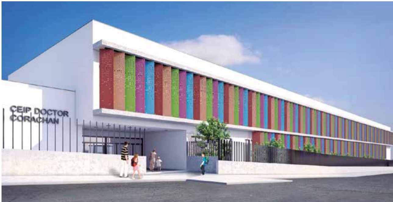
Maqueta del CEIP Doctor Corachán de Chiva.

El plazo previsto de finalización de las obras, una vez adjudicada a la empresa finalista, se estima en 18 meses, con el acabado final que se muestra en los render.