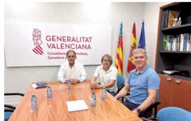
Un momento durante la reunión.

que pueden aportar valor a la Junta Central y viceversa. Y Vicente Tejedo ha mostrado su predisposición para profundizar en la línea de colaboración entre la Conselleria y la Junta Central de Usuarios.