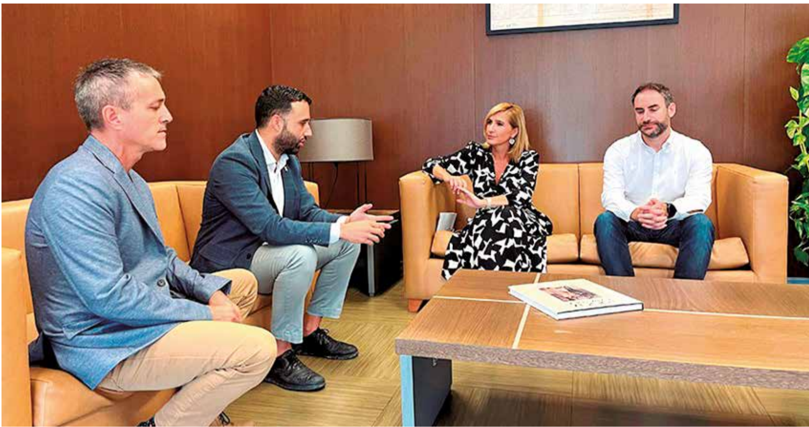
Autoritats en la reunió per a abordar la situació del futur Palau de la Justícia de Sagunt.

EL REIVINDICAT COMPLEX ATENDRÀ UNA POBLACIÓ DE MÉS DE 90.000 HABITANTS DE VORA UNA QUINZENA DE MUNICIPIS