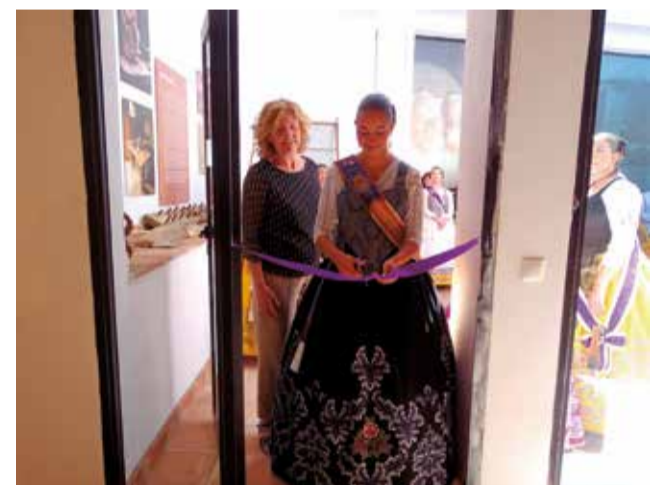
Diferentes momentos durante la inauguración del Centro de Interpretación de Alfarería de Utiel.