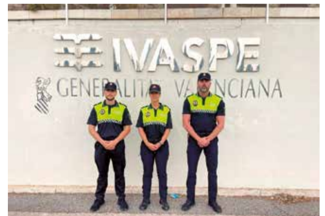
Els tres nous agents de policia.

El cos de Policia Local de Foios incrementa la seua plantilla amb la incorporació de tres nous agents. Després de superar el curs de l'Institut Valencià de Seguretat Pública i Emergències (Ivaspe), els tres nous policies, dos homes i una dona, han ingressat en el cos policial on realitzaran les seues pràctiques durant els pròxims tres mesos. Una vegada finalitze el seu període d'aprenentatge i superen un examen de supòsit pràctic s'incorporaran de manera definitiva a la Policia Local com a funcionaris de carrera.