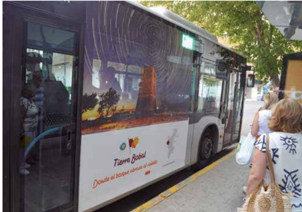
Tierra Bobal en la Feria de Albacete.

bacete que se celebra del 7 al 17 de septiembre, Tierra Bobal estará presente con un autobús tematizado circulando por sus calles. Esta Feria, declarada de Interés Turístico Internacional y reconocida muchas veces por votación popular como la mejor fiesta popular de España, congregó a más de 3 millones de vi-