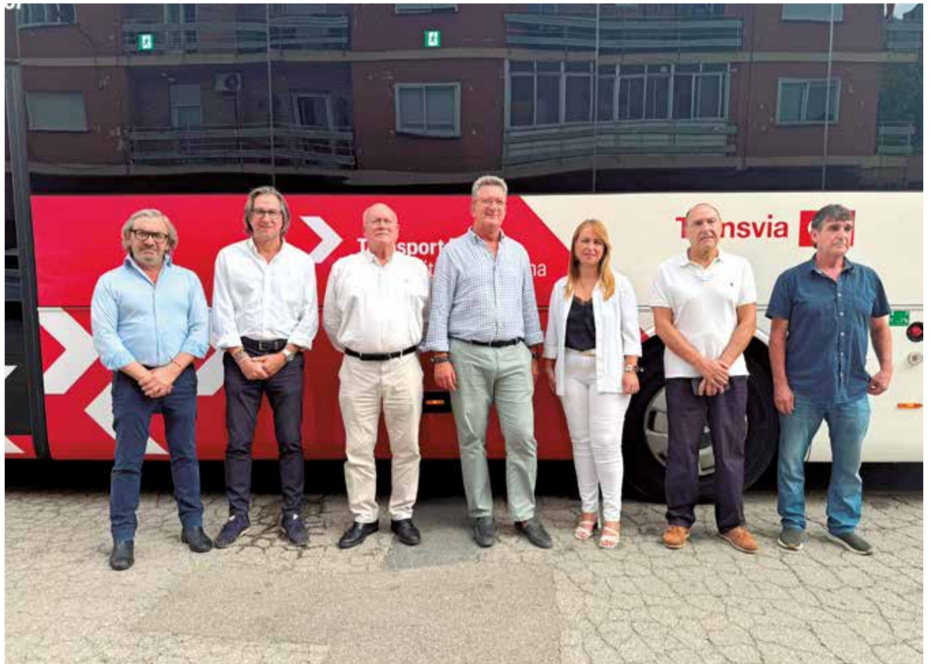
Los diferentes alcaldes de los municipios que reciben este servicio junto a Martínez Rus.

Con este nuevo servicio, ha hecho hincapié, “seguimos trabajando para mejorar la red autonómica de transporte público de viajeros por carretera para dar una respuesta más eficaz a las necesidades de movilidad de la población