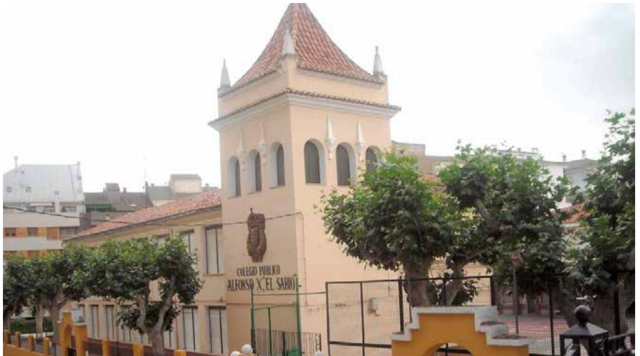
CEIP Alfonso X "El Sabio" de Requena.

Por último, el conseller ha anunciado que este domingo, 8 de septiembre, se va a celebrar la recuperación de esta asignatura con una concentración de bandas de música juveniles que se celebrarán de forma simultánea en las ciudades de València, Castelló de la Plana, Alicante y Elche.