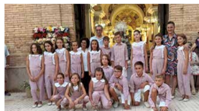
L'alcaldesa amb els grups de festers.