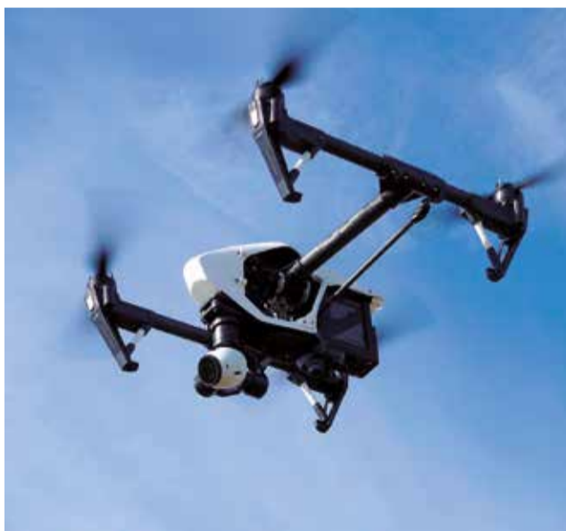
Foto de archivo de un dron.

Los agentes locales han procedido a la incautación de las plantas además de remitir esta sustancia al área de Sanidad de Delegación de Gobierno para establecer la cantidad y pureza exacta de la sustancia.