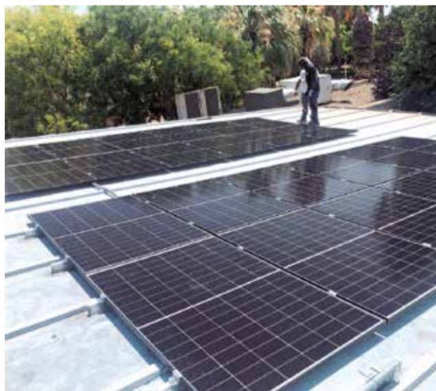
Les plaques solars.

L'alcalde Vicent Porta ha destacat els múltiples beneficis del projecte, com la reducció de la petjada de car-