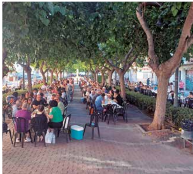
Un dels esmorzars popular.

pregó, de berenars, un dia dedicat a l'esport, ball, jocs aquàtics, un musical, i un colorit Holi Fest.