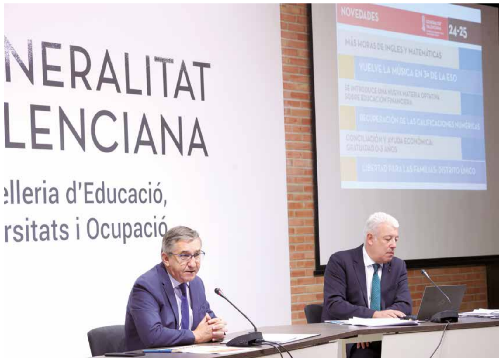
El conseller de Educación José Antonio Rovira durante la presentación.

En cuanto a las ratios, este curso se mantiene en iguales términos que el pasado, siendo la media de 21 alumnos en Infantil de segundo ciclo y Primaria, de 24 en Secundaria y de 29 en Bachillerato. Todas las etapas están por debajo de la ratio máxima establecida.