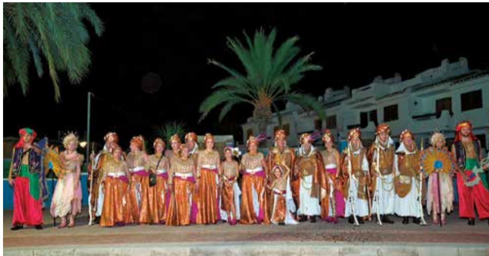
Una de les comparses en l'Entrada de Moros i Cristians.

Encara queda per davant este cap de setmana, la celebració de la festivitat de Nostra Senyora de l'Esperança, amb les tradicionals calderes, missa i processó el dissabte, a més d'una discomòbil, i el diumenge dedicat a Sant Francesc. També, en pròximes setmanes, les penyes boueres tindran els seus actes els dies 19, 20, 21, 27 i 28 de setembre.