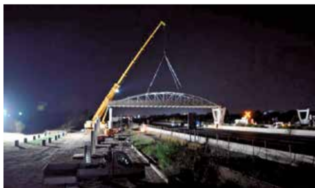
La instal·lació de la nova passarel·la.