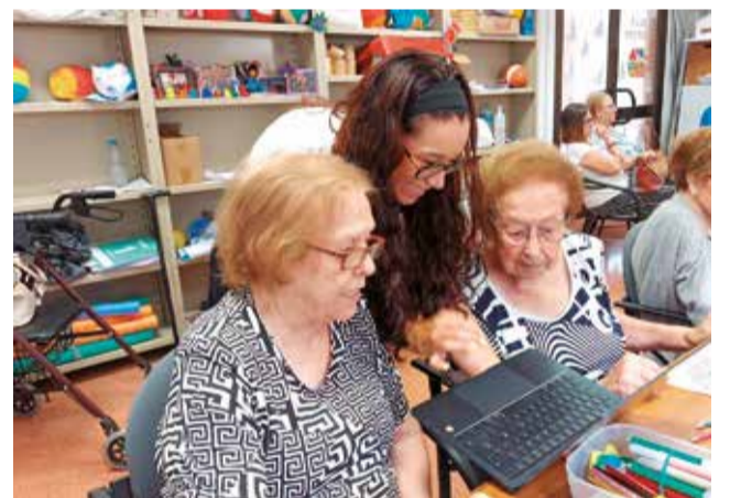
Diferentes momentos durante el taller de accesibilidad digital de Godelleta.