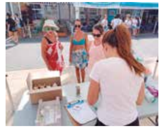
L'estand informatiu.