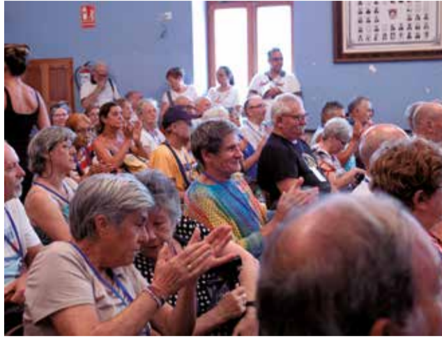
Un momento durante el homenaje.

PARA PROFUNDIZAR EN LA HISTORIA DE LOCALIDAD SE PROYECTÓ UN REPORTAJE DEL PROGRAMA 'VA PASSAR AÇÍ', EMITIDO EN ÀPUNT, TITULADO "LA MECA DEL ESPERANTO"