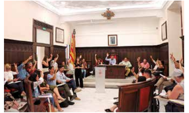
Pleno del Ayuntamiento de Sagunt.