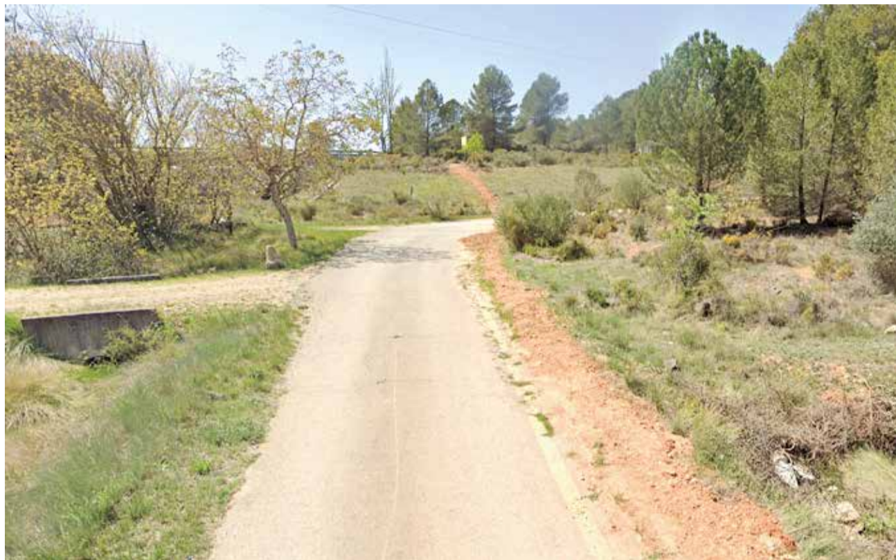
Zona del apeadero de la estación de Renfe a su paso por Siete Aguas.

“La Diputació ha estimado oportuno el acondicionamiento de este itinerario peatonal y ciclista, con el objetivo de avanzar hacia un patrón más equilibrado de