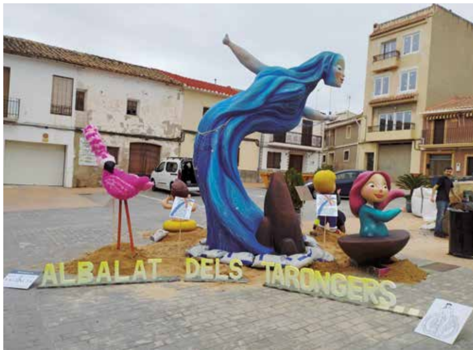
Falla plantada a Albalat en novembre de 2022 gràcies a la Diputació.

La plantada de monuments fallers serà la primera vegada que es realitzarà a Quartell i la segona a Torres Torres, que ja va acollir una iniciativa similar en 2022. A més, Castielfabib estrena aquesta ruta fallera de la Diputació, que inclourà un total de 30 monuments repartits per diverses comarques valencianes.