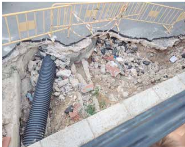
Situación de la calle Gómez Ferrer.