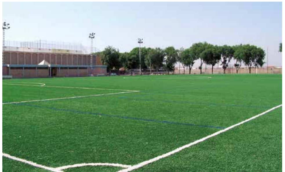
El camp de futbol de Foios.

Clemente afegix que "el PP sempre estarà al costat de la gent, no permetrem que el govern municipal i el seu alcalde riuen dels nostres veïns".