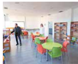
Guarderia. / EPDA