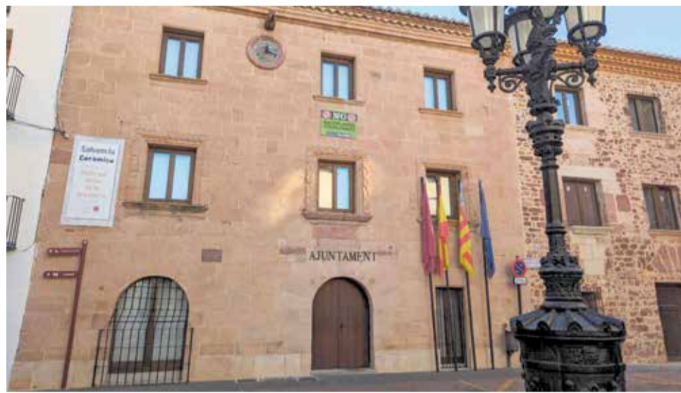
Edificio consistorial de Vilafamés.

Por otro lado, la medida se traducirá en una mejora sustancial para la conciliación familiar y laboral de la plantilla, que destaca por su juventud. La intención es crear un buen ambiente de trabajo y faci-