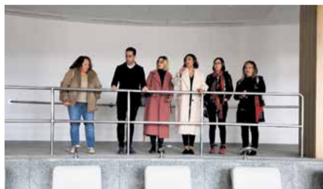
Visita a les instal·lacions del centre termal.

L'alcaldessa va explicar com l'Ajuntament de Benassal està desenvolupant un pla de participació ciutadana i empresarial amb l'objectiu de recollir la sensibilitat de Benassal sobre el futur del centre termal. A més l'Ajuntament compta amb un estudi de viabilitat sobre la