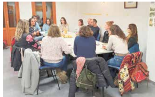
Reunió de la Mancomunitat amb les AMPA. / EPDA