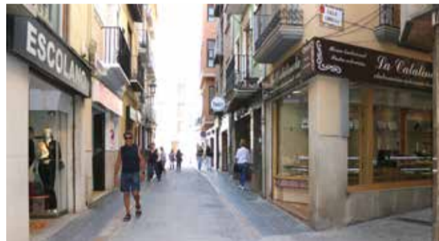
La compra en Segorbe puede resultar gratis.