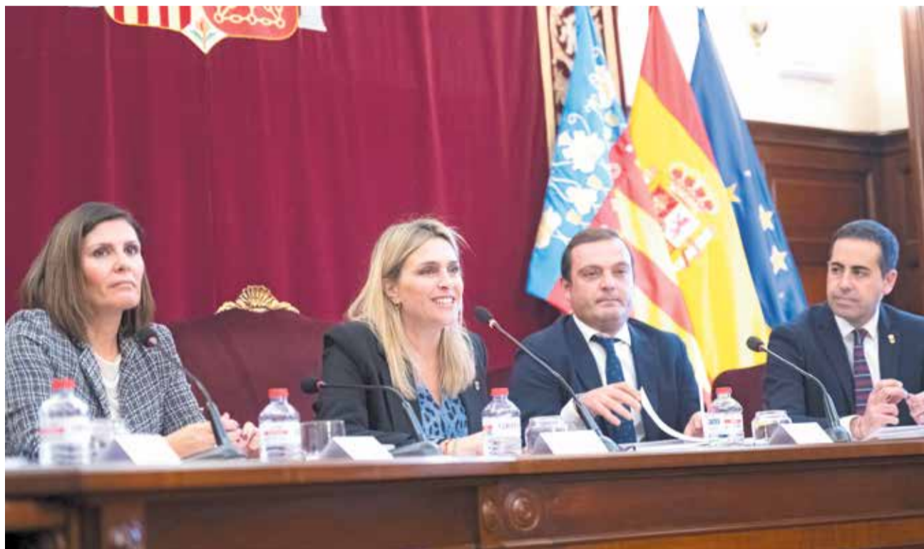
Intervenció de la presidenta de la Diputació, Marta Barrachina, durant el ple ordinari de desembre.

“La ceràmica, que forma part de l'ADN i és motor vital de l'economia de la nostra província, és un dels objectius prioritaris de les polítiques de la Diputació Provincial”, va continuar Barrachina. Per eixe motiu, “des d'esta institució continuarem defensant la nostra indústria taulellera amb fermesa per a evitar que s'apague i, en eixe sentit, continuarem exigint al Govern central que in-