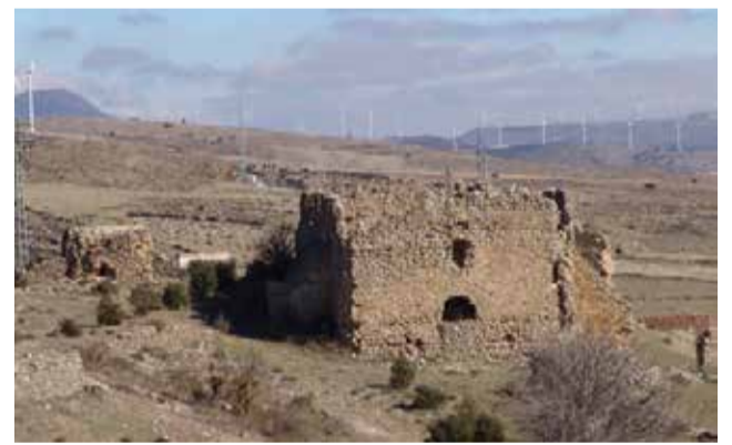
Iglesia del castillo de El Toro.