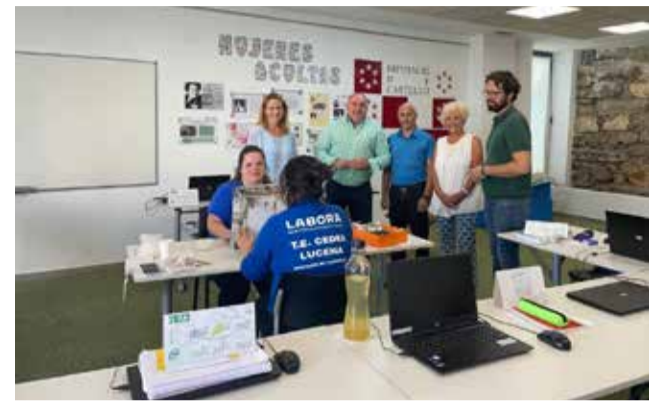
Sanidad y medio ambiente, materias de CEDES. / EPDA