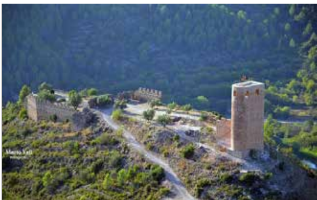
Castillo de Vall de Almonacid.