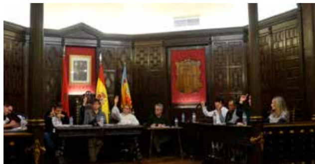
Pleno presupuestario.