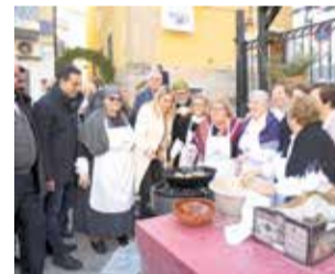
Barrachina en Suera.