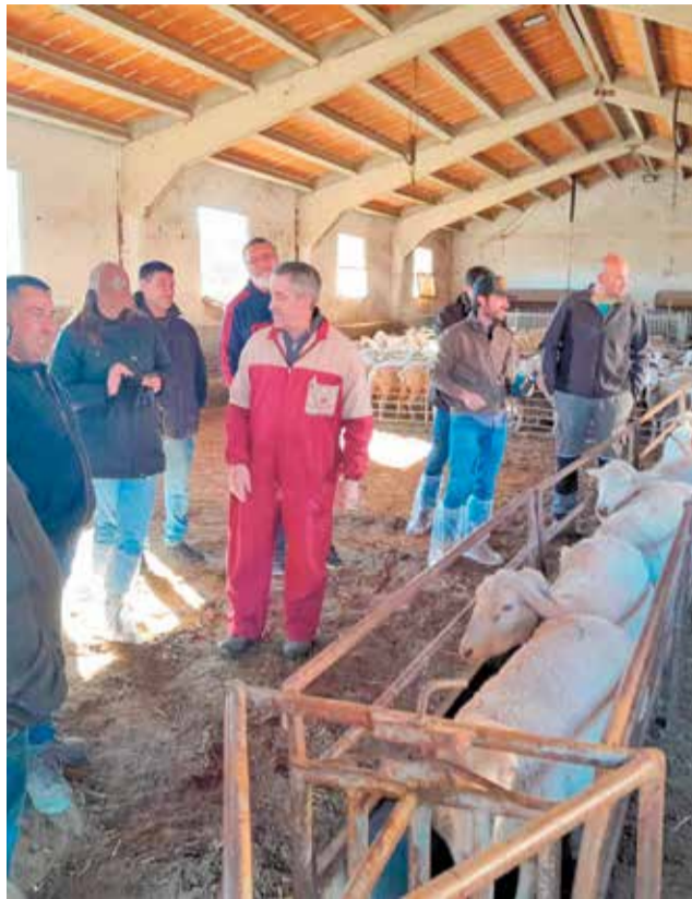
Activitats i ponències del primer congrés nacional de ramaderia extensiva celebrat en Morella.

D'altra banda, es va viure una jornada pràctica en el terreny, on els professionals que hi van participar van mostrar diverses formes de tractar el ramat, així com d'aplicar la tecnologia. Estes novetats estan per a fer més fàcil la vida als ramaders i buscar la rendibilitat amb exemples clars sobre el terreny com les ecografies en ovelles per conèixer l'estat de gestació o els collars de loca-