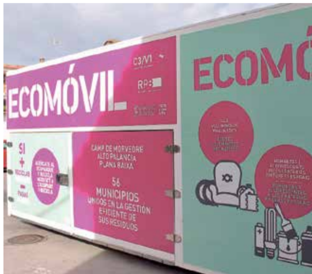
Ecoparques del Consorcio Palancia Belcaire. / EPDA

El Consorcio Palancia Belcaire está formado por 56 municipios de las comarcas del Camp de Morvedre, Alto Palancia y Plana Baixa. Los ayuntamientos de esos 56 municipios, junto a la Diputación de Castellón, la Diputación de València y la Generalitat Valenciana, gestionan de la manera más eficiente posible los residuos urbanos del Plan Zonal C3/V1.