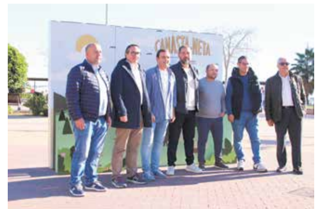
Jornada mediambiental en el Grau de Castelló.

telló, puguem disfrutar d'una mar neta i sana”. “Moltes vegades resulta impossible per als nostres pescadors realitzar la seua labor per la presència de plàstics o residus i això és el que hem