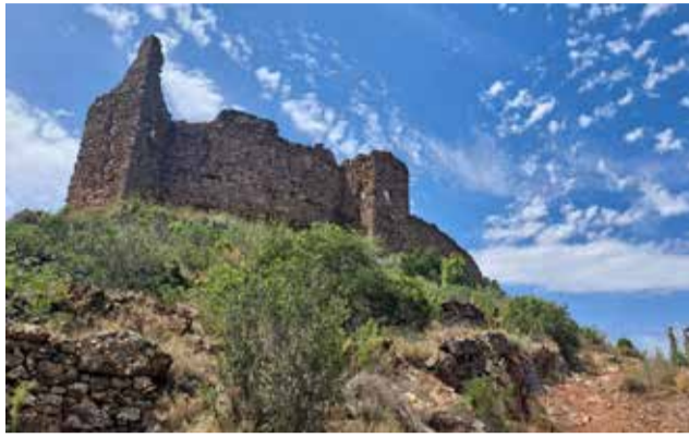
Castillo de Azuébar.