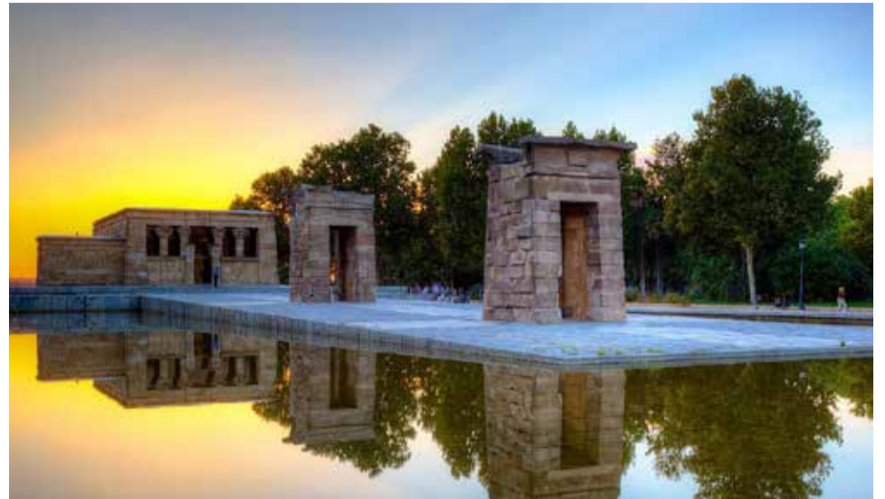
El templo de Debod tal como se encuentra en Madrid.

Las autoridades españolas decidieron que se instalara allí, tal vez siguiendo el criterio del arqueólogo Martín Almagro Basch basado en dos circunstancias: que el terreno original del templo era el desierto y que por lo tanto no tenía palmeras próximas, y que las autoridades egipcias habían expresado su deseo de que se instalará en la capital de España. Finalmente se inauguró el 18 de julio de 1972, con la opinión generalizada de que se trataba de una muestra más del "centralismo" de Madrid. Y allí se encuentra, en la montaña de Príncipe Pío, junto a la plaza de España. Sin duda un lugar mucho más adecuado que Elche por sus bajas temperaturas y en el centro del casco urbano de la capital. Y así, el aumento desmedurado de sus visitantes, los agente meteorológico, y la contaminación, están deteriorando sus piedras y los grabados que aparecen en ellas.