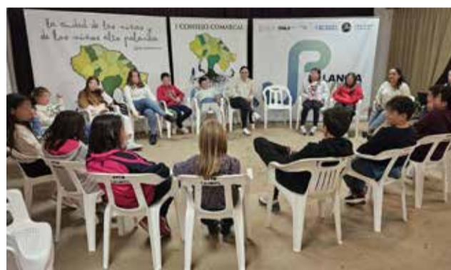
Consejo comarcal de la infancia en Caudiel.

Las consejeras y los consejeros adolescentes reclamaron actividades lúdicas y de ocio y tiempo libre, como torneos deportivos de baloncesto y fútbol en las instalaciones municipales. Comunicaron a la presidenta las limitaciones que supone la falta de transporte público para este grupo de edad, de