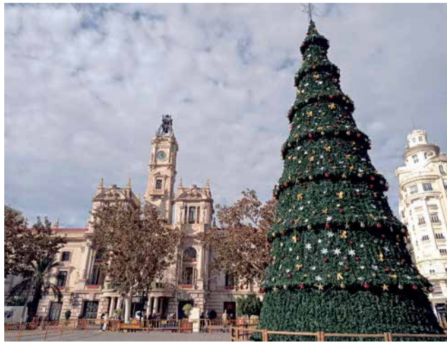
Árbol de la Plaza del Ayuntamiento de Valencia.