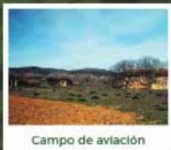
Campo de aviación