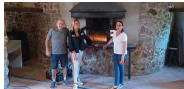
Fabregat en Pavías.

En ambas poblaciones se han abordado asuntos para la zona como la mejora y el acondicionamiento de las infraestructuras viarias, el sistema de atención sanitaria, la agilización de temas administrativos o la conectividad para facilitar el acceso a servicios sociales o educativos.