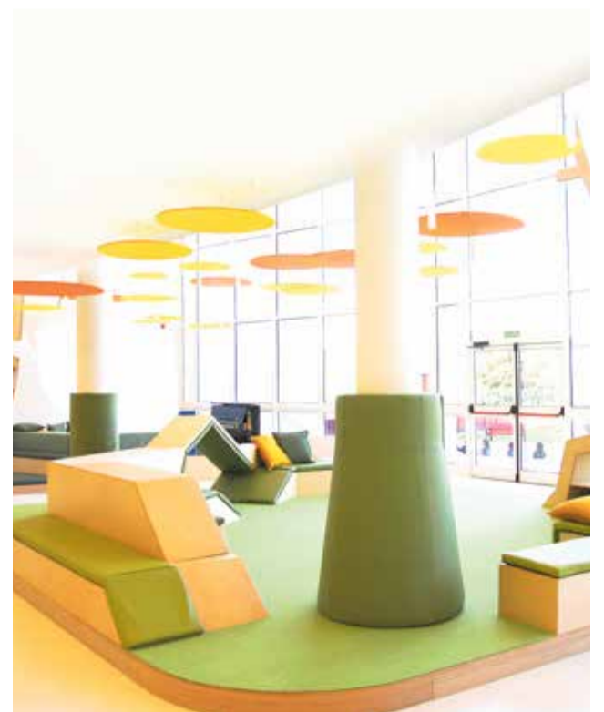
Ágora Lledó International School en Castelló.

Agora Lledó International School se caracteriza por la excelencia educativa y su visión se basa en una serie de principios básicos: multilingüismo en todo el colegio, el programa IB y un enfoque en una educación integral que incluya tecnología, música, arte y deportes. El colegio de Castelló ofrece un plan de estudios ambicioso e integral, que está diseñado para preparar a los alumnos para la realidad social y profesional del mundo en el que viven hoy y proporcionarles las herramientas que necesitan para alcanzar el éxito académico y personal.