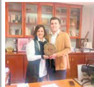
Agraïment. / EPDA