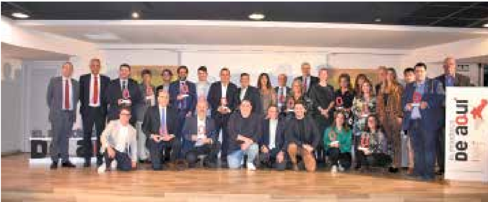
Galardonados y autoridades en los I Premios Provincia de Castellón de El Periódico de Aquí, celebrados en Peñíscola.

EL HOTEL & SPA PEÑÍSCOLA PLAZA SUITES ACOGIÓ EL EVENTO, EN EL QUE SE CITARON AUTORIDADES Y REPRESENTANTES DE INSTITUCIONES, ASOCIACIONES Y EMPRESAS DE DIFERENTES LOCALIDADES DE TODAS LAS COMARCAS DE LA PROVINCIA