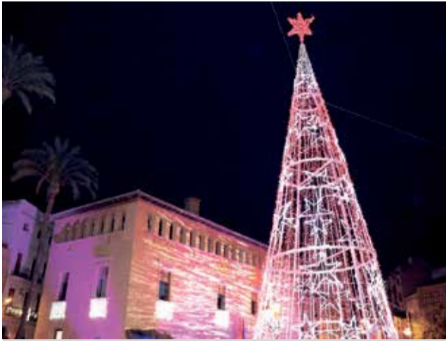
Árbol de navidad de Llíria.