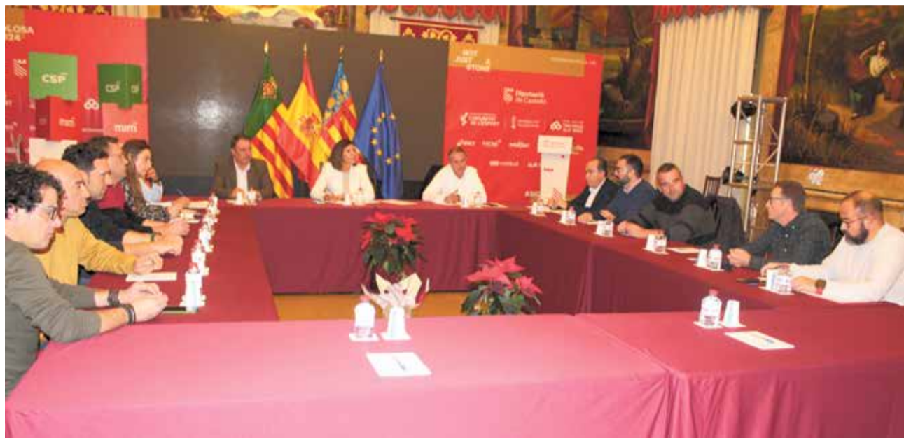
Reunió en el Palau Provincial per a tractar el tancament de la planta de purins de Todolella.

Tant en l'informe de la Direcció General com en la denúncia es reflectia que la planta no complix amb la normativa quant a la minimització de l'impacte ambiental. Per eixe motiu, des de la Diputació de Castelló, sent titular de la