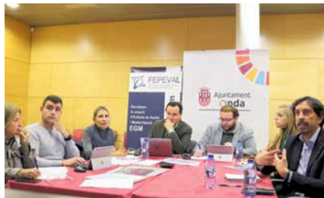
Jornada en el Museo del Taulell Manolo Safont.