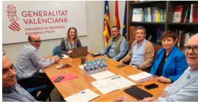
Reunión en Consellería.