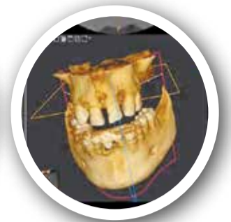
TAC de un paciente con abundante masa ósea. / EPDA

► Este tratamiento es adecuado para personas que han perdido la mayoría de sus dientes, quedando pocos sanos útiles. También pacientes que tienen las típicas “dentaduras” removibles y quieren cam-