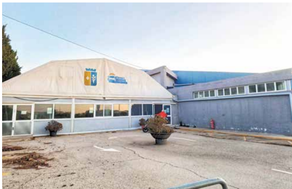
Exterior de les instal·lacions de la piscina municipal de Benicarló.

L'alcalde s'ha mostrat satisfet i optimista després de l'adjudicació de les obres, un pas crucial des-