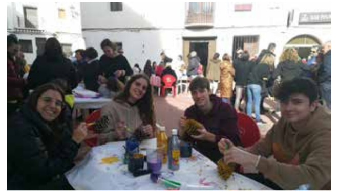
Talleres para los adornos.