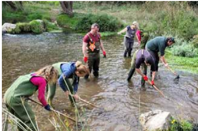
Técnicos y voluntarios en el río.

Este trabajo de voluntariado consiste en remover manualmente, con ayuda de rastrillos y otras herramientas pesadas, las gravas del río acumuladas en ciertos lugares preferidos por la trucha para desovar, los llamados frezaderos, anotando toda la información necesaria para localizarlos y caracterizarlos, y así facilitar el posterior seguimiento de la reproducción de las truchas. Los mejores frezade-