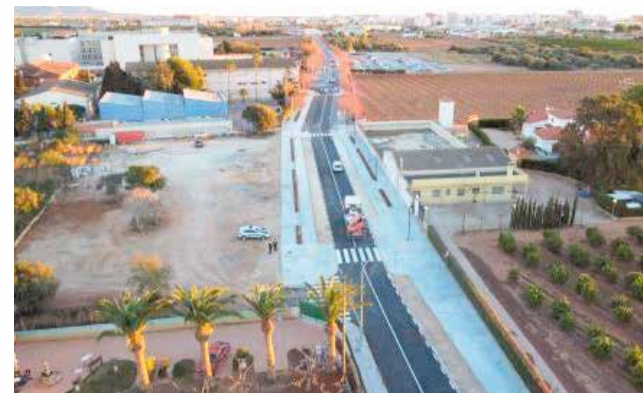
Remodelació de l'entorn de l'IES José Vilaplana.