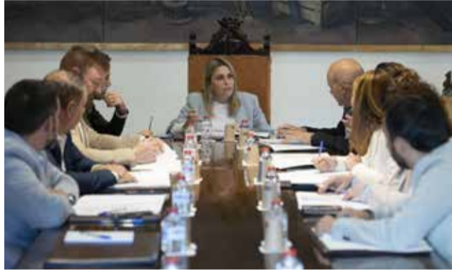
Comisión de gobierno provincial.

En cifras, el plan de transición energética beneficiará en el ejercicio 2024, a un total de 57 municipios de menos de 1.000 habitantes y contará