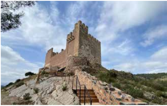
Castillo de Gaibiel.