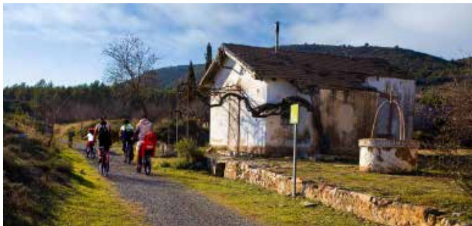
Los planes pretenden aumentar la calidad de los servicios turísticos

Los Planes de Dinamización y Gobernanza Turística de la Comunidad Valenciana se configuran como una iniciativa de la Generalidad, instrumentada a través de la formalización de con-