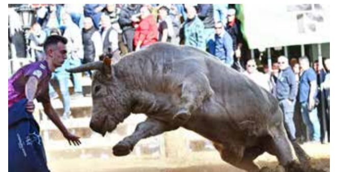
Castellnovo marca el comienzo de temporada.