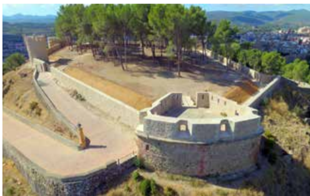
Fuerte de la Estrella de Segorbe.