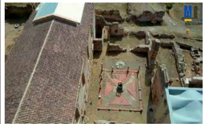
La cartuja a vista de dron.