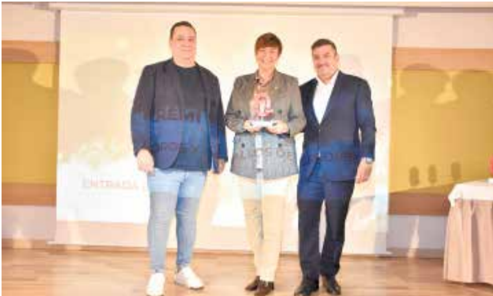
Premio Fiestas al Ayuntamiento de Segorbe por la Entrada de Toros y Caballos.