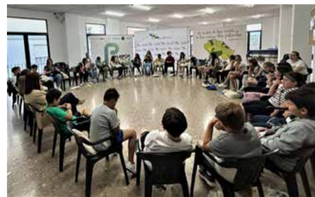
Reunión del Consejo Comarcal.

empoderar a la ciudadanía desde edades tempranas, de forma que conozcan sus derechos y mecanismos de participación en sociedad, sobre todo el derecho a expresar su opinión y que ésta sea tenida en cuenta por quienes toman decisiones que afectan a su vida social y su empoderamiento como ciudadanía", han concluido.