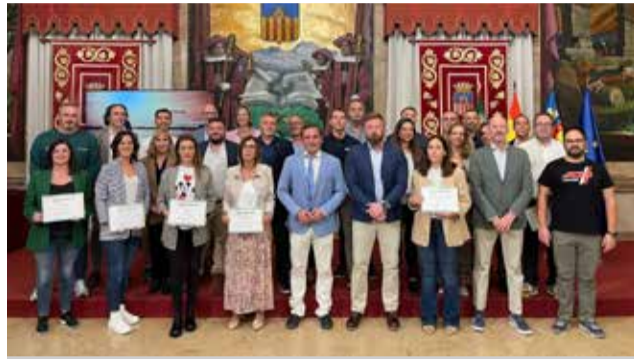
Entrega de certificados en Diputación.

Castellón Cycling es una iniciativa impulsada por el Patronato Provincial de Turismo para trabajar de forma coordinada junto a empresas y ayuntamientos con el objeto de ofrecer servicios de calidad adaptados a los potenciales clientes cicloturistas. Se trata de un club de pro-