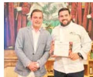
Primer premi.