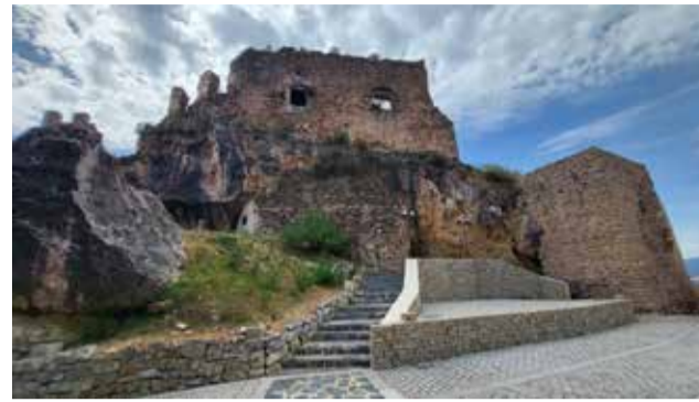
El castillo, residencia de Beatriz de Borja.