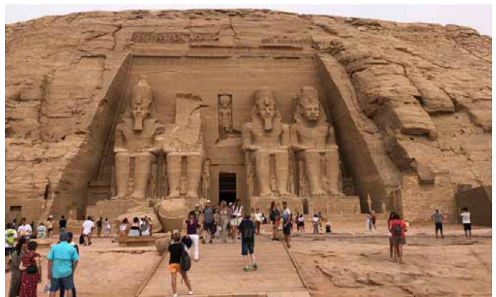
España contribuyó al traslado de Abu Simbel./ MARÍA MARTÍN