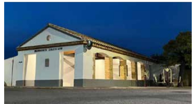
Finalizadas las obras en el lavadero.

La principal intervención ha sido la sustitución de toda la cubierta del lavadero, ya que la antigua se encontraba seriamente afectada por la carcoma. Asimismo, también se ha procedido a la renovación de la pintura, además de a la instalación de iluminación noc-