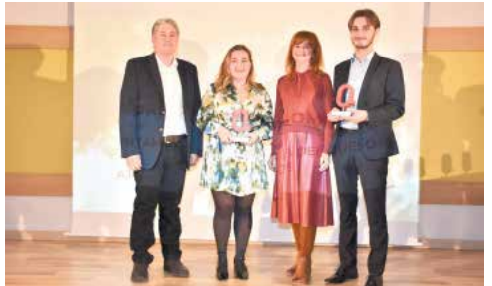
Premio de Gastronomía para la Fundación de Turismo de Montanejos. / P.G.