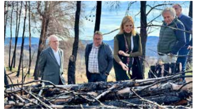
Salomé Pradas en la zona quemada de Toràs

Ha sido en esta última localidad donde la consellera Salomé Pradas ha visitado la zona afectada y se ha reunido con su alcalde, Carlos del Río, junto a ediles de las otras poblaciones afectadas.