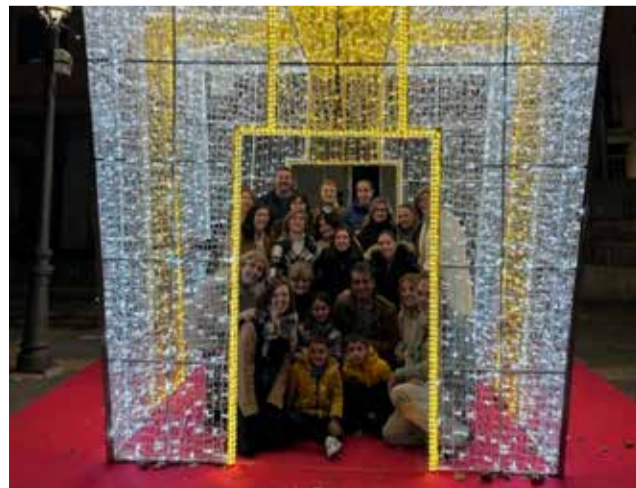
El regalo gigante y los participantes.

Este año además del regalo gigante han preparado decoración sostenible con materiales reciclados para adronar las calles y dinamizar las compras en los establecimientos de la propia población.