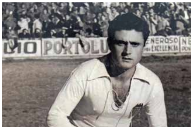
Rubicos con el escudo valencianista

En 1952 ficho por el Mallorca continuando por la 2ª división española.