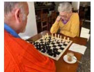
Campeonato / EPDA