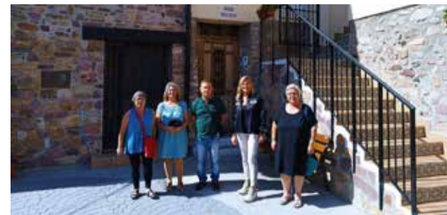
La delegada en Higueras.