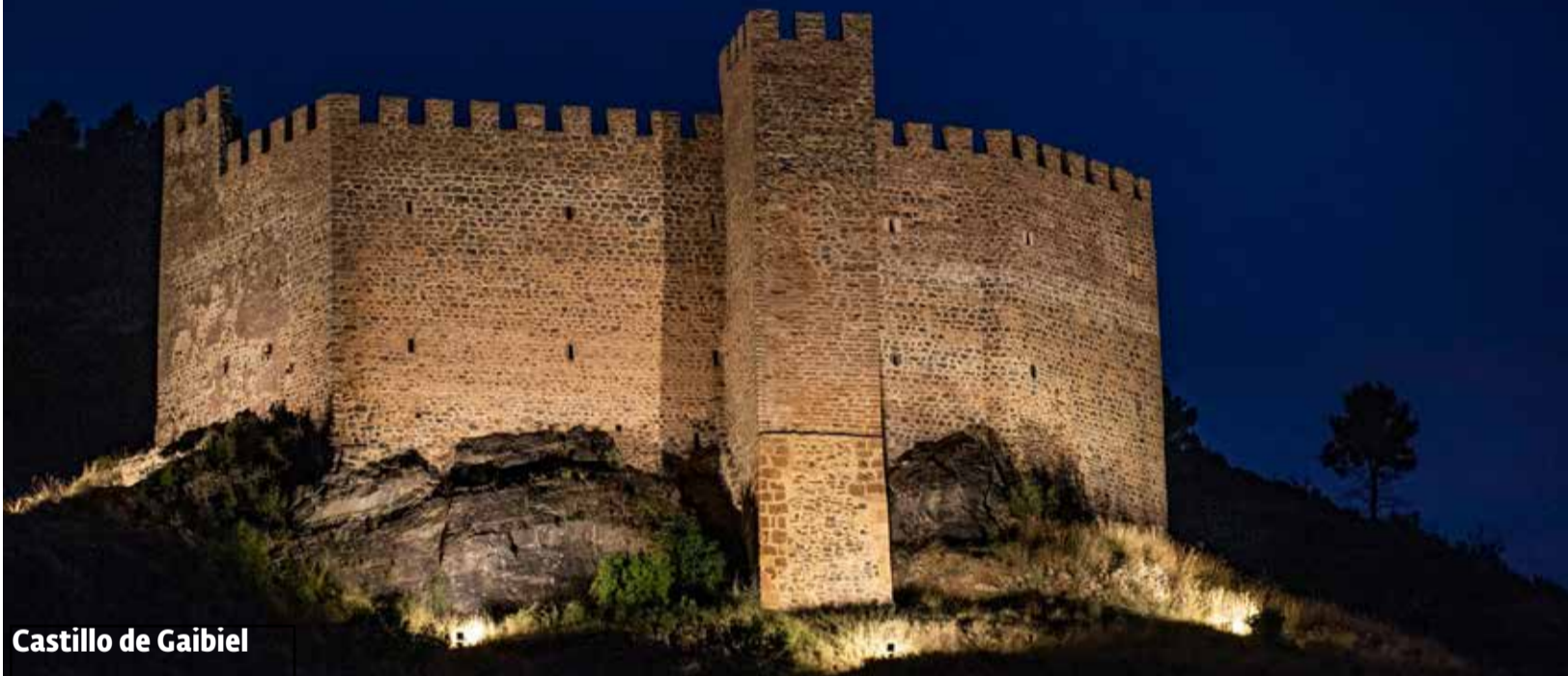
Castillo de Gaibel

ONCE RUTAS RECORREN LAS FORTALEZAS DE LA COMARCA DEL PALANCIA EN UNA PÁGINA WEB Pág. 5