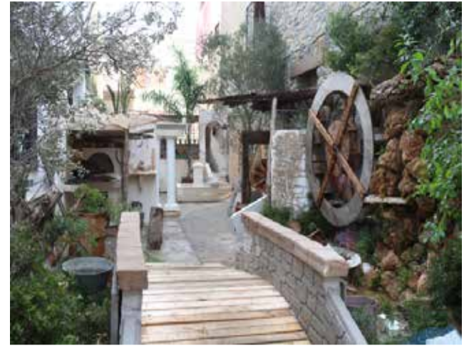
Belén de la calle del Portillo en Segorbe.

de Llíria, Ciudad Creativa de la UNESCO, como la Unió Musical, la Banda Primitiva, la Agrupación Musical Edetana 'Vicente Giménez', la Orquesta de Plectro 'El Micalet', la Banda UDP o el Grup de Danses 'El Tossal'.