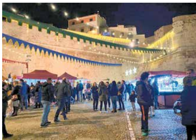
Mercat Medieval de Peníscola.