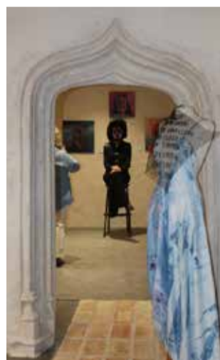
Una de las salas.

Aprovechando la celebración del acto inaugural y de la presencia de numeroso público, por parte del ayuntamiento se dio lectura a una declaración institucional con motivo del 25 de noviembre Día Internacional de la eliminación de la violencia contra la mujer.