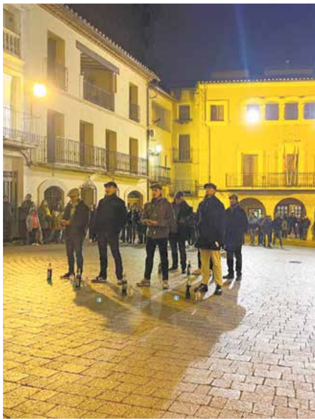
Diversos instants del tradicional 'Cant de les Cartes' d'Albocàsser'

La festivitat va continuar el 8 de desembre amb la Santa Missa i el recorregut pels carrers amb la rondalla cantant les cobles a la Verge i la banda de música posant el toc rítmic, amb un gran èxit de participació per part del veïnat. Tampoc va faltar la 'captà', en la qual els quintos van recaptar diners per a sufragar els festejos.