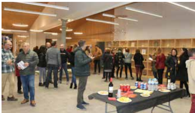
Aspecto de la sala expositiva.