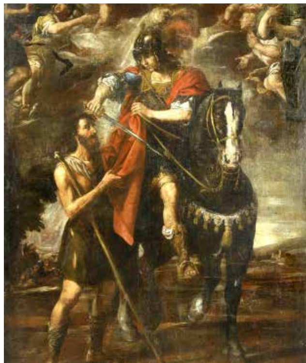
La obra de Ribalta a subastar

Según ha explicado Subastas Darley, "la escena representa a San Martín de Tours, un soldado del ejército romano, compartiendo su capa