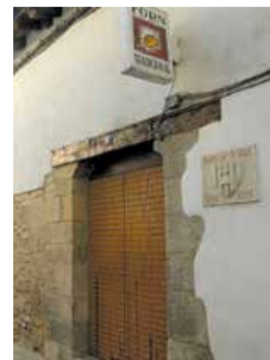
Forn de la Vila.

L'Ajuntament de Forcall ha executat les obres de rehabilitació de coberta del Forn de la Vila, amb un pressupost de 42.105,27 euros. Una quantitat que el Consistori ha rebut de les ajudes destinades a actuacions de conservació i protecció dels béns immobles del patrimoni cultural de la Comunitat Valenciana de la Conselleria de Cultura i Esport. D'esta manera, s'ha restaurat la teulada del Forn de la Vila, el més antic d'Europa