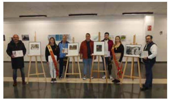
Reinas y concejal con premiados.