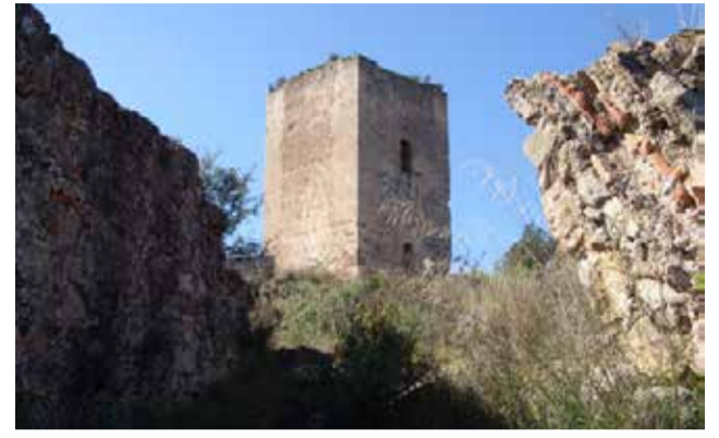
La 'torreta' del castillo de Jérica.