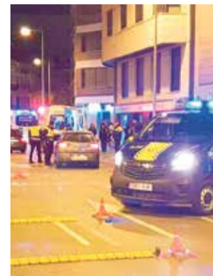
Control en Castelló.

La iniciativa busca concienciar a la ciudadanía sobre la importancia de evitar el consumo de alcohol y drogas al ponerse al volante, fomentando así comportamientos