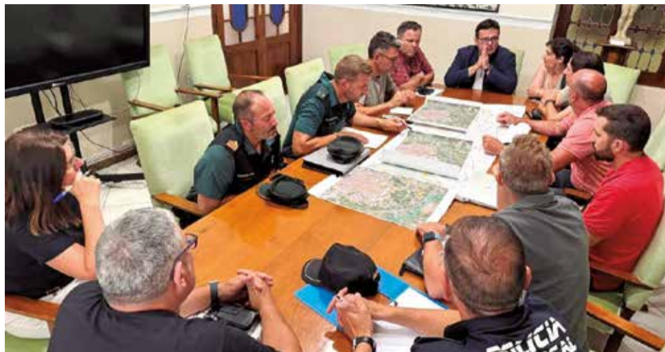
Reunió per abordar la execució de les obres. / EPDA