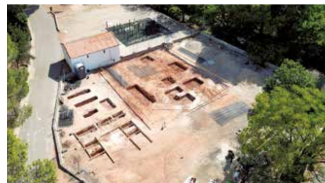
Zona on estarà ubicada.