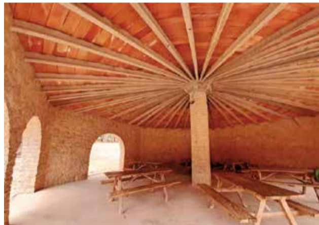
Zona de acampada de El Remedio ubicado en Utiel. /