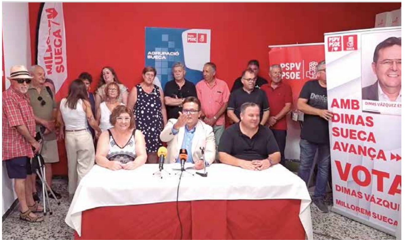
Rueda de prensa del PSOE de Sueca.

Los promotores del acuerdo alegan una "gestión económica insatisfactoria, inestabilidad y políticas 'erráticas' que hacen patente la necesidad de cambio"