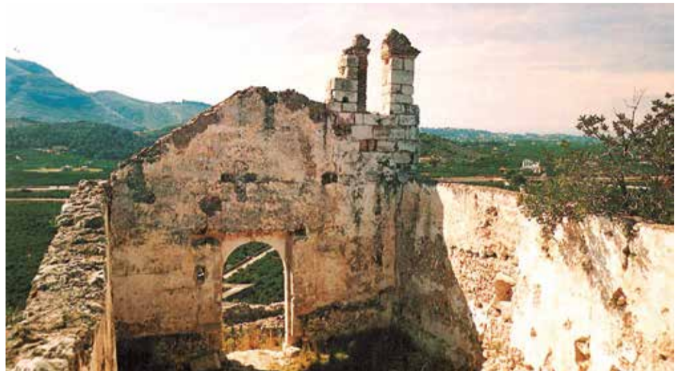
Ermita de Sant Miquel de Corbera.

La creixent llista de patrimonis en risc a la Ribera posa de manifest la necessitat urgent d'actuacions de conservació i restauració. La comunitat, les autoritats locals i les entitats responsables han d'unir-se per a assegurar que aquests tresors històrics no sols es preserven, sinó que també es valoren i mantinguen com a part fonamental del patrimoni cultural de la regió.