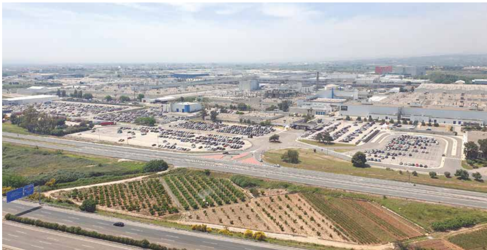
Un área industrial de la Ribera.

■ LAS ACTUACIONES MODERNIZARÁN Y DOTARÁN DE INFRAESTRUCTURAS Y SERVICIOS UNA TREINTENA DE POLÍGONOS