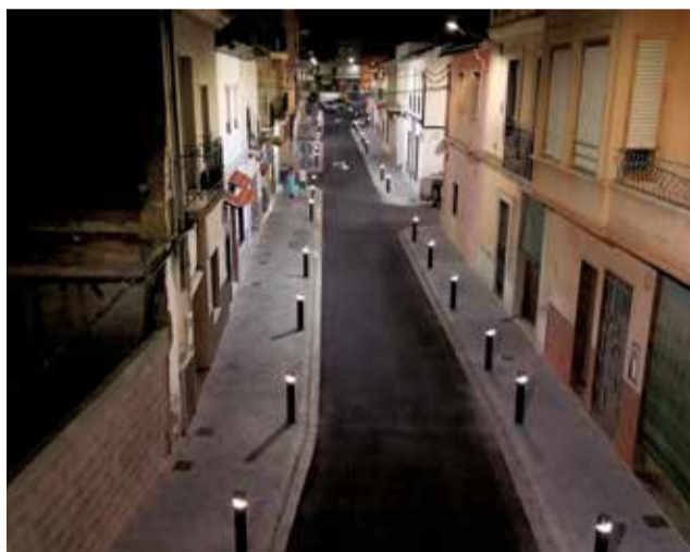
Diverses perspectives del carrer reurbanitzat després de les obres. / EPDA