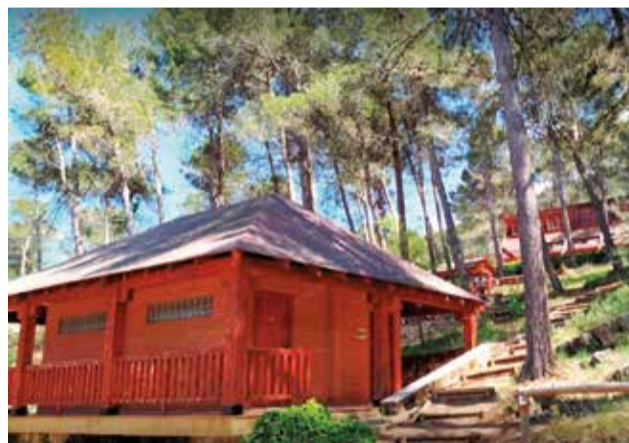
El espacio Zamorano, en Agres.