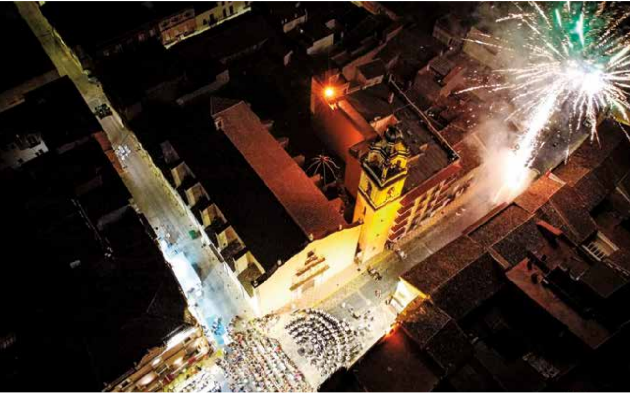
Concert a Guadassuar.