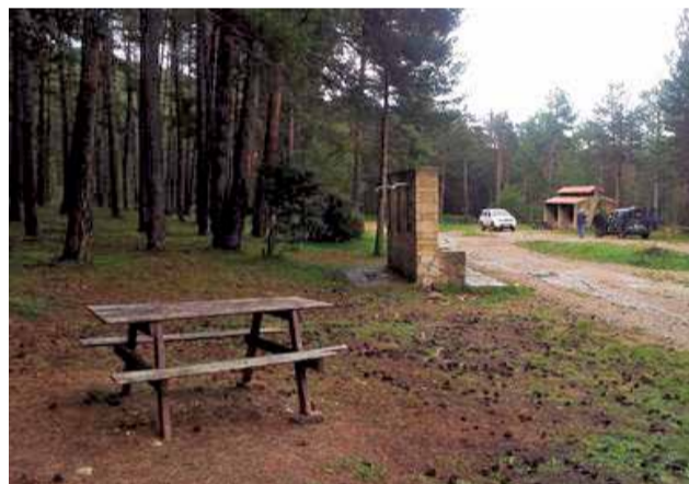
El Planàs en La Vistabella. / EPDA