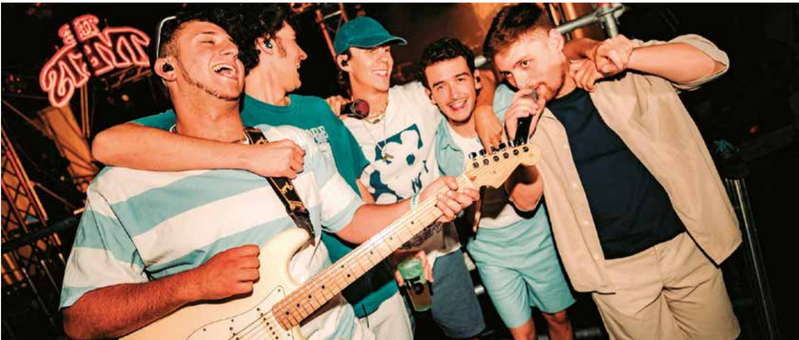
The Tyets, grup de música que arrassa i que estarà a Alzira el 8 d'octubre, junt amb altres.

LES ENTRADES PER AL CONCERT, QUE SE CELEBRARÀ EL DIA 8 AL RECINTE FIRAL DE LA CIUTAT, JA ESTAN A LA VENDA