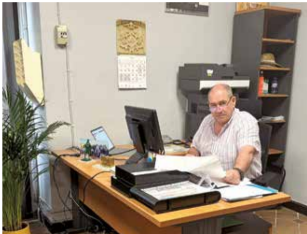
Un operario realizando las labores, el concejal delegado y el mapa de actuaciones por zonas.