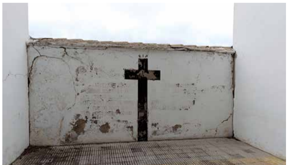
Cementiri de Albalat de la Ribera.

Tal y como destaca la vicepresidenta Enguix, “el presupuesto de más de un millón de euros que destinamos este año a memoria demuestra que, para este gobierno de la Diputació, sigue siendo una herramienta esencial en la sociedad actual para construir un futuro sólido y democrático”.