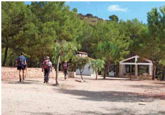
Zona de acampada de Higuieruelas.

Cada vez más gente, especialmente en los rangos de edad más joven, buscan opciones vacacionales huyendo de los grandes epicentros del turismo. La opción de desplegar una tienda y pasar unos días entre la naturaleza es posible en algunos espacios de Castellón, Valencia y Alicante; en zonas autorizadas para ello y tiene muchas ventajas.