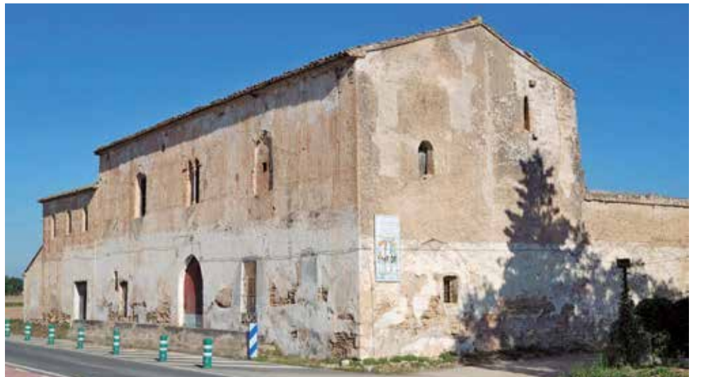
La Granja de Sinyent de Polinyà, una joia del gòtic civil valencià.