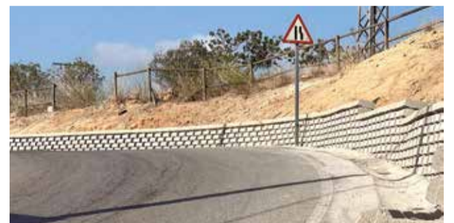
Les autoritats visiten les obres acabades.