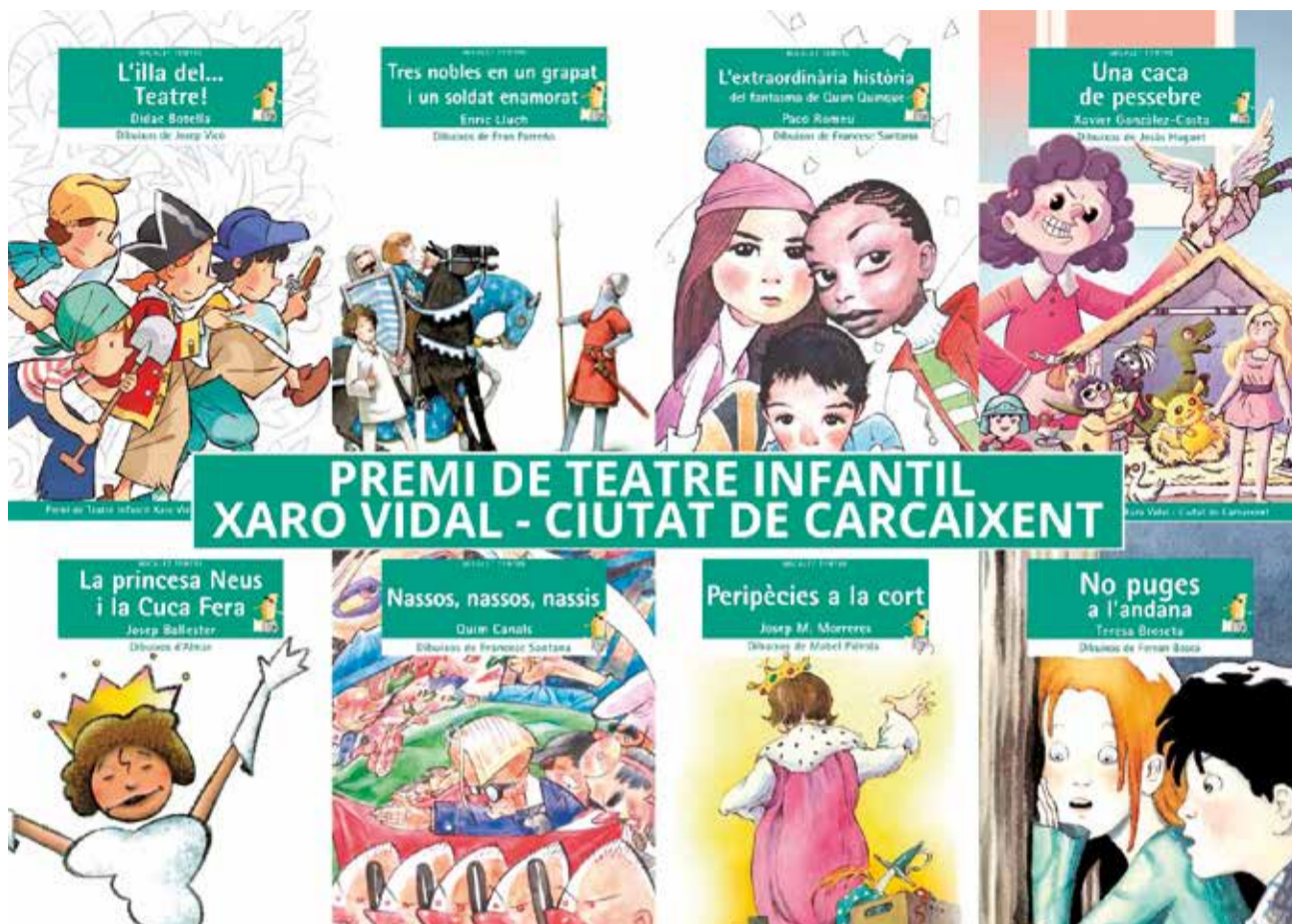
Premi de teatre infantil Xaro Vidal Ciutat de Carcaixent.

Tot i ser un premi biennal des de 2003, l'última edició es va dur a terme en 2020, quedant desert el premi. Des de l'Ajuntament de Carcaixent, l'actual equip de govern vol donar continuïtat al Premi per tal de continuar afa-