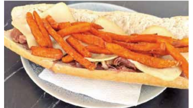
Esmorzar d'El Destí, el guanyador.

La primera edició del Concurs de 'Ruta de l'Esmorzar amb el Nostre Pa Tradicional' celebrada a l'Alcúdia ha tancat amb gran èxit, consolidant-se com una celebració destacada de la gastronomia local i l'ofici dels forns tradicionals a la localitat. Organitzat per l'Ajuntament de l'Alcúdia, el concurs ha permès als residents i visitants gaudir d'una varietat de deliciosos esmorzars elaborats amb ingredients locals i el característic pa tradicional de poble.