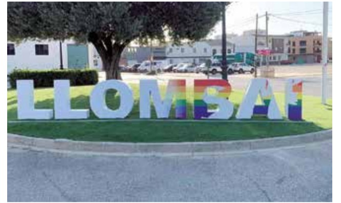
Bandera arrancada en una rotonda de Llombai.