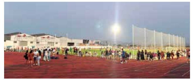
El Cotif a Guadassuar.