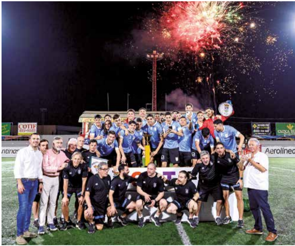
Campions de la 40 a edició, autoritats i representants.