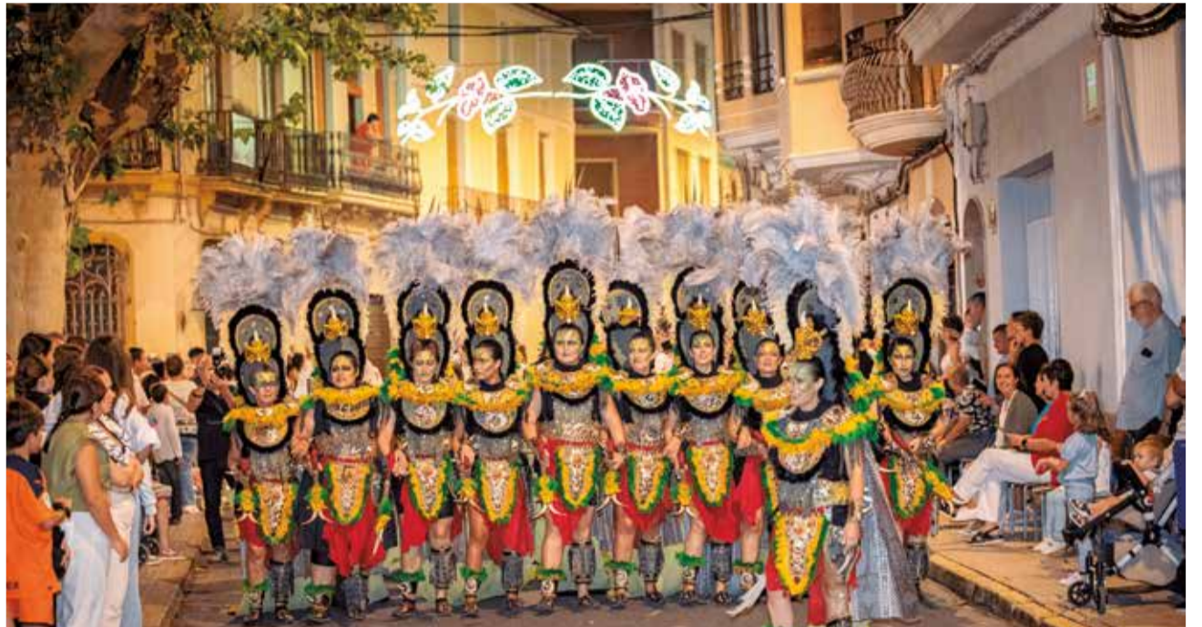
Moros i Cristians de Carlet.

Per descomptat, com és característic de les festes