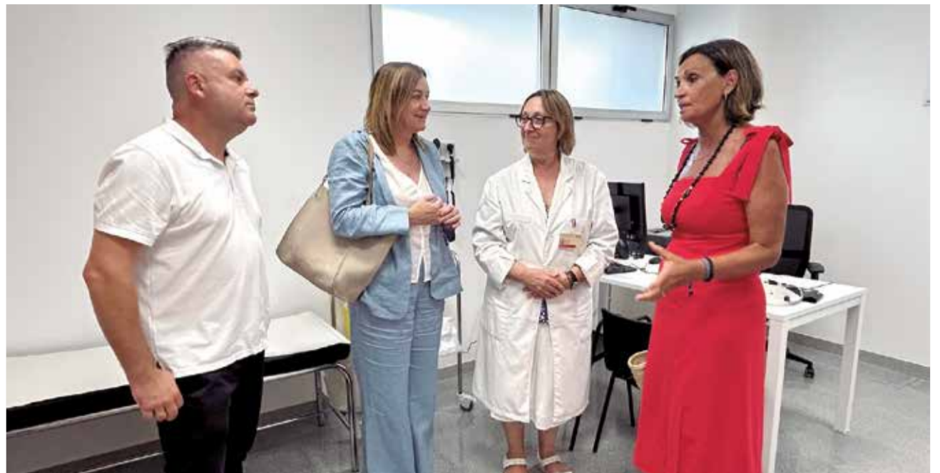
Un instant de la visita de les autoritats al consultori auxiliar de Fortaleny.