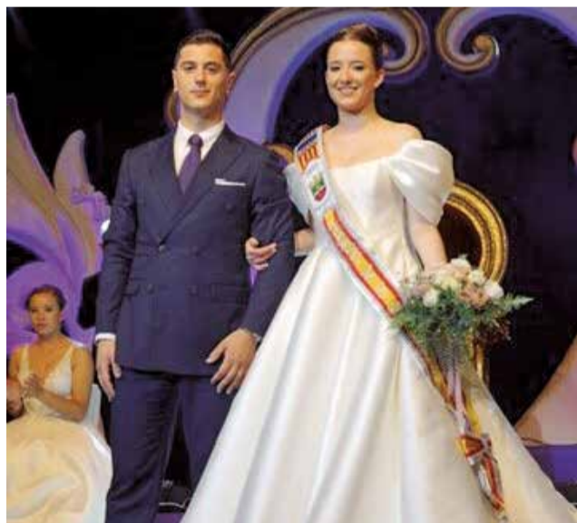
Regina de ls Festes 2024.

Posteriorment, tindrà lloc el passacarrer de recollida de festeres el dia 15 i de festeres el 16, missa amb la parti-