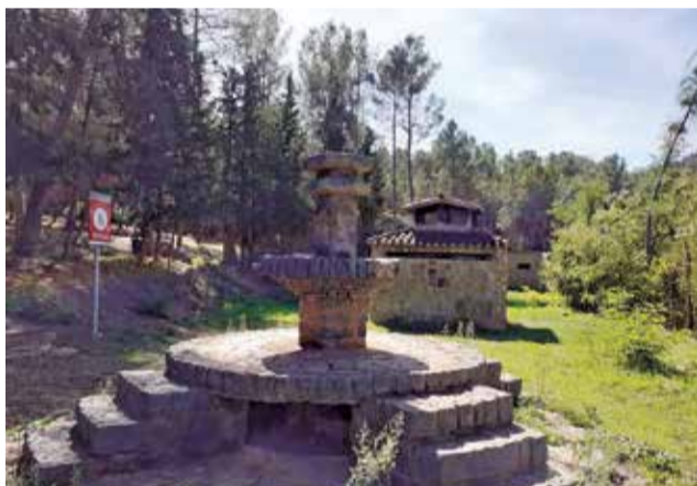
Zona de acampada de Titaguas.

La única zona de acampada libre de la provincia de Castellón está ubicada en el Parque Natural del Penyagolosa, en el término municipal de Vistabella del Maestrat. La instalación se encuentra bajo una extensa arbolada de pino silvestre y pino laricio. Dispone de aseos, duchas, paellers, fuente y mesas. Es una zona ideal para iniciar rutas de senderismo hacia el pico de Penyagolosa o travesías por el GR-7 o GR-33. Para acampar es necesaria la presentación de una declaración responsable.