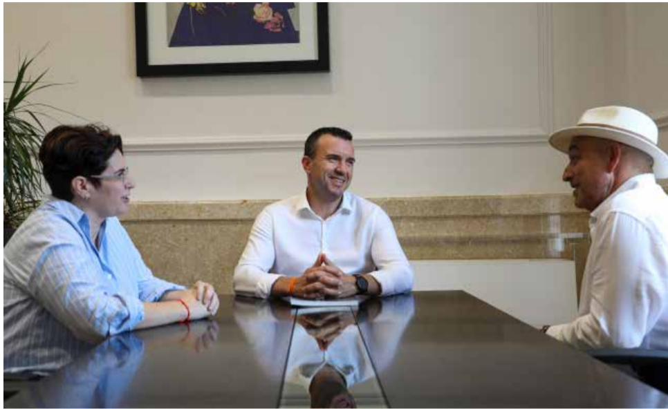
Un instant de la reunió amb el president de la Diputació de València.

EL MUNICIPI REP UNA INVERSIÓ D'1,3 MILIONS QUE TAMBÉ DESTINARÀ A CREAR ESPAIS JUVENILS