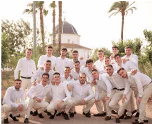
Festers d'enguany.