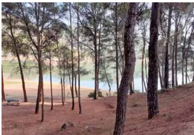
Embalse de Buseo de Chera.

Fuente Muñoz es una de las áreas recreativas más populares de la provincia de Valencia y cuenta con una zona de acampada junto al embalse de Benagéber, rodeada de un pinar de pino carrasco. Se trata de un espacio de con gran calidad visual, al reflejarse todas las elevaciones y vegetación que rodean al embalse en el agua, generando un paisaje muy característico de este pueblo joven, ya que en los años 50 tuvo que cambiar su antigua ubicación, que quedó en las profundidades del embalse. Dispone de paellero, mesas, fuente, aseos y duchas. Es necesaria la presentación de una declaración responsable.