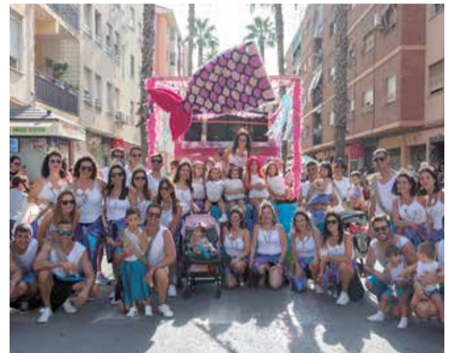
Un instant de les festes de l'any passat.