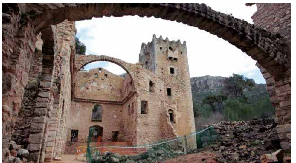
Montestir de la Murta, a Alzira. / EPDA