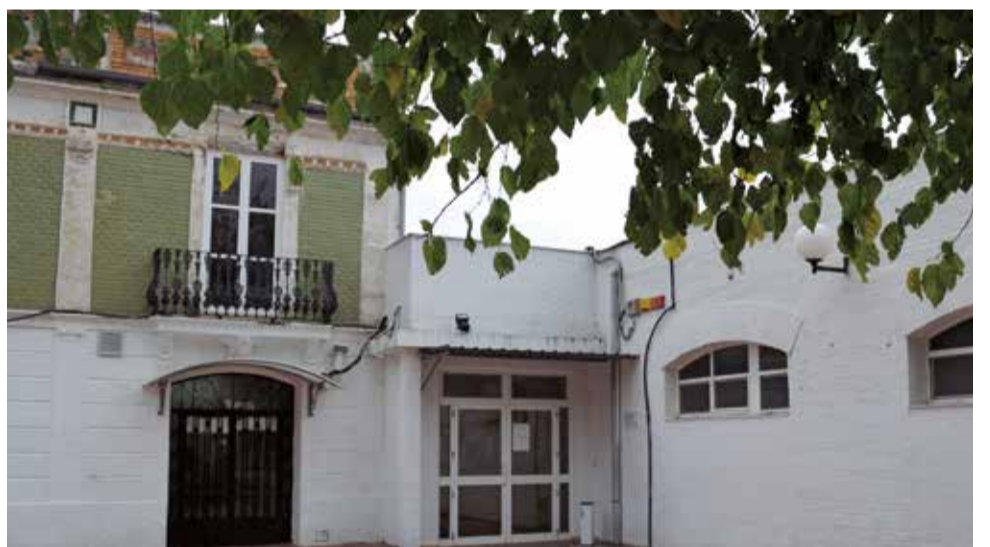
Hort de Sant Feliu, a Alginet.