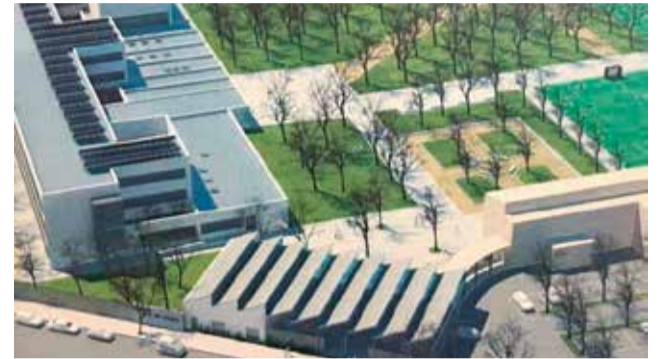
Recreació del nou centre.

Encara que inicialment el termini d'execució estava previst en 30 mesos, l'empresa adjudicatària Vialterra Infraestructuras, S.A, ha comunicat que l'objectiu és haver finalitzat la construcció per al curs 2025/2026, si no hi ha cap imprevist, per a continuar després amb la demolició. A més, ha establert que l'execució de les obres siga compatible amb el desenvolupament normal de les classes i que no supose la reubicació de l'alumnat en ba-