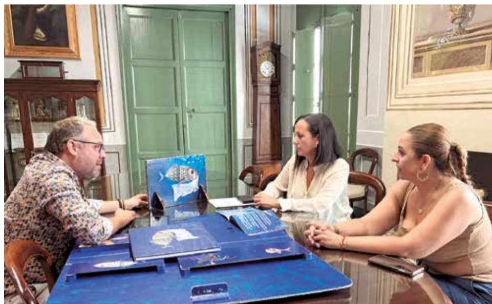
Posada en marxa de la iniciativa.

La Regidoria d'Educació desenvoluparà el projecte en tots els centres educatius del municipi, a més de programar activitats al llarg de l'any