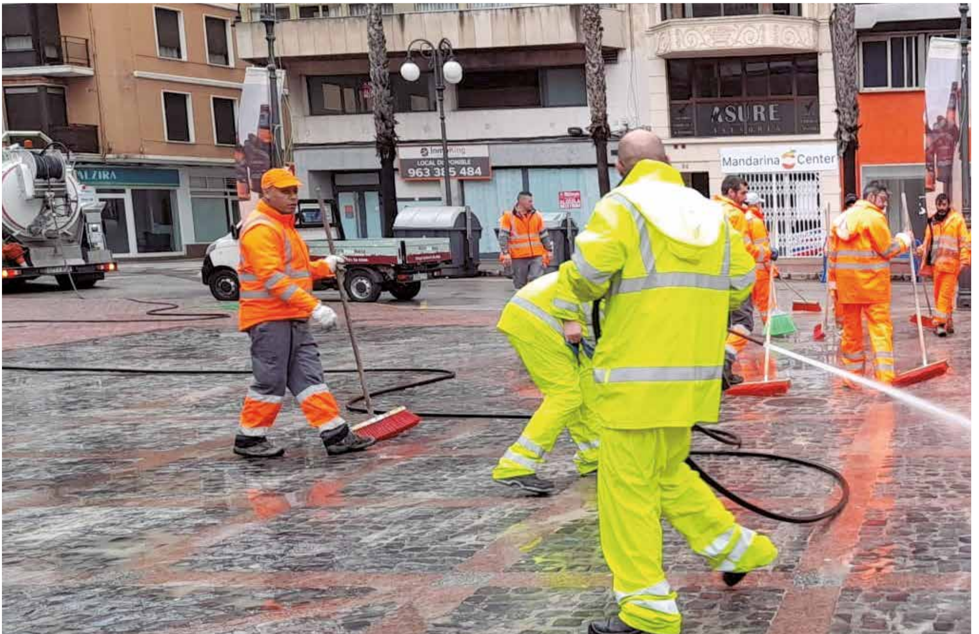
Dispositiu de neteja en Alzira.