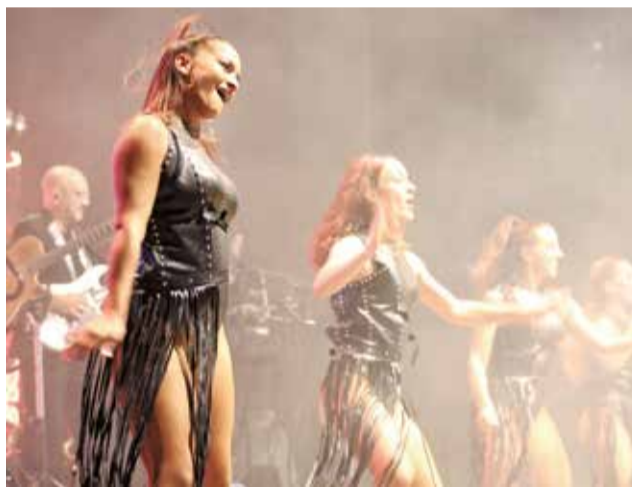
Varios momentos de los actos de la programación de fiestas.