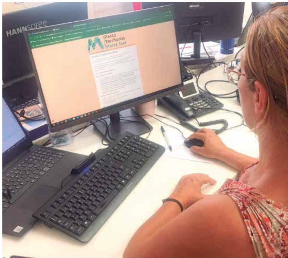
Una tècnica consulta el llistat d'empreses.

Una altra de les aplicacions que pot tindre l'eina, segons l'àrea de Negoci, és la de conèixer les activitats auxiliars d'un mateix sector que existeixen a la