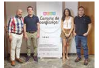
Representants d'ACST. / EPDA