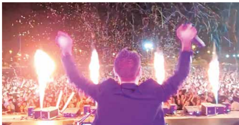
Una de las actuaciones del año pasado.

El viernes, 6 de agosto, de 18.30 a 20.00 horas, vuelve Carnestoltes Joves al Carrer, con música y concurso de disfraces. Es una actividad para un público familiar, adolescente y joven. Está organizado por el Consell