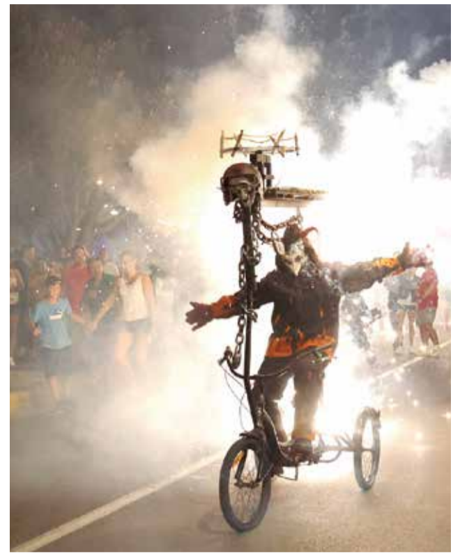
Un correfocs pels carrers.

EL PROGRAMA D'ACTES DEL 30 D'AGOST AL 10 DE SETEMBRE INCLUIX LES ACTUACIONS DE BERET I LOS ZIGARROS