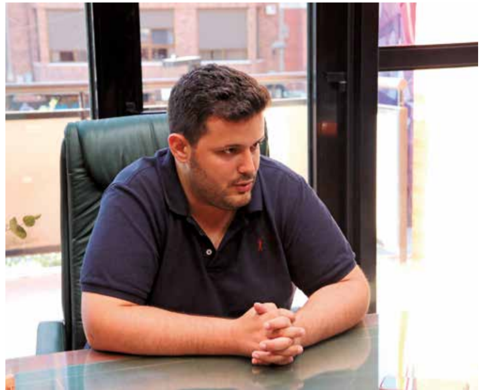
Ferris responde a las preguntas de El Periódico de Aquí.

► Yo creo que si por algo me he caracterizado es por intentar tener una