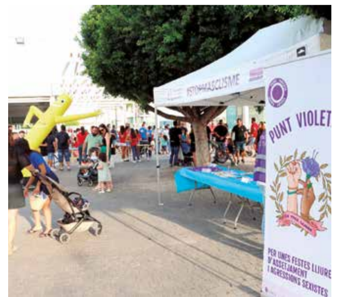
Un punt violeta en les festes d'un poble.

En la campanya, que també es difon a través de les xarxes socials, es realitzen recomanacions per a la persona que està sent víctima d'una agressió com ara: "cerca a alguna persona i fingeix que la coneixes per a eixir de la situació" o "dirigeix-te a algú que tingues a prop i explica-li el que està passant". "Si et trobes en algun esdeveniment festiu, acudeix al Punt Violeta o a l'organització, i explica'ls el que està passant", indica la campanya. "No tens la culpa de res", es recalca a la víctima.