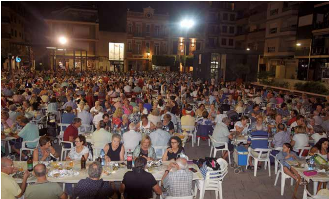
El sopar popular és un acte dels més multitudinaris.

10.30 h: Tercer open tir al blanc en el camp de la Pobla de Vallbona. Organitza: