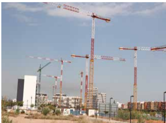
Grúas y edificios en construcción.

A diferencia de otros municipios, que han paralizado la concesión de licencias de forma cautelar, la intención del equipo de Gobierno es que se convierta en definitiva cuando se cumplan todos los plazos, por lo que se ya se ha redactado la propuesta de planeamiento al efecto. Es decir, en Quart de Poblet ya no habrá más pisos turísticos que los que ya existen.