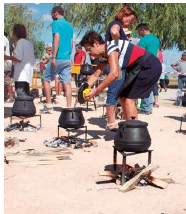
El concurso de Allipebre.

Además del concurso, desde el Club de Producto del Port de Catarroja se impulsan diferentes eventos como la XI Festa de la Sega de l'Arròs organizada por el Consejo Regulador de la Denominación de Origen Arroz de València o las exhibiciones de vela latina que destacan la importancia del Port como albergue de las tradiciones y la historia del municipio.