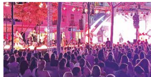
Varios moments del desfile.