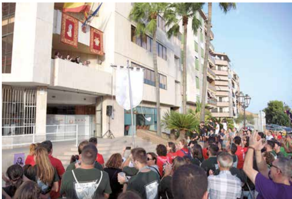
El pregón desde el balcón del ayuntamiento.

Una de las grandes atracciones será el concierto gratuito del reconocido grupo Efecto Pasillo, que tendrá lugar el 9 de agosto a las 23:30 en la explanada del Auditori. Este evento promete ser uno de los puntos culminantes de las festividades. "Hemos preparado un car-