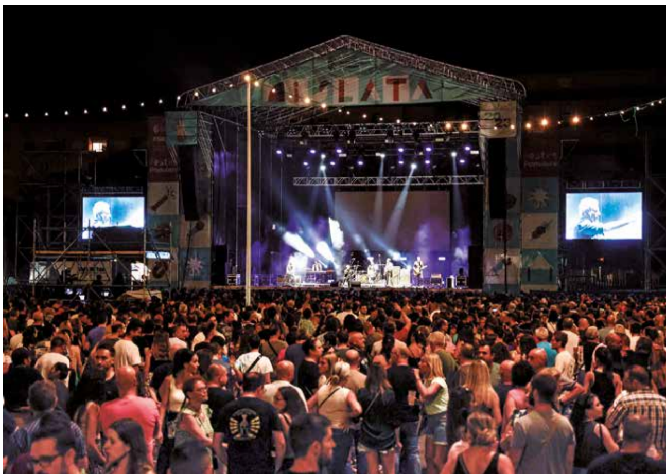
El público asistente a una de las actuaciones en el recinto ferial.

Tras el lunes 2 de septiembre, día de fiesta local, empezarán las jornadas dedicadas a las fiestas populares organizadas por el propio Ayuntamiento de Mislata. El recinto ferial, ubicado en la calle Hospital, abrirá sus puertas el 3 de septiembre con un desfile inaugural, un castillo de fuegos artificiales y el habitual encendido