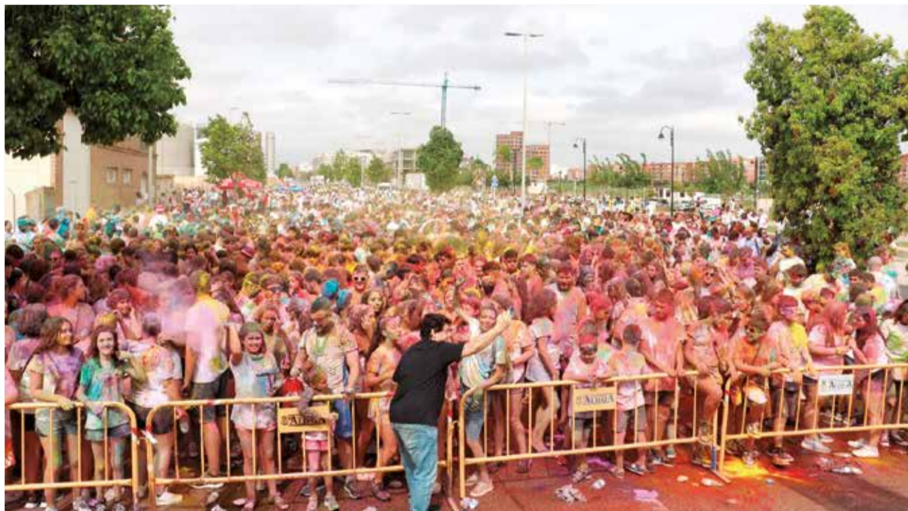
La Holi Quart es el acto que atrae a un mayor número de participantes.

Uno de los actos que más expectación genera es la Holi Quart, la fiesta del agua, donde cientos de jóvenes disfrutan de una divertida carrera llena de color y desenfreno que cada año atrae a un mayor número de participantes.