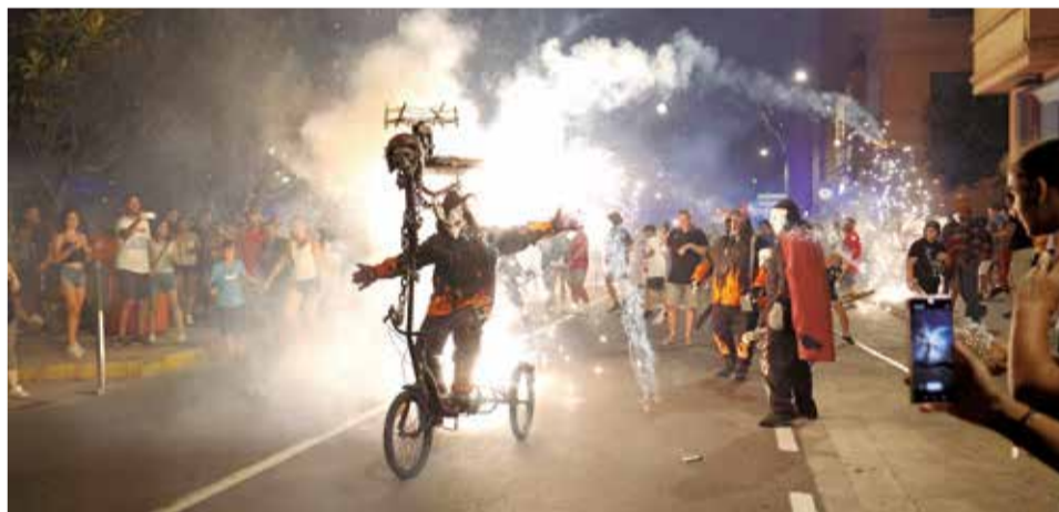
Un espectáculo de fuego y pólvora.

de luces, dando así el inicio a 5 días intensos que albergarán las casetas de asociaciones y que contarán, entre otras actividades, con un desfile de disfraces, el tradicional reparto de pinchos, un correfoc y la mascletà nocturna que cerrará los actos del último día.