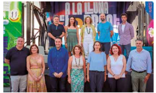
El equipo de gobierno en la presentación.