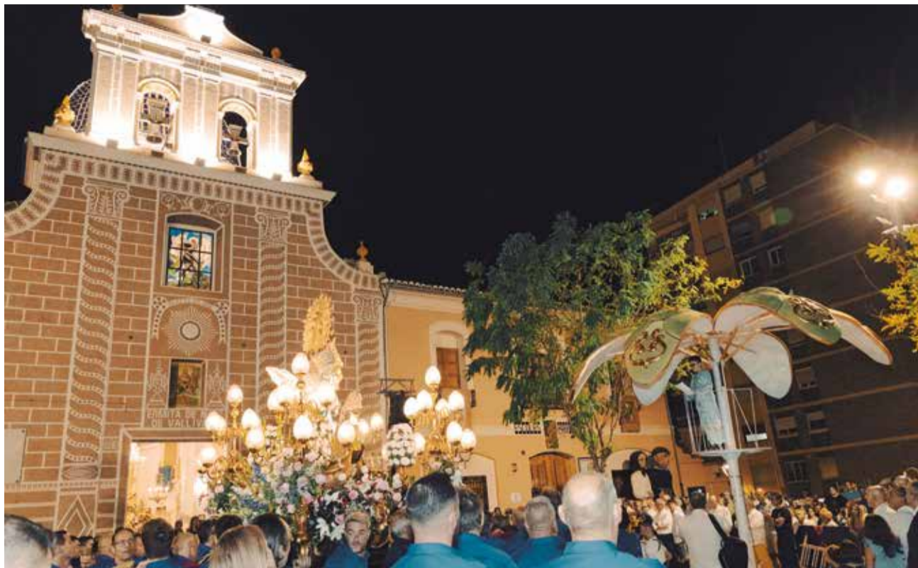
El Cant de la Carxofa en les festes majors de Picassent.