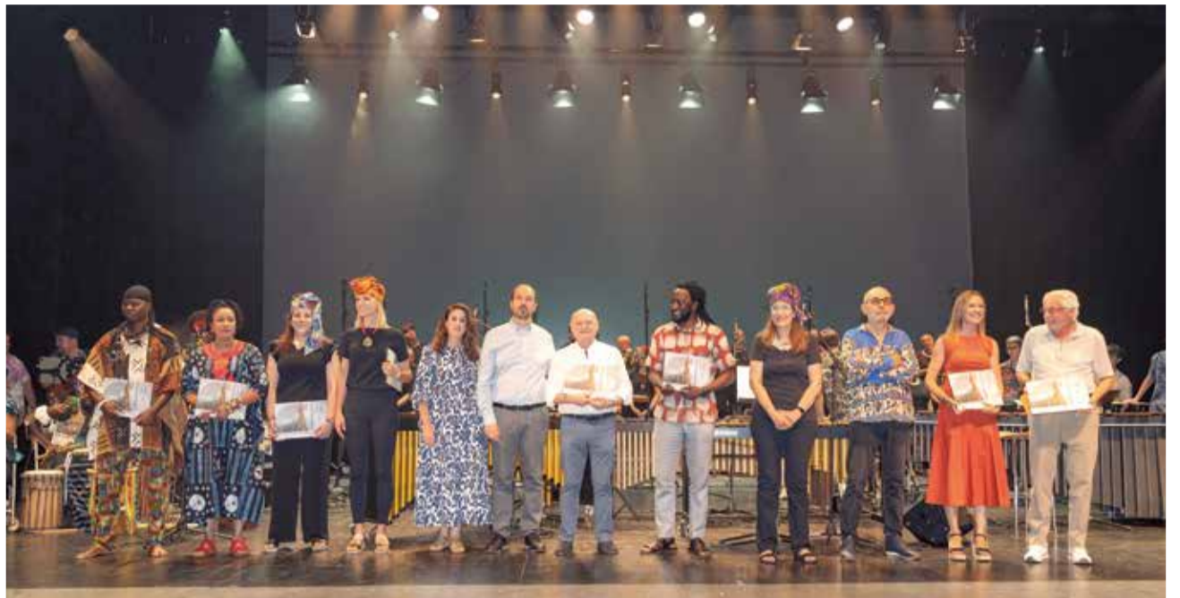
L'Orfeó d'Aldaia dalt de l'escenari.

Les autoritats, encapçalades per l'alcalde Guillermo Luján, van lliurar reconeixements als representants de les agrupacions participants a l'espectacle, al que van acudir el diputat de Cultura, Francisco Teruel, i representants de la corporació.