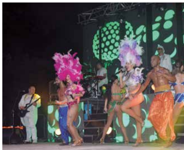
Un dels espectacles de l'any passat.

18.00 h: Vesprada de jocs medievals de Moros i Cristians a càrrec de la Junta Festera de Moros i Cristians en la Plaça Ausias March. 22.30 h. Ambientació musical en el Recinte Festiu