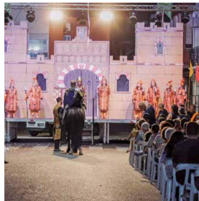
La representación de les Ambaixades.