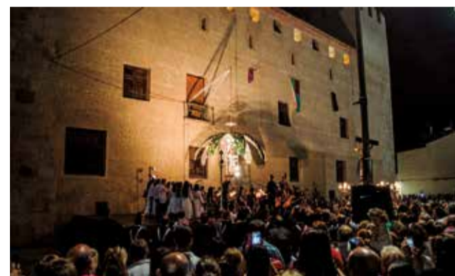
El Cant de la Carxofa en Alaquàs.

També el Mercat medieval donarà la benvinguda a les festes el divendres 30 d'agost, amb oficis tradicionals, gastronomia i artesanía local i que es completarà amb el tradicional pregó.