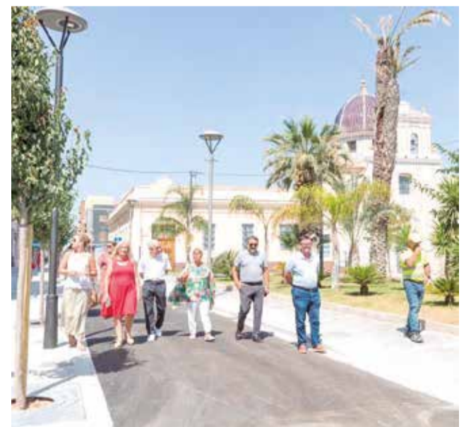
L'obertura de l'entorn de l'Ermita.