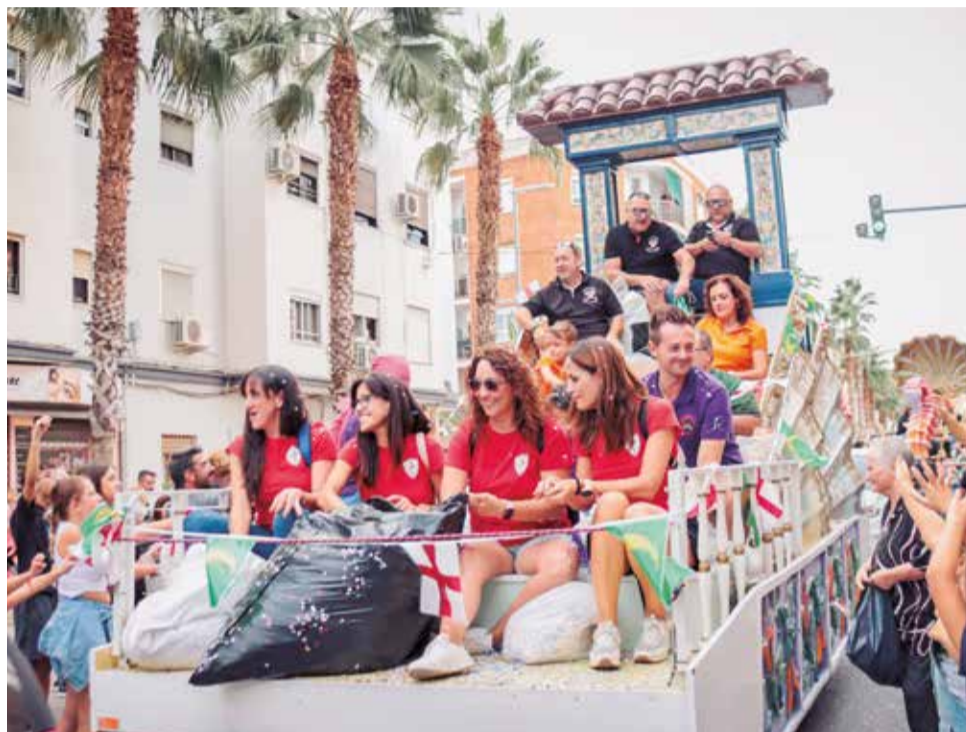
Una de las carrozas de la cabalgata del año pasado.

Asimismo, se ha impulsado una programación para todos los públicos. Desde propuestas para público más mayor con el Concierto Sénior