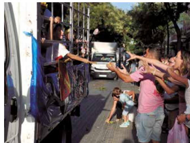
El público sigue la cabalgata.

Una de las novedades deportivas de estas fiestas de Santa Ana 2024 ha sido el 'I Open Blitz Albal' organizado por el Club Ajedrez Albal, donde más de cien ajedrecistas se dieron cita en la cooperativa de Albal y se repar-