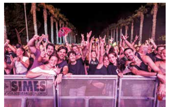
Varios moments dels actes festius.