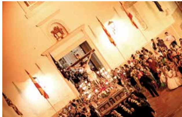
Procesión del Día del Cristo en Alcàsser. / ENCUADRE

Las Fiestas Mayores de Alcàsser llegan después de las fiestas en honor a la Virgen del Carmen y a