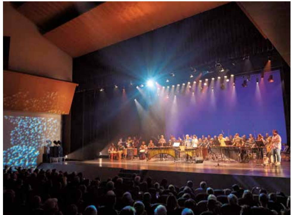
Un moment de l'actuació dalt l'escenari.