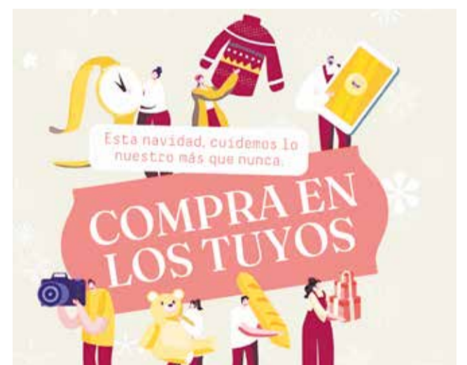
Campanya "en nadal som molt de botigueta"

Llombai afavorix el comerç local amb la campanya comercial "En nadal som molt de botigueta".