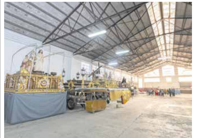
Futur Museu de la Setmana Santa de Gandia / A.O.