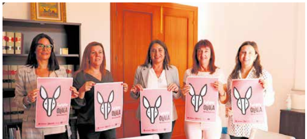
Imatge d'arxiu del programa «Tardor Oliva» 2022