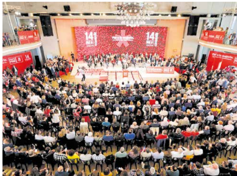
Congreso del PSPV en Benidorm en 2021.