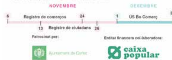
Cartell campanya 'Bo Comerç'.

L'Ajuntament de Carlet no es fa responsable del deteriorament, pèrdua o extraviament del Bo Comerç que, en cap cas, serà reemborsat.