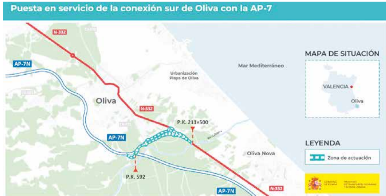
Mapa de situación de la nueva conexión de la carretera N-332 con la AP-7.