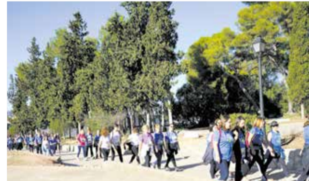
Moment de la marxa

La marxa solidària de 5 quilòmetres ha passat per espais molt emblemàtics de la localitat com ara la muntanyeta