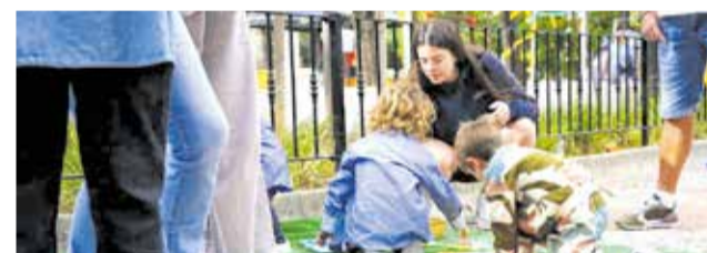
Families durante la celebració de la jornada

Entre las diferentes actividades que tuvieron lugar, destacaron, manualidades, acciones de fomento de la cultura valenciana, pintacaras i gastronomia. La programación se completó con la representación del sainete valenciano