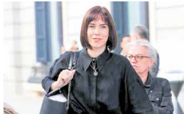
La ministra Diana Morant en una imagen de archivo.

Otro de sus principales objetivos es que la inversión a las universidades alcance al menos el equivalente al 1% del PIB en 2030 - hoy en el 0,7%.