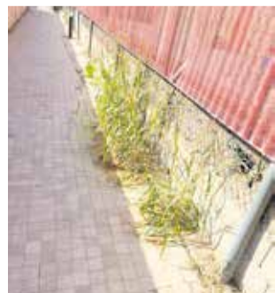
Estado actual del mirador del Serpis de Gandia.

mo un ambiente poco saludable, aumento de la delincuencia y una mala imagen para los gandienses y nuevos turistas.