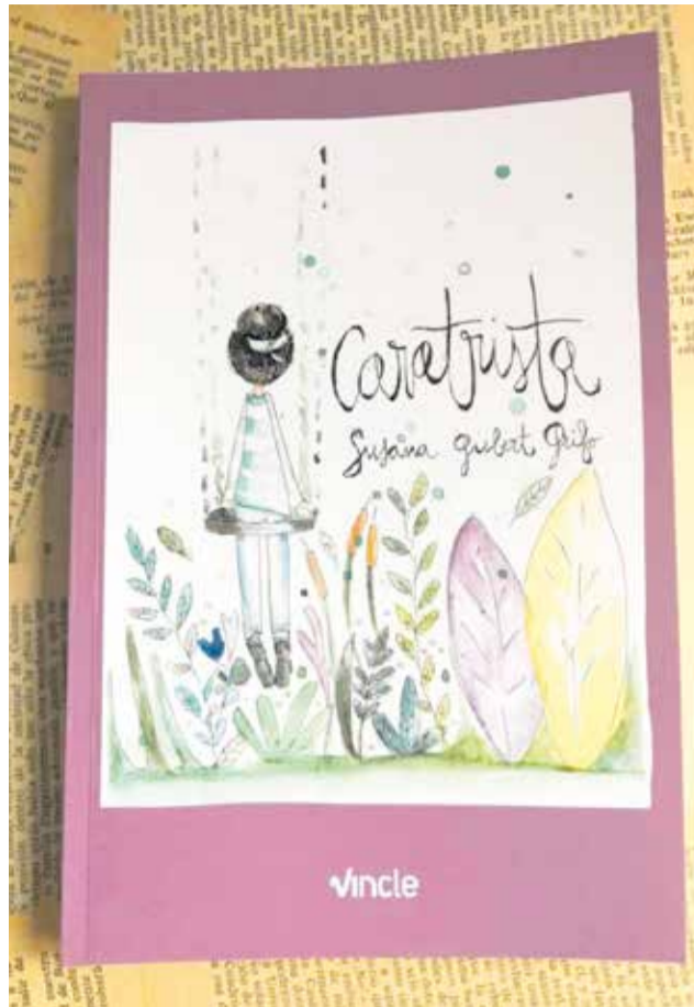
Portada del llibre 'Caratrista'.

En paraules de la fiscal... «Les dones podem ser tan masclistes com els homes. De fet, moltes ho són -o ho som- sense saber-ho, perquè els sesgos masclistes són una cosa que ens han