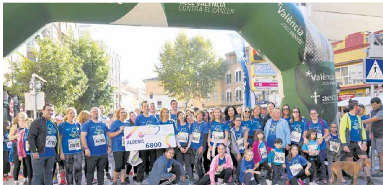
Participants al punt d'eixida de la marxa, amb el xec dels diners recaudats.

la investigació del càncer. Enguany, a Alberic s'han venut 1360 dorsals, el que es tradueix en una recaptació de 6.800 euros. En finalitzar la prova, l'organització va repartir a totes i tots els participants rosquilletes i fruita gràcies a la col·laboració de les empreses Bollo i Anitín. A més, per a tancar el matí es va celebrar una rifa de productes que distints comerços locals van voler donar per a sumar esforços amb la recollida de diners.