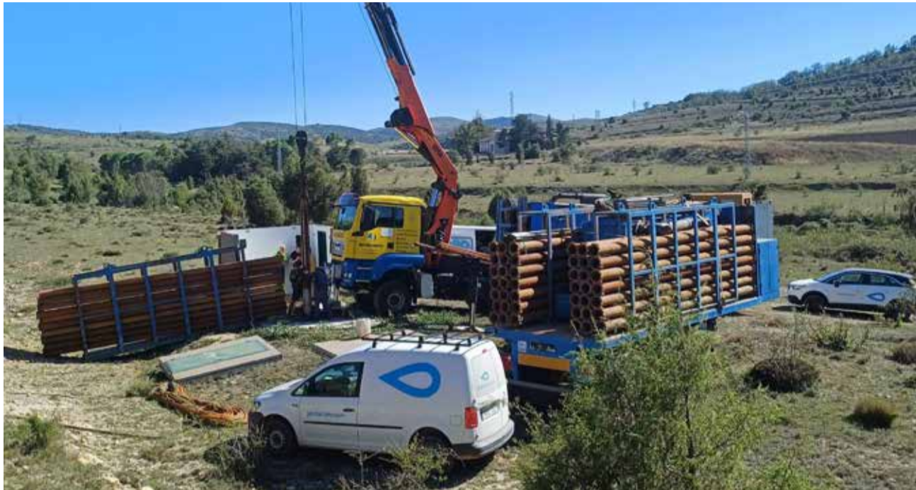
Treballs al Pou de Colomer IV de Morella.

AMB ESTA AJUDA S'ANUL·LARÀ LA TAXA EXTRAORDINÀRIA SOBRE EL CONSUM APROVADA PEL PLE