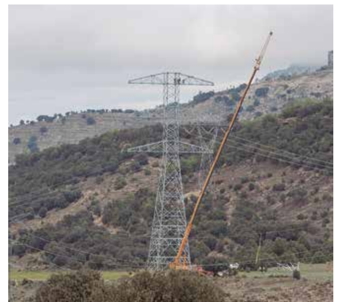
Torre de Muy Alta Tensión (MAT) en Morella.