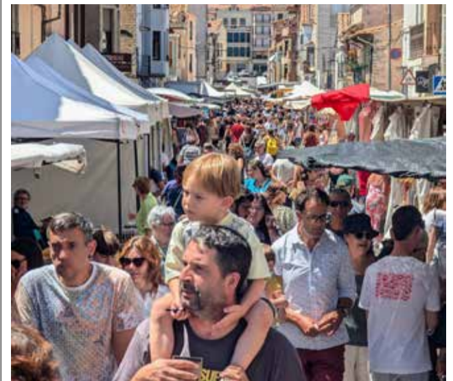
Assistents a la Fira de la Magdalena de Vilafranca.