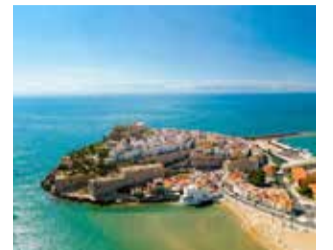
Vista de Peníscola.