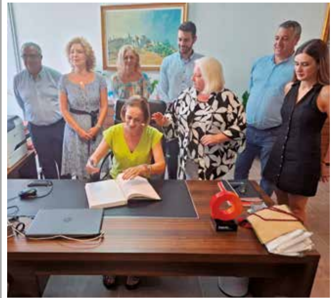
Momento de la firma en el libro de honor.