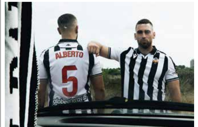
Nueva equipación del CD Castellón.