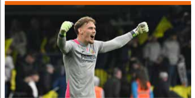
► El Villarreal y el Chelsea han cerrado un acuerdo para el traspaso del portero Filip Jorgensen, según el periodista especializado Fabrizio Romano. Ambos clubes habrían pactado el pago de 24,5 millones de euros.

El descuento para los abonados estará activo dos o tres días después de renovar, no automáticamente después de realizar la renovación.