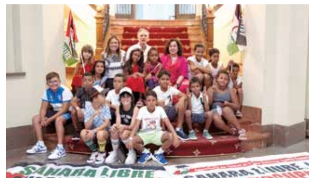
Recepció a la Diputació de Castelló.

Com ha indicat Torlà, "esta iniciativa és possible gràcies a l'esforç conjunt de diverses associacions, així com al compromís, la sensibilitat i solidaritat de nombroses famílies".