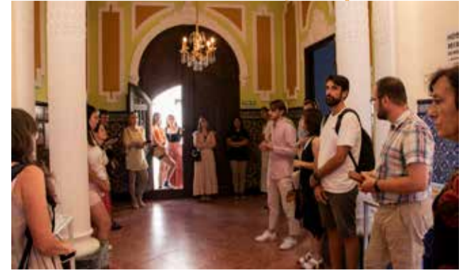
Recorrido por Villa Purificación.

nimos ha alcanzado un destacado protagonismo como ningún otro lugar de la comarca, con exposiciones, conciertos, encuentros literarios, además del Centro de Interpretación de la Batalla de Levanta, CIBAL, que es el eje vertebrador de otras numerosas actividades relacionadas con la Guerra Civil. No es