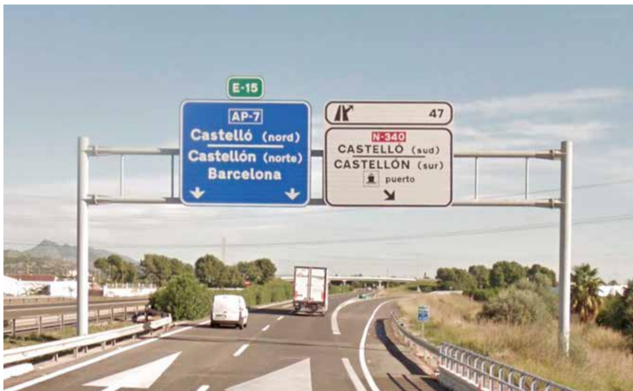
Cartell amb el topònim bilingüe de Castelló en una eixida de l'AP-7 en 2018.