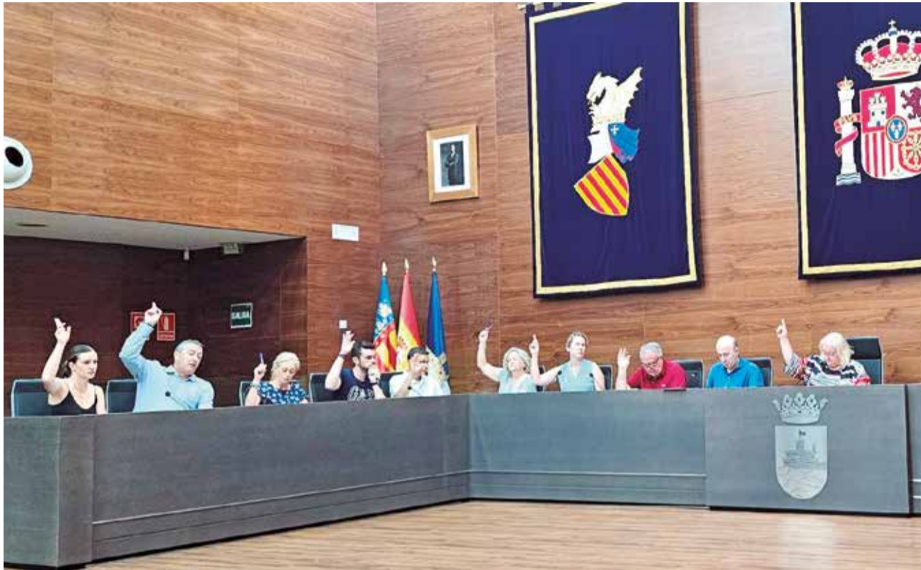
Un instante durante la sesión ordinaria de julio del pleno de Oropesa del Mar.

EL PLENO TAMBIÉN APRUEBA EL CONVENIO PARA LA FINANCIACIÓN Y EXPLOTACIÓN DE LA DESALADORA