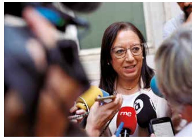
Llanos Massó, presidenta de les Corts.

La oposición ha censurado la decisión de la presidenta. Desde el PSPV-PSOE han reprochado que se “aferre al cargo sin ningún tipo de escrúpulos”, mientras que Compromís ha afirmado que “lo único que le interesa es cobrar los 100.000 euros al año y tener