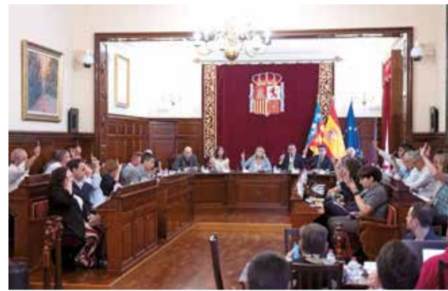
Ple ordinari de juliol de la Diputació de Castelló.