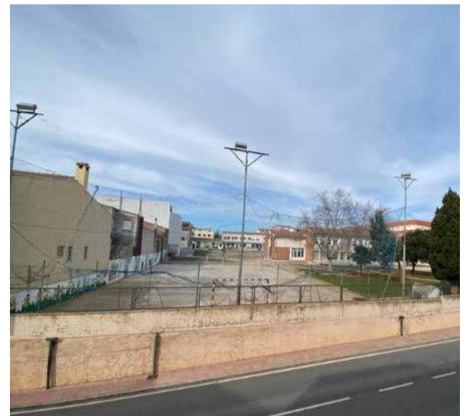
CEIP Joan de Brusca d'Albocàsser.