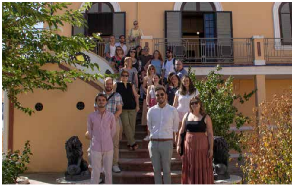
Asistentes y ponentes en las jornadas.

VILLA PURIFICACIÓN ACOGIÓ LAS DIVERSAS INTERVENCIONES QUE PUSIERON DE MANIFIESTO LA IMPORTANCIA DEL TURISMO EN LA ZONA