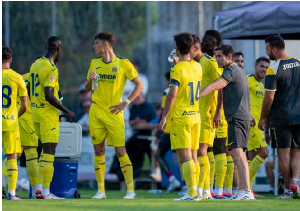
Segundo amistoso de la pretemporada contra el FC Sion suizo.

El 24 de julio, el Villarreal se enfrentó al FC Sion en el Estadio Eugène-Parlier de Montreux, Suiza. El equipo de Marcelino García Toral consiguió su primera victo-