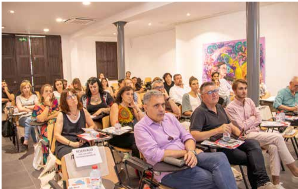
Intervenciones en la villa Purificación.