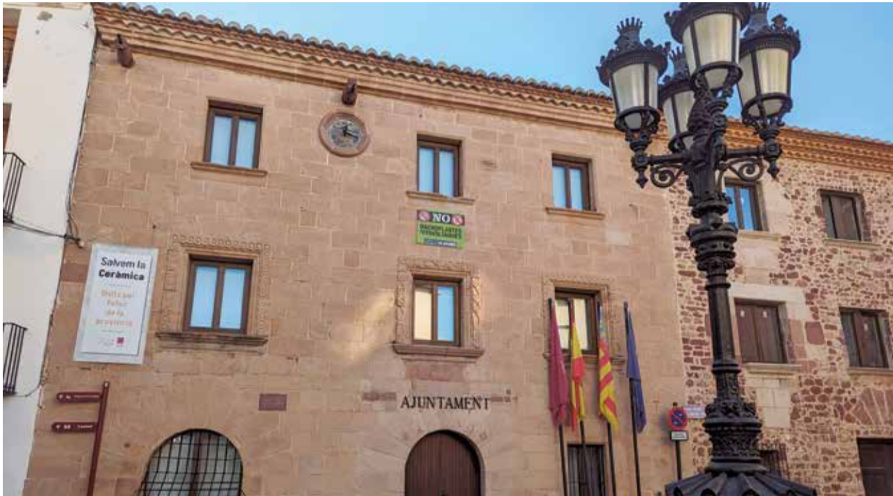
Façana de l'Ajuntament de Vilafamés.

EL CONSISTORI TAMBÉ INICIA ELS TRÀMITS PER A CONFIGURAR UNA COMUNITAT ENERGÈTICA LOCAL