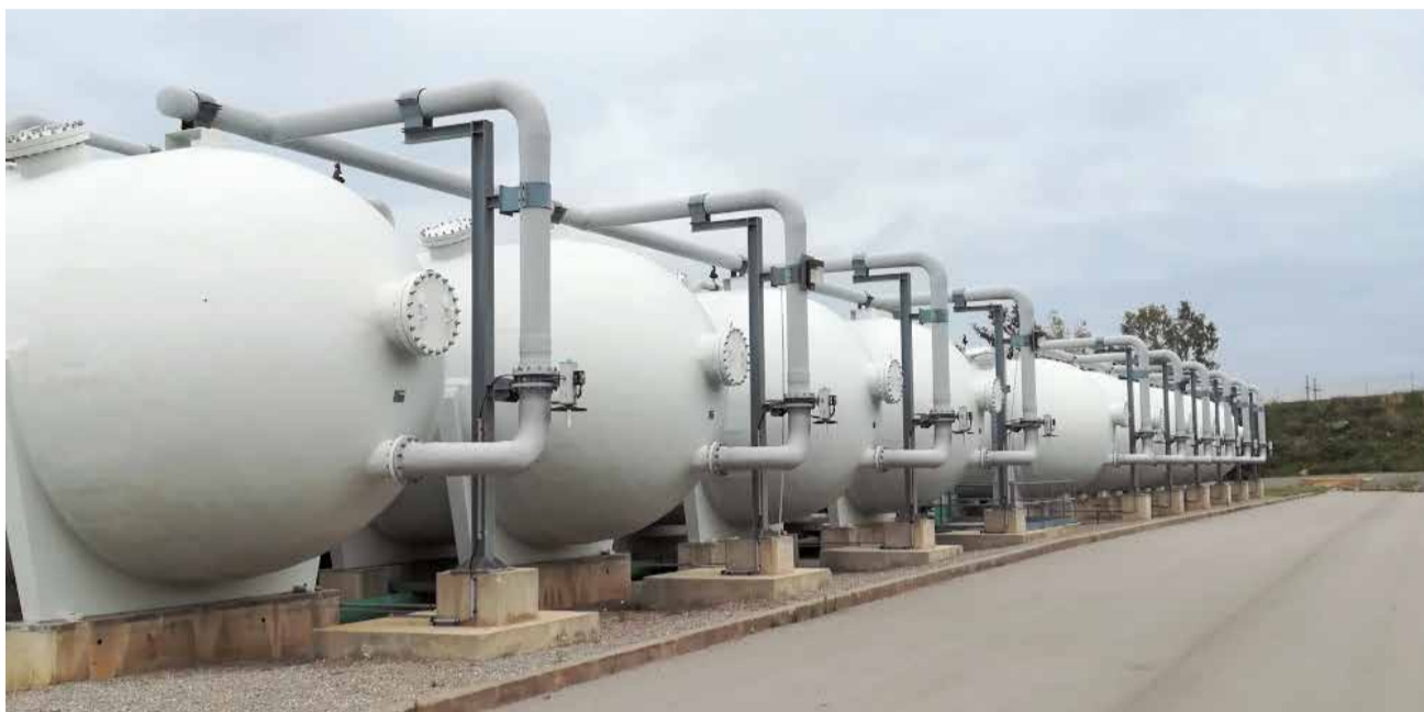
Instal·lacions de la dessaladora d'Orpesa-Cabanes.

EL PLE APROVA LA MOCIÓ PRESENTADA PER L'EQUIP DE GOVERN EN LA SESSIÓ ORDINÀRIA DE JULIOL