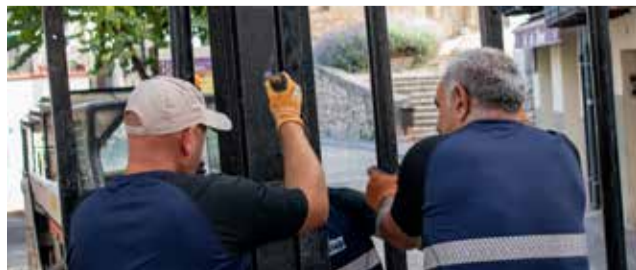
Membres de la brigada municipal munten les barreres per als actes tauris d'agost a Morella.

L'Ajuntament de Morella entra en els últims dies del mes de juliol amb els preparatius de la intensa activitat que tindrà el poble a l'agost. Així, ja s'han començat a muntar les barreres del recinte taurí per a les festes en honor de Sant Roc que començaran el divendres 2 d'agost. Estes