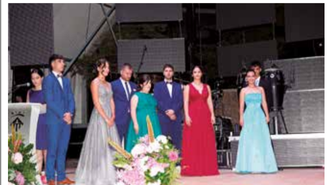
Presentació de la Cort d'Honor de Vilafamés 2024.