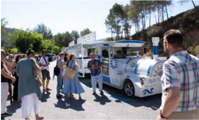
Visita a la Fuente de los Baños en tren turístico. / J.S.