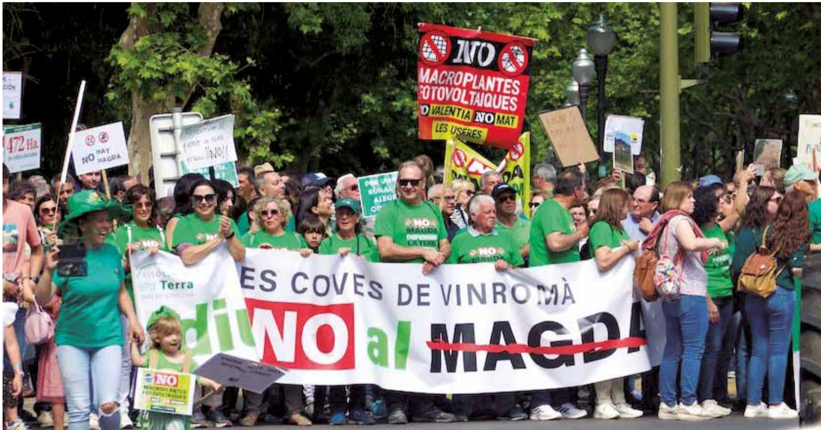
Protesta contra la Magda en Castelló de la Plana en mayo de 2023.

LA PROMOTORA RENUNCIA AL PROYECTO INICIAL DE LA MACROPLANTA SOLAR DE LA PLANA ALTA Y TRABAJA EN UN PLAN B