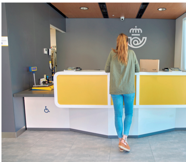
Oficina de Correus en una imatge d'arxiu.

L'empresa de missatgeria continua ampliant la seua oferta en l'àmbit rural per a prestar serveis de proximitat a tota la ciutadania, especialment, en les zones rurals, on l'empresa logística