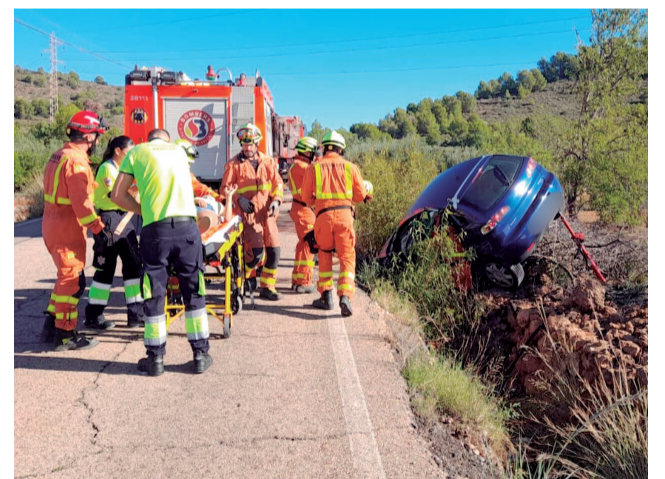
Rescate tras el accidente en Estivella.