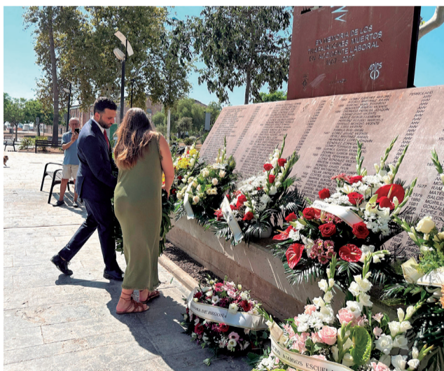
Un instant de l’homenatge el 12 d’agost.

Durant l’homenatge, l’alcalde i la regidora van fer entrega d’una corona de flors en nom de l’Ajuntament, acompanyats per unes paraules emotives de reconeixement a les més de 150 víctimes laborals. Moreno va destacar la importància de recordar aquells que “van