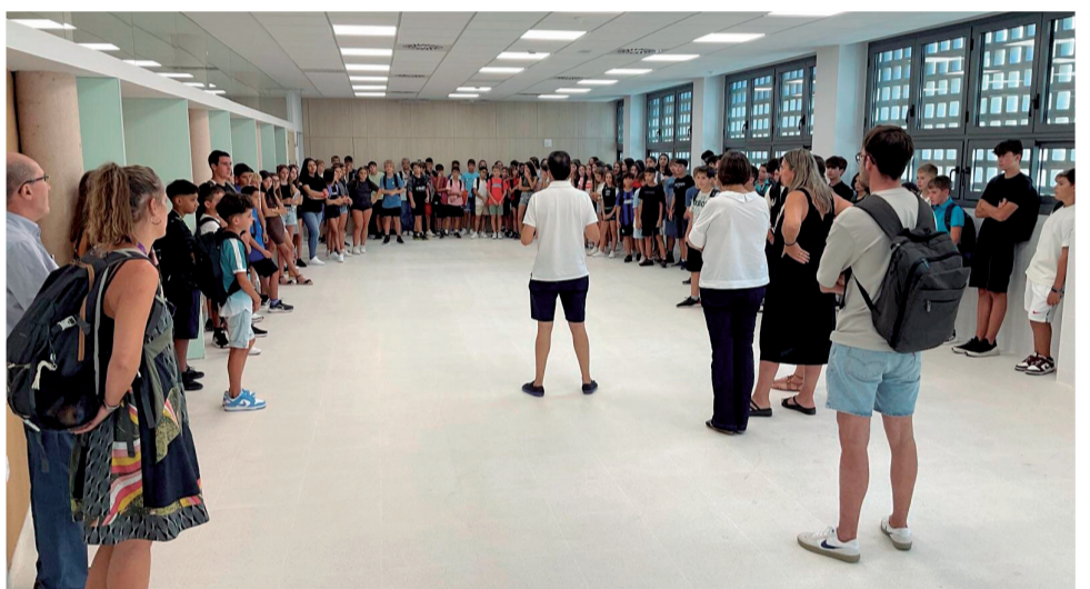
Autoridades, docentes y estudiantes, el día de la inauguración del centro.

ver a estudiar en un colegio digno, tras varios años de esfuerzo y superación de dificultades”, declaró el alcalde.