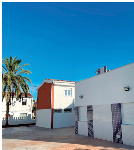
Exterior del nuevo aulario de Algar de Palància.