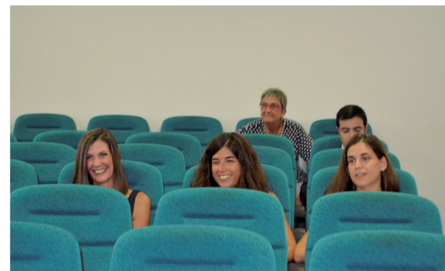
Público escuchando a Sancho en Canet.