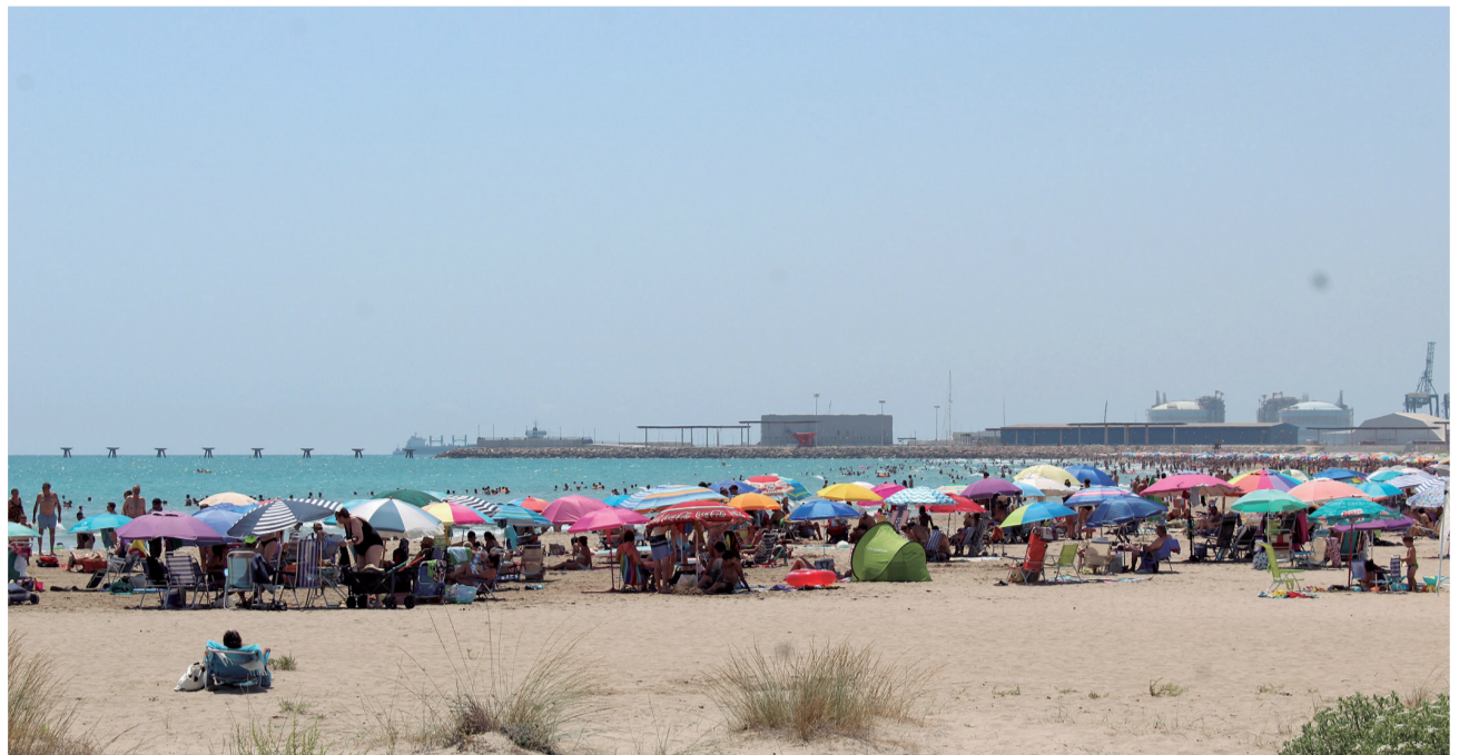
La platja del Port de Sagunt, plena durant un dia del mes d'agost.

Quant a les oficines i punts d'informació turística han atès a més de 5.000 persones, dada que és similar a les visites rebudes pel Castell, monument més visitat de la ciutat, seguit per la Casa dels Berenguer. Un 65 %