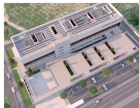
Recreació del futur Palau de la Justícia de Sagunt.

de l'edifici com són la Clínica Forense, el Jutjat de guàrdia, el Gabinet Psicosocial i l'Oficina d'Assistència a les Víctimes.