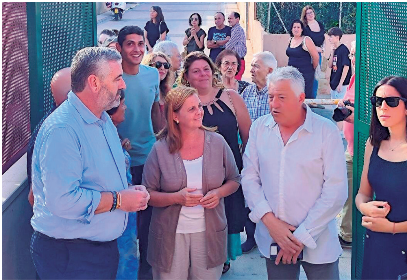
Autoridades y vecinos en la inauguración del aulario de Algar de Palància.

"Hace más de un año que advertimos a la Consellería que