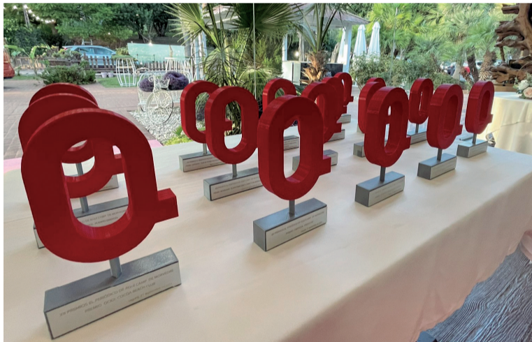
Restaurante El Mirador, donde tendrán lugar los premios.

ció de la platja Racó de Mar, que utilitza solucions sostenibles per combatre l'erosió costanera. En turisme, es reconeixerà la Guia Comarcal de 'birding' elaborada per l'Ajuntament de Sagunt, que enriqueix l'oferta turística amb informació detallada sobre l'ornitologia.