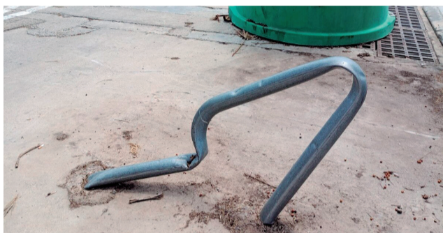
Diversos punts denunciats pel PP.

Malgrat haver informat diverses vegades d’esta problemàtica, Sáez ha lamentat que encara no s’haja actuat per millorar la situació. “Els nostres veïns veuen com els espais estan cada vegada més degradats i perillo-