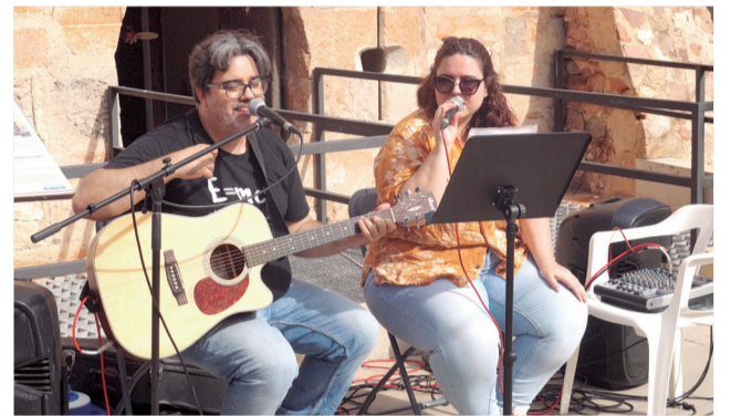
Diversos instants de la Fira del Comerç de Benavites en l'edició d'un any anterior.

Els participants que assisteixen a les diferents actuacions podran recollir un segell en una targeta dissenyada per al Circuit. Aquells que aconseguisquen completar els sis segells, podran rebre un obsequi en l'Ajuntament una vegada finalitzades totes les activitats. El Circuit compta amb la col·laboració de l'Institut Va-