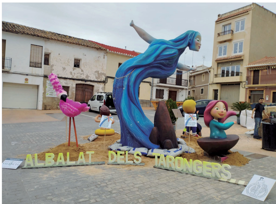
Falla plantada a Albalat en novembre de 2022 gràcies a la Diputació.

La plantada de monuments fallers serà la primera vegada que es realitzarà a Quartell i la segona a Torres Torres, que ja va acollir una iniciativa similar en 2022. A més, Castielfabib estrena aquesta ruta fallera de la Diputació, que inclourà un total de 30 monuments repartits per diverses comarques valencianes.