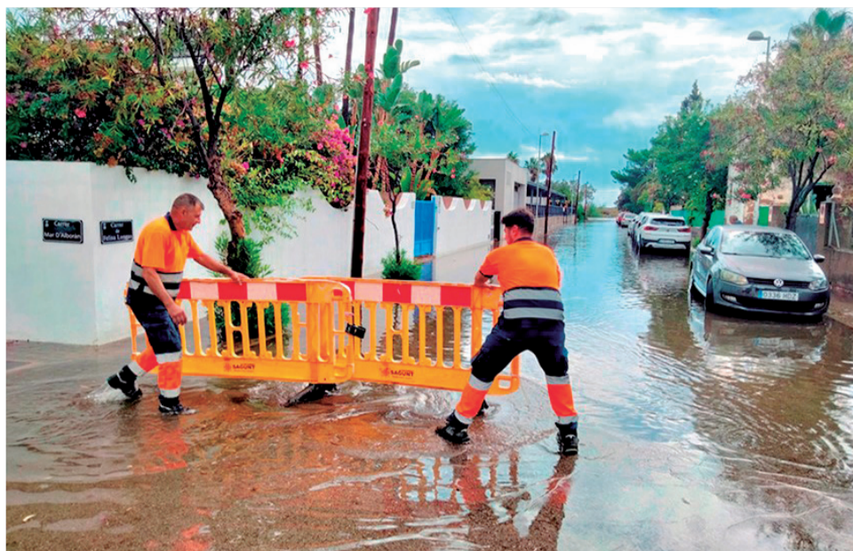
Una de les últimes inundacions que va patir la zona de l'Almardà.

El següent pas és publicar l'acord en el Butlletí Oficial de la Província, així com en el tauler d'anuncis de l'Ajuntament de Sagunt. D'igual mode, també s'ha acordat donar compte del mateix a l'Agència Valenciana de Seguretat i Resposta a les Emergències amb la finalitat de procedir a la seua homologació per part de la Comissió de Protecció Civil de la Comunitat Valenciana.