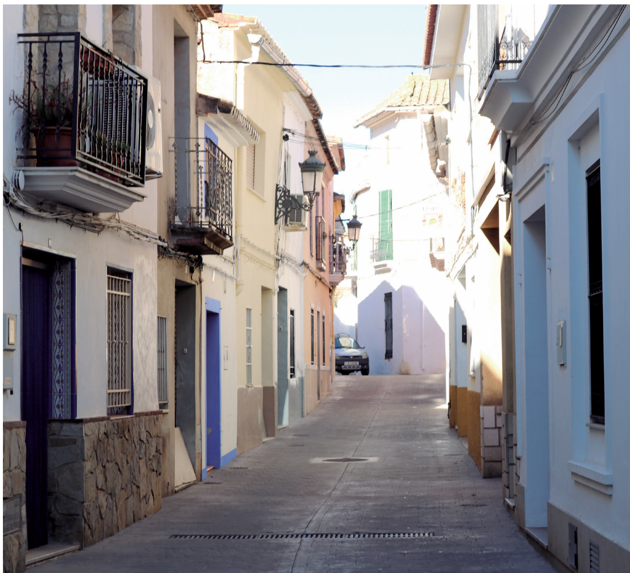
Un carrer del municipi d'Albalat dels Tarongers.

El president de la Diputació de València, Vicent Mompo, indica que "afavorir la mobilitat entre municipis rurals és clau per a fixar població, especialment en comarques en les quals hi ha serveis mancomunats". En este sentit, ha apuntat que l'estratègia per a combatre la despoblació "ha de faci-