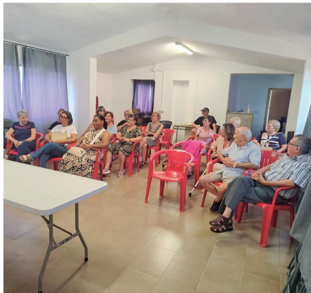
Un dels tallers que s'ha portat a terme.