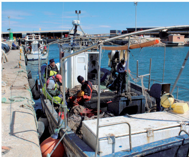
Pescadors de la Verge del Carme del Port.

La Confraria de Pescadors Verge del Carmen va iniciar la seua activitat a la ciutat fa més de 25 anys i és l'encarregada de portar avant la Llotja de Peix del Port Marítim de Sagunt. Entre les labors que ha dut a terme durant la seua història destaca el suport als pescadors, sent un punt de trobada i suport per a ells. A més, els ha proporcionat assistència en qüestions com la seguretat en la mar, la comercialització del peix i la