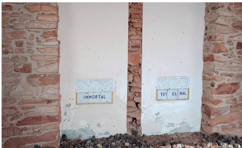
Així ha quedat el panell ceràmic de l'ermita.