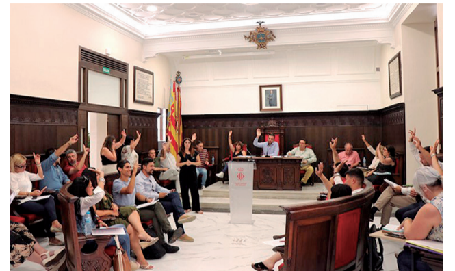
Pleno del Ayuntamiento de Sagunt.