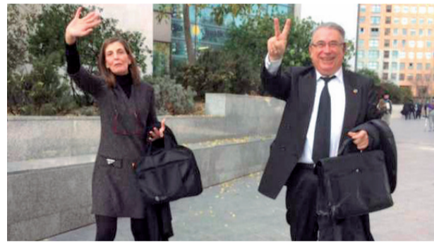
Sancho y su esposa a la salida de la Ciudad de la Justicia.

Sancho que era lo que el Consistorio quería desde un principio - quitarse de en medio en un asunto que le ha causado un desprestigio institucional durante varios años con alcaldes y funcionarios acusados