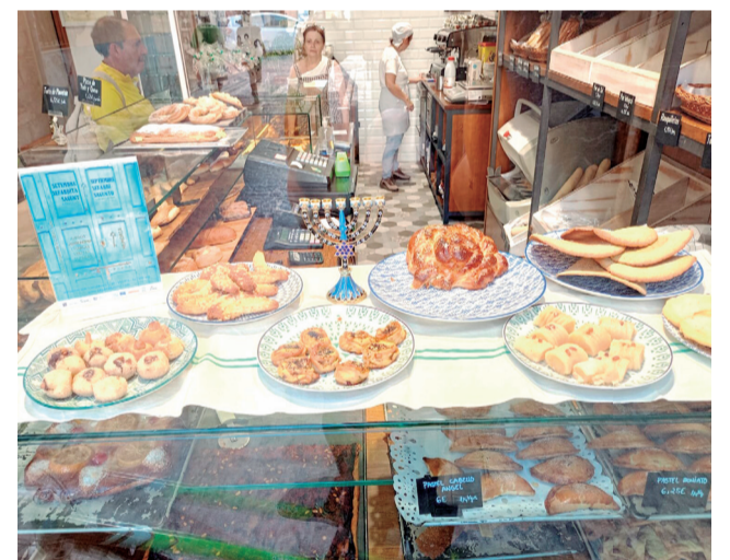
Propuesta gastronómica sefardí.