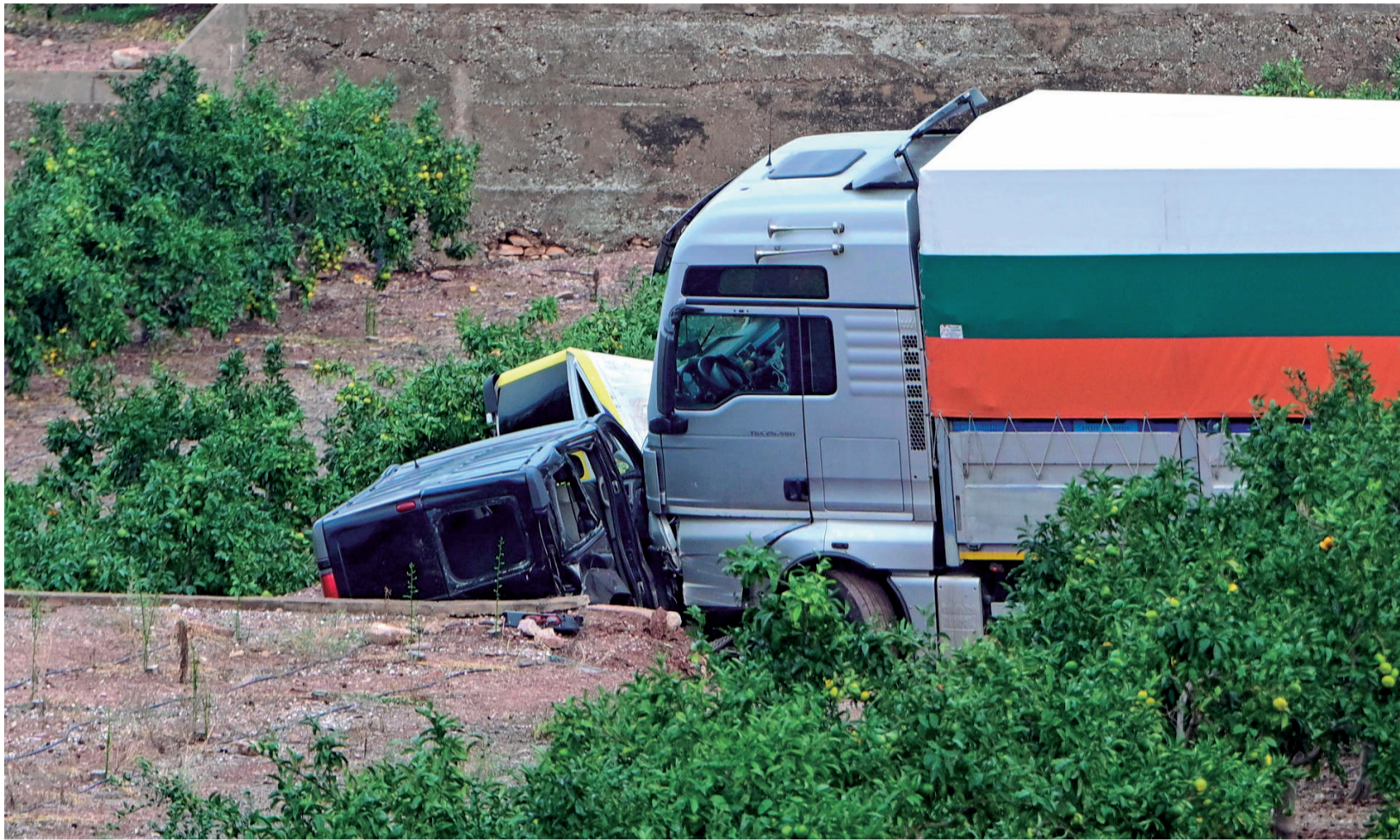
Vista general del camión que ocasionó el accidente en un campo de Benifairó de les Valls.