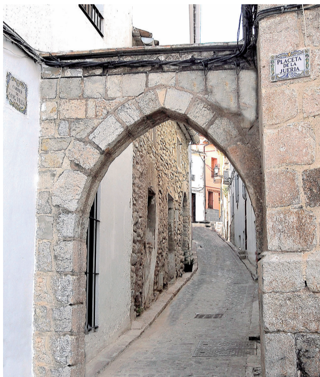
Varios rincones de la judería de Sagunt.