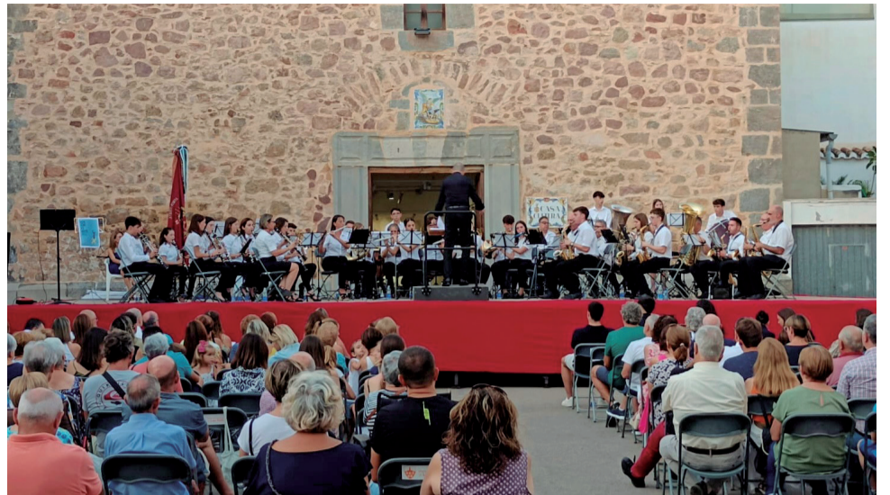
Un concert que va tindre lloc en les festes del 2023

No te quedes enrere, i gaudeix de les Festes Populares de Quart de les Valls 2024! Vine a viure unes jornades plenes de tradició, diversió i convivència. Per a més informació sobre el programa d'activitats, consulta el web oficial de l'Ajuntament de Quart de les Valls: www.quartdelesvalls.com