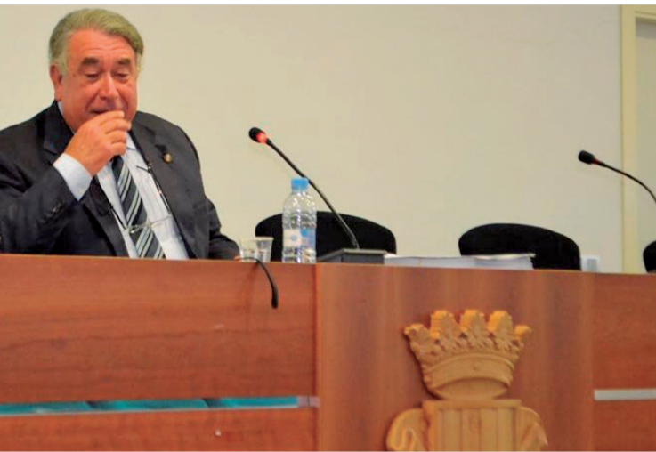
sa para hablar de libertad de expresión.