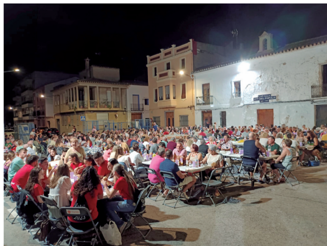
Sopar organitzat durant les festes de l'any passat.