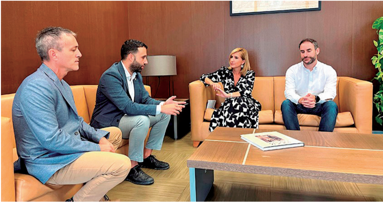
Autoritats en la reunió per a abordar la situació del futur Palau de la Justícia de Sagunt.

■ EL REIVINDICAT COMPLEX ATENDRÀ UNA POBLACIÓ DE MÉS DE 90.000 HABITANTS DE VORA UNA QUINZENA DE MUNICIPIS