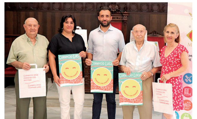
Presentació de la campanya a l’ajuntament.

La campanya consisteix a sortejar premis en metàl·lic entre els clients dels 572 comerços adherits a la mateixa per a incentivar als ciutadans i ciutadanes al fet que s’acosten a conèixer l’àmplia oferta de comerç local de la ciutat i a realitzar les seues compres en ell. Els comerços adherits es donaran a conèixer pròximament a través de la web del comerciant i les xarxes socials. A més es podrà identificar l’establiment gràcies