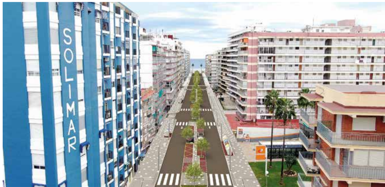
Les obres del carrer Caminàs de Cullera fins al passeig marítim.

En paraules de l'alcalde de Cullera, Jordi Mayor, «és un dels projectes més importants de l'actual legislatura», i ha afirmat que mitjançant aquesta inversió «convertirem aquesta avinguda en un bulevard fins al passeig marítim més verd, més accessible i més bonic».