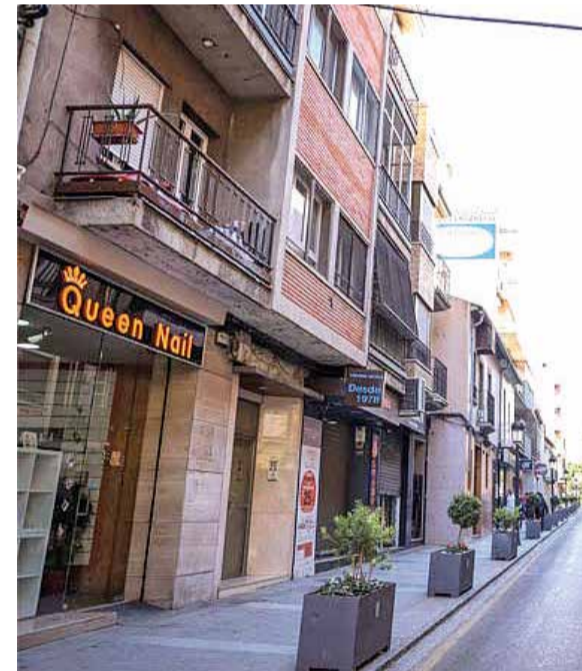
Calle Mayor de Paterna.