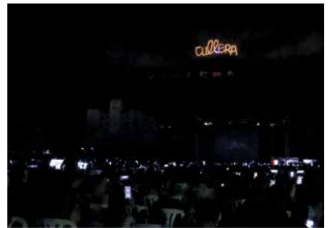
Diferents moments durant la commemoració dels 50 anys de les lletres de la muntanya de Cullera.

Un públic que que va vibrar amb el fil conductor d'Eugeni Alemany, la veu i interpretació de Pepa Blasco, les anècdotes i el vídeo homenatge a les persones precursors, la felicitació de l'alcaldesa de Los Angeles i l'espectacle final amb 120 drons sobre el cel de Cullera, proseguix.