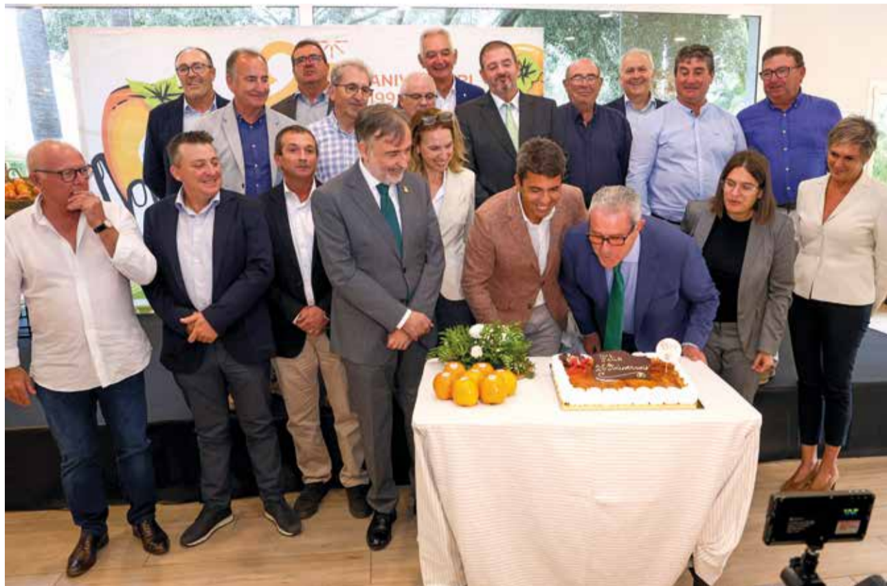
Diferents moments durant la celebració de l'aniversari a l'Alcúdia.