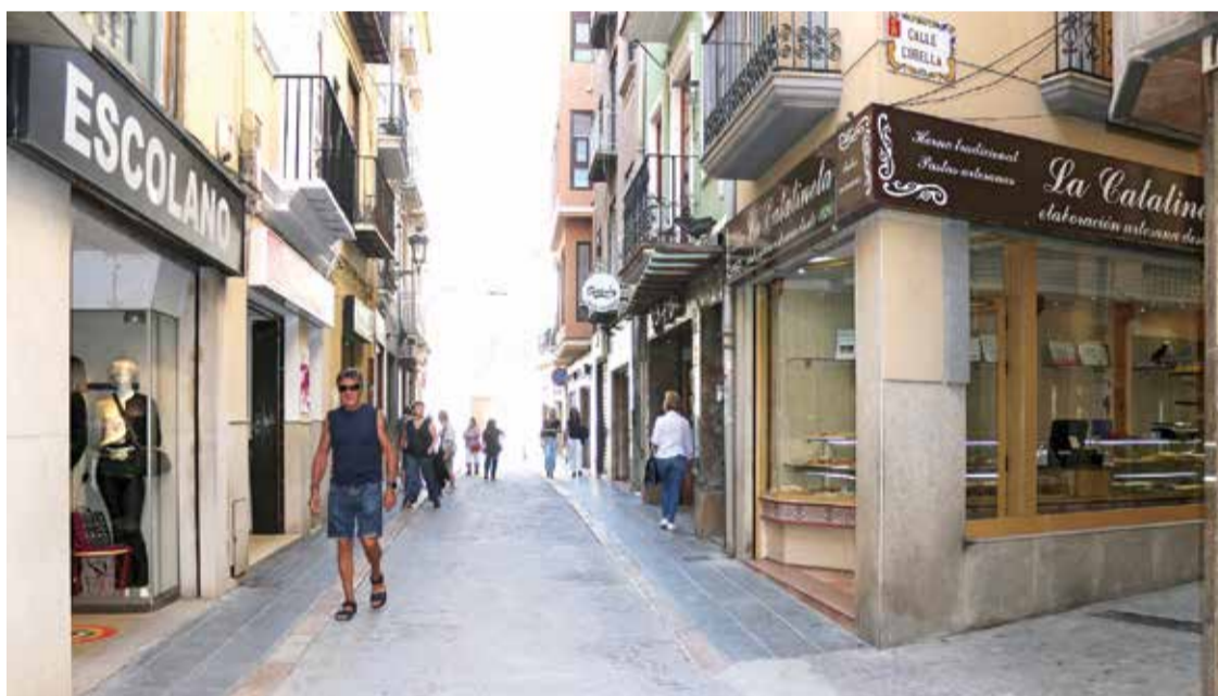
Calle Julio Cervera de Segorbe.

En cuanto a la fisonomía de la avenida, historia y modernidad se entrelazan en ella. Es un lugar donde el pasado y el presente convergen, con edificios como la Antigua Gerencia de los Altos Hornos del Mediterráneo, el Casino, el Barrio Obrero y las Casas de los Ingenieros (las 'casitas azules') que remiten a los vestigios industriales del Port. Y es que, en pleno apogeo de la industria siderúrgica del Port, el punto en el que uno vivía en dicha avenida determinaba su estatus social. En resumen, la Avenida 9 de Octubre es el latido comercial de la comarca, con un legado que perdura.