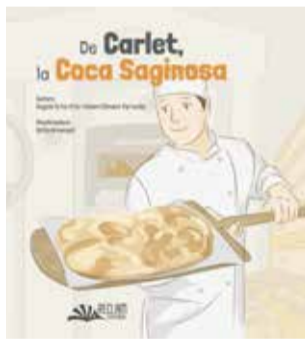
Portada llibre.