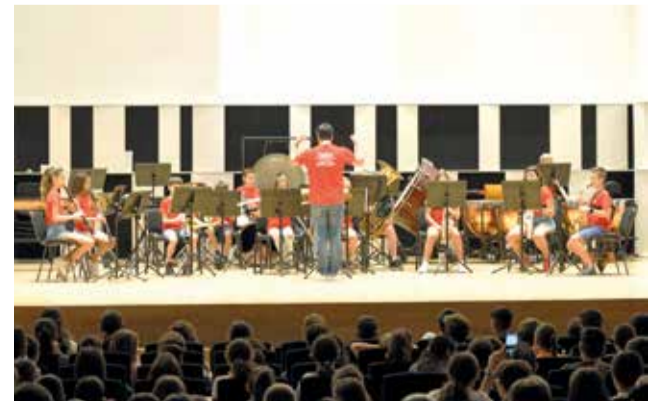
El festival a Castelló

jecció del film búlgar 'El caso Tesla', amb la presència de l'actor protagonista, Martin Paunov i del cineasta, Andrey Hadjivasilev qui, a més, va rebre el Premi MICE 2023 a la Contribució Científica. Assistiren a este esdeveniment alumnes del CEIP Miguel de Cervantes i de l'IES Ramon Esteve.