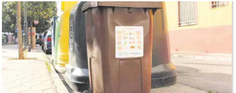
Campanya 'Separat i net' de Villalonga i un dels nous contenidors.