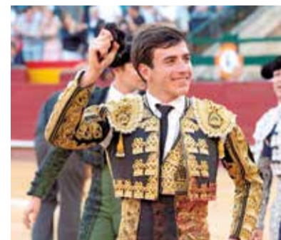
Nek, la gran esperanza valenciana.