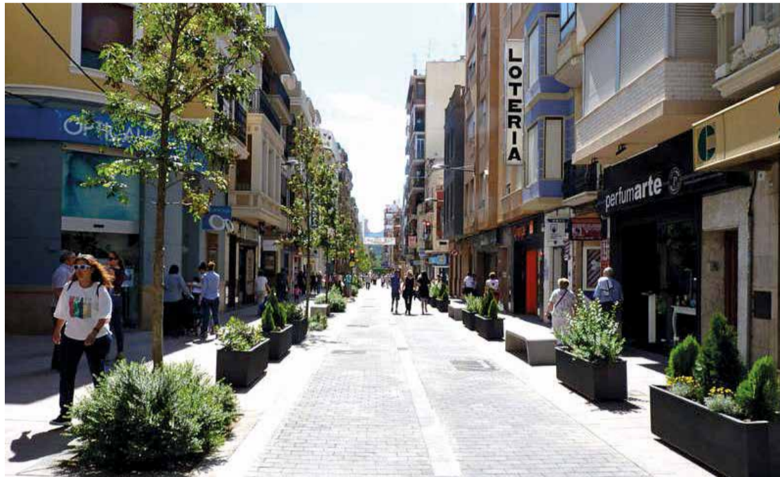
Calle Benito Pérez Galdós de Alzira.

La Comunitat Valenciana es conocida por su rica cultura, su impresionante arquitectura y su deliciosa gastronomía. Pero también es un destino de compras excepcional, con calles comerciales que combinan la tradición con la modernidad, ofreciendo una experiencia única para los amantes de las compras. En este reportaje, exploraremos algunas de las calles comerciales más destacadas de la Comunitat Valenciana en concreto de sus comarcas y descubriremos lo que las hace tan especiales.