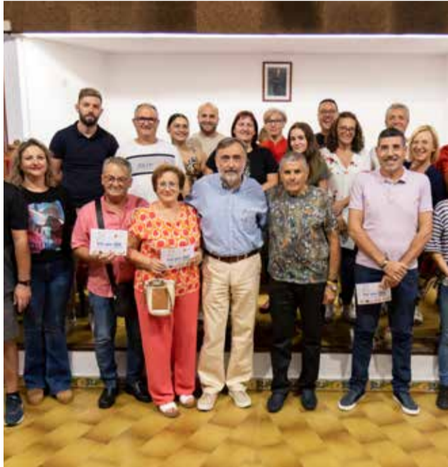
Premiats i participants del concurs.

Com és costum, es guardonaren les tres primeres "Tapes Populares", que eixiren de la votació de la ciutadania, a través d'un full de ruta o "passatapes", vàlid per a una