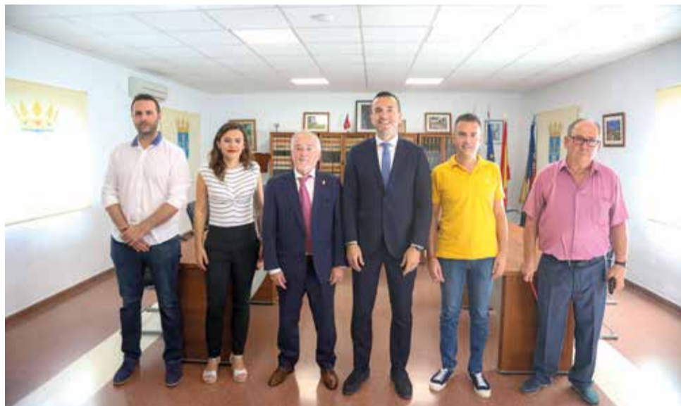
L'alcalde i la corporació amb el president Vicent Mompó

euros que van arribar de manera incondicionada al consistori a través del Fons de Cooperació Municipal. En total, més de 1,5 milions d'euros amb els quals el municipi ha pogut emprendre millores com la construcció del tanatori o l'ampliació del cementeri, dos actuacions que han tingut un cost global de 375.000 euros. A més, el consistori ha rehabilitat