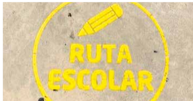
Augment de la senyalística vertical i horitzontal. / EPDA