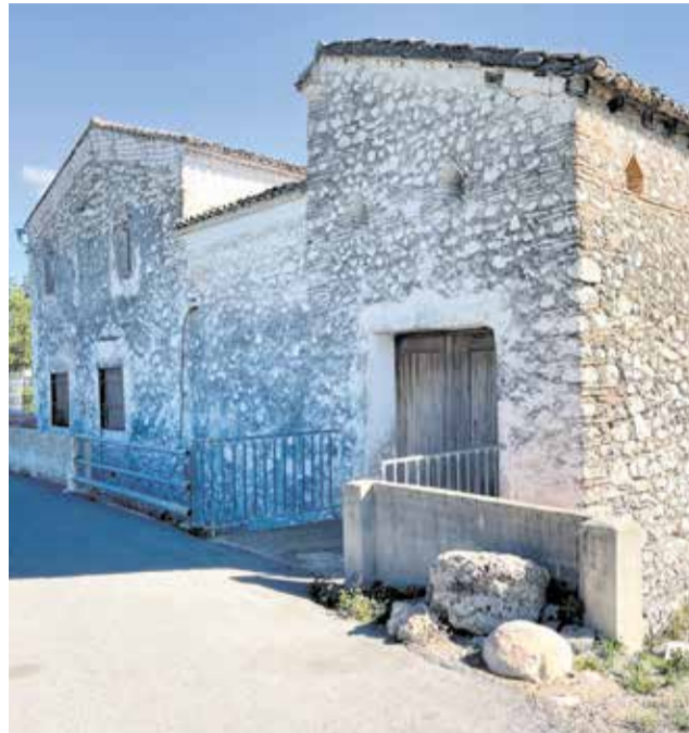
Estado actual del 'Molí Vell d'Ausiàs March'.

Las obras de rehabilitación se dividen en dos fases y cuentan con un presupuesto inicial de medio millón de euros subvencionados por la Generalitat Valenciana y que la vicepresidenta segunda y consellera de Servicios Sociales, Igualdad y Vivienda, Susa-