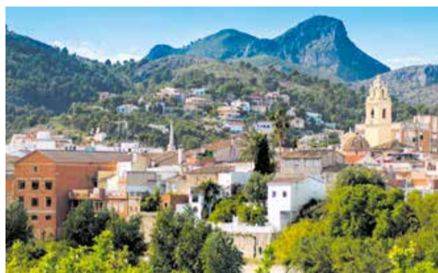
Vista del municipi del Real de Gandia.