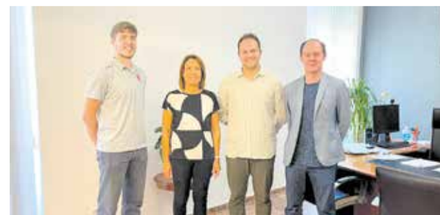
Reunió de l'Associació de Lacrosse en Oliva.

Per això, la Copa d'Espanya de Lacrosse no es quedarà només als camps de joc d'Oliva Nova. Durant les dues setmanes prèvies, diversos monitors han visitat els col·legis de la zona per tal d'ensenyar als més joves els fonaments d'este emocionant esport.