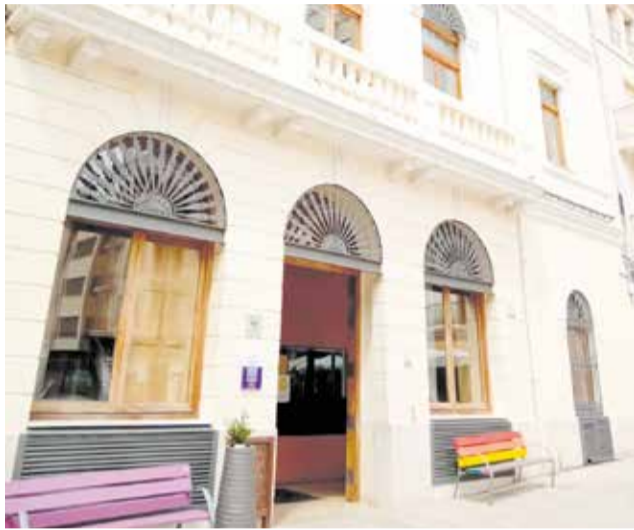
Ajuntament de Tavernes de la Vall d'ignia.

Serà un nou taller amb un programa mixt d'ocupació i formació, que té com a objectiu incrementar l'ocupabilitat de desocupats majors de 18 anys amb la finalitat de facilitar-los la inserció laboral. De la mateixa manera, este programa permet mitjançant accions formatives, com ara obres o la prestació de serveis d'utilitat pública o interès social. El taller d'ocupació tindrà una duració de 12 mesos, equi-