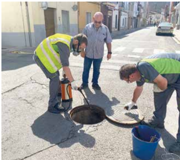
Actuacions en els claveguerams.

La Diputació Provincial de València ofereix ajudes als ajuntaments de municipis i entitats locals de la província de València amb població inferior a vint mil habitants, destinades a la realització de campanya de salut pública en l'exercici 2023, que es desenvolupa en execució de la línia de subvenció cinquena del Pla Estratègic de Subvencions 2023 de l'Àrea de Benestar Social i Qualitat Democràtica.