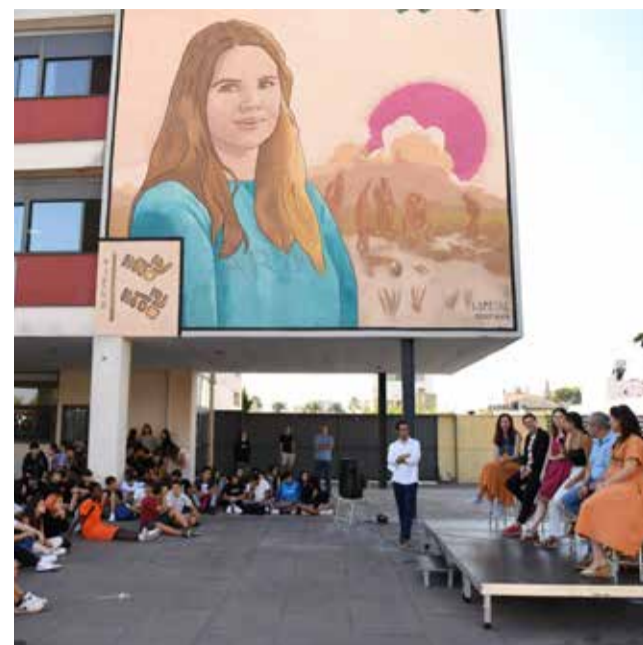
Mural a l'IES Sucro d'Albalat.