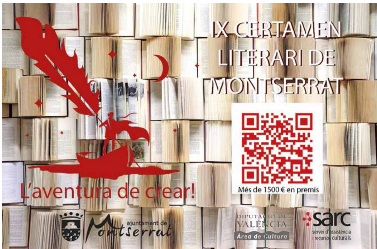
Cartell del IX certamen literari de Montserrat. / EPDA

El tema serà lliure. Les creacions que es presenten no podran estar concursant en altres certàmens, ni els seus autors o autores haver estat premiats en alguna categoria d'aquest certamen, immediatament anterior a la present convocatòria, d'aquest ajun-