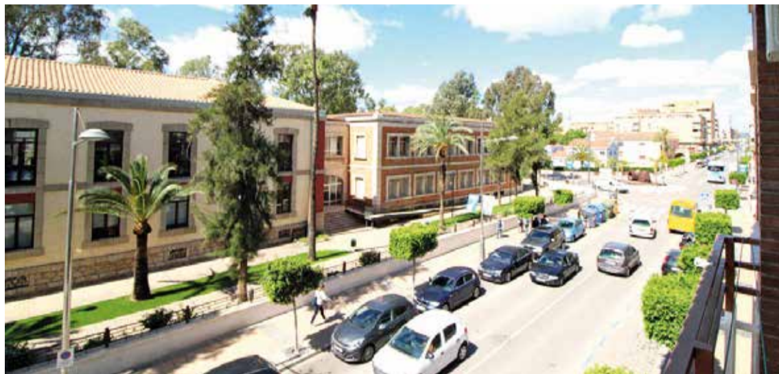
Avenida 9 d'Octubre de Sagunt.

La capital de l'Horta Sud, Torrent, es un gran centro comercial al aire libre. Sus calles están llenas de comercios que ofrecen una variada oferta de productos y servicios y cuenta con una asociación de comerciantes potente. No obstante, el eje de vertebración es la avenida al Vedat donde se puede disfrutar de un buen paseo mirando escaparates de todo tipo, por ello no es extraño que sea