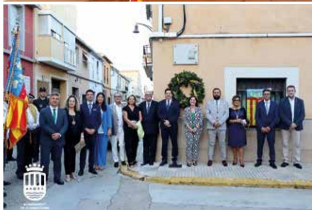
Celebració del 9 d'Octubre a Guadassuar.