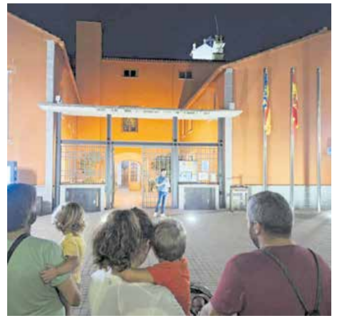
Concentració a les portes de l'Ajuntament.

Conscients que des d'un poble de 1.095 habitants segurament no poden canviar la política internacional, des de l'Ajuntament de Potries han defensat la seua postura i la convocatòria de la concentració: "almenys hem d'alçar la nostra veu i posicionar-nos institucionalment per a donar veu al poble palestí, i contar la història d'esta guerra des de la seua perspectiva, molt amagada per mitjans, estats i poderosos", han conclòs en un comunicat a través de les xarxes municipals.