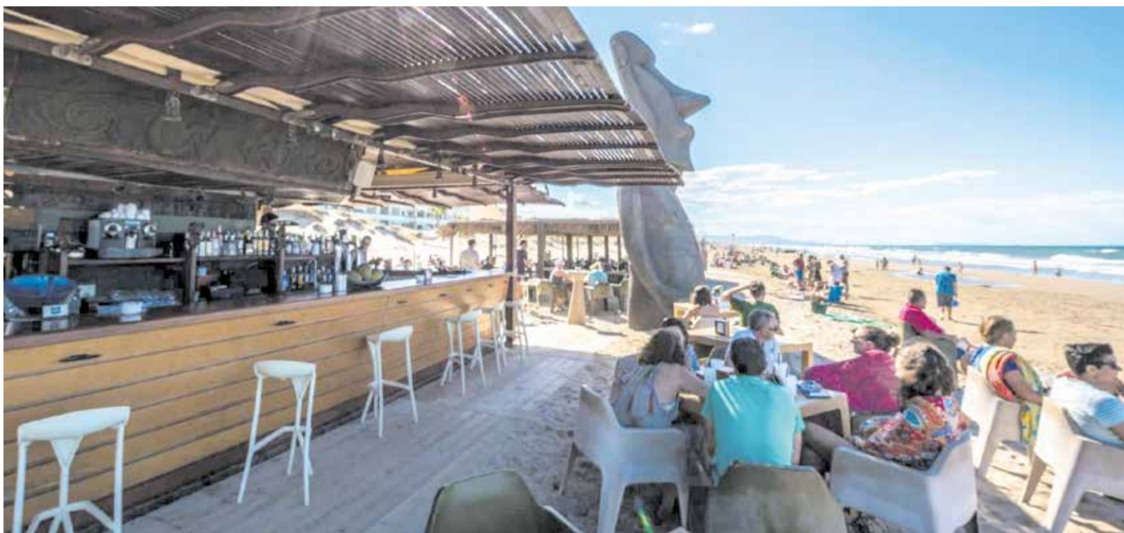
Diverses persones en un xiringuito de la platja d'Oliva durant l'estiu.

L'OPOSICIÓ DEMANA LA DIMISSIÓ DEL REGIDOR DE TURISME PER LA SEUA RELACIÓ AMB ELS EMPRESARIS INVOLUCRATS