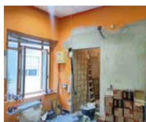
Part de les obres.