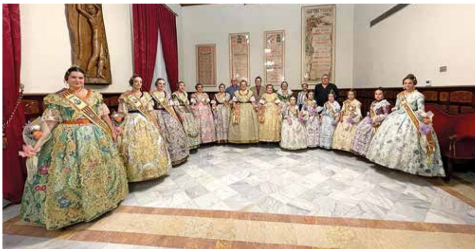
Les Falleres Majors de Sueca i la seua cort d'honor.