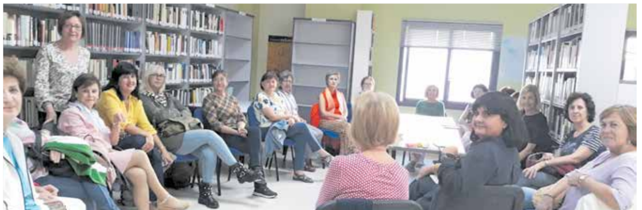
Diferents instants durant el primer club de lectura de la biblioteca de Benirredrà.