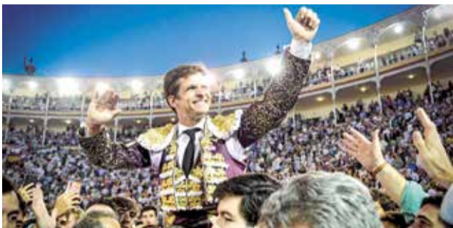
El Juli, en su última puerta grande en Madrid.