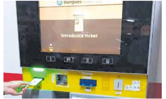
TPV en el pàrquing del passeig del País Valencià.