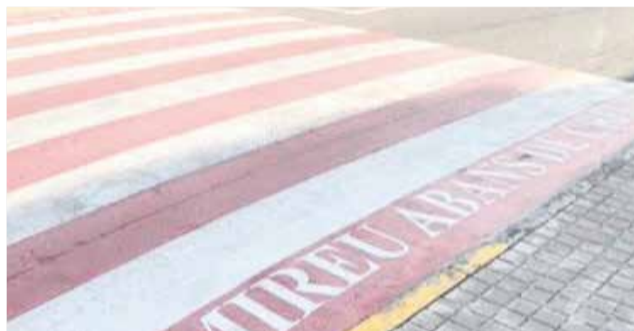
Milliores en els passos de vianants.