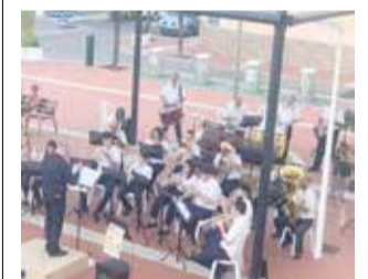
Actuación en Beniflà.