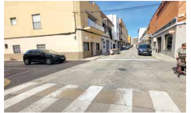
Zona nord de l'Alcúdia.