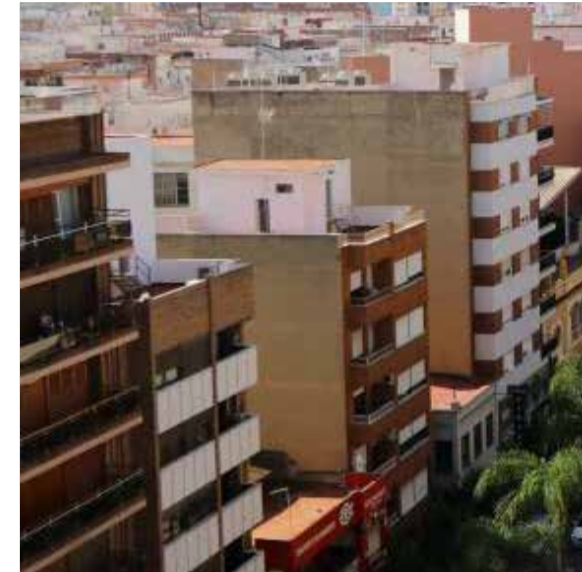
Avenida al Vedat de Torrent.

A lo largo de esta calle, encontrarás una serie de pequeñas tiendas y talleres que exhiben el trabajo de artis-