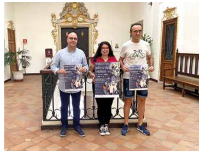
Presentació del cartell de la carrera de Halloween.

El preu del dorsal és de 2 euros i es podrà adquirir en diferents comerços de la ciutat com ara Celia Fons (c/ Major de Santa Caterina), Tintoreria Camarena (c/ Auxili) o Sierra Street Style (c/