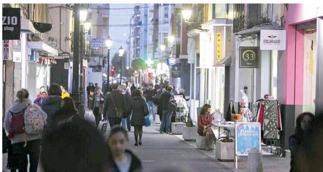
Calle Sant Pasqual de Gandia.