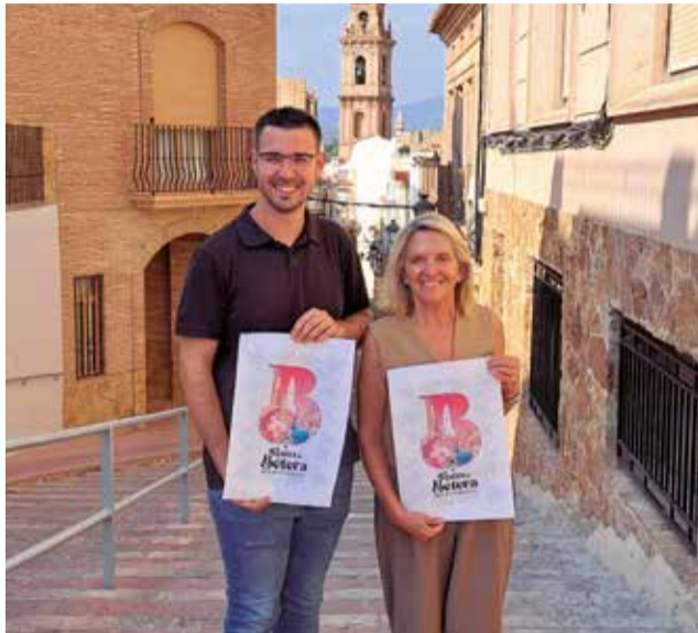
Presentación del cartel de las Fiestas.

Hasta que las Obreras lleguen a la parroquia, los Mayoriales serán los encargados de llenar las calles del municipio de confeti, un confeti de colores emblema también de la fiesta. Una vez finalice La Rodà, los vecinos y vecinas se congregarán a las puertas de la iglesia para presenciar uno de los actos más emotivos, donde las Obreras Casadas colocarán la mantilla a las Obreras Solteras para que puedan entrar en la Iglesia.