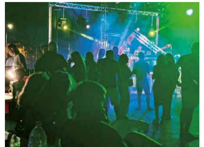
Discomóvil del Lorifest de Loriguilla.

Un sinfín de actos destinados a los más jóvenes y a los que siguen siéndolo en espíritu, desde discomóviles con