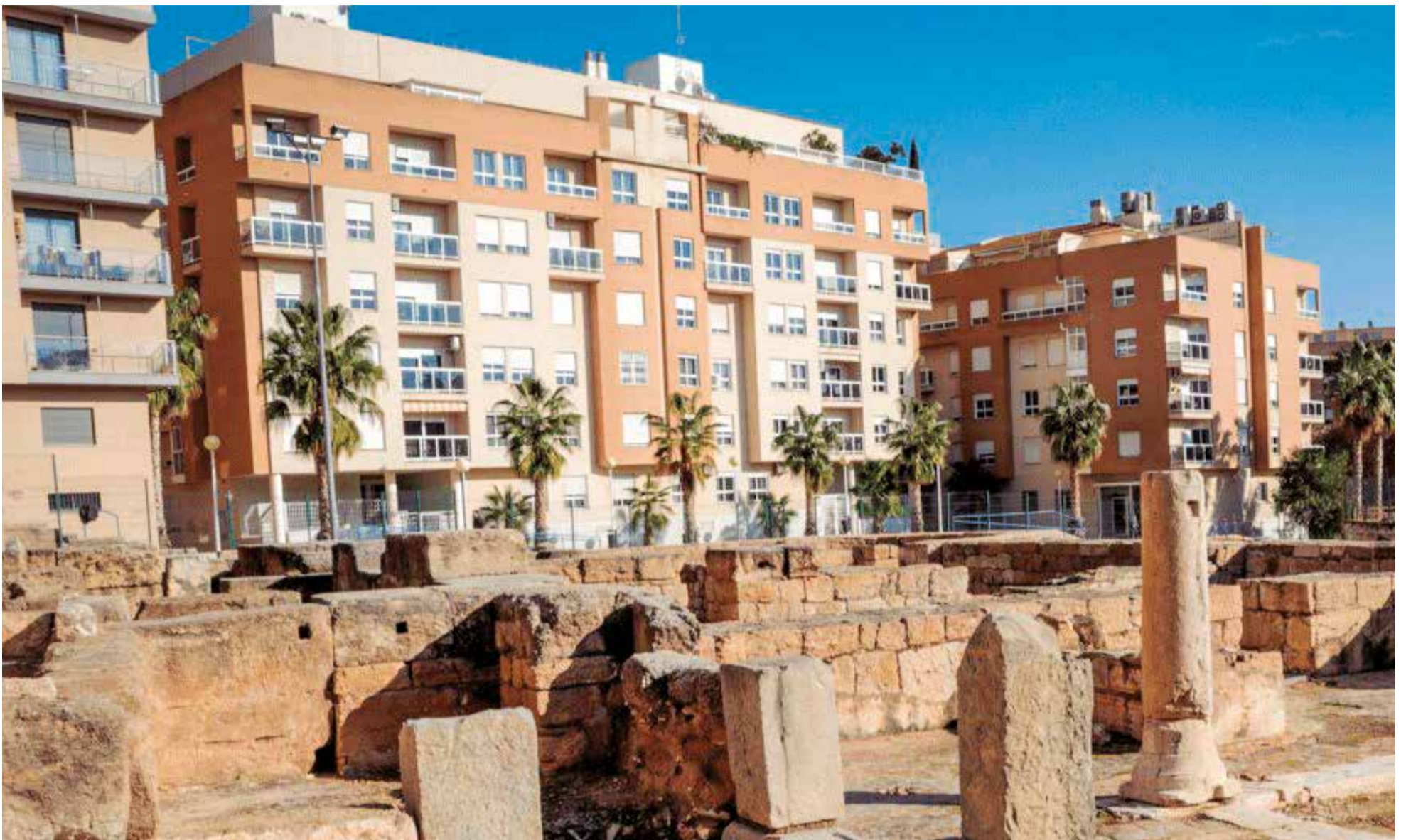
Blocs de vivendes junt a les Termes de Mura de Lliria.