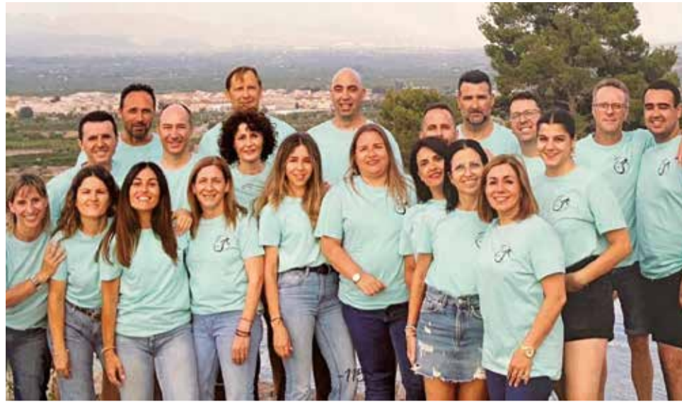
Festers 2024 de Casinos.

El diumenge 11 d'agost, els carrers de Casinos s'ompliran de color i alegria amb la cavalcada de les 19:00 hores, on grans i menuts podran gaudir d'una desfilada plena de fan-