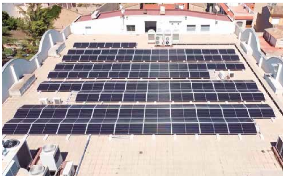
Placas solares en la Centro Social de la Pobla de Vallbona.

Estos nuevos proyectos llegan a través de dos préstamos de 125.000 euros, los cuales estarán bonificados hasta los 70.000 euros por el Instituto Valenciano de la Competitividad Empresarial (IVACE), a lo que se añadirán fondos propios. Las obras tienen previsión de ser ejecutadas durante el inicio del año 2025.