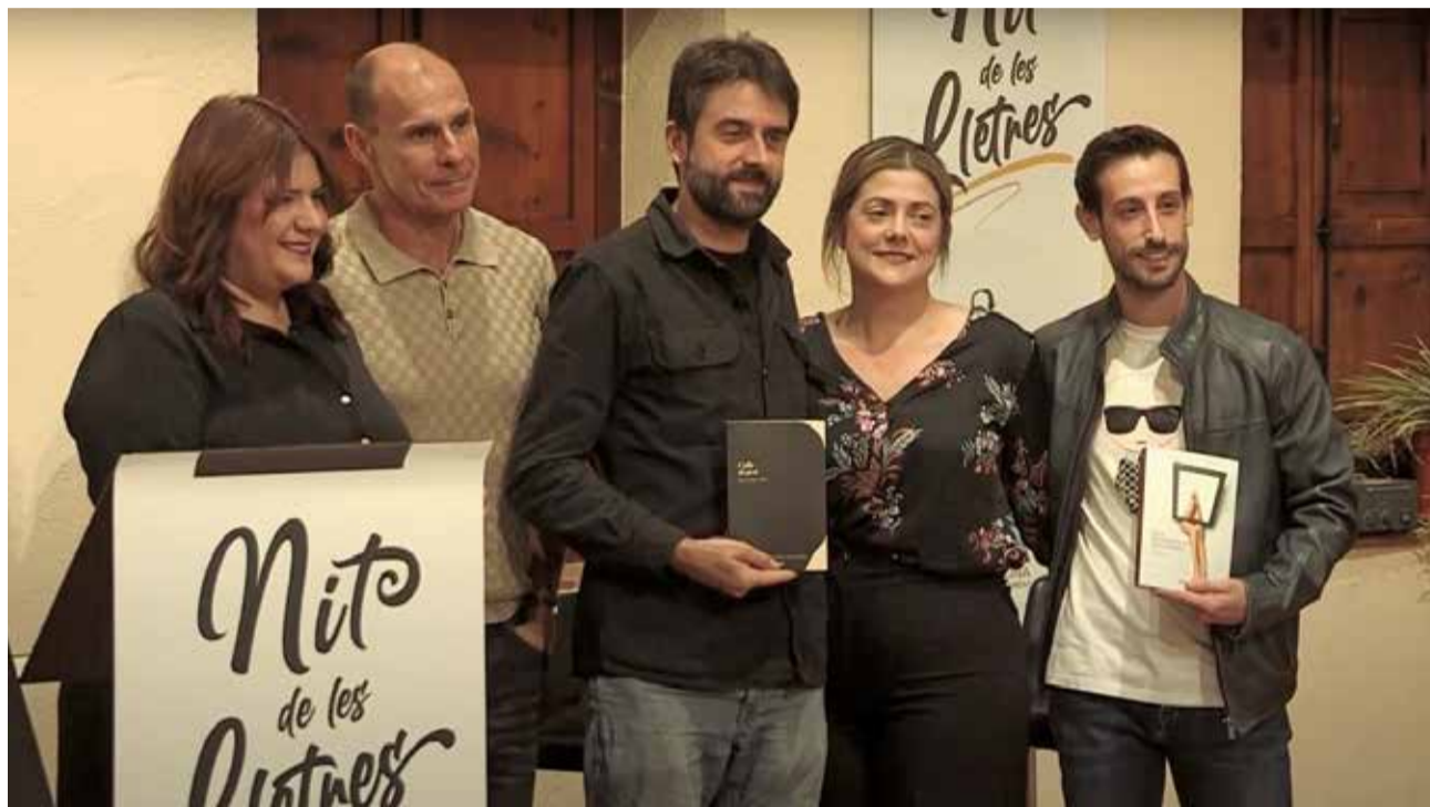
Edición anterior de los premios en la Pobla de Vallbona.

Esta opción también se ha incluido en los premios Maria Roca de narrativa juvenil, ofreciendo un mayor número de opciones a las personas de