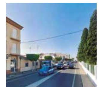
Carretera CV-336.

En concreto, los documentos elaborados contemplan la adecuación de las aceras en el tramo de la residencia de mayores, así como la colocación de una barandilla separadora que obligue a los peatones a cruzar por las zonas habilitadas para ello.