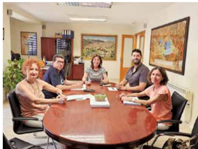
Reunión en el ayuntamiento de Loriguilla.

En la reunión, se trataron los Talleres de Empleo, su importancia y las medidas que el Consistorio adopta para su promoción, solicitud y homologación de nuevas especialidades. Se trata de una herramienta de formación y empleabilidad temporal que