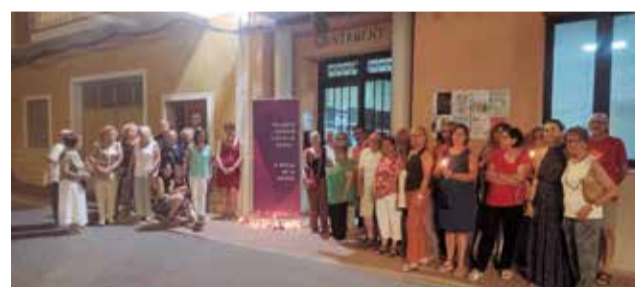
Vigília contra la violència masclista a Olocau.