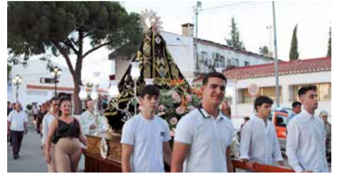
Procesión de la Virgen de la Soledad en 2023.

llanas dan todo de sí para ensalzar a su patrona y divertirse como solo en esta localidad saben hacer.