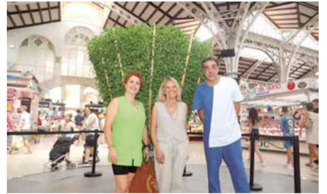
Entrega en el Mercado Central de Valencia.