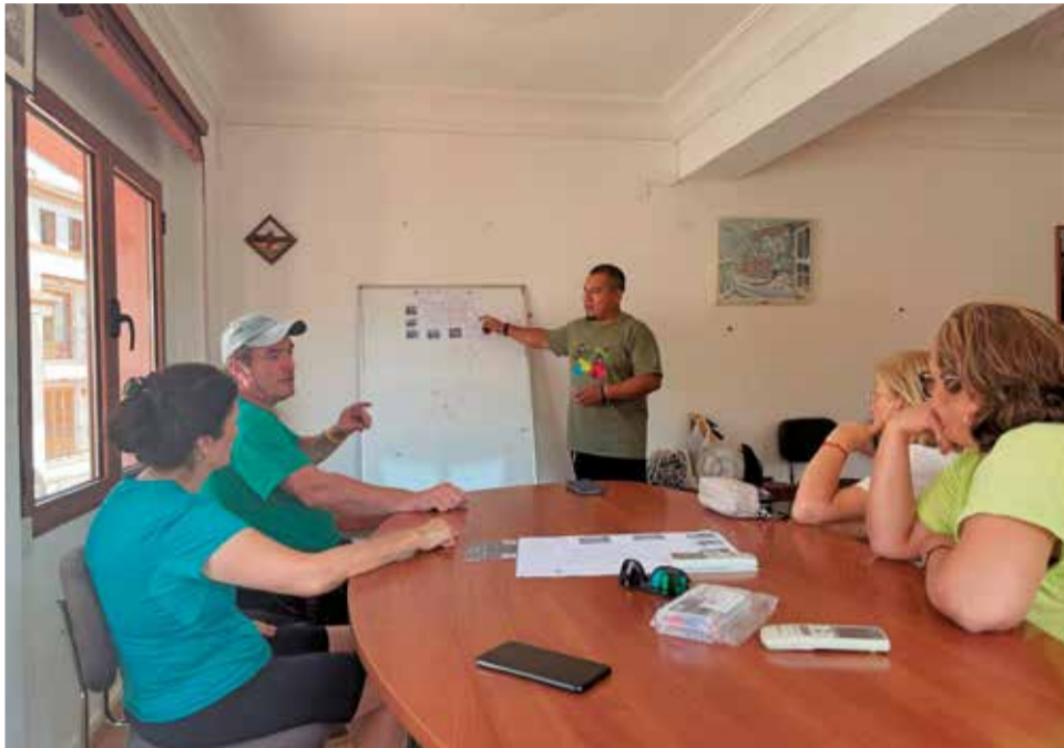
Sesión de planificación de las rutas y tareas en el ayuntamiento de Gátova. / EPDA

En la imagen, se puede observar al equipo durante una sesión de planificación de las rutas y tareas de limpieza, en la que también participaron representantes del Ayuntamiento. La contratación se enmarca en las políticas municipales de fomento del empleo local y mejora de los servicios públicos.