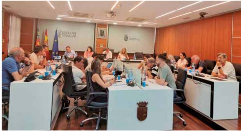
Un instant durant el ple de pressupostos de l'Ajuntament de Riba-roja.

Un altre servei que es millorarà és el servei municipal de transport urbà que presta actualment amb una externalització parcial per valor de més de 500.000 euros que permetrà continuar sent un servei públic de qualitat i gratuït per a tots els usuaris. Un altre dels serveis que es millorarà al llarg d'enguany a Riba-roja de Túria serà el de la jardineria, el pressupost de