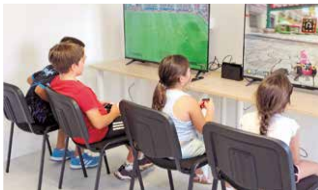
Instalaciones de la Casa de la Juventud.