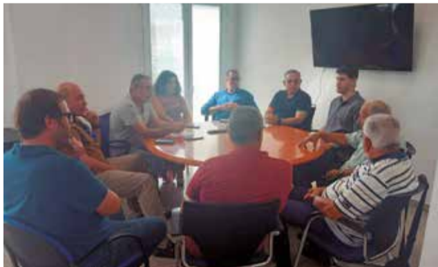
Reunión entre el Ayuntamiento y los propietarios.

Durante la reunión, se han discutido diversas propuestas para mejorar y revitalizar la zona y se ha establecido un calendario para mantener reuniones periódicas para avanzar en los temas tratados y garantizar una colaboración continua entre el Ayuntamiento y los propietarios de los suelos del área industrial.