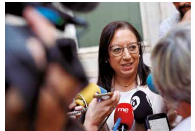
Llanos Massó, presidenta de Les Corts.

La oposición ha censurado la decisión de la presidenta. Desde el PSPV-PSOE han reprochado que se “aferre al cargo sin ningún tipo de escrúpulos”, mientras que Compromís ha afirmado que “lo