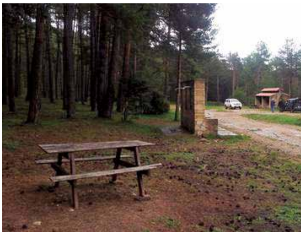
Zonas de acampada de El Planàs en La Vistabella.

El espacio de El Molinillo, ubicado en las cercanías del río Turia en el término municipal de Titaguas, se encuentra rodeada de un extenso pinar de pino carrasco adulto. Dispone de mesas, fuente, paellero y aseos. La instalación se encuentra cerca del Paraje Natural Municipal 'La Caballera', donde confluyen las estribaciones de la Sierra de Javalambre, por el margen izquierdo del río Turia y las de la Serranía de Cuenca por su margen derecho. Para acam-