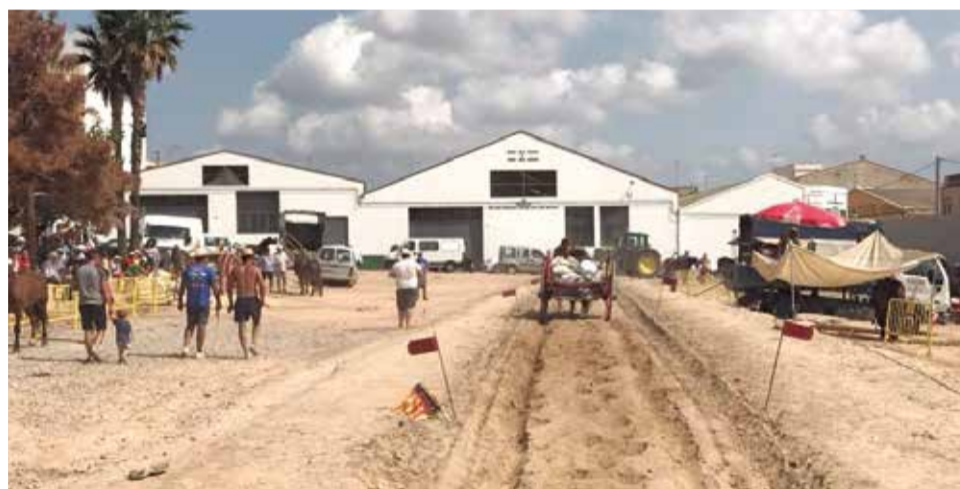
Tir i arrastre en Benaguasil.

La Pujada a la Montieleta és una de les carreres més especials del circuit de la Diputació de València; té una molt bona acceptació, ja que el recorregut és molt atractiu i d'un nivell exigent”