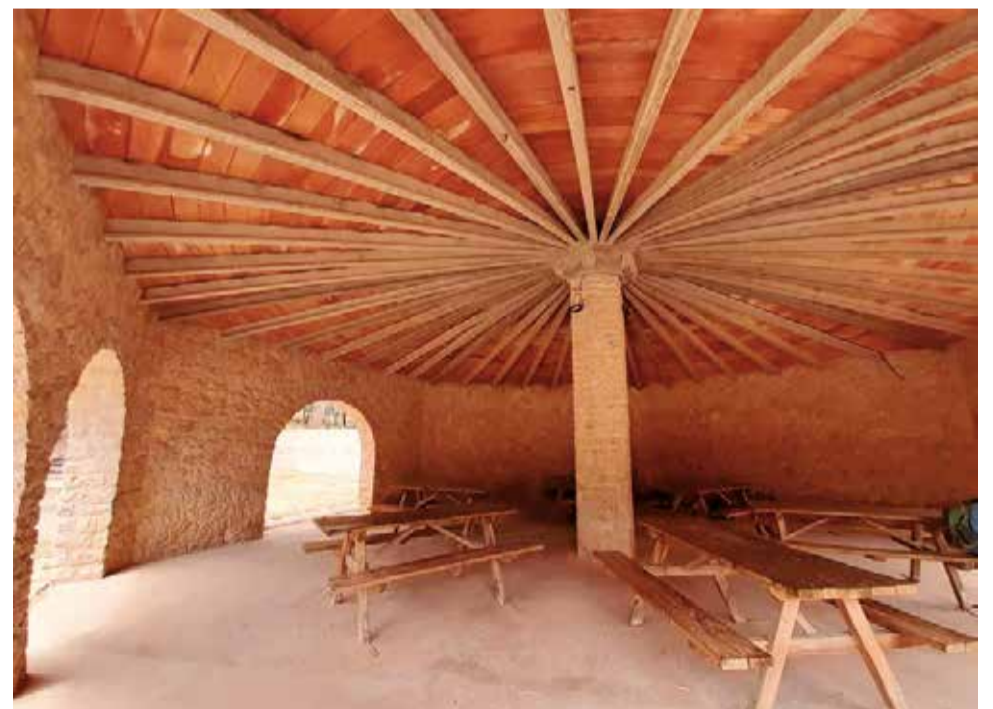
Zona de acampada de El Remedio ubicado en Utiel.

Junto al embalse del Buseo encontramos otra popular espacio para acampar, ideal para escapar del sofocante calor del verano, en pleno corazón del Parque Natural de Chera - Sot de Chera. La superficie aproximada es de 5 hectáreas. Dispone de mesas, paellers, aseos y duchas. Y además, en él pueden realizarse distintas actividades recreativas, por ejemplo, la pesca. Para acampar es necesaria la presentación de una declaración responsable. En-