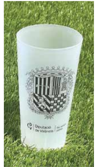
Vasos de plástico.

El uso indiscriminado de plástico supone un problema de contaminación y un uso de recursos insostenible. Reciclar es muy importante y desde este Ayuntamiento se pretende poner en marcha propuestas en materia de eficiencia para reducir su uso e implantar alternativas ambientalmente responsables, especialmente durante las fiestas.