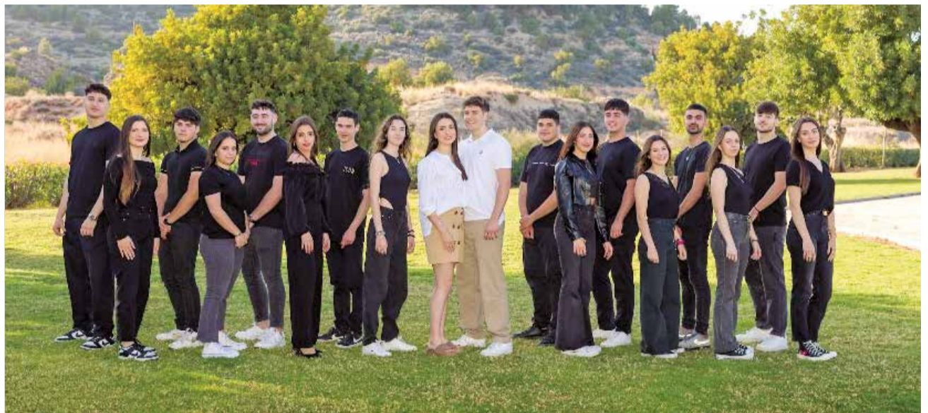
Festers i festeres (esquerra) i clavaris i clavariesses (dreta) de les festes 2023 de Benaguasil.

09.00h. Missa descoberta. 12.00h. Missa major d'Acció de Gràcies. 14.00h. Mascletà a l'Avinguda de Montiel a càrrec d'Hermanos Caballer. 20.00h. Missa i processó. 22.00h. Mascletà nocturna a càrrec d'Hermanos Caballer.