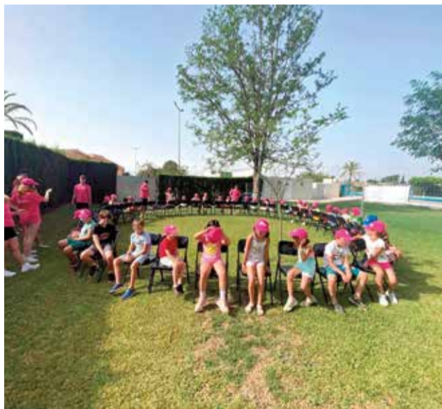
Diverses activitats de les escoles d'estiu de Serra.

Paral·lelament, s'ha celebrat l'escola esportiva al Po-