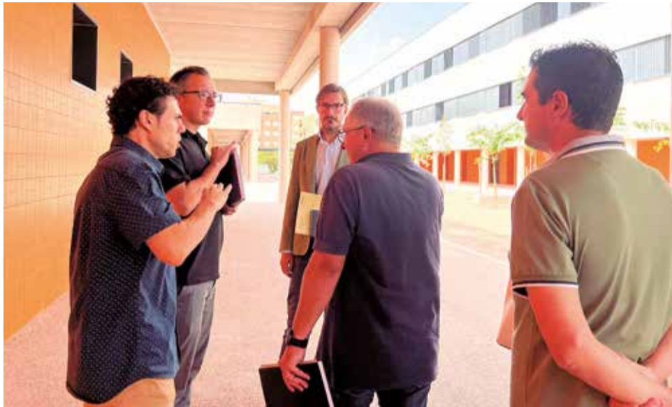
Autoritats en l'acte de recepció de les obres del nou IES Camp de Túria a Llíria.

García assenyalava que este nou institut ha sigut possible gràcies al Programa