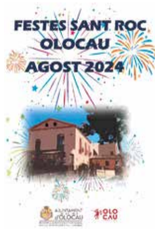
Cartell de festes.