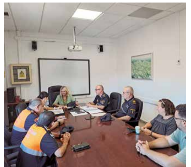
Reunión en el ayuntamiento de Bétera.

Uno de los actos más llamativos y de gran afluencia de visitantes es el día 15 de agosto, día de la Rodà de les Alfàbegues, este día conlleva un dispositivo especial que, entre otras medidas, se tiene en cuenta la seguridad para los accesos a las inmediaciones de las calles adyacentes al evento.