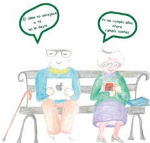
Imatge de la Setmana Cultural dels jubilats d'Olocau.

l'ús del mòbil i de les aplicacions; l'excursió al Museu Valencià de la Il·lustració i de la Modernitat (MuVIM) el dimarts 27; el dinar per a socis i col·laboradors (dimecres 28), la projecció d'una pel·lícula i el posterior col·loqui en la Llar dels Jubilats (dijous 29); el viatge a Morella amb visites guiades als llocs més emblemàtics i al Santuari de la Balma (divendres 30); i una nova edició del concurs de rebosteria (dissabte 31). Finalment, el divendres 6 de setembre, es realitzarà una excursió al celler Vera de Estenas d'Utiel. Per a participar en les activitats, caldrà inscriure's en la Llar dels Jubilats en horari de 17 a 20 hores.