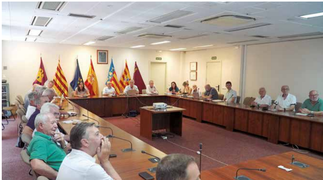
Comisión de Desembalse del sistema Turia de la Confederación Hidrográfica del Júcar.

El presidente de la CHJ ha afirmado que, con los indicadores de julio, era previsible que el sistema Turia entrara en prealerta y, teniendo en cuenta las previsiones meteorológicas de Aemet de que el otoño "no sea especialmente lluvioso", se ha acordado establecer esa restricción del 15 % para uso agrícola.