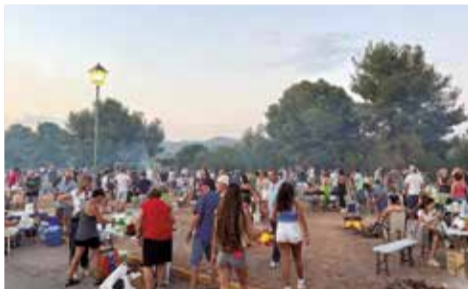
Diferents actes de les festes patronals de Serra.