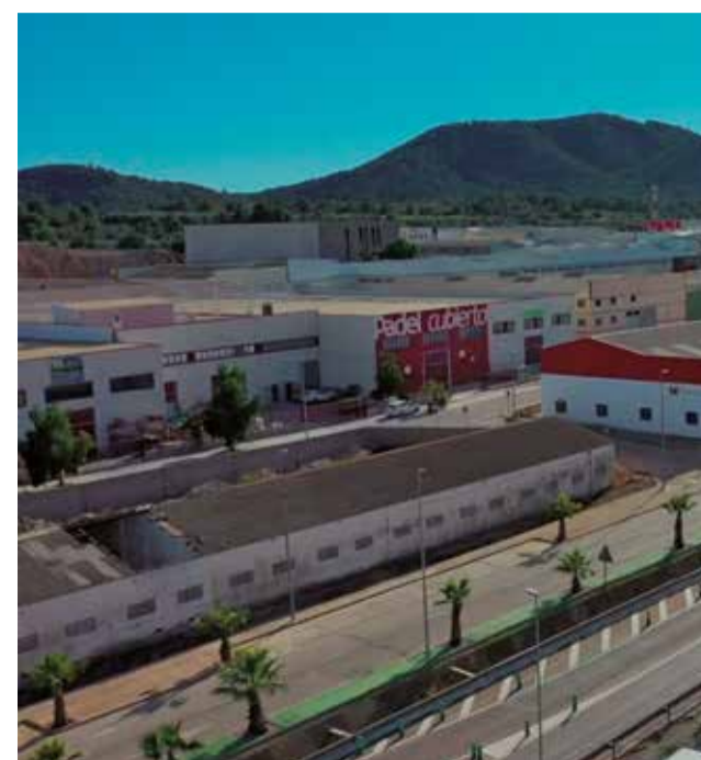
Polígono de Vilamarxant.

También se crearán zonas biosaludables y carril bici para fomentar la movilidad sostenible, se mejorará la identificación de las calles y señalización del tráfico, el saneamiento separativo de agua, los viales, las instalaciones deportivas, así como los pasos de peatones de las zonas industriales mediante la eliminación de barreras arquitectónicas.