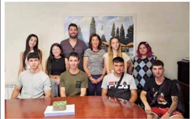
Bienvenida en el Ayuntamiento de Loriguilla.