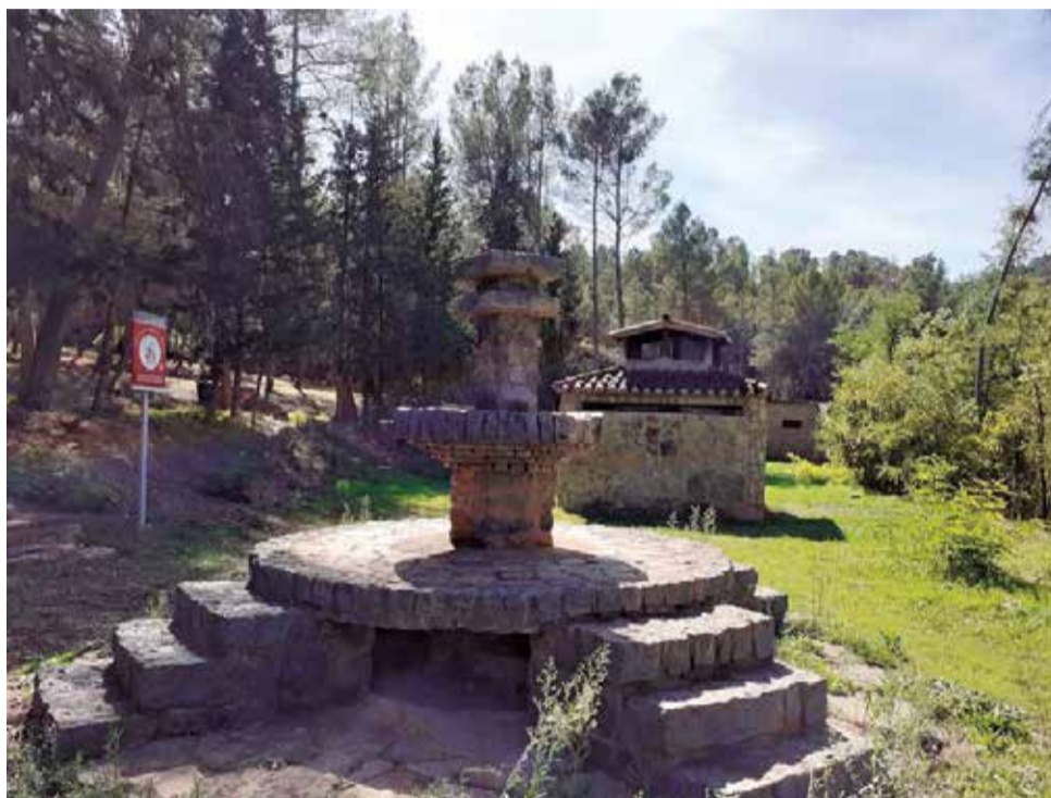
Zonas de acampada de Higuieruelas y Titaguas.

► PRECAUCIÓN INCENDIOS. La mayoría de merenderos se cierran por el riesgo de incendio durante el verano.