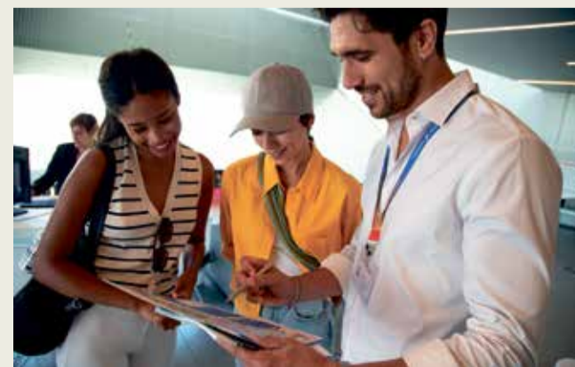
Professionals del sector turístic. / EPDA