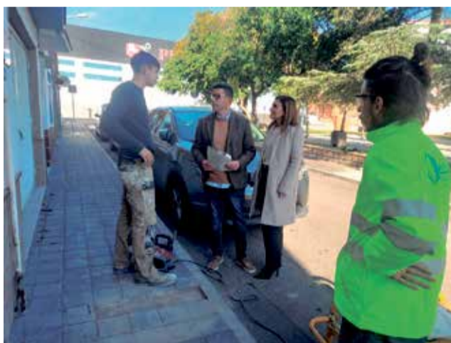
Visita a los trabajos en el barrio Pío XII.

Según ha explicado la alcaldesa, el consistorio hace valer el plazo de garantía de un año desde la finalización de los trabajos ofertados por la empresa adjudicataria. En este sentido, el edil ha insistido en la labor de supervisión que se realiza desde los servicios técnicos municipales de las distintas intervenciones urbanísticas que se realizan.