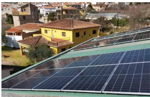
Placas solares en Viver.

La Comunidad Energética Local de Viver (CELVi) es por fin una realidad tras resolver los últimos escollos con la distribuidora i-DE para la concesión de los permisos de conexión a la red. Los primeros puntos de generación eléctrica del municipio se pusieron en marcha el pasado 17 de noviembre, seis meses después de la previsión inicial, abasteciendo de momento a 30 hogares. En las próximas semanas se irán activando progresivamente los otros cinco puntos de generación, que darán servicio al resto de vecinos que ya se han adherido a esta iniciativa.