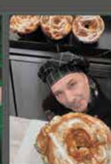
CORONA SAGUNTINA CHOCOMEL