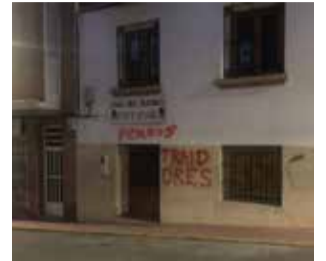
Sede PSOE. / EPDA