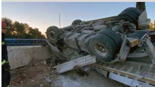
► 18-12: Un camión se estrella contra la mediana de la autovía A-23 a la altura de Segorbe. Bomberos y Guardia Civil de Tráfico acudieron a atender el accidente. El conductor no resultó atrapado.