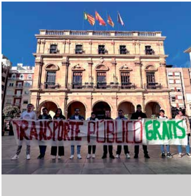
Concentración frente al ayuntamiento de Castelló.

La asociación juvenil de la ciudad, que forma parte del Consell Municipal de la Joventut, ha denunciado también “el veto del concejal de Movilidad a hablar con nosotros, a pesar de representar alrededor de 2.000 firmas de jóvenes de la ciudad. Quien algo teme, algo esconde. Desde Som Jovens vamos a seguir informando de este hecho a los ciudadanos, ya que entendemos que un cargo público debe respetar siempre a los vecinos de Castelló y