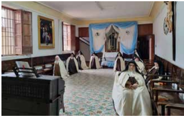
Monjas carmelitas en Caudiel.

Las formas para consagrar son de diferentes medidas. Además, “también hacen formas para celiacos y de medidas especiales para custodias” puntualiza Aparici.