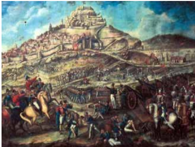
Cuadro que ha pasado a restauración.