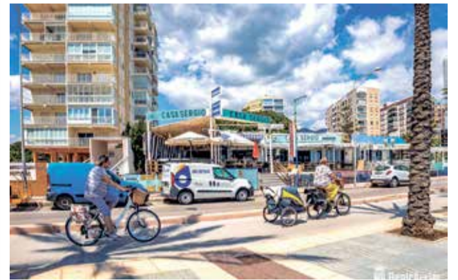
Usuarios de bicicleta en Benicàssim.