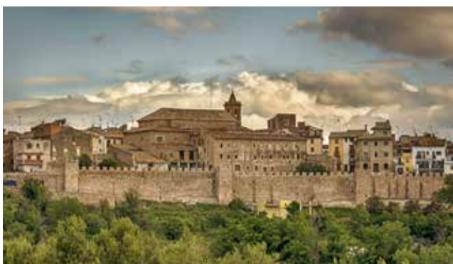
Segorbe, la más poblada del Palancia.