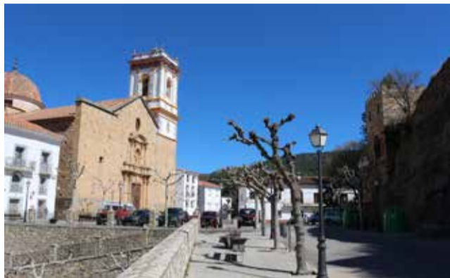
Villahermosa, el último 'municipio turístico'. / EPDA

Por provincias, 11 municipios de la provincia de Alicante han obtenido esta nueva distinción a lo largo del 2023, un total de 15 pertene-