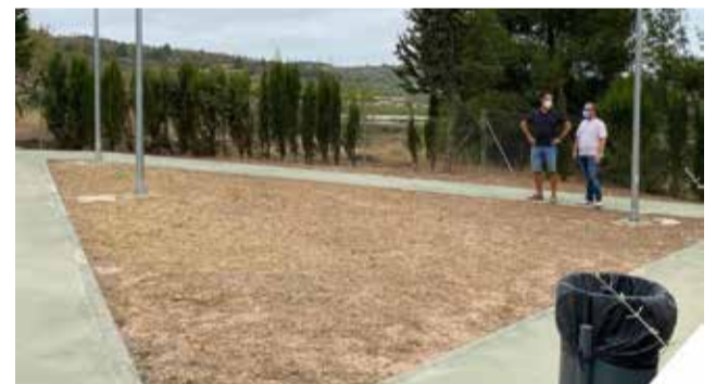
Solar donde se prenten ubicar el parque.