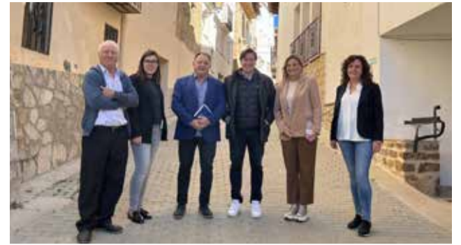
La delegada con el alcalde de Cortes