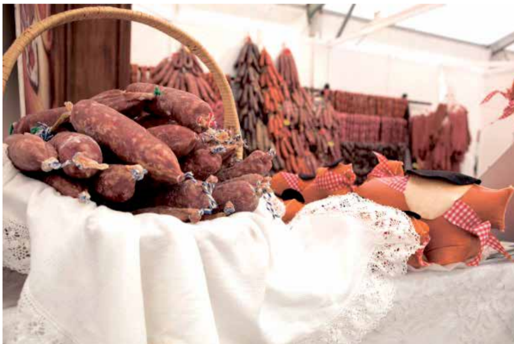
Feria del embutido de Requena.

dar cada detalle para mantener su buena calidad. La Muestra del Embutido marca el calendario gastronómico de la Comunitat Valenciana.