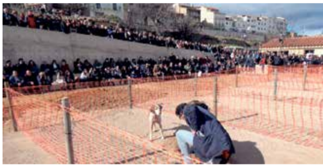
Edició anterior de la Mostra de la Trufa Negra.