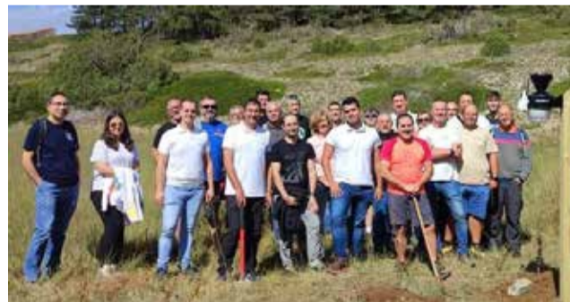
Muchos socios asistieron al momento.

La Asociación Valenciana de Meteorología AVAMET ha instalado la 42ª estación propia en la Nava, dentro del término municipal del Toro. Esta localidad ya disponía de tres estaciones meteorológicas pertenecientes varios socios de AVAMET, pero la de la Nava será sin lugar a duda una estación especial. Por un lado, porque estará situada a una altitud de 1481 metros, convirtiéndose en la estación más alta de toda la red de AVAMET y, por tanto, en uno de los puntos más fríos de todo el territorio valenciano. Y por el otro, porque la Nava reúne las condiciones orográficas