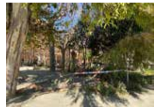
Rama caída.