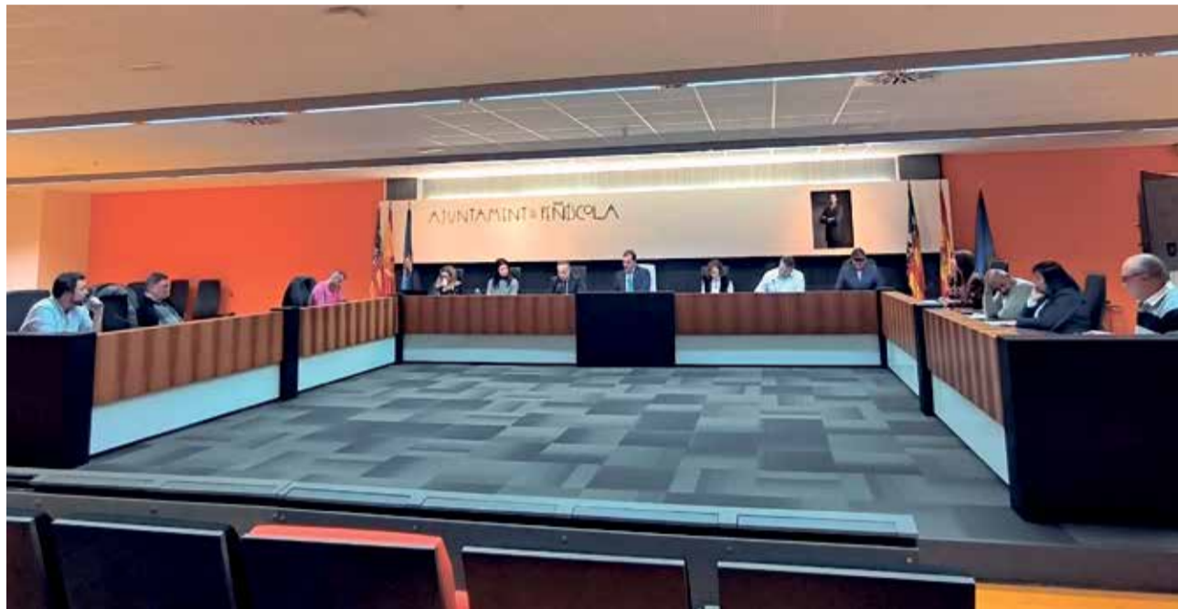
Un instant durant la sessió plenària de l'Ajuntament de Peníscola.

"Este full de ruta, que aterra els Objectius de Desenvolupament Sostenible de les Nacions Unides a la realitat i necessitats del nostre municipi, és un document viu, fruit d'un procés participatiu, en el qual la ciutadania ha exposat els principals reptes que enfrontem junts com a poble", ha manifestat, posant en valor el procés participatiu impulsat des de l'administració per a la seua confecció.