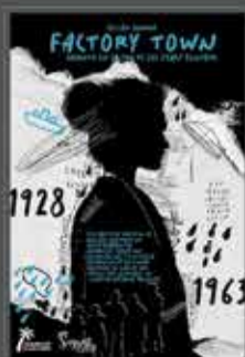
FICCIÓN SONORA FACTORY TOWN

Feria Internacional de Turismo DEL 24 AL 28 DE ENERO 2024