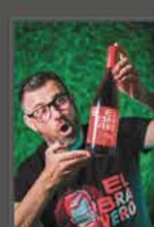
VERMUT EL BRAVERO