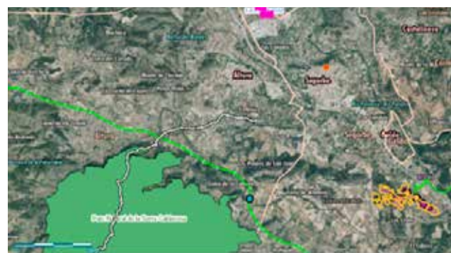
Línea de la PSF Altura III. /VISOR CARTOGRÁFICO GVA