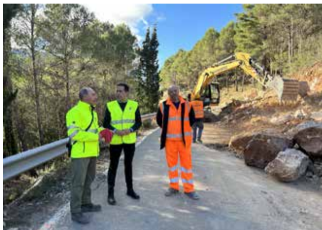
Visita de obras en término de Jérica.

Así pues, por lo que hace a las actuaciones de mejora en las carreteras de la comarca del Palancia durante el último trimestre de 2023, el vicepresidente tercero ha explicado que las intervenciones se localizan en los municipios de Jérica o Algimia de Almonacid. "Son acciones clave que tienen el objetivo común de resolver los problemas de los vecinos y garantizar la seguridad de los