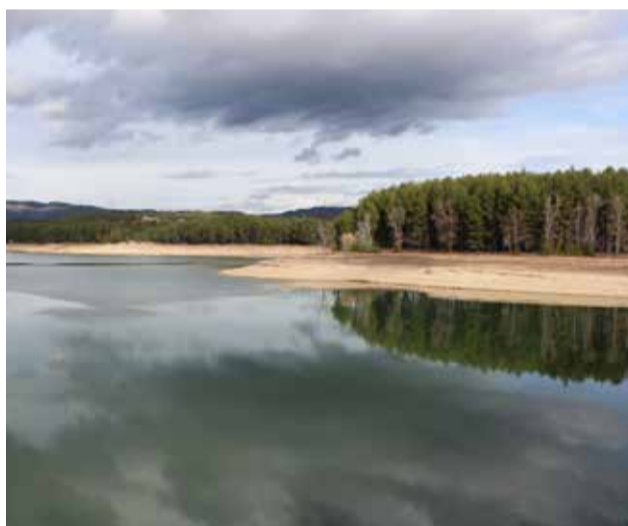
Nivel del agua junto al embalse.

sentaba el 23'95 de su capacidad que es de 6 hm 3 .