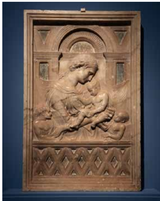
La obra se conserva habitualmente en el Museo de la Catedral de Segorbe.

Se trata de una de las obras más valiosas que guarda el Museo de la Catedral Basílica de Segorbe y a la vez una de las escasas piezas que conserva en talla. Es un relieve de mármol de Carrara que representa a la Virgen con el Niño, del que es autor Donatello, una de las figuras más sobresalientes del Renacimiento Italiano. La obra es de principios del siglo XV y procede del desaparecido alcázar de Segorbe al que seguramente llegó como consecuencia de la donación de uno de los primeros duques de la casa Argón Sicilia. No es la primera vez que esta pieza sale del Museo de la Catedral, destacando especialmente la cesión al Museo del Prado a finales de 1998, para la exposición que sobre Felipe II, príncipe y mecenas del Renacimiento.