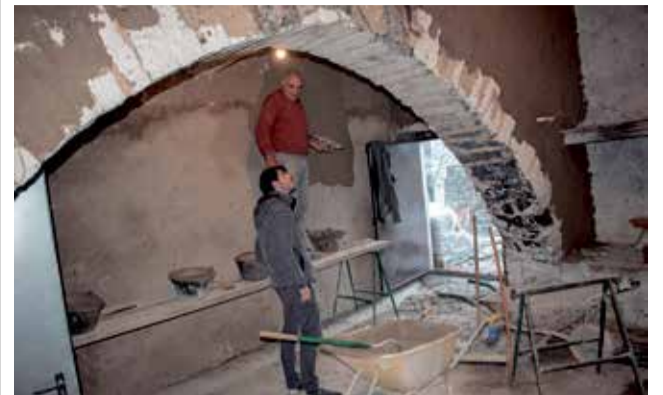
Obres al santuari de Vallibana de Morella.