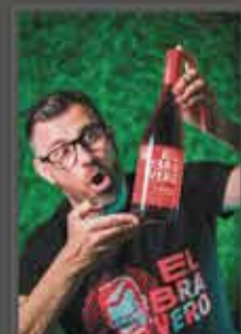
VERMUT EL BRAVERO

www.saguntoturismo.com f i s @saguntoturismo