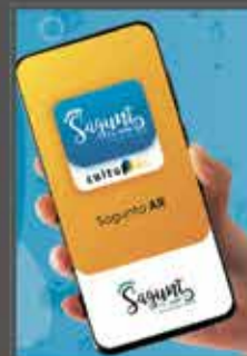
APP MOVIL REALIDAD AUMENTADA