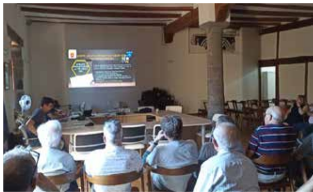
Reunión de vecinos en el Ayuntamiento.