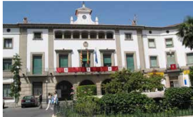
El Ayuntamiento de Viver toma medidas.

Ya en el interior de la vivienda se dirigen sobre todo a la habitación principal donde