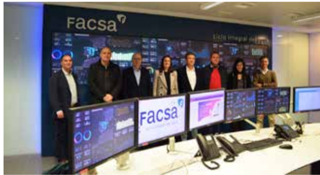
La compra en Segorbe puede resultar gratis.

En este punto, compañía y consistorio han destacado