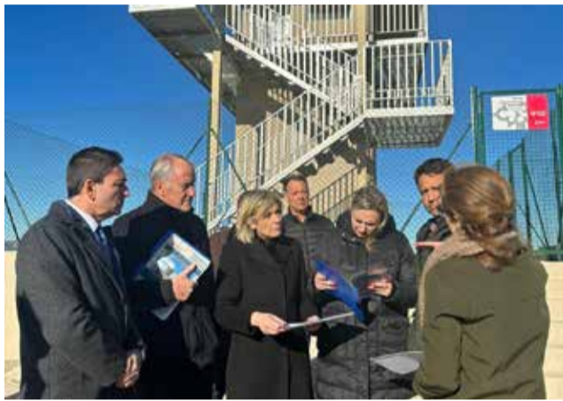
Visita al nuevo observatorio.

Este observatorio forestal de las Boqueras en una construcción en dos plantas, la planta inferior divide en aseo, cuarto almacén y cuarto para instalación de baterías y cuadros eléctricos. La segunda planta es diáfana con cristales en las cuatro paredes donde se colocan los equipos de