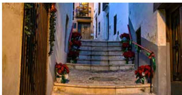
Calle de San Diego florida. / EPDA