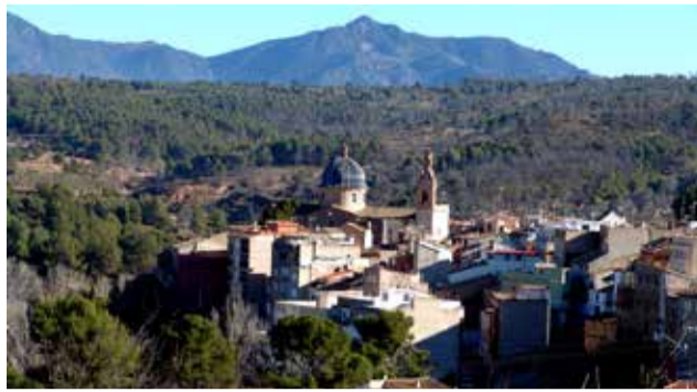
Ayuda económica de la Generalidad.