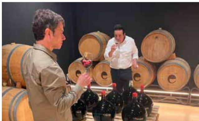
El vino, otro atractivo comarcal.

La visita incluye una cata de las variedades prefiloxéricas Pampolat y Morenillo y de otros dos vinos actuales, Viento sobre la piel, un elegante monovarietal de Syrah