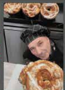
CORONA SAGUNTINA CHOCOMEL