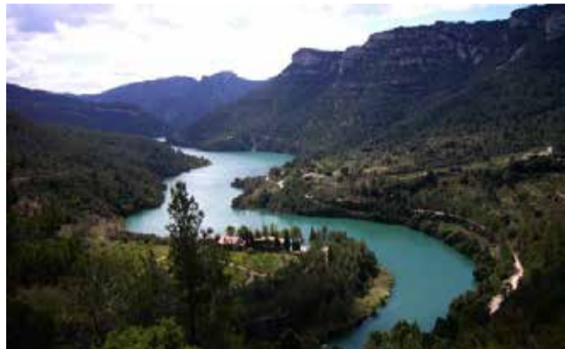
Se pretende restaurar hábitats y especies.

Mérida ha explicado que “los beneficiarios de estas