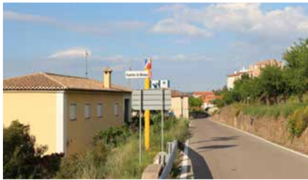
Fuente La Reina, la menos poblada del Mijares.

•Cirat: ha perdido el último año 3 habitantes y en la actualidad tiene 223 habitantes.