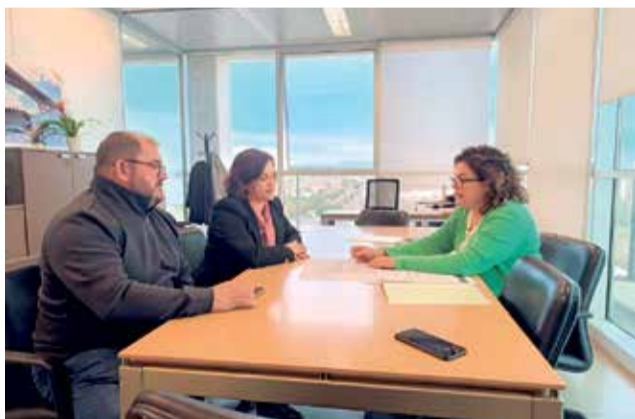
Reunió amb la directora general d'Infraestructures.

L'objectiu de l'Ajuntament és unir este vial amb les carreteres que ixen de la localitat cap a Vilafranca i Castelló i, en la mesura que siga possible, evitar el pas de vehicles pesants pel centre del municipi. A més, també permetrà que els vehicles que tenen com a origen o desti-