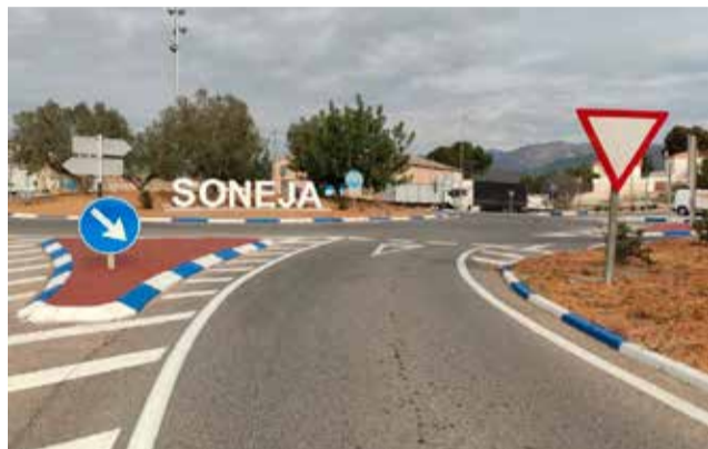
Trabajos en el Monte Hoyo.

Se trata de la segunda fase de este plan de mejora en esta área industrial, después de que en 2022 se acometieran mejoras en parte del polígono, con un valor superior a los 80.000 euros. Precisamente, y coincidiendo con el fin de los trabajos, el equipo de gobierno ha anunciado su