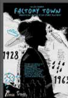
FICCIÓN SONORA FACTORY TOWN

Feria Internacional de Turismo DEL 24 AL 28 DE ENERO 2024