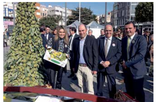
Visita al Mercat Gastronòmic de Benicarló.

La presidenta de la Diputació va assistir el 27 de gener al Mercat Gastronòmic, emmarcat en la XXXI Festa de la Carxofa, declarada Festa d'Interés Turístic Autòmic, i va ressaltar la importància de la carxofa per a la gastronomia de la província i el seu potencial per a ser un dels productes referents.