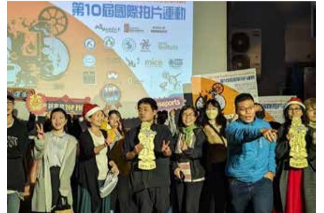
Entrega de premios en Taiwan

Es la rúbrica a un intenso año, repleto de actividades culturales en todos los ámbitos y en todas las manifestaciones, que han llevado el nombre de la localidad del