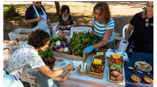
Se plantearon otras alternativas