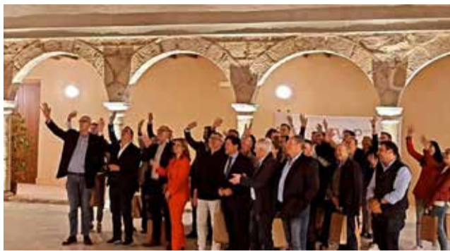
Representantes de la FVMP en Viver.