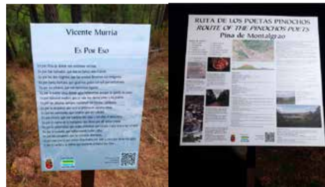
Pie de foto.

"La ruta de los poetas pinochos" se trata de una ruta circular donde nos encontraremos con poemas de los ilustres poetas pinochos, que describen y dejan plasmado su amor por el pueblo. Todos los poemas disponen de código QR para poder escuchar el audio de los poemas. A mitad de ruta, nos encontraremos con un mirador que nos permite visualizar el pueblo y el en-