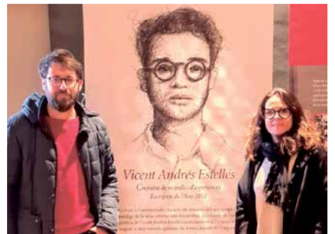
Representants de Vilafranca en la presentació.

Al llarg de l'any s'informarà de les activitats que Vilafranca acollirà. "És un honor per a nosaltres reconèixer el llegat d'Estellés en el poble valencià i universal. És una de les figures artístiques valen-