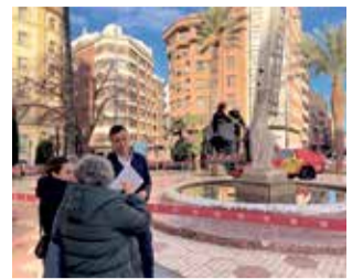
Treballs. / EPDA