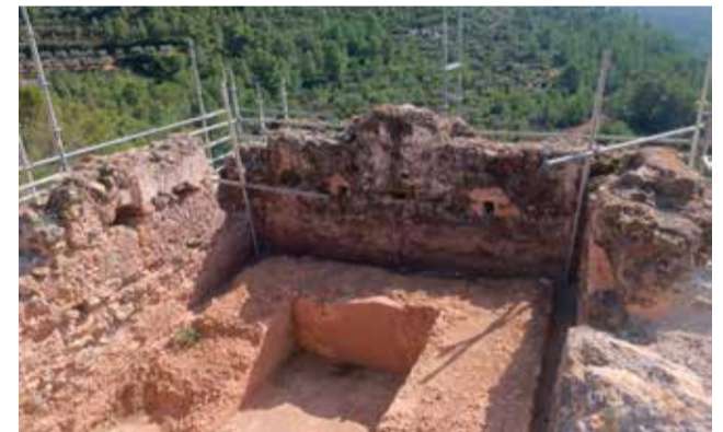
El Castillo de Almonecir en obras.

Concretamente, las obras comprenden el saneado y retacado de fábricas de mampostería, la recuperación en esquinas de sillería de piedra, el macizado de zonas de asentamiento, la colocación de sillares de piedra, la texturización y patinado de las mismas y la reposición en las zonas superiores de los muros de cal y canto. Las previsiones apuntan a que las actuaciones finalizarán a mediados del próximo mes de diciembre.