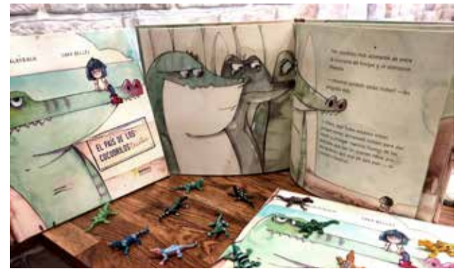
El nuevo cuento ya a la venta. / EPDA