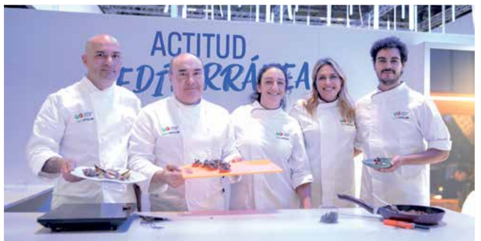
Barrachina participa en un showcooking amb xefs de Castelló en Fitur.