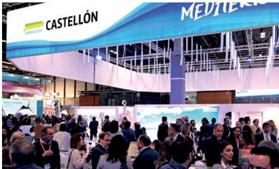
Estand del Patronato de Turismo Provincial de Castellón en Fitur.

Del mismo modo, la consellera de Turismo ha destacado que "la dinámica de trabajo que se ha puesto de manifiesto estos días en Fitur y la fortaleza que demuestra el sector contribuye a trasladar el mensaje de que somos un destino sostenible, innovador, accesible y que apuesta por la calidad y la excelencia".