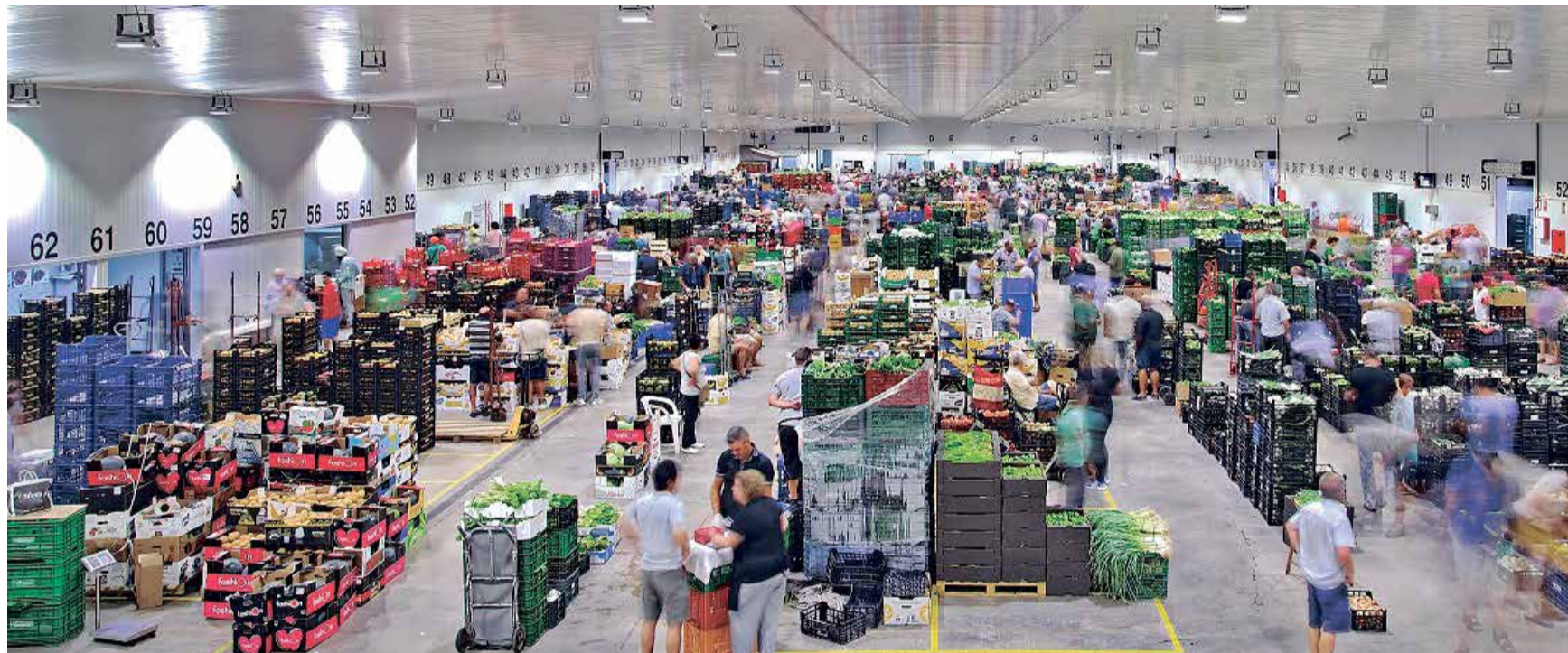
Tira de cortar de Valencia.

No obstante si lo que se quiere es comprar productos de la huerta prácticamente a diario, Alboraya ha puesto en marcha una iniciativa pionera, se trata de 'De l'Horta a casa', una plataforma online de venta directa de productos