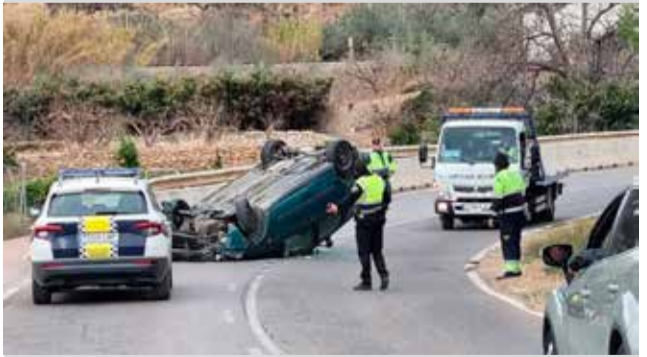
► 2-1: Un turismo vuelca en la antigua carretera N-234 entre Navajas y Segorbe, término municipal de esta última población. La Policía Local acudió al lugar cortando la circulación por invasión de calzada.