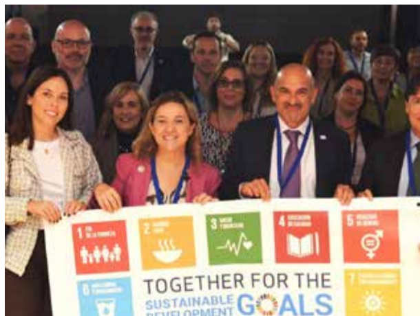
Acto de incorporación a la red.

La Red de Entidades Locales para la Agenda 2030 es una red de la FEMP en la que se integran, de forma voluntaria, los gobiernos locales que se comprometan a implementar los ODS de la Agenda 2030 de forma transversal en sus políticas públicas locales y provinciales. El principal objetivo de la red es favorecer la coordinación de actuaciones entre los gobiernos locales a fin de alcanzar mejores resultados en la implementación de la Agenda 2030 en los municipios y provincias, a través de la