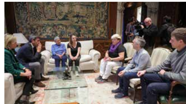
Mazón con los afectados