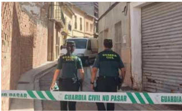
Detenidos casi in fraganti.