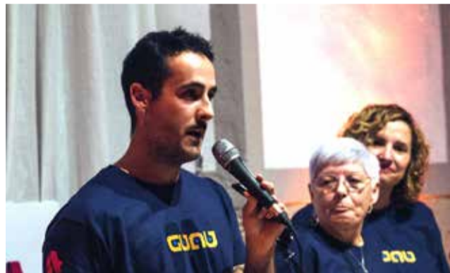
Presentación en el Hotel Martín el Humano.

El festival, que tendrá la duración de un sólo día, se celebrará el día 29 de junio del presente año 2024 en la zona del verbenódromo de Segorbe, junto al Sector S-I, y acogerá un aforo que se calcula en torno a 3.500 personas. La idea es generar un evento musical que relacione a distintos agentes del pueblo como la restauración, asociaciones, comercio local y artistas entre otros.