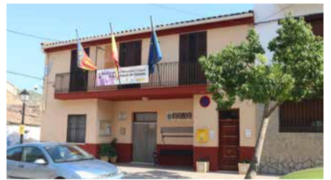
Ayuntamiento de Fanzara. / EPDA