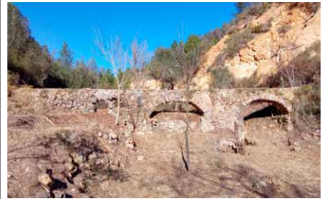
Acueducto en Montán / EPDA