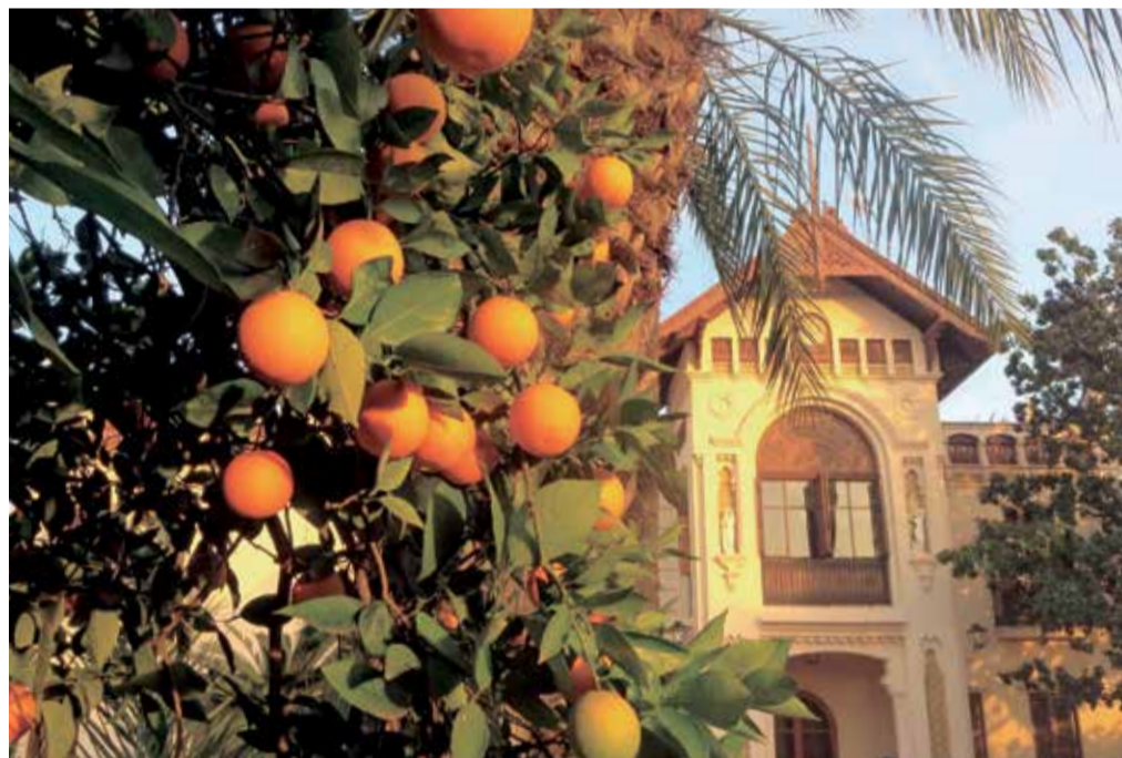
Naranjas de Carcaixent, el producto estrella de la comarca de la Ribera.