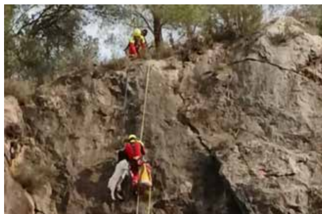
Los bomberos en pleno rescate.

Se aseguraron a través de unas cuerdas y cuando llegaron hasta ella la ataron para que no se cayera, mientras otro bombero tiraba desde arriba y así pudieron desplazarla hasta un lugar seguro.