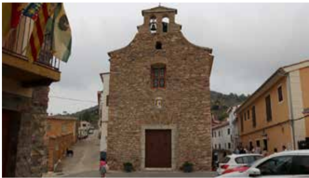
Higuera, la menos poblada del Palancia.