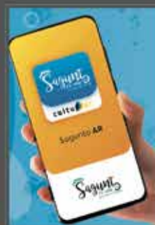
APP MOVIL REALIDAD AUMENTADA