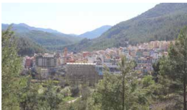
Montanejos, la más poblada del Mijares.