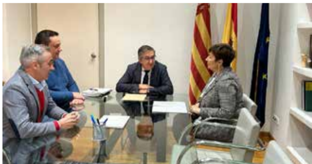
Reunión en Consellería.

En la integración del Conservatorio Profesional de Música de Segorbe a la Red de Conservatorios de la Generalidad Valenciana, todos los