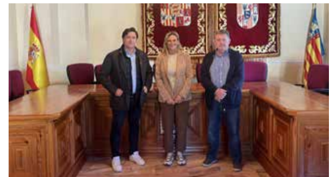
La delegada con el alcalde de Villahermosa.