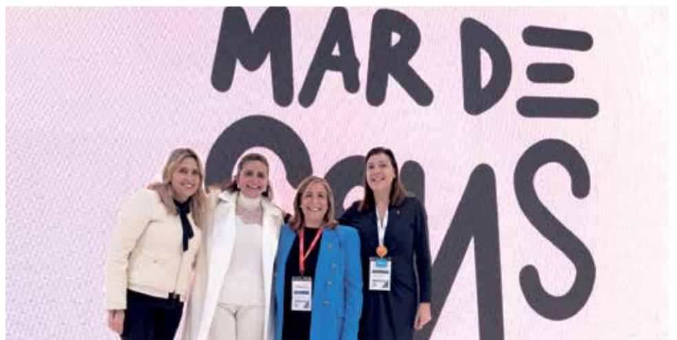
Presentació del festival 'Mar de Sons' de Benicàssim en Fitur.