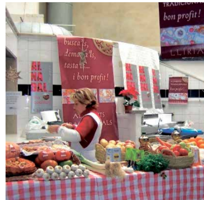
Una tienda del mercado municipal de Liria.

de proximidad de los agricultores de la huerta local.