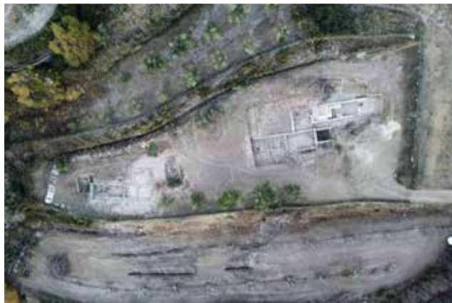
Vista aérea de la villa de El Prado.

El yacimiento, situado en la partida de la Almenara, a unos 3 Km. al Noroeste del casco urbano, fue descubierto en 2007 durante el seguimiento arqueológico de la instalación de la línea de evacuación eléctrica del parque eólico. Tras 10 años de aban-