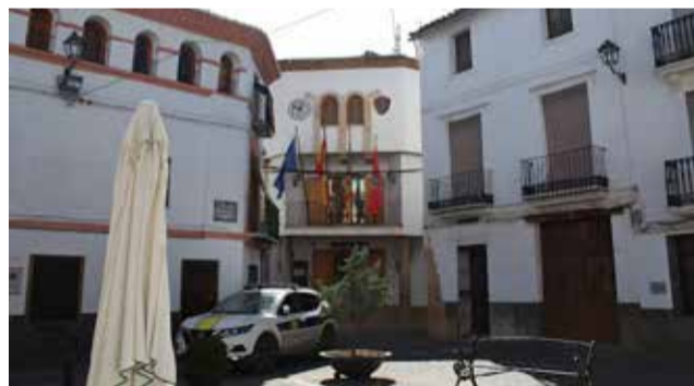
Oposición a las centrales fotovoltaicas.