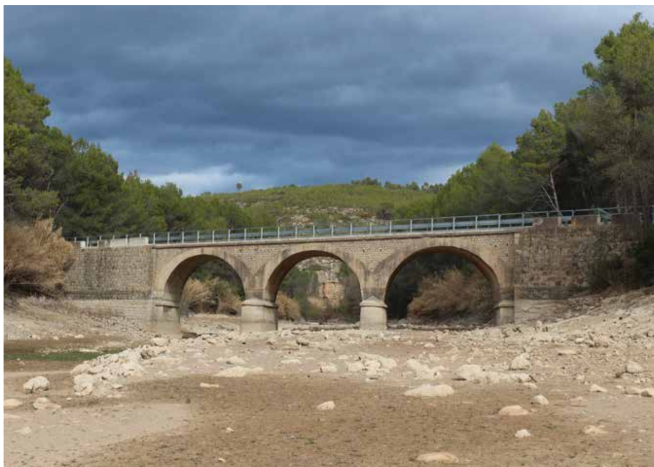
El río de Gaibiel apenas aporta agua al pantano.

En el caso del pantano del Regajo, según datos de la propia Confederación a fecha 15 de enero, el agua embalsada era de 144 hm 3 lo que repre-