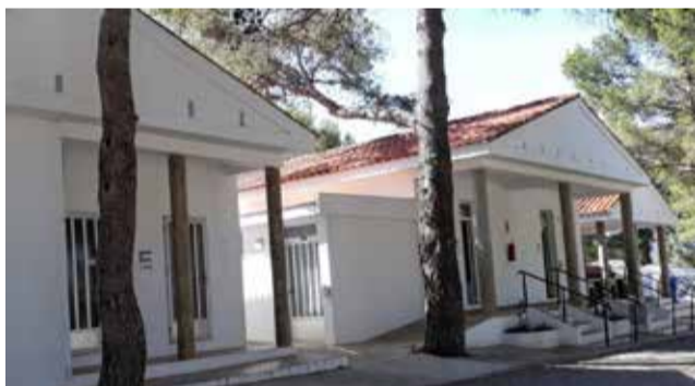
El camping municipal será reformado.